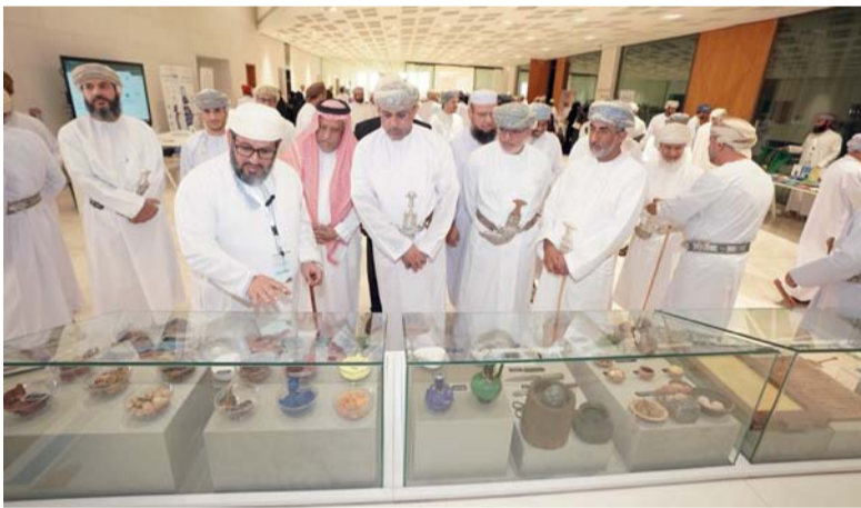
الندوة تستمر ٣ أيام بمشاركة واسعة من عدد المكتبات الحكومية والأهلية