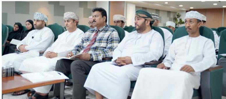
■ الحلقة تناولت جوانب مُتعددة من النظام الضريبي

مسقط . «الوطن»: الجانب النظري بالعمل. وتناولت الحلقة جوانب متعددة من النظام الضريبي، بما في ذلك أنواع الضرائب وكيفية حسابها، بالإضافة إلى التدريب على استخدام الجبابة الإلكترونية. يذكر أن مثل هذه اللقاءات تأتي لتشجيع الطلاب على المساهمة في بناء مجتمع ضريبي واع، بما يتماشى مع أهداف التنمية المستدامة ورؤية عُمان ٢٠٤٠.