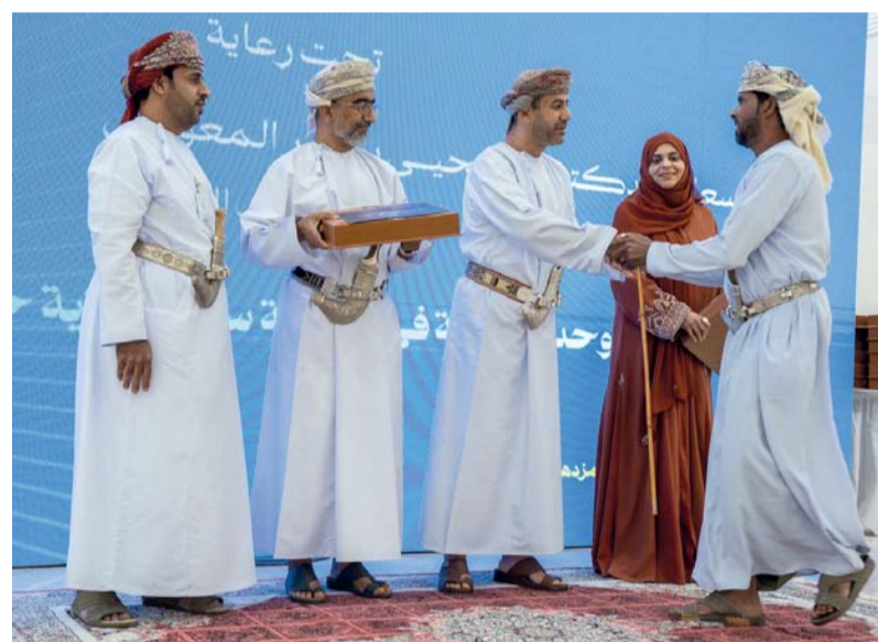
أثناء تسليم المستفيدين الوحدات السكنية

وأشارت إلى أنه في إطار تعزيز الاستدامة البيئية وتحسين جودة الحياة، تم التعاون مع هيئة البيئة لزراعة شتلات من النباتات المحلية داخل المجتمع السكني، بهدف زيادة الرقعة الخضراء وتحقيق البعد الجمالي والصحي للمجتمع، بما يتماشى مع معايير الاستدامة البيئية. الجدير بالذكر أن الوزارة قامت خلال العام الحالي بتسليم أكثر من ٦٠٠ وحدة سكنية للمستفيدين من برامج الإسكان الاجتماعي، عبر تقديم وحدات سكنية جاهزة أو مساعدات سكنية، كما يجري حالياً تنفيذ ما يزيد على ١٣٠٠ وحدة سكنية جديدة في مختلف المحافظات.