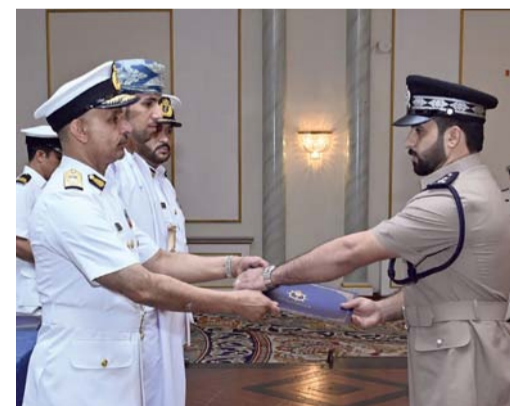
■ توزيع الشهادات على المشاركين والمحاضرين في البرنامج

يشار إلى أن البرنامج الذي بدأت فعالياته في الثامن من الشهر الجاري شهد مشاركة عدد من المؤسسات الحكومية والخاصة ذات العلاقة، وهدف إلى تعزيز دور ومكانة سلطنة عُمان في سلامة النقل البحري دولياً، ورفد السجل الوطني للسلامة البحرية بخبراء اختصاصيين في متطلبات السلامة البحرية وعمليات التحقيق في الحوادث والأحداث البحرية بالتعاون مع كافة الجهات ذات العلاقة، إلى جانب تأهيل الكفاءات العمانية للإسهام في تعزيز كفاءة النقل البحري محلياً. يأتي هذا البرنامج بالتعاون بين أكاديمية السلطان قابوس البحرية بالبحرية السلطانية العمانية ومكتب سلامة النقل بوزارة النقل والاتصالات وتقنية المعلومات. حضر المناسبة عدد من كبار الضباط بالبحرية السلطانية العمانية، وعدد من المسؤولين بالمؤسسات الحكومية والخاصة.