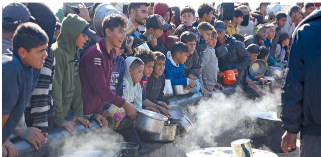
فلسطينيون ينتظرون الحصول على حصة غذائية في مركز توزيع جنوب خان يونس في جنوب قطاع غزة.

وواصلت أعمال المقاومة في الضفة الغربية خلال الأربع وعشرين ساعة الماضية، ضمن معركة «طوفان الأقصى»، ووقع ١٣ عملاً مقاوماً ضد جنود الاحتلال. وذكر مركز معلومات فلسطين «معطى» أن عمليات المقاومة تضمنت عمليتي إطلاق نار واشتباكات مسلحة وتفجير عبوة ناسفة، وانذلاع موجهات وإلقاء حجارة في ٦ نقاط متفرقة بالضفة، إلى جانب خروج ٣ مظاهرات شعبية منددة بجرائم الاحتلال. وانذلت موجهات بين الشبان وقوات الاحتلال في بلدة أبو ديس بمدينة القدس المحتلة، ومخيم عسكر وبيت فوريك ومدينة نابلس والخضر ببيت لحم، وتخلل جميع هذه المواجهات إلقاء حجارة.