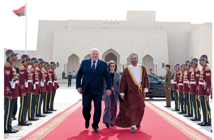
الرئيس البيلاروسي أثناء مغادرته البلاد عبر المطار السلطاني الخاص