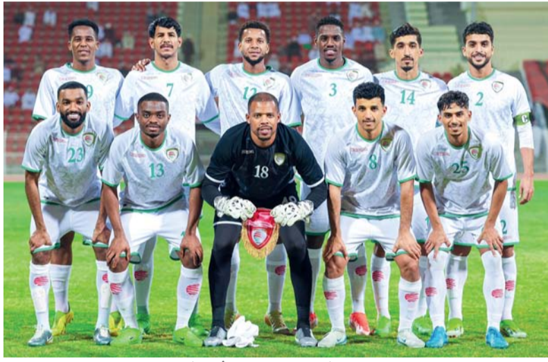
■ منتخبنا الوطني الأول لكرة القدم

■ على بركة الله وتوفيقه.. وبحفا عن إنجاز كروي جديد.. وعبر بوابة المنتخب الكويتي الشقيق.. ومن ساحة استاد جابر الأحمد الدولي.. وفي أول أيام بطولة خليجي ٢٦.. ينطلق قطر الأحمر العماني بظهوره الأول عبر مباراة الافتتاح التي ستشهد حضوراً جماهيرياً كثيفاً ستردان به مدرجات ملعب المباراة، سواء من الجماهير الكويتية التي أصبحت منعشة لاستعادة أمجادها الكروية في البطولة الخليجية التي شهدت تتويج الأزرق بها (١٠) مرات.. وفي المقابل حضور جماهير متوقع من الأوفياء العمانيين في أمسية ستطلق الوهج الأول لبطولة الأشقاء.. ■