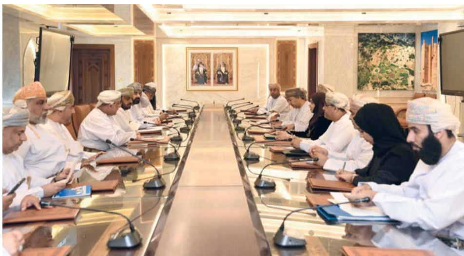
■ اللقاء استعرض الموضوعات ذات الصلة بالرعاية الاجتماعية

الوزارة في ولاية أدم كالأشخاص ذوي الإعاقة وكبار السن والأسر المعسرة، وذلك للوقوف على حالاتها، وتلمس احتياجاتها ومتطلباتها ومقترحاتها بما يخدم توجه الوزارة في تنمية البرامج وتطوير الخدمات المقدمة لها. والتقت - خلال الزيارة - بعدد من الأشخاص ذوي الإعاقة العاملين في إحدى المؤسسات الفندقية بولاية الجبل الأخضر، الأمر الذي أتاح التعرف على طبيعة المهام والأعمال الموكلة لهم، وحصر التحديات وسبل تذليلها، وذلك بما من شأنه تمكين وتعزيز قدراتهم وتحقيق اندماجهم في سوق العمل. وتواصل معالي الدكتور وزير التنمية الاجتماعية والوفد المرافق لها برنامج زيارتها لمحافظة الداخلية اليوم (الخميس الموافق ١٩/١٢/٢٠٢٤ م). وذلك بزيارة مركز الوفاء لتأهيل الأشخاص ذوي الإعاقة بالجبل الأخضر، ومركز الوفاء لتأهيل الأشخاص ذوي الإعاقة بهلاء، وعدد من حالات الأشخاص ذوي الإعاقة والأسر المعسرة وكبار السن في ولاية بهلاء.