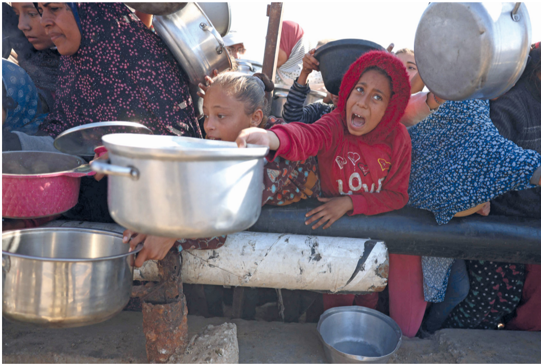
فلسطينيون ينتظرون حصّة طعام في مركز توزيع جنوب خان يونس في جنوب قطاع غزة.