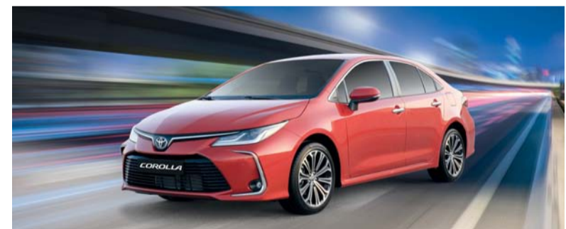
■ كورولا مزودة بمجموعة من مزايا السلامة الشاملة

يمكن الآن امتلاك سيارة تويوتا كورولا والاستمتاع بمزايا حصرية ضمن مهرجان السعادة، مع الحصول على خدمة لمدة ٥ سنوات/٥٠,٠٠٠ كم (أيهما أسبق)، وتأمين شامل لسلطنة عُمان لمدة سنة واحدة وفرصة للفوز بواحد من ضمن ١٦ جهاز آيفون ١٦ برو ماكس. ويخضع العرض الذي ينتهي بتاريخ ٢٣ يناير ٢٠٢٥ للشروط ويمكن معرفة تفاصيله عند زيارة أقرب صالة عرض سعود بهوان للسيارات. تستمر تويوتا كورولا في وضع معايير جديدة في صناعة السيارات، حيث تجمع بين التصميم الأنيق والميزات المتقدمة والتصميم الداخلي المتقن. وباعتبارها واحدة من أكثر سيارات الصالون شهرة منذ ظهورها لأول مرة، أصبحت كورولا مرادفة للموثوقية والتنوع ورضا العملاء. بدءاً من مظهرها الخارجي الأنيق إلى مقصورتها المجهزة تجهيزاً جيداً، تعد كورولا سيارة تجسد التوازن المثالي بين الأناقة والمساحة والراحة وكفاءة استهلاك الوقود والقوة. تقدم كورولا خيارين قويين للمحرك حيث يوفر المحرك الديناميكي رباعي الأسطوانات سعة ٢,٠ لتر ينتج ١٦٨ حصاناً وعزم دوران يبلغ ٢٠,٣٩