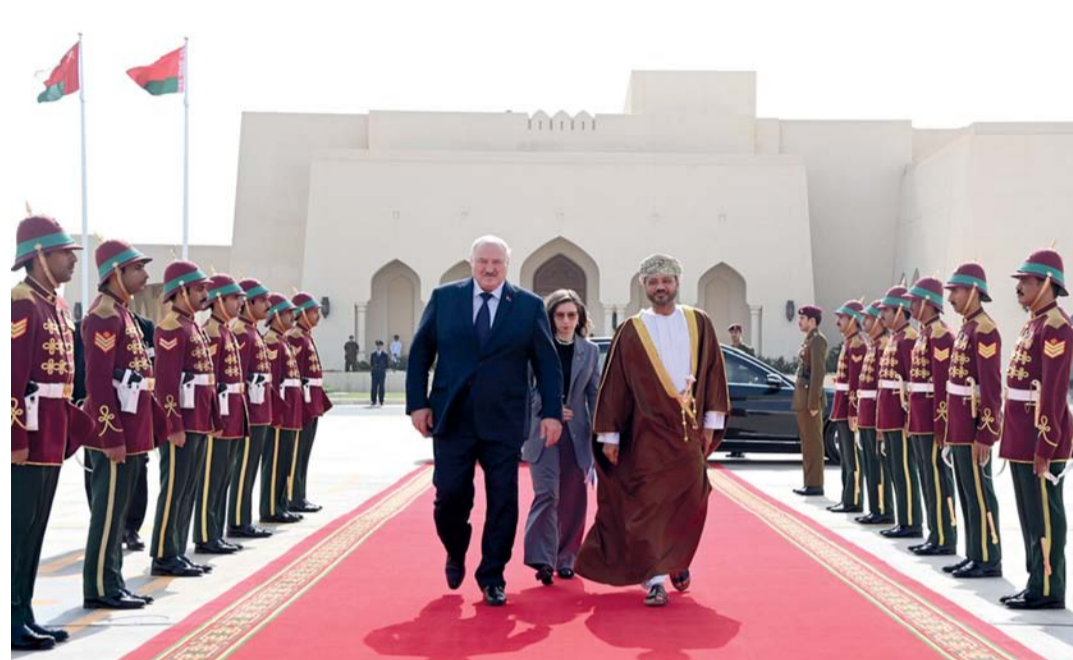
رئيس بيلاروس أثناء مغادرته أمس البلاد مختتماً زيارة رسمية دامت عدة أيام