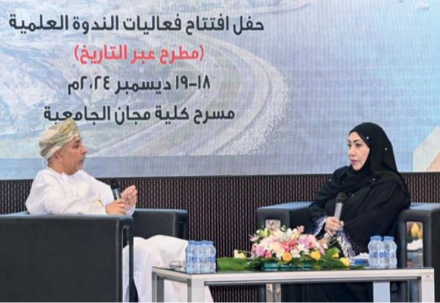
حفل افتتاح فعاليات الندوة العلمية (مطرح عبر التاريخ) ١٨-١٩ ديسمبر ٢٠٢٤، مسرح كلية مجان الجامعة

■ مسقط، العُمانية: بدأت أمس بولاية مطرح أعمال ندوة (مطرح عبر التاريخ) التي تنظمها وزارة الثقافة والرياضة والشباب ممثلة بالمنتدى الأدبي، ضمن سلسلة ندوات المدن العُمانية التي تنظمها الوزارة في إطار برامجها الثقافية والعلمية، وذلك تحت رعاية معالي السيد سعود بن هلال البوسعيدي محافظ مسقط. وتبرز الندوة التي تختتم اليوم، التعرق في دراسة مدينة مطرح باعتبارها مدينة عُمانية عريقة، تحمل أحداثاً تشكل جزءاً من التراث الثقافي والإنساني، كما تسعى إلى استكشاف الجوانب المختلفة