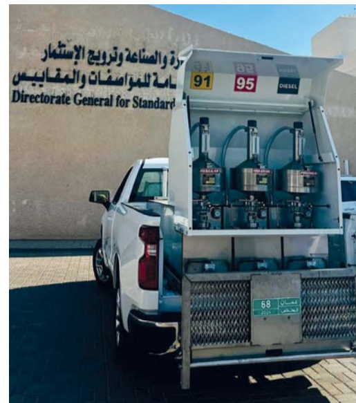
■ المختبرات المتنقلة ستقدم أعلى مستويات السلامة والدقة

العُمانيّة بأنه سوف يتم تزويد المختبرات المتنقلة بأجهزة حديثة تتحقق من نوع الوقود، بمعنى التأكد من الالتزام بنوع الوقود المقدم على سبيل المثال نوع ٩١ و٩٥ و٩٨، ما يعزز ثقة المستهلكين وكذلك أصحاب المحطات من نوع الوقود المقدم. ويبيّن أنه سيتم تفعيل هذه الخدمة على مراحل، تبدأ بثلاثة وحدات من المختبرات المتنقلة تغطي جميع المحطات في محافظات مسقط وشمال الباطنة ووظفار، وسوف تستكمل الوزارة من خلال توفير وحدات أخرى لتغطية جميع المحافظات، وكذلك سيتم