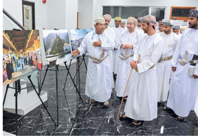
الحضور يطلع على صور ووثائق تبرز تاريخ مطرح وحضارتها