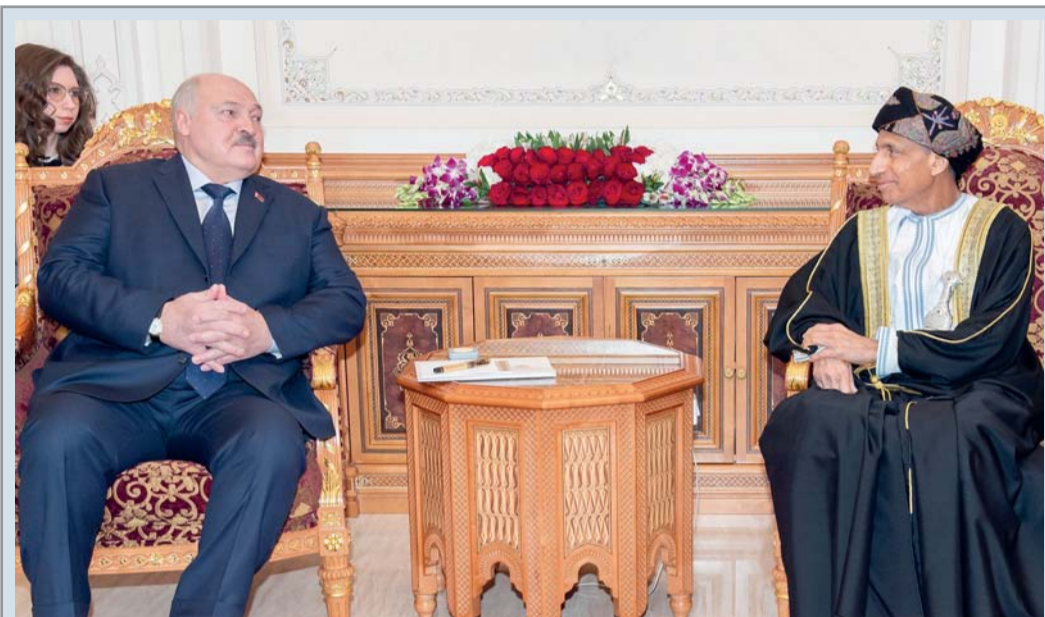
فهد بن محمود أثناء استقباله ألكسندر لوكاشينكو