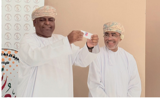
■ من سحب قرعة البطولة

القرعة عن وقوع مستضيف البطولة نادي عُمان في المجموعة الثانية بجوار الكويت الكويتي ودبا الحصن الإماراتي والعربي القطري، فيما ضمت المجموعة الأولى الريان القطري والنجمة البحريني ونادي السبب والنور السعودي. وتفتتح منافسات البطولة يوم ١٥ فبراير القادم بقاء الكويت الكويتي والعربي القطري في الساعة الرابعة عصرًا، بعدها المباراة الثانية التي تجمع بين نادي عُمان المستضيف مع دبا الحصن في الساعة السادسة والنصف مساءً، وهي مباراة الافتتاح في البطولة التي تقام على ملعب الصالة الرئيسية بمجمع السلطان قابوس الرياضي ببوشر كما تم خلال الحفل الكشف عن شعار البطولة. ■