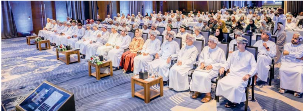
■ اللقاء يساهم في تعزيز التعاون في التقنيات الرقمية بين القطاعين العام والخاص

ناقش اللقاء الأول للرؤساء التنفيذيين للشركات الناشئة والقطاع التقني والاتصالات في سلطنة عمان، التحديات التي تواجهها الشركات التقنية الناشئة والحلول المقترحة بما يعمل على مد جسور التعاون بين الشركات الصغيرة والمتوسطة من جهة، والشركات الكبرى من جهة أخرى من خلال إطلاق شبكة الرؤساء التنفيذيين من أجل تعزيز شراكات استراتيجية تدعم منظومة التحول الرقمي. جاء ذلك خلال اللقاء الذي نظّمته غرفة تجارة وصناعة عمان ممثلة بلجنة الاقتصاد الرقمي والصناعة بالتعاون مع وزارة النقل والاتصالات وتقنية المعلومات وذلك تحت رعاية سعادة فيصل بن عبدالله الرواس رئيس مجلس إدارة غرفة تجارة وصناعة عمان، وبحضور عدد من أصحاب السعادة وأعضاء مجلس إدارة الغرفة وأصحاب وصاحب الأعمال والرؤساء التنفيذيين. وتم خلال اللقاء تدشين شبكة الرؤساء التنفيذيين من أجل تعزيز شراكات استراتيجية تدعم منظومة التحول الرقمي، كما دشنت وزارة النقل والاتصالات وتقنية المعلومات ممثلة في المديرية العامة لتحفيز القطاع ومهارات المستقبل منصة للشركات التقنية، والتي تدرج ضمن مبادرة تكين. ويهدف إنشاء المنصة إلى تسهيل الوصول إلى الشركات العمانية النشطة في قطاع الاتصالات وتقنية المعلومات