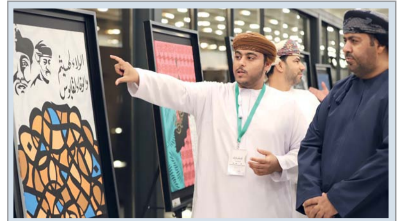
أروقة المعرض تضم ١٥٠ عملاً في مختلف مجالات الإبداع الفني

للمكتبات بقدماً عدد من الباحثين والأكاديميين، إذ تعالج الندوة دور المكتبات وأهميتها في جودة الحياة، إضافة إلى البعد الحضاري للتراث الفكري العماني، وأهمية توظيف تقنيات الذكاء الاصطناعي في تطوير المراكز الثقافية والمكتبات الأهلية، وتسليط الضوء على الأنشطة الابتكارية والخدمات غير التقليدية. وبين أنه تم تخصيص محاور للتعريف بأدوار المكتبات التابعة لمركز السلطان قابوس العالي للثقافة والعلوم والمكتبات في الجوامع السلطانية لتتناول الأنشطة الإبداعية لهذه المكتبات ودورها في تعزيز الجوانب الفكرية والإبداعية، إضافة إلى التعريف بدور المكتبات كحاضنات للابتكار الرقمي من خلال أنموذج مكتبة الأطفال. يصاحب الندوة معرض ثقافي بمشاركة المكتبات والمراكز الأهلية بمشاركة خارجية، إضافة إلى جولة في متحف عُمان عبر الزمان وزيارات إلى قلعة نزوى ومكتبة نزوى العامة وحارة العرق وبعض المتاحف الخاصة. ■■