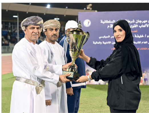
■ ويتوج الفرق النسائية الحاصلة على المراكز الأولى