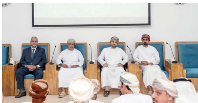
الحلقة عرفت بعمليات تنفيذ المشروع وخط سير القطار

للمشروع، وخط سير القطار ومحطات التوقف واستعراض الأعمال الاستشارية لإدارة المشروع وكيفية تمكين الشركات والمؤسسات الصغيرة والمتوسطة لتبنيهم للدخول في أعمال المشروع إلى جانب بحث الفرص الاستثمارية في قطاع الهندسة والطاقة ومعدات الاتصالات والنقل والخدمات اللوجستية والإمدادات الغذائية وخدمات التموين.