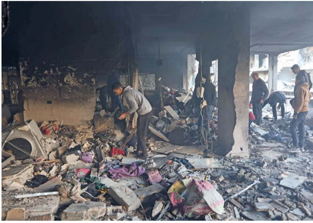
فلسطينيون يتفقدون الأضرار في موقع غارة جوية إسرائيلية على مبنى في حيّ الدرج بمدينة غزة.

وأظهر التقرير الأخير الذي نشره البنك الدولي أن الناتج المحلي الإجمالي لقطاع غزة انهار بنسبة