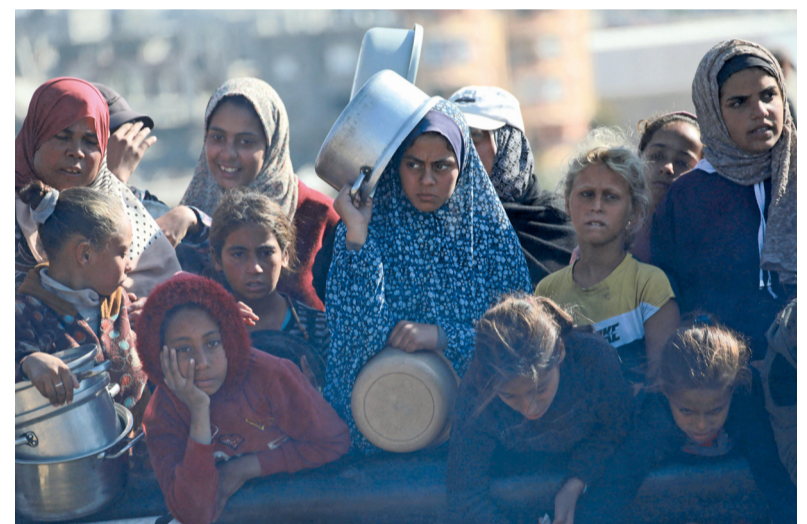
فلسطينيون ينتظرون حصّة طعام في مركز توزيع جنوب خان يونس.

مسقط. العمانية: يقوم فخامة الرئيس جواو مانويل لورينسو رئيس جمهورية أنجولا بزيارة رسمية لسلطنة عمان يوم غد الخميس. وستتمّ خلال هذه الزيارة مناقشة أوجه التعاون بين البلدين الصديقين والسبل الكفيلة لتقويتها تحقيقا لتطلعات الشعبين والغايات المنشودة في مختلف الجوانب. كلل الله تعالى مساعي عاهل البلاد المفدى بالتوفيق والسداد، إنه تعالى سمع قريب مجيب الدعاء.