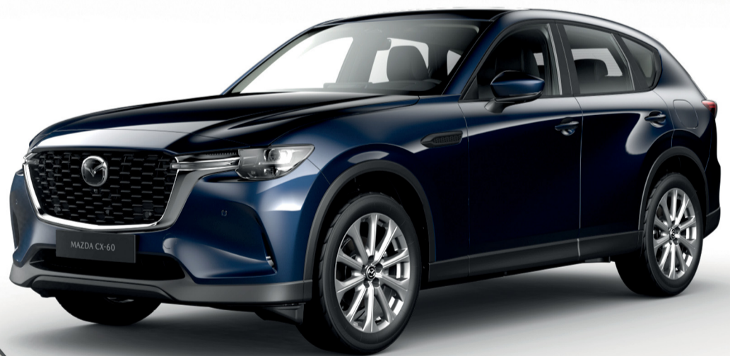
مازدا CX-60 سعة 2.5 لتر