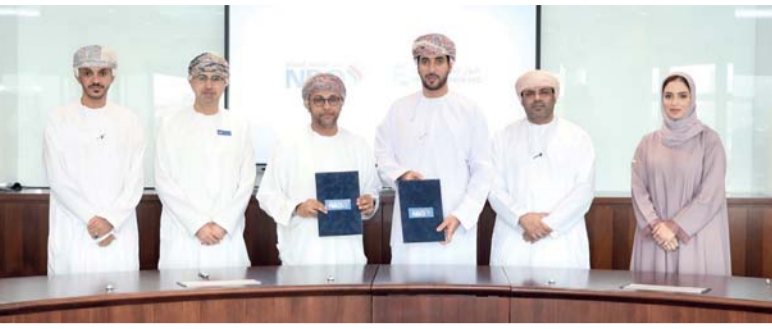
الاتفاقية تساهم في تقديم حلول مبتكرة تلبى احتياجات العملاء.

وكل من له اعتراض على ذلك عليه أن يتقدم بأسباب اعتراضه لأمانة السجل التجاري بوزارة التجارة والصناعة وترويج الاستثمار بمسقط خلال شهر من تاريخ نشر هذا الاعلان.