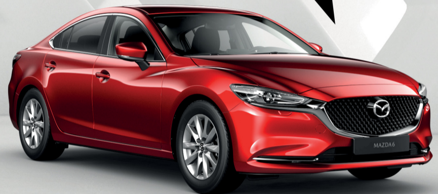
مازدا 6 سعة 2.0 لتر