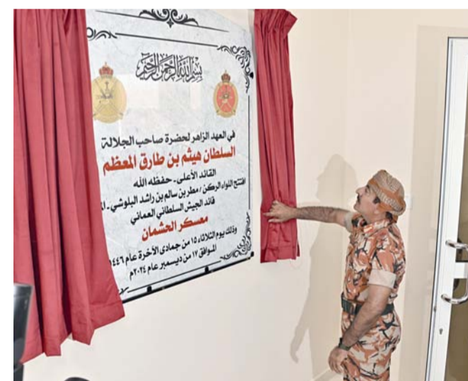
أثناء إزاحة الستار عن التوحة التذكارية للمعسكر

يضعط به الجيش السلطاني العُماني بمختلف وحداته وتشكيلاته من أنوار «معسكر الحشمان» للواء حرس الحدود، برعاية اللواء الركن مطر بن سالم البلوشي قائد الجيش السلطاني العُماني، في إطار ما تنتهجه أسلحة قوات السلطان المسلحة والدوائر الأخرى بوزارة الدفاع من خطط التحديث، بما يتماشى مع متطلبات التطوير من برامج الاستدامة فيما