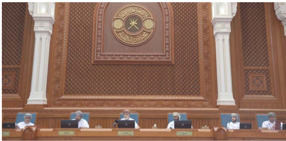
■ أعضاء مجلس الدولة خلال عقد الجلسة الرابعة لدور الانعقاد العادي الثاني من الفترة الثامنة

وبعد مناقشات مستفيضة من المرمين والمكرات الأعضاء، أقر المجلس تقرير اللجنة الاقتصادية والمالية الموسعة بشأن مشروع الميزانية العامة للدولة للسنة المالية ٢٠٢٥م، وأختتم المجلس الجلسة باستعراض تقرير الأمانة العامة حول أنشطة المجلس.