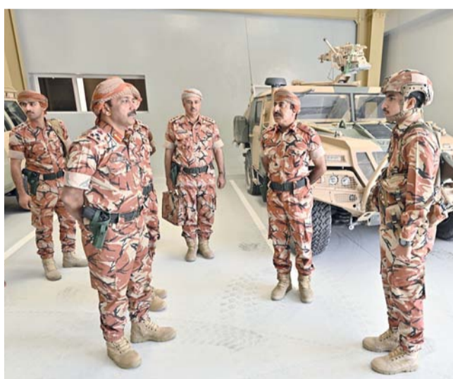
مطر البلوشي يستمع إلى إيجاز عن أنوار لواء حرس الحدود

أبوية وتشكيلات ووحدات الجيش السلطاني العُماني الأخرى. ثم قام قائد الجيش السلطاني العُماني بجولة في مرافق المعسكر ومنشأته الحديثة، واطلع على ما زُوّد به من تجهيزات ومعدّات متطورة تتلاءم والواجبات المنوطة به. يأتي افتتاح «معسكر الحشمان» تأكيداً على الاهتمام السامي والرعاية الكريمة اللتين تحظى بهما قوات السلطان المسلحة من لدن حضرة العُماني.