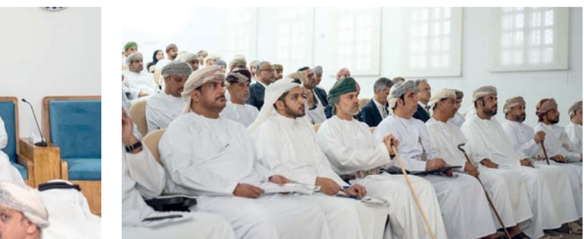
الحضور تعرفوا على مزايا المشروع

الأعمال للإسهام في تخفيض التكلفة الإنسانية وتحسين كفاءة وفعالية النقل وضمان توافر الخدمات اللوجستية مع المعايير البيئية، بالإضافة إلى دور الشركة ومساهمتها في زيادة الفرص الاستراتيجية للمحافظة، ودعم وتمكين الاقتصاد الوطني وربط المناطق السكنية والصناعية وتعزيز كفاءة أداء الشركات السياحية. كما تطرقت الحلقة إلى التعريف بعمليات التنفيذ