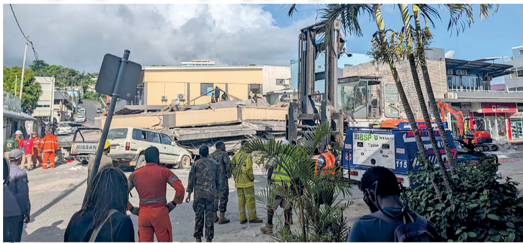
عمال إنقاذ في موقع مبنى انهار جراء زلزال قوي ضرب جزر فانواتو بالمحيط الهادئ

مخاوف من فقدان ٢٠٠ متطوع جراء الإعصار شيدو