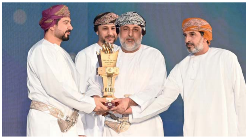
تتويج نادي صلالة بالمركز الأول