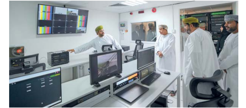
المشروع يهدف إلى معالجة المواد السمية والبصرية وتحويلها إلى مواد رقمية