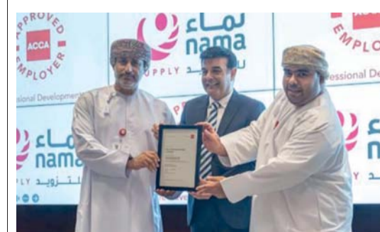
التتويج يعود على التزام الشركة بالاستثمار في رأس المال البشري

الرائدة في مجال تطوير الموارد البشرية، حيث يُعزّن اعتمادها من مكانة الشركات ويدعم جاذبيتها كوجهة مفضلة للمهنيين الباحثين عن بيئات عمل متقدمة تسهم في تطورهم المهني والشخصي. ويؤكد هذا التتويج التزام شركة نماء للتزويد برؤيتها الاستراتيجية التي تركز على الاستثمار في رأس المال البشري باعتباره الأساس لتحقيق التميز المستدام والنجاح المؤسسي.