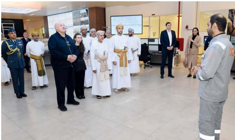
صيف البلاد يستمع إلى عرض مفصل حول عمليات ميناء صحار

بمحافظة شمال الباطنة، في إطار زيارته الرسمية لسلطنة عُمان. وكان في استقبال فخامة الضيف، والوفد المرافق له لدى وصوله إلى قلعة صحار التاريخية سعادة محمد بن سليمان الكندي محافظ شمال الباطنة. واستمع فخامة الضيف والوفد المرافق له إلى شرح موجز عن قلعة صحار وتاريخ بناؤها وما تحتويه من معالم ومرافق أثرية وتراثية لتكون شاهداً على العديد من الأحداث المهمة في التاريخ العُماني. وتجوّل فخامته في أروقة القلعة التي تحكي العراقة وتاريخ سلطنة عُمان الحافل بالأحداث وتعد من أبرز المعالم التاريخية في محافظة شمال الباطنة. وتسلم فخامة الضيف هدية تذكارية بمناسبة الزيارة، قدّمها له سعادة محافظ شمال الباطنة. رافق فخامة الرئيس الكسندر لوكاشينكو، رئيس جمهورية بيلاروس خلال الزيارة، معالي عبد السلام بن محمد المرشدي رئيس جهاز الاستثمار العُماني (رئيس بعثة الشرف) وعدد من أعضاء بعثة الشرف المرافقة لفخامة الضيف.