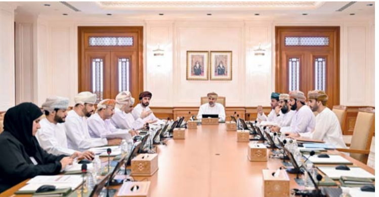
مكتب مجلس الشورى أثناء اجتماعه أمس

جديدة لاكتشاف المياه الجوفية في الصحراء الغربية، حيث أفاد الرد دعوة المجلس لحضور لقاء مع فريق العمل من المختصين بالوزارة ونظراتهم بجامعة السلطان قابوس ومركز أبحاث المياه للاطلاع على مشروع تطوير تكنولوجيا باستخدام الرادار لتصوير المياه الجوفية بالتعاون مع كل من الولايات المتحدة الأميركية والمملكة المغربية. واستعرض أعضاء مكتب المجلس كذلك تقارير المشاركة في لقاء النائب الأول لرئيس البرلمان السعودي مع ممثلي البرلمان والمجالس التشريعية الخليجية (قطر) واستعراض جهود المجلس التشريعية الخليجية على المستوى الإقليمي والدولي من خلال اجتماعاته الثنائية ومشاركاته في اللقاءات الدولية التي تناقش القضايا الدولية.