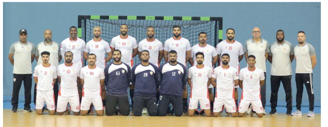
فريق نادي عمان لكرة اليد

الجدير بالذكر بأن النسخة الأولى لبطولة كأس السوبر أقيمت في موسم ٢٠١٧/٢٠١٨ وجمعت بين نادي عمان ومسقط فاز بلقب نادي عمان والنسخة الثانية موسم ٢٠١٨/ ٢٠١٩ جمعت أيضا بين نادي مسقط ونادي عمان وحقق نادي مسقط اللقب لأول مرة واحتفظ نادي مسقط أيضا بلقب في موسم ٢٠١٩/٢٠٢٠ بعد فوزه على نادي عمان وبعد ذلك لم تقم مباراة السوبر بسبب جائحة كورونا.