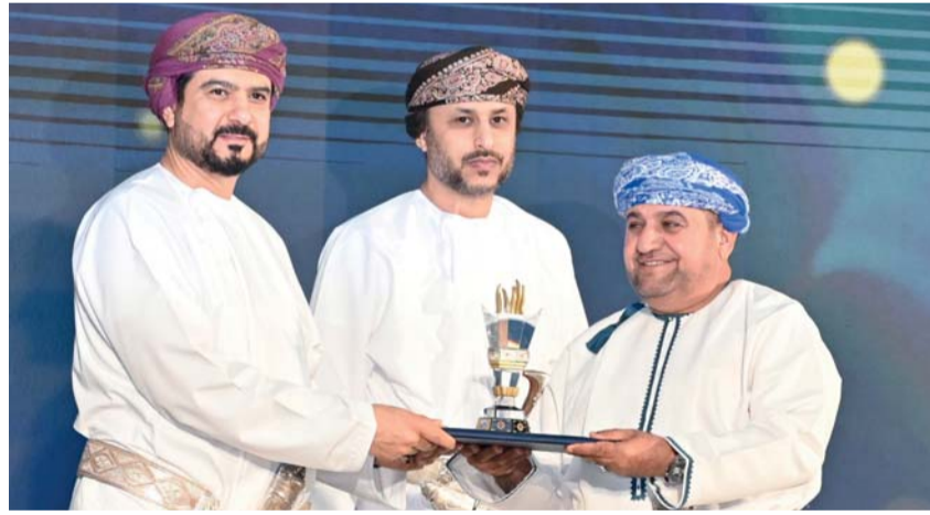
تتويج نادي صحم بالمركز الثالث

وتحتل مسابقة كأس جلالة السلطان للشباب بأهمية خاصة لدى قطاع الرياضة والشباب، حيث تعد داعماً رئيساً للأندية في تحقيق أهدافها المنشودة والنهوض بالأنشطة الرياضية والشبابية، ويتضح ذلك من خلال زيادة الأنشطة المنفذة بالأندية بمختلف أنواعها، والحرص على توثيق العلاقة بين النادي والمجتمع بمختلف فئاته، كما أن المسابقة تأتي استمراراً للدعم الذي يحظى به هذا القطاع، وتأكيداً للدور الذي تقوم به الأندية في خدمة المجتمع وتنمية الموارد البشرية، تنمية متوازنة رياضياً وفكرياً من خلال التشجيع على أسس النجاح والتنافس الشريف، واستثمار أوقات الفراغ بما يعود بالنفع على الشباب وعلى المجتمع.