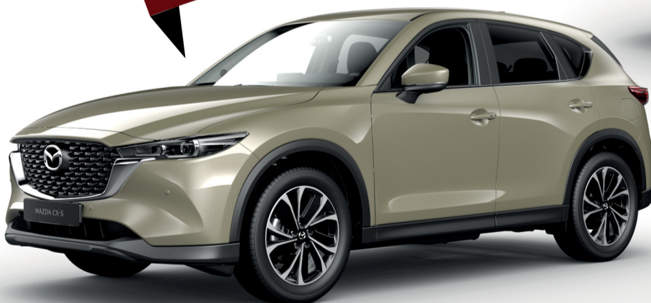
مازدا CX-5 سعة 2.5 لتر