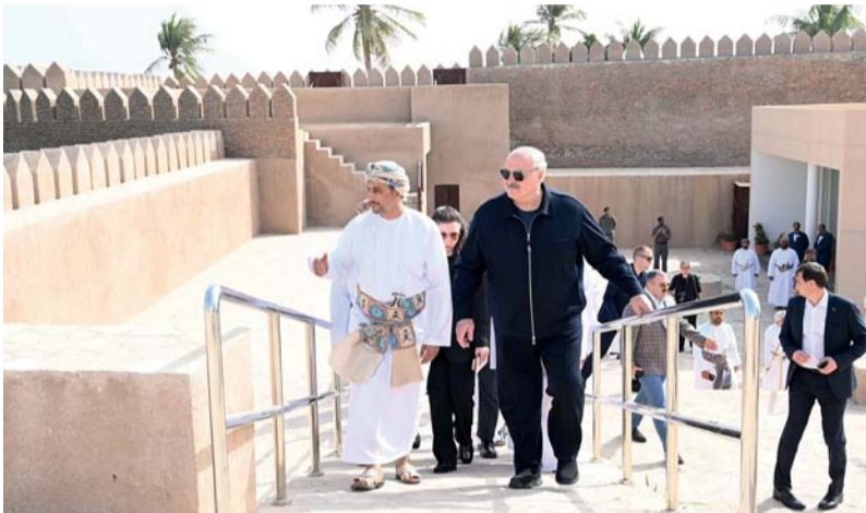
.. وخلال زيارته قلعة صحار التاريخية