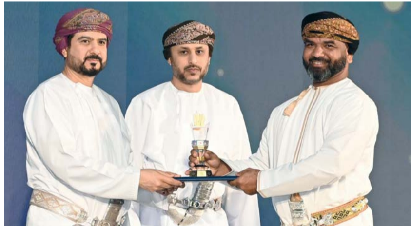
تتويج نادي السيب بالمركز الثاني