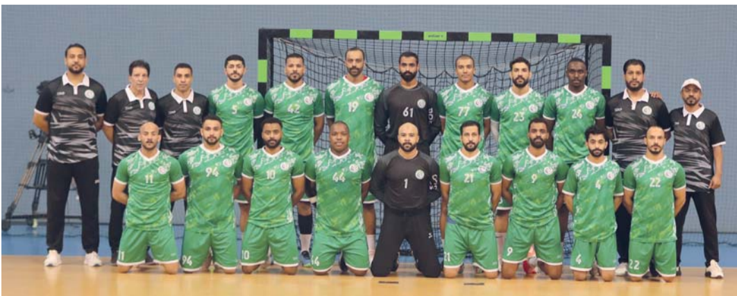
فريق أهلي سداب لكرة اليد

يسدل الستار مساء على منافسات بطولة كأس السوبر لكرة اليد في نسختها الجديدة بإقامة المباراة النهائية بين نادي عمان وأهلي سداب في الساعة السادسة مساء على ملعب الصالة الرئيسية بمجمع السلطان قابوس الرياضي ببوشر وذلك تحت رعاية سعادة فيصل بن عبدالله الرواس رئيس مجلس إدارة غرفة تجارة وصناعة عمان بحضور موسى بن خميس البلوشي رئيس مجلس إدارة الاتحاد العماني لكرة اليد وأعضاء مجلس الإدارة