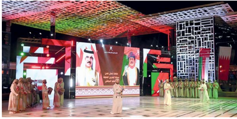
الحفل تضمن عدداً من اللوحات الغنائية