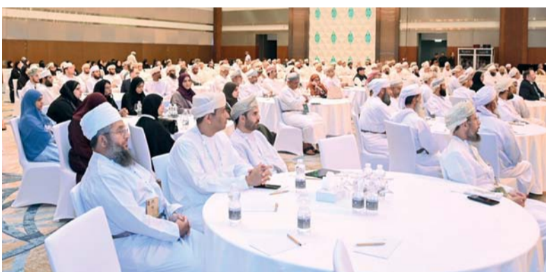
التوصية بتعزيز دور المجتمع لا سيما الجيل القادم في نماء الوقف