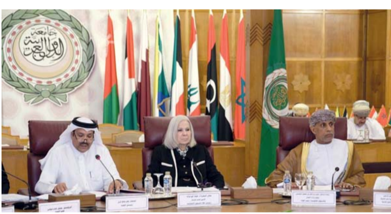
استعراض الجهود التي بذلتها سلطنة عُمان في سبيل تنفيذ الميثاق

جلسة مناقشة التقرير استعراض الجهود التي بذلتها سلطنة عُمان في سبيل تنفيذ الميثاق على الصعيد الوطني مدعمة بالإحصاءات التي تثبت ذلك، كما قام وفد سلطنة عُمان المشارك في المناقشة بالرد على أسئلة وتوصيات واستفسارات لجنة الميثاق العربي لحقوق الإنسان، حيث أعربت لجنة الميثاق العربي لحقوق الإنسان عن تقديرها ودعمها للجهود التي تم بذلها في سبيل إنفاذ الحقوق والحريات المنصوص عليها في الميثاق العربي لحقوق الإنسان.