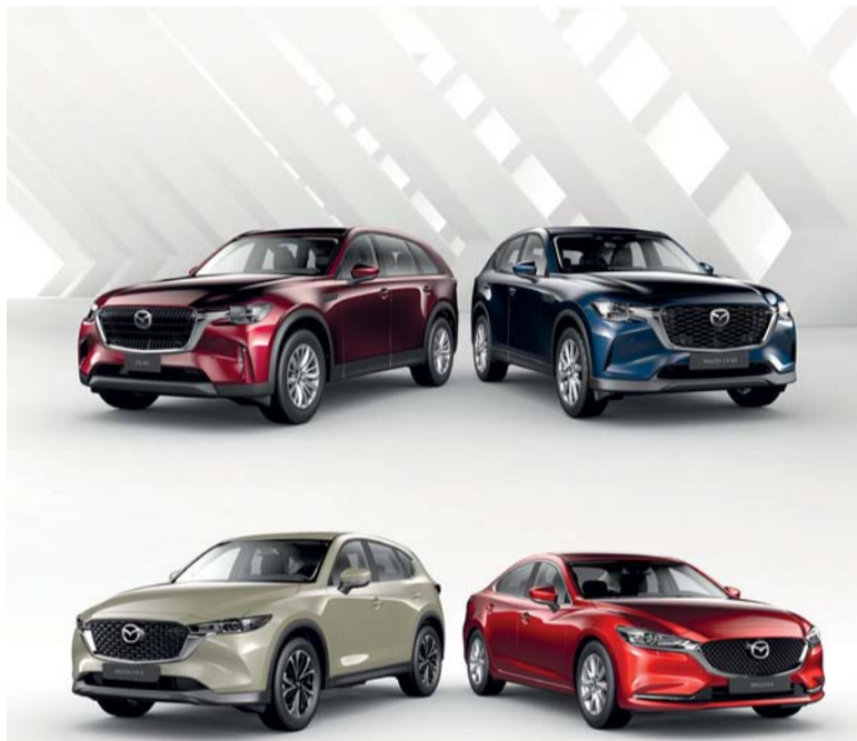
تشكيلة سيارات مازدا بعرض جذاب

جذاب وتجمع بين الأداء والتصميم، وبفضل محرك Skyactiv-G سعة ٢.٠ لتر وناقل حركة أوتوماتيكي بـ ٦ سرعات، توفر تجربة قيادة ديناميكية وتفاعلية.