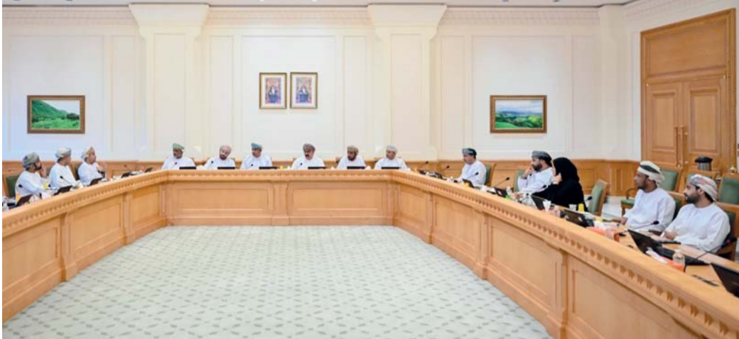
اللقاء استعرض خصوصية وطبيعة السوق العقاري في سلطنة عمان

وجرى الاجتماع الثالث من دور الانعقاد العادي الثاني للفترة (٢٠٢٤-٢٠٢٥م) للفترة العاشرة (٢٠٢٣ - ٢٠٢٤م) برئاسة سعادة الدكتور حمود بن أحمد البحياني، رئيس لجنة الخدمات والمرافق العامة بالمجلس.