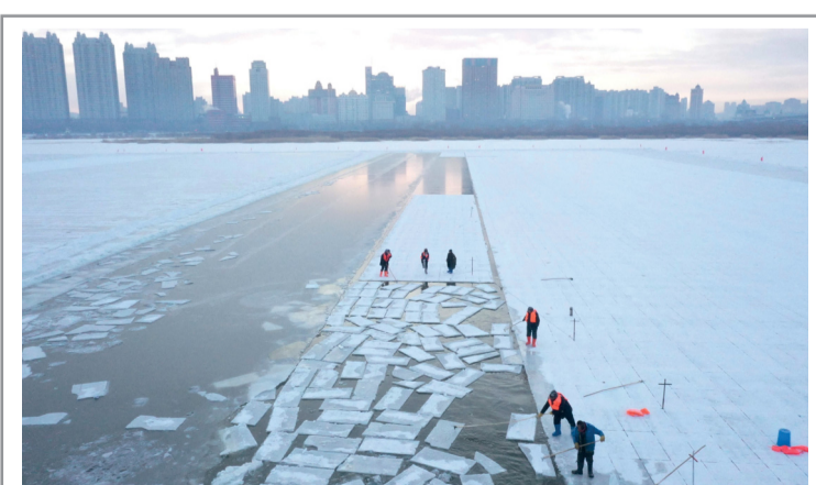
صورة جوية لعمال يبذلون الجهد من نهر سونغجو المتجمد استعداداً لمهرجان «هاربين العالمي للجليد والثلج السنوي» بمقاطعة هيلونغ جيانج في الصين.

سان فرانسيسكو - د ب أ: كشفت دراسة علمية أن ممارسة التدريبات الرياضية تنشأ الذاكرة والقدرات العقلية لمدة ٢٤ ساعة. وشملت الدراسة التي أجراها فريق بحثي من