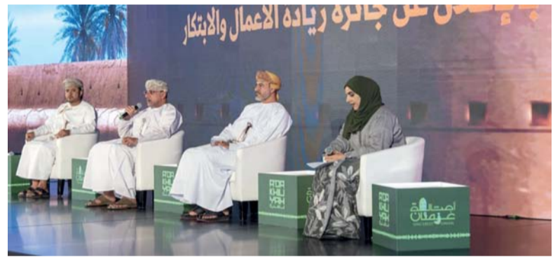
الجائزة تهدف إلى تعزيز ثقافة ريادة الأعمال ودعم المؤسسات الصغيرة والمتوسطة

شركة طلابية جامعية و ٤ تتنوع جائزة الداعمين لريادة الأعمال، وتتضمن أفضل جهة تمويلية وداعمة من القطاع الحكومي وأفضل جهة داعمة من القطاع الخاص وأفضل مؤسسة من القطاع المدني غير ربحية. جدير بالذكر أن جائزة ريادة الأعمال والابتكار بمحافظة الداخلية تنفذ كل عامين بهدف تعزيز ثقافة ريادة الأعمال، وتوفير بيئة ملائمة للتميز والإبداع والابتكار، ودعم وتشجيع المؤسسات الصغيرة والمتوسطة وتقدير الشخصيات والمؤسسات المسهمة في دعم ريادة الأعمال، وتكريم رواد الأعمال والمؤسسات الصغيرة والمتوسطة المجددين.