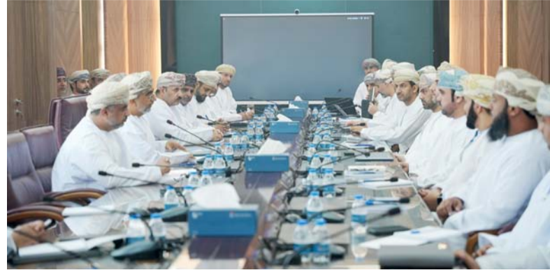
اللقاء يهدف إلى تحقيق التطلعات التي تتوافق مع أهداف التنمية المستدامة