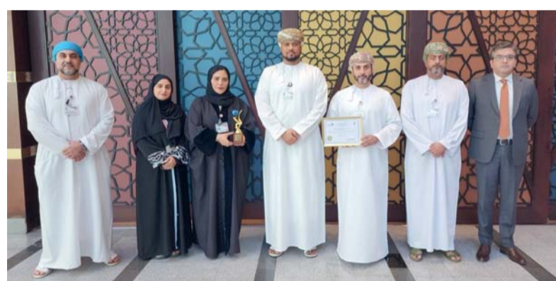
■ الجائزة تؤكد ريادة «ميثاق» في قطاع الصيرفة الإسلامية

المدى الطويل للمستثمرين، وذلك من خلال الاستثمار بشكل رئيسي في محفظة من الأسهم المتوافقة مع الشريعة الإسلامية والمدرجة في الأسواق بالبنطقة، مؤكداً على أن ميثاق سيواصل تقديم أفضل الخدمات والحلول المتميزة والمتكاملة للزبائن بما يلبي احتياجاتهم المتزايدة. ويقدم ميثاق للصيرفة الإسلامية لزيائته حزمة من الخدمات والتسهيلات المصرفية المتوافقة مع أحكام الشريعة الإسلامية. ولعل أبرز ما ينبغي التأكيد عليه بأن هذه المنتجات تخضع لسلسلة من التوجيهات والتشريعات الصادرة من البنك المركزي العماني والمراجعات الشرعية والإجراءات الإشرافية التي تخضعها هيئة الرقابة الشرعية التابعة لميثاق بحيث يتم صياغتها على نحو يتوافق مع أحكام الشريعة الإسلامية ويتلاءم مع تطورات زبائن ميثاق واحتياجاتهم الحالية.