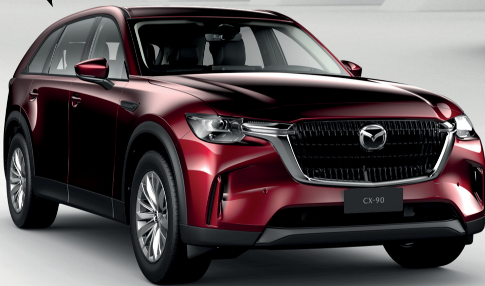
مازدا CX-90 سعة 3.3 لتر تيربو MHEV