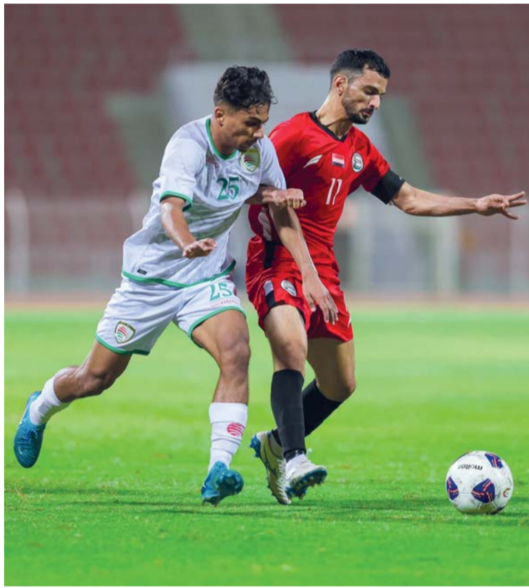
من لقاء المنتخب أمام نظيره اليمني

وهذا هو هدفه الرئيسي، ولكن من الممكن أن تقدم أفضل المستويات لتكسّر الحواجز التي ربما تكون مفصلة وفي وقت تحتاج فيه إلى كسب المباراة بعيدا عن المستوى الذي قد يحدك في مرات عديدة، فمباراة اليمن ليست هي المقياس الرئيسي لمنتخبنا ولاعبه سواء الأساسيون أو البدلاء وقبلهم الوجوه الجديدة التي تنتظر فرصتها للدخول في منظومة الأحمر سريعا قبل مرور الوقت، لذلك، نأمل أن الجهاز الفني حقق الاستفادة المرجوة من مباراة اليمن، وأنه استفاد من الدرس وعرف كيف سيسير الأمور بعيدا عن الفلسفة (المعطلة) والتي ظهرت سلبية في ماضي الوقت وخاصة في التصنيفات الآسيوية بقيادة الجهاز الجديد، وإيا كان المشهد فأكد أنه بالنهاية ساعد الجميع في كشف خلل ما أو حكم على مستوى لاعب ما أو التأكيد على الأسلوب المتبع، وسنرى ذلك في أول مباراة للأحمر أمام الكويت.