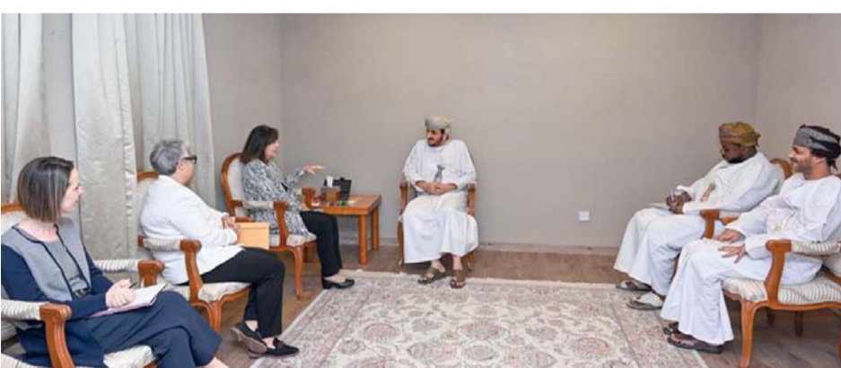
خليفة الحارثي أثناء استقباله إليزابيث ريتشارد

مسقط. العُمانية: استقبل سعادة الشيخ خليفة بن علي الحارثي، وكيل وزارة الخارجية للشؤون الدبلوماسية أمس السفيرة إليزابيث ريتشارد منسقة مكافحة الإرهاب بوزارة الخارجية الأمريكية، بديوان عام وزارة الخارجية. تم خلال المقابلة تبادل وجهات النظر حول التطورات بشأن القضايا بالمنطقة، وسبل تعزيز التعاون بين سلطنة عُمان والولايات المتحدة الأمريكية في مكافحة الإرهاب. حضر المقابلة سعادة حضر المقابلة سفيرة أنا إسكروهيما، سفيرة الولايات المتحدة الأمريكية لدى سلطنة عُمان، وعدد من المسؤولين من وزارة الخارجية.