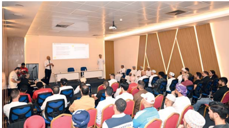
من حضور عرض برامج اللجنة