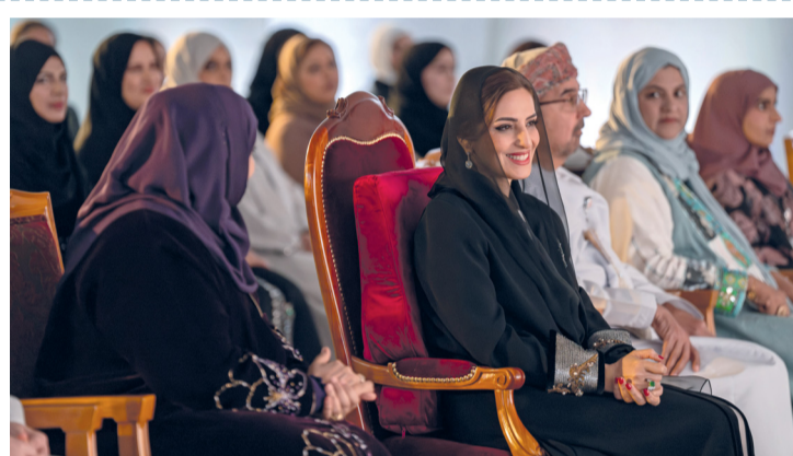
السيدة الجليلة تشيد بالجهود الحثيثة لتطوير قدرات المرأة العُمانية في مختلف المجالات

الرياض. العُمانية: بدأت بالملكة العربية السعودية مجريات التمرين العسكري العُماني السعودي المشترك (تضامن/١)، بمشاركة قوة من كتيبة ساحل عُمان بلواء المشاة (٢٣) بالجيش السلطاني العُماني، وقوة من الكتيبة الثانية من مجموعة اللواء العشرين بالملكة العربية السعودية. تفاصيل ..... ص ٢