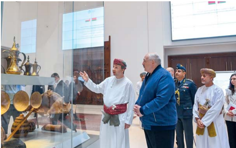
صيف البلاد يستمع إلى شرح واف عن مكونات التراث الثقافي لسلطنة عُمان

وتعبّر عن القيم الثقافية التي تشتهر بها. وفي قاعة عظمة الإسلام تعرف فخامته على مقتنيات تجسد روعة الإبداع الإسلامي أبرزها محراب مسجد العونية. وزار فخامة الضيف ركن السلطان قابوس بن سعيد بن تيمور (أعز الرجال وأنقاهم) بقاعة عصر النهضة، ووقف على أصل الرسالة رقم «١» للسلطان قابوس بن سعيد بن تيمور. طيب الله ثراه الموجهة إلى أصحاب السمو أعضاء مجلس العائلة المالكة الكرام عبر مجلس الدفاع. كما زار قسم الخط الزمني لأسرة البوسعيد، واطلع على مجموعة من