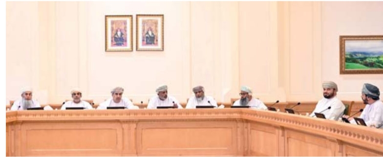
اجتماع لجنة الأمن الغذائي والمائي بمجلس الشورى أمس

وقع الاتفاقية سعادة الدكتور علي بن عامر الشيداني وكيل وزارة النقل والاتصالات وتقنية المعلومات ولتعزيز التعاون بين سلطنة عمان وسياسيات بوكاب رئيس الشبكات والشركات وعضو اللجنة التنفيذية بالمنتدى الاقتصادي العالمي. وتهدف الاتفاقية إلى تسريع تبني تطبيقات التقنيات الناشئة والذكاء الاصطناعي وفق الأسس والمعايير الدولية والاستفادة من شبكة الخبراء الدوليين في المجال الرقمي التي تتوفر لدى المنتدى الاقتصادي العالمي، كما تهدف إلى إطلاق