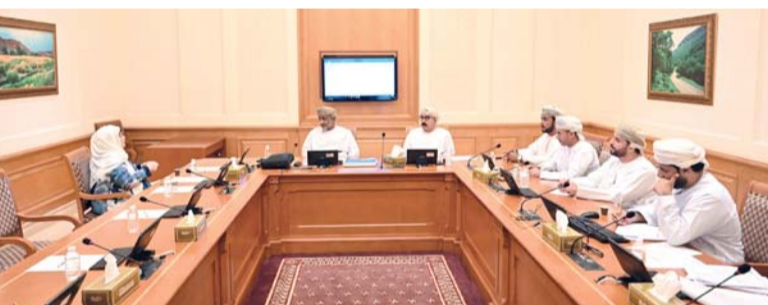
لجنة الخدمات والمرافق العامة بمجلس الشورى خلال اجتماعها أمس