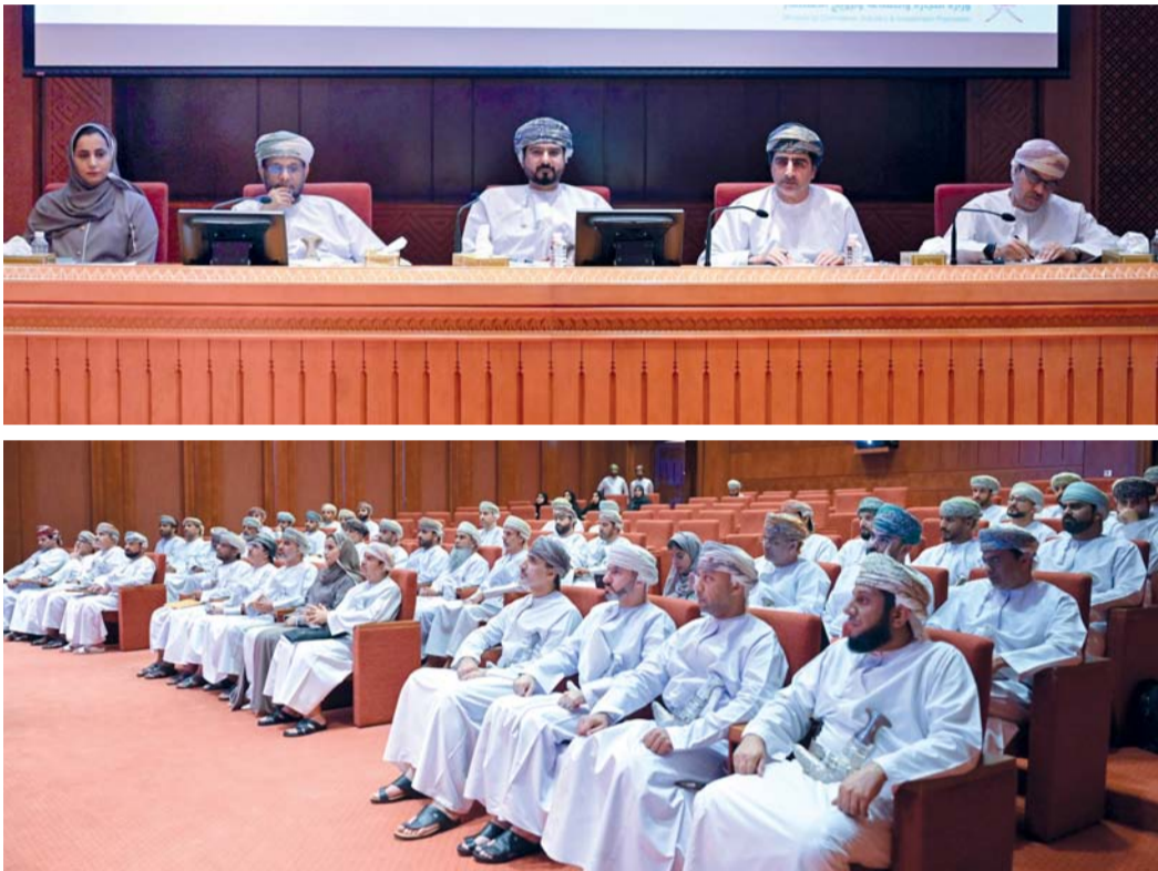
اللقاء أكد على ضرورة العمل الجاد لزيادة مساهمة الصناعة والتجارة والاستثمار في الناتج المحلي الإجمالي

ويهدف البرنامج إلى تمكين سلطة عُمان لتصبح وجهة تنافسية للاستثمار، وبيئة أعمال نشطة في منظومة التجارة العالمية من خلال تطوير شراكات بين سلطة عُمان ومجمعي الأعمال المحلي والدولي، ويقود البرنامج هذا التطوير مستنداً إلى مستهدفات «رؤية عُمان ٢٠٤٠» بهدف تيسير تحرك منظومة الاستثمار الشمولية عبر حزمة من التسهيلات والإجرائية والقانونية والإدارية والتخطيطية ذات الأثر المستدام ويسعى البرنامج إلى تعزيز دور القطاع الخاص في قيادة التنمية الاقتصادية وتمكينه عبر تهيئة البيئة الاستثمارية الجاذبة، ويهتم بتحسين بيئة الأعمال في سلطة عُمان من خلال تبسيط إجراءات الاستثمار، وتطوير أدوات الاستثمار والتشريع والقضاء، ويركز البرنامج على كثير من القطاعات الاستثمارية كالصناعات التحويلية والاتصالات وتقنية المعلومات والنقل والطاقة والتعدين والأمن الغذائي والطييران والسياحة.