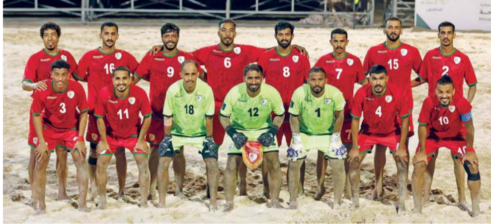
منتخبنا الوطني الأول لكرة القدم الشاطئية

تسحب يوم بعد غد الخميس بمقر الاتحاد الآسيوي لكرة القدم بالعاصمة الماليزية كوالالمبور قرعة النسختة الحادية عشرة لكأس آسيا لكرة القدم الشاطئية التي تستضيفها تايلاند على شاطئ جومتين بمدينة باتايا خلال الفترة من ٢٠ إلى ٣٠ مارس ٢٠٢٥ بمشاركة ١٦ منتخبًا حيث تم وضع منتخبنا الوطني الأول لكرة القدم الشاطئية في المستوى الأول مع منتخبات تايلاند وإيران واليابان. أما المستوى الثاني فيضم منتخبات: الإمارات، الكويت، البحرين، الصين، والمستوى الثالث: السعودية، لبنان، أفغانستان، ماليزيا، والمستوى الرابع: إندونيسيا، الهند، العراق، فيتنام، وسيتم توزيع