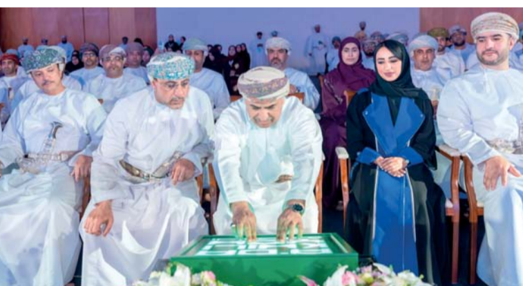
أثناء تدشين الهوية البصرية للمحافظة

محاورة اقتصادية واستثمارية وبالاستفادة من تجارب عملية وتطبيقية، وربط القطاع الوقفي بالتنوع الاقتصادي والتنمية الشاملة والتركيز على أهمية زيادة إسهام هذا القطاع الحيوي في الناتج المحلي. وقال: إن المؤتمر يتكامل مع جهود وزارة الأوقاف والشؤون الدينية الرامية إلى