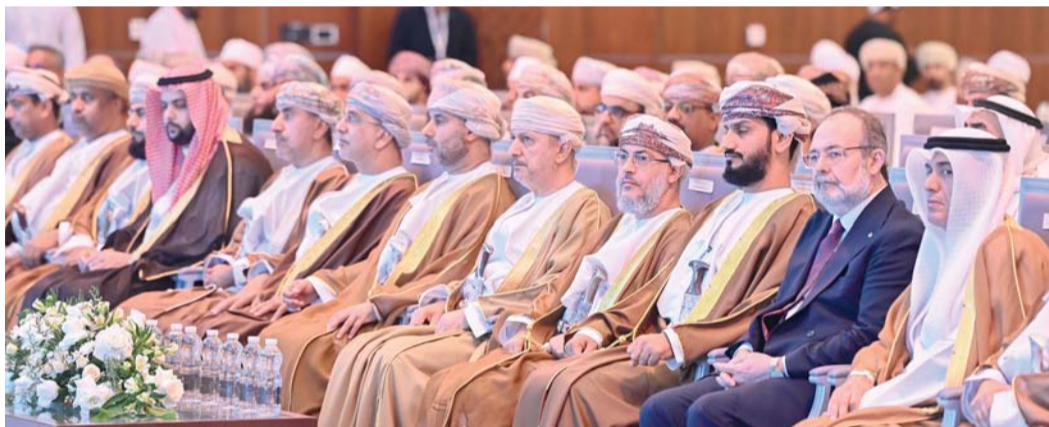
المؤتمر يأتي تجسيداً للشراكة الفاعلة بين الوزارة والمؤسسات الوقفية

مستنبطاً من الحروف والمباني، بل من المقاصد والمعاني، فالقيم التي يشتمل عليها الوقف من إثمار وخير وبر وإنفاق ومرحمة وإحسان وصدقة وقرض حسن، هي قيم متصلة في نصوص الشريعة. وقال صاحب السمو السيد الدكتور أدهم بن تركي آل سعيد: إن التحديات التي تواجه الوقف تتمثل في رصد وحصر الأوقاف، والقوانين واللوائح المنظمة والإدارة الفاعلة للوقف، والثقافة الوقفية المجتمعية فتوجهات الوقف المعاصرة تتمثل في إدارة الأموال بشكل منهجي ومهني والشفافية والحوكمة، وسياسات الإنفاق المرنة (المصارف المبتكرة)، والابتكار في جمع التبرعات والمصارف (السهم الوقفي)، والاستثمارات في المسؤولية الاجتماعية والربط مع برامج الاستثمار الاجتماعي والتنموي، وقياس أثر الوقف بتوثيق العوائد الاجتماعية والاقتصادية.