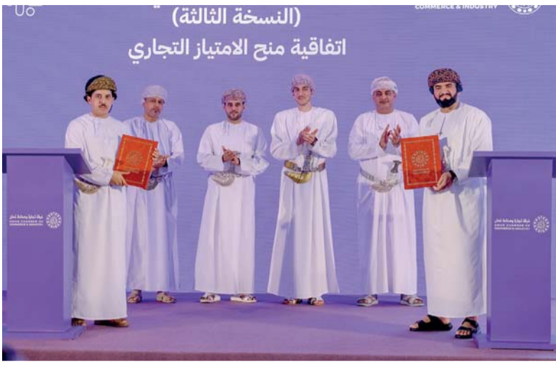
■ توقيع ٦ اتفاقيات لتطوير الامتياز التجاري بين الغرفة وعدد من الشركات

بالمائة ومجموعة المواد الغذائية والمشروبات غير الكحولية بنسبة ٣,٥ بالمائة ومجموعة الصحة بنسبة ٣,٢ بالمائة، مع زيادات محدودة في مجموعات المطاعم والفنادق، والملابس والأحذية، والأثاث والتجهيزات والمعدات المنزلية وأعمال الصيانة، والتعليم. وفي أحدث تقرير لصندوق النقد الدولي في نوفمبر الماضي في ختام مشاورات المادة الرابعة لعام ٢٠٢٤ مع سلطنة عمان، أشار التقرير إلى تراجع التضخم في سلطنة عمان إلى ٠,٦ بالمائة خلال الفترة من بداية العام الجاري وحتى نهاية الربع الثالث من العام الجاري، مقابل نسبة تضخم بلغت ٠,٩ بالمائة في عام ٢٠٢٣، لتظل معدلات التضخم في أسعار المستهلكين عند مستويات منخفضة في سلطنة عمان. وتتوقع وزارة الاقتصاد أن يظل معدل التضخم معتدلاً وضمن المستهدفات على المدى المتوسط، كما تتابع الوزارة من خلال مؤشر تنافسية المحافظة تطورات التضخم في مختلف المحافظات بهدف تحديد تفاوتات الأسعار والعوامل المؤثرة على التغيير في الأسعار للمساعدة في اتخاذ ما يلزم من إجراءات تحد من هذه التفاوتات وتحقق توازن الأسواق والأسعار.