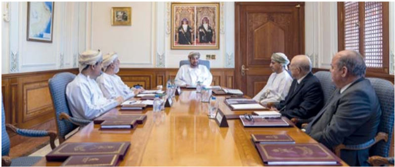
الاجتماع تضمن اعتماد المجالات الثلاثة للدورة القادمة للعام ٢٠٢٥ م