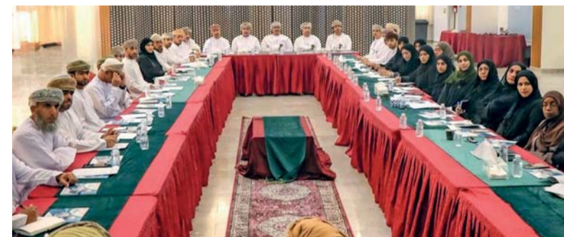
المدينة تسعى لتحقيق معايير التنمية المستدامة