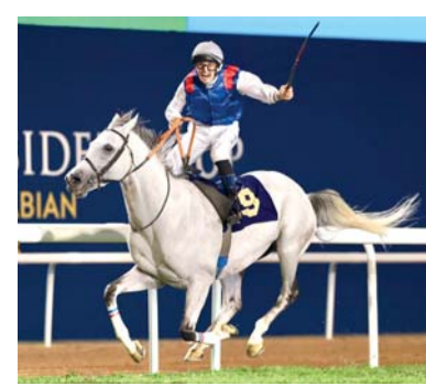
الجواد هيروس دي لا جارد