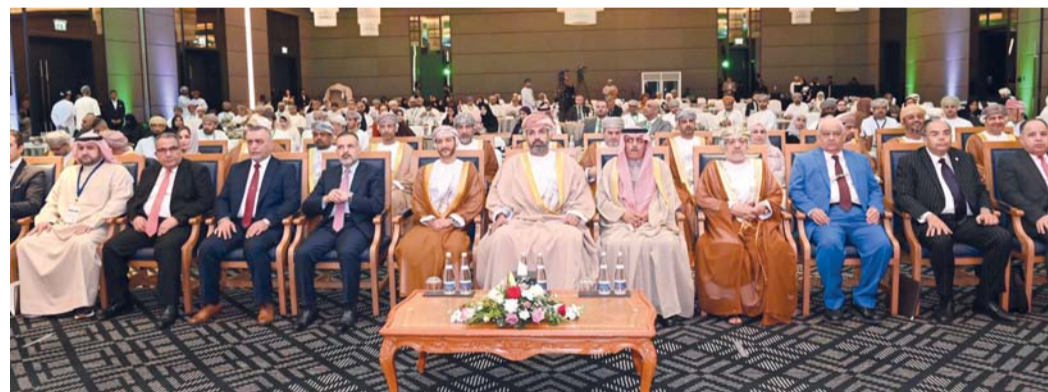
المؤتمر يركز على ثلاثة محاور منها تقييم جاهزية الحكومات وتحليل السياسات الحكومية لتحقيق الأمن الغذائي

ناقشت لجنة الخدمات والمرافق العامة بمجلس الشورى أمس خطة عملها لدراسة مشروع قانون الاتصالات وتقنية المعلومات المحال من الحكومة إلى المجلس وفقاً للمادة (٤٧) من قانون مجلس عُمان التي تنص بأن: «تعال مشروعات القوانين التي تعدها الحكومة إلى مجلس عمان لإقرارها أو تعديلها، ثم رفعها إلى السلطان مباشرة؛ للتصديق عليها وإصدارها وفي حال إجراء تعديلات من قبل مجلس عمان على مشروع القانون يكون للسلطان رده إلى المجلس لإعادة النظر في تلك التعديلات، ثم رفعه إلى السلطان». وخلال الاجتماع الثاني لدور