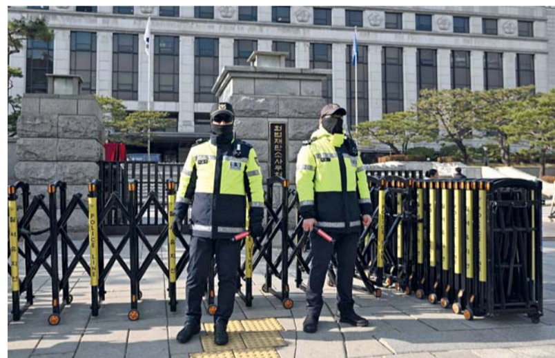
رجال شرطة يقفون للحراسة أمام المحكمة الدستورية في سيئول حيث بدأت المحكمة إجراءاتها بشأن عزل الرئيس يون سوك يول.

سيئول. وكالات: عقدت المحكمة الدستورية في كوريا الجنوبية أول اجتماع لها لمناقشة الجدول الزمني لآلية عزل الرئيس يون سوك يول بسبب محاولته الفاشلة فرض الأحكام العرفية. وأمام المحكمة الدستورية ستة أشهر للتصديق على عزل يون من عدمه، بعدما صوت البرلمان على إقالته السبت. وفي حال موافقة المحكمة، ستجري انتخابات رئاسية خلال شهرين. وخلال هذه الفترة التي تصل مدتها إلى ثمانية أشهر، سيعمل رئيس الوزراء هان داك-سو على تأمين المرحلة الانتقالية. وفي أول كلمة له بصفته رئيسا مؤقتا، تعهد بذل قصارى جهده لضمان «حكم مستقر». وقال رئيس الحزب الديمقراطي (قوة المعارضة الرئيسية) لي جاي ميونغ: «يجب على