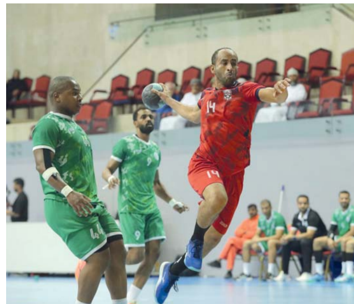
صورتان أرشيفيتان من مسابقات كرة اليد

أعلنت لجنة المسابقات بالاتحاد العماني لكرة اليد عن جدول وقواعد وشروط دوري عام سلطنة عُمان للدرجة الأولى للموسم الرياضي ٢٠٢٤/٢٠٢٥م الذي سينطلق يوم العشرين من الشهر الجاري بمشاركة ٨ أندية وهي نادي عُمان حامل اللقب ومسقط والسيب وأهلي سداب ومجيس والشباب وصلالة ونزوى حيث يشهد الأسبوع الأول بمبارتين الأولى تجمع صلالة مع الشباب في الساعة الثانية ظهراً على ملعب صلالة نادي الأمل، ويستضيف نادي عُمان بملعبه بصالة النادي نادي مجيس في الساعة الرابعة عصراً، وتقام يوم السبت ٢١ من الشهر الجاري أيضاً مباراتين الأولى تجمع نادي عُمان مع نادي صلالة على ملعب الصالة الرياضية بنادي عُمان في الساعة الرابعة عصراً، ويتبارى نزوى مع مسقط في الساعة السادسة مساءً على ملعب الصالة الرياضية بمجمع الرياضي بنزوى، ويوم الأحد ٢٢ من الشهر الجاري تقام مباراة واحدة تجمع أهلي سداب مع السيب في الساعة السادسة مساءً على ملعب الصالة الفرعية بمجمع السلطان قابوس الرياضي بوشر.