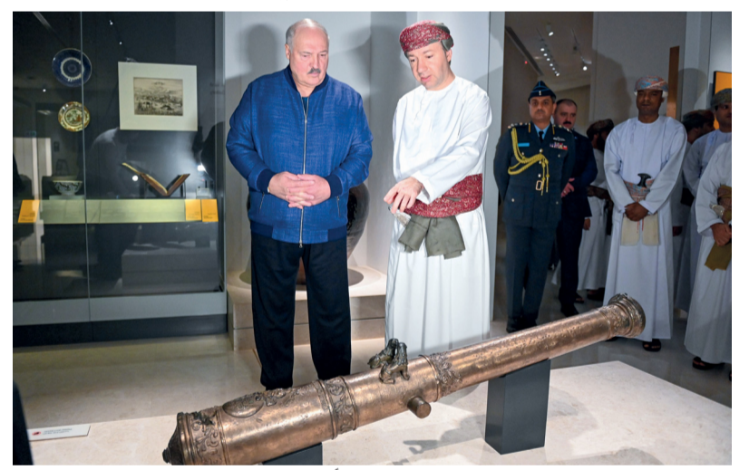
رئيس جمهورية بيلاروس يطالع على مقتنيات المتحف

مسقط. العُمانية: زار فخامة الرئيس ألكسندر لوكاشينكو، رئيس جمهورية بيلاروس والوفد المرافق له أمس المتحف الوطني في إطار الزيارة الرسمية لسلطنة عُمان. وتجول فخامة الضيف، والوفد المرافق له، في أرجاء المتحف وأرواقه، واستمعوا إلى شرح واف عن، وما يحويه من قاعات متنوعة تبرز مكونات التراث الثقافي لسلطنة عُمان، منذ ظهور الأثر البشري في عُمان وإلى يومنا الحاضر.