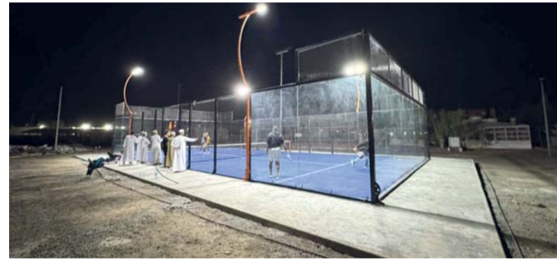
ملعب البادل بنادي بهلاء