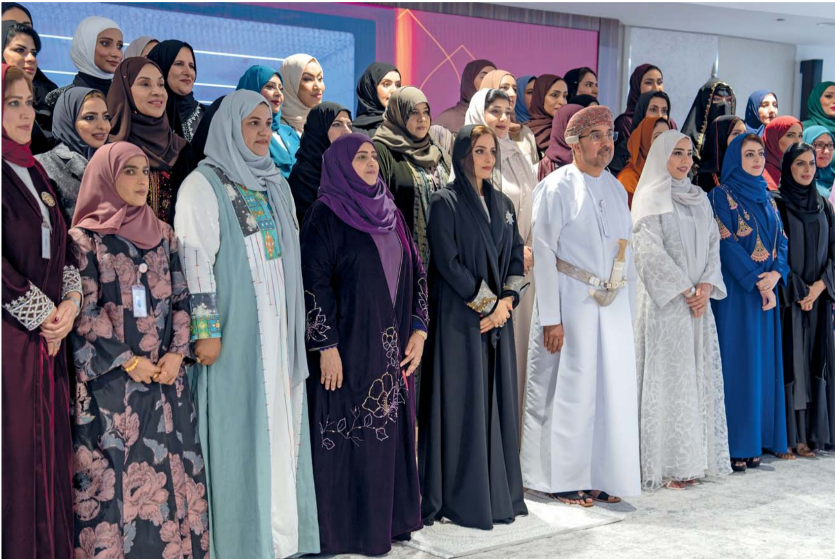
المبادرة تهدف إلى الارتقاء بقدرات المرأة العُمانية للمساهمة الفاعلة في مسيرة التنمية الشاملة في سلطنة عُمان