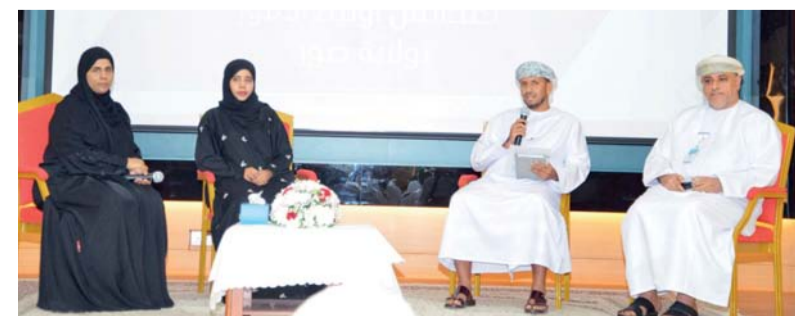
تعزيز التكامل بين المجتمع المدرسي والمجتمع المحلي

نظّم مجلس أولياء الأمور بولاية صور الملتقى الأول لمجلس أولياء الأمور بمدارس ولاية صور للعام الدراسي (٢٠٢٤/٢٠٢٥م) وذلك برعاية سعادة الدكتور يحيى بن بدر المعولي محافظ جنوب الشرقية وبحضور سعادة الشيخ الدكتور هلال بن علي الحبسي والي صور، رئيس مجلس أولياء الأمور بالولاية والسيد فخر الدين بن هلال البوسعيدي نائب والي صور بنيابة رأس الحد وأعضاء المجلس البلدي ورؤساء الوحدات الحكومية وأعضاء مجلس أولياء الأمور بولاية صور ورؤساء مجالس أولياء الأمور بمدارس ولاية صور والشيخ وذلك بقاعة المشارك بولاية صور. وقد ألقى سعادة الشيخ الدكتور هلال بن علي الحبسي والي صور رئيس مجلس أولياء الأمور بولاية صور كلمة أكد خلالها أن هذا الملتقى يهدف إلى تمكين مجالس أولياء الأمور بمدارس ولاية صور من الوصول إلى أفضل الممارسات في تفعيل أنوارها، وفي تعزيز التواصل