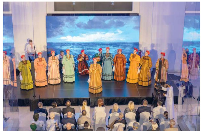
فرقة الأكاديمية الشعبية الشمالية الروسية

ويضيف: يمكننا الآن أن نستأنس بما توصلت إليه الأبحاث في اللغات الأخرى وتطبيقه على اللغة العربية. على سبيل المثال، يمكن للذكاء الاصطناعي أن يساعد معلمي اللغة العربية على تصميم الدروس والأنشطة التي تركز على المفردات ومواقف التواصل ذات الصلة بمجالهم. وبهذه الطريقة، يتم تعزيز فعالية التعلم إلى الحد الأقصى وتسهيل اكتساب المهارات اللغوية المتخصصة، ومن المعروف أن دمج الذكاء الاصطناعي في التعليم قد ولد تقدماً وفرصاً كبيرة في تعلم اللغات بشكل عام، فقد أدى الذكاء الاصطناعي إلى تطوير روبوتات الدردشة مثل (تشات جي بي تي ChatGPT) التي تعطي الطلاب فرصة لممارسة مهارات التحدث بشكل تفاعلي، كما تمكنهم من تحسين التغذية الراجعة الفورية في تصحيح التمارين الكتابية والشفوية، مما يسهل عملية التعلم ويعزز استقلالية الطالب. يترجم هذا التكيف مع احتياجات وأساليب التعلم لكل فرد إلى وصول شخصي إلى تعلم اللغة ويضمن فعالية وديناميكية.