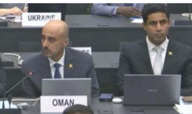
وقد سلطنة عُمان المُشارك في الاجتماع

الاجتماعية وضرورة العمل المشترك لتعزيز السلم والأمن الدوليين، مع تأكيدها في وقت سابق على التزامها بدعم أهداف الاتفاقية والعمل مع المجتمع الدولي لتحقيق الأمن والأمان البيولوجي. يناقش الاجتماع عدداً من الموضوعات المدرجة ضمن جدول أعمال الدورة الخامسة والستين من الأطراف لاتفاقية الأسلحة البيولوجية (BWC).