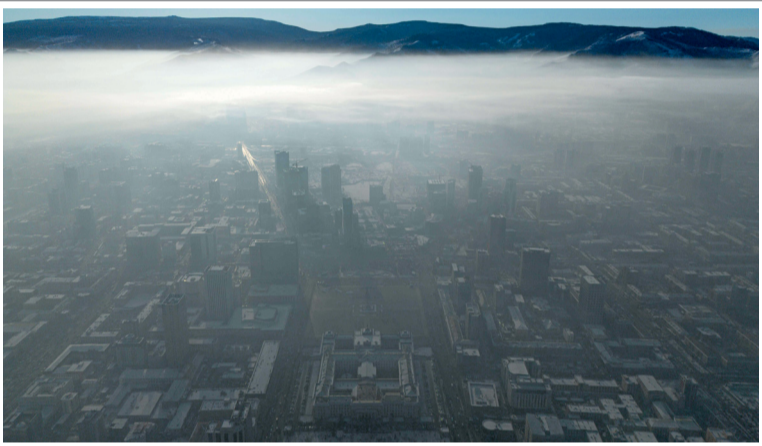
■ منظر جوي يظهر ضبابا دخانيا كثيفا ناجما عن تلوث الهواء في سماء العاصمة المنغولية أولان باتور

٥ برلين. د. أ: اكتشف الباحثون في منطقة نهر الميكونج في جنوب شرق آسيا خلال العام الماضي أكثر من ٢٣٠ نوعا جديدا من الحيوانات والنباتات التي لم تسجل من قبل، وفقا لتقرير جديد صادر عن الصندوق العالمي للطبيعة. وتمكن مئات العلماء العاملين في كمبوديا ولاوس وميانمار وتايلاند وفيتنام من اكتشاف ١٧٣ نوعا من النباتات الوعائية، و٢٦ نوعا من الزواحف، و١٧ نوعا من البرمائيات، و١٥ نوعا من الأسماك، وثلاثة أنواع من الثدييات. وبهذا الاكتشاف، يصل العدد الإجمالي لأنواع التي تم اكتشافها على