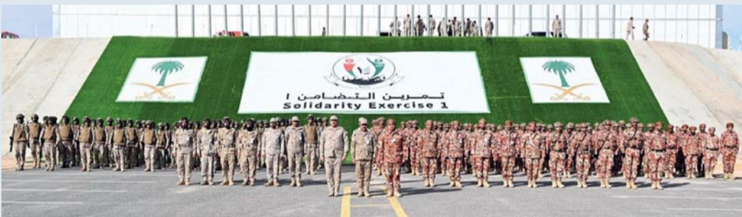
إكساب المشاركين مهارات تنفيذ الخطط العسكرية المشتركة

الرياض. العُمانية: بدأت بالملكة العربية السعودية مجريات التمرين العسكري العُماني السعودي المشترك «تضامن ١»، بمشاركة قوة من كتيبة ساحل عُمان بلواء المشاة (٢٣) بالجيش السلطاني العُماني، وقوة من الكتيبة الثانية من مجموعة اللواء العشرين بالملكة العربية السعودية. تضمن