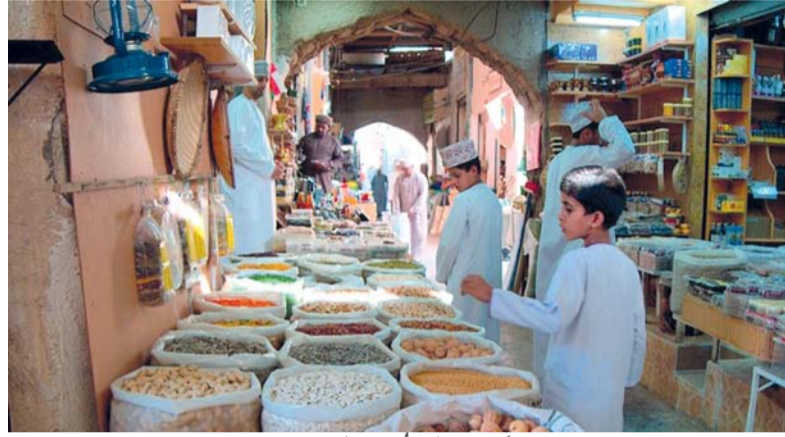
■ وزارة الاقتصاد تتوقع أن يظل معدل التضخم معتدلاً وضمن المستهدفات على المدى المتوسط.