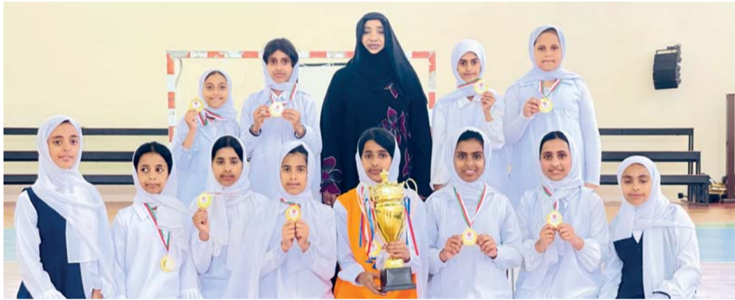
فريق مدرسة عائشة بنت أبي بكر المتفوق بلقب دوري المدارس