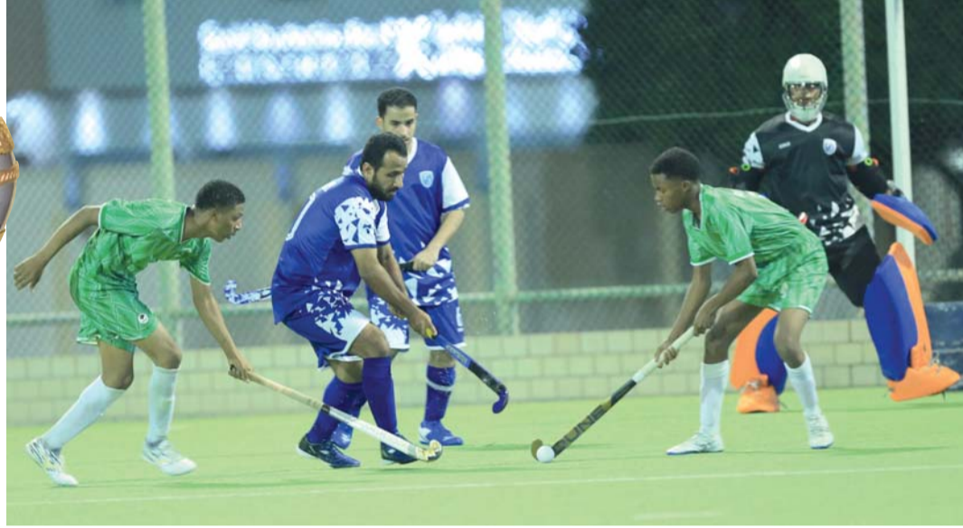
من مباريات كأس جلالته للهوكي في الأدوار التمهيدية