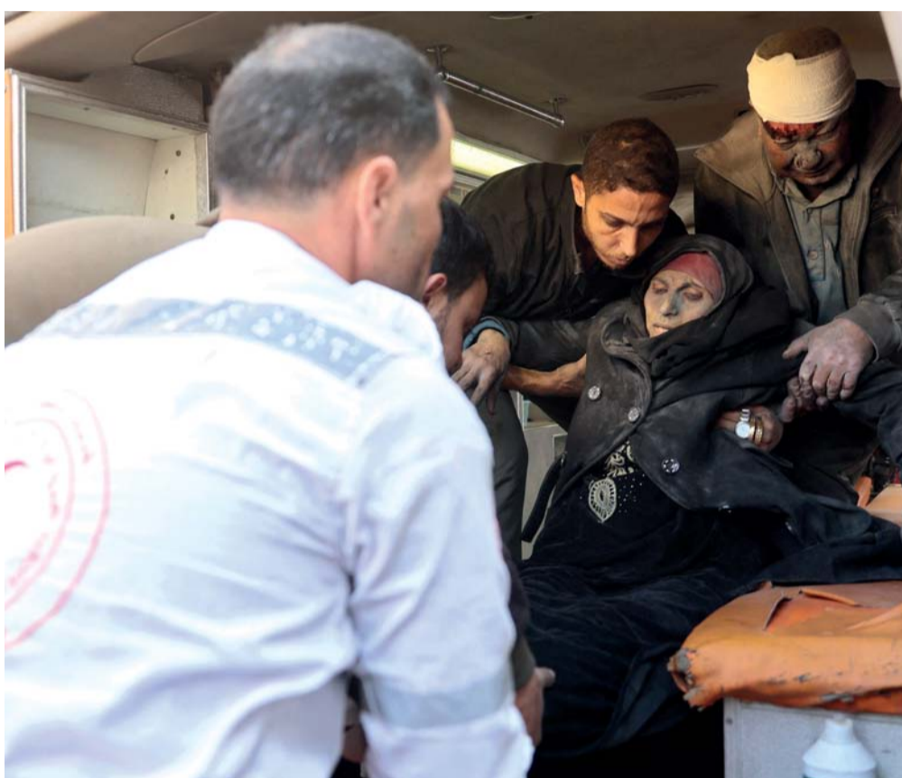
مسعفون ينقلون امرأة فلسطينية جريحة إلى سيارة إسعاف قبل نقلها إلى المستشفى الأهلي العربي، المعروف أيضاً باسم المستشفى المعداني، في مدينة غزة .