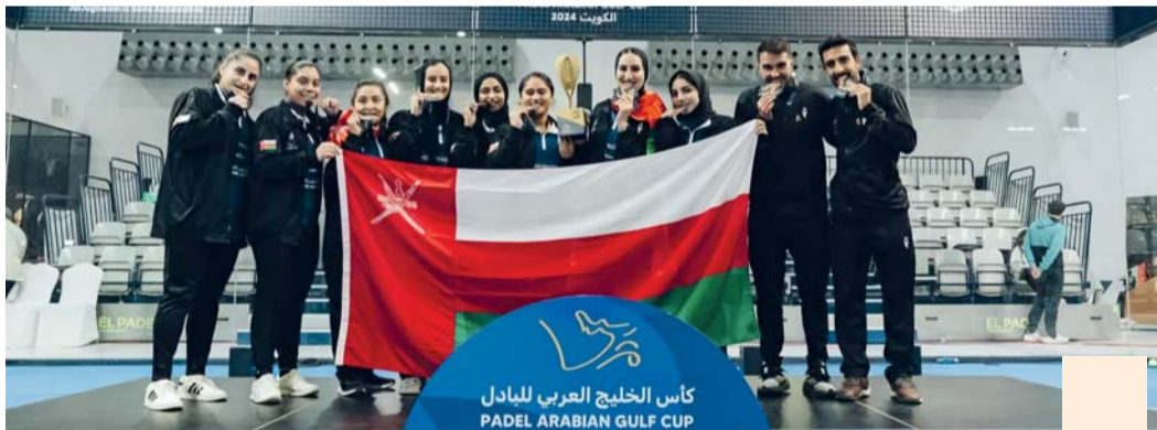
منتخب السيدات يحتفل بتتويج بكأس الخليج للبادل

تطلق اليوم ٤ مباريات في الأدوار النهائية لمسابقة كأس جلالته للهوكي في نسختها الـ ٤٤ في المجموعة الأولى يستهل نادي صحار بطل النسخة الماضية مشواره بملاقاة نادي السلام وذلك في الساعة السابعة مساءً وفي نفس المجموعة يلقي أهلي سداب مع النصر في الساعة الخامسة مساءً وتقام أيضاً مباراتان في المجموعة الثانية حيث يلعب صلالة مع السيب في الساعة الخامسة مساءً ويلقي ظفار مع العمارات في الساعة السابعة مساءً جميع المباريات تقام على أرضية ملعب هوكي عمان بولاية العمارات «المعبين الأول والثاني». وكانت قرعة البطولة قسمت الفرق المشاركة على مجموعتين الأولى ضمت نادي صحار حامل اللقب في النسخة الماضية مع أندية أهلي سداب والنصر والسلام بينما ضمت المجموعة الثانية أندية صلالة والسيب والعمارات وظفار وتلعب الأندية في كل مجموعة بنظام الدوري من دور واحد، ويتبارى في نصف النهائي أول المجموعة الأولى مع ثاني المجموعة الثانية والفائزان يتأهلان للمباراة النهائية أما الخاسران فيلعبان مباراة تحديد المركزين الثالث والرابع والميدالية البرونزية. وتعد مسابقة كأس جلالته للسلطان للهوكي من أعرق المسابقات المحلية التي انطلقت منذ عام ١٩٧١، حيث فاز بأول نسخة منها نادي عُمان، وكذلك فاز بالمسابقة في أعوام ١٩٧٢ و ١٩٧٣ و ١٩٧٤، قبل أن يفوز نادي أهلي في ١٩٧٥، بينما حصد النهضة لقب ٣ مواسم على التوالي أعوام ١٩٧٦ و ١٩٧٧ و ١٩٧٨، ثم فريق الشرطة عام ١٩٧٩، ثم عاد النهضة وتوج بها في موسمي ١٩٨٠ و ١٩٨١، قبل أن يتلق نادي مطرح ويتوج بلقب الكأس في