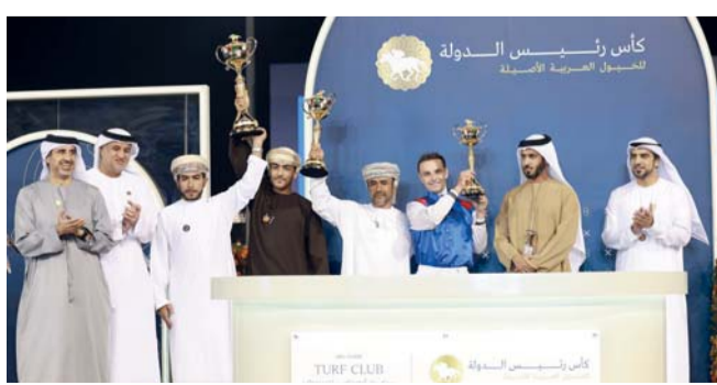
تسلم كؤوس وجوائز التي حصدتها الجواد هيروس دي لا جارد