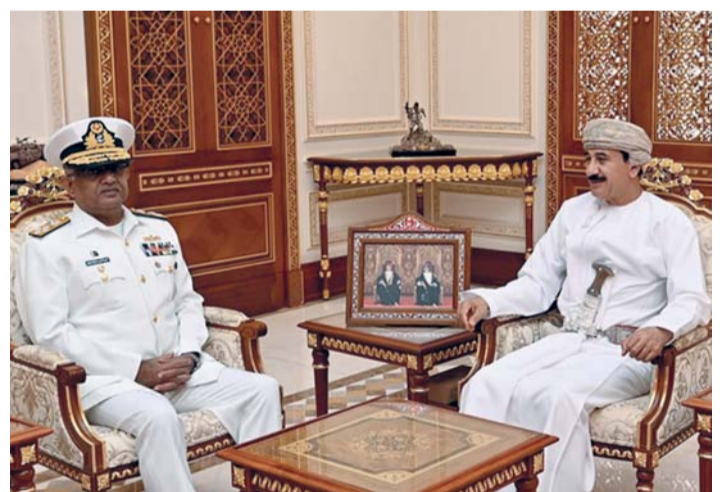
سلطان النعماني أثناء استقباله نافيد أشرف

من الموضوعات العسكرية، كما استمعوا إلى إيجاز عن كلية الدفاع الوطني وما تتضمنه من مرافق وتجهيزات، واطلعوا على أقسام الكلية المختلفة. وزار أمس الفريق أول بحري نافيد أشرف رئيس هيئة الأركان للقوات البحرية بجمهورية باكستان الإسلامية والوفد العسكري المرافق له مركز الأمن البحري. وكان في استقبالهم لدى وصولهم مقر المركز العميد الركن بحري عادل بن حمود البوسعيدي رئيس مركز الأمن البحري. وخلال الزيارة استمع الفريق أول بحري رئيس هيئة الأركان للقوات البحرية بجمهورية باكستان الإسلامية والوفد العسكري المرافق له إلى إيجاز عن أدوار وجهود مركز الأمن البحري في المحافظة على سلامة البيئة البحرية، في المنطقة البحرية العُمانية، كما تجولوا في مرافق المركز، واطلعوا على ما جُهر به من تقنيات وأنظمة حديثة تُلبي واجباته الوطنية.