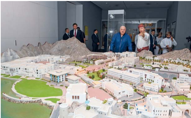
.. وأثناء تجوله داخل قاعات المتحف المختلفة