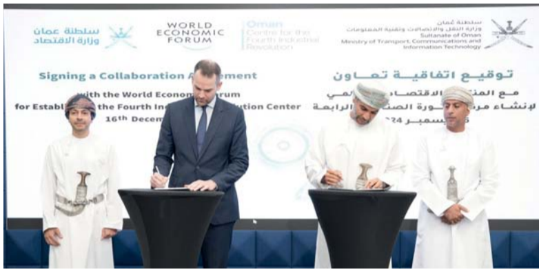
الاتفاقية تساهم في تسريع تبني تطبيقات التقنيات الناشئة والذكاء الاصطناعي

الاستدامة وحلول المناخ ستعمل الوزارة على تطوير سياسات وتطبيقات نكء اصطناعي مبتكرة لدعم الحلول المناخية المستدامة، والمساهمة في معالجة القضايا البيئية العالمية.