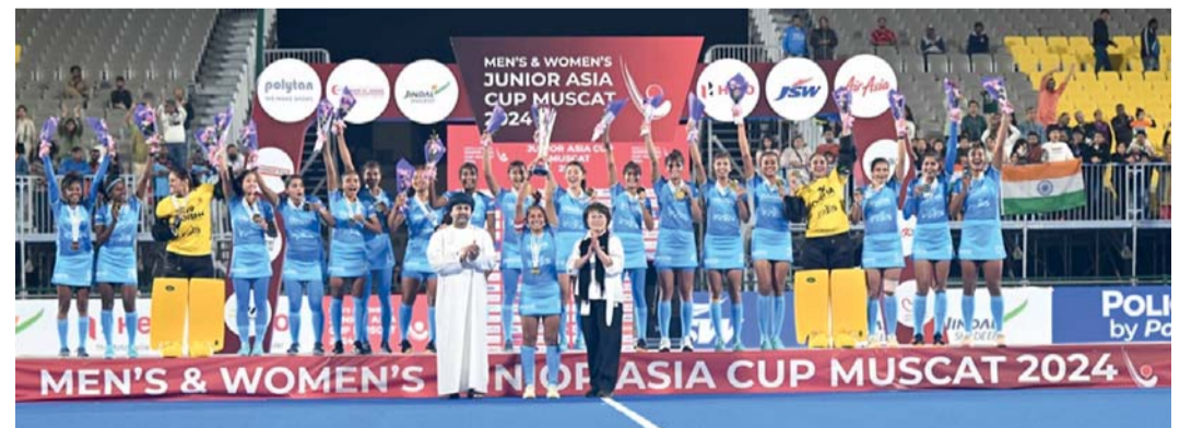
منتخب السيدات يحتفل بتتويج ببطولة آسيا لهوكي الشباب للنساء

توج منتخب الهند بلقب بطولة آسيا لهوكي الشباب للنساء ٢٠٢٤، التي استضافتها سلطنة عُمان على ملعب هوكي عُمان بولاية العمارات في محافظة مسقط، خلال الفترة من ٧ إلى ١٥ ديسمبر الجاري وحقق المنتخب الهندي البطولة بعد فوزه في المباراة النهائية على منتخب الصين بركلات الترجيح بنتيجة ٢-٣. بعد انتهاء الوقت الأصلي بالتعادل الإيجابي ١-١. وفي مباراة تحديد المركز الثالث، تغلب منتخب كوريا الجنوبية على منتخب اليابان بضريرات الترجيح بالننتيجة نفسها (٢-٣)، بعد تعادل الفريقان ١-١ في الوقت الأصلي. بينما فاز منتخب الصين بتايبيه على منتخب هونغ كونغ الصينية بنتيجة كبيرة ٦-١ في مباراة تحديد المركزين السابع والثامن، في حين حسم منتخب ماليزيا المركز الخامس بفوزه على منتخب تايلاند بنتيجة ٦-٠ صفر. وقد شهدت مراسم التتويج مشاركة عدد من الشخصيات، حيث قام سعادة سفير الهند لدى سلطنة عُمان