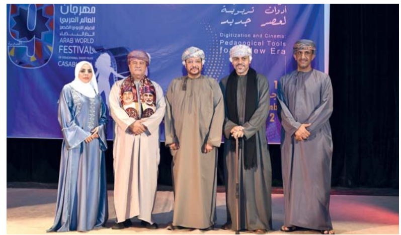
الوفد العماني المشارك في المهرجان

شملت الفعاليات افتتاح معرض (روسيا)، حيث يُبرز المعرض صوراً للمواقع الطبيعية الروسية، ونماذج من العمارة الخشبية والحجرية، بالإضافة إلى مشاهد من مدن روسية بزوايا غير مألوفة، فضلاً عن إقامة حفلة مسائية تقدمها فرقة الأكاديمية الشعبية الشمالية الروسية، حيث يتعرف الحضور على أحد أشكال الفن الشعبي الشهير، وتقود الفرقة الفنانة المكرمة في الاتحاد الروسي سيفيتلانا إغناطياف، أستاذة