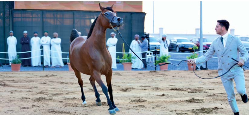
من استعراضات الهجن المشاركة في البطولة.

الجدير بالذكر أن دوري هذا الموسم سيشهد مشاركة ٨ أندية وهي: السيب، مصيرة، صحم، الشباب، مجيس، صحار، السلام، والبشائر. وتبلغ عدد مباريات الدوري ٥٦ مباراة وفقاً للدوري المعتمد، حيث ستخوض الأندية المشاركة ٢٨ مباراة في الدور الأول. ثم يتبع ذلك دوري من دورين للأندية التي تحتل المراكز من الأول إلى الخامس في الدور الأول، بإجمالي ٢٠ مباراة لترتيب تلك الأندية. وفي الأدوار النهائية، يتنافس الفريق صاحب المركز الأول مع صاحب المركز الرابع، فيما يلعب الفريقان الحاصلان على المركزين الثاني والثالث ضد بعضهما، على أن يلعب الخاسران لتحديد صاحب المركز الثالث، بينما يلتقي الفريقان الفائزان في المباراة النهائية لتحديد بطل الدوري ووصيفة.