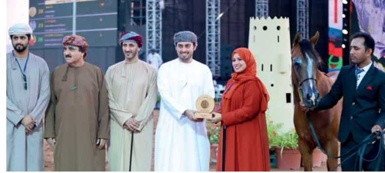
تتويج مُلاك الخيول الفائزة بالمراكز الأولى في البطولة

اختتمت بطولة الرباطية المحلية لجمال الخيل العربية في ولاية صحار بمحافظة شمال الباطنة ضمن مهرجان صحار الثالث في مركز صحار الترفيهي بدعم من محافظ شمال الباطنة والتي أشرف عليها الاتحاد العماني للفروسية والسباق، واستمرت على مدى يومين بمشاركة ٥٤ خيلاً. واشتملت البطولة على ٨ فئات للتأهيل لليوم الأول و٦ أشواط البطولة لليوم الثاني.