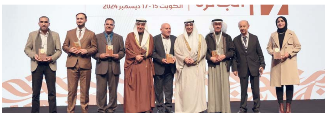
صورة جماعية للفائزين وعدد من القائمين على الدورة

يذكر أن فعاليات الدورة التاسعة عشرة تتواصل على مدى ثلاثة أيام، بدءاً من مساء أمس الأحد وحتى مساء غدا الثلاثاء، وتقدم الدورة على مسرح مكتبة البابطين المركزية للشعر العربي خمس جلسات أدبية، تبدأ بجلسة بعنوان (عبدالعزيز البابطين.. رؤى وشهادات)، تليها أربع جلسات أدبية يعرض المختصون من خلالها ثمانية أبحاث عن الشاعر عبدالعزيز سعود البابطين المحتفى به، وثلاث أمسيات شعرية ينشد فيها سبعة وعشرون شاعراً.