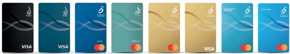
■ البطاقات الائتمانية لبنك ظفار توفر مجموعة من الامتيازات

الفرع وذلك تماشياً مع حملة الوعد بالخدمة التي أطلقها بنك ظفار مؤخراً حيث يتم تنفيذ ١٠ دقائق فقط منذ احتياج الزبائن في ١٠ دقائق فقط من وصولهم إلى الفرع. وتؤكد هذه المبادرة التي يتم تنفيذها الآن في جميع فروع بنك ظفار على تفاني البنك في تقديم أفضل الخدمات واحترام وقت الزبائن. وتعكس مجموعة البطاقات الائتمانية قدرتها على تلبية الاحتياجات المميزة لزبائنه من مختلف الشرائح من الأطفال والقرى إلى الشباب والنساء والأفراد الأثرياء والشركات كما يقدم البنك حلولاً مصرفية مصممة خصيصاً لكل شريحة أو فئة وذلك من خلال تلبية الاحتياجات والمتطلبات الفريدة لهذه الفئات مما يؤكد على دور بنك ظفار كشريك مالي موثوق به ويجعل الزبائن في قلب عملياته التشغيلية.