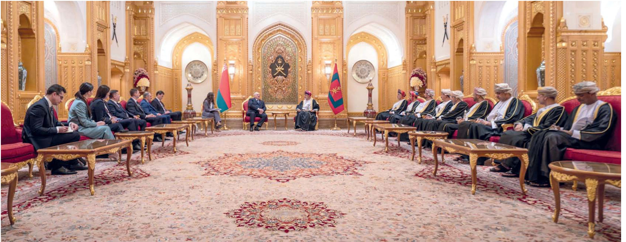
■ جلالة السلطان ورئيس جمهورية بيلاروس أثناء جلسة المباحثات الرسمية بقصر العلم العام