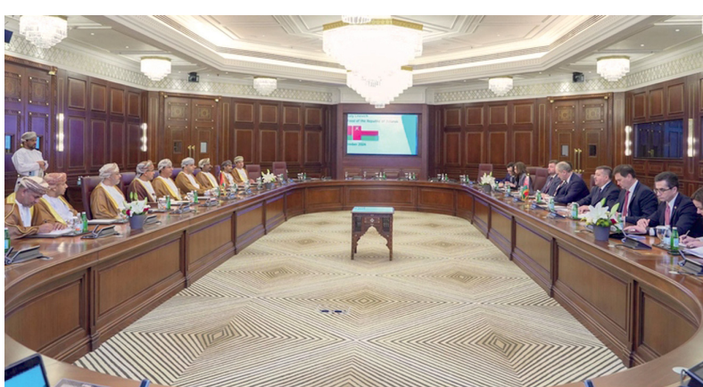
الجانبان ناقشا سبل دعم التبادل التجاري والفرص الاستثماريّة

وناقش الجانبان مسائل التعاون في مجال الأمن الغذائي وتنفيذ مشروعات مشتركة لإنتاج المواد الغذائية في سلطنة عُمان وتبادل الخبرات والزيارات والاستفادة من تجربة بيلاروسيا في تطوير وتنمية القطاعات الزراعيّة والسمكيّة والمائيّة.