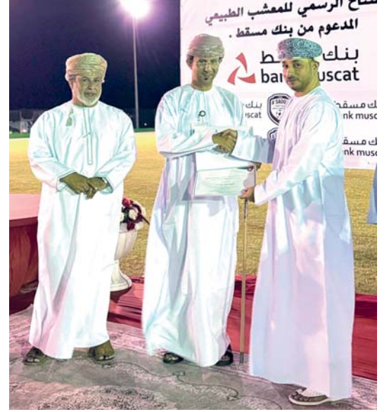
تكريم المساهمين والداعمين لمشروع التعشيب الطبيعي لملاعب فريق الصعود