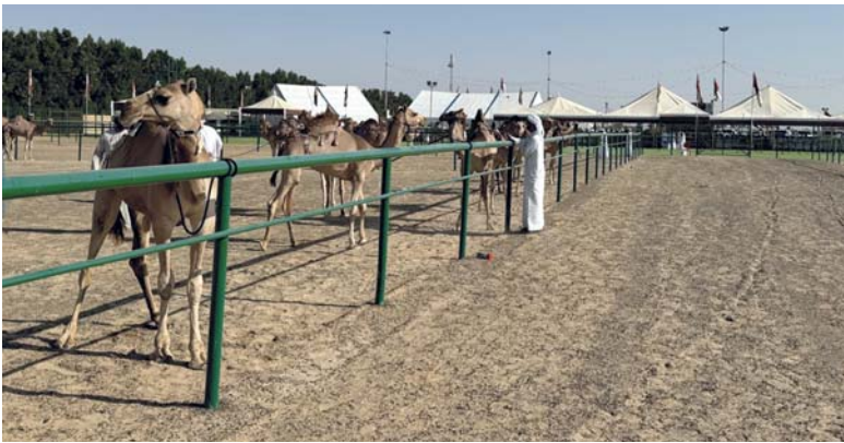
أعضاء لجنة التحكيم أثناء عملية تقييم الهجن المشاركة في المهرجان

بعثة المنتخب اليمني الشقيق وصلت إلى مسقط مساء أمس الأول، حيث اكتفى الجهاز الفني بخوض حصتين تدريبيتين فقط استعداداً لمباراة اليوم، حيث اختتم استعداداته عبر الوحدة التدريبية التي خاضها أمس في الخامسة والنصف مساء على ساحة مجمع السلطان قابوس الرياضي ببوشر، وقد أكد المدرب نور الدين ولد علي مدرب المنتخب اليمني أن جميع لاعبي اليمن في جاهزية تامة، وليس هناك منغصات قد تعيق طموحات الفريق اليمني في خليجي ٢٦، ويأمل في تقديم مباراة ودية أمام منتخبنا تحقق له كل أهدافه قبل السفر للكويت، وأن يعالج كل الأخطاء التي وقعت للفريق في مباراته الماضية أمام الكويت وهي التجربة الودية الأولى بالنسبة له وانتهت بالتعادل الإيجابي ١/١، وأن مباراة اليوم ستكون حاسمة لاختيار القائمة النهائية للبطولة، مشيراً إلى أن أداء اللاعبين خلال المراحل التحضيرية كان مرضياً، وأضاف أنه يحرص على متابعة أداء اللاعبين المحترفين في أنديةهم، بهدف الوصول إلى التشكيلة المثالية التي ستتمثل المنتخب في البطولة.