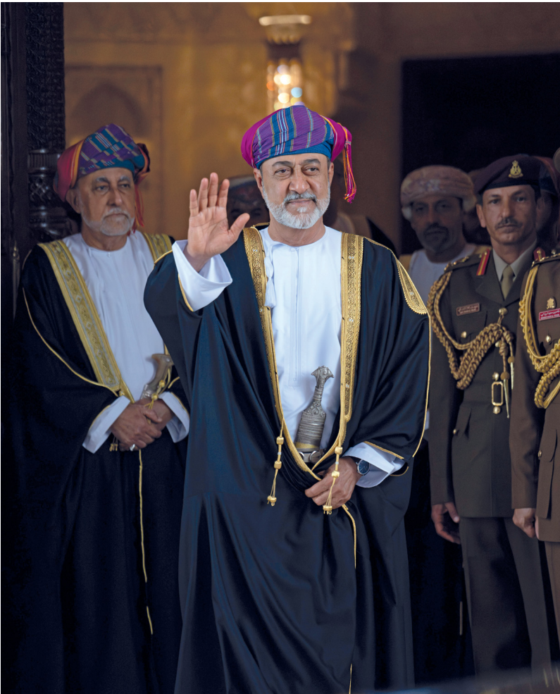
جلالته مُرحَّبًا بِضَيْفِ البلاد مُتَمَنِّيًا لَهُ طَيْبَ الإقامة