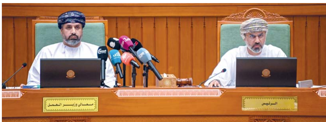
الجلسة تطرقت إلى أولويات قطاع العمل ومتطلباته

خلال عدة محاور أبرزها، نتائج تطبيق عقود العمل الحكومية المؤقتة بأنواعها، وخطط الوزارة لتطويرها، ونتائج تطبيق بقية أنواع عقود العمل بالقطاع الخاص والتحديات الماثلة أمام الوزارة، ومستقبل عقود العمل المؤقتة القائمة والمستقبلية وخطة الوزارة في التعامل معها جراء تطبيق قانون العمل الحالي. واشتملت الجلسة على مناقشة رؤية وزارة العمل بشأن الإطار القانوني والإداري لعقود العمل المؤقتة في ظل مؤشرات «اقتصاديات سوق العمل» المتأرجحة ومتطلبات التقنية والذكاء الاصطناعي ومتابعة الوزارة للأثار الإيجابية والسلبية) جراء تطبيق مبادرات التشغيل المؤقتة على بيئة العمل في سلطنة عُمان والقوى الوطنية العاملة بقطاعيه (العام والخاص).