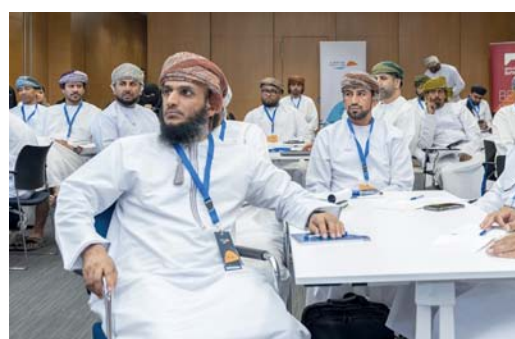
■ برنامج «رودا الدقم» خطوة مهمة لدعم رواد الأعمال والمؤسسات الصغيرة والمتوسطة

التي تلبى احتياجات الشركات التي تلبى الاحتياجات المتعددة للزبائن من الشركات. وتأتي البطاقات الائتمانية من بنك ظفار محملة بالامتيازات التي تثرى حياة الزبائن إذ يمكن لحاملي البطاقات كسب نقاط المكافأة على المشتريات التي يمكن استبدالها