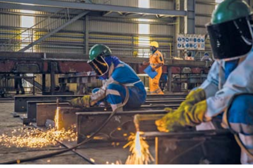
يلتزم صاحب العمل بتحديث عقد العمل عند وجود أي تغيير يطرأ على أجر العامل

هذا الإعلان جزء لا يتجزأ من مستندات المناقصة.