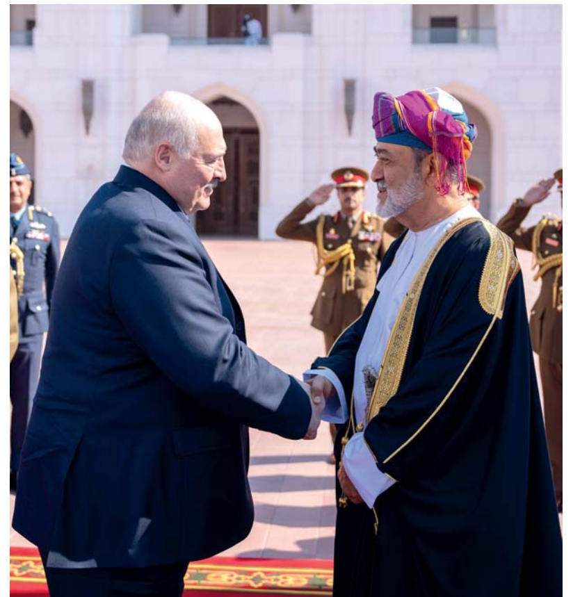
■ جلالة السلطان في مقدمة مستقبلي رئيس بيلاروس مُرحباً به ضيفاً عزيزاً