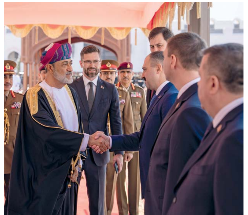
■ جلالة السلطان يصافح الوفد الرسمي المرافق لضيف البلاد