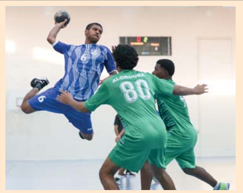
من مباريات دوري الشباب لكرة اليد