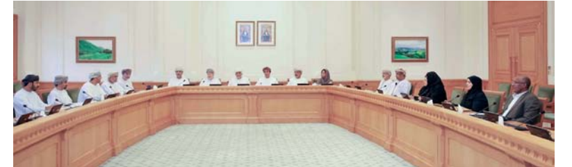
المشروع يُسهم في تطوير سياسات منح الإعفاءات من ضريبة الدخل

جرى ذلك خلال اجتماع اللجنة الخامس لدور الانعقاد العادي الثاني من الفترة الثامنة،