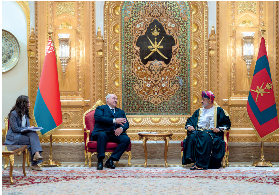
جلالة السلطان ورئيس جمهورية بيلاروس أثناء جلسة المباحثات الرسميّة بقصر العُلمِ العام

مسقط . العُمانيّة: بعثَ حضرةُ صاحبِ الجلالةِ السُلطانِ هيثمِ بنِ طارقِ المعظّم . حفظه اللهُ ورعاهُ . برقيّةً تهنئةً إلى أخيه جلالته الملك حمد بن عيسى آل خليفة ملك مملكة البحرين بمناسبة العيد الوطني لمملكة البحرين الشقيقة. أعربَ جلالتهُ السُلطانُ المعظّمُ من خلالها عن أطيّبِ تهانيه وصادقِ تمنياته الأخويّة لجلالة الملك بواقرِ الصحّة والسعادة ومديدِ العمر، مقرونة بالدعاء إلى الله تعالى أن يُعيدَ هذه المناسبةَ عليه وعلى الشعبِ البحريني الشقيق، وقد تحقّق له المزيدُ ممّا يصبو إليه من تقدّمٍ وازدهارٍ، ولعلاقاتِ البلديّين المتجدّرة النمو والارتقاء. كما هنأَ حضرةُ صاحبِ الجلالةِ السُلطانِ هيثمِ بنِ طارقِ المعظّم . حفظه اللهُ ورعاهُ . عبّرَ برقيّةً تهنئةً أخاهُ صاحبِ السموّ الشّيخِ مشعلِ الأحمدِ الجابرِ الصباحِ أميرَ دولةِ الكويت، بمناسبةِ ذكرى تولّي سُمُوهُ مقاليدِ الحكم. ضمّنها جلالتهُ السُلطانُ المعظّمُ أطيّبَ تهانيه وأصدّقَ تمنياته لأخيه سموّ الأمير، سائلًا اللهُ عزّ وجلّ أن يوفّقَ سُمُوهُ لتحقيقِ المزيدِ من الإنجازاتِ والتطوّراتِ في دولةِ الكويتِ الشقيقة، بما يُلبي تطلّعاتِ الشعبِ الكويتي وتحقّقِ المزيدِ ممّا يرنو إليه من ازدهارٍ ورخاءٍ، راجيًا لعلاقاتِ الشراكة والتعاون والتعاوُدِ اطرادَ التقدّمِ والنموّ.