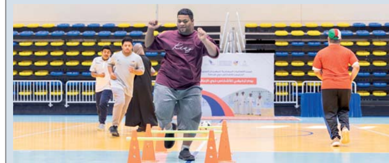
تفاعل كبير من قبل المشاركين في فعاليات اليوم الترفيهي