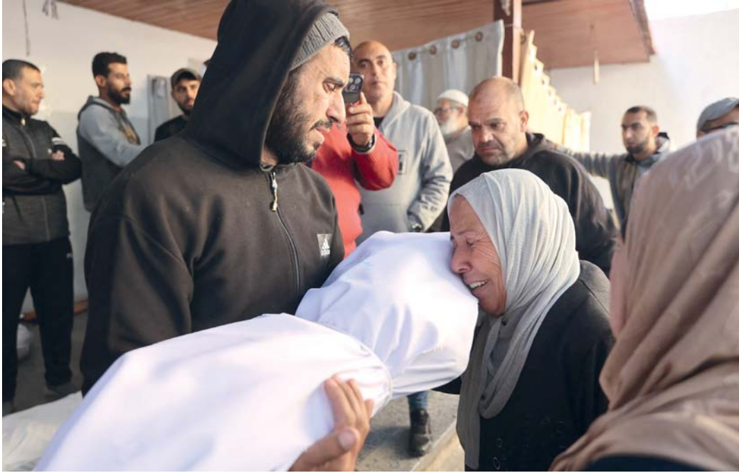
فلسطينية تنتحب حزناً على شهيد لها اغتيل في غارة إسرائيلية بغزة