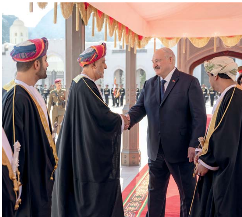
■ رئيس بيلاروس يصافح مُستقبليه من الجانب العُماني