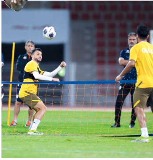
من تدريبات منتخبنا الوطني الأول

وسط جماهيره وعلى أرضه في مشهد تكرر كثيراً بين الفريقين خلال بطولات كأس الخليج على مر التاريخ. الجهاز الفني لمنتخبنا يسعى من خلال هذه التجربة (الوحيدة) لأن يقف على كل جزئية تخص الأحمر العماني، بالإضافة إلى الوقوف على نتائج المعسكر الداخلي الذي يخوضه منتخبنا حالياً، ناهيك عن معالجة الأخطاء المرتكبة والمتكررة التي صاحبت مسيرة منتخبنا في مباريات التصفيات المؤهلة للمونديال والتي أضع من خلالها الأحمر الكثير من النقاط لمصلحة المنافسين المباشرين على أقل تقدير. ■■