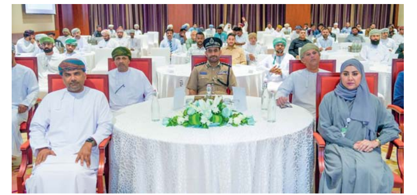
النفط العمانية للتسويق ملتزمة بتعزيز ثقافة الصحة والسلامة

افتتحت مؤخرًا شركة النفط العمانية للتسويق فعاليات أسبوع الصحة والسلامة والجودة السنوي وذلك برعاية العميد الركن مهندس علي بن سيف القبالي رئيس هيئة الدفاع المدني والإسعاف.