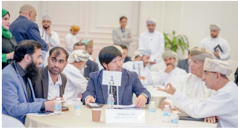
■ المنتدى شهد استعراض المقومات الاستثمارية والحوافز المقدمة للمستثمرين في البلدين

المنتدى شهد استعراض المقومات الاستثمارية والحوافز المقدمة للمستثمرين في البلدين المعتمد لدى سلطنة عمان الاهتمام العماني بالاستثمار في المجالات الحيوية وتكنولوجيا المناخ معرباً عن تطلعه لتعزيز التعاون بين البلدين في هذا الشأن خاصة مع توجه سلطنة عمان لتطوير تكنولوجيا الهيدروجين الأخضر والأومونيا والطاقة المتجددة، وبين أن اليابان تعمل على استراتيجية للاستثمار في البنية الأساسية الخضراء والحلول الرقمية بالإضافة إلى تجارة السيارات والفضاء والمعدات الطبية والمعادن والزراعة والصناعات الثقيلة.