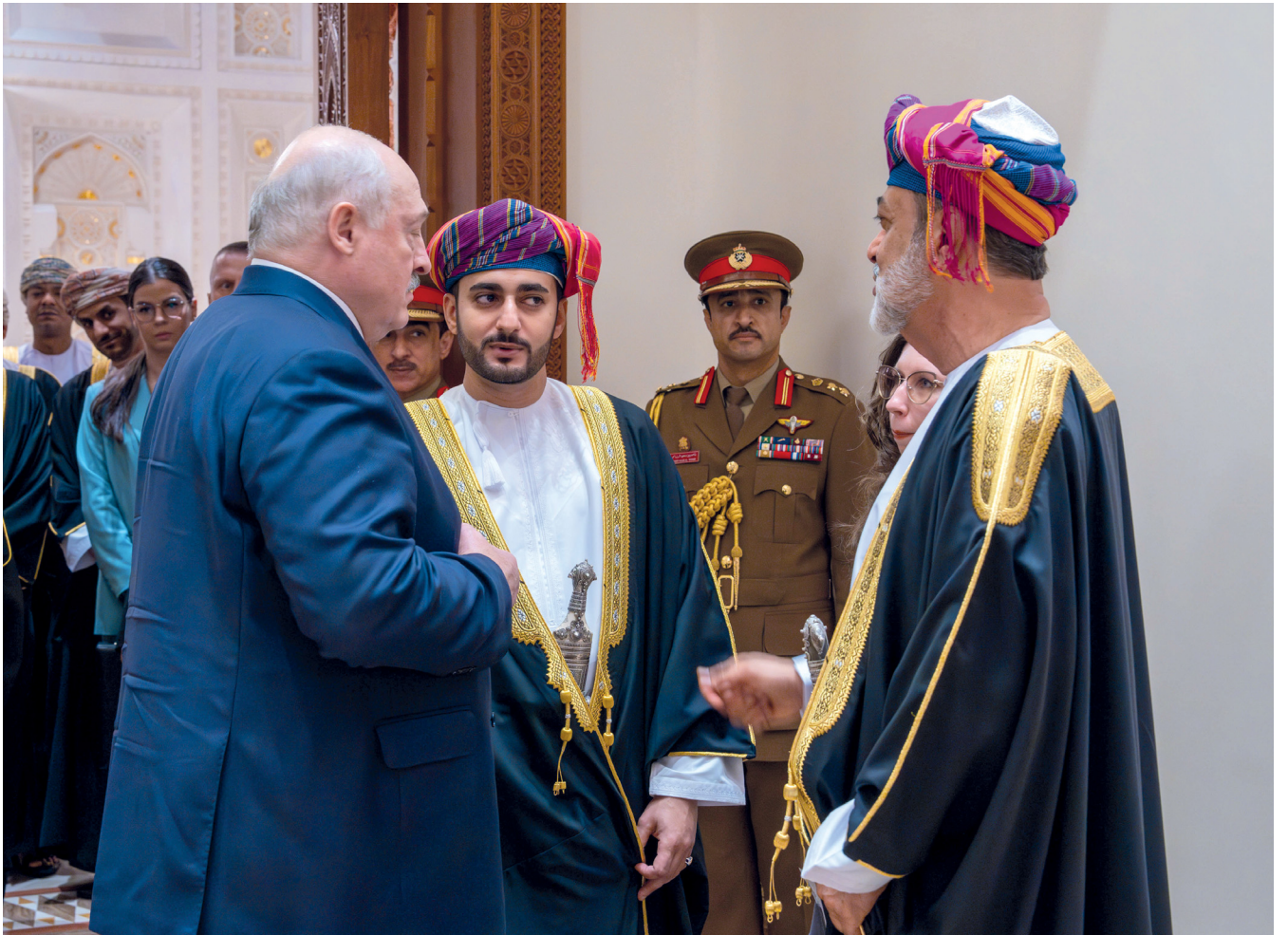
جلالة السُّلطان ورئيس جمهورية بيلاروس في حوارٍ وديٍّ بحضور ذي يزن بن هيثم