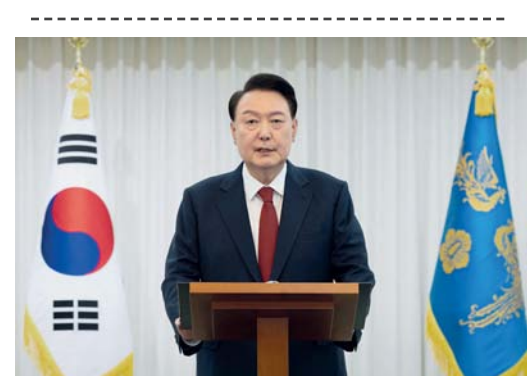
الرئيس الكوري الجنوبي يون سوك يول يلقي خطاباً عاماً داخل مقر إقامة الرئيس في سيئول

وصلت الطائرات الحربية الإسرائيلية قصفها لمختلف مناطق قطاع غزة مخلفة أعداداً كبيرة من الشهداء والجرحى حيث ارتكب الاحتلال الإسرائيلي مجزرتين خلال ٢٤ ساعة ضد العائلات في قطاع غزة في حين أقدم الاحتلال على إحراق منازل بجباليا وبيت لاهيا. وارتفعت حصيلة العدوان الإسرائيلي إلى ٤٤٩٣٠ شهيداً و١٠٦٦٢٤ مصاباً من السابع من أكتوبر ٢٠٢٣. ونفذت طائرات الاحتلال سلسلة غارات خلال الليل أُنيت لاستشهاد ١٣ وإصابة نحو ثلاثين معظمهم أطفال. واستشهد أربعة وعدد من الإصابات إثر قصف طائرات الاحتلال منزلاً لعائلة مطر بشوارع النفق وسط مدينة غزة، كما ارتقى ثلاثة شهداء ووقع عدد من المصابين في غارة إسرائيلية استهدفت منزلاً لبحي الزيتون جنوب مدينة غزة واستشهد أربعة وعدد من الجرحى بعد قصف الاحتلال منزلاً لعائلة «عروق» في حي الشيخ رضوان شمال مدينة غزة. وكانت طائرات الاحتلال قصفت مدرستي الماجدة وسيلة والعائلة المقسمة غرب غزة ما أدى لاستشهاد تسعة وإصابة العشرات. وتواصل قوات الاحتلال تدمير وإحراق المنازل في جباليا وبيت لاهيا. ونسف الاحتلال عدداً من المباني السكنية بمنطقة الخلفاء في مخيم جباليا شمال قطاع غزة. وأطلقت طائرة «كواد كابتير» القنابل على المنازل في محيط مستشفى