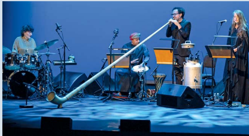
مبادرة «جسور الصحراء» هي أنشطة تعليمية وثقافية مجتمعية تقام في جميع أنحاء سلطنة عمان

تستضيف دار الأوبرا السلطانية مسقط يوم الخميس والجمعة المقبلين مسرح يو التايواني لتقديم عرضه الاستثنائي (سيف الحكمة) وهو عرض يدمج بين مهارات قرع الطبول والفنون القتالية والبراعة في الأداء الأكروباتي، حيث سيروي الرحلة البطولية لـ (الشجاع) وهو يواجه الخوف من