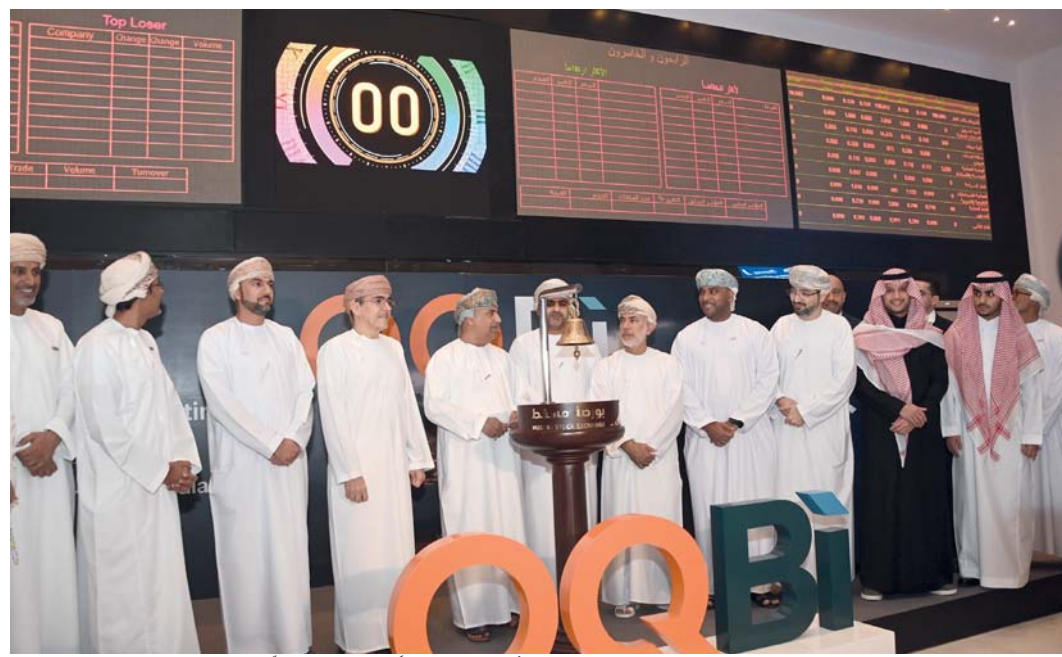
إدراج شركة أوكيو للصناعات الأساسية يُعد رابع إدراج للشركة في قطاع النفط والغاز