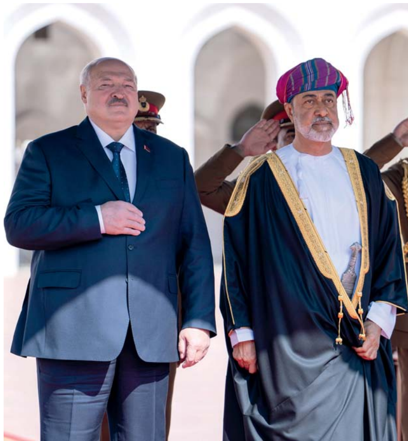
■ جلالة وضيف البلاد أثناء عزف السلام الوطني لجمهورية بيلاروس

بعدها صافح جلالته السلطان المعظم الوفد الرسمي المرافق لفخامة الضيف، فيما صافح فخامة الرئيس الضيف مُستقبليه من الجانب العُماني، حيث كان في الاستقبال عددٌ من أصحاب السمو وأصحاب المعالي الوزراء وعددٌ من القادة العسكريين. ■