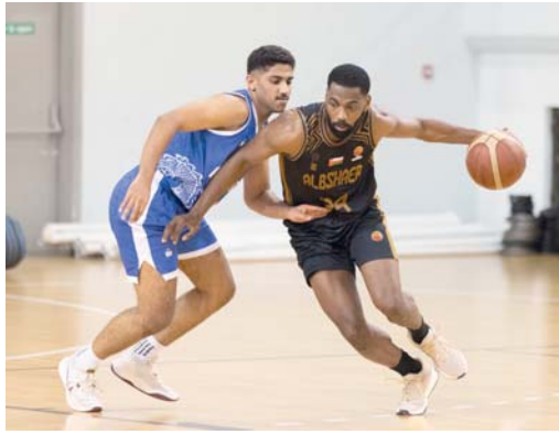
من لقاء البشائر والنصر