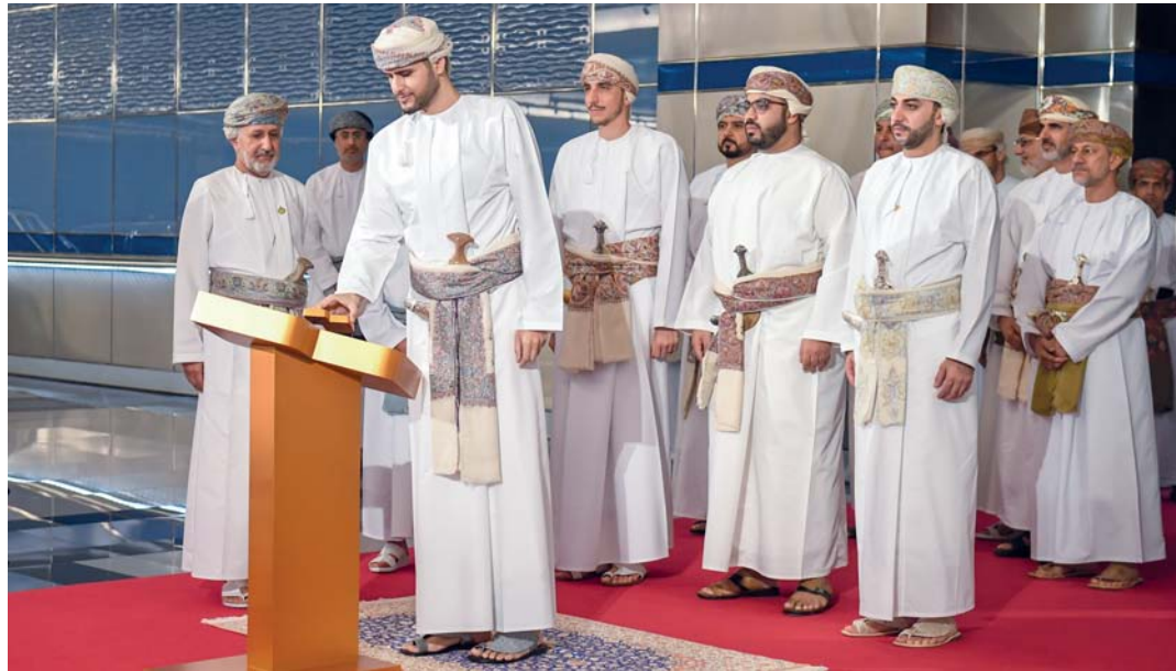
■ المتحف نافذة من نوافذ جذب المهتمين بعالم السيارات