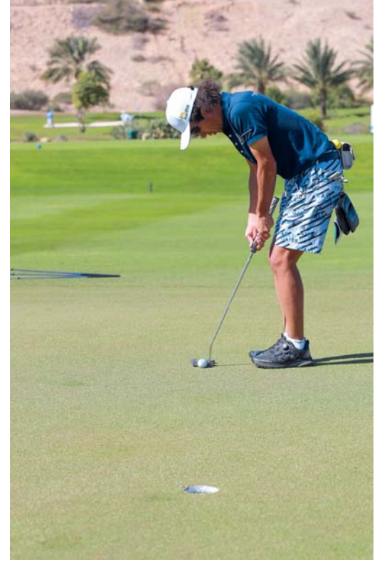
منافسة قوية شهدت المرحلة الأولى من الجولة الختامية

تنطلق اليوم المرحلة الثانية من الجولة الختامية لبطولة كأس عمان للجولف في نسختها الثانية، والتي تنظمها وزارة الخارجية بالتعاون مع عدد من الجهات الحكومية والخاصة، خلال الفترة من شهر أبريل الماضي حتى ديسمبر من العام الجاري، بإقامة المرحلة الثانية من الجولة الختامية، وذلك على ملعب لافي بمرتفعات المطار، وكانت منافسات المرحلة الأولى من الجولة التي أقيمت على ملعب