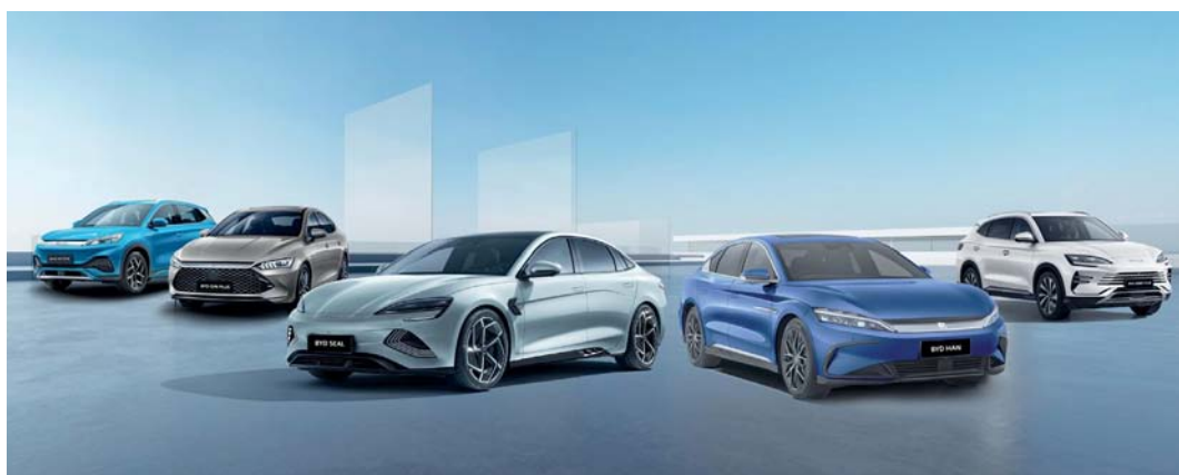
■ أحدث تشكيلة لسيارات بي واي دي الجديدة بالطاقة الكهربائية

بي واي دي الحالية في سلطنة عمان طراز بي واي دي أوتو ٣ الديناميكي، وطراز سيل ذو الأداء العالي، وطراز هان الفاخر، وطراز سونج بلس متعدد الاستخدامات، وطراز تشين بلس الأنيق، وقريباً، ستوسع التشكيلة مع طرح سيارة سي ليون، وهي سيارة رياضية متعددة الاستخدامات كهربائية طال انتظارها ومستعدة لجذب العملاء ومن خلال صالة العرض الرئيسية هذه، لا تتبع شركة بي واي دي، وشركة السيارات العالمية والأعمال المركبات فحسب، بل تقودان سلطنة عمان نحو مستقبل يتميز بالابتكار المستدام والتميز في مجال السيارات. تمثل كل مركبة من بي واي دي رحلة إلى التكنولوجيا المتطورة، وإعادة تصور التنقل من أجل مستقبل أفضل وأكثر تشويقاً. وفي سلطنة عمان، يتم توزيع سيارات بي واي دي بواسطة شركة السيارات العالمية والأعمال ش.م.م.