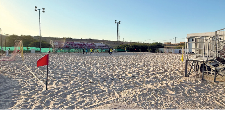
مبادرات التوظيف المؤقتة

مسقط. العُمانيَّة: يستضيف مجلس الشورى الأحد المقبل في جلسته الاعتيادية الثالثة من دور الانعقاد العادي الثاني للفترة العاشرة معالي الدكتور محاد بن سعيد باعوين وزير العمل، لمناقشة بشأن موضوع «مبادرات التوظيف المؤقتة». وقال سعادة الشيخ أحمد بن محمد الندابي أمين عام مجلس الشورى في تصريح له إن جلسة الاستضافة جاءت وفقاً للمادة (٦٨) من قانون مجلس عمان، والمادة (٥٦) من قانون مجلس الشورى التي نصت على أنه يجوز لمجلس الشورى ممارسة اختصاصه في المتابعة باستعمال جملة من الأدوات من بينها طلب المناقشة. تفاصيل ص ٢