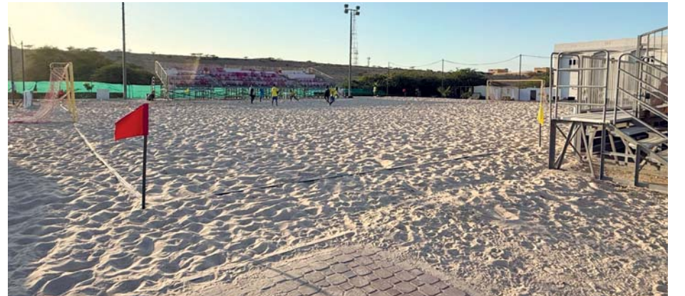
■ الملعب الرملي الرئيسي بمجمع السلطان قابوس الرياضي ببوش