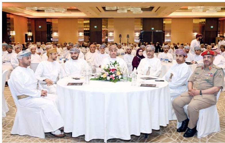
المؤتمر يسلط الضوء على أهم الجوانب التي يحتاجها القائد لإحداث تغيير سريع وإيجابي

المهتمين بتطوير مهاراتهم القيادية. ويتضمن المؤتمر العديد من الجلسات النقاشية وأوراق العمل؛ حيث جرى في اليوم الأول مناقشة العلاقة بين بناء الثقة والإلهام القيادي، وتأثير القيادة في صنع قادة آخرين، واستراتيجيات بناء ثقافات عمل متميزة، ودور القيادة في تشكيل ثقافة العمل التي يحتاجها القائد لإحداث تغيير سريع وإيجابي ذي أثر على المستقبل، مضيفاً أن المؤتمر يشترك به خبراء من داخل سلطنة عُمان وخارجها مما يمثل فرصة لتبادل الآراء والتجارب في استخدام الأدوات المتقدمة في أساليب