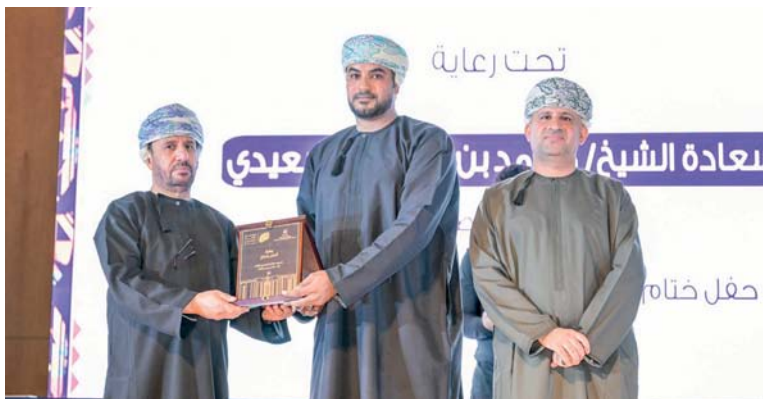
راعي المناسبة يكرم الفائزين

ممثل دور ثان للفنان إبراهيم الهاشمي عن دوره بمسرحية (١٢ رجلاً غاضباً) لفرقة مسرح ظفار وجائزة أفضل ممثلة دورها إخلاص الحارثية عن دورها بمسرحية (جثة ليست على الرصيف)، كما حصلت على أفضل أداء، أما أفضل ممثلة دور ثان من نصيب الفنانة أميرة البلوشية عن دورها في مسرحية (الرايا والخلخال) لفرقة السلطنة وحصدت أيضاً فرقة السلطنة للثقافة والفن على جائزة أفضل مؤثرات صوتية وموسيقية أما أفضل ديكور مسرحي فهدبت لمسرحية (يوم سعيد) لفرقة الرؤية أما أفضل أزياء فحصلت عليها مسرحية (السموم) لفرقة أوبار. بعد قام راعي الحفل سعادة الشيخ محمد بن سيف البوسعيدي والي ولاية صلالة بتكريم الفائزين أصحاب المراكز الأولى.