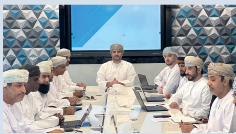
الوظائف المطروحة تشمل فرصا متنوعة بقطاع المياه

هذه الوظائف إحدى الثمار الرئيسية لهذه الجهود. يذكر أن ملتقى دور القطاعات الاقتصادية في توظيف فرص العمل والقيمة المحلية المضافة الذي نظم بالتعاون بين وزارة العمل والبرنامج الوطني للتشغيل وبمشاركة واسعة من الجهات الحكومية والخاصة ويسعى إلى تحقيق عدة أهداف من بينها تعزيز شراكات القطاعات المختلفة ودعم تعزيز القيمة المحلية المضافة وتوظيف الوظائف في السوق العماني وتوفير فرص عمل مستدامة للكوادر الوطنية العمانية إلى جانب تشجيع التكامل بين القطاعين الحكومي والخاص لتحقيق التنمية الاقتصادية المستدامة.