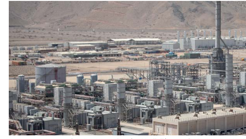
إجمالي إنتاج الكهرباء بنهاية سبتمبر ٢٠٢٤ بلغ ٣٧٥٨٤,٧ جيجاوات بالساعة

مسقط. «الوطن»: سجل إجمالي إنتاج سلطنة عُمان من الكهرباء حتى نهاية شهر سبتمبر الماضي، ارتفاعاً بنسبة ٨,١ بالمائة ليبلغ ٣٧٥٨٤,٧ جيجاوات بالساعة مقارنة بـ ٣٤٧٧٧,٤ جيجاوات بالساعة خلال نفس الفترة من ٢٠٢٣. وبينت الإحصائيات الصادرة عن المركز الوطني للإحصاء والمعلومات أن محافظات شمال وجنوب الباطنة والظاهرة سجلت إجمالي إنتاج ٢٣٥٨٦,١ جيجاوات بالساعة بارتفاع نسبه ٧,٨ مقارنة بنهاية شهر سبتمبر ٢٠٢٣. وانخفض إجمالي الإنتاج بمحافظة مسقط بنسبة ٨,١ بالمائة ليبلغ ٣٩٥,٥ جيجاوات بالساعة فيما ارتفع بمحافظة ظفار بنسبة ١٤,٧ بالمائة ليبلغ ٤٤٥٨ جيجاوات بالساعة. وارتفع إجمالي الإنتاج بمحافظة شمال وجنوب الشرقية بنسبة ٦,١ بالمائة ليبلغ ٨٢٤٧,٦ جيجاوات بالساعة فيما انخفض إجمالي الإنتاج بمحافظة الوسطى بنسبة ٢٦,١ بالمائة حيث بلغ ١٣٠,٩ جيجاوات بالساعة وبمحافظة مسندم ارتفع