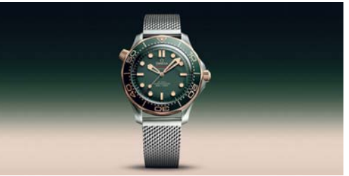
الإصدار الجديد من أوميغا

تواصل أوميغا توسيع مجموعة سيماستر دايفر 300M مع إطلاق إصدار جديد يتميز بجمعه بين التيتانيوم من الدرجة الثانية والذهب البرونزي ويمثل هذا التصميم