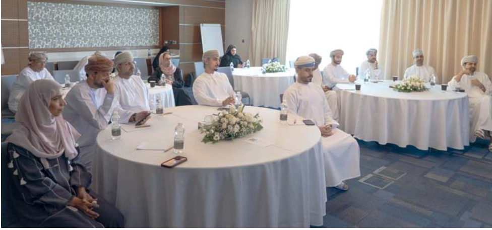
الجلسات ناقشت واقع الطريق نحو بناء منظومة ريادة الأعمال

أبرزها مقدمة حول أساسيات الاستثمار الجريء، وفهم منظومة الشركات الناشئة للشركات الناشئة ورأس المال الجريء، بالإضافة إلى مزايا استثمارات الشركات العائلية؛ والتركيز على نقاط القوة في مجال المشاريع، بما في ذلك آفاق الاستثمار الطويل الأجل وشبكات التواصل القوية لديهم، واستراتيجيات للشركات العائلية. كما ركزت حلقة العمل الثانية على «المكاتب العائلية - الاستثمار الاستراتيجي وحوكمة»، والتي ستعقد اليوم وتتمثل محاور الحلقة في إنشاء مكتب عائلي، والتخطيط الاستراتيجي للاستثمار، وحوكمة كأفضل ممارسة لإدارة المكتب العائلي جنباً إلى جنب مع الشركة العائلية وتحفيز الاستثمار عن طريق الاستثمار المغامر.