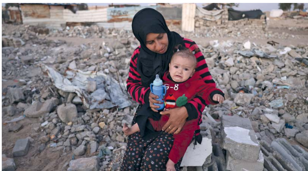
فلسطينية تطعم طفلها وسط أنقاض المباني المدمرة في مخيم مؤقت للنازحين الفلسطينيين في منطقة نهر البار في خان يونس.

وقال ناريشكين، في مقابلة مع صحيفة «ارزفيدتشيك» الروسية: «الوضع على الجبهة ليس في صالح كييف». وأضاف: «المبادرة الاستراتيجية في