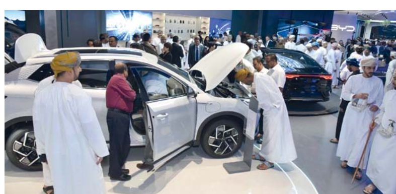
■ الحضور يطالعون على السيارات الجديدة

بي واي دي الحالية في سلطنة عمان طراز بي واي دي أوتو ٣ الديناميكي، وطراز سيل ذو الأداء العالي، وطراز هان الفاخر، وطراز سونج بلس متعدد الاستخدامات، وطراز تشين بلس الأنيق، وقريباً، ستوسع التشكيلة مع طرح سيارة سي ليون، وهي سيارة رياضية متعددة الاستخدامات كهربائية طال انتظارها ومستعدة لجذب العملاء ومن خلال صالة العرض الرئيسية هذه، لا تتبع شركة بي واي دي، وشركة السيارات العالمية والأعمال المركبات فحسب، بل تقودان سلطنة عمان نحو مستقبل يتميز بالابتكار المستدام والتميز في مجال السيارات. تمثل كل مركبة من بي واي دي رحلة إلى التكنولوجيا المتطورة، وإعادة تصور التنقل من أجل مستقبل أفضل وأكثر تشويقاً. وفي سلطنة عمان، يتم توزيع سيارات بي واي دي بواسطة شركة السيارات العالمية والأعمال ش.م.م.