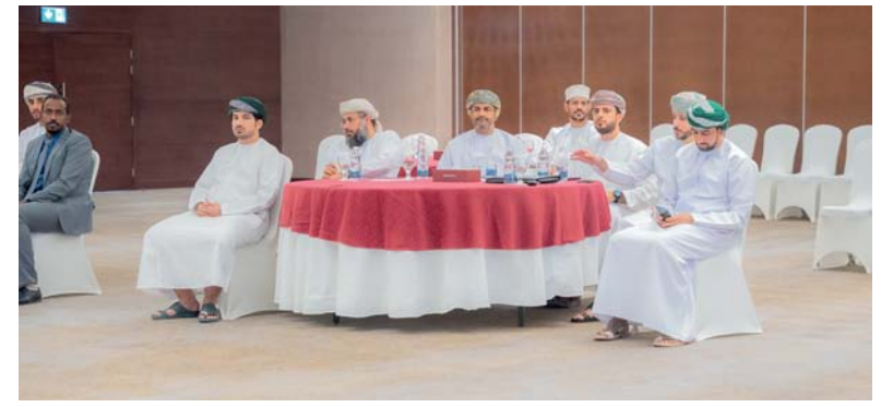
■ الحلقات تناقش التحديات التي تواجه المؤسسات الصغيرة والمتوسطة

رعى الاحتفالية سعادة المهندس نايف بن علي العبري، رئيس هيئة الطيران المدني، وبحضور رئيس مجلس منظمة الطيران المدني الدولي، وعدد من المسؤولين الحكوميين من الوزراء ورؤساء هيئات الطيران المدني، والمنظمات الدولية والإقليمية، وشركات الطيران، والمطارات، والشركات المتخصصة في الأمن. وتخلل الحفل تقديم عروض مرئية لختلف المناسبات الثلاث، حيث تم خلالها استعراض تاريخ منظمة الطيران المدني الدولي (الإيكاو) وإنجازاتها،