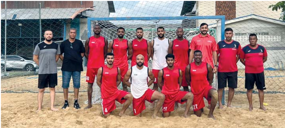
■ منتخبنا الوطني لكرة اليد الشاطئية

البلوشي بأن البطولة ستقام على الملاعب الرملية بمجمع السلطان قابوس الرياضي في بوش وسيسبق هذه البطولة دورة الألعاب الخليجية الشاطئية التي ستكون في ضيافة السلطنة أيضا وقبل البطولتين سيكون الجمهور على موعد مع البطولة الخليجية للأندية لكرة اليد لدول مجلس التعاون الخليجي في ضيافة نادي عمان فبراير ٢٠٢٥م وسيكون عام إستثنائي بكل تأكيد مع استضافة السلطنة لثلاث بطولات كبيرة وهذه دعوة لكل منتسبي لعبة كرة اليد بالسلطنة والجمهور الكريم والمتابعين لإستمتاع بكل تلك المنافسات التي ستكون بدايتها البطولة الخليجية للأندية وختامها في مايو بالبطولة الآسيوية لكرة اليد الشاطئية.