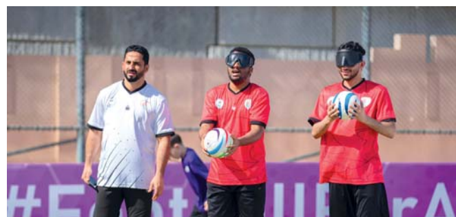
■ استعراض مهارات المشاركين