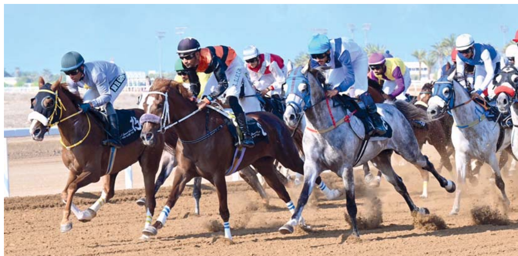
■ صورة أرشيفية من سباق الخيل بمزرعة الرحبة