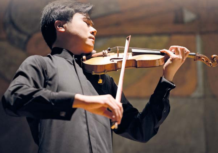
المبادرة تهدف إلى بناء روابط متينة بين الفنانين العالميين وسلطنة عُمان

ومن بين الفعاليات الرئيسية إقامة حفل موسيقي لسايمون زو، الحائز على جائزة مسابقة باغانيني لعام ٢٠٢٣، الذي سبق أن أحيى حفلاً موسيقياً استثنائياً بحضور الملك تشارلز الثالث في لندن، عزف خلاله على آلة كانون الأسطورية، وهي آلة كمان نيكولو باغانيني التي صنعها جوزيبي غوارنيري ديل. جيسو في عام ١٧٤٣، جنباً إلى جنب مع أوركسترا لندن السيمفونية بقيادة السير أنطونيو بانابو. وسيقام حفل في مسقط في ٢٤ فبراير ٢٠٢٥ برقعة عازف البيانو جيل باي. سيكون الحفل مفتوحاً للجمهور، وسيضم