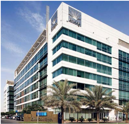
المبنى يضم مكاتب ومحلات تجارية مختلفة

أسواق سلطنة عمان ومنطقة مجلس التعاون الخليجي. واستحوذ صندوق «ازدهار» العقاري على المبنى من مجمع «إعمار» للأعمال في عام ٢٠١٩، وهو عبارة عن مبنى مكون من ٦ أدوار يتميز بواجهة مميزة من الجرانيت والزجاج ويضم مكاتب ومحلات تجارية على مساحة ١٥٣ ألف قدم مربع تقريبا.