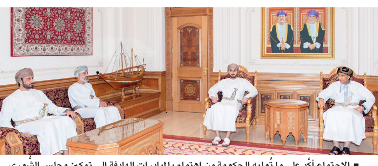
الاجتماع أكد على ما توليه الحكومة من اهتمام بالمبادرات الهادفة إلى تمكين مجلس الشورى

مسقط. العُمانيَّة: عقد مجلس الوزراء ومجلس الشورى اجتماعاً مشتركاً، في القاعة المخصصة للاجتماعات بمبنى مجلس الوزراء بمسقط، أمس، حيث استقبل صاحب السمو السيد فهد بن محمود آل سعيد نائب رئيس الوزراء لشؤون مجلس الوزراء وعدد من أصحاب السمو والمعالين أعضاء مجلس الوزراء، سعادة خالد بن هلال المعولي رئيس مجلس الشورى وأصحاب السعادة أعضاء مكتب المجلس. وفي إطار التعامل الإيجابي مع مقترحات أعضاء مجلس الشورى، فقد وافق مجلس الوزراء على قيام جهات الاختصاص الحكومية بتقديم العروض المرئية أمام مجلس الشورى حول جهود الارتقاء وتطوير الأداء في كافة القطاعات الاقتصادية. واستعرض الاجتماع العديد من الموضوعات من بينها: مجالات التعاون مع الحكومة، والاضطلاع بالتوعية الهادفة إلى إعطاء الصورة الحقيقية للعمل الوطني، والتطرق إلى أهمية دور اللجنة الوزارية التنسيقية المشتركة بين مجلس الوزراء ومجلس الشورى بما يحقق المضي قدماً لتقديم أفضل الخدمات للمواطنين. تفاصيل ص ٢