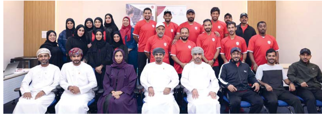
صورة جماعية للمشاركين في البرنامج

أندية أهلي سداب، والسيب، والنصر، وصلالة، والعمارات، وتناهل هذه الأندية مباشرة إلى الأدوار النهائية من المسابقة، بينما ضمت «مجموعة التحدي» أندية ظفار، والسلام، والاتحاد، ومرباط، وقريات، والرساتاق، والنهضة، وصحار، والشباب، ومصيرة، وصحم، وجرى تقسيم مجموعة أندية «التحدي» إلى ثلاث مجموعات، بحيث ضمت المجموعة الأولى أندية الرساتاق، وقريات، والشباب، ومصيرة، وتبارت الأندية في المجموعة الأولى فيما بينها بنظام الدوري من دور واحد. بينما ضمت المجموعة الثانية أندية صحار، وصحم، والسلام، والنهضة، وتبارت الأندية في المجموعة الثانية فيما بينها بنظام الدوري من دور واحد، وعقب نهاية الأدوار التمهيدي،