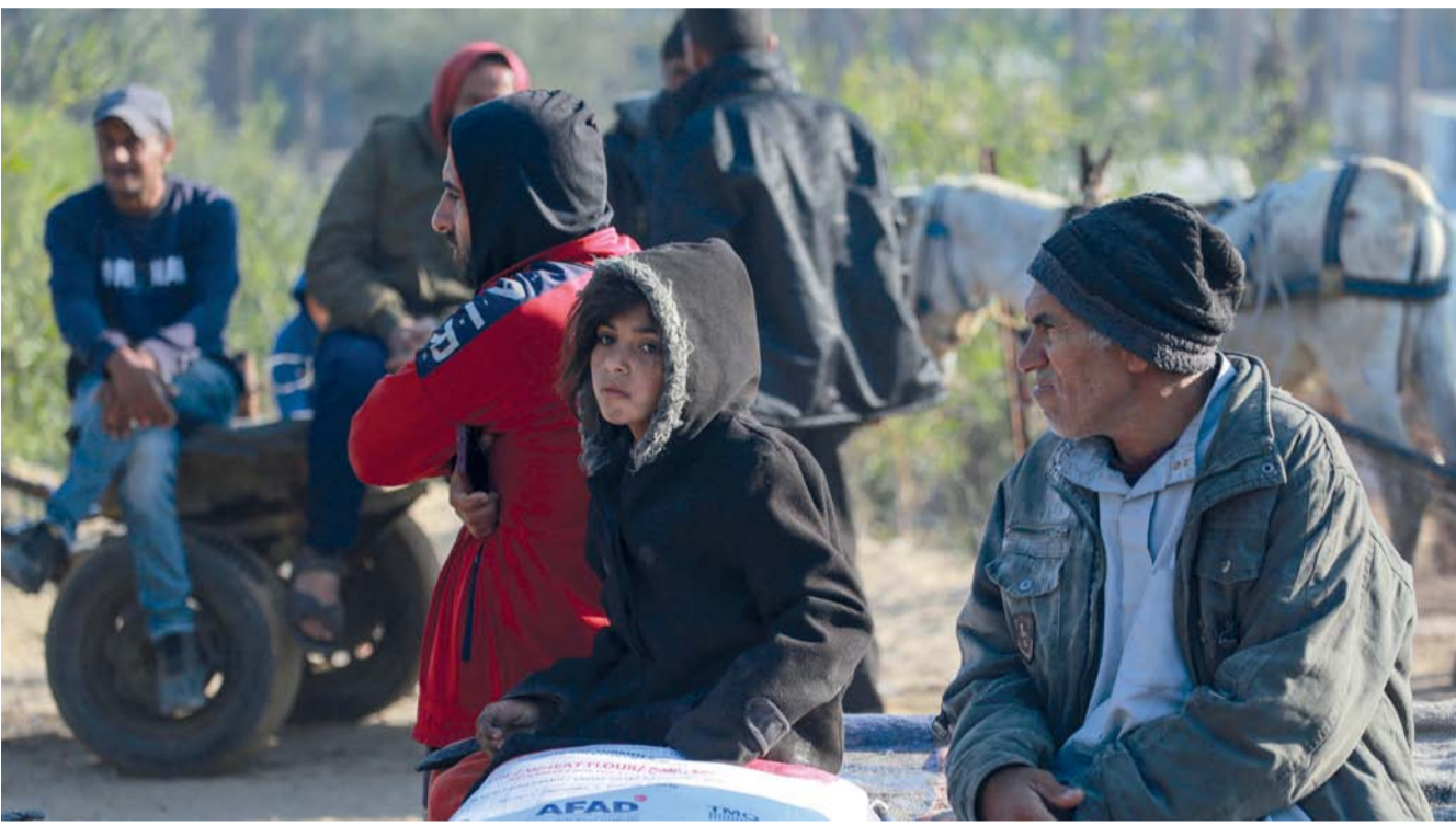
فلسطينيون يتسلمون أكياس الطحين التي وزعتها وكالة (الأونروا) في مدينة خان يونس جنوب قطاع غزة.