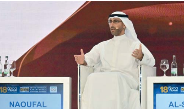
أوراق العمل ناقشت الخطوات الهادفة إلى تسريع اعتماد الطاقة النظيفة

في التحوّل الرقمي وسط التحديات العالمية. كما ركز على النسخة الثالثة من منتدى الشباب التابع للاتحاد الخليجي للبتروكيماويات والكيماويات، باعتباره مساحة لإعداد قادة المستقبل الذين سيقودون مسيرة القطاع نحو آفاق جديدة.