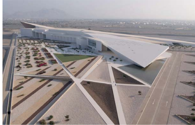
الجائزة تضاف إلى العديد من الإنجازات الأخرى التي حققها المتحف

خلال استخدام النحاس في الواجهات يعبر عن تاريخ عُمان العريق في استخراج هذا المعدن واستخدامه في الصناعات المختلفة. كما يتناغم الشكل المُعين الذي يميز المبنى مع العناصر الجغرافية المحيطة، ما يوجد توازناً بين التصميم الحديث والطابع التقليدي، ليقي هذه الصرح الثقافي شاهد على عراقة الثقافة العُمانيّة وابتكارها المستمر.