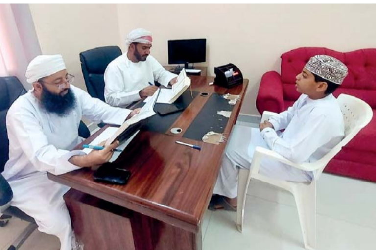
■ تقييم أحد الطلبة المشاركين

ومدرستي حبيب بن زيد للبنين وسيح السندة للبنات للمتسابقين من مدارس ولاية جعلان بني بوعلی، ومدرسة مصيرة للمتسابقين من مدارس ولاية مصيرة وقد تم تقييم الطلبة وفق ضوابط التقييم المعتمدة.