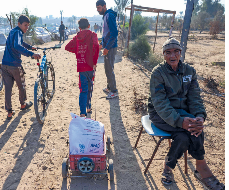
صبي فلسطيني يسحب كيس طحين على صندوق بعجلات بعد استلامه من مركز توزيع في مدينة خان يونس جنوب قطاع غزة.

القدس المحتلة. «الوطن». وكالات: ارتفعت حصيلة الشهداء في قطاع غزة جراء العدوان الإسرائيلي على القطاع إلى (٤٤٥٠٢)، أغلبيتهم من الأطفال والنساء، منذ بدء عدوان الاحتلال الإسرائيلي في السابع من أكتوبر ٢٠٢٣. وذكرت وكالة الأنباء الفلسطينية أن حصيلة الإصابات ارتفعت إلى (١٠٥٤٥٤) مصاباً، منذ بدء