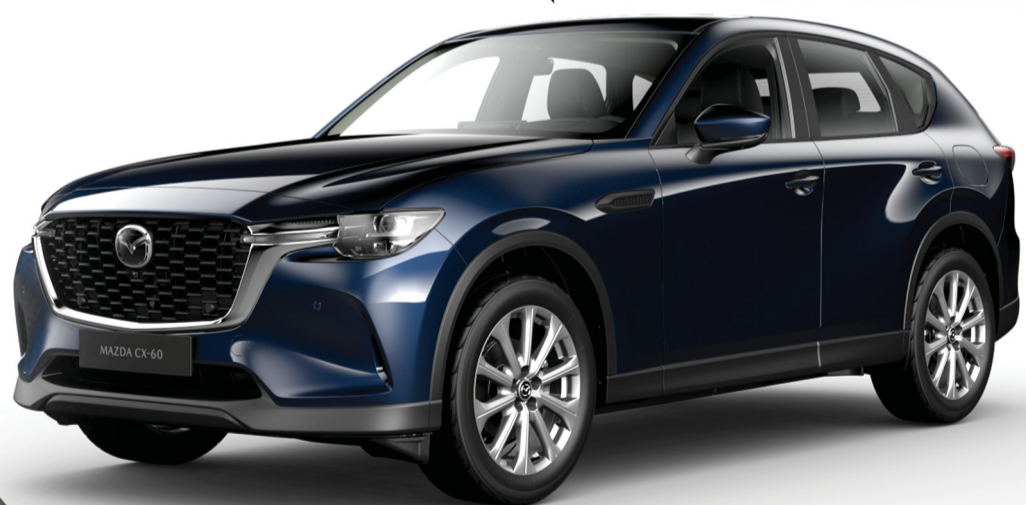
مازدا CX-60 سعة 2.5 لتر