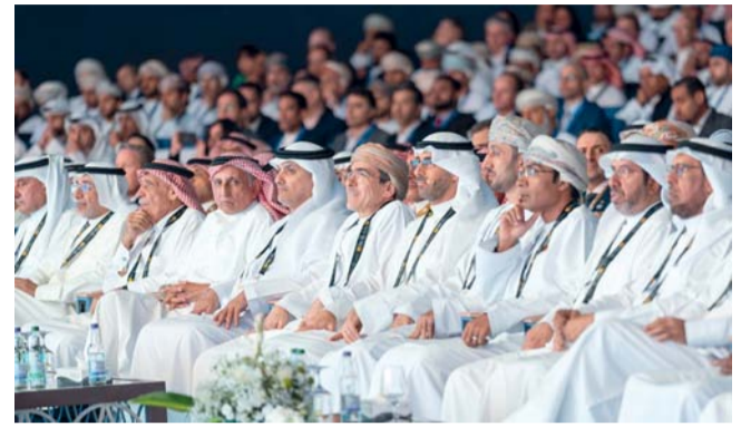
مناقشات المنتدى ركزت على تأثيرات الإختراقات في الذكاء الاصطناعي

بدوره تحدث الشيخ نواف بن سعود الصباح، نائب رئيس مجلس الإدارة والرئيس التنفيذي لمؤسسة البترول الكويتية حيث ركز على الدور الحيوي المستمر للهيدروكربونات في تلبية الطلب العالمي على الطاقة، إلى جانب أهداف الإنتاج الطموحة للشركة، وتركيزها على البتروكيماويات للتنوع الاقتصادي. مشيراً إلى أنه على الرغم من أن مصادر الطاقة المتجددة ستقوم بدور أكبر، فإن الهيدروكربونات ستظل عنصرًا لا غنى عنه بحلول عامي ٢٠٤٠ و٢٠٥٠، حتى مع الاستخدام الكامل لمصادر الطاقة المتجددة، والطاقة النووية، والفحم، ويتوقع أن تمثل الهيدروكربونات ربع الطلب العالمي على الطاقة. وتطرق نواف الصباح إلى الرؤى التي تشكل الشراكات الإقليمية والدولية ودورها في مستقبل الصناعة، والنمو الذي شهدته صناعة البتروكيماويات في دول مجلس التعاون لدول الخليج العربية والتطورات خلال السنوات الماضية. وشهد المنتدى جلسة شارك فيها الرؤساء التنفيذيون إلى تطور ونمو صناعة الكيماويات خلال السنوات العشر المقبلة في ظل التطور والتقدم التكنولوجي، والضرورات المتعلقة بالاستدامة، وديناميكيات التجارة والأسواق، والتغيّرات التنظيمية، والتحوّلات في الأسواق العالمية الناشئة التي تفتح آفاقاً جديدة للنمو. كما تركّزت مناقشات المنتدى على تأثيرات الإختراقات في الذكاء الاصطناعي وغيرها من التقنيات