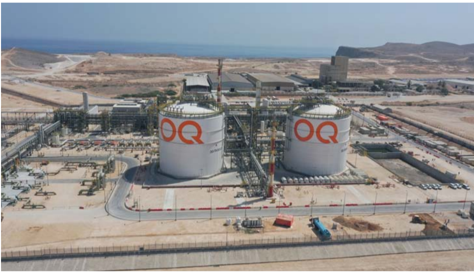
عملية إدراج أوكيو للصناعات الأساسية في بورصة مسقط ١٢ ديسمبر الجاري

وفيما يتعلق بمنهجية تخصيص فئة المؤسسات أوضحت الهيئة بأنها خصصت وفق الأليات والمعايير التي اعتمدها الشركة المصدرة للورقة المالية، وذلك وفق ما نص عليه في نشرة الإصدار، حيث جاءت نسب التخصيص على النحو الآتي: الفئة الأولى المؤسسات المحلية ١٩,٩٥٪ من الأسهم المكتتبة والفئة الثانية (الأفراد) كبار المستثمرين: بمقدار ٧٢,٨١٧٪ من الأسهم المكتتبة، والفئة الثانية (الأفراد) صغار المستثمرين توزيع الحد الأدنى بـ (٣٠ ألف) سهم، وتوزيع ما نسبته ٢٩,٢٦٩٪ لكل مكتتب من الأسهم المكتتبة.