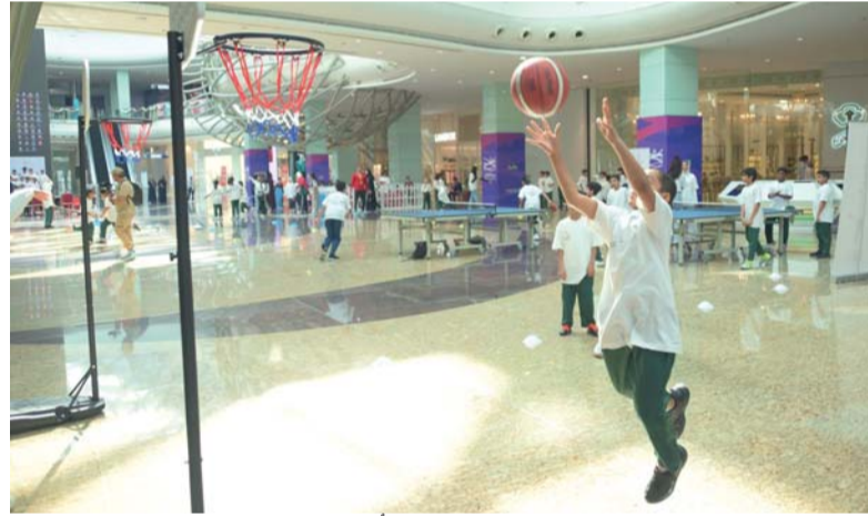
■ فعاليات متنوعة شارك فيها الطلاب باليوم الأولمبي