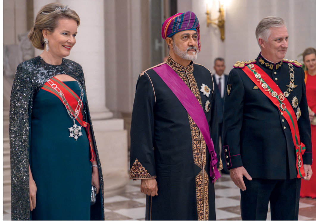
جلالة السلطان وملك البلجيكيين وقرينته أثناء مأدبة العشاء الرسمية

فحسب، بل هي راسخة، وقد تعززت هذه العلاقات وتستمر في الازدهار من خلال الزيارات رفيعة المستوى، أبرزها زيارة جلالتكم إلى عمان في شهر فبراير ٢٠٢٢. من جانبه رحب جلالة ملك البلجيكيين بالزيارة السامية لجلالة السلطان المعظم، مؤكداً على أن البلدين تربطهما علاقات تاريخية واقتصادية ودبلوماسية قوية، ويتطلعان إلى تطويرها ومواصلة البناء في مجالات أخرى ذات الاهتمام المشترك، بما في ذلك الابتكار والدفاع وصناعة الفضاء والصحة والتبادل الأكاديمي والثقافي. تفاصيل ..... ص ٣ و٢