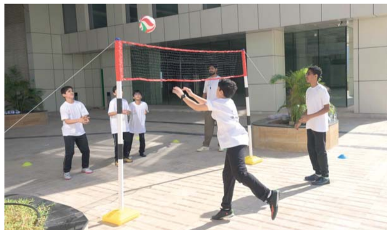
■ من فعاليات كرة الطائرة

تعليم، اكتشاف، في دعوة الأنشطة الرياضية واكتشاف صريحة للجميع للمشاركة في إمكاناتهم البدنية.