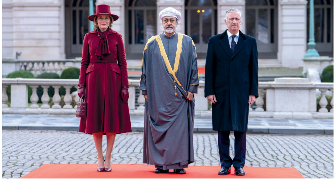
■ جلالة السلطان وملك ومملكة البلجيكيين أثناء عزف السلام السلطاني العُماني والسلام الملكي البلجيكي