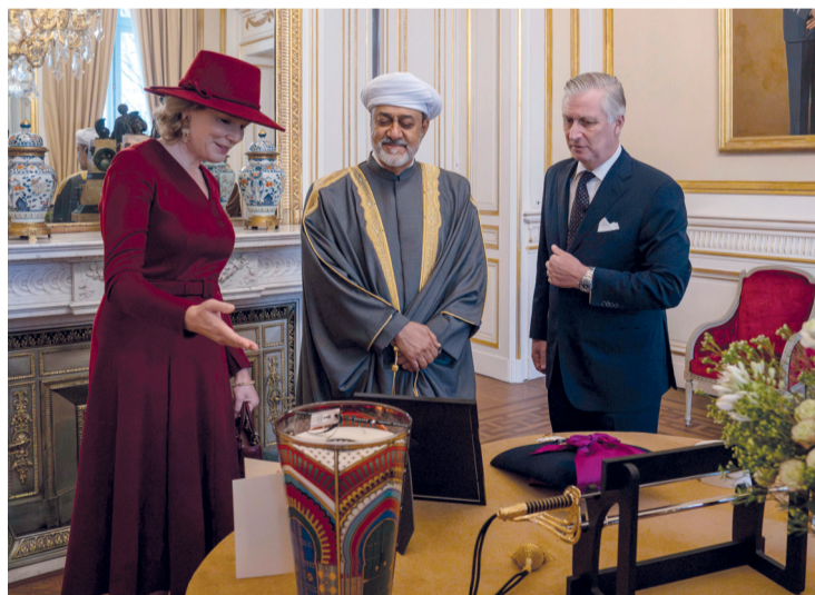
■ جلالة السلطان وملك البلجيكيين أثناء تبادل الأوسمة والهدايا التذكارية