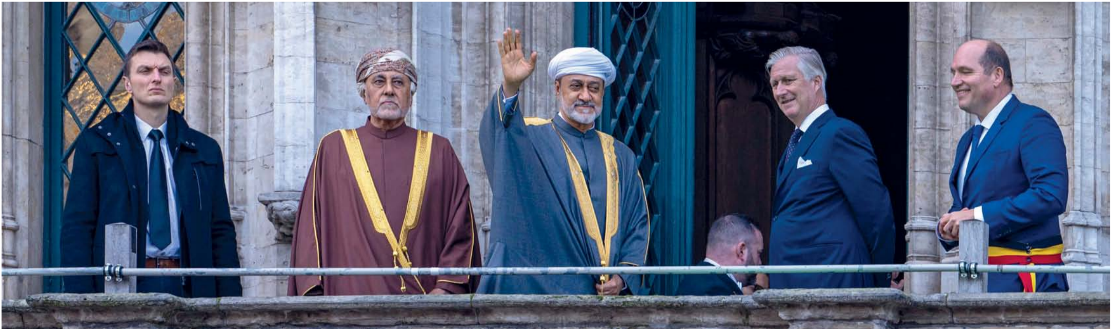
■ جلالة السلطان يُلقى التحيّة على المُرحّبين بجلالته من الشرفّة المطلّة على السّاحة الخارجيّة لقاعة مدينة بروكسل