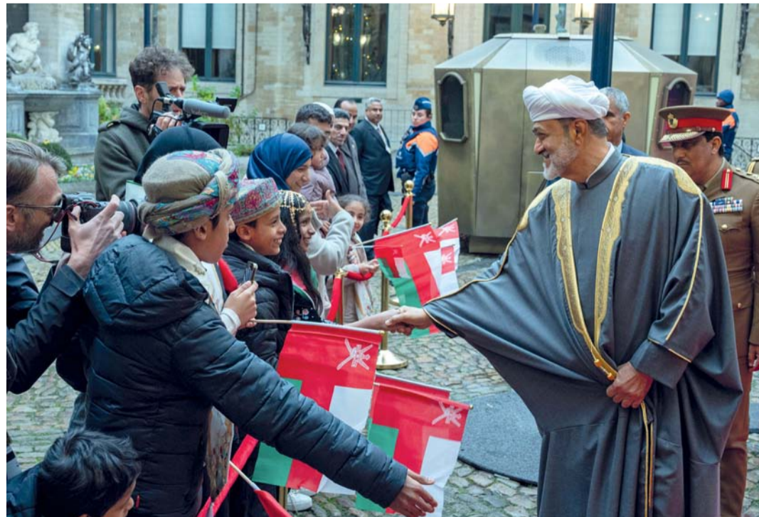
■ عددٌ من أبناء أعضاء سفارة سلطنة عُمان في بروكسل والبعثات الخليجيّة والعربيّة ومختلف الجنسيّات يشاركون في الترحيب بجلالة السلطان

لله بروكسل - العُمانية: قام حضرة صاحب الجلالة السلطان هيثم بن طارق المعظم - حفظه الله ورعاه - والوفد الرسمي المرافق مساء أمس بزيارة إلى قاعة مدينة بروكسل بمملكة بلجيكا، يرافقه جلالة الملك فيليب ليوبولد لويس ماري ملك البلجيكيين.