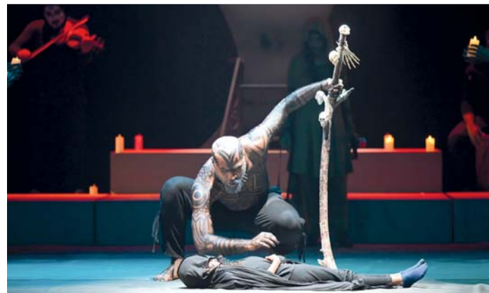
«السموم» تسير أغوار التضحية والألم والصراع بين القيم الإنسانية