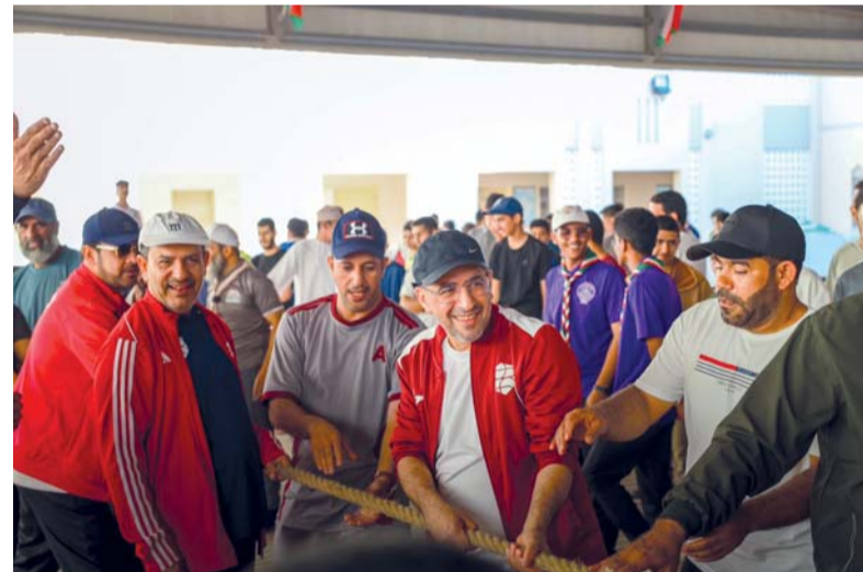
■ عدد من المسؤولين بوزارة التربية والتعليم يشاركون الطلاب فعاليات اليوم الرياضي

نظمت وزارة التربية والتعليم ممثلة في الإتحاد العماني للرياضة المدرسية صباح امس «اليوم الرياضي الموحد لمدارس سلطنة عمان» (شوية رياضة) في جميع المدارس الحكومية والخاصة والتي وصلت إلى أكثر من ٢٤٠٠ مدرسة حكومية وخاصة، واستهدفت أكثر من ٩٠٠ ألف طالباً وطالبة. وشهد اليوم الرياضي مشاركة عدد من المسؤولين بوزارة التربية والتعليم، حيث شارك سعادة الدكتور عبدالله بن خميس أبو سعدي وكيل وزارة التربية والتعليم للتعليم بتواجده في مدرسة حي التراث بولاية نزوى بمحافظة الداخلية، بحضور علي بن عبدالله الحارثي مدير عام المديرية العامة للتربية والتعليم بمحافظة الداخلية، وحضور فهد بن خلفان المشايخي أمين سر الإتحاد العماني للرياضة المدرسية.