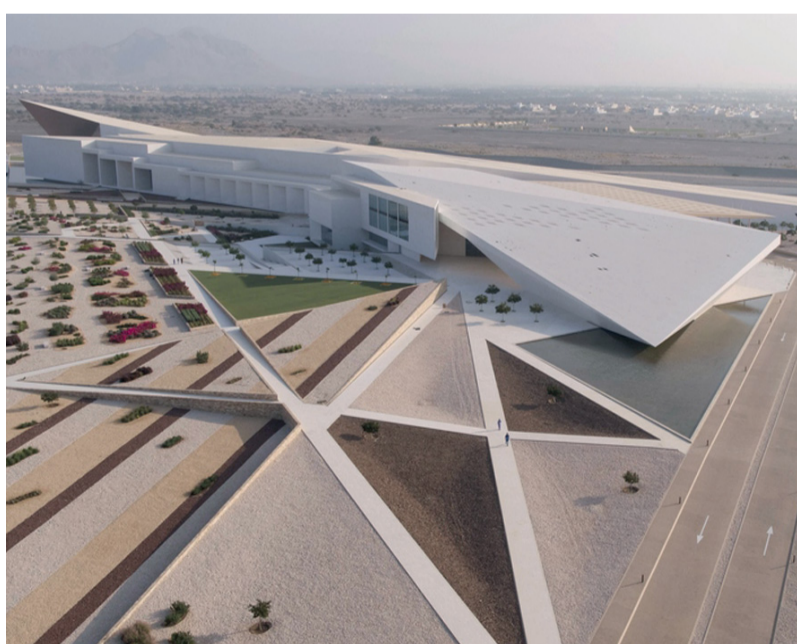
الجائزة تصاف إلى العديد من الإنجازات الأخرى التي حققها المتحف

سيول. ا.ب.ف. أعلن الرئيس الكوري الجنوبي يون سوك يول رفع الأحكام العرفية وسحب القوات العسكرية من الشوارع، وذلك بعد ساعات من إعلانه المفاجئ برفضها. وقال يون في خطاب متلفز «قبل قليل، كان هناك طلب من الجمعية الوطنية برفع حالة الطوارئ، قمنا بسحب الجيش الذي نشر لتطبيق عمليات الأحكام العرفية. سنقبل طلب الجمعية الوطنية ونرفع الأحكام العرفية».