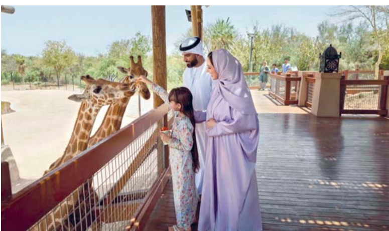
مدينة العين توفر تجارب عديدة للزوار

العين بدولة الإمارات العربية المتحدة واحة تنبض بالحياة، فهي منارة للثقافة والتراث الإماراتي العريق، ووجهة مفضلة للتجديد والاستجمام بعيداً عن ضغوط الحياة اليومية. وتزخر العين، بإمارة أبوظبي، بتجارب ومغامرات استثنائية، تتنوع من استكشاف الحصون القديمة والواحات الوارفة والأفلاج إلى التعرف إلى عادات وحيياة أهلها، والاستمتاع بالأنشطة المتنوعة في أحضان الطبيعة. العين هي أول منطقة مدرجة ضمن قائمة اليونسكو لمواقع التراث العالمي في دولة الإمارات العربية المتحدة، وتضم واحدة من أقدم المناطق المأهولة بالسكان باستمرار، والمواقع التاريخية والثقافية الأصيلة. ويعود تاريخ منطقة العين إلى ما يزيد على خمسة آلاف عام، وتتميز بجماها الأخصان ومواقعها الأثرية وحصونها المرممة وقصورها التاريخية الغنية بالقبصص.