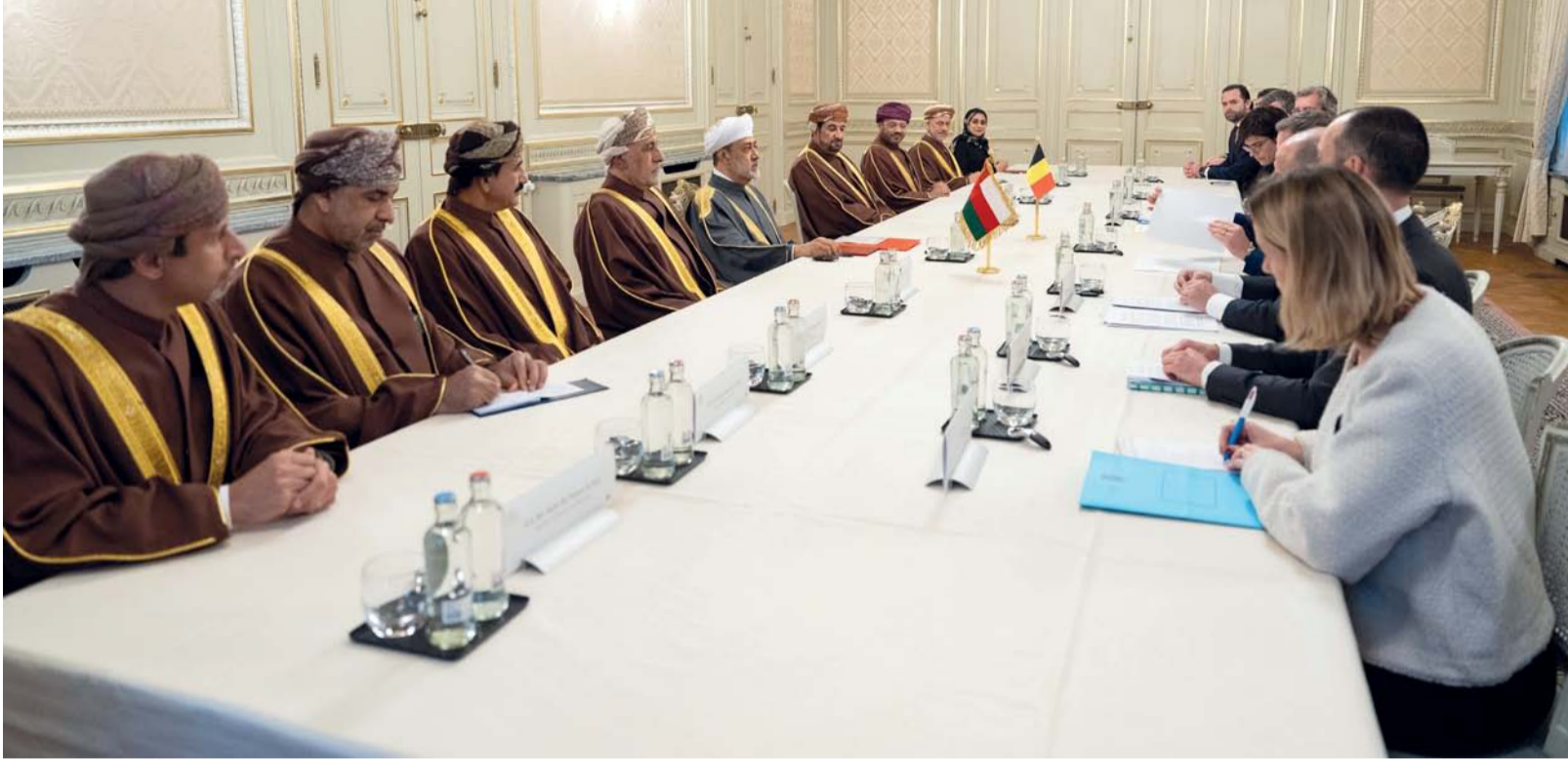
■ جلالة السلطان ورئيس الوزراء البلجيكي أثناء جلسة المباحثات الرسمية في مقر رئاسة مجلس الوزراء البلجيكي

لله بروكسل - العُمانية: عقد حضرة صاحب الجلالة السلطان هيثم بن طارق المعظم - حفظه الله ورعاه - ودولة ألكسندر دي كرو رئيس الوزراء البلجيكي ظهر أمس جلسة مباحثات رسمية في مقر رئاسة مجلس الوزراء البلجيكي (لاميرمونت).