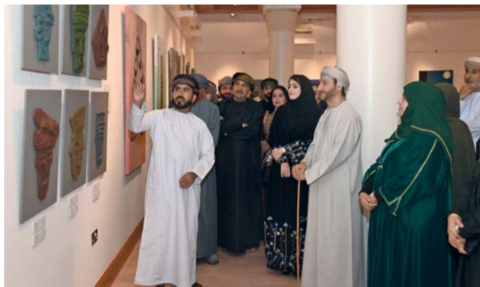
الحضور يستمع لتفاصيل الأعمال الفنية المعروضة

حدث يُعد فرصة لمشاركة الأحداث للفنانين التشكيليين لتعلم أساليب وتقنيات مختلفة لإخراج عمل فني ذي جودة، ونشر الوعي حول قانون (مساعدة الأحداث) لجميع فئات المجتمع، وفتح الأفق للتعريف باختصاصات دائرة شؤون الأحداث وتفعيل الشراكة المجتمعية، إلى جانب تحفيز شرائح المجتمع للمساهمة في عملية التنمية المستدامة.