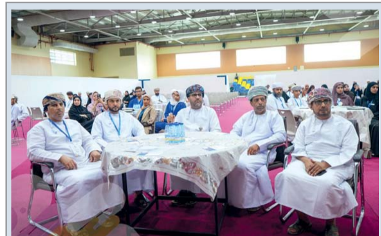
الملتقى يهدف لإيجاد بيئة حوارية بين أعضاء أندية وجماعات المناظرات