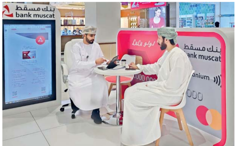
■ ميزات متنوعة توفرها بطاقات بنك مسقط الائتمانية

كونسيرج عالمية تقدم المساعدة الشخصية على مدار الساعة وطوال أيام الأسبوع، إضافة إلى الحصول على استرداد نقدي بنسبة ١٪ على المعاملات المحلية والدولية بالإضافة إلى تأمين سفر مجاني متعدد الرحلات. أما بطاقة لولو وبنك مسقط الائتمانية فتوفر للزبائن العديد من الامتيازات والمنافع الحصرية والمكافآت القيمة تتضمن نقاط مكافأة بنسبة ٢٪ عند استخدام البطاقة في محلات لولو هايبرماركت في السلطنة، وخصم ٠,٥٪ عند استخدام البطاقة في المحلات المحلية والدولية الأخرى وتأمين سفر مجاني عند شراء ٥٠٪ من سعر التذكرة باستخدام البطاقة ودخول مجاني غير محدود لأكثر من ١٠ صالات مطارات مختلفة. وتتيح بطاقة الجوهر البلاستيكية الائتمانية للزبائن الاستفادة بمجموعة واسعة من تسهيلات التأمين المجانية، إضافة إلى استرداد نقدي بنسبة ١٪ على المعاملات المحلية والدولية، كما توفر الفأخرة حول العالم بالإضافة إلى الصالات في مطار مسقط وصلالة.