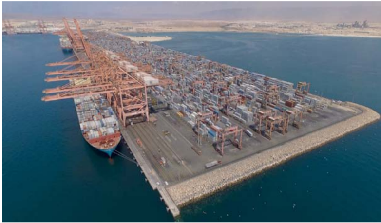
■ اللائحة ستمثل نقلة نوعية في تطوير أمن القطاع البحري العماني