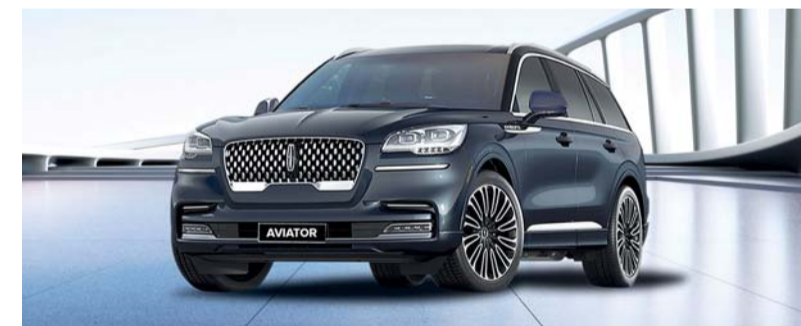
■ لينكون أفياتور قوة في الطرق الوعرة

نظام مساعد الكبح عند الرجوع بالسيارة للخلف راحة البال من خلال إيقاف السيارة إذا اكتشفت