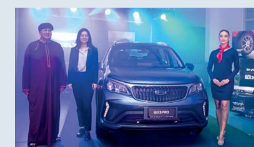
■ لحظة تدشين سيارة كروس أوفر الجديدة

تحتوي على مجموعة من عجلات معدنية مقاس ١٦ بوصة ولهجات سوداء مما يجعلها مناسبة. كما تتميز بمقصورة واسعة مع شاشة مركزية عاتمة مقاس ٨ بوصات وعجلة قيادة متعددة الوظائف وسريعة الاستجابة تعزز من ميزة الوضع الرياضي للحصول على تجربة قيادة أكثر ديناميكية. كما تأتي السيارة على