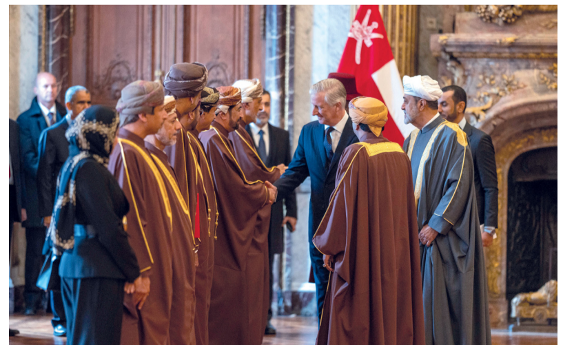
■ ملك البلجيكيين يصافح الوفاء الرسمي المرافق لجلالة السلطان