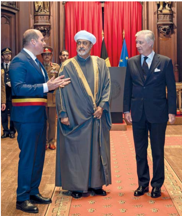
■ جلالة أثناء جُولته في المبنى التاريخي الذي يُعد تحفة معماريّة ضاربة في القَدَم