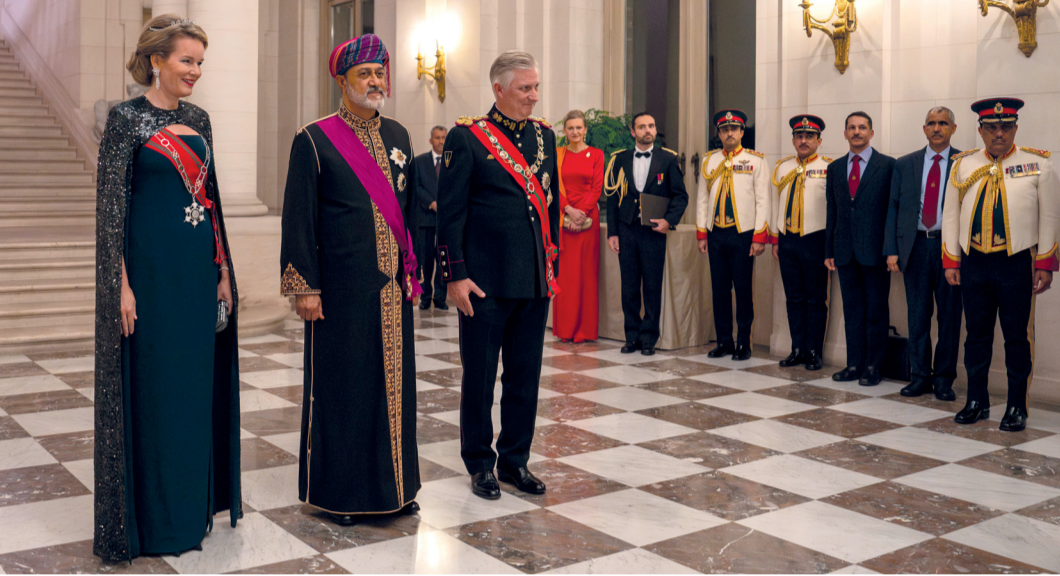
.. وأثناء مأدبة العشاء الرسمية على شرف جلالته السلطان بلقعة لاجن الملكية

جلالته يؤكد: المناقشات تعكس روح التعاون والتفاهم المتبادل مما يمهّد الطريق لتحقيق تقدم ملموس ويلبي التطلعات المشتركة