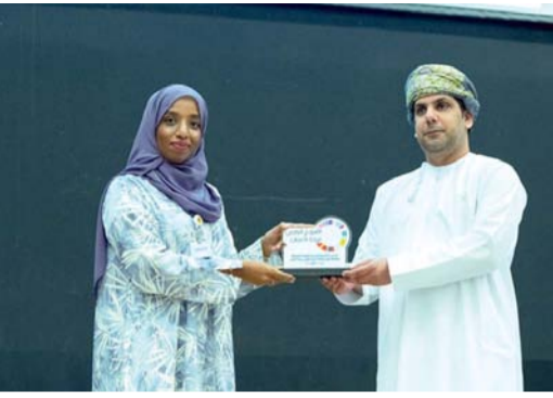
المسابقة تساهم في تحفيز روح ريادة الأعمال لدى الطلاب