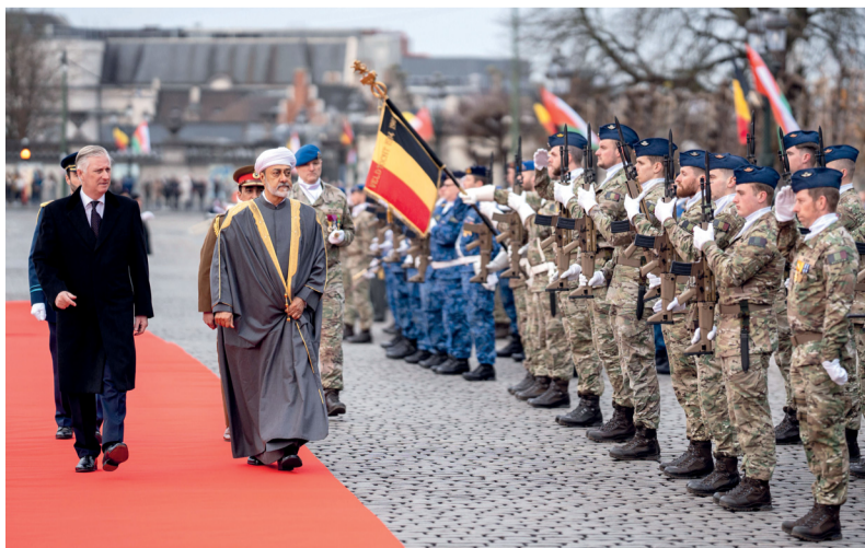
■ جلالة السلطان يتفقّد حرس الشرف بمعبة ملك البلجيكيين

ونأمل أن نحظى قريباً بشرف الترحيب بجلالة الملك وجمالة الملكة مرة