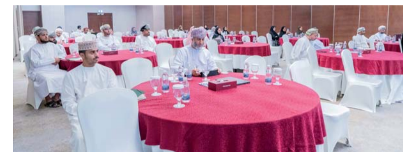
■ الحملة سلطت الضوء على أهمية رفع مستوى الوعي المجتمعي بالطاقة النظيفة

الاستراتيجية المتعلقة بالاستدامة والطاقة، وخلال الحملة، قدمت جهات متعددة أوراق عمل متخصصة، منها وزارة النقل والاتصالات وتقنية المعلومات، ووزارة الإسكان والتخطيط العمراني، وشركة نماء للتزويد، وشركة تنمية نفط عمان، وشركة نفاذ للطاقة المتجددة، ونادي المركبات الكهربائية، ومؤسسة الكون الأخضر. وتضمنت هذه الأوراق مناقشات مستفيضة حول تعزيز برامج كفاءة الطاقة وترشيد الاستهلاك، بالإضافة إلى استعراض مواضيع محورية لضمان استدامة مشاريع الطاقة والتنمية البيئية في سلطنة عمان.