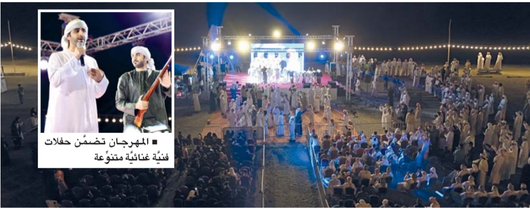
المهرجان تضمّن حفلات فنية غنائية متنوعة