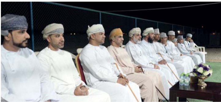
■ راعي المناسبة والحضور

تختتم وزارة الثقافة والرياضة والشباب ممثلة بالمديرية العامة للأنشطة الرياضية مساء اليوم الأربعاء فعاليات المهرجان السنوي الخامس للأشخاص ذوي الإعاقة ٢٠٢٤ تحت شعار (عزيمة وتحدي) بالتعاون مع وزارة التربية والتعليم ووزارة التنمية الاجتماعية ووزارة الصحة، استهدف المهرجان ٢٦٠٠ مشارك ومشاركة تقريبا من مختلف الفئات من ذوي الإعاقة وأسره والعاملين والمشرفين من جميع محافظات سلطنة عمان وبمشاركة وفد من المملكة العربية السعودية، وسترعى حفل الختام مساء اليوم صاحبة السمو السيدة حبيبة بنت جيفر آل سعيد، وذلك في القرية المصاحبة لفعاليات المهرجان بمجمع السلطان قابوس الرياضي بوشهر. اشتمل المهرجان على ١١ برنامجاً رياضياً تمثل في ألعاب القوى، سباق ذوي الإرادة، البوتشي، الريشة الطائرة، الغوص، كرة السلة على الكرسي المتحرك، كرة الهدف للمكفوفين، البوتشيا