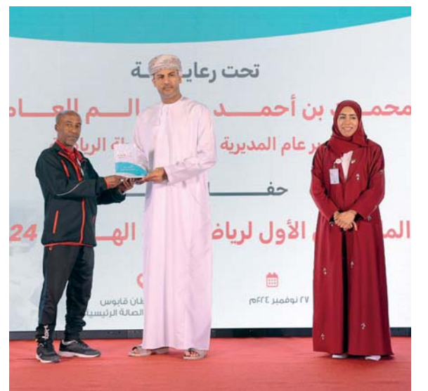
محمد العامري يكرم المشاركين في الملتقى

اختتم يوم أمس الملتقى الأول لرياضة الهواه فعالياته، الذي نظمته وزارة الثقافة والرياضة والشباب ممثلة بدائرة النشاط الرياضي بالمديرية العامة لأنشطة الرياضة خلال الفترة من ٢٥-٢٧ نوفمبر في مجمع السلطان قابوس الرياضي ببوشر، وقد رعى حفل الختام محمد بن أحمد العامري مدير عام المديرية العامة لأنشطة الرياضة والذي أقيم بالصالة الرئيسية للمجمع، حيث تم عرض مرئي ملخص للملتقى، وتم تكريم المنظمين والجهات المشاركة. وشمل هذا الملتقى في نسخته الأولى ٩ ألعاب رياضية وهي رياضة القوس والسهم (الأولمبي والتقليدي) ورياضة التيك بول ورياضة السباكتراو ورياضة المصارعة الاستعراضية ورياضة الصقور ورياضة الملاكمة الأولمبية ورياضة البنتابول ورياضة البيكل بول وسباقات السلوقي العربي الأصيل، حيث استهدف الأشخاص الممارسين لهذه الرياضات وعموم الرياضيين وطلبة المدارس بالإضافة إلى موظفي الوزارة.