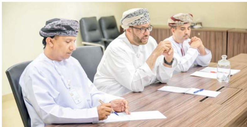
المهرجان يشهد مشاركة ٧ فرق مسرحية أهلية من محافظة ظفار

ينطلق في الثاني من ديسمبر المقبل مهرجان ظفار المسرحي في نسخته الثالثة، الذي تنظمه المديرية العامة للثقافة والرياضة والشباب بمحافظة ظفار، ويستمر حتى التاسع من ديسمبر بمشاركة ٧ فرق مسرحية أهلية من محافظة ظفار. وفي هذا إطار عقد امس الأول بمقر المديرية العامة للثقافة والرياضة والشباب