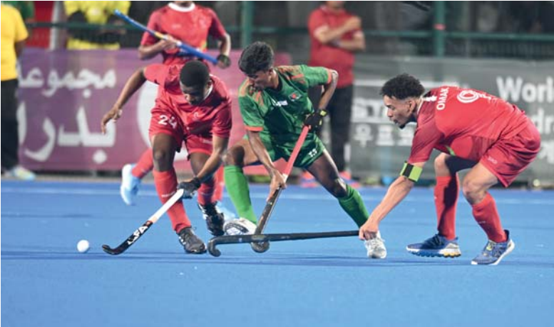
من مباراة منتخبنا و بنجلاديش

منتخبنا يخسر لقاء الافتتاح أمام بنجلاديش