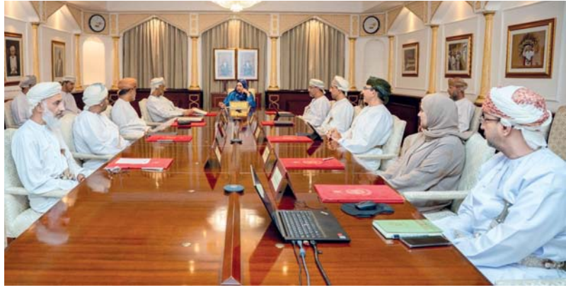
■ مجلس جامعة السلطان قابوس أثناء اجتماعه أمس

الكرام ممن انتهت عضويتهم في دورته السابقة على ما قدموه من جهود مخلصه، والتي كان لها الأثر الكبير في نجاح مداولات المجلس. وقد اطلع المجلس على مستجدات سير العمل في الجامعة في قطاعات كافة، وعلى الموقف التنفيذي لمختلف القرارات والتوصيات المتخذة من قبله، ثم شرع في تداول موضوعات الاجتماع، حيث تم اعتماد تطبيق شرط اجتياز المقابلة الشخصية لقبول الطلبة المحولين إلى كلية