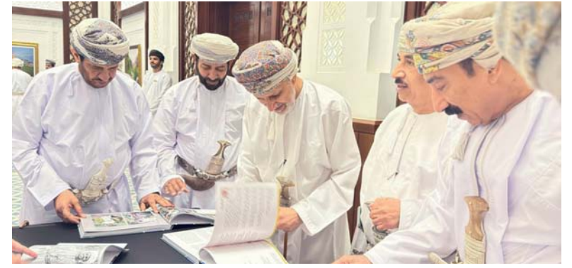
الحضور يطلع على محتوى الكتاب

ينطلق الفنان في معرضه من فكرة أن الإنسان حاول منذ نشوء الحضارات محاكاة فكرة السمو والارتقاء، لذلك أنتج مجموعة من الفلسفات والثقافات المعمارية على مر التاريخ والتي تتواءم مع مفردات الطبيعة من