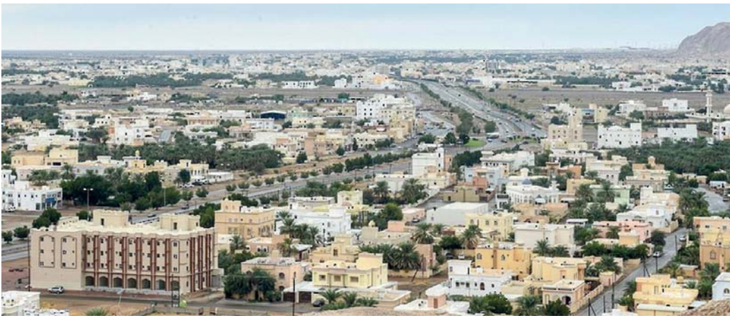
■ مشاريع الإسكان تسهم في تعزيز التنمية بمحافظة الظاهرة

عبري، العمانية: شهدت محافظة الظاهرة في الربع الثالث من العام الحالي نشاطاً ملاحظاً في القطاع العقاري، حيث تجاوز حجم التداول العقاري حاجز ١٦ مليون ريال عماني، وتركز الجزء الأكبر من هذه التداولات في الرهونات العقارية التي بلغت قيمتها أكثر من ١١ مليون ريال عماني بينما شكلت عقود البيع أكثر من ٥ ملايين ريال عماني.