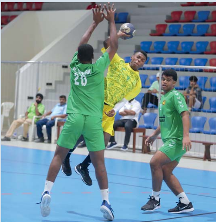
■ من مباريات دوري الناشئين لكرة اليد

الرياضية بمجمع الرياضي بصور ويتبارى السويق مع نادي عمان في الساعة الرابعة عصراً بالصالة الرياضية بالمجمع الرياضي بالمرستاق. الجدير بالذكر بأن نظام دوري الناشئين ينص أن تلعب جميع الأندية في المرحلة الأولى بنظام دوري من مرحلتين «تجميع نقاط» لكل مجموعة يصعد الأول والثاني من كل مجموعة إلى الدور الثاني، يلعب أول المجموعة الأولى مع ثاني المجموعة الثانية وأول المجموعة الثانية مع ثاني المجموعة الأولى «مباراتين» وفي حالة تبادل الفوز بين الفريقين (كل فريق يحصل على نقطتين) لا ينظر إلى فارق الأهداف يتم اللجوء مباشرة إلى رميات «٧» أمثال كل فريق «٥» رميات وفق القانون الدولي، وإذا استمر التعادل يلعب رمية برمية، ويلعب الفريقان الخاسران على المركزين الثالث والرابع «مباراة واحدة» ويلعب الفائزان على المركزين الأول والثاني «مباراة واحدة» لتحديد بطل الدوري ويمنح الفريق الفائز نقطتان والفريق المتعادل نقطة واحدة ولا يمنح الفريق الخاسر أي نقطة والفريق المنسحب لا يمنح أي نقطة والفريق الذي يحضر بطاقات خلال «١٥» دقيقة قبل المباراة يعتبر خاسراً ويعامل معاملة الفريق المنسحب.