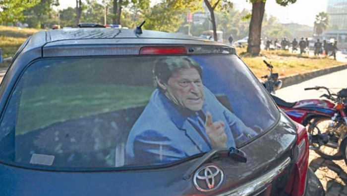
جنود شبه عسكريين يقفون للحراسة على طول شارع بالقرب من سيارة تحمل صورة لرئيس الوزراء السابق المسجون عمران خان، في إسلام آباد.

إسلام آباد. اف.ب. خلا وسط إسلام آباد صباح أمس الأربعاء من أنصار رئيس الوزراء الباكستاني السابق عمران خان غداة تفريق تظاهرات للمعارضة، فيما لزم السكان منازلهم التي لم يخرجوا منها منذ أيام بسبب الانتشار الأمني. مساء الثلاثاء، دعا عمران خان من سجنه أنصاره إلى التعبئة والسير باتجاه ساحة دي-شوك المحاذية لمقرات الحكومة في العاصمة في ختام يوم من التظاهرات التي شهدت مقتل أربعة من أفراد الأمن بعدما دهستهم سيارة يقودها متظاهرون، على ما ذكر وزراء. وكتب عمران خان، المسجون منذ أغسطس ٢٠٢٣، على اكس «على الذين لم ينضموا بعد إلى التظاهرة أن يتوجهوا إلى دي-شوك». وتقدمت بشرى بيبي زوجة لاعب الكريكت الدولي السابق عقب الإفراج عنها التظاهرة التي بلغ عدد المشاركين فيها نحو ١٠ آلاف شخص، وهي الأضخم منذ إيداع خان السجن، قبل أن تتوارى عن الأنظار ليلًا. رأى مدير معهد جنوب آسيا في مركز ويلسون الأميركي مايكل كوجلان أنه بعد ٢٤ ساعة من المواجهة في الشوارع، «لا يوجد منتصر». وأضاف أنه من خلال إغلاق العاصمة ومدارسها وقطع الإنترنت «أجج الجيش والحكومة غضب الناس ضدهم».