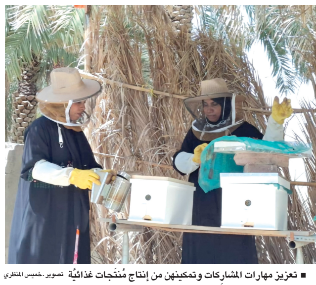
تعزيز مهارات المشاركات وتمكينهن من إنتاج مُنتجات غذائية

أكبر أم جديدة تلد في سن ٦١ سكوبي . ا.ف.ب: أصبحت امرأة تبلغ ٦١ عاماً أكبر امرأة تلد طفلاً في مقدونيا الشمالية، على ما أعلنت السلطات الصحية في الدولة الواقعة في منطقة البلقان. ولجأت الأم الجديدة التي لم يُكشف عن هويتها، إلى التخسيس المخبري، بحسب مديرة العيادة الجامعية لأمراض النساء والتوليد في سكوبي إيرينا ألكسيسكا باستيف. وأضافت باستيف أن المرأة الستينية خضعت سابقاً لعشر محاولات تلقيح اصطناعي. لا تفرض مقدونيا الشمالية أي حد عمري على النساء اللواتي يسعين إلى التخسيس في المختبر. وخرجت الأم والمولود الجديد من المستشفى الثلاثة. ويبلغ الأب ٦٥ عاماً، بحسب السلطات. وتشير الإحصاءات الرسمية إلى أن معدل الخصوبة في مقدونيا الشمالية بلغ ١.٤٨ طفل لكل امرأة في العام ٢٠٢٣.