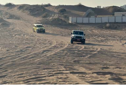
الحدث وفر فرصة لاكتشاف قدرات رانجلر ٢.٠ لتر تيربو

وتظل السلامة على رأس الأولويات من بين أكثر من ٨٥ ميزة متطورة بما فيها مثبت السرعة التكيفي وتحذير الاصطدام الأمامي وحماية معززة من الصدمات الجانبية. الأمامي وحماية معززة من الصدمات الجانبية. تم تجهيز طرازات جيب رانجلر روبيكون ٢٠٢٤ بمحور خلفي مسطح بالكامل جديد كلياً (Dana 44 HD) يوفر قوة استثنائية وقدرة سحب تصل إلى ٢٢٦٧ كجم.