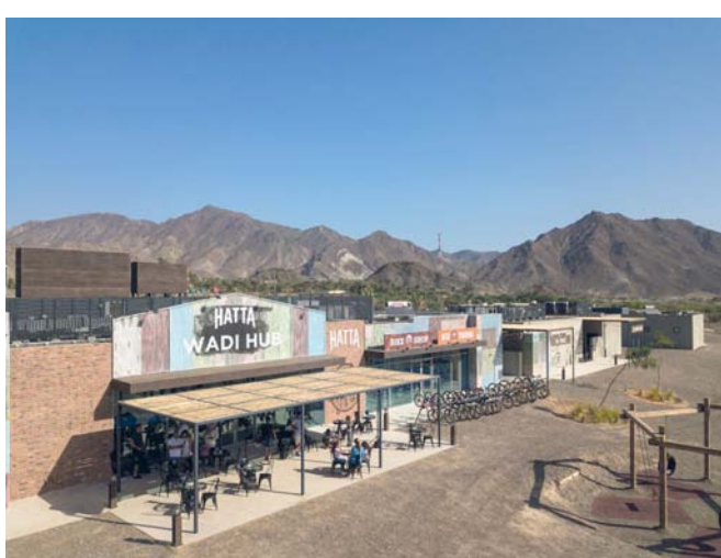
■ منتجعات حتا وادي هب

كما يُعد مطعم Trésind، الفائز بالعديد من الجوائز والتقديرية، الرائد لمجموعة Passion F