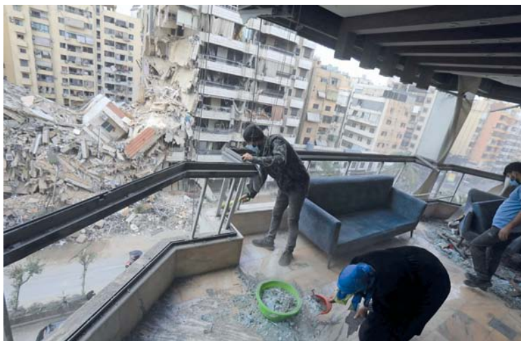
لبنانيون يزيلون الأنقاض والرُّكام من شقتهم في الضاحية الجنوبية لبيروت، مع عودة الناس لتفقد منازلهم بعد دخول وقف إطلاق النار حيز التنفيذ.

بيروت وكالات: بدأ سريان وقف إطلاق النار في لبنان حيز التنفيذ فجر أمس، ليمهد الاتفاق إنهاء الصراع بعد ما يقرب من ١٤ شهرًا من القتال عبر الحدود بين لبنان وإسرائيل، الذي أودى بحياة الآلاف منذ اندلاع بسبب الحرب في قطاع غزة منذ العام الماضي. ويدعو لدة شهرين ويطلب خلاله حزب الله بإنهاء وجوده المسلح في جنوب لبنان، في الوقت الذي تعود فيه القوات الإسرائيلية إلى جانبها من الصدور. ومن المقرر أن تقوم لجنة دولية بقيادة الولايات المتحدة بمراقبة الالتزام بالاتفاق. وكان الرئيس الأميركي جو بايدن قد أعلن مساء أمس الأول، أن لبنان والكيان الإسرائيلي وافقا على وقف إطلاق النار، مؤكداً أن إسرائيل ستسحب قواتها تدريجيًا على مدى ٦٠ يومًا، مع سيطرة الجيش اللبناني على الأراضي القريبة من الحدود مع إسرائيل. وقبل ساعات من دخول وقف