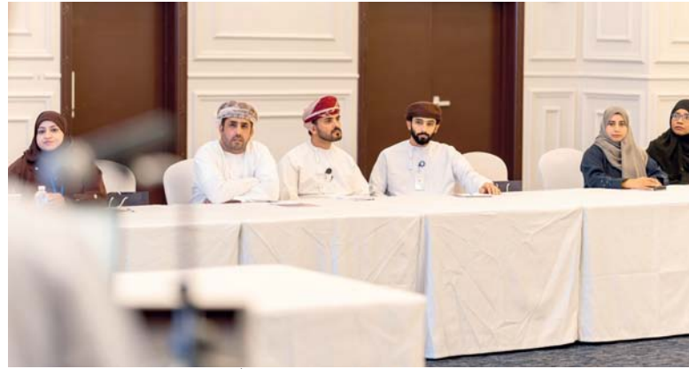
الجلسة سلّطت الضوء على المزايا المُقدّمة للشركات الملتزمة.

لتأسيس شركات صغيرة ومتوسطة في مختلف المجالات ومساير «التدريب المقرون بالعمل الحر» الذي يربط الباحثين عن عمل بعدد من البرامج التدريبية لتأهيلهم لشغل الفرص المرتبطة بالعمل الحر في السوق المحلي والعالمي من مختلف المؤهلات والتخصصات الدراسية، بالإضافة إلى مسار «التدريب المقرون بالإحلال» الذي يعمل على