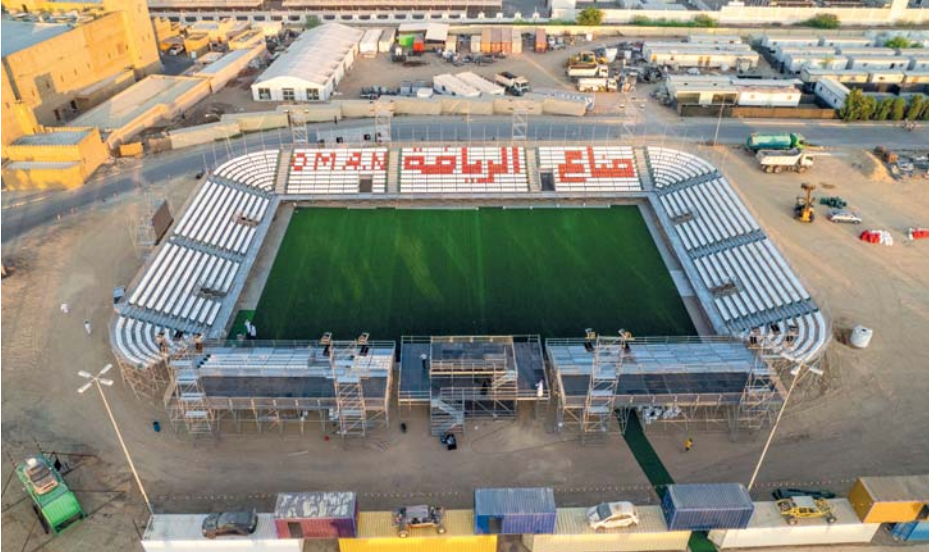
■ ملعب نهائيات كأس العالم لسداسيات كرة القدم

تطلق غدا «الجمعة» نهائيات كأس العالم لسداسيات كرة القدم «سوكا»، والتي تستضيفها سلطنة عُمان بمشاركة ٤٠ فريقاً من مختلف دول العالم للتنافس على لقب البطولة، وتستمر حتى ٧ ديسمبر القادم ويقام هذا الحدث للمرة الأولى في سلطنة عُمان، حيث تم تقسيم المنتخبات المشاركة إلى ٨ مجموعات، تضم كل مجموعة ٥ فرق تتنافس للوصول إلى الأدوار النهائية وقد أتمت اللجنة المنظمة للبطولة كافة استعداداتها وتحضيراتها النهائية للانطلاق الحدث الرياضي الهام. وكانت قرعة البطولة أوقعت الفريق العُماني في المجموعة الأولى مع فرق أميركا وإيطاليا وكندا وقطر، وفي المجموعة الثانية فرق ألمانيا وبلغاريا وجورجيا وليبيا وصربيا، وضمت المجموعة الثالثة اليونان وبلجيكا