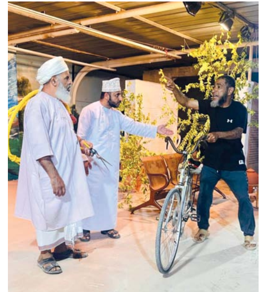
المسرحية تهدف إلى الوفاء وغرس الارتباط بالوطن