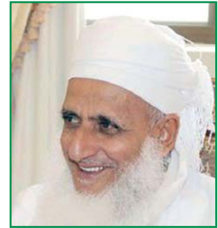
يجيب عن أسئلتكم سماحة الشيخ العلامة أحمد بن حمد الخليلي المفتي العام للسلطنة

حب الوطن واجب على كل فرد يعيش على أرضه لذا لا بد له من أمور ليكون قد أدى ما عليه من حقوق، على هذا ما هي حقوق المواطن للوطن وما هي حقوق الوطن للمواطن؟ لا ريب أن الوطن يتكون من المواطنين فالإنسان مطالب بأن يكون فرداً صالحاً في مجتمعه وأن يكون شاعراً بمشاعر الأخوة التي تشد المؤمنين بعضهم إلى بعض وهي التي جسدها النبي في قوله: (ترى المؤمنين في توادهم وتراحمهم وتعاطفهم كمثل الجسد إذا اشتكى منه عضو تداعى له سائر الجسد بالحصى والسهر) .. فكل تخريب هو إضاعة للأمانة. كيف تربي أبناء الوطن على المحافظة على نعمة الأمن؟ الأمن إنما هو ناشئ من الإيمان فعندما يترسخ الإيمان في النفوس يحافظ على الأمن ولذلك لا بد من تربية الأجيال على الإيمان وعلى التعلق بالله تعالى وحب الله وحب رسوله