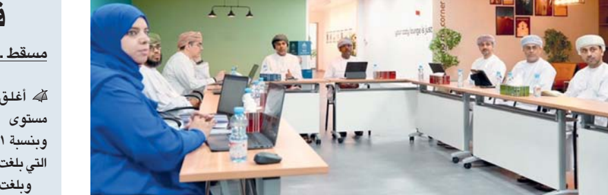
اللجنة اطلعت على ملخص الجولة التعريفية للبرنامج حول المحافظات

مسقط، العُمانية: عقدت اللجنة الفنية للبرنامج الوطني للاقتصاد الرقمي أمس اجتماعها الثاني لعام ٢٠٢٤ برئاسة سعادة الدكتور علي بن عامر الشاذلي وكيل وزارة النقل والاتصالات وتقنية المعلومات للاتصالات، وعضوية ممثلي الجهات الحكومية المعنية. تم خلال الاجتماع مناقشة تنفيذ التوصيات الواردة في الاجتماع الأول للجنة الفنية للبرنامج الوطني للاقتصاد الرقمي، واستعراض التقرير النصف السنوي الأول والثاني للبرنامج الوطني للاقتصاد الرقمي المراد رفعه إلى مجلس الوزراء، إضافة إلى مناقشة خطة البرنامج الوطني للاقتصاد الرقمي للمرحلة المقبلة (٢٠٢٦-٢٠٣٠). وشهدت مؤشرات البرنامج الوطني للاقتصاد الرقمي ارتفاعاً هذا في العام؛ حيث تقدمت سلطنة عُمان تسعة مراكز في التصنيف العالمي لمؤشر الحكومة الإلكترونية لتحل في المرتبة الـ ٤١ دولياً من أصل ١٩٣ دولة، كما تقدمت السلطنة ٤ مراتب في مؤشر جاهزية الشبكات محققة المركز الـ ٥٠ عالمياً. واطلعت اللجنة خلال الاجتماع على ملخص الجولة التعريفية للبرنامج الوطني للاقتصاد الرقمي حول المحافظات. يذكر أن مهام اللجنة الفنية للبرنامج الوطني للاقتصاد الرقمي تتمثل في إجراء الدراسات الفنية للبرامج والخطط التنفيذية المتعلقة بالاققتصاد الرقمي ومتابعة سير العمل في البرامج والخطط التنفيذية بشكل متواصل مع الفرق التنفيذية لكل برنامج، وتذليل الصعوبات التي تعيق عملية التنفيذ ورفعها للجنة المالية والاقتصادية بمجلس الوزراء كما تتابع اللجنة مؤشرات الأداء التابعة لكل برنامج والخطط التنفيذية وربطها مع مستهدفات رؤية «عُمان ٢٠٤٠» المتعلقة بالاققتصاد الرقمي.