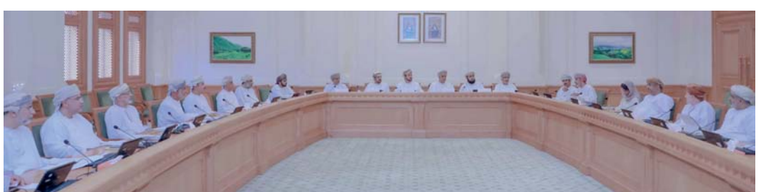
اللجنة خلال مناقشتها مشروع الميزانية العامة للدولة المحال من مجلس الوزراء

مسقط، «الوطن»: ناقشت اللجنة الاقتصادية والمالية الموسعة بمجلس الدولة أمس، مشروع الميزانية العامة للدولة للسنة المالية ٢٠٢٥ المحال من مجلس الوزراء، كما اطلع أعضاء اللجنة الاقتصادية والمالية ورؤساء اللجان الدائمة بالمجلس خلال الاجتماع الأول لدور الانعقاد العادي الثاني من الفترة الثامنة، برئاسة المحكم الدكتور ظافر بن عوض الشفري رئيس اللجنة الاقتصادية والمالية، على تقرير مجلس الشورى بشأن مشروع الميزانية العامة للدولة للسنة المالية ٢٠٢٥. يذكر أن المادة رقم (٥٢) من قانون مجلس عمان نصت على أن «تحال مشروعات خطط التنمية والميزانية العامة للدولة من مجلس الوزراء إلى مجلس الشورى لمناقشتها وإبداء توصياته بشأنها خلال شهر على الأكثر من تاريخ إحالة إليه، ثم إحالتها إلى مجلس الدولة؛ لمناقشتها العامة للدولة سرياً».