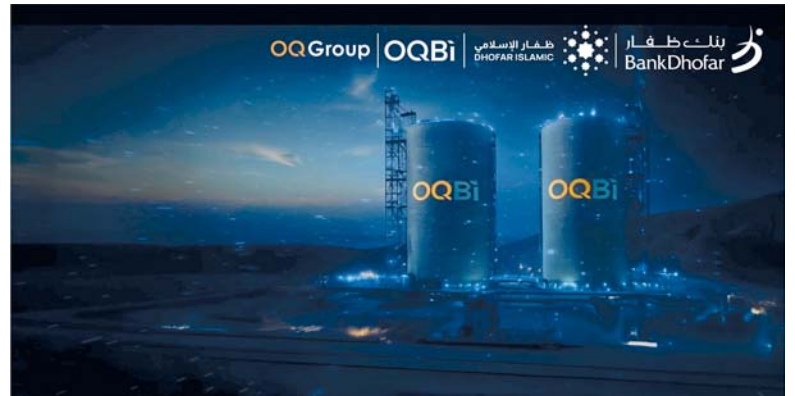
■ الاكتتاب العام الأولي لشركة أوكيو للصناعات الأساسية فرصة استثمارية مهمة

وقد أصدرت هيئة الرقابة الشرعية SSB لدى ظفار الإسلامي ما يؤكد أن الطرح متوافق مع الشريعة الإسلامية بناء على الظروف السائدة وفقاً لتاريخ هذا التصريح. ويمثل الاكتتاب العام الأولي لشركة أوكيو للصناعات الأساسية فرصة استثمارية مهمة حيث يلتزم بنك ظفار ووظفار الإسلامي بضمان حصول زبائنهم على تجربة مريحة وسهلة للمشاركة في هذا الاكتتاب ويمكن للزبائن التقدم بطلب للاكتتاب رقمياً من خلال التطبيقات عبر الهاتف النقال حيث تتنح هذه المنصة الرقمية إمكانية المشاركة الفورية ويضع خطوات سهلة من أي مكان من ناحية أخرى للزبائن الذين يفضلون التعامل وجهاً لوجه يمكنهم أيضاً زيارة أي من الفروع لتقديم الطلب من خلال تعبئة نموذج الاكتتاب لشركة مسقط للمقاصة والإيداع الإلكتروني، وسيكون موظفو الفروع متاحين للمساعدة طوال عملية تقديم الطلبات كما بإمكان الزبائن تقديم طلب للاكتتاب ومتابعة طلبهم مباشرة من خلال التطبيق.