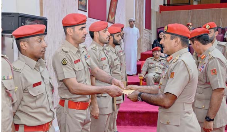
■ أثناء تكريم فريق موسيقى الجيش السلطاني العماني

والخامس في مسابقة العزف في مستوياتها المختلفة، كما حصلت الفرقة على عدد من المراكز الأولى والمتقدمة على مستوى المسابقات الفردية.