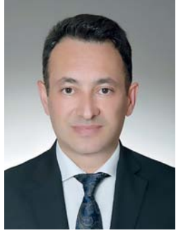
■ عبدالله بن خليفة

العُمانية - التركية، معبراً عن ترحيبه بالزيارة التي تجسد عمق الروابط التاريخية الممتدة بين البلدين على مدى قرون عديدة. وأضاف: إن هذه الزيارة تُبرز إرادة القيادتين الحكيمتين لتعزيز هذه العلاقات وتطويرها بما يخدم المصالح المشتركة للشعبين الشقيقين، لافتاً إلى أن هذه الزيارة تأتي في وقت حاسم لتعزيز التعاون المشترك بين سلطنة عُمان وجمهورية تركيا في مجالات متعددة تشمل الاقتصاد، والثقافة، والسياسة. وبين أنه من المتوقع أن تثمر النقاشات بين القيادتين عن شراكات استراتيجية جديدة ورؤى مشتركة لمواجهة التحديات الإقليمية والدولية، بما يُعزز مكانة البلدين على الساحة العالمية ويدعم تطورات شعبيهما.