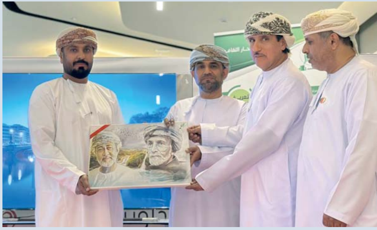
ختام الأمسية شهد تكريم الشعراء المشاركين وتقديم هدية لراعي المناسبة