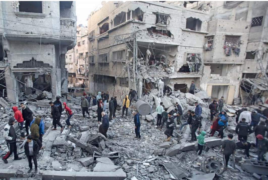
فلسطينيون يتفقدون الأضرار في موقع غارة جوية إسرائيلية في مخيم النصيرات وسط غزة.

عوانه المكثف والشامل وغير المسبوق على قطاع غزة، عبر شن عشرات الغارات الجوية والقصف برًا وبحرًا، مع ارتكابه مجازر دامية ضد المدنيين وتغذية جرائم إبادة في مناطق التوغل، ما خلف عشرات الآلاف من الشهداء والجرحى والمفقودين، وألحق دمارًا هائلًا بالبنى والمرافق والمنشآت الحيوية، فضلًا عما سببه من كارثة إنسانية غير مسبوقة نتيجة وقف إمدادات الغذاء والماء والدواء والوقود بسبب الحصار. في المجال الإنساني يواجهون أوضاعًا صعبة للغاية، لذا طلبنا مرارًا توفير المزيد من نقاط الدخول إلى غزة والمزيد من الطرق للتوزيع بأنحاء القطاع. من جانبه، شدد مكتب الأمم المتحدة لتنسيق الشؤون الإنسانية (أوتشا) على أن القانون الدولي الإنساني يحتم حماية المدنيين وضمان تلبية احتياجاتهم الضرورية للبقاء على قيد الحياة، سواء بقوا في أماكنهم أو فروا منها. ويواصل الاحتلال الإسرائيلي عوني الحرجاني شمال دوار الشيخ زايد شمال مخيم جباليا، وأجبروا النازحين فيها على المغادرة. وفي نيويورك أعلنت الأمم المتحدة أنها قامت بإحدى وأربعين محاولة هذا الشهر للوصول إلى الفلسطينيين المحاصرين في مناطق بشمال غزة بمساعدات منقذة للحياة، لكن سلطات الاحتلال الإسرائيلي «لم تيسر أيًا من هذه المحاولات». وقال فرحان حق نائب المتحدث باسم الأمم المتحدة، في مؤتمر صحفي: إن أجزاء من شمال غزة تخضع للحصار لأكثر من ٥٠ يومًا حتى الآن، فيما تتواصل الأعمال القتالية. وأضاف أن المدنيين هناك يتعرضون لقصف مكثف وبجاجة ماسة للمساعدة. ونكر أن الأسر التي فرت من شمال غزة بحثًا عن الأمن والمأوى في مدينة غزة، تواجه أيضًا شحًا بالغا في الإمدادات والخدمات، بالإضافة إلى الاكتظاظ وظروف النظافة السيئة. وأشار إلى أن جميع العاملين