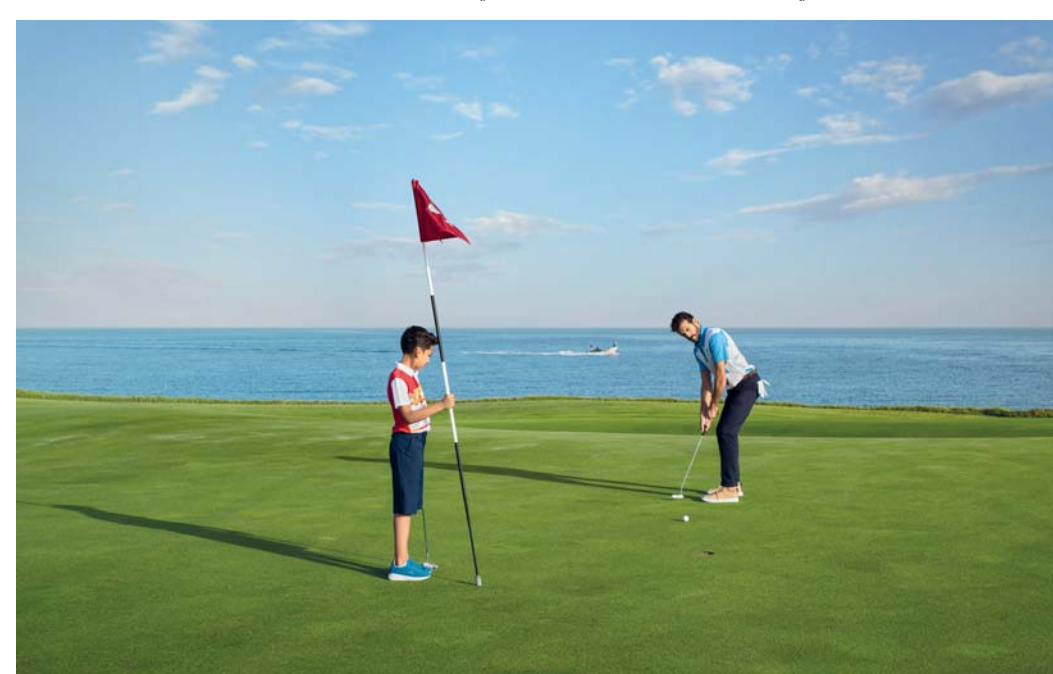
■ ملعب الموج للجولف

شهادة على ما يتميز به الملعب من تصميم استثنائي وجمال طبيعي، وما يقدمه من تجارب لا تضاهي في رياضة الجولف. فمُنذ افتتاحه في عام ٢٠١٢، نجح الموج للجولف في استقطاب لاعبي الجولف من جميع أنحاء العالم، حيث يعتبر أول ملعب