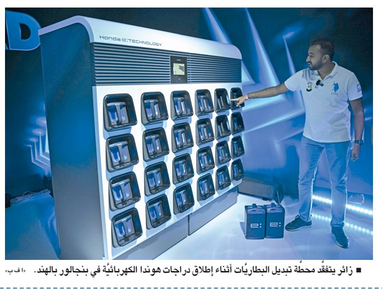
زائر يتفقد محطة تبديل البطاريات أثناء إطلاق دراجات هوندا الكهربائية في بنجالور بالهند.

دعم المنتجات الزراعية للمرأة الريفية بعبري عبري . من سعيد الغافري: نُفذ قسم التنمية الريفية بالمديرية العامة للثروة الزراعية وموارد المياه بمحافظة الظاهرة، برنامجاً تدريبياً للمرأة الريفية المستفيدة من مشروع دعم وتسويق المنتجات الزراعية للمرأة الريفية بولاية عبري. تضمن البرنامج تقديم ست حلقات تدريبية شملت مجالات متنوعة من الصناعات الغذائية صناعة المرئي من الفواكه، والمخللات والصلصات، وإنتاج منتجات التمور ومشتقاتها، ومنتجات نحل العسل، والألبان والدواجن واللحوم وغيرها من المنتجات، وهدف البرنامج لتعزيز مهارات المشاركات وتمكينهن من إنتاج منتجات غذائية ذات جودة عالية، مما يساهم في زيادة الدخل، كما تم التركيز على استراتيجيات تسويق المنتجات لضمان وصولها إلى الأسواق المحلية. كما تم استعراض أساليب التعبئة واختيار العبء المناسبة للمنتج