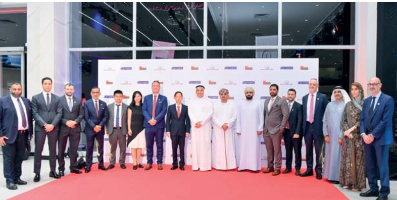
صورة جماعية لعدد من المشاركين في الاحتفالية

المستدام. كما تم استعراض أحدث طرازات «GAC موتور» التي تشمل EMZOOM و EMPOW و GS٨ والطراز الجديد كلياً MA، وهي سيارات تتميز بأحدث التقنيات، وتوفر الفخامة والثقة في الأداء. بالإضافة إلى ذلك، كتفت المجموعة عن بعض طرازات علامة «أيون» المستقبلية، مثل