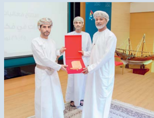
درع تذكارية تكريماً للمرحوم سعيد ود وزير

تضمنت الجلسة العلمية الأولى من الندوة والتي أدارها الدكتور ناصر بن سعيد العتيقي، ثلاث أوراق علمية، تناولت الورقة العلمية الأولى بعنوان «الشاعر ولد وزير النشأة والتكوين» قدمها الدكتور محمد بن حمد العريمي الباحث في التاريخ ركز في ورقته على جانب من سيرة الشاعر ولد وزير وما يتعلق بنشأته والعوامل التي أثرت على تكوينه الأدبي، حيث ولد الشاعر سعيد بن عبد الله بن وزير الفارسي في حارة (المصيفة بالقرب من المسجد الجامع الكبير بولاية صور في سنة ١٣٢٢هـ بحسب ما يذكر الشاعر في مذكراته التي كتبها.