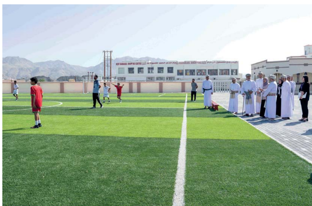
جلالة السلطان لدى حضوره حصّة رياضية بالمدرسة

وأكد سعادته: إن دلالات هذه الزيارة تتجاوز الاحتفاء، فهي تؤكد أهمية تطوير البيئة التعليمية بما يتماشى مع المعايير الحديثة، وتسلسل الضوء على أهمية تمكين الطلبة والمعلمين من أدوات الابتكار والإبداع ومهارات المستقبل، وتشكل حافزاً كبيراً لنا في قطاع التعليم المدرسي للعمل على تعزيز جودة المناهج الدراسية والبرامج التربوية، وتكثيف الجهود لتحقيق التميز التعليمي. وأضاف: ونحن في وزارة التربية والتعليم نؤكد التزامنا الكامل بالعمل على تنفيذ رؤية جلالته السامية من خلال تعزيز الشراكة بين مختلف أطراف العملية التعليمية؛ لضمان تهيئة بيئة تعليمية محفزة وشاملة تلبي طموحات الأجيال القادمة.