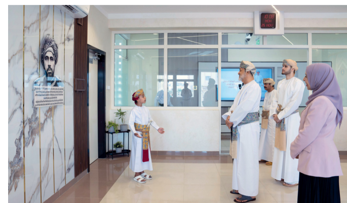
■ جلالة السلطان أثناء تجوله في أقسام المدرسة ومراقبته وحضوره بعض الحصص الدراسية في الصُوف ومراكز التعلم والمختبر وإطلاع جلالته على أركان المعرض المصاحب للمقام بمناسبة الزيارة الكريمة حيث تضمّن نماذج من البرامج والأنشطة المنفذة من قِبل طلبة المدرسة في مجالات الثقافة المالية وريادة الأعمال ومسارات التعليم المهني والتقني وتوظيف الذكاء الاصطناعي في العملية التعليمية.

العامرات - العُمانية: تفضّل حضرة صاحب الجلالة السلطان هيثم بن طارق المعظم - حفظه الله ورعاه - صباح أمس وقام بزيارة مباركة لمدرسة السلطان فيصل بن تركي للبنين بولاية العامرات بمحافظة مسقط للاطلاع عن كثب على سير العملية التربوية والتعليمية، والبرامج الحديثة المطبقة لإثراء الجوانب المعرفية والإدراكية لطلبة المدارس.