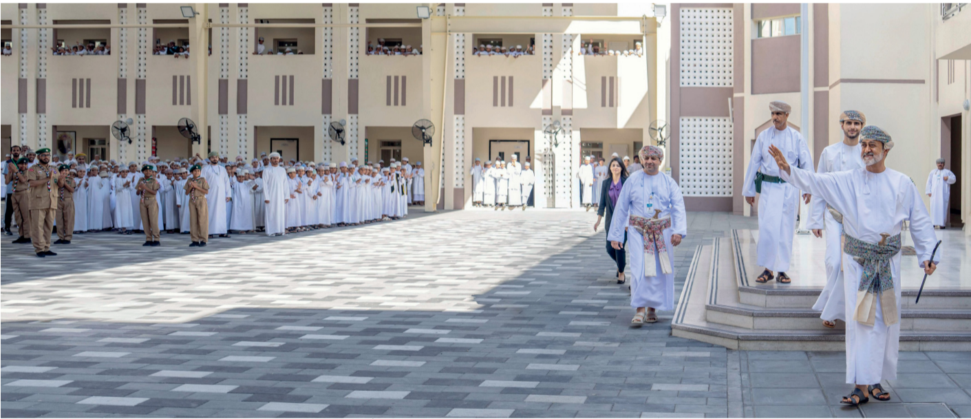
■ جلالة السلطان يُلقي التحية على أبنائه التربيين والطلبة بالمدرسة