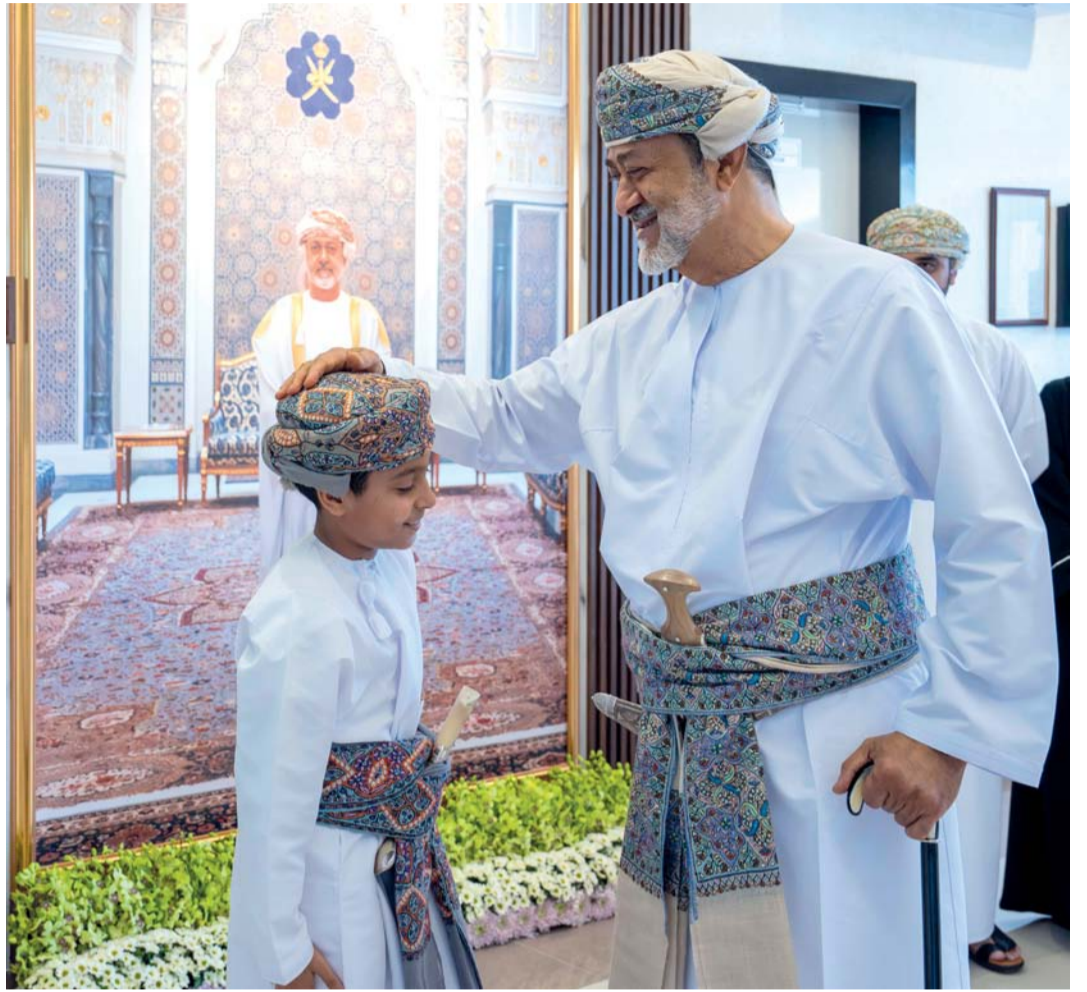
جلالة السلطان يُحيي أحد أبنائه الطلبة بعد إلقاءه قصيدة ترحيبية بهذه المناسبة الميمونة