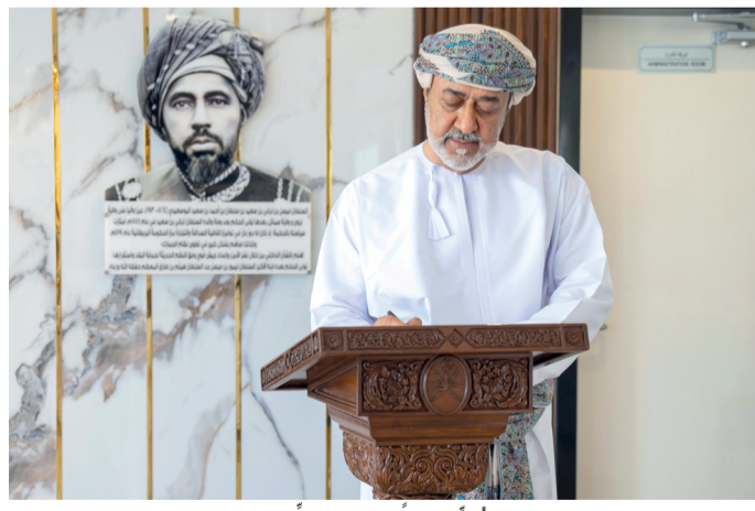
■ جلالته يُدوّن كلمة بمناسبة الزيارة الكريمة