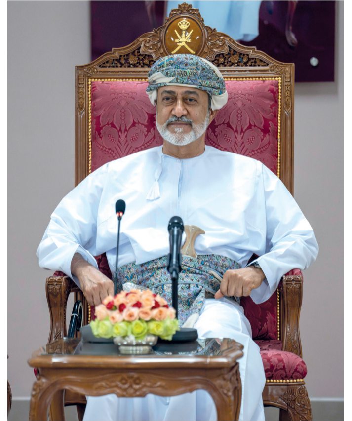
■ جلالته في حوارٍ أبويٍّ مع التربيين وأبنائه الطلبة