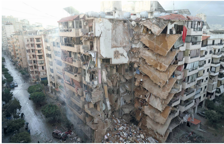
مبنى تعرض للقصف جراء الغارات الجوية الإسرائيلية التي استهدفت منطقة الطيبة في ضواحي بيروت.

ونسف جيش الاحتلال مربعات سكنية جديدة شمال غرب مدينة رفح جنوب قطاع غزة، فيما واصلت مواقعها العسكرية على محور فيلادلفيا إطلاق النار على مواصي رفح.