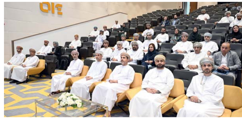
■ الملتقى يناقش أهمية لجان حوكمة التشغيل في القطاعات الاقتصادية

مسقط. «الوطن»: ركيزة أساسية للتحوّل الرقمي والتنمية الاقتصادية الشاملة في سلطنة عمان.