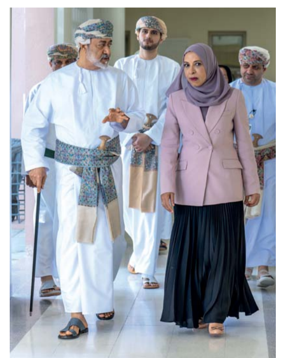
جلالته لدى تجوُّله في أقسام المدرسة ومرفأها