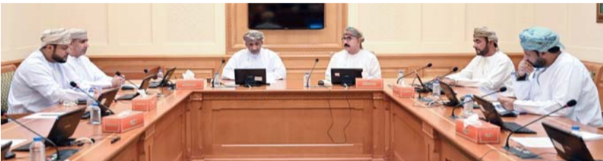
■ اللجنة استعرضت تقرير استضافتها لشركة نماء القابضة للكهرباء

القابضة للكهرباء، والمتضمن على أبرز ما خلص إليه اللقاء من مناقشات موسعة حول رفع كفاءة الخدمات المقدمة في قطاع الكهرباء بما من شأنه تجويد وتطوير الخدمات التي تقدمها الشركة للمواطنين والمقيمين في سلطنة عمان.