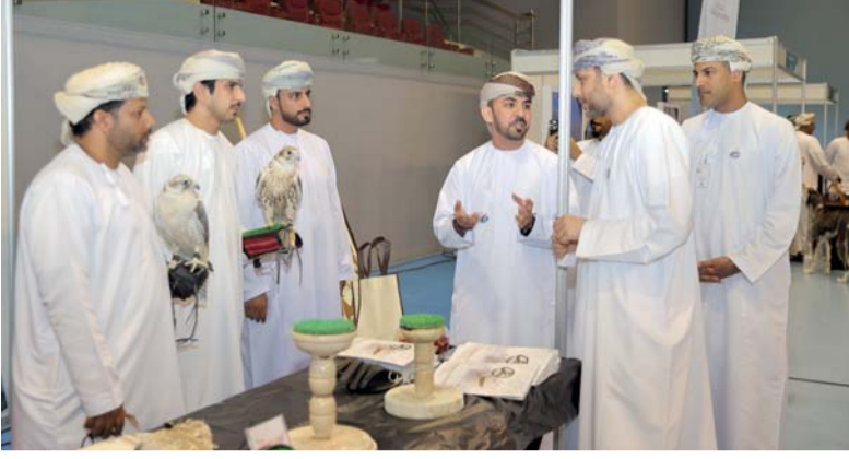
... ويطلع على المعرض المصاحب لفعاليات الملتقى

لندن . أ. ف. ب. تعهد رئيس الاتحاد الدولي لألعاب القوى (وورلد اثليتيكس) البريطاني سيباستيان كو بحماية الرياضة النسائية في حال فوزه برئاسة اللجنة الأولمبية الدولية، بعد الجدل الذي حصل خلال أولمبياد باريس الصيف الماضي. وقال كو في مقابلة مع وكالة فرانس برس إن ضمان مجموعة واضحة