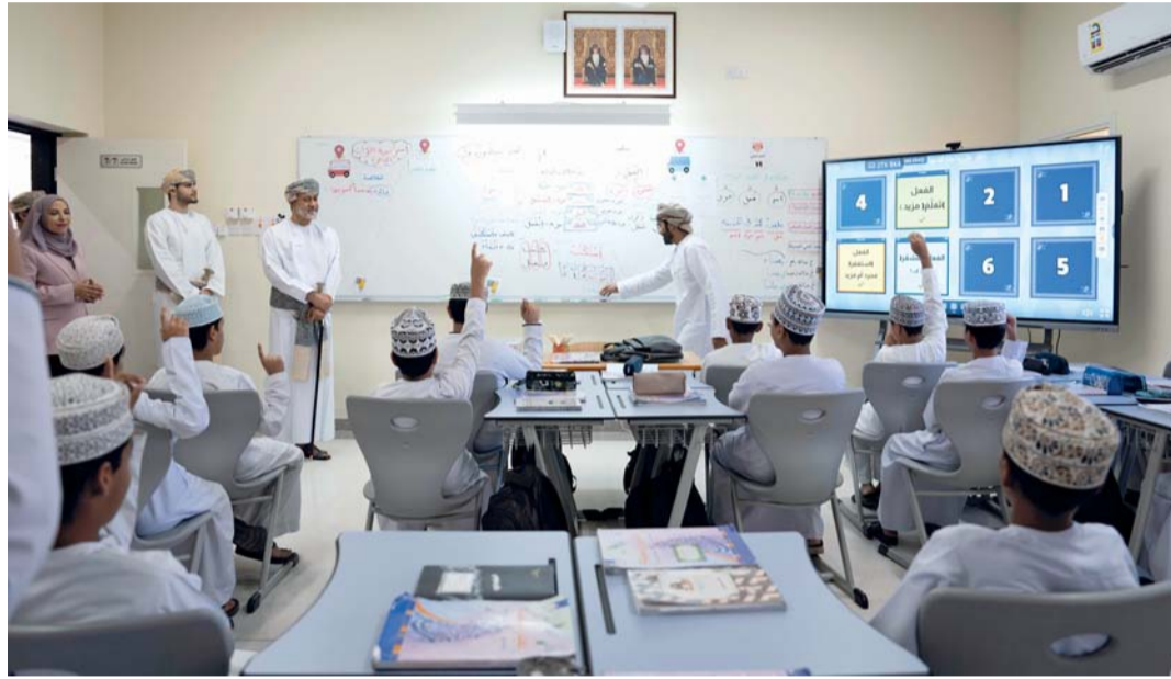
جلالته أثناء حضوره إحدى الحصص الدراسية

وببالغ التقدير والامتنان عبرت معالي الدكتورة مديحة بنت أحمد الشيبانية وزيرة التربية والتعليم عن سعادتها الغامرة بالزيارة السامية لمولانا حضرة صاحب الجلالة السلطان هيثم بن طارق المعظم - حفظه الله ورعاه - إلى مدرسة السلطان فيصل بن تركي للبنين بولاية