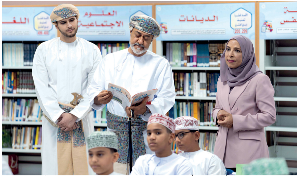
جلالة السلطان لدى تجوله في أقسام المدرسة ومراقبتها وحضور بعض الحصص الدراسية

العمارات . العُمانيّة: تفضّل حضرة صاحب الجلالة السلطان هيثم بن طارق المعظم . حفظه الله ورعاه . صباح أمس وقام بزيارة مباركة لمدرسة السلطان فيصل بن تركي للبنين بولاية العُمرات بمحافظة مسقط للاطلاع عن كثب على سير العملية التربوية والتعليمية، والبرامج الحديثة المطبقة لإثراء الجوانب المعرفية والإدراكية لطلبة المدارس. وقد أكد جلالته السلطان المعظم . حفظه الله ورعاه . على حرصه السامي على تزويد المدارس التي بُنيت خلال السنوات الثلاث أو الأربع الماضية بأحدث الإمكانيات.. مُضيفاً . أعزّه الله . أن العلم اليوم ليس كما كان سابقاً تقليدياً، وإنما هناك حركة حقيقية فيها تسابق وإبداع مبني على معرفة الطالب بالتقنيات الحديثة.