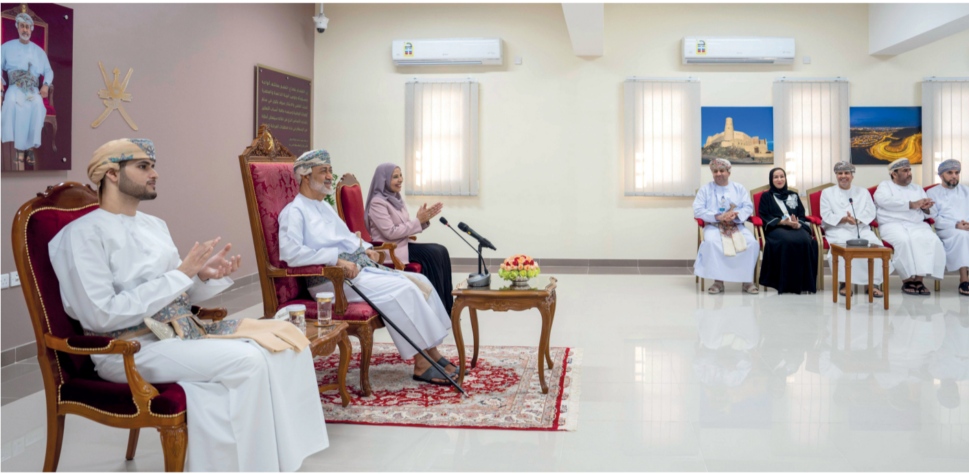
■ العاهل المُفدى لدى لقائه بمجموعة من التربيين وأبنائه الطلبة من مختلف مدارس محافظة مسقط للاستماع إلى مبادراتهم وإنجازاتهم في مجال التعليم

■ العلم اليوم ليس كما كان سابقاً تقليدياً وإنما هناك حركة حقيقية فيها تسابق وإبداع مبني على معرفة الطالب بالتقنيات الحديثة ■ جلالته يؤكد: الشباب والطلبة الذين رأيناهم واستمعنا منهم يبشرون بالخير وعمان تحتاج لكل فرد أن يكون جزءاً من البناء