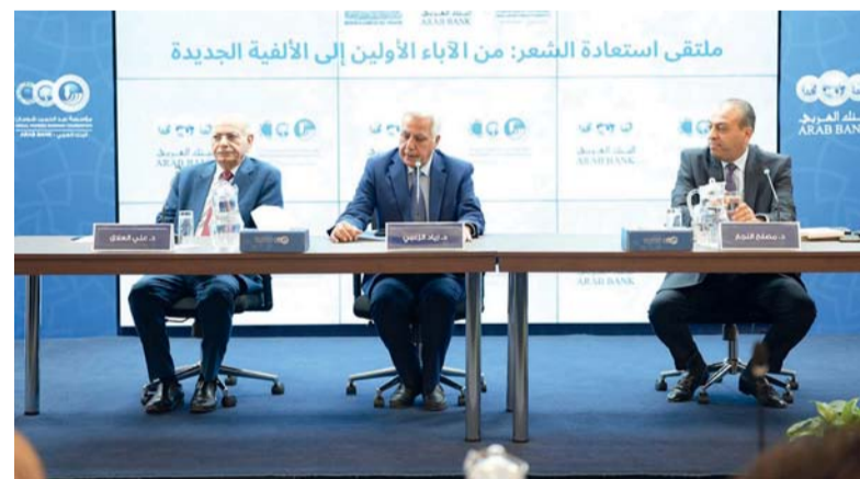
الملتقى يلقى الضوء على قضايا عديدة أبرزها اتجاهات القصيدة الحديثة

عمان - العُمانية: أسهم عدد كبير من الباحثين والأكاديميين والنقاد والشعراء من داخل الوطن العربي وخارجه في تأثيث مفردات ملتقى (استعادة الشعر... من الأبناء الأولين إلى الألفية الجديدة) الذي انطلق بالأردن امس الأول بتنظيم من مؤسسة سلطان بن علي العويس الثقافية وبالتعاون مع مؤسسة عبد الحميد شومان. وأسهم الملتقى الذي شارك فيه الناقد الدكتور مبارك الجابري من سلطنة عُمان والمكرس للبحث في رهن الشعر العربي ومستقبله، في إلقاء الضوء على قضايا أبرزها اتجاهات القصيدة الحديثة، وانكسار المنبرية، وطبيعة التواصل بين الأجيال الشعرية، ودور النقد.