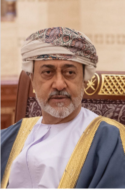
جلالة السلطان هيثم بن طارق - حفظه الله ورعاه -

«الاهتمام بقطاع التعليم بمختلف أنواعه ومستوياته وتوفير البيئة الداعمة والمحفزة للبحث العلمي والابتكار سوف يكون في سلم أولوياتنا الوطنية، وسنمده بحافة أسباب التمكين باعتباره الأساس الذي من خلاله سيتمكن أبنائنا من الإسهام في بناء متطلبات المرحلة المقبلة»