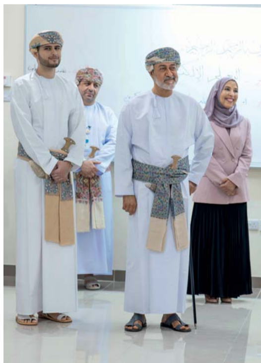
العاهل المُدّي أثناء حضوره بعض الحصص الدراسية في الصُفوف ومراكز التعلّم والمختبر