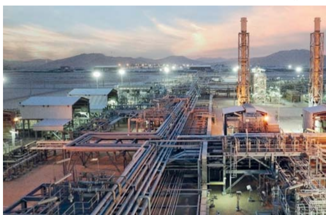
■ النتائج المتميزة التي حققتها الشركة تعكس مسؤوليتها في تحقيق نتائج أفضل للمساهمين.

تحقيق نتائج أفضل للمساهمين وتحقيق تطوراتهم إلى زيادة العائد على الاستثمار، وكفاءة الأداء المالي والتشغيلي الذي تحرص عليه في عملياتها. وقال إن الشركة ستواصل في الربع الرابع من العام الجاري تحقيق الأهداف المخطط لها في معدلات إنتاج النفط والغاز، مع متابعة متغيرات الأسواق الناشئة وسلوك تسعير السلع. مؤكدا على أن أوكيو للاستكشاف والإنتاج ستبقى على المسار الصحيح مع الحفاظ على محفظة متوازنة من مزيج النفط والغاز، وأداء متميز لأصول الشركة، كما تتوقع الشركة زيادة في إنتاج الغاز في المستقبل القريب، بالإضافة إلى تعزيز القدرة التنافسية المالية والتشغيلية للمحفظة الأساسية، وزيادة الطلب في السوق على الغاز الطبيعي الذي تزوده أصول أوكيو للاستكشاف والإنتاج، وهو ما سيدعم الأداء المالي الذي حققته الشركة منذ بداية العام، كما يتوقع استمرار زيادة إنتاج الشركة وفقاً لخطة أعمالها المتوقعة. وقال: إن الشركة ستواصل العمل على تحويل الفرص الجديدة إلى مشروعات، وتشكيل أفاق نمو جديدة بما يتواءم مع استراتيجية الشركة، وهو ما سترجم إلى نمو المشروعات في المستقبل.