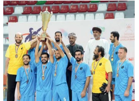
تتويج فريق جامعة التقنية والعلوم التطبيقية بالكأس