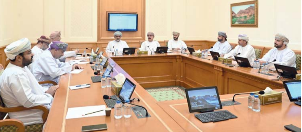
اللجنة اعتمدت تقريرها النهائي حول الرغبة المبداء بتهيئة مراكز الإيواء

المبداء بشأن تهيئة مراكز الإيواء بسلطنة عمان. جرت الاستضافة ضمن أعمال الاجتماع الرابع ما بين الدورين الأول والثاني، من الفترة العاشرة (٢٠٢٣ - ٢٠٢٧)، برئاسة سعادة الدكتور حمود بن أحمد البحياني رئيس لجنة الخدمات والمرافق العامة وبحضور أصحاب السعادة أعضاء اللجنة. وقدم أصحاب السعادة جملة من الملاحظات والاستفسارات خصوصاً فيما يتعلق بالموقف التنفيذي لعدد من مشاريع الطرق وصيانة الطرق المتضررة بالأنواء المناخية والتي تنفذها الوزارة في عدد من محافظات ولايات سلطنة عمان. من جانب آخر اعتمدت اللجنة خلال الاجتماع تقريرها النهائي حول الرغبة