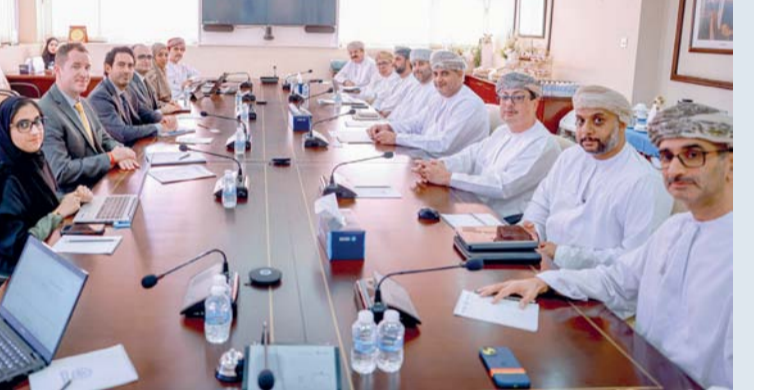
اللقاء ناقش جهود سلطنة عمان لتحقيق التنوع الاقتصادي

مسقط - الوطن: يدفع بالقطاع الخاص إلى دور قيادي لتحقيق هذه التوجهات. وأوضح السعدي أن الغرفة تضع في مقدمة أولوياتها تحسين بيئة الأعمال وجلب الاستثمارات وذلك انطلاقاً من التوجهات الاستراتيجية للغرفة المنسجمة مع رؤية (عمان ٢٠٤٠) لتتكامل في هذا الصدد مع الجهود الحكومية حيث أثمر هذا التكامل عن تقديم سلطنة عمان في التصنيفات الائتمانية ومؤشرات التنافسية وسهولة الأعمال. كما أن الغرفة تهتم بالمرجعات التي يجريها الصندوق وتعمل بشكل مستمر على متابعة توقعاته للاقتصاد العالمي. حضر اللقاء عدد من مجلس إدارة غرفة تجارة وصناعة عمان وعدد من ممثلي الشركات في القطاعات الاقتصادية المختلفة.