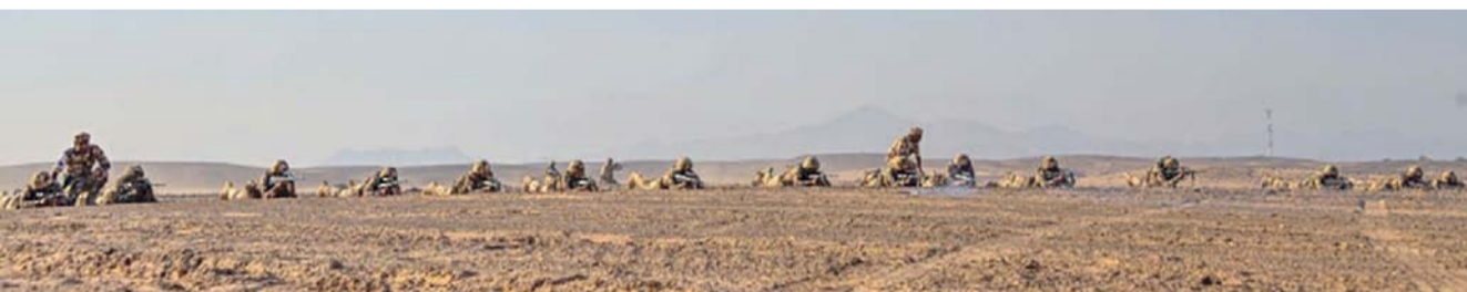
■ إكساب الضباط المرشحين العلوم والمعارف العسكرية