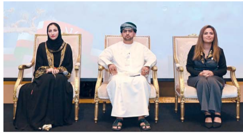
المنتدى سيركز على الدور الحيوي لسلطنة عُمان في السوق العالمي للشق القطع الطاقة

وتعزيز التعاون وقيادة الابتكار والاستدامة في قطاع البتروكيماويات والكيماويات. كما سيسلط المنتدى في هذه النسخة الضوء حول قيادة التقدم المستدام على الصعيد العالمي في صناعة البتروكيماويات والكيماويات. وأشار الرئيس التنفيذي لمجموعة أوكيو إلى أن المجموعة تمتلك العديد من مشاريع الصناعات التحويلية بسلطنة عُمان، إذ تتبع النهج