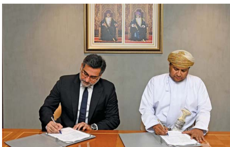
■ تعزيز التعاون وتبادل المعلومات والخبرات العلمية

التعاون وتبادل المعلومات والخبرات العلمية، حيث ستتمكن المدينة الطبية وجامعة أوتوا من خلال هذا التعاون من تبادل المعرفة المتخصصة في مجالات الرعاية الصحية، إلى جانب توسيع نطاق التدريب في مجال تبادل الخبرات التدريبية والمهنية للارتقاء بكفاءة الكوادر الطبية بما يعود بالنفع على جميع الأطراف، الذي يساهم في تطوير القطاع الصحي، علاوة على تنظيم منسقيات علمية وندوات مشتركة تعزز تبادل الأفكار والرؤى المتقدمة حول أحدث التقنيات والعلوم في القطاع الصحي.