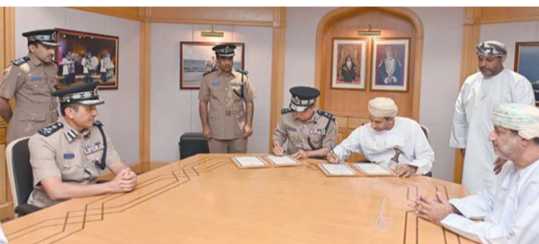
■ أثناء التوقيع على الاتفاقية

مسقط. العمانية: استقبل سعادة الشيخ خليفة بن علي الحارثي، وكيل وزارة الخارجية للشؤون الدبلوماسية أمس سعادة سني دابر السفارة الأميركية المتجولة المعنية بمكافحة الاتجار بالبشر، بديوان عام