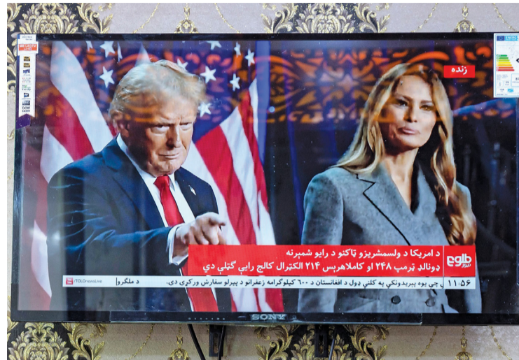
بث تلفزيوني مباشر لقناة تولو نيوز الأفغانية يتم تشغيله في مطعم في كابول ويظهر الرئيس الأمريكي السابق والمرشح الرئاسي الجمهوري دونالد ترامب مع زوجته ميلانيا ترابم أثناء خطابه.

ما أظهرته نتائج شبه نهائية حيث تقدم على منافسته الديمقراطية نائبة الرئيس كامالا هاريس في عدة ولايات بينها الولايات المتأرجحة. وقال دونالد إنه سيفوز في كل الولايات المتأرجحة وسنصل إلى ٣١٥ صوتاً بالمجمع الانتخابي وأمريكا، وهذا ما ينبغي أن يكون هنا. وهذا انتصار هائل للشعب الأمريكي.