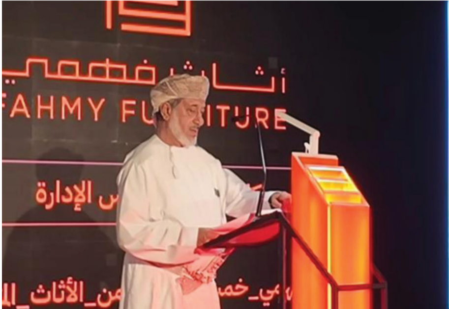
رئيس مجلس الإدارة يرحب بالضيوف