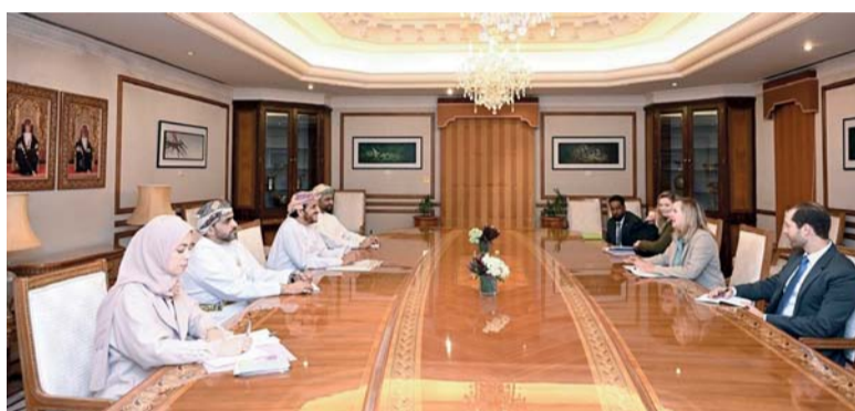
■ خليفة الحارثي أثناء لقائه مع سني دابر

وقعت شرطة عمان السلطانية صباح أمس بمدينة القيادة العامة للشرطة في القرم اتفاقية مشروع دمج الأنظمة مع شركة نماء للتزويد. وقّع الاتفاقية من جانب شرطة عمان السلطانية اللواء خليفة بن علي السيابي مساعد المفتش العام