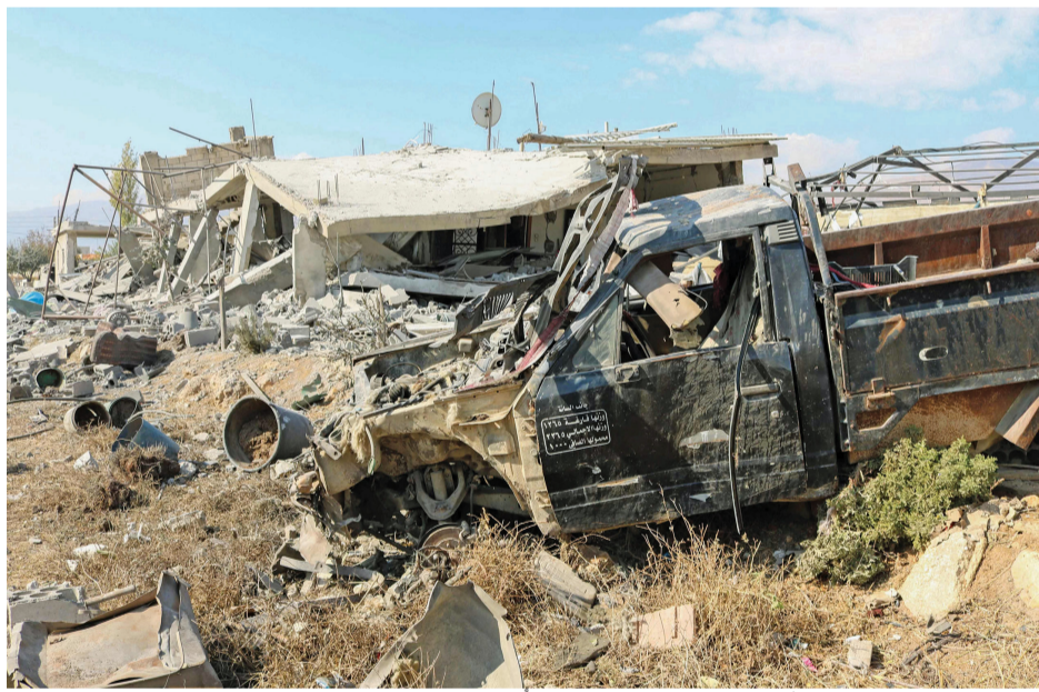
صورة تظهر منظر الدمار جراء غارة جوية إسرائيلية ليلاً استهدفت قرية سعدنايل اللبنانية في منطقة البقاع الأوسط.

وخرقها لسيادته وتوغلها البري داخل أراضيه، وارتكابها المزيد من المجازر، وتدميرها المتواصل والمنهج للقرى الحدودية، كبداية العديسة التي فجر الجيش الإسرائيلي أحد أحيائها بـ ٤٠٠ طن من المتفجرات، وكذلك قرى كفركلا، حولا، ميس الجبل، محبيب، بليدا، عيترون، عين إبل، حانين، عينا الشعب، قوزح، رميا، أم التوت، ومروحين.