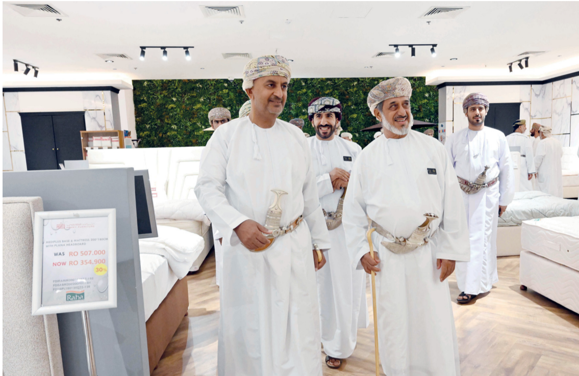
■ راعي الحفل ورئيس مجلس الإدارة يتفقدان المعرض