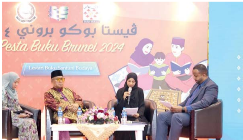
الحلقة تأتي احتفاءً بالذكرى الـ ٤٠ لتأسيس العلاقات الدبلوماسية بين البلدين