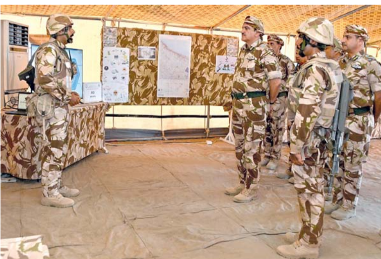
■ أثناء متابعة سير مجريات التمرين وأحداثه

القيادة والتعبوية الفردية والجماعية في التخطيط والتنفيذ الاستراتيجي. حضر فعاليات البيان العملي عدد من كبار الضباط والضباط، وجمع من منتسبي سلاح الجو السلطاني العماني.