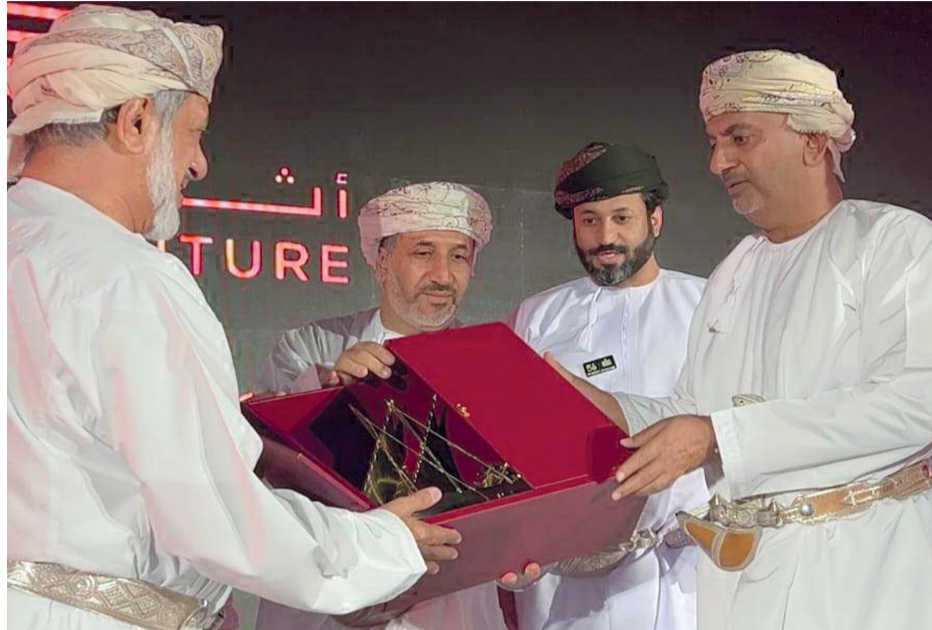
رئيس مجلس الإدارة يقدم هدية تذكارية لراعي الحفل