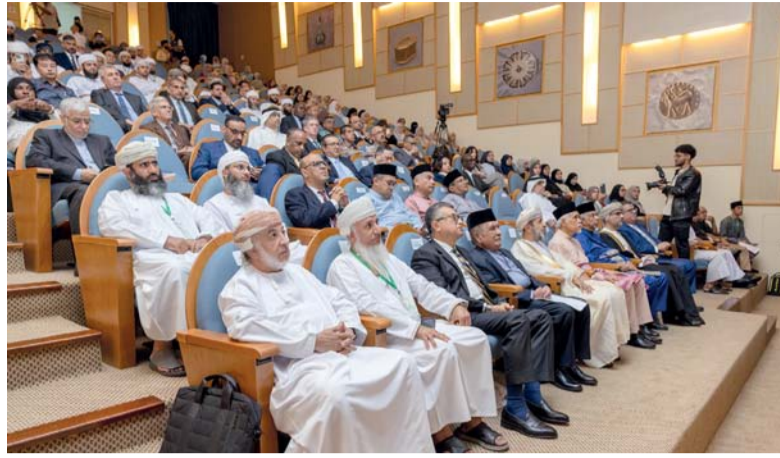
الحضور أثناء افتتاح المؤتمر