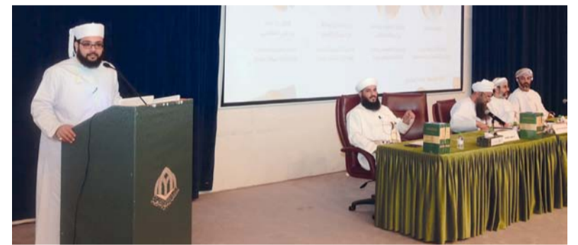
المشاركون في الندوة العلمية

رعى الحلقة سعادة بنغيران الحاج محمد حسنان بن بنغيران الحاج علي حسن، السكرتير الدائم (للمثقافة) بوزارة الثقافة والشباب والرياضة، وعدد من كبار المسؤولين الحكوميين. افتتحت الحلقة بكلمة ترحيبية لسعادة السفيرة إرما بنت سعيد الكثرية، سفيرة سلطنة عُمان المعتمدة لدى بروناي دار السلام، وقالت إن هذه الندوة ليست مجرد احتفال بذكرى العلاقات الدبلوماسية، بل هي فرصة للتأمل في مسيرة التعاون بين البلدين واستشراف آفاق مستقبلية جديدة. وتطرقت سعادتها إلى التراث الثقافي المشترك، مشددة