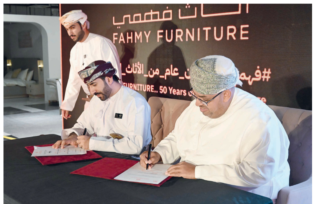
أثناء توقيع اتفاقية مع شركة البرعمي