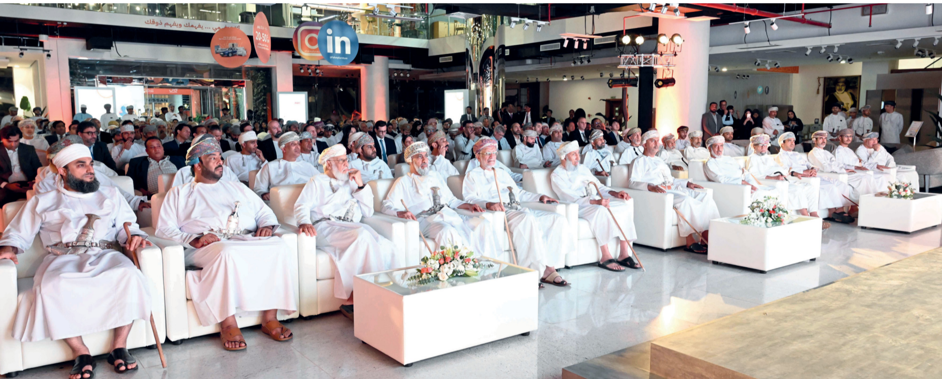
■ راعي الحفل والحضور خلال فعاليات الحفل

حملنا على عاتقنا مسؤولية الإسهام في مسيرة تنمية اقتصاد بلادنا فبدأت رحلتنا في تأسيس شركة أثاث رائدة مجموعتنا تقدم أفضل منتجات تتميز بالراحة والجودة والذوق الرفيع والأسعار التنافسية