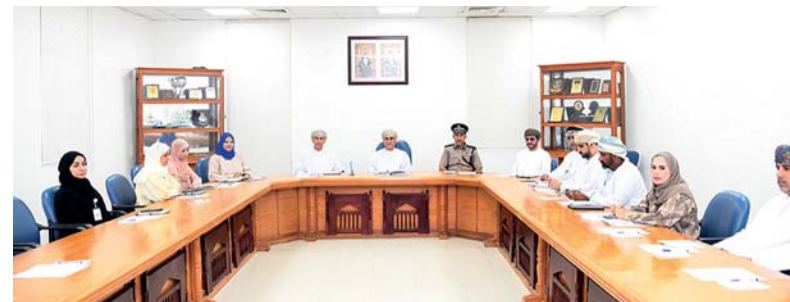
■ الاجتماع ناقش تطوير خدمات وبرامج للأشخاص ذوي الإعاقة

انطلقت أمس أعمال ندوة «متابعة تنفيذ الاستراتيجية العربية لكبار السن بين الإمكانات والتحديات»، والتي تستضيفها سلطنة عُمان ممثلة في وزارة التنمية الاجتماعية لمدة يومين، وبالشراكة مع قطاع الشؤون الاجتماعية بالأمانة الفنية لمجلس وزراء الشؤون الاجتماعية العرب بالجامعة العربية، وصندوق الأمم المتحدة للسكان، والمكتب الإقليمي للدول العربية، ومنظمة مساعدة كبار السن العالمية، ومركز الإحصاء الخليجي. وورعت افتتاح أعمال الندوة معالي الدكتورة ليلي بنت أحمد النجار وزيرة التنمية الاجتماعية، ومن جانبها قالت: أن كبار السن هم كنوز من الخبرة والحكمة، وواجبنا اليوم تجاههم توفير كل ما يلزم ليعيشوا حياة كريمة بمكانتهم، فالمجتمع الذي يحترم كبار السن ويقدرهم