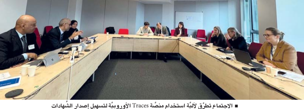
الاجتماع تطرّق لآلية استخدام منصة Traces الأوروبية لتسهيل إصدار الشهادات

بروكسل - العمانية: بحث وفد من المختصين من وزارة الثروة الزراعية والسمكية وموارد المياه مع نظرائهم من المفوضية الأوروبية في اجتماع عُقد أمس بالعاصمة البلجيكية بروكسل، إجراءات تسجيل شركات الاستزراع السمكي بين الجانبين. وناقش الجانبان استيفاء المنتجات السمكية المستزرعة العمانية لمتطلبات التصدير إلى دول الاتحاد الأوروبي، إلى جانب التعرف الجمركية على المنتجات السمكية العمانية. وتطرّق الاجتماع إلى الحديث حول آلية استخدام منصة Traces، الأوروبية، التي تسهل إصدار الشهادات الصحية البيطرية الإلكترونية لدول الاتحاد. وتأتي هذه الاجتماعات ضمن سلسلة من الخطوات التي تتخذها الوزارة لتسهيل تصدير منتجات المصانع والمزارع السمكية، ورفع مستوى مكانتها في الأسواق العالمية.