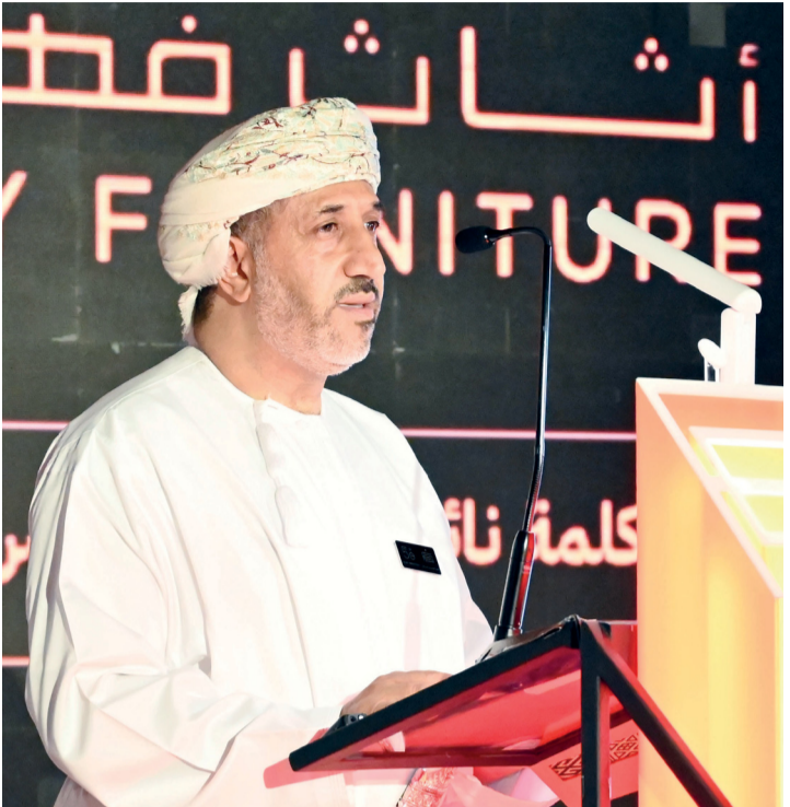
■ نائب رئيس مجلس الإدارة يلقي كلمة خلال الحفل