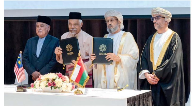
التوقيع لإنشاء مركز عُمان للبحوث والدراسات في الجامعة الإسلامية العالمية بماليزيا