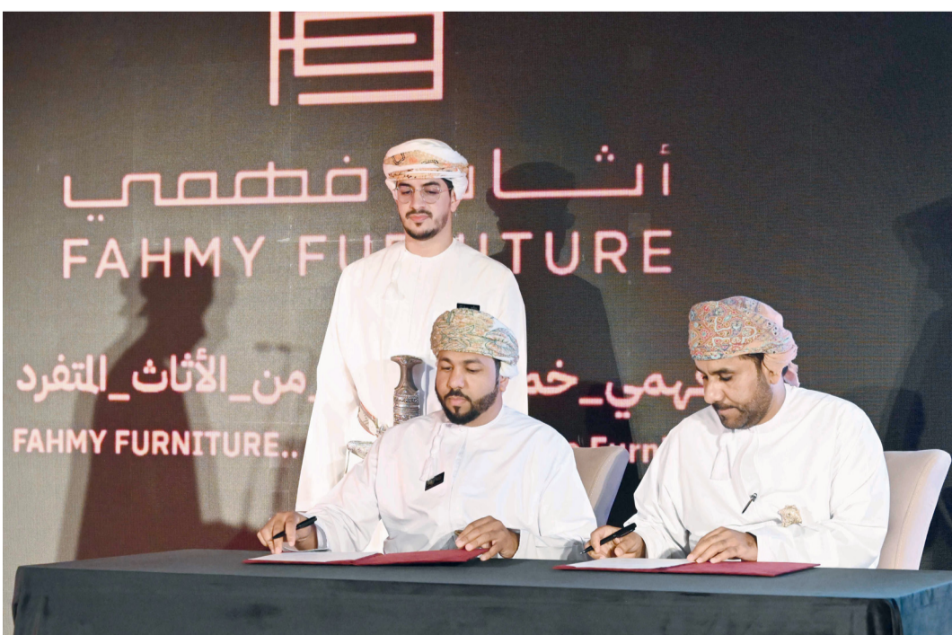
توقيع اتفاقية بين شركة أثاث فهمي وبنك الطعام العماني