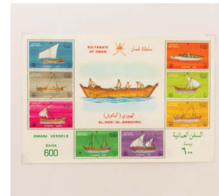
■ الطوابع البريدية تُوثّق إنجازات وأحداثاً تاريخية