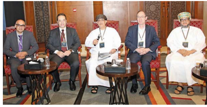
إحدى جلسات المؤتمر