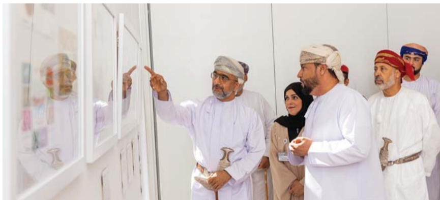
■ الطوابع المعروضة رحلة بصرية تستكشف من خلالها تاريخ وثقافة ولاية صور