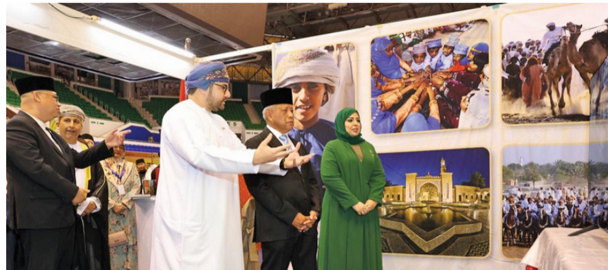
■ الفعاليّة تُعزّز المشاركة كجسر ثقافي يربط بين الشعوب