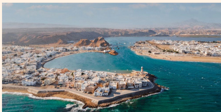
■ خطة تطويرية لمختلف القطاعات التنموية في محافظة جنوب الشرقية

من جهة أخرى تحدث سعادته عن قطاع الطرق حيث يتم استكمال مشروع ازدواجية الطريق من ولاية الكامل والوافي إلى صور (المرحلة الثانية - الجزء الثاني)، بالإضافة إلى إسناد الأعمال المنبغية من مشروع ازدواجية الطريق من دوار شركة الغاز إلى دوار بلاد صور بمحافظة جنوب الشرقية، كما يجري العمل على تصميم وتنفيذ طريق وادي بني جابر بطول ٦ كيلومترات بالمرحلة الثانية،