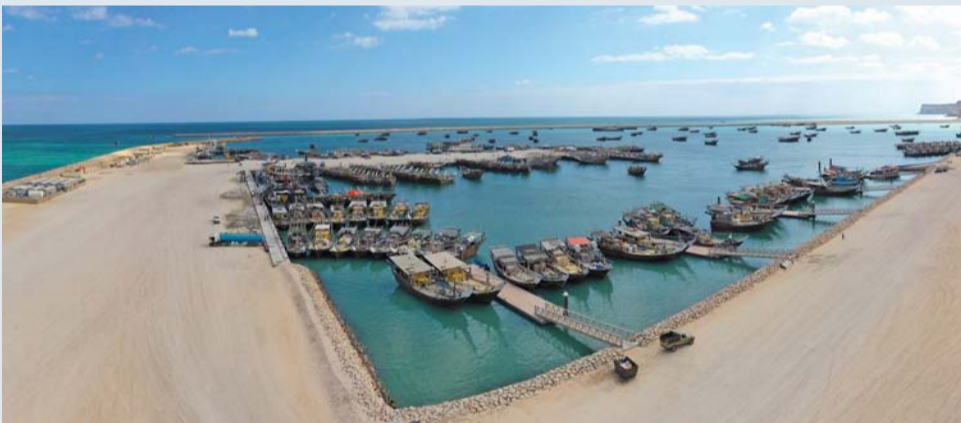
■ الهيئة تسعى إلى استخدام مشاريع الطاقة الخضراء في ميناء الصيد البحري بالدقم

مسقط. «الوطن» : طرح الهيئة العامة للمناطق الاقتصادية الخاصة والمناطق الحرة، مناقصة مشروع الأعمال التكميلية لميناء الصيد البحري بالمنطقة الاقتصادية الخاصة بالدقم وتشمل أعمال البنية الأساسية وشبكة المرافق وتشمل مناقصة الأعمال التي يمولها الصندوق السعودي للتنمية إنشاء خدمات المرافق مثل شبكات الطرق، والإشارات المرورية والعلامات الإرشادية، وإمدادات الطاقة لإنارة الطرق، وشبكات تصريف مياه الأمطار وشبكات مياه الصرف الصحي، وشبكات مياه الشرب وشبكات مكافحة الحرائق والاتصالات بميناء الصيد البحري بالدقم. ودعت الهيئة ائتلاف الشركات العمانية والسعودية ذات الخبرة إلى التقدم في المناقصة من خلال منصة المناقص الإلكتروني «إسناد» حيث تم تحديد آخر موعد لاستلام مستندات المناقصة بتاريخ ١٨ نوفمبر الجاري. ويتألف الميناء القائم حالياً الذي تبلغ مساحته نحو ٧,٥ كيلومتر مربع من كاسري أمواج بطول ٣,٣ كيلومتر، ورسيف ثابت بطول ١,٣ كيلومتر، ومزود بـ ٦ مراس عائمة ويعمق غاطس إلى ١٠ أمتار، ورسيف خاص لقوارب شرطة خفر السواحل. ويتميز موقع ميناء الصيد البحري بالدقم الذي تم تشغيل أجزاء منه بقرية من منطقة الصناعات السمكية والغذائية التي تم تخطيطها لتراعي الاحتياجات الأساسية للاستثمار في الصناعات الغذائية المستهدفة توطئتها بالمنطقة والتي تحتضن حالياً ٦ مصانع، كما تسعى الهيئة بأن يكون ميناء الصيد البحري بالدقم ميناء يستخدم مشاريع الطاقة الخضراء الصديقة للبيئة. يشار إلى أن شركة مرسى الدقم للاستثمار المشغلة للميناء وهي عبارة