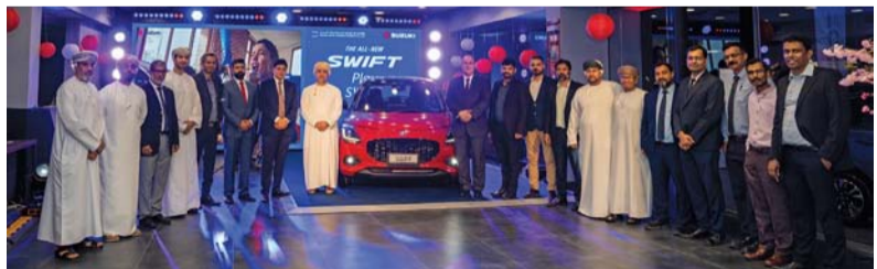
■ صورة جماعية أثناء تدشين السيارة سوزوكي الجديدة

حسن وشركاه: تمثل سوزوكي سويفت ٢٠٢٥ حقبة جديدة لسيارات سوزوكي في سلطنة عمان حيث إنها تعكس التزامنا المستمر بتقديم سيارات تتفوق في الأداء والأناقة والتكنولوجيا ونحن متحمسون لإحضار هذا الطراز إلى السوق العمانية، وعمل ثقة من عمل نقلة نوعية للسائقين كما يأتي افتتاح صالة العرض الجديدة في العذبية التزاماً بالتميز والابتكار في سلطنة عمان وتحسين تجربة العملاء من خلال إنشاء مساحة يتواصل فيها الناس مع علامة سوزوكي التجارية واستمتاعهم بخدمة ممتازة. وجاء تصميم صالة عرض سوزوكي الجديدة في العذبية لتقديم تجربة فاخرة للعملاء حيث تعرض هذه المنشأة الجديدة مجموعة كاملة من السيارات وتوفر مساحة ترحيبية للتعامل لاكتشاف السيارات وتجربة قيادتها والاستمتاع بخدمات مخصصة.