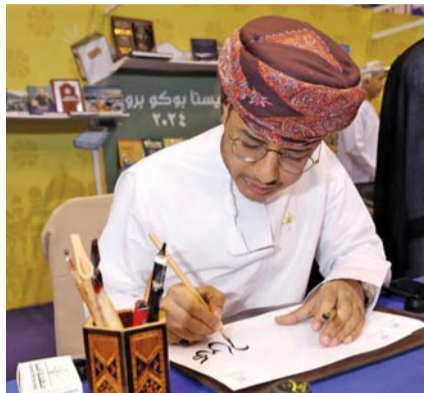
■ جناح سلطنة عُمان حظي باهتمام واسع