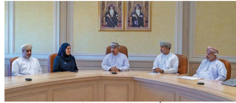
اللجنة الإشرافية أثناء اجتماعها الأول أمس

مسقط . العمانية: عقدت اللجنة الإشرافية متابعة الإعداد للرخطة الخمسية الحادية عشرة أمس اجتماعها الأول، التي تعنى برسم التوجهات الاستراتيجية وستتبنى منها خطط الجهات المعنية بالصحة. واستعرض الاجتماع الذي ترأسه معالي الدكتور هلال بن علي بن هلال السبتي وزير الصحة المنهجية المتبعة من وزارة الاقتصاد في إعداد الرخطة الخمسية الحادية عشرة، وما نُفذ من خطوات بصفتها مراحل تمهيدية لإعداد الرخطة، حيث عُقدت عدد من حلقات العمل بإشراف وزارة