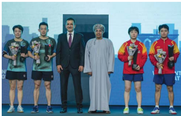
تتويج فئة الزوجي المختلط

البطولات الدولية الكبيرة سيساهم في تطور ورفع المستويات الفنية للاعبين المحليين ومن ثم التنافس على المراكز المتقدمة بهذه البطولات. وتُمن نائب رئيس الاتحاد على دور وسائل الاعلام المحلية في تغطية هذا الحدث الدولي، شاكرًا لكافة المؤسسات والشركات على دعمها ورعايتها لهذا الحدث الدولي، مختتمًا تصريحه بأن الاتحاد مقبل على استضافة دولية هامة في شهر يناير المقبل، حيث ستستقطب هذه البطولة عددا من نجوم اللعبة في سلطنة عمان، ونتطلع الى دعم ومساندة الجميع في البطولة المقبلة.