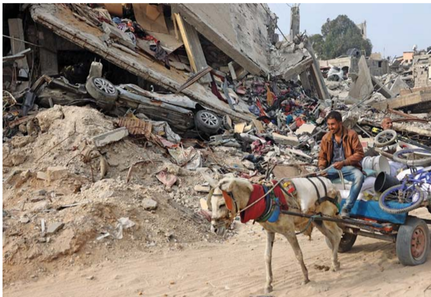
فلسطيني يركب عربة يمر بجوار مبنى مدمر، حيث تظهر متعلقات شخصية وسيارة بين الأنقاض، جراء الحرب على مدينة غزة. غزة ارتقى شهداء ومصابون في غارة جوية إسرائيلية استهدفت منزلاً لعائلة أبو العوف ونفذت طائرات الاحتلال الإسرائيلي قصفاً

وكان أمس الأول قتل جنديان من كتيبة شاكيد في لواء جفعاتي في معارك جباليا شمال قطاع غزة، وأصيب جندي في كتيبة شاكيد لواء جفعاتي، بجروح خطيرة.