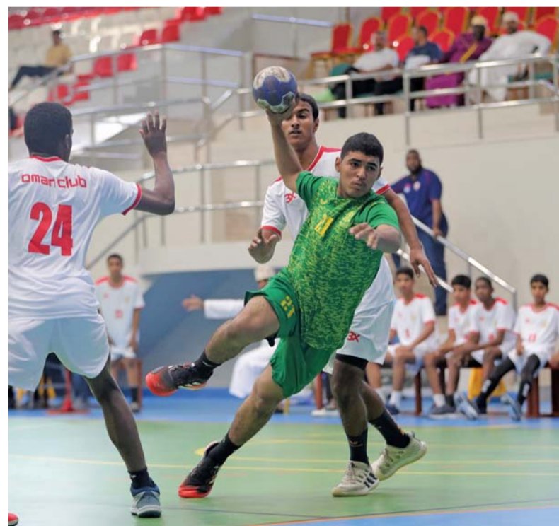
أداء مميز ومنافسة شرسة واللظة من مباراة السيب و نادي عمان

شهدت الجولة الثانية لدوري الناشئين لكرة اليد للموسم الرياضي ٢٠٢٤/٢٠٢٥ منافسات قوية، حيث حقق نادي السيب فوزه الثاني في الدوري بعد تغلبه أمس الأول في الجولة الثانية على نادي عمان ١٩/٢٨ وكان نادي السيب فاز في الجولة الأولى على نادي السويق ٦/٢٥ وفاز نادي مسقط على نادي صحم ٨/٤٢ وتغلب نادي العروبة على نادي السويق ٧/٢٦ وكانت الجولة الأولى أسفرت عن فوز نادي نزوى على نادي صحم وتفوق السيب على نادي السويق ٦/٢٥ وفوز العروبة على نادي عمان ١٣/٢٥.