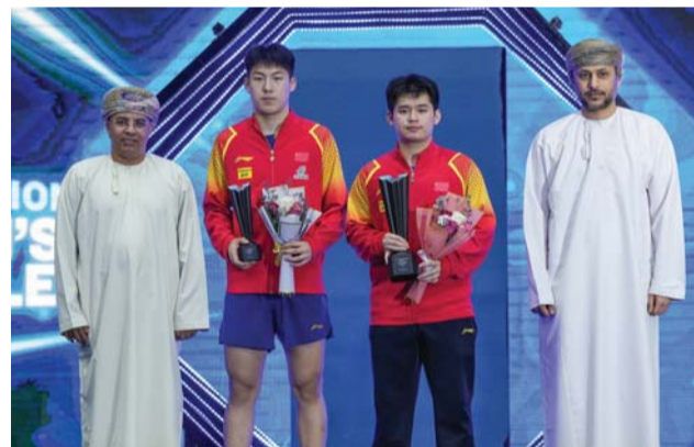
تتويج فئة فردي الرجال