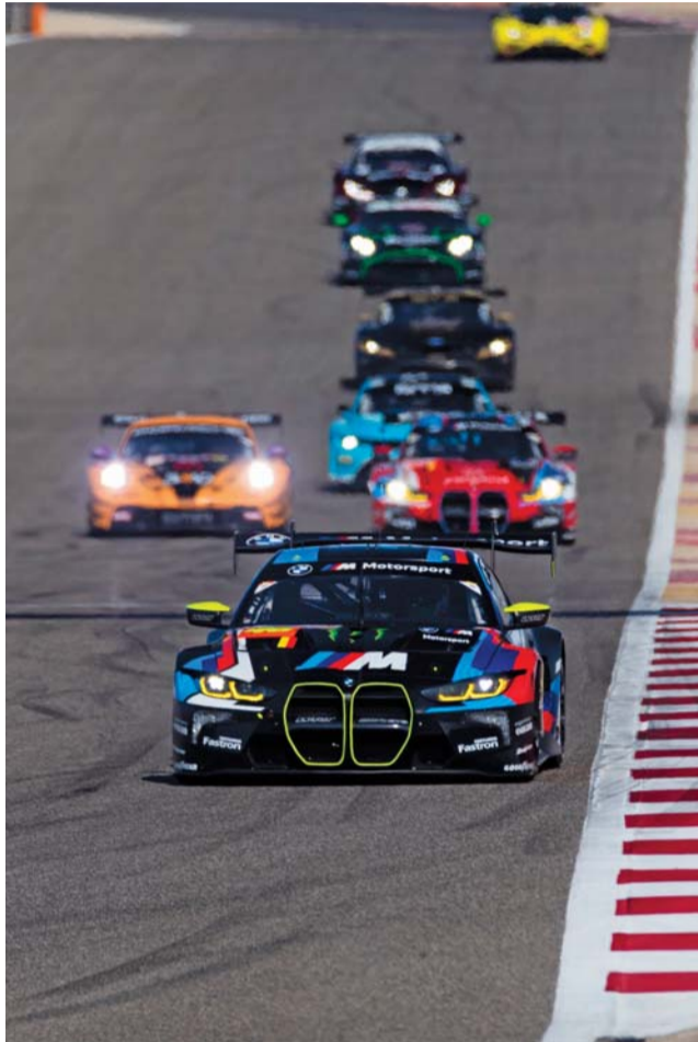
أحد سباقات البطولة

زميل الحارثي في الفريق دبلو ار تي الإيطالي فالنتينو روسي استلم المهمة عقب ذلك والذي من جانبه حاول بكل خبرته تجاوز المتسابقين من أمامه لكنه واجه صعوبة بسبب إطارات السيارة والتي لم تتجاوب مع طموحات المتسابقين، ليعود روسي بعد إكماله حدود الساعة من السباق