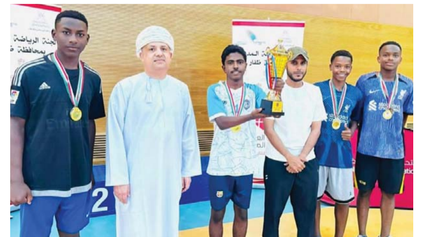
■ لحظة تتويج الفائزين بالمنافسات