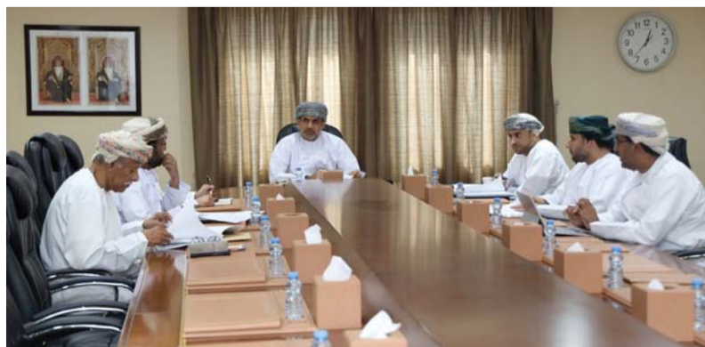
■ الاجتماع استعرض ما تم إنجازه في خطة الهيئة للعام الحالي

المبذولة من قبل كواد الهيئة بالتعاون مع الجهات ذات العلاقة باختصاص وعمل الهيئة. كما تم استعراض ما تم إنجازه في خطة الهيئة للعام الحالي ٢٠٢٤م وفق ما تم اعتماده من مبادرات وحملات إعلامية لخدمة المستهلك وارتباطها المباشر في رضا المتعاملين مع الهيئة، ورفع مؤشرات الإجابة المؤسسية بها وما تم تحقيقه من مؤشرات إحصائية كما تم مناقشة مشروع خطة الهيئة للعام المقبل. واستعرض أعضاء المجلس في الاجتماع الجهود