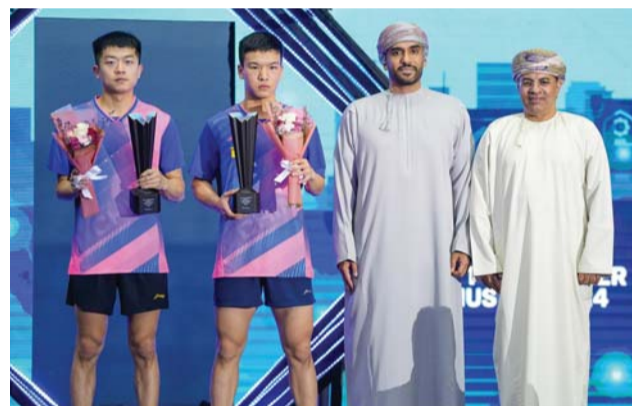
تتويج فئة زوجي الرجال