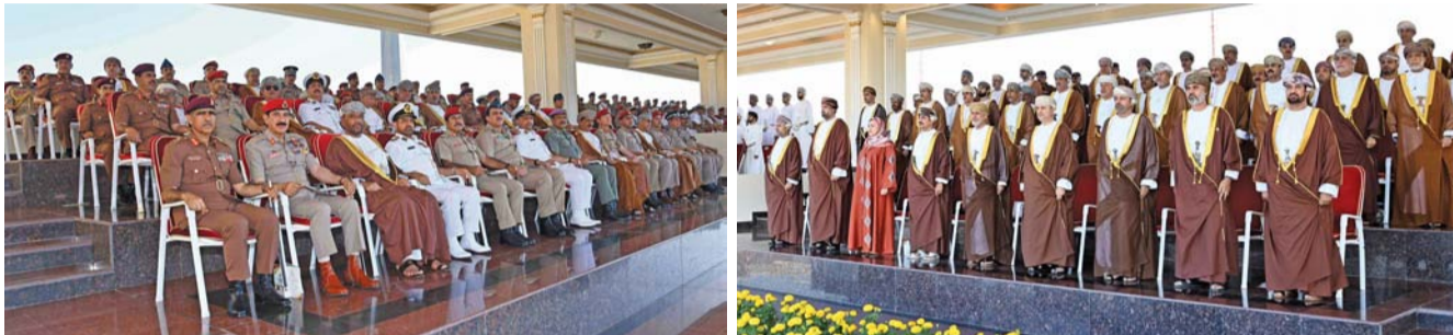
أصحاب المعالي والسعادة والمدعوون وقادة الأجهزة العسكرية والأمنية أثناء الحفل