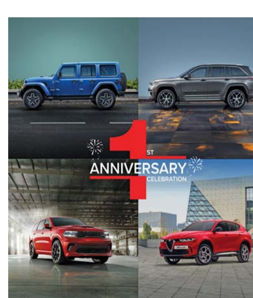
■ مجموعة متنوعة من علامة ستيلانتيس بعروض حصرية