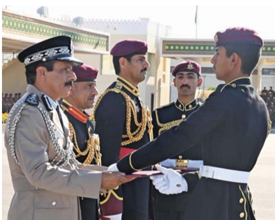
تسليم الشهادات لأوائل الخريجين

أعضاء مجلس الدولة، وعدد من أصحاب السعادة. كما حضر المناسبة عدد من كبار ضباط قوات السلطان المسلحة والحرس السلطاني العماني والجهات العسكرية والأمنية الأخرى، وعدد من المدعوين من كبار الضباط المتقاعدين من الحرس السلطاني العماني، وعدد من المحققين العسكريين للدول الشقيقة والصديقة، وجمع من ضباط وضباط صف وأفراد الحرس السلطاني العماني، وجمع من المدعوين.