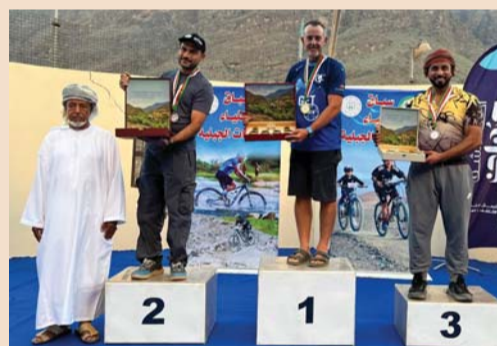
تكريم الفائزين بالسباق

والترويج لها كموقع سياحي، إلى جانب استفادة المجتمع المحلي من خلال التنظيم والمشاركة وعرض المنتجات بالإضافة إلى التشجيع على ممارسة رياضة الدراجات الجبلية وإبراز دورها المهم في تحسين الصحة الجسدية والعقلية، واستهدف السباق عدد من الفئات (فئة النخبة): للمحترفين القادرين على إكمال السباق في أقل فترة زمنية ممكنة - فئة السيدات - فئة أقل من ٢٣ سنة - فئة أكبر من ٤٠ سنة). وعلى هامش السباق أقيم عدد من الفعاليات المصاحبة من أبرزها: سباق الأطفال للدراجات الهوائية - معرض الأسر المنتجة - إقامة الفنون الشعبية. وفي نهاية السباق قام سعادة راعي المناسبة بتكريم الفائزين بالمراكز الأولى لكل فئة من فئات السباق.