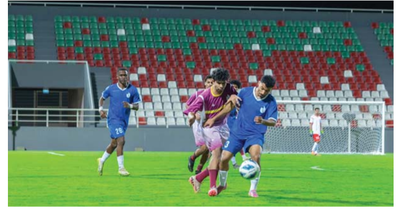
من منافسات كرة القدم