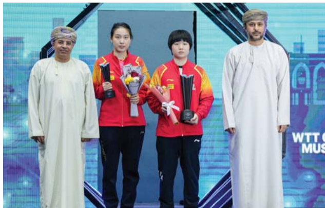
تتويج فردي السيدات