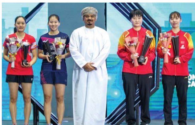
تتويج فئة زوجي السيدات