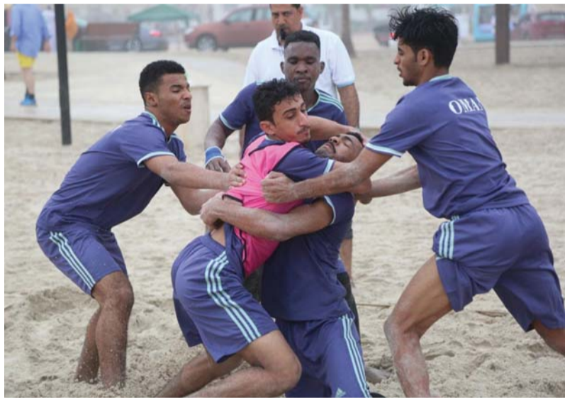
■ صورة أرشيفية من منافسات سابقة

أكدت منتخبات العراق وإيران وموريتانيا، بالإضافة إلى منتخب سلطنة عُمان مشاركتها في البطولة الودية الدولية في لعبتي الكبادي والتيك بول التي ستقام على هامش في ملتقى الرياضات والألعاب الشاطئية والبحرية بولاية بوشر، والذي ينظمه مكتب والي بوشر بالتعاون مع الشركة المنفذة للمبادرة مؤسسة التميز للفعاليات الرياضية خلال الفترة من ١٢ إلى ١٦ نوفمبر الجاري على شاطئ العذبية. وتأتي إقامة الملتقى ضمن احتفالات سلطنة عُمان بالعيد الوطني المجيد، حيث يشمل الملتقى العديد من البرامج والألعاب والرياضات التقليدية العُمانية والآسيوية منها كرة القدم وكرة الطايرة الشاطئية والكبادي والكرة الخشبية والسبكتاكراو وسباقات قوارب المتنوعة، كما يتخلل الملتقى إقامة عدد من الأنشطة المصاحبة من دورات تدريبية وتعليمية وعروض رياضية أخرى. كما تصاحب فعاليات الملتقى مسابقات شبابية، وعروض السيارات الكلاسيكية والدراجات النارية، وعروض فرق الفنون الشعبية التي تتميز بها محافظات سلطنة عمان... وتحتف حالياً اللجان العاملة بالملتقى كافة استعداداتها وتحضيراتها مع اقتراب موعد إقامة الملتقى الذي يقام لأول مرة حيث تسعى اللجنة المنظمة إلى إنجاح الملتقى؛ ليكون بشكل دائم لأنه يضيف قيمة جمالية لشاطئ العذبية ويسهم في الترويج السياحي. ﷻ