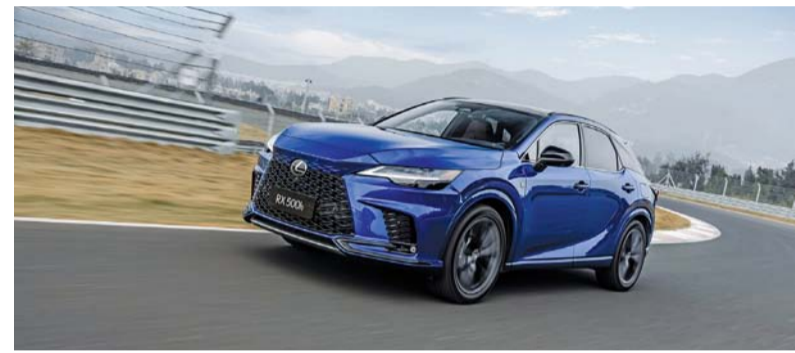
■ آر إكس تأتي بالعديد من خيارات الراحة

وتعكس سيارة آر إكس فلسفة علامة لكزس التجارية حيث تتمتيز بخيارات الراحة التي تشمل باب خلفي كهربائي مع مستشعر للقدم دون استخدام اليدين، ومساحات استشعار عند طول المطر وجهاز غسل المصابيح الأمامية والمفتاح الذكي ونظام الدخول المضاء الترحيبي واشحن هاتفك باستخدام