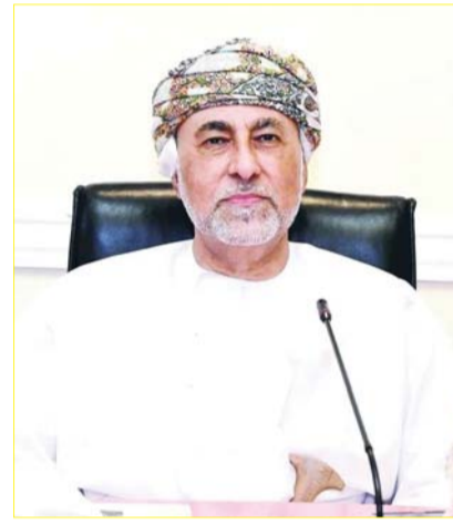
■ شهاب بن طارق

والأحداث الكروية خاصة، وذلك بعد تنظيحه الناجح للتصفيات الآسيوية السابقة وتأكيده نجاحه في تنظيم التصفيات القارية الحالية، وهو دليل على ثقة الاتحاد