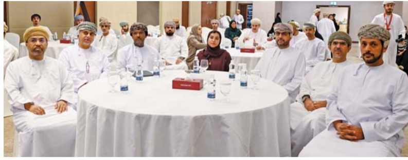
الجلسة ناقشت الحلول الممكنة لتحفيز تمويل المؤسسات الصغيرة والمتوسطة

وهدفت الجلسة الحوارية إلى زيادة قدرة المؤسسات الصغيرة والمتوسطة على الوصول إلى الخيارات التمويلية المتاحة في البنوك التجارية، بما يمكنها من التطور والنمو، وزيادة مساهمتها بشكل فاعل في الناتج المحلي الإجمالي، وذلك عبر استعراض الواقع الفعلي لتمويل المؤسسات الصغيرة