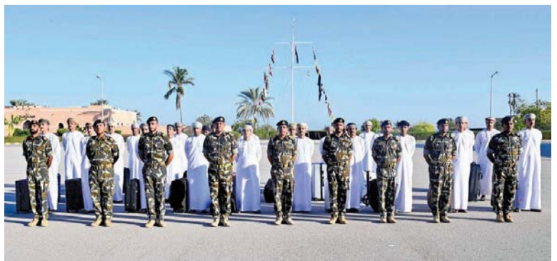
المواطنون الذين اجتازوا مراحل القبول والتقييم والاختبارات والفحوصات

مسقط. العُمانية: استقبلت البحرية السلطانية العُمانية أمس وبالتنسيق مع وزارة العمل دفعة من المواطنين ممن اجتازوا مراحل القبول والتقييم والاختبارات والفحوصات الطبية والبدنية التي أجريت لهم لبدء التدريب العسكري ليكونوا ضباطاً عسكريين. يأتي ذلك استمراراً للجهود الوطنية لقوات السلطان المسلحة في استيعاب الكفاءات الوطنية من أبناء الوطن وفقاً للخطة والبرامج الموضوعية لتوظيف الكفاءات الوطنية في أسلحة قوات السلطان المسلحة والإدارات الأخرى بوزارة الدفاع. وقد سخرت البحرية السلطانية العُمانية كافة خبراتها وإمكاناتها من القوى البشرية المتخصصة والمتخصصة والمتطلبات الإدارية والصحية بما يوفر البيئة المناسبة لتحقيق سرعة تنفيذ إجراءات الالتحاق بالخدمة العسكرية، والانضمام إلى ميادين الواجب الوطني للإسهام في خدمة هذا الوطن الأبي وقائه الغد لحضرة صاحب الجلالة السلطان هيثم بن طارق المعظم القائد الأعلى. حفظه الله ورعاه.