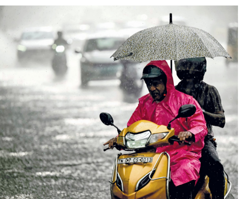
راكبا دراجة نارية على طول أحد الشوارع أثناء هطول الأمطار في تشيهاي بالهند.

بكين - العُمانية: أجلت سلطات مقاطعة تشجيانج في شرق الصين نحو ٢٨٢ ألف شخص، قبيل وصول الإعصار «كونج-ري» الذي يتوقع أن يصل مصحوباً برياح قوية وأمطار غزيرة ومخاطر مرتفعة لحدوث فيضانات في المقاطعة. وذكرت وكالة أنباء الصين الجديدة «شينخوا» أن عملية الإجلاء واسعة النطاق جاءت مع اقتراب الإعصار من السواحل الشرقية للبحر الرئيسي الصيني. وفي الوقت نفسه، عُلق تشغيل جميع الخطوط ١٥٢٢ لنقل الركاب عبر العبارات بما يشمل ٣٤٧ سفينة، بينما توقفت أعمال البناء لـ ١٣٦ مشروعاً متعلقاً بالبنية التحتية، ونقلت ٦٧٥ سفينة بناء إلى