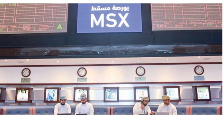
■ إدراج أوكيو للاستكشاف والإنتاج انعكس على القيمة السوقية الإجمالية لبورصة مسقط

■ معرض سوق السفر العالمي ٢٠٢٤ سيتناول آخر المستجدات في قطاع السياحة العالمي