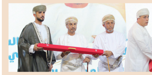
أثناء توزيع هدايا التذكارية

أقيم يوم الجمعة ١ نوفمبر عرس الخويرات الجماعي السابع عشر والذي تخلله العديد من الفقرات المصاحبة مع حضور كبير من أبناء الخويرات والأهالي