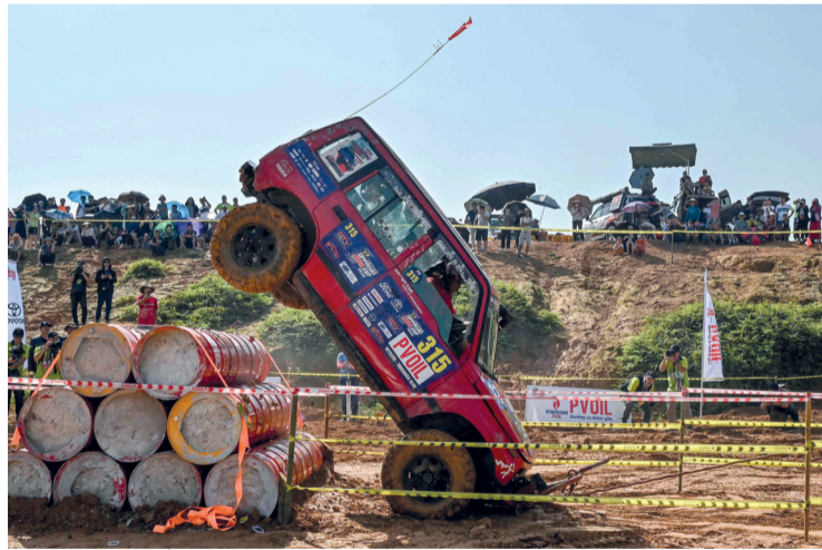
أحد المنافسين يقود سيارته فوق عقبة على المسار خلال كأس فيتنام للطرق الوعرة ٢٠٢٤ في هانوي.