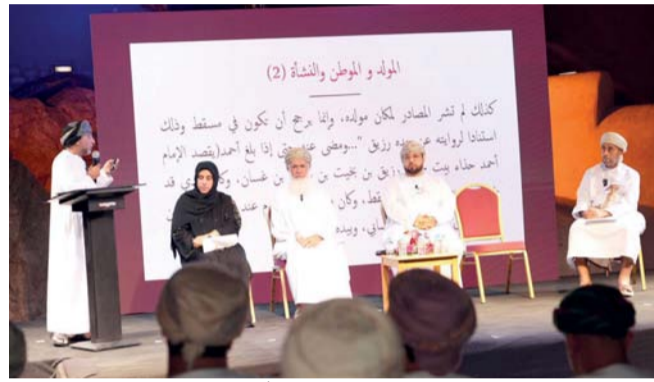
المشاركين في الندوة

المبدعين في مختلف مجالات الإبداع. وأضاف: تؤكد التجربة الثقافية العمانية حضوراً قوياً في الساحات الدولية، وخصوصاً في منظمة اليونسكو، حيث تمثل دليلاً ساطعاً على عمق حضارتها وهويتها الفريدة، فضلاً عن القيمة الحقيقية لشعبها المبدع عبر العصور. وقد تجلّى هذا من خلال إدراج مجموعة من عناصر الثقافة العمانية في قوائم اليونسكو المتنوعة، والمشاركة العمانية الفعالة في لجان المنظمة