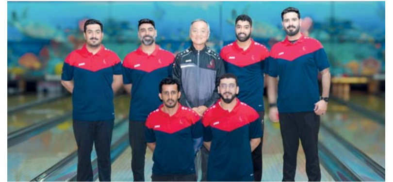
منتخبنا الوطني للبولنج

🏆 يبدأ اليوم منتخبنا الوطني للبولنج مشواره في منافسات البطولة العربية الحادية عشرة؛ لمنتخبات الرجال والسابعة لمنتخبات السيدات والتي تستضيفها العاصمة المصرية القاهرة حتى يوم ١٠ من الشهر الحالي بمشاركة عشرة منتخبات عربية أكدت مشاركتها في منافسات هذه البطولة، وافتتحت يوم أمس رسمياً منافسات البطولة من خلال حفل الافتتاح الرسمي الذي أقيم بالمركز الدولي للبولنج الذي سيستضيف أحداث البطولة. 🏆