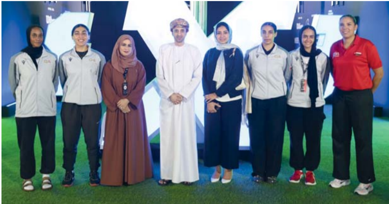
من لقاء سفير السلطنة في البحرين ببعثة نادي مسقط

اختتم سباق القدرة والتحمل التأهيلي الدولي لمسافة ١٢٠ كم + ١٠٠ كم، والذي نظمه الاتحاد العماني للفروسية والسباق وبإشراف الاتحاد الدولي للفروسية وذلك على قرية المحامد للقدرة والتحمل بولاية بركاء. واشتمل السباق على سباقين تأهيليين لمسافة ٨٠ كم و ٤٠ كم، حيث وصل عدد المشاركين إلى ١٠٥ خيول منها ٥ خيول في السباق الدولي لمسافة ١٢٠ كم و ٣٨ خيلاً في السباق الدولي لمسافة ١٠٠ كم، و ٣٠ خيلاً في السباق التأهيلي لمسافة ٨٠ كم و ٢٢ خيلاً في السباق التأهيلي لمسافة ٤٠ كم، حيث تأهل ٦٧ خيلاً، في مختلف السباقات ٤ خيول لمسافة ١٢٠ كم دولي و ٢٧ خيلاً لمسافة ١٠٠ كم دولي، و ١٣ خيلاً لمسافة ٨٠ كم تأهيلي، إضافة إلى ٢٣ خيلاً لمسافة ٤٠ كم تأهيلي.