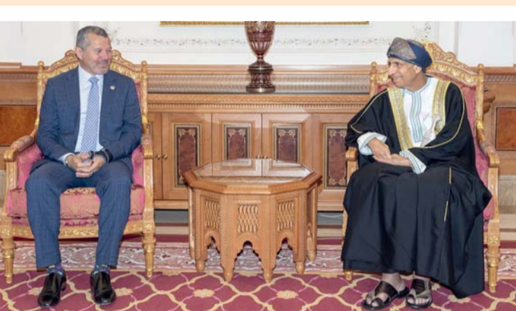
■ فهد بن محمود أثناء استقباله أرسيديو دومينجيز

■ البحرية الدولية تحتفل بالذكرى المئوية لتأسيس مدفعية سلطان عمان