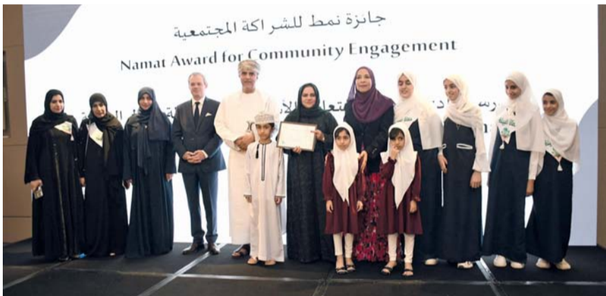
المسابقة تُنفذ سنوياً لطلبة المدارس في الصفوف (٥-١٢) من مختلف المدارس الحكومية بالمديريات التعليمية

تنفذ المسابقة سنوياً لطلبة المدارس الصفوف (٥-١٢) من مختلف المدارس الحكومية بالمديريات التعليمية بمحافظات سلطنة عُمان، من خلال تقديم عدد من المبادرات المتميزة في مجالات الاستدامة في الحفاظ على البيئة، وقد استقطبت هذه المسابقة في نسختها الرابعة (١٦٤) مدرسة حكومية، وتأهل منها (١٤٤) مدرسة، وقد حازت (٣) مدارس على المراكز الأولى لمشاريعها المتميزة في مجال الاستدامة، وذلك بعد عملية تقييم شاملة تكونت من ثلاث مراحل.