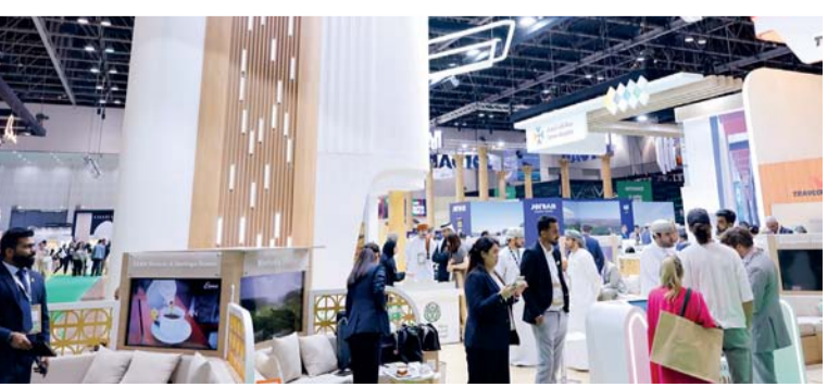
■ معرض سوق السفر العالمي ٢٠٢٤ سيتناول آخر المستجدات في قطاع السياحة العالمي