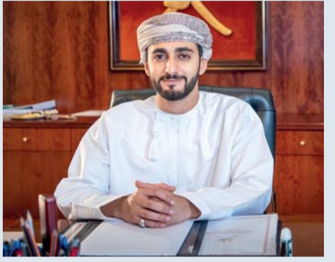
■ ذي يزن آل سعيد

مسقط . العُمانية: يرعى صاحب السمو السيد ذي يزن آل سعيد وزير الثقافة والرياضة والشباب غداً الافتتاح الاجتماع السنوي لصناديق الثروة السيادية الذي تستضيفه سلطنة عُمان ممثلة بـ جهاز الاستثمار العُماني، وبشراكة فيه رؤساء وأعضاء أكثر من خمسين صندوقاً سيادياً بأحاء العالم من ست وأربعين دولة. وسيشارك في المؤتمر المصاحب للاجتماع الذي يعد الأكبر في تاريخ المنتدى منذ تأسيسه في عام ٢٠٠٩م نخبة من أبرز المتحدثين على المستويين العالمي والإقليمي، منهم إيلون ماسك الرئيس التنفيذي لشركة سبب إسكس وتيسلا الذي سيشترك بصورة افتراضية (عن بُعد)، إلى جانب روبرت سميث رجل أعمال أميركي، وأنطونيو كراسيس الرئيس التنفيذي لشركة فالور، ويان يو المستشار القانوني في صندوق النقد الدولي. وسيتخلل المؤتمر المصاحب للاجتماع استعراض أحدث الموضوعات المتعلقة بالتغيرات العالمية في قطاع الاستثمار، مثل: تحول الطاقة والذكاء الاصطناعي وسلاسل الإمداد والحكومة، إضافة إلى البُعد الاجتماعي في توجيه هذه الاستثمارات. كما يعد الاجتماع فرصة للاجتماع مع كبار التنفيذيين من مختلف صناديق الثروة السيادية لمناقشة أبرز القضايا العالمية المعاصرة وتبادل وجهات النظر حول موضوعات استثمارية واقتصادية مختلفة والحديث حول التحديات التي تواجه صناديق الثروة السيادية. جدير بالذكر أن المنتدى الدولي لصناديق الثروة السيادية الذي حصل جهاز الاستثمار العُماني على عضوية كاملة فيه في عام ٢٠١٥م يتجاوز حجم ثروات أعضائه ٨ تريليونات دولار، وهو ما يمثل ٨٠ بالمائة من أصول جميع صناديق الثروة السيادية في العالم.