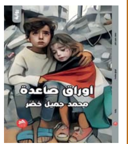
■ غلاف الرواية

عُمان. العمانيّة: يستلهم الكاتب الأردني محمد جميل خضر في روايته (أوراق صاعدة)، أحداث الراهن العربي، وبخاصة بعد (طوفان الأقصى)، معانيها الواقعية الحياتي في قطاع غزة، عبر رصد حيوات شخصيات ومآلات أيامهم. يقول جهاد أبو حشيش، مدير دار (فضاءات)، ناشر الرواية: (ترصد الرواية حيوات ومصائر ثلاث شخصيات رئيسية يربط بينها أُناس من غزة، مثل عائلة بلورات أصلها من خان يونس، عُمان مهندس معماري أصله من رفح، ونجوى أصلها من غزة. في لحظة فارقة يشاهد ثلاثتهم أوراق شجر تصعد نحو السماء، مدوّناً