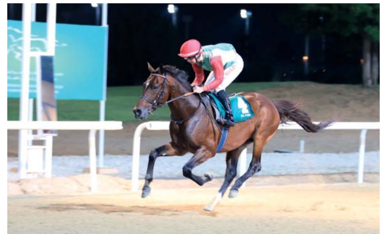
الحصان وسام في منافسة شرسة بشوط التكافؤ