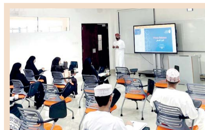
■ حلقة العمل تهدف إلى تعريف الطلبة بالبيان الصحفي وأهميته وعناصره

تألفت الأوركسترا الأوروبية الفيلهارمونية بقيادة فولتر بروسست، فكانت رحلة موسيقية رائعة للجمهور شكّلت تجربة استثنائية، عكست عمق وقوة الإبداع الفني لنشأت خان المعروف في جميع