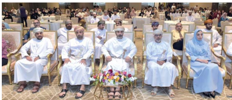
المؤتمر أكد أهمية تقديم خدمات تأهيلية متكاملة وشاملة