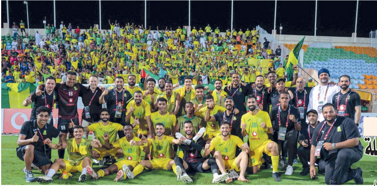
لقطة جماعية للاعب السيب والجهاز الفني والإداري وفرحة التأهل