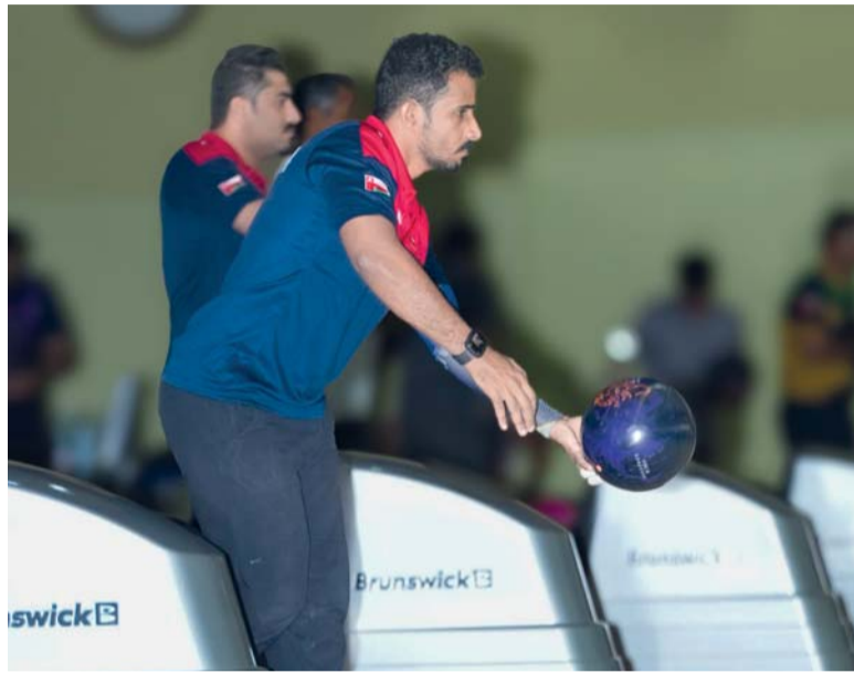
من تدريبات منتخبنا استعدادا للبطولة

ونظرا لتعذر اعلان المنفذ ضده بالطرق العادية وعليه يعتبر هذا النشر اعلانا له متضمنا تكليفه بالوفاء بما هو مطلوب منه أعلاه خلال سبعة ايام من تاريخ هذا النشر، عملا بنص المادتين (١١) و(٣٥٦) من قانون الإجراءات المدنية والتجارية. أمانة سر المحكمة