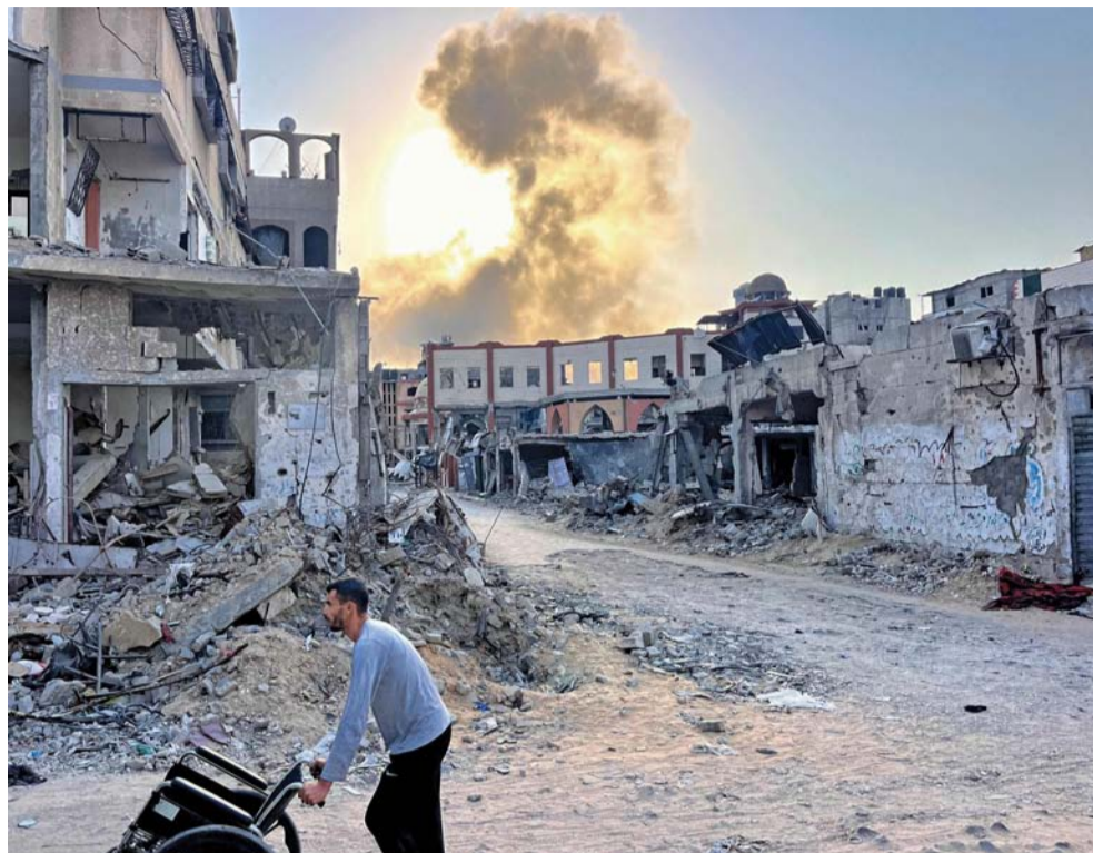
دخان يتصاعد جراء القصف الإسرائيلي على بيت لاهيا في شمال قطاع غزة.

القدس المحتلة. «الوطن». وكالات: واصلت الطائرات الإسرائيلية قصفها لمختلف مناطق قطاع غزة مخلفة أعدادا كبيرة من الشهداء والجرحى، حيث ارتكب الاحتلال الإسرائيلي ثلاث مجازر ضد العائلات في قطاع غزة وصل منها للمشافي عشرات الشهداء والجرحى. وارتفعت حصيلة العدوان الإسرائيلي إلى (٤٣٢٥٩) شهيدا (١٠١٨٢٧) مصابا منذ السابع من أكتوبر الماضي، وواصل جيش الاحتلال عملياته العسكرية الدورية لليوم ٢٨ بجبالا وبيت لاهيا. وارتكب الاحتلال مجزرتين دامتت خلال ٢٤ ساعة في مخيم جباليا بحق عائلتي الغندور وشلايل أدتا إلى استشهاد ٨٤ فلسطينيا دون ناجين في المنزلين المكونين من عدة طبقات. وارتقى ثلاثة باستهداف مجموعة من الفلسطينيين بمنطقة مشروع بيت لاهيا شمال قطاع غزة. وارتقى ثلاثة شهداء جراء قصف قرب نقابة العمال في حي الصفاوي شمال مدينة غزة، وهم عمر