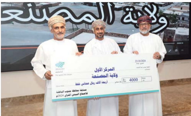
تكريم الفريق الفائز بالمركز الأول

المتميز في تنفيذ البرامج البيئية وتحسين مستوى الإصحاح العام في الولاية، وحصلت ولاية الرستاق على المركز الثاني نظير جهودها الشاملة في الحد من مصادر التلوث، ونالت ولاية بركاء المركز الثالث بفضل حملات التوعية المجتمعية التي أطلقتها لتعزيز النظافة العامة ومكافحة ناقل الأمراض، كما تم تكريم الداعمين والمنظمين الذين كان لهم دور كبير في نجاح الحملة.