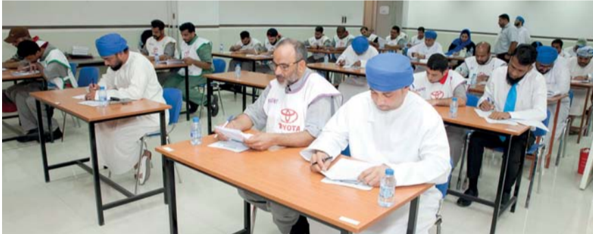
محترفو الخدمة الموهوبون في مسابقة المهارات الوطنية