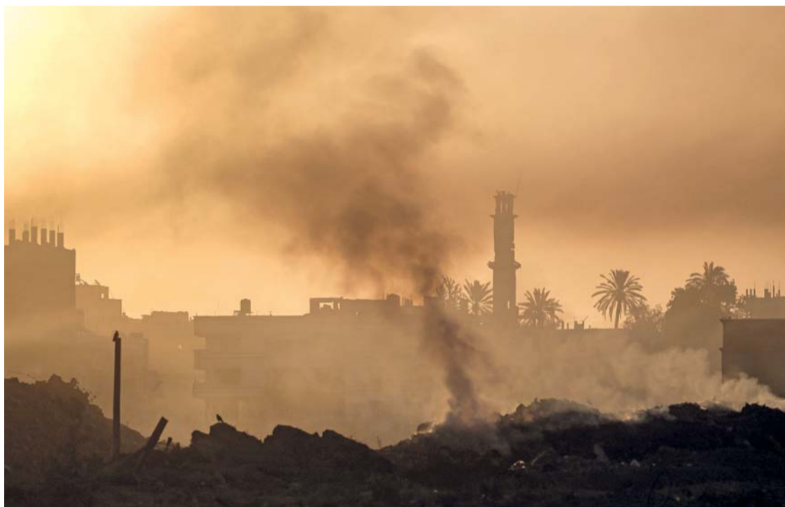
الدخان يتصاعد قرب مسجد تضرر جراء العدوان الإسرائيلي على دير البلح وسط قطاع غزة.

وأوضحت، أنه وفقاً للتقارير فإن معظم المواد الغذائية نفدت ولا توجد كميات كافية من المياه الصالحة للشرب إضافة إلى نقص الوقود، والبحث للمقاة في الشوارع، في ظل عدم إمكانية الوصول إلى الخدمات والرعاية الطبية اللازمة، والمستشفيات الثلاثة