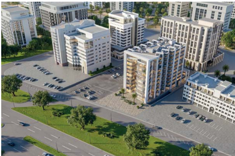
مشروع «برج ملاك» بأحدث أنماط التصميم وأعلى معايير الجودة

وأعلى معايير الجودة بهدف السعي إلى لعب دور تكاملي في تحفيز النمو الاقتصادي والتنمية داخل سلطنة عمان، من خلال جذب الأعمال وتقديم الخدمات الأساسية. ومن المتوقع أن يوفر المشروع فرص أعمال متنوعة، وينشط الاقتصاد المحلي، ويعزز جودة تجربة العمل بشكل عام. ويعتبر «برج ملاك» شاهداً على التميز المعماري العماني، ويعمل كجسر للأعمال والرؤى الطموحة للمستثمرين الراغبين في تأسيس وجودهم في موقع متميز. ومن المقرر أن يصبح «برج ملاك» محورا للتعاون وريادة الأعمال والتحديث، مما يعهد الطريق لمزيد من التطورات في المنطقة.