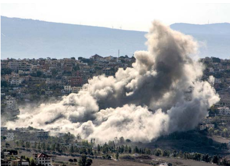
سحب الدخان تتصاعد في أعقاب غارة جوية إسرائيلية على قرية الخيام في جنوب لبنان أمس.

المدينة فور صدور التحذير الإسرائيلي. في غضون ذلك قال الجيش الإسرائيلي في بيان إنه اعترض طائرتين مسيرتين أطلقتا من الشرق، تجاه إيلات. وأعلنت فصائل عراقية أنها استهدفت فجر أمس هدفاً حيوياً في إيلات بواسطة الطيران المسيّر. وشدد البيان على استمرار الفصائل في شنّ عمليات على إسرائيل «بوتيرة متصاعدة».