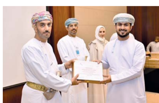
تكريم إحدى المدارس الفائزة

مدرسة ليما للتعليم بتعليمية محافظة مسندم في كلمة المدارس الجيدة: لقد أسهم المشروع في تمكين الطلبة بحمل المسؤولية من أجل الوطن، والمساهمة في خدمته، وتطوره، وإزدهاره باستخدام أسلوب البحث العلمي الذي يركز على الملاحظة، واستطلاع الرأي، وتنفيذ جلسات العصف الذهني، واستخدام أسلوب حل المشكلات، والتخطيط، والعمل بروح الفريق، وتوزيع المهام، والتنفيذ، والمتابعة، والتقييم، والتطوير، والنسحين. وقد قسمت المدارس المشاركة إلى (٣) مستويات، حيث جاء في المستوى الأول كل من: مدرسة ليما للتعليم الأساسي (١٢.١) بتعليمية محافظة مسندم بمشروع البحث عن عمل بين الواقع والمأمول، ومدرسة هالة بنت خويلد (١٢.٩) بتعليمية محافظة جنوب