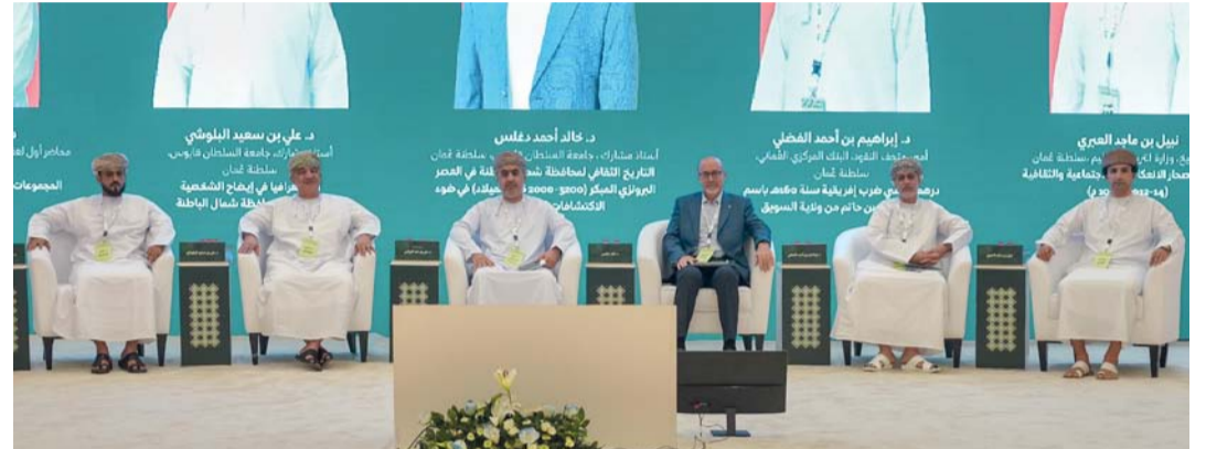
المشاركين في الجلسة الأولى