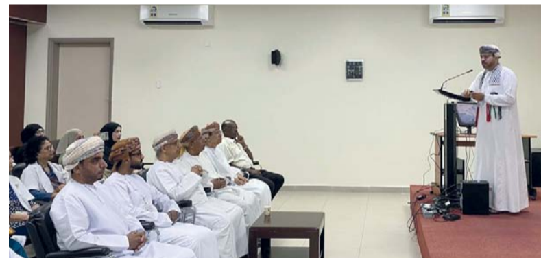
القاضي أشاد بصبر أهالي القطاع في التعامل مع الوضع الكارثي

بمستشفى السلطان قابوس بصلالة. في البداية تحدّث الدكتور عن بواكير فكرة المشاركة في تقديم العلاج لضحايا العدوان الإسرائيلي بقطاع غزة والتي أرجعها إلى مبادرة ابنه وصديقته في التعريف بالحرب الغاشمة ونشرها عنها في النوازل الاجتماعية. بالإضافة إلى مراسلاته مع زملائه الأطباء الأردنيين القريبين من الحدث.