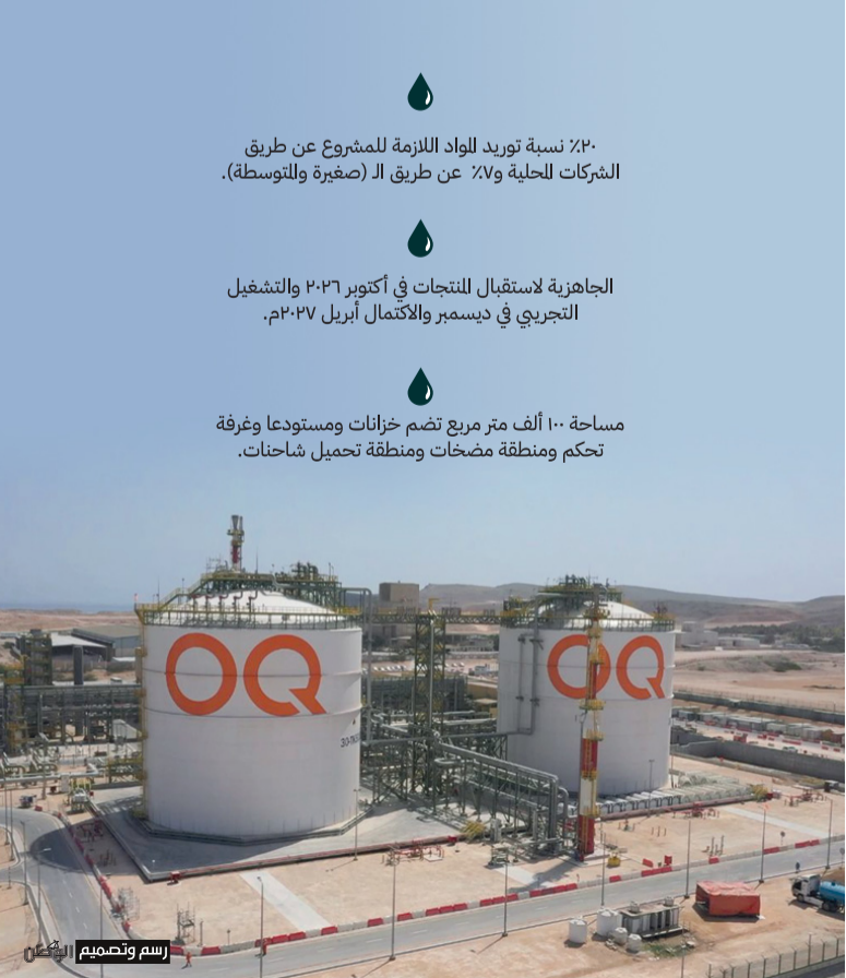
رسم وتصميم: الوطن

بأى مشروع خزانات الوقود الذي تغذيه (أوكيو) في ولاية بغاء بمحافظة مسندم لتوفير احتياجات المحافظة من المشتقات النفطية، وضمان تلبية احتياجاتها في حالات الطوارئ، ومن ثم يوفر متطلبات المواطنين والقيمين من المنتجات النفطية المختلفة.