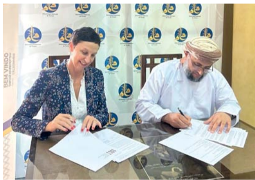
تعزيز قطاع النشر والهوية الثقافية

تونس. العُمانية: انضمت وزارة الإعلام - ممثلة في المديرية العامة للمطبوعات والمصنفات الفنية - إلى شبكة الأرقام الدولية للدوريات خلال مشاركتها في الاجتماع السنوي لشبكة الوكالة الدولية للرقم المعياري الدولي (ISSN) بالعاصمة التونسية. وتهدف الوزارة بانضمامها للشبكة إلى تعزيز قطاع النشر والهوية الثقافية على الساحة الدولية، والاطلاع على التجارب العالمية في استخدام الرقم المعياري الدولي (ISSN) لدعم التسويق والانتشار للمطبوعات الدورية التي تصدر عن سلطنة عُمان.