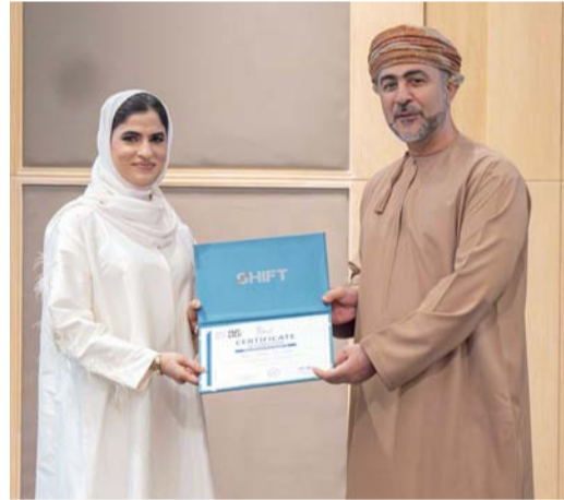
راعي الاحتفالية يكرم إحدى الخريجات

احتفلت الشركة العمانية للتنمية السياحية (مجموعة عمران) بتخريج الدفعة الأولى من برنامجي إعداد القادة «SHIFT» و«GFT»، والبالغ عددهم ٦٧ موظفاً، وذلك في إطار التزامها بتطوير الكفاءات الوطنية والمساهمة في إثراء مستقبل قطاع السياحة في سلطنة عُمان.