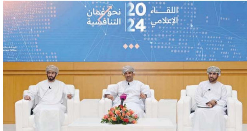
سلطنة عمان حققت قفزات في مؤشرات مهمة تلامس أغلبها مسار مستهدفات رؤية عمان ٢٠٤٠

وسلط اللقاء الضوء على ما تم تحقيقه من تقدم حتى الآن في تحسين عدد من المؤشرات الدولية والخطوات القادمة لتعزيز تواجد سلطنة عمان على خارطة التنافسية الدولية ومنها دراسة الانضمام إلى المعهد الدولي للتنمية الإدارية IMD والاستعداد خلال العام المقبل ٢٠٢٥ لادراج سلطنة عمان في مؤشر جاهزية الأعمال الصادر عن البنك الدولي والذي يعد من أهم المؤشرات العالمية التي تقدم منظوراً واسعاً لتقدم جهود الحكومات في دعم وتوسعة أنشطة القطاع الخاص ورفع مساهمتها في النمو المستدام. وأكد معالي الدكتور سعيد بن محمد الصقري وزير الاقتصاد أن اللقاء الإعلامي حول تنافسية سلطنة عمان في المؤشرات الدولية يأتي ضمن نهج وزارة الاقتصاد