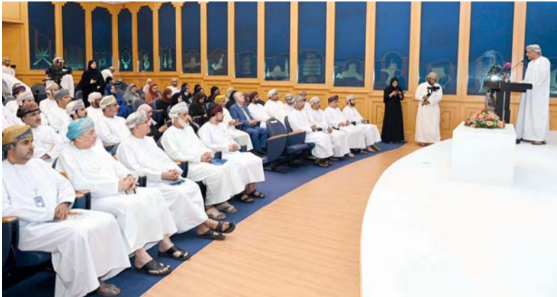
سلطنة عمان حققت قفزات في مؤشرات مهمة تلامس أغلبها مسار مستهدفات رؤية عمان ٢٠٤٠

الهادف إلى تعزيز التواصل مع الخبراء ووسائل الإعلام وكافة المهتمين بالشأن الاقتصادي، وهو فرصة لتسليط الضوء على الجهود المبذولة بشكل أكثر تعمقاً حول الملفات النوعية المحددة ضمن اختصاصات الوزارة ويتيح فسحة من الحوار إزاءها، ومعرفة آفاقها، والتعرف على خطط الوزارة في كل من هذه الملفات. وأشار معالي إلى أن وزارة الاقتصاد تدشن لقاءاتها الإعلامية المتخصصة باللقاء حول ملف