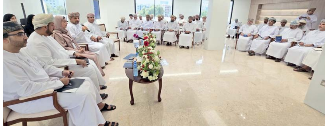
الجلسة ناقشت التحديات التي تواجه أصحاب المؤسسات الصغيرة والمتوسطة في منظومة الأمن الغذائي والسياسات والتشريعات الداعمة للقطاع.

نظمت هيئة تنمية المؤسسات الصغيرة والمتوسطة أمس الجلسة الحوارية الثانية بعنوان «آفاق المؤسسات الصغيرة والمتوسطة في مجال الأمن الغذائي» ضمن السلسلة الثانية من سلسلة الجلسات الحوارية وذلك بحضور معالي الدكتور سعود بن حمود الحبسي وزير الثروة الزراعية وسعادة حليمة بنت راشد الزعيرة رئيسة الهيئة وسعادة المهندس بدر بن سالم المعمرى الأمين العام لمجلس المناقصات وحسين بن علي بن إبراهيم اللواتي الرئيس التنفيذي لبك التنمية الغماني وبمشاركة عدد من أصحاب المؤسسات الصغيرة والمتوسطة المختصين في أنشطة الأمن الغذائي والأنشطة المرتبطة بها. وتعدّ الجلسات مساحة ومنصة تفاعلية مستمرة مع أصحاب المؤسسات الصغيرة والمتوسطة والتي تعتمد على الرصد والاستماع إلى آراء المستفيدين حول جودة الخدمات المقدمة لهم وتذليل التحديات والمعوقات التي قد تواجههم في هذا المجال. وقال معالي الدكتور سعود