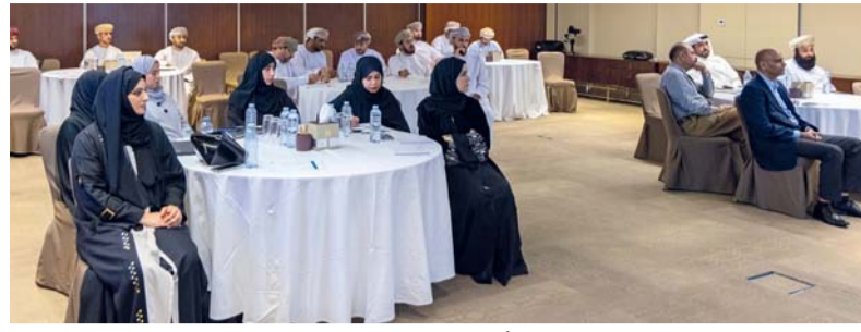
البطاقة الخضراء تُسهم في تعزيز قيم ترشيد استهلاك المياه