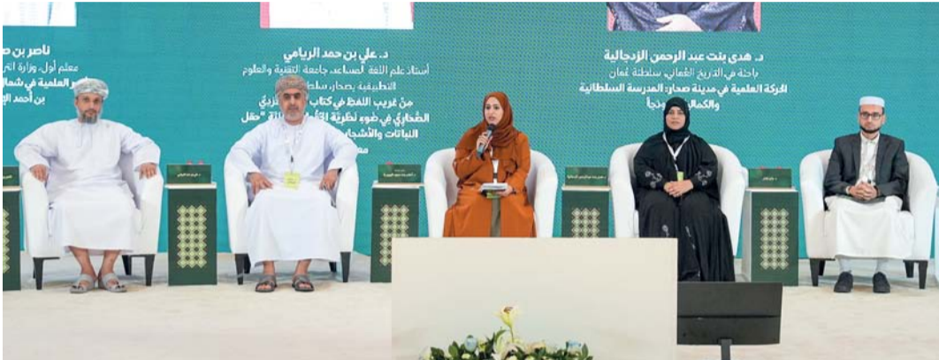
المشاركين في الجلسة الثانية