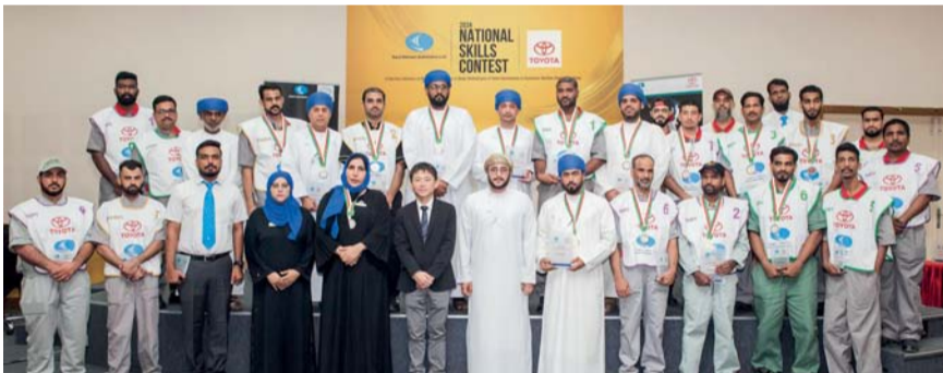
تكريم الفائزين في مسابقة المهارات الوطنية

أعلنت شركة سعود بهوان للسيارات مؤخراً عن الانتهاء بنجاح من مسابقة المهارات الوطنية لخدمة تويوتا وهو حدث مرموق تم تصميمه لتكريم ومكافأة موظفي الخدمة المتميزين في تويوتا بسلطنة عُمان الذين يظهرون مهارات وتفانياً استثنائيين. وتسلط هذه المسابقة السنوية الضوء على موهبة وخبرة موظفي خدمة تويوتا الفنية، وعلى شغفهم بالحفاظ على أعلى معايير رعاية العملاء.