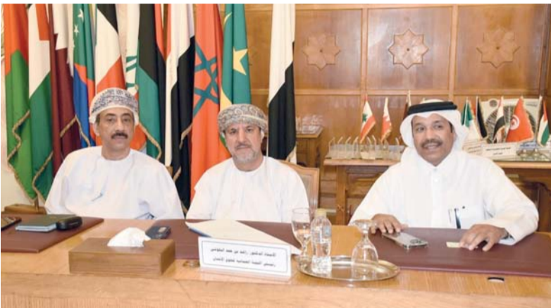
وقد سلطنة عُمان المشارك في الاجتماع

وقد ألقى ممثل دولة قطر بيان التقرير الذي احتوى على جملة من الموضوعات حول غايات تنفيذ الميثاق، والملاحظات الشكلية، كذلك تفاصيل موضوعات عدد من الحقوق، إضافة إلى الردود والتعليقات على الاستيضاحات التي تمت خلال الجلسات.