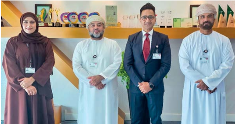
الجائزة تعكس التزام بنك مسقط بتبني الابتكارات التكنولوجية

وتتضمن أهم الإنجازات على المستوى التنظيمي للمكتب بناء لوحة بيانات المؤشرات الدولية والعمل على تشكيل فرق وطنية أو الانضمام لفرق تحسينية لعدد من المؤشرات الدولية، والانتهاج من الدليل الاسترشادي لحوكمة العمل بالمؤشرات الدولية، وذلك بالتعاون مع وحدة متابعة تنفيذ رؤية عمان ٢٠٤٠. وأشار المكتب الوطني للتنافسية إلى أن العمل يتم حالياً على تحسين ١٤ مؤشراً يتابعها المكتب من خلال ٤ فرق وطنية تم تشكيلها لمتابعة وتحسين هذه المؤشرات، وتتضمن أهم المؤشرات والتقارير الدولية التي تتناول سلطنة عمان ويتابعها المكتب تقرير مستقبل النمو الصادر عن المختدى الاقتصادي العالمي، ومؤشر الابتكار العالمي الصادر عن المنظمة العالمية للملكية الفكرية ومؤشرات الحوكمة العالمية الصادرة عن البنك الدولي، ومؤشر الأداء البيئي الصادر عن جامعتي ييل وكولومبيا، ومؤشر مدركات الفساد الصادر عن منظمة الشفافية العالمية ومؤشر جاهزية الشبكات الصادر عن معهد بورتلانز، ومؤشر الحرية الاقتصادية الصادر عن هيرتاج فانديشن إضافة إلى عدد آخر من المؤشرات.