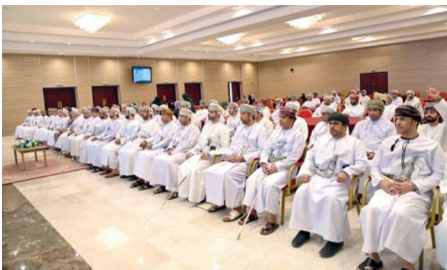
الحضور أثناء حفل التّكريم

وأوضح سعادة الشيخ أحمد بن علي الحسيني والي المصنعة أن تحقيق ولاية المصنعة للمركز الأول على مستوى المحافظة جاء نتيجة الجهود الحثيثة التي بذلتها اللجنة الرئيسية بالولاية بالتعاون والوحدة الحكومية والمؤسسات الأهلية والقطاع الخاص وأفراد المجتمع، مشيراً إلى أن ذلك يُعدُّ نقطة بداية لمواصلة أهداف اللجنة الرامية للقضاء على الزعاجة، مؤكداً سعادته على أهمية ديمومة العمل بنفس الروح. كما تحدّث سعادته عن أهم البرامج التي نفذتها اللجنة بالولاية الأمر الذي أدّى إلى انخفاض المنحنى الوبائي بالولاية إلى جانب الزيارات الميدانية والمحاضرات.