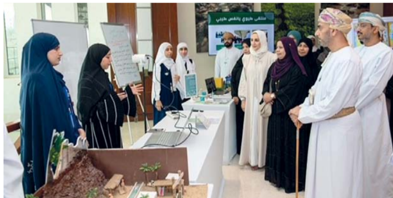
الإطلاع على محتويات المعرض المصاحب

الباطنة بمشروع غذاء، تدوير، استدامة، ومدرسة بحر عُمان (١٢.١) بتعليمية محافظة جنوب الشرقية بمشروع الكنز الخفي (عشبة الزعتر)، ومدرسة مقنيات (١٢.٥) بتعليمية محافظة الظاهرة بمشروع الزامة، والزمن يعود، وجاء في المستوى الثاني كل من مدرسة السلطان قابوس (١٠.١) بتعليمية محافظة ظفار بمشروع: إعادة تدوير لحاء النارجيل، وتحويلها إلى سلع تجارية، ومدرسة صحح للتعليم الأساسي (١٢.١٠) بتعليمية محافظة شمال الباطنة بمشروع: إرث التاريخ، وتحديات العصر، ومدرسة جبل العوامر (١٢.٩) بتعليمية محافظة مسقط بمشروع تأثير بعض الممارسات البشرية على معدل انبعاثات ثاني أكسيد الكربون في البيئة المدرسية، ومدرسة زنبق بنت الرسول (١٠.٥) بتعليمية محافظة الداخلية بمشروع: الهيدروجين الأخضر وقود المستقبل، وحل في المستوى الثالث كل من: مدرسة سمية للتعليم الأساسي (١٢.١٠) بتعليمية محافظة شمال الشرقية بمشروع: المُرقة براونز وحكايات، ومدرسة عزان بن قيس (١٢.١٠) بتعليمية محافظة البريمي بمشروع المياه الرمادية، ومدرسة صوقرة للتعليم الأساسي (١٢.١٠) بتعليمية محافظة الوسطى بمشروع تأسيس مركز لتخنيمة مواهب الشباب بمنطقة صوقرة.