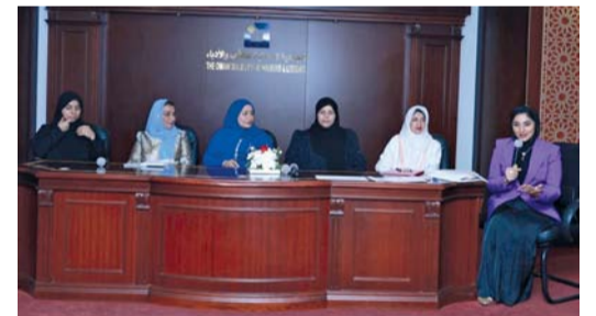
المشاركات في الجلسة الحوارية

مع بداية الموسم الجديد، تواصل دار الأوبرا السلطانية مسقط تقديم مجموعة كاملة من برامجها، حيث ستقدم مجموعة متنوعة من العروض، بداية العروض مع كريستينا برانكو، مغنية الفادو الشهيرة التي تضيء الأصالة والتوجه على هذا النوع من فن الغناء البرتغالي التقليدي. يقام هذا الحفل ليلة واحدة فقط، ويتم خلالها التعريف بهذه الموسيقى التقليدية التي تلامس مشاعر الحب والفقد والعواطف العميقة لدى الجمهور، وكل هذا يأتي في عرض (ولكن أي فادو؟) مع كريستينا برانكو يوم الثلاثاء ٥ نوفمبر المقبل في الأوبرا السلطانية- دار الفنون الموسيقية. وبعد يومين يقام عرض الموسيقى العسكرية السنوي: عمان والعالم، الذي يستمر لمدة ثلاث ليالٍ في ساحة الميدان لدار الأوبرا الرئيسية. تم تهيئة ساحة الميدان كي تستوع أكثر من ٢٠٠٠ شخص، تتضمن الفرق العسكرية وشرطة عمان السلطانية، مع الطبول والمزامير، إلى الفرق الزائرة من الأردن والنمسا، في هذا