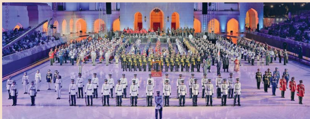
عروض شهر نوفمبر تشهد مشاركة شرطة عمان السلطانية وفرقا عسكرية