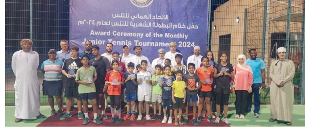
■ صورة جماعية للمشاركين في البطولة الأولى