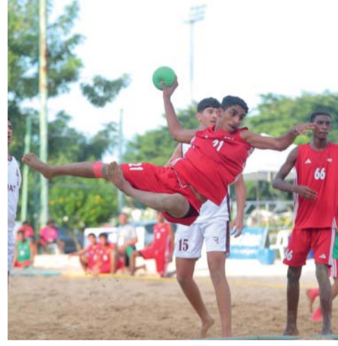
■ لاعب مُنتخبنا يُسدّد في مرمى المُنتخب القطري