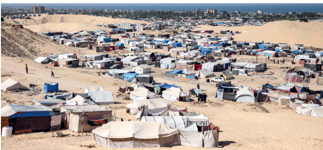
خيام تروي النازحين في منطقة المواصي بخان يونس جنوب قطاع غزة والتي يستهدفها الاحتلال بالقصف رغم تحديدها كمنطقة آمنة، من قبله فيما تقول الأمم المتحدة إنه لا مكان آمن للنازحين في غزة.

القدس المحتلة، «الوطن»، وكالات: تصاعدت حرب الإبادة التي يشنها الاحتلال الإسرائيلي على الفلسطينيين في قطاع غزة، خصوصاً في الشمال، حيث تواصل القصف على القطاع، بعد استهداف الاحتلال مركز إيواء تابعاً للأونروا بحمى جباليا، في حين استشهد أكثر من (٧٠) فلسطينياً منذ فجر الثلاثاء، (٥٧) منهم في شمال غزة. وقال وزير الخارجية الأميركي أنتوني بلينكن بعد مباحثات في «تل أبيب» إن