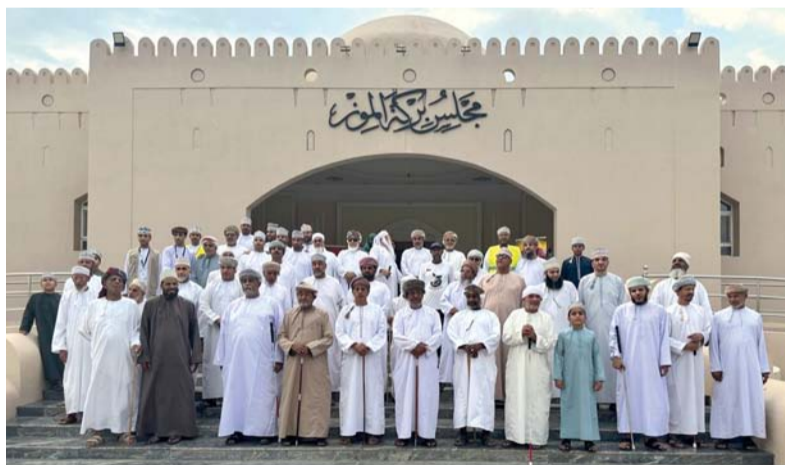
المشاركون في الاحتفال

نزوى. من سالم بن عبدالله السالمي: في إطار الاحتفال باليوم العالمي للعصا البيضاء، نظمت جمعية النور للمكفوفين فرع محافظة الداخلية بالتعاون مع مركز خدمة المجتمع بجامعة نزوى فعالية المسير رعى الفعالية سعادة علي بن ناصر الحراصي، عضو مجلس الشورى ممثل ولاية نزوى الذي أشاد بأهمية هذه المبادرات في تعزيز الوعي المجتمعي بحقوق المكفوفين ودعم استقلاليتهم، حيث شارك في الفعالية عدد كبير من المكفوفين وأفراد المجتمع وبعض من الطلبة والطاقم التدريسي بجامعة نزوى. وحول هذه المناسبة قال حمد بن محمد الشيعلي أمين سر فرع الجمعية: يأتي تنظيم هذا المسير بهدف تسليط الضوء على أهمية العصا البيضاء كرمز لاستقلالية المكفوفين وتعزيز الوعي بحقوقهم، فقد انطلق المسير من المعشى القريب من جامعة نزوى وسط أجواء