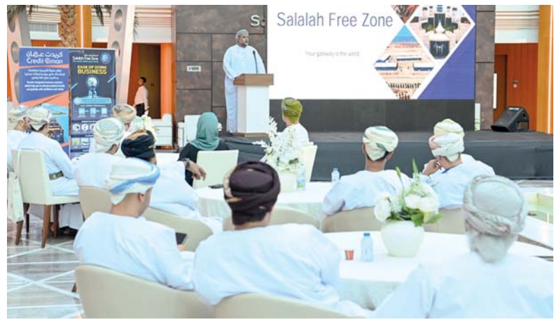
المنتدى تضمن تقديم عروض مرئية ركزت على فرص الاستثمار

كما يتضمن المنتدى تقديم عروض مرئية متنوعة تركز على استعراض فرص الاستثمار المتاحة في محافظة ظفار، وكيفية الحفاظ على ديمومة الشركات في سوق العمل، والابتكار وتقديم جلسات نقاشية، تتناول الأولى البنية الأساسية والمزايا اللوجستية وفرص الاستثمار في قطاع البتروكيماويات بصلالة، فيما تناقش الجلسة الثانية دور صلالة في الاستثمارات العالمية في مجال صناعة الأغذية، بينما تتطرق الورقة الثالثة إلى آفاق العوائد العالية للاستثمار في صناعة الأدوية بصلالة بما في ذلك دور البنية الأساسية وقرب صلالة من الأسواق الناشئة وخطوط الملاحة البحرية الدولية.