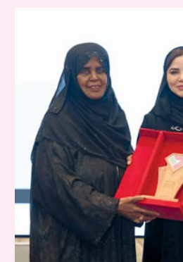
تكريم النساء المهلمات