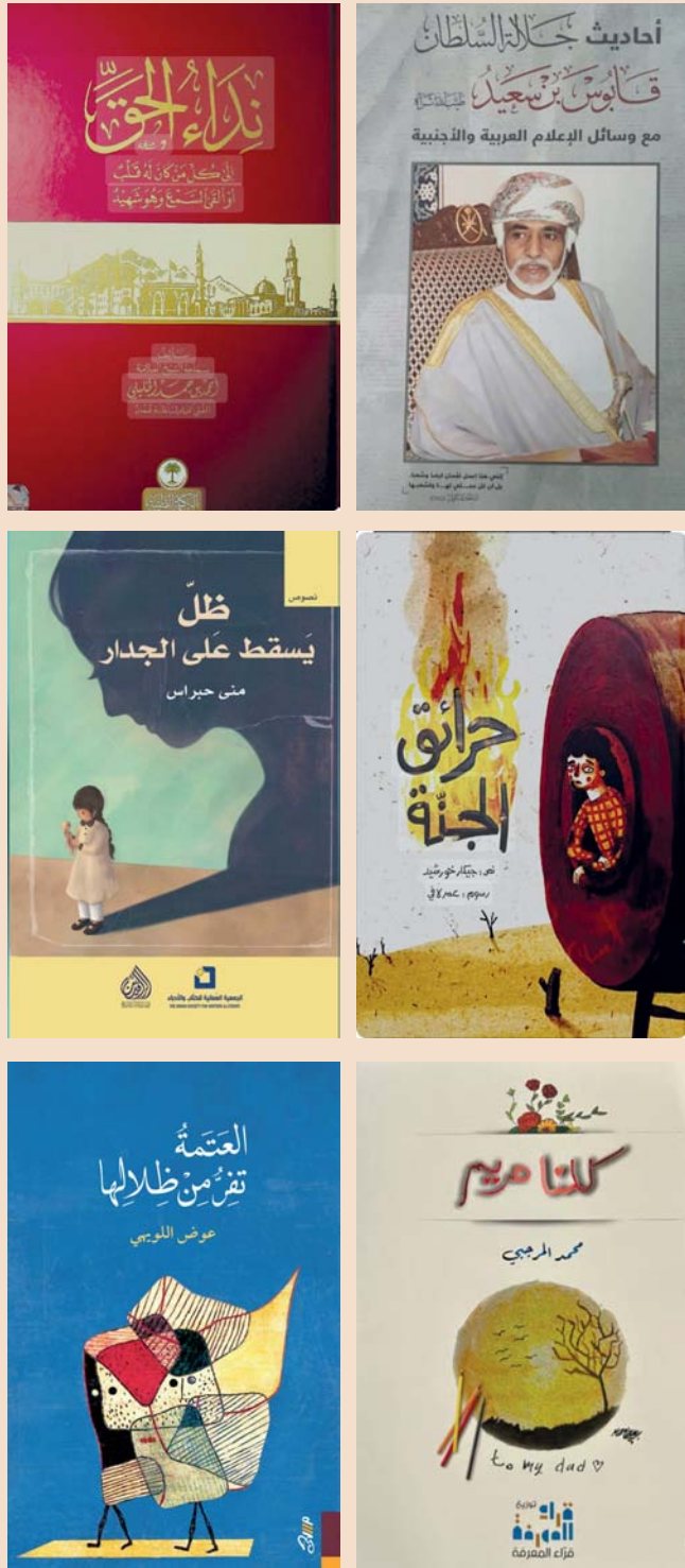
الإصدارات الستة التي أضيفت لمشروع الكتاب الصوتي