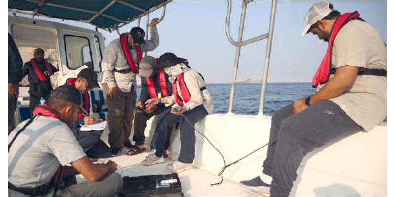
الفريق أثناء التصوير وتوثيق المشاهدات وتسجيل البيانات

حصب . العُمانيّة: بدأت أمس في ولاية حصب أعمال المرحلة الرابعة لمشروع مسح أنواع الثدييات البحرية بمحافظة مسندم، الذي تنفذه هيئة البيئة بالتعاون مع عدد من الجهات الحكومية ذات الاختصاص ويستمر حتى ٣١ أكتوبر الجاري.