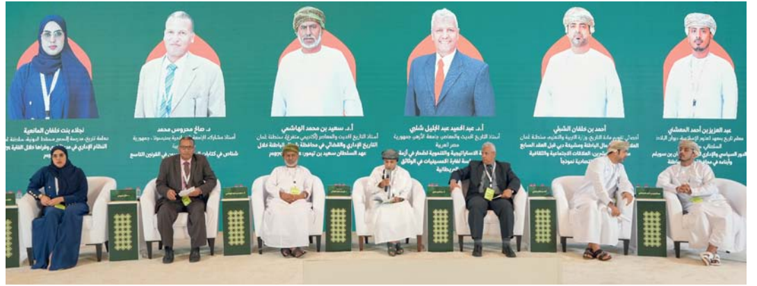
المشاركون في الجلسة الأولى