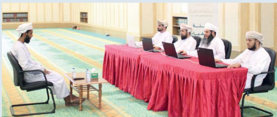
تقييم أحد المشاركين

موزعة على مختلف ولايات سلطنة عُمان، وبلغ إجمالي عدد المسجلين في مستويات المسابقة السبعة لهذه الدورة ١٧٩٠ متسابقاً ومتسابقة. وتهدف المسابقة إلى تشجيع العُمانيين على حفظ القرآن الكريم والالتزام بتعاليمه، وتكوين جيل قرآني يحمل كتاب الله ويتقن تلاوته، وتعزيز حضور سلطنة عُمان في المسابقات القرآنية الدولية. حيث تتضمن المسابقة سبعة مستويات، المستوى الأول