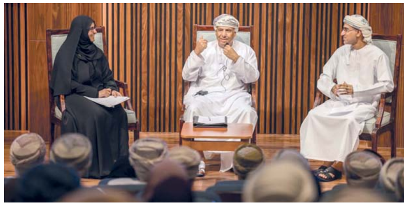
توظيف التكنولوجيا الحديثة لتحسين الإجراءات وجعلها أكثر استدامة

التحول الرقمي، والأمن السيبراني، وإدارة الموارد، مع التركيز على حلول تقنية ومستدامة تلبي احتياجات السفارات والمواطنين على حد سواء. الجدير بالذكر أن البرنامج الذي تم تنفيذه سيستمر حتى منتصف ديسمبر، بمشاركة واسعة من موظفي الوزارة والبعثات، ستعرض الأفكار والمشاريع المبتكرة أمام لجنة لتقييمها واعتماد المشاريع والمبادرات الفائزة التي تسهم في تحسين الأداء المؤسسي للسفارات العمانية.