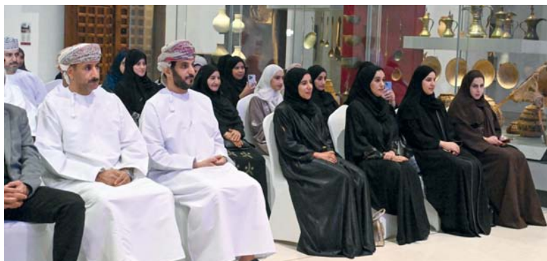
■ اللقاء استعرض إنجازات المرأة العلميّة

وتطرق الحوار كذلك إلى أبرز التحديات التي تواجه الاستثمار في الموارد الطبيعية، كصعوبة توفر بعض المواد الأساسية الطبيعية، وقلة الترويج للمستثمرين، وتكلفة التجارب والمخبرات، بالإضافة إلى تصنيف النشاط التجاري، وتأخر إصدار الشهادات، وخلص النقاش على التأكيد بأن الملكية الفكرية مطلب عالمي لحماية أي مستحضر، أو فكرة، أو نتيجة علمية من الموارد الوراثية الحيوانية والنباتية، ويتعدى الأمر إلى المخطوطات القديمة في جانب الطب الشعبي.