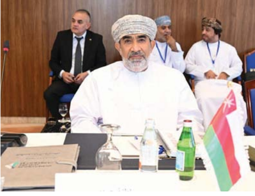
خليفة البرواني خلال مشاركته في الاجتماعات

العمانية. شاركت سلطنة عمان ممثلة في المركز الوطني للإحصاء والمعلومات في اجتماعات الدورة ٤٩ لمجلس الأمناء للمعهد العربي للتدريب والبحوث الإحصائية، التي عقدت في مملكة البحرين. مثل وفد سلطنة عمان في الاجتماعات سعادة الدكتور خليفة بن عبدالله البرواني الرئيس التنفيذي للمركز الوطني للإحصاء والمعلومات. وناقشت الاجتماعات جملة من الموضوعات، أبرزها: ميزانية المعهد وأنشطة المعهد خلال العامين ٢٠٢٥ و ٢٠٢٦ حسب احتياجات الأجهزة الإحصائية، وتطرق الاجتماع إلى مبادرات المنظمات الشريكة وسبل التعاون لتنظيم أنشطة مشتركة. ومثل سعادة الرئيس التنفيذي للمركز الوطني للإحصاء والمعلومات كذلك وفد سلطنة عمان المشاركون في اجتماعات اللجنة الإحصائية التابعة للجنة الاقتصادية والاجتماعية لغرب آسيا (الإسكوا) والتي تعقد في العاصمة البحرينية المنامة وتستمر يومين. جرى خلال الاجتماعات مناقشة مستقبل العمل الإحصائي في المنطقة العربية، والطرق إلى نتائج الدورة الخامسة والخمسين للجنة الإحصائية للأمم المتحدة ونتائج تقييم الدورات السابقة للجنة الإحصائية، واعتماد توصيات اللجنة الإحصائية في دورتها السادسة عشرة.