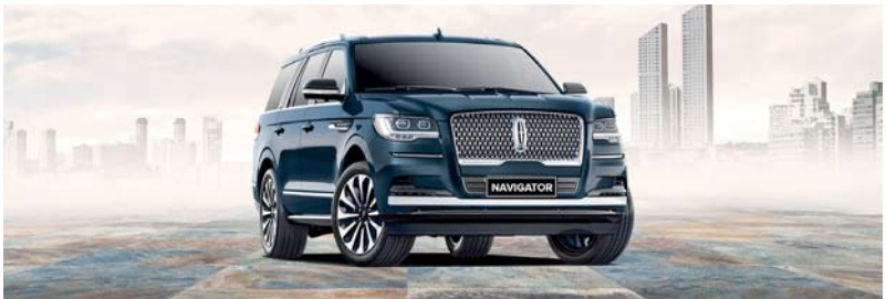
لينكون نافيجيتور سيارة متعددة الاستخدامات

وتعطي لينكون الأولوية للسلامة من خلال وسائد هوائية أمامية ثنائية المراحل للسائق والراكب الأمامي ووسائد هوائية جانبية للمقعد الأمامي، ووسائد سفيتي كانبوي الهوائية جانبية ستائرية مع جهاز استشعار لحالات التدهور، ونظام التحكم الإلكتروني بالثبات مع ميزة التحكم بالميلان، وتقنية المفاتيح المبرمج MyKey، ولوحة مفاتيح سكيوري كود غير مرئية، بالنسبة للعائلات التي تطلب المزيد من رحلتها، تعمل سيارة لينكون نافيجيتور على إعادة تعريف ما يجب أن تكون عليه السيارات الرياضية متعددة الاستخدامات الفخمة من قوة وهبة وراحة مطلقًا.