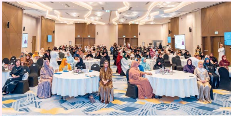
الندوة سلطت الضوء على المزايا التشريعية الخاصة بالمرأة