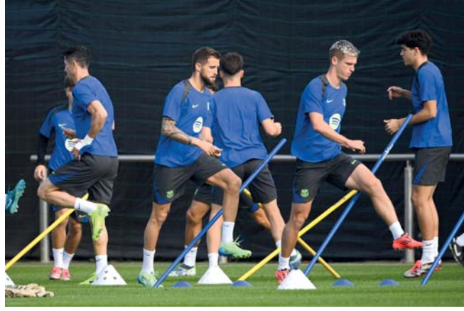
لاعبو برشلونة خلال الحصة التدريبية

كومباني أن المهمة الأربعة على أرض برشلونة لن تكون سهلة بقا لأن النادي الكاتالوني سيقا بل شراسة من أجل محاولة الثأر من مناسفه الذي خرج منتصرا من المباريات الست الأخيرة بين الفريقين، أبرزها في ربع نهائي عام ٢٠٢٠ حين اكتسح «بلاوجرانا» ٨-٢ خلال حقبه تشي جاتحة كوفيد حين كان العملاق الألماني بقيادة المدرب الصالي لخصم الأربعاء هانزي فليك، وتواجه الفريقان في دور المجموعات خلال موسمي ٢٠٢١-٢٠٢٢ و ٢٠٢٢-٢٠٢٣ وخرج بايرن منتصرا بالمباريات الأربع، مسجلا فيها ١١ هدفا من دون أن تهتز شبكاه. ويبدو برشلونة بقيادة فليك في أفضل وضع ممكن من أجل محاولة استعادة اعتباره، إذ فاز بتسع من مبارياته العشر الأولى في الدوري المحلي مع مردود هجومي أكثر من رائع (٣٣ هدفا). «الامر لا يتعلق أبدا باللاعبين» -وتحضر برشلونة بأفضل طريقة لاستضافة بايرن ومن ثم مواجهة غريمه ريال مدريد حامل اللقب السبت على أرض الأخير في «كلاسيكو» الدوري المحلي، وذلك بفوزه الكاس على إشبيلية ١-٥ الأحد، بينها ثنائية للهداف السابق للمعلق الكاتالوني الهولندي روبرت ليفاندوفسكي. ويأتي تألق برشلونة رغم افتقاده خدمات لاعبين مؤثرين جدا مثل الهولندي فرنكي دي يونغ، الأوروغوياني رونالد أراوخو، الدنماركي أندرياس كريستينسن والحارس الألماني مارك-أندري تير شتيجن، لكنه استعادة جافي الذي تعافى من إصابة في الركبة وشارك الأحد ضد إشبيلية.