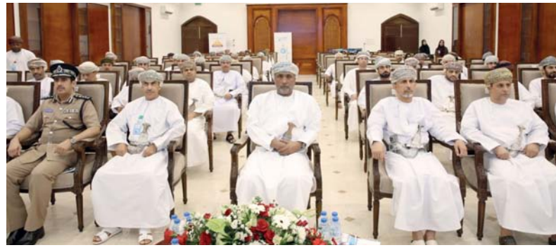
الملتقى يسلم الضوء على مفهوم الأمن السيبراني ومخاطر الذكاء الاصطناعي

بدأت أمس فعاليات الملتقى التوعوي الأول لأمن المعلومات الإلكترونية بمحافظة الظاهرة، والذي نظمه مكتب محافظة الظاهرة ممثلًا بقسم أمن المعلومات الإلكترونية تحت رعاية سعادة نجيب بن علي الرواس محافظ الظاهرة بحضور عدد من أصحاب السعادة الولاة والمسؤولين من مختلف القطاعات بالمحافظة، ويختتم اليوم «الأربعاء».