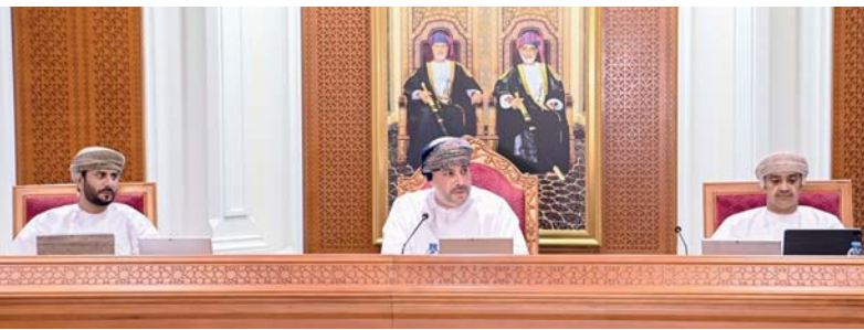
بلدي ظفار أثناء الاجتماع أمس

إلى استعراض الخطط المتبعة من الشركة لتنظيم عملية نقل النفايات خلال موسم الخريف. كما تناول الاجتماع نتائج لقاء لجنة الشؤون الاجتماعية مع ممثلي لجان التنمية الاجتماعية بالولايات وعدد من الفرق الخيرية، حول سبل تنفيذ مبادرة تنظيم الأعراس الجماعية، بهدف دعم الأسر المحتاجة وتخفيف الأعباء المالية عن الشباب المقبلين على الزواج، بما يعزز تماسك المجتمع.