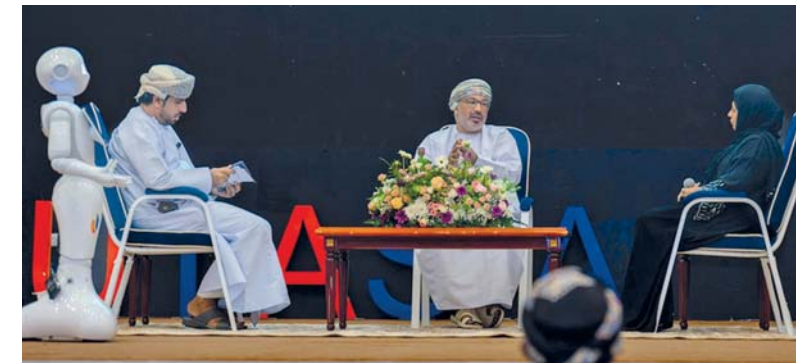
الجلسة الحوارية ناقشت أبرز قضايا التعليم والبحث العلمي

المصنعة. العمانية: نظمت وحدة متابعة تنفيذ رؤية عُمان ٢٠٤٠ أمس لقاءً تعريفياً في جامعة التقنية والعلوم التطبيقية بالمصنعة بمحافظة جنوب الباطنة، يتضمن التعريف بالمحاور والأولويات والتوجهات الاستراتيجية للوحدة والتعريف بمؤشرات الأداء الوطنية. وقدم معالي الدكتور خميس بن سيف الجابري رئيس وحدة متابعة تنفيذ رؤية عُمان ٢٠٤٠، عرضاً مرئياً قال فيه: إن رؤية عُمان ٢٠٤٠ تركز على تطوير نظام تعليمي عالي الجودة مبني على الشراكة المجتمعية وحوكمة مستقلة، والذي يقيم وفقاً للمعايير الوطنية والدولية، ويشمل التطوير تحديث المناهج التعليمية لتعزيز القيم الدينية والهوية العمانية، والاهتمام بالتنمية المستدامة وتزويد