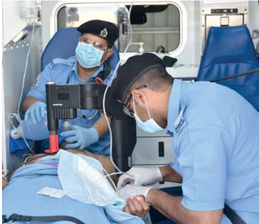
تقديم الرعاية الصحية لطالبيها في مواقع الحوادث

كما تعنى أيضاً بتقديم العناية الطبية الطارئة للحالات المنزلية الحرجة، وتأتي توفير هذه الخدمة في ظل النمو السكاني والعمراني الكبير الذي تشهده المحافظة وحرصاً من الهيئة على توفير كامل خدماتها ونشرها في مختلف ربوع سلطنة عُمان.