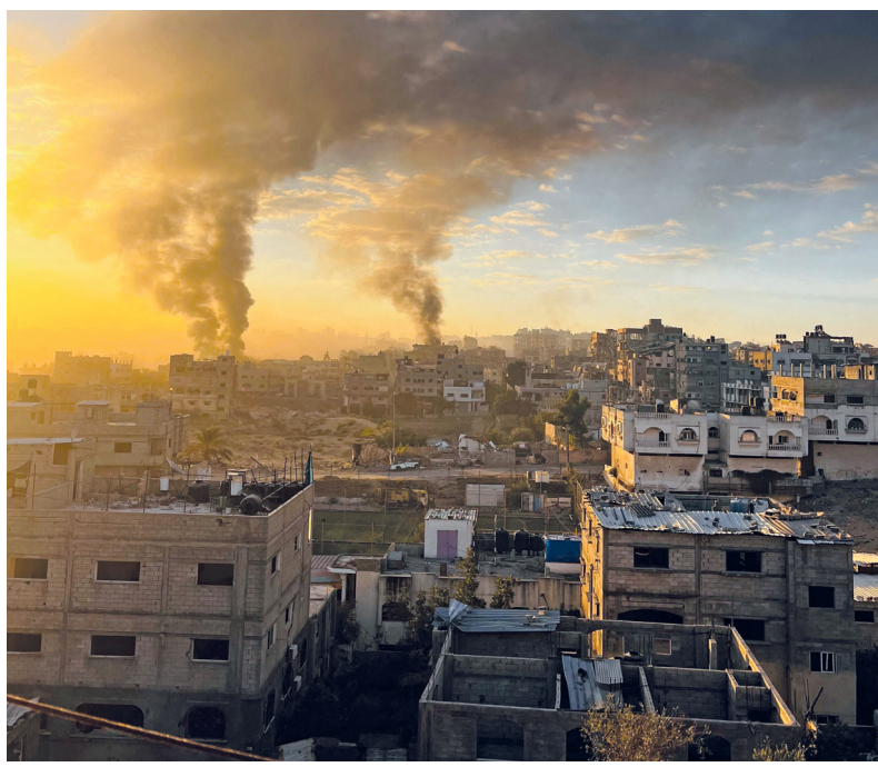
دخان يتصاعد بعد الغارات الإسرائيلية على بيت لاهيا في شمال قطاع غزة.