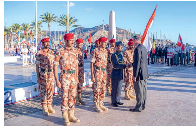
■ المسابقة تتطلب قدرات بدنيّة وذهنيّة عالية