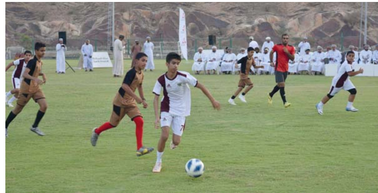
الملاعب الخضراء أسهمت في تطوير الممارسة الرياضية

تشكّل مبادرات وبرامج المسؤولية الاجتماعية وخدمة المجتمع، رافداً مهماً لدعم مختلف فئات المجتمع، كونها تركز على مجالات مختلفة تخدم أهداف التنمية المستدامة. ومن هذا المنطلق، حرص بنك مسقط، المؤسسة المالية الرائدة في سلطنة عمان، طوال مسيرته على تعزيز هذا الجانب من خلال برامج المسؤولية الاجتماعية التي حققت نجاحاً وتحظى بالإشادة من قبل الجميع.