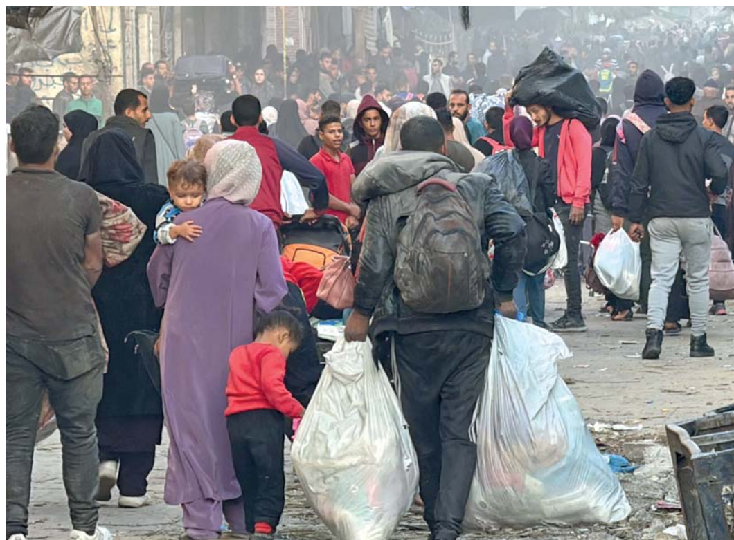
فلسطينيون يزنحون مع أمتعتهم بعد أن هجرهم الاحتلال من منازلهم قسراً في بيت لاهيا، شمال قطاع غزة.

بيروت. وكالت: استهدفت غارات إسرائيلية محيط مدينة صور في جنوب لبنان، وفق ما أوردت الوكالة الوطنية للإعلام الرسمية، ونك بعد إنذار إسرائيلي بالإخلاء، وأوردت الوكالة «شأن الطيران المعادي سلسلة غارات على منطقة الحوش، شرق مدينة صور الساحلية، في وقت أظهر البث المباشر لوكالة فرانس برس سحابة دخان تنبعث من المنطقة بعد القصف. يأتي ذلك فيما أعلن حزب الله اللبناني، الاشتباك مع قوة إسرائيلية تسللت باتجاه أطراف بلدة الطيبة مساء الإثنين وإيقاع إصابات مباشرة. وبين الحزب أن ذلك يأتي دعماً للشعب الفلسطيني الصامد في قطاع غزة وإسناداً لمقاومته الباسلة والشريفة ودفاعاً عن لبنان وشعبه. ولفت الحزب إلى أنه عند الاشتباك استقدم الاحتلال مدرعات مساندة القوة المشتبكة فتصدى لها المقاومون مجدداً وأجبروها على التراجع، ثم قام المقاومون بقصف القوة المتراجعة في منطقة التجمع بالأسلحة الصاروخية وحققوا فيها إصابات مباشرة.