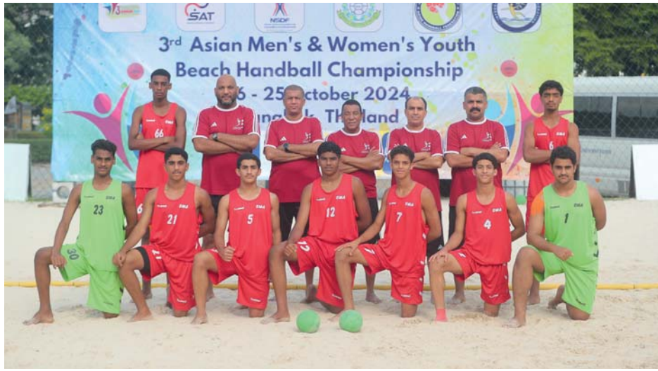
منتخب ناشئي كرة اليد الشاطئية

“ يخوض اليوم منتخبنا الوطني للناشئين لكرة اليد الشاطئية في الساعة الواحدة وخمس عشرة دقيقة ظهراً بتوقيت سلطنة عمان لقاء مفترق الطرق، عندما يواجه نظيره المنتخب القطري في الجولة الخامسة بالبطولة الآسيوية الثالثة للناشئين لكرة اليد الشاطئية المقامة حالياً في العاصمة التايلاندية بانكوك حتى يوم الجمعة القادم، يدخل منتخبنا لقاء اليوم وليس أمامه سوى الفوز وعليه أن يخدم نفسه من أجل مواصلة المنافسة على أحد المراكز الثلاثة الأولى في البطولة.”