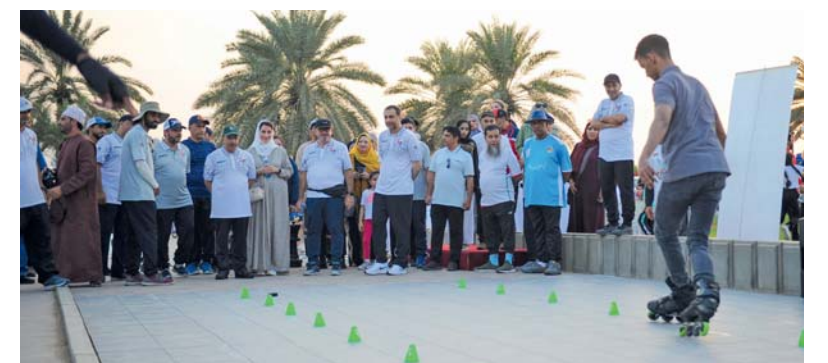
أنشطة متنوعة ستشهدها الفعالية

على هامش الاجتماعات وذلك لبحث العديد من الجوانب لتطوير رياضة الهوكي، والعمل على تحقيق مزيد من الدعم وتخطي العقبات التي تعترض مستقبل رياضة الهوكي دوليا. الذكرى المؤتية للاتحاد وحول استضافة سلطنة عمان لاجتماعات «كونجرس» الجمعية العمومية للاتحاد الدولي للهوكي، أعرب داتو الطيب إكرام رئيس الاتحاد الدولي للهوكي عن خالص شكره وامتنانه لسلطنة عُمان، لاستضافة اجتماعات «كونجرس» في العاصمة العمانية مسقط، مشيرا إلى أنه من دواعي الشرف للاتحاد الدولي للهوكي بأن يعقد مؤتمره السنوي وفي نسخته التاسعة والأربعين في سلطنة عُمان، لافتا إلى أن هذا الحدث يمثل محطة مهمة في مسيرة الاتحاد الدولي للهوكي، حيث يجتمع رؤساء وأعضاء الاتحادات القارية