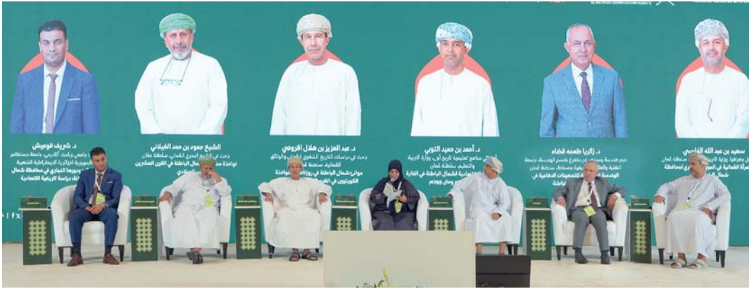
المشاركون في الجلسة الثانية