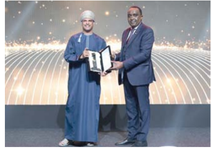
الجائزة تعكس التزام عمانتل الدائم بتقديم حلول مبتكرة

شبكة الهاتف المحمول، تستضيف عمانتل اليوم نواة شبكة الجيل الخامس غير المستقلة (5G NSA) التي تحمل جميع حركة مرور الشركة، مما أسهم في رفع كفاءة الخدمة وتعزيز تجربة المشتركين. كما أطلقت عمانتل نواة الجيل الخامس السحابية المستقلة (5G SA) وحلول الحوسبة الطرفية المتنقلة (MEC) المخصصة للاستخدامات المؤسسية. ونقل أكثر من ٩٠٪ من أعباء العمل التقنية لعمانتل إلى السحابة، ونقل أكثر من ٢٠٠ منتج إلى بنية تعتمد على الخدمات الصغيرة. أما جائزة أفضل ابتكار في الخدمات ذات القيمة المضافة للإنترنت اللاسلكي الثابت فتأتي تقديراً لاستجابة عمانتل المبتكرة لتحديات توفير الإنترنت عريض النطاق. حيث نجحت الشركة في تحويل ٩٨٪ من مشتركيها من خدمات الإنترنت عبر الكابلات الحساسة إلى تقنية الجيل الخامس اللاسلكي الثابت في المناطق التي تواجه صعوبات في نشر الألياف البصرية.