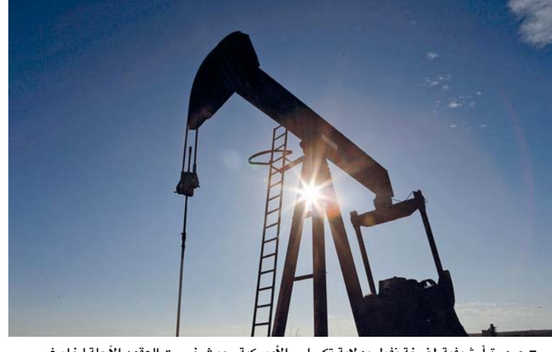
صورة أرشيفية لمضخة نطف بولاية تكساس الأمريكية، حيث خسرت العقود الآجلة لخام غرب تكساس الوسيط ٢٣ سنتاً أمس.

للبرميل. كما خسرت العقود الآجلة لخام غرب تكساس الوسيط الأكثر تداولاً لديسمبر ٢٣ سنتاً أو ٠,٣ بالمائة إلى ٦٩,٨١ دولار للبرميل. من جهته صعدت أسعار الذهب أمس مقتربة من المستوى القياسي المرتفع الذي بلغته الجلسة السابقة، وسط حالة من عدم اليقين بخصوص الانتخابات الأمريكية والنتوات الرهنة في الشرق الأوسط وتوقعات بخفض بنوك مركزية رئيسية لأسعار الفائدة. وارتفع الذهب في المعاملات الفورية ٠,٥ بالمائة إلى ٢٧٣٢,٤٤ دولار للأوقية (الأونصة). وزادت العقود الأمريكية الآجلة للذهب ٠,٣ بالأوقية.