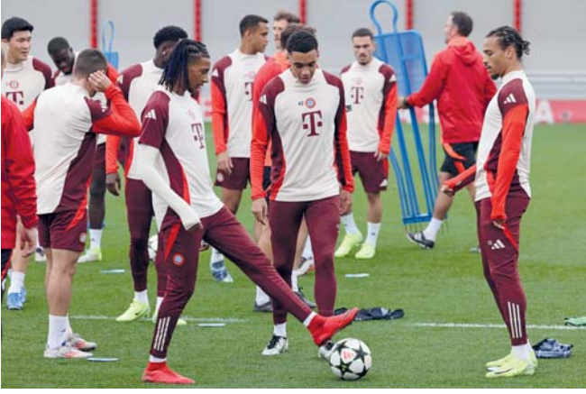
لاعبو بايرن ميونخ خلال الحصة التدريبية