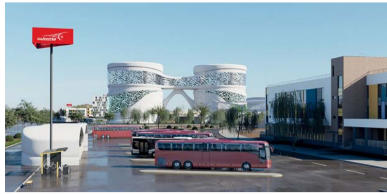
الاتفاقيات تعزز التنمية الاقتصادية والاجتماعية من خلال مشاريع مستدامة تدعم الاقتصاد المحلي

وقعت محافظة الداخلية أمس عددا من العقود الاستثمارية بتكلفة استثمارية تتجاوز ٧ ملايين ريال عماني، وبمعايير استثمارية تتجاوز مليونين وسبعمئة ألف ريال عماني مع عدد من الشركات، وذلك تحت رعاية معالي المهندس سعيد بن حمود المعولي، وزير النقل والاتصالات وتقنية المعلومات. حيث يأتي توقيع العقود في إطار دعم النمو الاقتصادي وتعزيز الخدمات التجارية في ولايات محافظة الداخلية، وتفعيل الشراكة بين الحكومة والقطاع الخاص وجذب الاستثمارات وتوفير فرص عمل مباشرة وغير مباشرة للمواطنين؛ تعزيزاً للمحتوى المحلي. وتضمنت العقود الاستثمارية التي وقعها معالي المهندس سعيد بن حمود المعولي، مع الشركات ذات العلاقة على تطوير محطة النقل العام التكاملية في