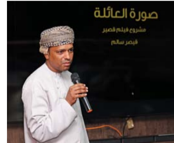
عروض مرئية قدمها أصحاب المشاريع السينمائية الفائزة

لدعم صناعة الأفلام العمانيين وتعزيز برامج الدعم المباشر وغير المباشر لأعضاء الجمعية. وتسعى الجمعية العُمانية للسينما إلى تشجيع صناعة وإنتاج الأفلام السينمائية في سلطنة عُمان، وجعل صناعة السينما أحد مصادر الدخل للاقتصاد الوطني من خلال استثمار التنوع الجغرافي والبيئي والمواقع الأثرية، واستقطاب شركات الإنتاج العالمية وصناعة الأفلام إلى سلطنة عُمان، حيث إن برنامج دعم الأفلام أحد البرامج التي تقدمها الجمعية لدعم الأعضاء من خلال تمويل إنتاج الأفلام في فئة الأفلام القصيرة بهدف تحفيز نمو قطاع الأفلام في سلطنة عُمان، وتطوير قدرات صناعة الأفلام الفنية وإعطائهم الفرصة للمشاركة بأفلامهم في المهرجانات المحلية والدولية.