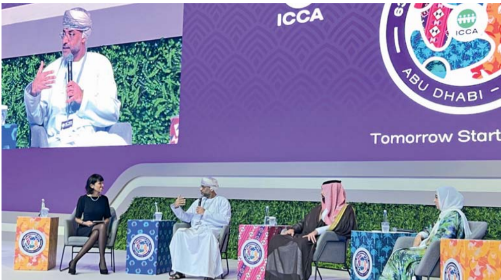
المشاركة فرصة للتعرّف بالفرص المتاحة في مجال سياحة المؤتمرات

الثرية والمتنوعة والقيم الثقافية والحضارية التي تتمتع بها سلطنة عُمان لتوفر تجربة سياحية عُمانية وعربية أصيلة. وأكد سعادة وكيل السياحة مشاركة وزارة التراث والسياحة في هذا المؤتمر يأتي بهدف تسليط الضوء على مكانة سلطنة عُمان كوجهة سياحية مميزة والتعريف بالتسهيلات والخدمات والعروض التي تستهدف السائح من مختلف دول العالم وتتوافق مع متطلباته واهتماماته.