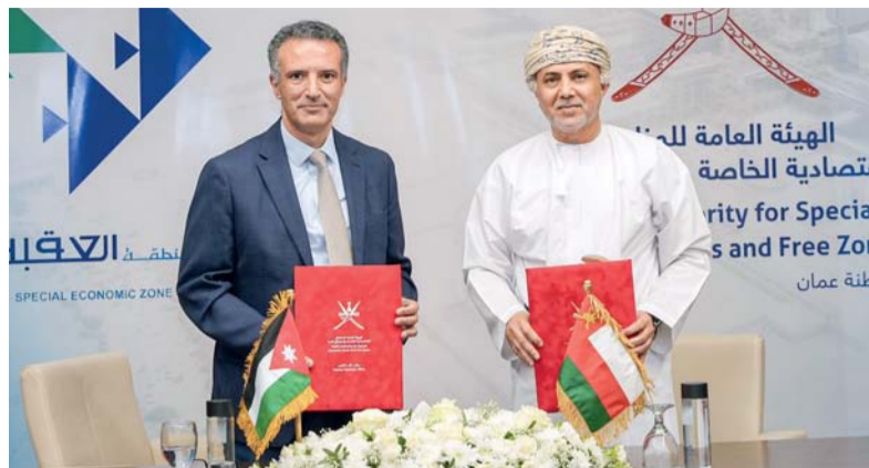
مذكرة التفاهم تغطي التعاون في عدد من المجالات الاقتصادية المشتركة

الدقم. العمانية: وقعت الهيئة العامة للمناطق الاقتصادية الخاصة والمناطق الحرة وسلطة منطقة العقبة الاقتصادية الخاصة في المملكة الأردنية الهاشمية أمس في مجال المنطقة الاقتصادية الخاصة بالدقم مذكرة تفاهم في مجال تشجيع التنمية الاقتصادية والاستثمارية للمناطق الاقتصادية الخاصة في كلا البلدين.