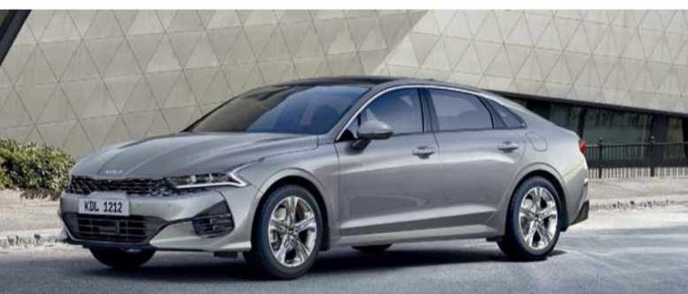
عروض حصرية من كيا لاحتفالات الربيع

قدمت كيا عروضاً مميزة بمناسبة العودة إلى المدارس، واحتفالات الربيع من كيا، وذلك بتجميع بعض من أفضل السيارات متعددة الاستخدامات بأحدث التقنيات وميزات السلامة المتقدمة ومن بين أبرز العروض التسجيل المجاني في السنة الأولى والتأمين والخدمة بالإضافة إلى قسائم اسمح وأرباح للحصول على أرباح عمولات ذهبية عيار ٢٤ قيراط بوزن ١٠ جرامات وأحدث هواتف آيفون ١٥ إس، وترقيات الخدمة لغاية ٢٠٠,٠٠٠ كم ويسري على سيارات الصالون الديناميكية. تتمتع سيارة سيلتوس بمحرك تيربو سعة ١,٤ لتر التي تنتج ١٣٨ حصاناً مقترنة بناقل حركة ٧ سرعات، وتأتي مزودة بقوة مع مجموعة من ميزات الراحة والاتصال، تشمل مفتاحاً ذكياً ووضع التضاريس ومقاعد جيدة التهوية والتحكم في صوت التوجيه وكاميرا الرؤية الخلفية وشاشة صوتية مقاس ٨ بوصات. وتأتي سيارة كيا كيه ٥ الصالون القوية بمحرك ٢,٥ لتر جي دي أي بقوة ١٩١ حصاناً عند ٦١٠٠ دورة في الدقيقة، وتتمتع بالتوازن المثالي بين الأناقة والقوة مع قدرات الدفع الرباعي ونقل الحركة ذي الثماني سرعات. كما تتمتع سيارة كيا