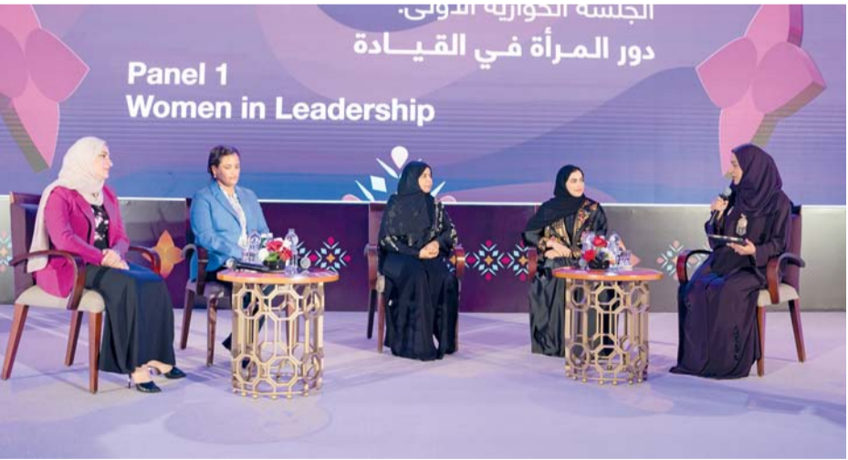
المحدثات أثناء إحدى الجلسات الحوارية

في دعم جهود الاستدامة والتحول نحو الطاقة النظيفة كما تؤكد على التقدير الكبير لدور المرأة في تعزيز قطاع النفط والغاز. كما تضمنت الاحتفالية جلستين نقاشيتين، الأولى بعنوان دور المرأة في القيادة والثانية بعنوان المرأة في العلوم والتكنولوجيا والهندسة والرياضيات وتناولت الجلسات النقاشية عرض تجارب المشاركون في الحوار تجاربهم الشخصية والمهنية، وسلطات الضوء على التحديات التي تغلبوا عليها والاستراتيجيات التي استخدموها لاختراق الحواجز في قطاع تقليدياً يهيمن عليه الرجال وتناولت المناقشات مجموعة من المواضيع المهمة، منها التقدم المهني والتحديات والاختراقات والتوجيه والتمكين وموازنة الأولويات ومستقبل المرأة في قطاع الطاقة.