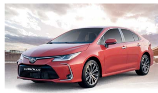
تويوتا كورولا تجمع بين التصميم الأنيق والميزات المتقدمة

يبلغ ١٥,٧ كجم لكل متر. تتميز كورولا من الداخل بتصميمها الأنيق والجذاب الذي يجمع التصميم الداخلي البسيط والمتطور بين المساحة والوظائف وتضمن المقاعد المصممة هندسياً مع مواد وسائد جديدة ومسند نزاع واسع ومساحة واسعة للأرجل تجربة متميزة لكل من الركاب في الأمام والخلف ويتم تعزيز راحة المقعد الخلفي من خلال ميزات مدروسة مثل فتحات تكييف الهواء الخلفية، في حين أن فتحة السقف وشاشة عرض المعلومات المتعددة مقاس ٤,٢ بوصة ونظام الصوت بنشاشة مقاس ٧ بوصات ونظام تخفيف السرعة ونظام