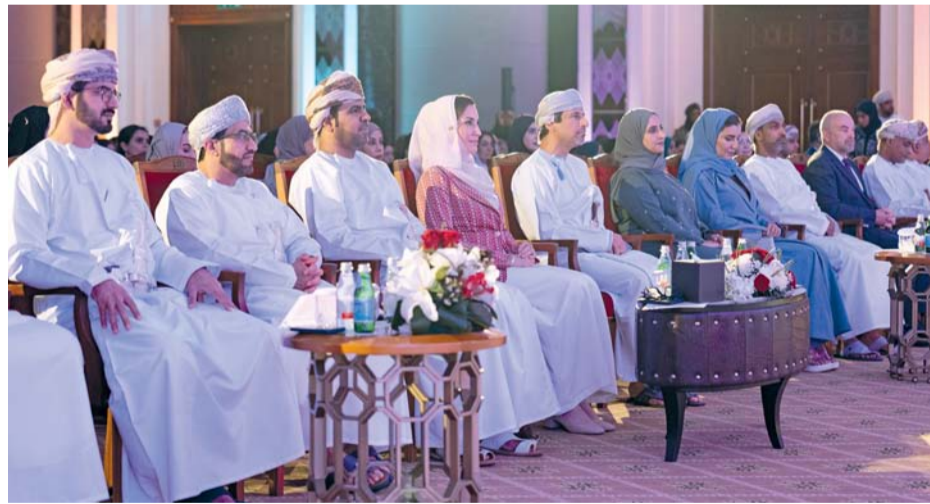
الاحتفالية سلطت الضوء على مشاركة النساء العمانيات في البرامج القيادية