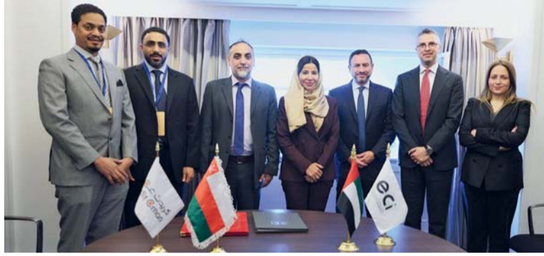
المذكرة تسهم في تعزيز القدرات التنافسية بين سلطنة عمان والإمارات