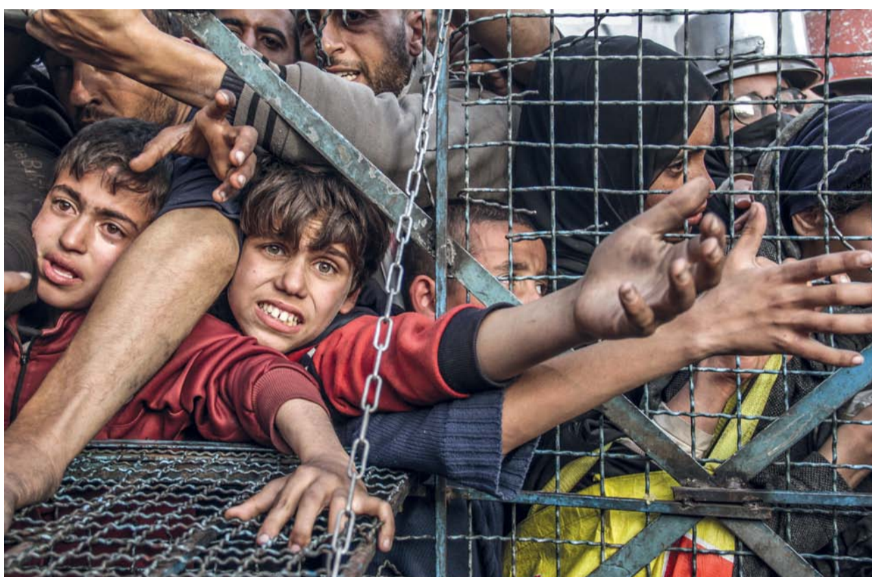
فلسطينيون بينهم أطفال يصفون للحصول على المواد الغذائية التي توّعتها المنظمات الخيرية في مدينة غزة.