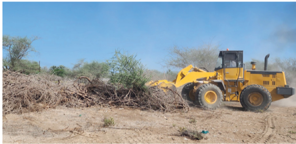
الإزالة تحافظ على الملكيات العامة للدولة

نفذت لجنة الإزالة الفورية بدائرة البلدية بالمصنعة يوم أمس إزالة حيازات غير قانونية في منطقة ودام الغاف جنوب بمساحة تقدر بـ (٦٠) ألف متر مربع بعد استيفاء جميع الإجراءات القانونية المعمول بها. وتأتي الحملة في إطار المحافظة على الملكيات العامة للدولة وحمايتها من العبث والتعدي عليها.