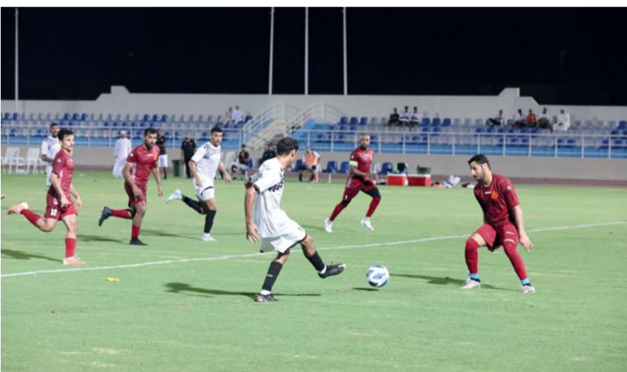
من أحد لقاءات البطولة

عشرة لوحدات شؤون البلاط السلطاني بصلالة، بمشاركة ١٢ فريقاً مقسمة على ٤ مجموعات.