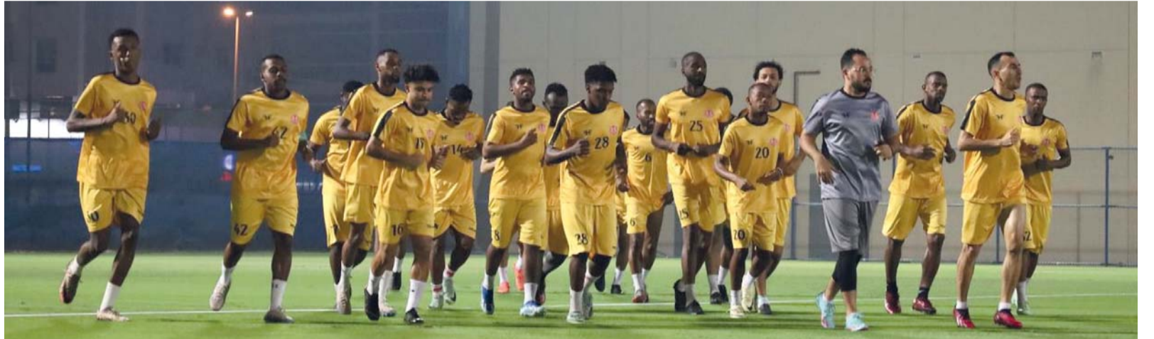
من الحصّة التدريبية لنادي ظفار

مباراة اليوم تعد أصعب المواجهات بالنسبة لنادي ظفار، فهو يواجه واحداً من أقوى الأندية الإماراتية بل الخليجية على وجه العموم، وباعتقادي أنه أقوى اختبار للزعيم والتي سيرسم من خلالها على مدى قدرة فريقه الذي يمر بظروف غير جيدة في هذا الموسم على تحدي الصعاب، وتسجيل بداية جيدة حتى وإن كانت بالتعادل حتى يحصل لاعبوه على ثقة أكبر في قادم المواجهات، ويدرك مدربه المصري أحمد حافظ بأنه في اختبار وتحدي صعبين للغاية وعليه العمل على تحدي عقبة اليوم بثبات إن أراد المضي قدماً في خط سير تصاعدي لما هو أفضل مستقبلاً.