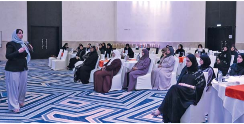
الحلقة تكسب الموظفين المهارات الأساسية اللازمة لتحقيق التوازن الفعّال

ومن تسهيلات التخزين والتوزيع من أجل فتح منافذ جديدة للتصدير وزيادة حجم الصادرات من المناطق الاقتصادية الخاصة للبلدين إلى الأسواق الإقليمية والدولية بأقل التكاليف الممكنة، وتبادل الخبرات بين الطرفين في مجال تنظيم حركة النقل للمناطق الاقتصادية الخاصة واللوجستيات والموانئ، ومن المتوقع أن تشهد الفترة المقبلة لقاءات مع المستثمرين العمانيين والأردنيين ومؤسسات التجارة والأعمال المحلية والدولية؛ للتعريف بالتسهيلات التي سوف يوفرها هذا التعاون للمستثمرين في المناطق الاقتصادية في سلطنة عُمان والمملكة الأردنية الهاشمية بغرض تحقيق أقصى جذب ممكن للاستثمارات في المناطق الاقتصادية الخاصة في البلدين. وعلى هامش توقيع مذكرة التفاهم قام معالي نايف حميدي الفايز، رئيس مجلس المفوضين في سلطة منطقة العقبة الاقتصادية الخاصة، والوفد المرافق له بزيارة بالمنطقة مثل ميناء الدقم والحوص الجاف ومصنع كروة للسيارات.