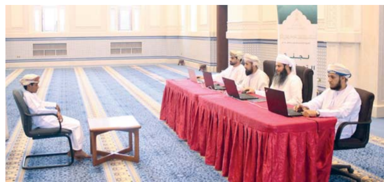
المسابقة تُعزّز الحضور في المسابقات القرآنية الدولية.

وتأتي مشاركة سلطنة عُمان في هذا المؤتمر فرصة للتعريف بالإمكانات والفرص المتاحة لديها والبنى الأساسية الخاصة بسياحة المؤتمرات والسياحة