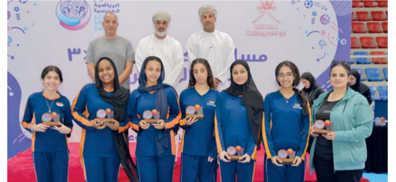
تتويج أصحاب المراكز الأولى

وأضاف الهلالي أن اللجنة لم تتلقى - ولله الحمد - أي ملاحظات على حكام البطولة، وهذا تأكيد على تعاون الفرق المتنافسة مع الحكام من حيث اللعب