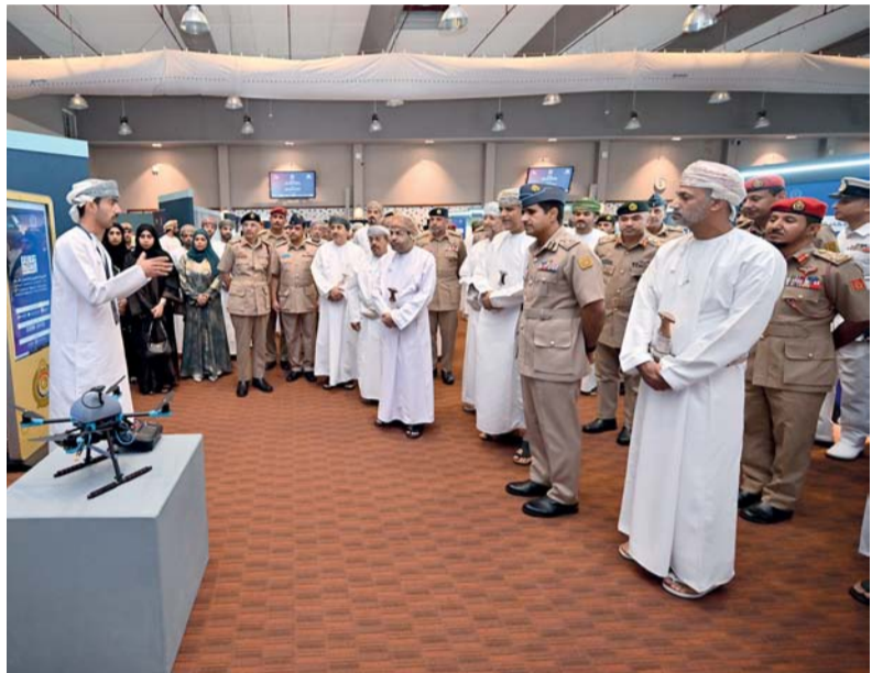
الفعاليات تهدف إلى توفير بيئة تعليمية تتحج للطلاب والموظفين استعراض إبداعاتهم وابتكاراتهم

مسقط. العُمانية: بدأت أمس فعاليات الأسبوع العلمي الخامس الذي جاء هذا العام بعنوان (الذكاء الاصطناعي وتكنولوجيا المستقبل) بالكلية العسكرية التقنية، برعاية سعادة الدكتور سعيد بن حمد الربيعي، رئيس جامعة التقنية والعلوم التطبيقية، وبحضور العميد الركن جوي مهندس محمد بن عزيز السيابي، عميد الكلية العسكرية التقنية. وتهدف فعاليات الأسبوع العلمي الخامس والذي تستمر فعالياته حتى الـ ٢٤ من الشهر الجاري إلى توفير بيئة تعليمية ملهمة تتيج للطلاب والموظفين على حد سواء استعراض إبداعاتهم وابتكاراتهم والمشاركة في الفعاليات العلمية والتكنولوجية، وتعزيز الابتكار والبحث العلمي، وابتكار حلول لتطوير المشاريع المرتبطة بالذكاء الاصطناعي، وإيجاد جسور للتواصل