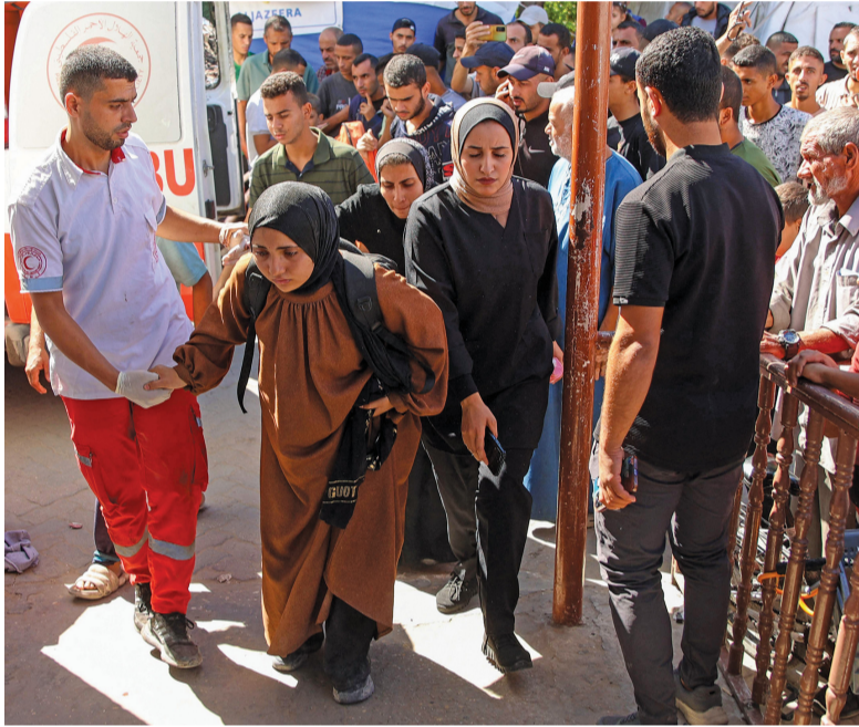
مصابون جراء العدوان الإسرائيلي على مخيم جباليا للاجئين وسط قطاع غزة يصلون إلى المستشفى الأهلي العربي، المعروف أيضاً باسم المستشفى المعمداني.

نزوى. العمانية: وقعت وزارة النقل والاتصالات وتقنية المعلومات، اتفاقيتين في مجال الطرق؛ الأولى لاستكمال مشروع طريق سيج قطنة في ولاية الجبل الأخضر، بتكلفة بلغت قرابة أربعة ملايين وخمسمئة ألف ريال عماني، والثانية إعادة تأهيل طريق بديد - نزوى، بتكلفة بلغت قرابة عشرة ملايين وخمسمئة ألف ريال عماني. كما تم بمحافظته الداخلية توقيع عدد من العقود الاستثمارية بتكلفة استثمارية تجاوزت (٧) ملايين ريال عماني، وبعائد استثماري تجاوز مليونين وسبعمئة ألف ريال عماني مع عدد من الشركات.