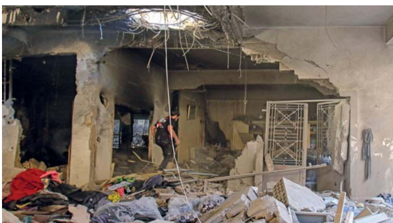
لبناني يتفقد أضرارًا لحقت بمنزل أصيب جراء غارة جوية إسرائيلية على مدينة بعلبك شرق لبنان.