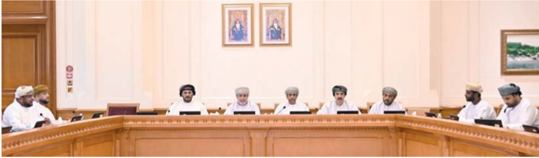
اللجنة الصحية والاجتماعية بمجلس الشورى خلال استضافتها المعينين بجهاز الضرائب