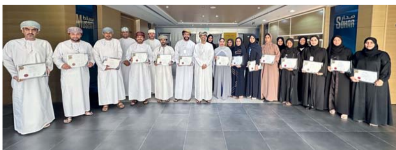
صورة جماعية للمشاركين في الدورة التدريبية

بنك عمان العربي: يأتي تنظيم الدورة في إطار استراتيجية بنك عمان العربي لدعم التحول الشامل للبنك والذي يتمحور حول تطوير الخدمات العصرية والرقمية وإثراء تجربة العملاء وتحقيق أعلى مستويات الرضا عن الخدمات وشملت الدورة التدريب الشامل لموظفي خدمة العملاء والأقسام الأمامية التي تتعامل بشكل مباشر مع الجمهور في بنك عمان العربي. وشارك في الدورة عدد من موظفي وزارة العمل وذلك في إطار التعاون وتبادل المعارف والخبرات والاستفادة من برامج التدريب والمحاضرات التي يتم تنفيذها في كلتا الجهتين.