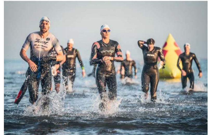
سلطنة عمان تستضيف النسخة العالمية الثانية

لمسافة ٩٠ كيلومتراً، والجري لمسافة ٢١,١ كيلومتراً، في مشهد خاطف للأنظار وسط جمال الطبيعة والجبال لهوانا صلالة.