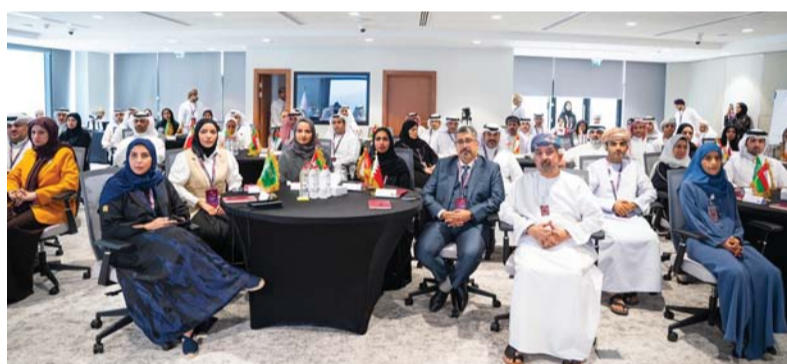
البرنامج يسعى إلى توحيد جهود دول المجلس في تطوير القيادات الحكومية

ويستهدف البرنامج موظفي الإدارة الوسطى في المؤسسات الحكومية بدول الخليج الست، بواقع ٦٥ مشاركاً من جميع الدول حيث تُعد فئة القيادات الوسطى محركاً مهماً في أي جهة ذات صلة وثيقة باستراتيجية الدولة؛ كونها تُشرف على جميع المهام المتعلقة بتنفيذ الخطط و١٠ وحدات تعليمية صُممت استناداً إلى دراسة تحليل الاحتياجات التي تهدف إلى فهم التوجهات الخاصة المطلوبة للإدارة الوسطى وتحديد الاحتياجات وتقديمها للمسؤول المباشر.