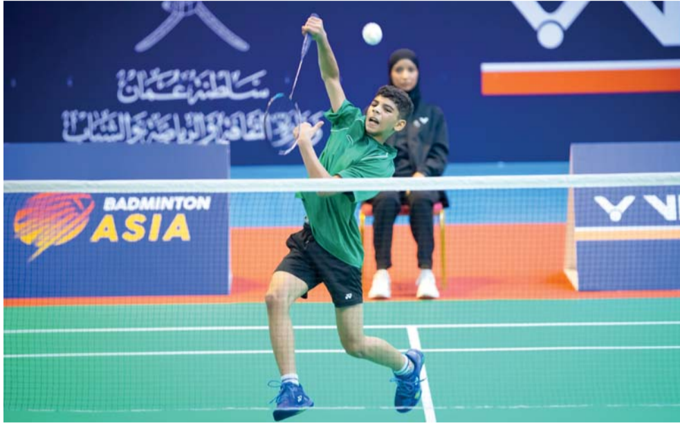
البطولة شهدت تنظيمًا متميزًا

حظيت النسخة التاريخية الأولى من منافسات بطولة غرب آسيا للريشة الطائرة للناشئين، والتي أقيمت بسلطنة عُمان للمرة الأولى في تاريخ رياضة الريشة الطائرة، بإنسداد واسعة من الاتحاد الدولي وكذلك الاتحاد الآسيوي للريشة الطائرة، إضافة إلى ردود الأفعال الإيجابية من المشاركين بالبطولة، وكذلك الوفود التي شاركت في الحدث الرياضي بمستوى التنظيم العالي والمهبر لمنافسات البطولة التي أقيمت في الصالة الرئيسية بمجمع السلطان قابوس الرياضي ببوش خلال الفترة من تاريخ (٧-١٢ أكتوبر ٢٠٢٤).