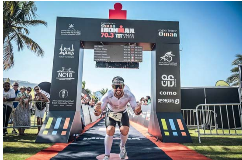
الحديث سيشهد مشاركة أبطال العالم

النسخة العمانية الثانية من بطولة «الرجل الحديدي» بمشاركة أكثر من ٥٠٠ متسابق من ٤٥ جنسية، منها مشاركات عربية وخليجية من بينها قطر والإمارات والكويت والسعودية ومصر، إلى جانب مشاركة دولية من أوروبا وأمريكا وآسيا.