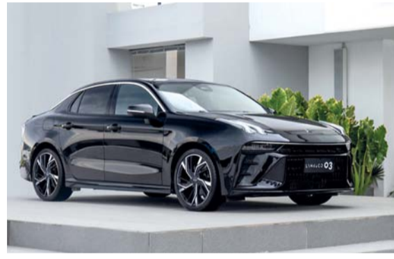
سيارة السيدان قيادة كهربائية مزودة بتكنولوجيا متقدمة

تعمل بمحرك توربيني عالي الأداء سعة ٢,٠ لتر يولد ٢١٨ حصاناً و١٦٠ كيلو واط مما يعمل على تسارع السيارة من ٠ إلى ١٠٠ كم لكل ساعة في ٧,٢ ثانية فقط وصممت بتجربة قيادة سلسلة دون التوقف المتكرر للتزود بالوقود جعلها الرفيق المثالي لكل من الرحلات الطويلة والتقلبات اليومية. كما تجسد التنقل الذكي المزود بميزات متقدمة وتصميم أنيق. وتتميز بما يقارب ٢٠ نظاماً متقدماً لمساعدة السائق في قلب هذا الابتكار حيث يشتمل على كاميرا أمامية واحدة و ٤ كاميرات بانورامية ٣ رادارات موجات ملليمترية ومساعد الطريق السريع المصمم للمساعدة في الحفاظ على المسار وتعديلات السرعة مما يوفر دعماً إضافياً أثناء القيادة بسرعة عالية والانتظار بسرعات منخفضة وجمع نظام العرض الكامل ٥٤٠ بين عرض بانورامي بزواوية ٣٦٠ درجة وعرض هيكل شفاف بزواوية ١٨٠ درجة، مما يسمح للسائقين بمراقبة ظروف الطريق المحيطة بشكل شامل، مما يعزز سلامة القيادة بشكل عام وتميز سيارة ٠٣ أيضاً بمصابيحها الذكية التي تتزامن مع عجلة القيادة لإضاءة اتجاهك مما يضمن لك البقاء متقدماً بخطوة واحدة أثناء التنقل في زوايا المدينة الضيقة أو السباق على الطرق المفتوحة. وتعمل شركة Lynk & Co على إحداث ثورة في امتلاك السيارات من خلال جعل الفخامة أكثر سهولة في الوصول إليها مع أقساط شهرية مميزة، كما أصبحت في متناول المشترين لأول مرة أو أي شخص يتطلع إلى ترقية سيارته الحالية، وكل ذلك بسعر يناسب ميزانيته كما تقدم أحدث ابتكارات السيارات إلى سلطنة عُمان ضمن خط أعمال التنقل للسيارات من مجموعة تاول.