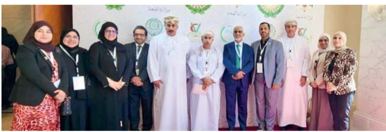
الحلقة ناقشت فرص الاستفادة من الكفاءات المهاجرة

بالدول العربية، الذي بدأت أعماله صباح أمس في العاصمة الأردنية عمان برعاية جلالة الملك عبدالله الثاني ابن الحسين ملك المملكة الأردنية الهاشمية بتنظيم من جامعة الدول العربية ومنظمة الصحة العالمية، ويستمر ليومين. وشارك في الجلسة الحوارية عدد من أصحاب المعالي وزراء الصحة العرب وسعادة الأستاذ الدكتور عمر الرواس أمين عام المجلس العربي للاختصاصات الصحية في عمان والممثلون عن الكفاءات العربية المهاجرة. رافق معاليه خلال مشاركته في المؤتمر سعادة الدكتورة فاطمة بنت محمد الجمعي - رئيسة المجلس العماني للاختصاصات الطبية - وعدد من المسؤولين من وزارة الصحة. ■