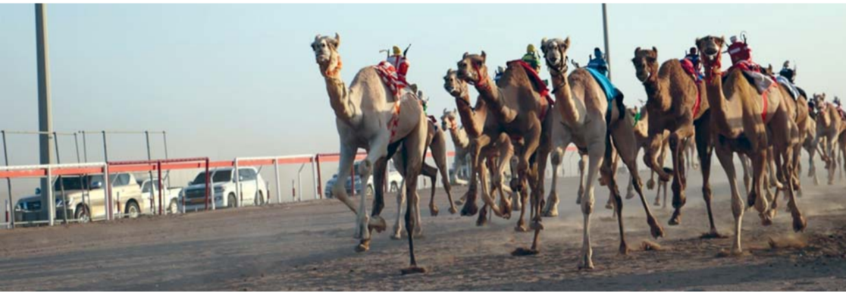
■ إثارة ومنافسة قوية في أشواط السباق

بولاية أدم منافسات المحطة الثانية من سباقات الهجن الأهلية بإقامة ١٢ شوطاً منها ٦ أشواط لفئة الإيداع لمسافة ٥ كيلومترات و ٣ أشواط لفئة الخنايا و لمسافة ٦ كيلومترات و ٣ أشواط للحول والزمول لمسافة ٦ كيلومترات.