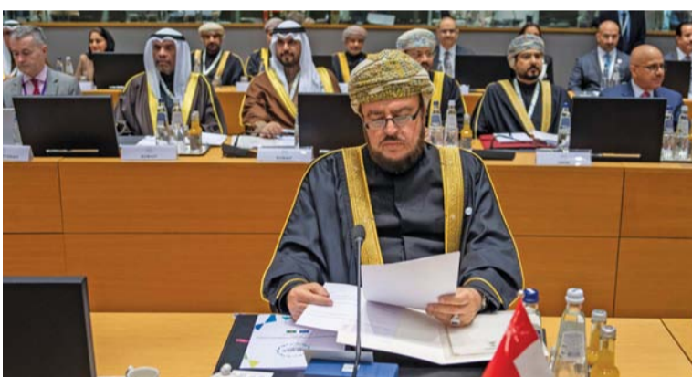
أسعد بن طارق يؤكد على تعميق التعاون مع أوروبا

المرأة العمانية كمقوم أساسي في المجتمع إنما كانت لبناء هذا النسيج المتكامل، مضيئاً أن الاحتفال هذا العام ركز على مجال الثقافة والأدب والشعر الذي أثمرته المرأة العمانية بحضورها. تضمنت الحفل، مشاهدة عرض مرئي يعكس دور المرأة العمانية في مجال الثقافة والأدب، والإعلان عن إصدار خاص بالمرأة