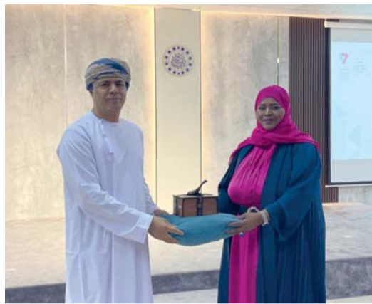
تكريم إحدى المُجيدات بولاية عبري

تقديم أوبريت شعري مُعلّمات من مختلف مدارس سلطنة عُمان. كما نظّمت جمعية المرأة العمانية بولاية بهلاء والحمراء احتفالاً مشتركاً، وذلك بقاعة الجوري بمبنى جمعية المرأة العمانية بهلاء برعاية سعادة الشيخ سعيد بن علي النعيمي والي بهلاء وسعادة الشيخ سليمان بن سعيد العزري والي الحمراء وبحضور سعادة الشيخ عمر بن علي الجنيبي عضو مجلس الشورى ممثل ولاية