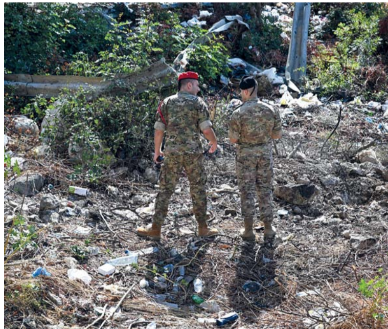
جنود لبنانيون يتفقدون موقع غارة إسرائيلية في جونية شمال بيروت.

دعت بروكسل، ١٠ دول غربية، بما في ذلك نحو عشر دول بما في ذلك المملكة المتحدة والولايات المتحدة وفرنسا وألمانيا، الطرفين المتحاربين في السودان إلى ضمان وصول الإعانات الإنسانية إلى ملايين الأشخاص الذين يحتاجون إلى مساعدة عاجلة. ومنذ أبريل ٢٠٢٣ يشهد السودان حرباً بين قوات الدعم السريع بقيادة محمد حمدان دقلو والجيش بقيادة عبد الفتاح البرهان، القائد الفعلي للدولة، أودت بحياة عشرات الآلاف. وقد نزح حوالي ١١.٣ مليون شخص جراء الحرب، بينهم نحو ٣ ملايين شخص فروا من السودان، وفق مفوضية الأمم المتحدة لشؤون اللاجئين التي وصفت الوضع بأنه «كارثة» إنسانية. ويواجه نحو ٢٦ مليون شخص انعداماً حاداً في الأمن الغذائي، وقد أعلنت المجاعة في مخيم زرم في دارفور. وقالت نحو عشر دول غربية في بيان مشترك «إن العرقلة المنهجية من كلا العسكريين للجهود الإنسانية المحلية والدولية هي أساس هذه المجاعة». ودون وقوع إصابات،