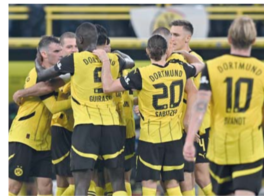
لاعبو دورتموند يحتفلون بالهدف الأول لفريقهم

بينما من مسافة قريبة داخل المرمى (٣٠)، لكنه ألغى بداعي