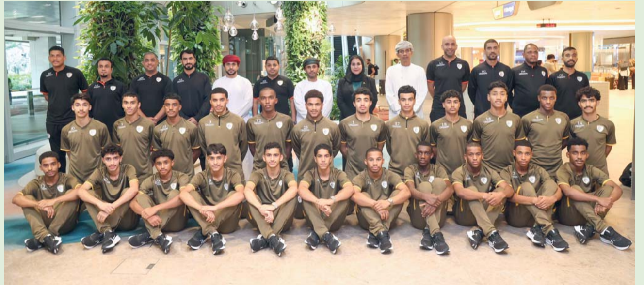
■ بعثة منتخبنا الوطني للناشئين لكرة القدم لدى وصولها مطار سنغافورة الدولي