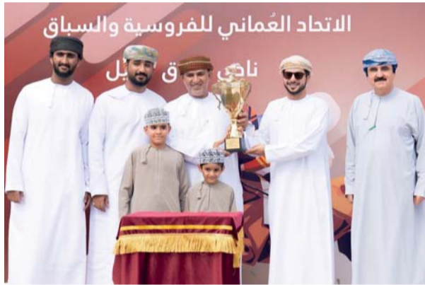
تتويج أصحاب المراكز الأولى في السباق