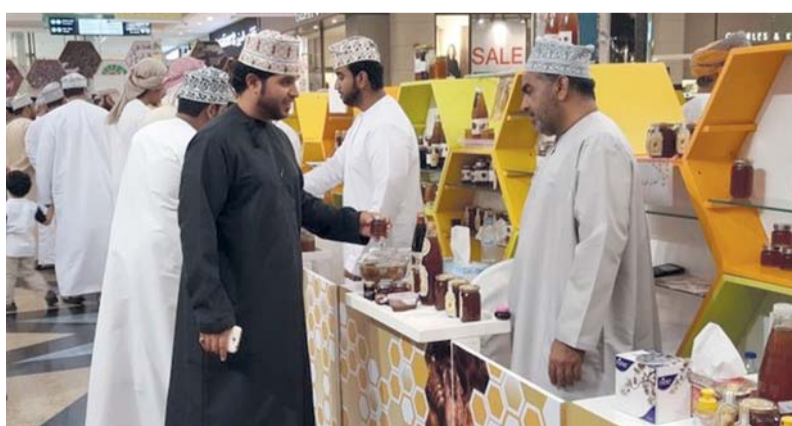
من فعاليات المؤتمر الدولي للتمور والعسل بمرکز عمان للمؤتمرات والمعارض

يذكر أن المعرض الدولي للتمور والعسل تم تنظيم دورته الأولى خلال شهر أكتوبر من العام الماضي وشارك في فعالياته ١٣ دولة و ١٥٠ شركة على المستوى المحلي والدولي من الشركات المنتجة للعسل والتمور وشركات التغليف والتعبئة والتصدير والاستيراد وكذلك شركات التصنيع الغذائي لمنتجات التمور والعسل.