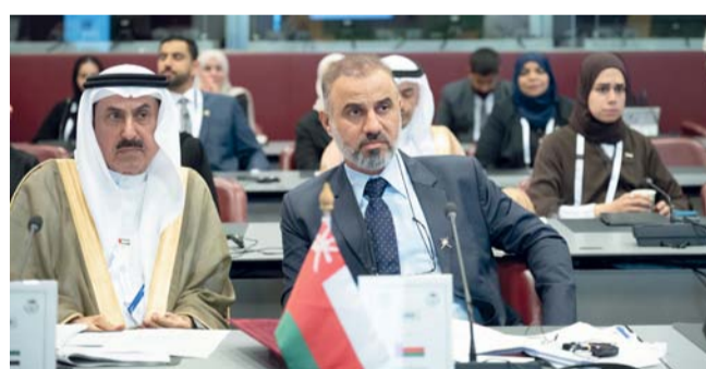
وفد سلطنة عمان أثناء مشاركته في أعمال الجمعية

إلى جانب ذلك، شارك سعادة الشيخ أحمد بن محمد النذابي أمين عام مجلس الشورى، وسعادة خالد بن أحمد السعدي أمين عام مجلس الدولة في اجتماعات الأمناء العامين للبرلمانات العربية، واجتماعات الأمناء العامين للبرلمانات الوطنية، والتي تناولت النظام الأساسي لجمعية الأمناء العامين للبرلمانات العربية، وتعديلات اللائحة الداخلية، في حين تطرقت اجتماعات الأمناء العامين للبرلمانات الوطنية إلى إدارة الاختصاصات المتداخلة بين اللجان البرلمانية، وكذلك أهمية الابتكار واستخدام تقنيات الذكاء الاصطناعي وتطبيقاته في العمل البرلماني. كما جرى خلال الاجتماع التصويت لانتخاب عضو للجنة التنفيذية لجمعية الأمناء العامين للبرلمانات الوطنية، واستعرض المشاريع الأخيرة التي قام بها الاتحاد البرلماني الدولي. من جانب آخر، وضمن أعمال الجمعية العامة للاتحاد البرلماني الدولي، شارك مجلس عمان في منتدى النساء البرلمانيات الذي ناقش «أثر الذكاء الاصطناعي على الديمقراطية وحقوق الإنسان وسيادة القانون»، بالإضافة إلى مشاركته في منتدى البرلمانيين الشباب التابع للاتحاد البرلماني الدولي، استعرض التحديثات بشأن مشاركة الشباب في البرلمانات، وتبادل الأفكار الهادفة إلى تطوير منتدى البرلمانيين الشباب. ■