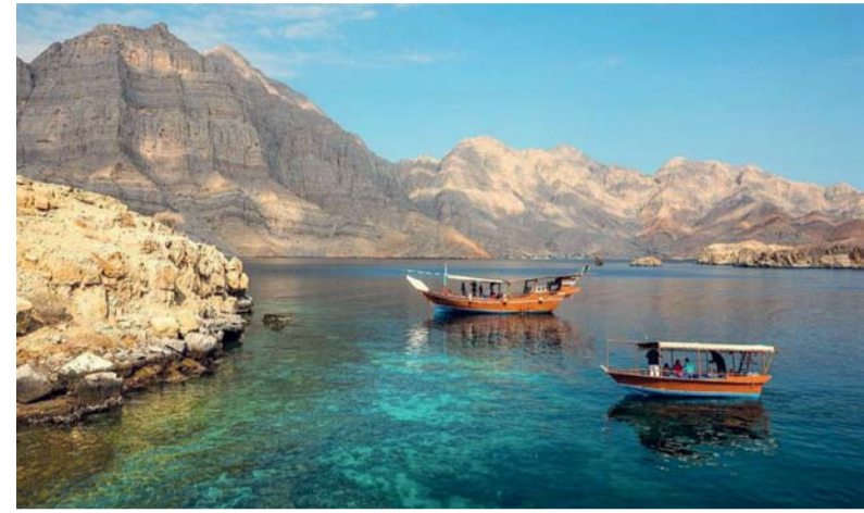
■ فرص واعدة متاحة للاستثمار في القطاع السياحي

في الأسواق السياحية العالمية نظراً لما تتميز به من موقع جغرافي مميز واستقرار سياسي، مؤكداً على أهمية قيام الجهات المعنية بالقطاع السياحي بالمزيد من الجهود خلال الفترة القادمة وعمل مخططات عامة للمناطق المطلوب تنميتها لتحفيز الاستثمارات المحلية والأجنبية وأيضاً القيام بالحملات التسويقية القائمة على منهج علمي وتعتمد على استخبارات الأسواق وطبيعة كل سوق منها ووضع نمط التسويق المناسب لكل سوق من أسواق المصدر، والتنسيق بين منظمي الرحلات السياحية بالأسواق وشركات الطيران والوكلاء المحليين بالمناطق السياحية بسلطنة عمان لذا يجب إعداد مخططات عامة للتنمية السياحية للمناطق والمحافظات تتضمن الطاقة الفندقية بدرجات متنوعة وتوفير الخدمات السياحية المعاونة التي يحتاجها السائح وأكد على أهمية الاستثمار في المحافظة على مبادئ الاستدامة والمجتمعات المحلية والعادات والتقاليد والثقافة المحلية التي يتم دعمها في كل هيئات الأمم المتحدة باعتبارها العمود الاجتماعي المهم في مبادئ الاستدامة كما أن فرص الاستثمار المتاحة في القطاع السياحي بسلطنة عمان واعدة نظراً لما يتميز به المناخ الاستثماري والحوافز والتسهيلات التي تمنحها للمستثمرين بشكل فعال كما تقدم المنظمة دراسات ودعمًا فنياً ولوائح للجهات المسؤولة عن القطاع السياحي في الدول الأعضاء، مشيراً إلى أنه من المتوقع أن ينمو قطاع السياحة العالمي بمعدل ٥,١ بالمائة في المتوسط ليصل إلى ٥,٩٦ مليار ريال عماني (١٥,٥ تريليون دولار أميركي) بحلول عام ٢٠٣٣.