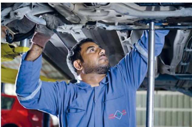
ارتفاع عدد العاملين في المؤسسات الخاصة العاملة فعلياً في سلطنة عمان

في حين بلغت القيمة المضافة للمؤسسات الصغيرة ٦٧٣ مليوناً و ٣٠٠ ألف ريال عماني بما نسبته ٦,٤ بالمائة بارتفاع نسبته ١,٦ بالمائة، وبلغ إجمالي القيمة المضافة للمؤسسات الصغيرة ٨٣٢ مليون ريال عماني بما نسبته ٧,٩ بالمائة بارتفاع نسبته ١,٩ بالمائة. الجدير بالذكر أن عدد العاملين في المؤسسات الخاصة العاملة فعلياً في سلطنة عمان ارتفع بنسبة ٠,٥ بالمائة بنهاية الربع الثاني من العام الحالي مسجلاً مليوناً و ٧٨١ ألفاً و ٦٤٣ عمالاً مقارنة بمليون و ٧٧٢ ألفاً و ٥٨٢ عمالاً خلال الربع الثاني من العام الماضي فيما بلغ عدد المؤسسات ٢٥٢ ألفاً و ٣١٢ مؤسسة للربع الثاني من عام ٢٠٢٤م بنسبة ارتفاع بلغت ١٠,٩ بالمائة مقارنة بالفترة نفسها من العام الماضي.