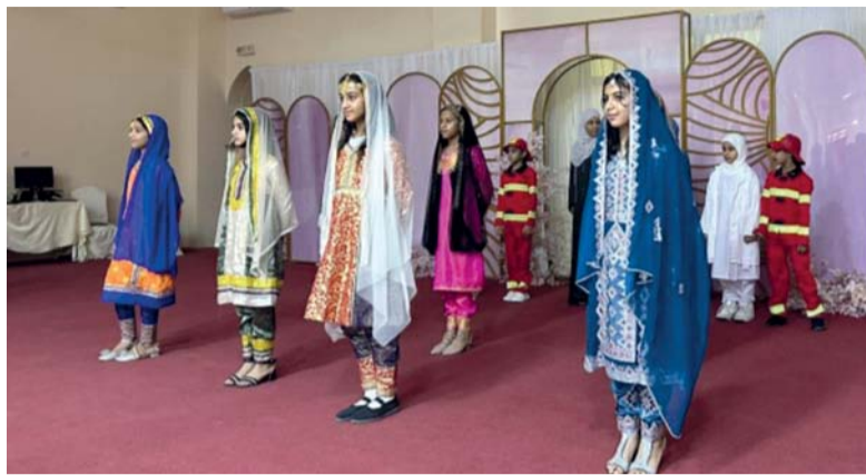
الطالبات يُقدمن أوبريتاً ترحيبياً بالحضور

احتفلت المديرية العامة للتربية والتعليم بمحافظة البريمي بيوم المرأة العمانية والسدي يصادف السابع عشر من أكتوبر من كل عام، وذلك بغرفة تجارة وصناعة عُمان بالمحافظة وبحضور سيف بن حمد العبدلي مدير عام المديرية العامة للتربية والتعليم بمحافظة البريمي والدكتور يوسف بن حمد البادي مدير دائرة الشؤون الإدارية ومديرات المدارس، والهيئات التدريسية. اشتمل الحفل على فقرة ترحيبية قُدمتها طالبات من مدرسة البريمي للتعليم الأساسي، كما ألقى سيف العبدلي مدير عام التربية والتعليم بالبريمي كلمة بهذه المناسبة أثنى فيها على دور المرأة باعتبارها لبنة أساسية في بناء المجتمع، مشيداً بجهود نساء المحافظة في مسيرة التنمية، وتضمن الحفل تقديم عرض مرئي تم خلاله استعراض منجزات من مدارس المحافظة، بعدها تم