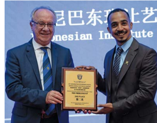
■ العدة العُمانية تحصد جوائز ومراكز متقدمة بمسابقة كأس العالم للتصوير الضوئي للجامعات والمؤسسات الأكاديمية