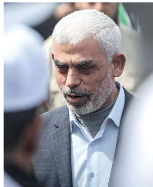
صورة تعود إلى مارس ٢٠٢٢ للشهيد يحيى السنوار وهو يشارك في مسيرة كجزء من يوم الأرض.