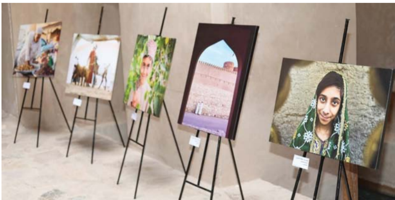
■ أروقة المعرض احتضنت أعمالاً فنيةً مُتنوعة

مجالات وهي: فن الرسم، وفن الخط العربي، وفن التصوير الفوتوغرافي حيث جسدت تلك الأعمال حياة الإنسان وارتباطه بولاية الريستاق. ففي جانب الرسم تنوعت المشاركات بين الرسوم الواقعية والرسوم الراقية والافتراضية من خلال عدد من اللوحات استخدم فيها الألوان الزينية والمائية، أما في مجال التصوير الفوتوغرافي فكانت المشاركات متنوعة عبرت عن حياة الإنسان العُماني في ولاية الريستاق من خلال الحياة اليومية والفنون الشعبية والبناء والتعمير أو من خلال تصوير الطبيعة وارتباطها بالإنسان. وفي مجال الخط العربي شارك عدد من الفنانين بجملة من الخطوط العربية كالنسخ والرقعة والثلث والديواني. كما شاركت إدارة التراث والسياحية بمحافظة جنوب الباطنة بمعرض تراثي اشتمل العديد من المقتنيات الأثرية القديمة، تنوعت ما بين الأسلحة التقليدية كالبنانق والسيف والخناجر والفضيات والتحف وحلي النساء والأدوات المنزلية وأدوات الزراعة والسفريات. وفي نهاية الاحتفال قام راعي المناسبة بتكريم المشاركين والمساهمين والداعمين. ■■