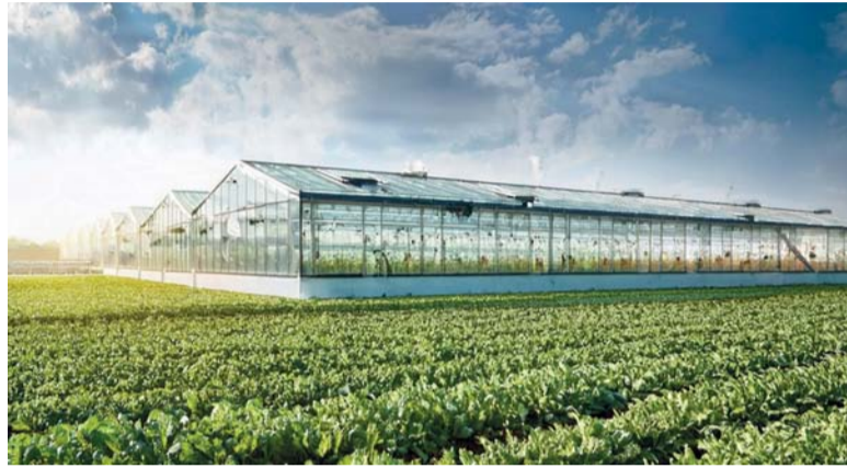
اتفاقيات لتعزيز مجالات الأمن الغذائي

الزراعة وتم توقيع اتفاقية حق انتفاع بين شركة المطاحن العمانية ومجموعة عمران. أعلنت هيئة الخدمات المالية عن اعتماد نسب تخصيص أسهم شركة أوكيو للاستكشاف والإنتاج بعد أن شهد الاكتتاب تغطية حجم الأسهم المعروضة بمقدار ٢,٤ مرة بحصة إجمالية بلغت حوالي مليار و٨١٤ مليون ريال عماني بعد احتساب قيمة السهم بـ ٣٩٠ بيسة وأشارت الهيئة إلى أن حجم الأسهم المحصلة بلغ حوالي ٤ مليارات و ٨٢٠ مليون سهم في حين كانت الأسهم المطروحة للاكتتاب العام مليوني سهم، ما يعكس ثقة المستثمرين المحليين والأجانب في الشركة المصدرة وسوق رأس المال العماني إضافة إلى جاذبية الاقتصاد الوطني بشكل عام. موارد المياه في ختام أعماله اليوم ٤١ مشروعاً استثمارياً بمختلف القطاعات بقيمة استثمارية تجاوزت ٤٥ مليون ريال عماني وعدد ٦٦ فرصة استثمارية كما خرج المختبر بـ ٢٤ مبادرة تمكينية لمشاريع في قطاع الأمن الغذائي وتطوير الخدمات اللوجستية وتدشين منصتي ثروات وزاد. وقعت وزارة الإسكان والتخطيط العمراني عدد (١٧٧) اتفاقية في مجال الأمن الغذائي بقيمة استثمارية بلغت أكثر من ٣٢,٣ مليون ريال عماني بمساحة تزيد عن ١٣,٧ ألف فدان كما تم توقيع عدد (١٤) عقدا استثمارياً في القطاع السمكي بقيمة استثمارية بلغت أكثر من ٣٦,٨ مليون ريال عماني كما تم توقيع مذكرة تفاهم بين شركة المطاحن العمانية وشركة النجد للتعمية