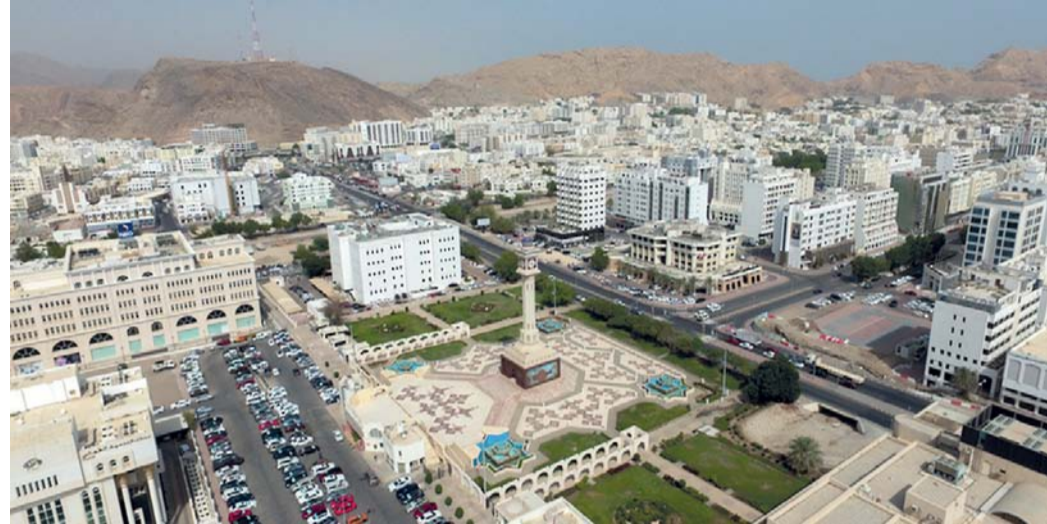
صعود رصيد ائتمان شركات القطاع المصرفي العماني

وأكد أن مشروع الأقماع الصناعية والذكاء الاصطناعي يعد الأول من نوعه على مستوى سلطنة عمان، متوقفاً أن يسهم المشروع في تحسين البنية التحتية التقنية، وتعزيز الأمن السيبراني، علاوة على دوره في دعم التنمية الاقتصادية والاجتماعية بالمحافظة. وأوضح العريمي أنه وبموجب الاتفاقية تقوم عمانتل بتزويد المحافظة بصور وبيانات عالية الدقة معالجة بتقنيات الذكاء الاصطناعي تدعم تطبيقات متنوعة مثل التخطيط الحضري والزراعة والملاحة والطاقة المتجددة تساعد على اتخاذ قرارات مناسبة أسرع وأدق بشأن الخدمات البلدية ومشاريع البنية التحتية في محافظة جنوب الشرقية.