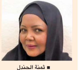
■ ثمنة الجندل