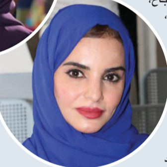
■ أمل الشقسية

إلى جانب رُبّات المنازل اللاتي لا تقل أهميتهن عن جميع العاملات في كافة المجالات، وما كان لحقها هذا الإجلال العظيم إلا بعد أن أولاهنا حضرة صاحب الجلالة السلطان قابوس بن سعيد - طيب الله ثراه - هذه المكانة الرفيعة وخصص لها يوماً معلوماً من كل عام؛ ليكون تكريماً لها وشهادة موثوقة بحقها علماً وإيماناً و يقيناً منه رحمه الله بأنها تستحق هذا التكريم؛ اعترافاً مجزوماً بكل ما تقدمه لوطنها، فما مدّت جنورها في أي أرض قاحلة إلا وحولتها لجنّة غناء بحكمتها وعطائها وتقانيها بأيّ دور تشغله، مهما كان صعباً تراه يستحق العناء، فشكراً لكل امرأة عُمانية حررت طاقتها المتكونة بذاتها لأجل الوطن الساكن بين أضلعها، والذي تربت ونشأت فيه لتكون قدوة بين نساء العالم ورمزاً للتواضع والشجاعة والصمود.