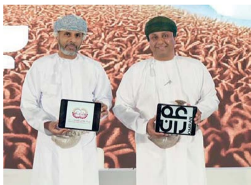
■ الاتفاقية تلي احتياجات السوق المحلي وتعزز استدامة القطاع الغذائي