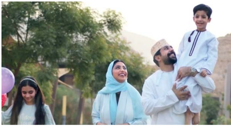
■ القيمة المستهدفة من منفعة دعم دخل الأسر هي ١١٥ ريالاً عمانياً

وقال إنه بالنسبة لم توسط قيمة المنفعة فقد بلغ (١٣٥) ريالاً عمانياً، فيما تم تسجيل أعلى قيمة لمنفعة دعم الأسر بمبلغ وقدره (٣٩٨) ريالاً عمانياً أما بالنسبة لمؤشرات المنتفعين من منفعة دعم دخل الأسر في المرحلة الأولى حسب المحافظات، فقد جاءت في المرتبة الأولى محافظة شمال الباطنة، حيث تم صرف المنفعة لـ (٢٨٠٧) أسرة، تليها محافظة مسقط حيث بلغ عدد الأسر (٢١١٨) منتفعاً، و (١٥٤٢) منتفعاً في محافظة جنوب الشرقية، أما في محافظة شمال الشرقية فقد تم الصرف لـ (١١٠٤) منتفعاً، وجاءت في المرتبة الخامسة لفئة غير المبني مقر الإقامة فقد بلغ عددهم (١٠٣٩) منتفعاً، وفي محافظة جنوب الباطنة (٩٠٦) منتفعاً، وفي محافظة الداخلية (٨٨٥) منتفعاً، وفي محافظة الوسطى (٧٦٥) منتفعاً، و (٥٨٧) منتفعاً في البريمي فقد بلغ (٤٩٠) منتفعاً، وفي محافظة الوسطى (٢٥٠) منتفعاً ومحافظة مسندم (٢٣٩) منتفعاً.