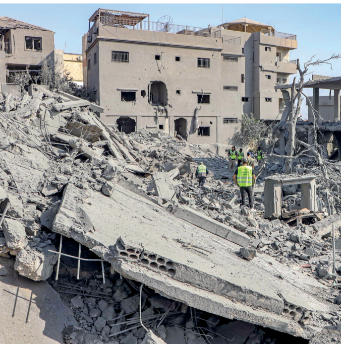
أفراؤ الدفاع المدني يبحثون عن ناجين بين أنقاض مبنى مدمر في موقع غارة جوية إسرائيلية، ليلاً على قرية قانا جنوب لبنان.