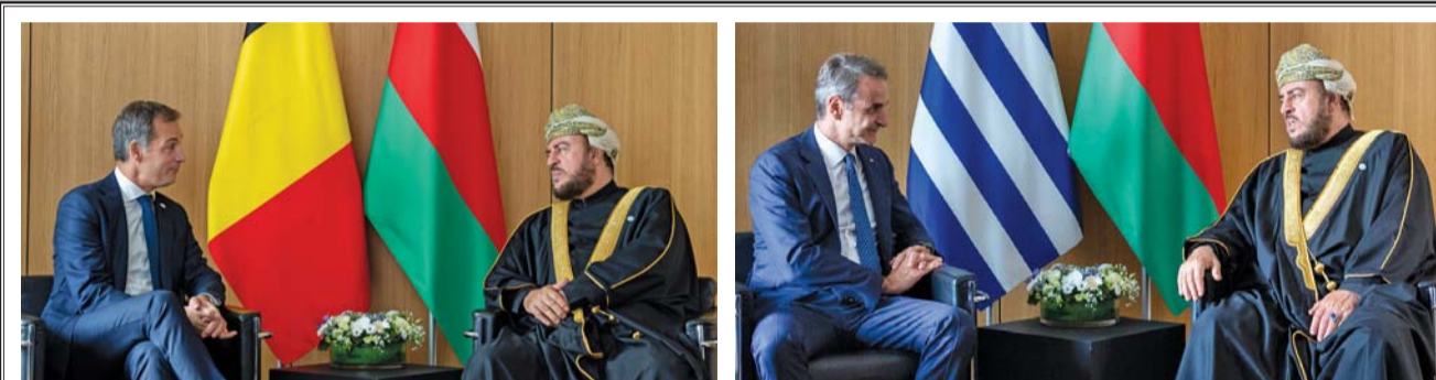
... وأثناء لقائه مع رئيس وزراء بلجيكا

سموه يؤكد: مرحلة متقدمة تعكس الرؤية المشتركة في توسيع آفاق الشراكة الاستراتيجية وتعميق التعاون القائم