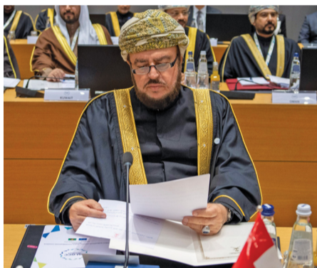
أسعد بن طارق يؤكد على تعميق التعاون مع أوروبا

أمام قمة «التعاون» والأوروبي.. تأكيد عماني على توسيع آفاق الشراكة الاستراتيجية ودعوة متجددة لتنفيذ حل الدولتين