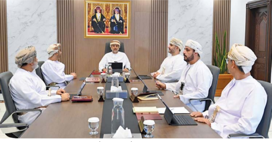
■ مجلس المناقصات أثناء اجتماعه أمس.

للتقديم الخدمات الاستشارية لإعداد المخطط الهيكلي لمسقط الكبرى بقيمة ٤٩٥ ألفاً و٩٧١ ريالاً عُمانياً، والأعمال الإضافية لأعمال الخدمات الاستشارية للتطوير والإشراف على ميناء الصيد البحري بولاية ببا بقيمة ٤٠٥ آلاف و٢٦٦ ريالاً عُمانياً، والأعمال الإضافية لمشروع صيانة الطرق الترابية بالمناطق الجبلية بمحافظة ظفار لمدة خمسة سنوات بقيمة ٤٠٠ ألف ريال عُمانياً، والأعمال الإضافية لمشروع رفع كفاءة مركز مدحا الصحي بمحافظة مسندم ليصبح مستشفى مدحا الجديد بقيمة ٣٩٥ ألفاً و١٦٦ ريالاً عُمانياً، والأعمال الإضافية وتمديد مشروع إنشاء المباني الإدارية والخدمات بميناء الصيد البحري بجزر الحلايبات بقيمة ٣٢٤ ألفاً و٦١٨ ريالاً عُمانياً، والأعمال الإضافية لتطوير وتنفيذ واستضافة ودعم الجوانب الصحية الإلكترونية بقيمة ٤٤٥ ألفاً و٤٤٥ ريالاً عُمانياً.