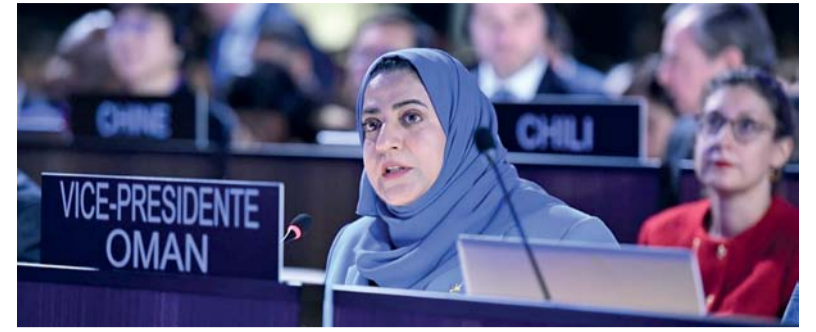
■ الوفد العماني المشارك أكد مكانة التعليم في سلطنة عُمان الذي ينسجم وفق ما دعت إليه رؤية عُمان (٢٠٤٠)

٢٦ أكتوبر الجاري. وقال سعادة الدكتور حمد بن محمد الضوياني رئيس هيئة الوثائق والمحفوظات الوطنية إن اختيار محافظة شمال الباطنة، لإقامة الندوة والمعرض الوثائقي المصاحب جاء في إطار استمرارية الجهود التي تبذلها الهيئة للتعريف وإبراز منجز الإنسان العماني على مر الحقب الزمنية المختلفة، وفي مختلف الأماكن، وكذلك استمراراً للندوات والمعارض التي أقامتها الهيئة عن محافظة مسندم، ومحافظة البريمي، ومدينة نزوى، ومحافظة الظاهرة، ومحافظة جنوب الشرقية مؤكداً أن محافظة شمال الباطنة بولاياتها الست (صحار، صحم، الخابورة، السويق، لوى، شناص) غنية بمفردات تاريخية وإرث تاريخي موغل في القدم، وشواهد حضارية قديمة، وتسلط الضوء والتعمق في مفردات هذا التاريخ أمر مهم للتعريف بدوره الفاعل في مجريات التاريخ العماني، وأضاف سعادة الدكتور: الندوة ستناقش في المحور التاريخي والسياسي الموقع الجغرافي وأهميته التاريخية، والأحداث السياسية، والمعاهدات والاتفاقيات، والشخصيات المؤثرة والفاعلة تاريخياً.