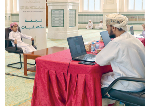
تقييم أحد المشاركين

(حفظ ٢٤ جزءاً متتالياً)، والمستوى الثالث (حفظ ١٨ جزءاً متتالياً)، والمستوى الرابع (حفظ ١٢ جزءاً متتالياً لمن هم في سن ٢٥ عاماً فما دون)، والمستوى الخامس (حفظ ٦ أجزاء متتالية لمن هم في سن ١٤ عاماً فما دون)، والمستوى السادس (حفظ ٤ أجزاء متتالية لمن هم في سن ١٠ أعوام فما دون)، بينما المستوى السابع (حفظ جزءين متتاليين لمن هم في سن ٧ سنوات فما دون).