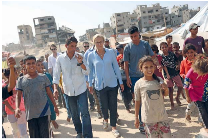
مُنسقة الأمم المتحدة للشؤون الإنسانية وإعادة الإعمار في غزة سيجريد كاج تزور مخيمًا مؤقتًا للمنازحين الفلسطينيين في مواصي خان يونس في جنوب قطاع غزة.

خمسة شهداء وجرحى جراء قصف إسرائيلي استهدف منزلاً لعائلة «القرم» يسكن فيه أسر نازحة بجوار برج الإيطالي بمنطقة النصر شمال غرب مدينة غزة. واستشهد عشرون فلسطينياً خلال غارات على المنطقة الوسطى من القطاع خلال الأربع وعشرين ساعة الماضية كان آخرهم شهيدان