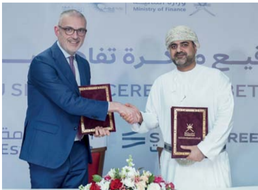
البرنامج يدعم القطاع المالي العُماني بأفضل الخبرات والحلول المالية والاستثمارية

مسقط. العُمانيّة: وقعت وزارة المالية ممثلة في البرنامج الوطني للاستدامة المالية وتطوير القطاع المالي (استدامة) مذكرة تفاهم مع شركة ستيت ستريت، لتعزيز الابتكار والنمو في القطاع المالي وذلك في إطار الجهود المستمرة في تعزيز التعاون مع المؤسسات المالية الدولية، ودعم القطاع المالي العُماني بأفضل الخبرات والحلول المالية والاستثمارية وقد وقع مذكرة