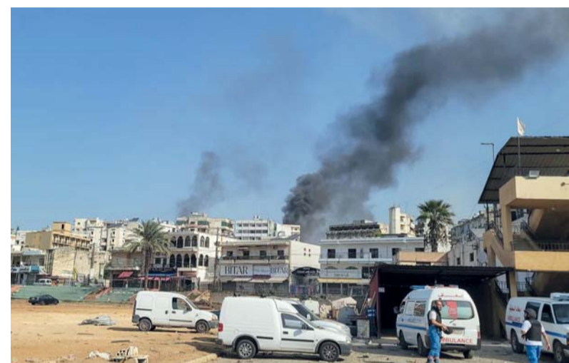
رجال الإنقاذ يقومون بعملهم مع تصاعد الدخان خلال الغارات الجوية الإسرائيلية على مدينة النبطية بجنوب لبنان.

أخرى في صف ومحيطها ولم يبلغ عن وقوع إصابات بسبب ما جاء في بيان الجيش.