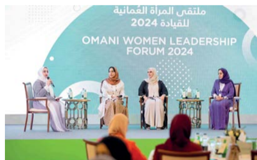
بنك ظفار يقدم للمرأة خطط التوفير وخدمات بنائيات واسعة

حصل بنك ظفار على جائزة أفضل خدمات مصرفية للمرأة في سلطنة عمان للعام الحالي وذلك ضمن جوائز مجلة تابلوبد للمرأة البريطانية تقديراً لجهود البنك المتميزة في تلبية المتطلبات والتطلعات المصرفية للنساء وقد أبدى بنك ظفار أهمية المرأة في سلطنة عمان اهتماماً