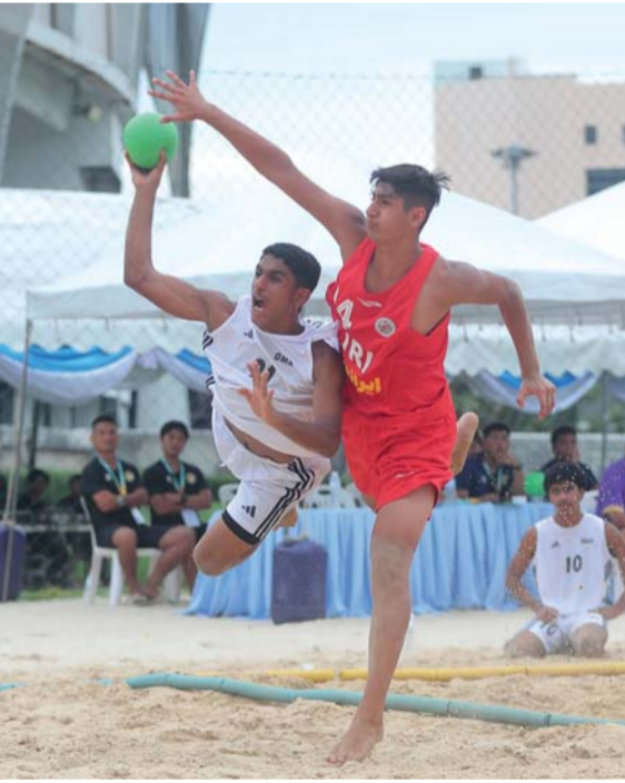
لاعب المنتخب في محاولة التسديد أمام المرمى الإيراني

دقائق ظهرها بتوقيت سلطنة عمان، حيث يسعى منتخبنا إلى تحقيق فوزه الأول والعودة مجدداً إلى أجواء المنافسة على أحد المراكز الثلاثة الأولى وأن أي خسارة جديدة سوف تضع المنتخب في موقف مخرج ويدرك لاعبو منتخبنا والجهان الفني مهمة اليوم، وسيعدون العدة لها من أجل تحقيق الفوز الأول.