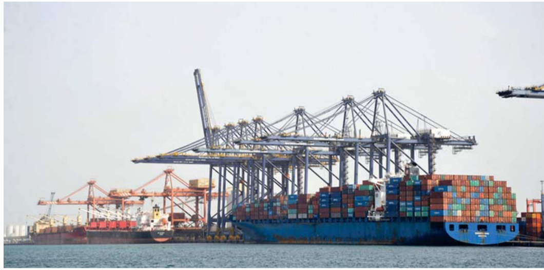
الميزان التجاري يسجل فائضا بنهاية شهر يوليو الماضي

وجاءت المملكة العربية السعودية ثانياً في الصادرات العُمانية غير النفطية وبما قيمته ٤٦٨ مليون ريال عماني تلتها كوريا الجنوبية بـ ٣٩٢ مليون ريال عماني فيما جاءت إيران في المرتبة الثانية في إعادة التصدير بما قيمته ٢٠٣ ملايين ريال عماني ثم الصين بـ ٥٧ مليون ريال عماني في حين جاءت دولة الكويت في المرتبة الثانية في الدول المصدرة لسلطنة عُمان بـ ٩٨٣ مليون ريال عماني تلتها الصين بما قيمته ٩٦٥ مليون ريال عماني.