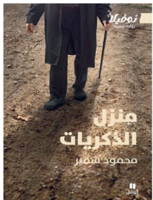
■ غلاف الرواية

منذ سنوات حين قرأت روايتي الياباني والكولمبي كواباتا وماركين، وبقية حائراً في الكيفية التي ستكون عليها الرواية، وضمن عملية الإعداد لكتابها قرأت كذلك كتاب ابن قتيبة عن أخبار النساء، وكتاب ابن القيم عن النساء، واقتطعت من الكتابين ما توقعت أنه سيثري الرؤية الفلسطينية لماهية الحب في زمن الشيخوخة، وعلاقة ذلك كله بزمن الاحتلال الذي يسعى إلى تهويد القدس وابتلاع الأرض وضنها إلى دولة الاحتلال بعد حرب الإبادة الراهنة ومحاولات التهجير القسري للشعب الفلسطيني. أخيراً جاءت اللحظة المواتية لكتابة الرواية حين ظهرت شخصية أسمهان التي أشعلت الكتابة وجعلتها ممكنة. وأضاف: الرواية متناصلة من ثلاثيني الرواية: فرس العائلة، مديح لنساء العائلة، ظلال العائلة، حيث بطل الرواية محمد الأصغر والبطل المساند رهوان هما من أبناء عائلة العبد اللات التي ترمز في امتدادها وشتاتها إلى الشعب الفلسطيني في