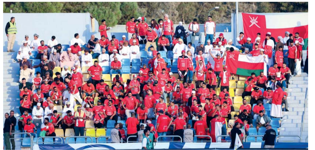
جماهيرنا خرجت حزينة بعد الخسارة برباعية