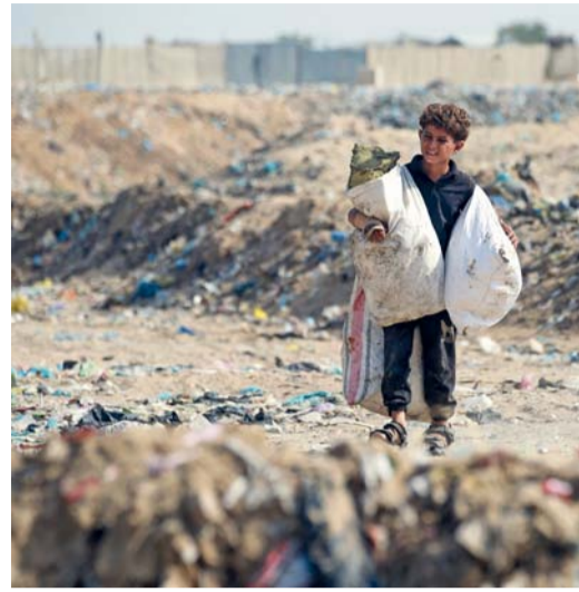
صبي يحمل أكياساً بعد فرز النفايات في مخبّ نفايات في خانونس جنوب قطاع غزة.

في قصف يعود لمنزل عائلة أبو مدين شرق مخيم البريج وسط القطاع. وارتقى أربعة شهداء ووقع مصابون جراء قصف الاحتلال لمجموعة فلسطينيين على نوار بلدة بني سهيل شرق مدينة خانونس بينهم ابن وابنه وحفيده من عائلة أبو مغمم. وواصل جيش الاحتلال تدمير المنازل في رفح فيما تمكنت فرق الإسعاف من انتشال جثمان شهيد واحد من حي الجنية شرق رفح. يأتي ذلك فيما قال رئيس البنك الدولي، أجاي بانجا إن الأضرار المادية جراء الحملة العسكرية الإسرائيلية على غزة تتراوح الآن على الأرجح بين ١٤ و ٢٠ مليار دولار، وإن تكلفة الدمار الناجم عن القصف الإسرائيلي لجنوب لبنان ستزيد من هذه التكلفة. وحذر بانجا في مقابلة مع رويترز نكست، من أن اتساع نطاق الحرب التي تشنها إسرائيل في غزة بشكل كبير قد يؤدي إلى تأثيرات كبيرة على الاقتصاد