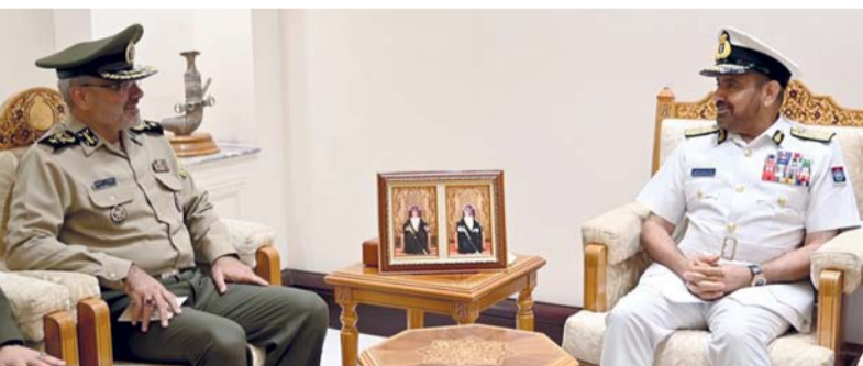
عبدالله الرئيسي أثناء لقائه محمد أحدي

مرافق المركز وما زود به من تقنيات وأنظمة تلبى واجباته الوطنية. كما زار رئيس الوفد الإيراني الكلية العسكرية التقنية، وكان في استقباله لدى وصوله مقر الكلية مساعد عميد الكلية العسكرية التقنية للشؤون الأكاديمية، واستمع إلى إيجاز عن الكلية العسكرية والملاحة في المناطق البحرية لسلطنة عُمان، واطلعوا على