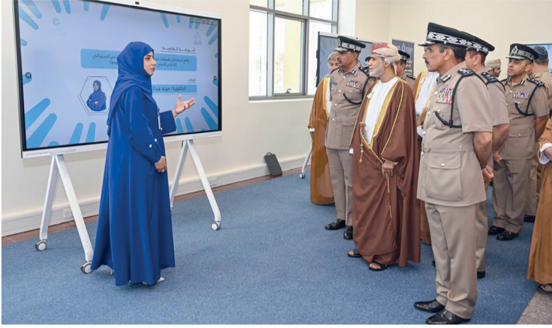
المؤتمر ناقش نور الإعلام الأمني الرقمي في التوعية بالأزمات

ودوره في التحليل الجنائي ومكافحة الجريمة، ودور تطبيقات الذكاء الاصطناعي في تعزيز منظومة العمل الجنائي بسلطنة عُمان، وحماية الملكية الفكرية لتطبيقات الذكاء الاصطناعي. كما استعرضت أوراق العمل في اليوم الأول الإصدار التشريعي للإبداع والابتكار في العمل الشرطي بسلطنة عُمان، والأساليب البديلة لاسترداد الأموال المتحصلة عن جرائم الفساد في التشريع العُماني، والطبيعة القانونية للوكيل الذكي بالذكاء الاصطناعي، ودور الإعلام الأمني الرقمي في التوعية بالأزمات المحلية في عصر الذكاء الاصطناعي، وتوظيف الإعلام الأمني لتطبيقات الذكاء الاصطناعي في غرس الهوية والمواطنة لدى المجتمع العُماني، وواقع استخدام تطبيقات الذكاء الاصطناعي في تعزيز الأمن السيبراني.