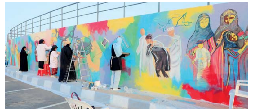
■ مشاركة واسعة للفنانين التشكيليين في المشروع

كثير من تقلبات حياته وظروفه. فالرواية مؤسسة على تناسخ مثير مع روايتين معروفتين في الأدب العالمي، بحيث أزعج أن ثمة رؤية فلسطينية لزمن الشيخوخة وللحب والحياة والمصير إلى جانب، وفي تفاعل مع الرويتين اليابانية والكولومبية. وضمن هذا السياق ثمة مقتطفات تعزز الرؤية الفلسطينية من كتابين من كتب التراث عن النساء وميولهن وامزجتهن، وبالطبع لن تكتمل الصورة أو الرؤية إلا بموضعتها في إطار الوضع الراهن الذي يعيشه الشعب الفلسطيني، حيث الاعتقالات والصفحة الغربية. وتفصح الرواية بعض جوانب الخلل في الأوضاع الداخلية للشعب الفلسطيني، تلك السلبات التي تزداد تقاماً مع وجود الاحتلال الإسرائيلي الذي يشجع عليها. مع ذلك فإن باب الأمل يظل مائلاً، والشعب الفلسطيني يواصل تشبته بالحياة والأمل والمستقبل.