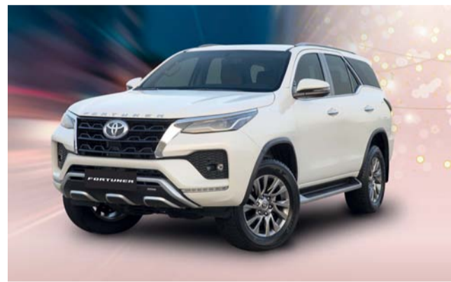
عروض وأداء مشوق من فورشرز

وتتفهمها في كل ظروف القيادة. و تتميز بتصميم داخلي متقن يجمع بين الراحة والرفقي ومقاعد جلدية فاخرة وعجلة قيادة من الجلد والخشب مع مبدلات سرعات ونظام تثبيت السرعة وتعد مقصورة فورشرز ملاذاً