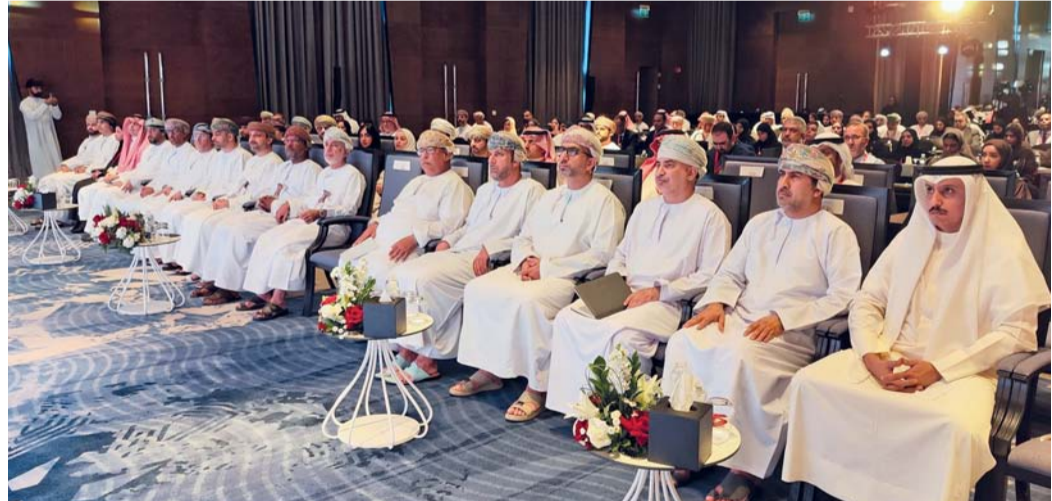
الحلقة تتناول دراسة وتقييم استراتيجيات التنويع الاقتصادي

مسقط - العُمانية: انطلقت يوم أمس بمسقط أعمال حلقة العمل الثامنة لتبادل الخبرات في مجال بناء واستخدامات النماذج الاقتصادية التي ينظمها البنك المركزي العُماني بالتعاون مع الأمانة العامة لمجلس التعاون لدول الخليج العربية لتعزيز التعاون المشترك بين دول المجلس في مجال النمذجة الاقتصادية وتطبيقاتها. وتناقش الحلقة التي تستمر يومين أحدث التطورات في مجال النماذج الاقتصادية ودورها في دعم عملية صنع السياسات الاقتصادية والمالية بالإضافة إلى دراسة وتقييم استراتيجيات التنويع الاقتصادي وتأثير التغيرات العالمية على تنبؤات ومعدلات النمو. وتستعرض الحلقة عددا من الرؤى الوطنية وبرامج التنويع الاقتصادي وسياسات التغيير المناخي والمخاطر المتعلقة به بالإضافة إلى الآثار الجيو اقتصادية بمشاركة نخبة من الباحثين من دول مجلس التعاون والمهتمين في