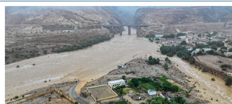
جريان أحد أودية المناطق المتأثرة بالحالة الجوية