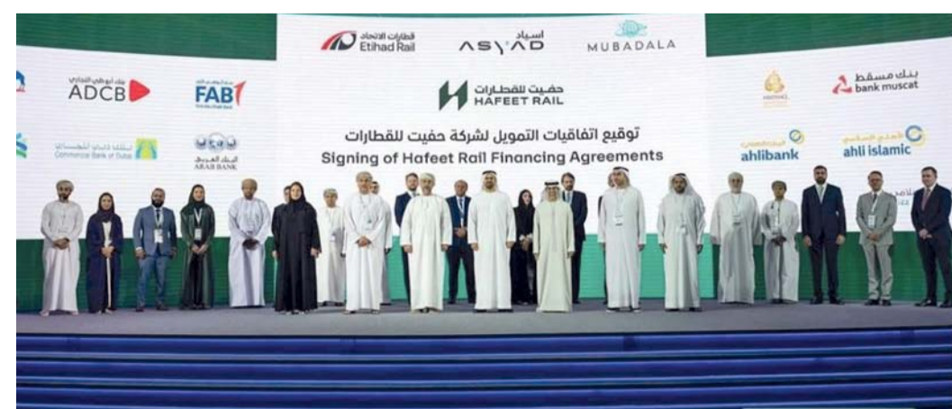
مساهمة بنك عمان العربي في تمويل أول خط للسكك الحديدية

مجال التغيرات العالمية وتأثيراتها على خطط التنويع الاقتصادي على مستوى دول الخليج العربية. في حين تناقش الحلقة اليوم اقتصادات الطاقة ورفع الكفاءة ونماذج تقييم المخاطر المالية وتأثير التغيرات الجيوسياسية على الصادرات غير النفطية وتدفعات التجارة في المنطقة بالإضافة إلى الاقتصاد الأخضر والابتكار التقني وأهمية الاستثمار في رأس المال البشري. وتعد هذه الحلقة من بين المبادرات التي تنظمها المصارف المركزية في دول مجلس التعاون من أجل تعزيز المعرفة وتبادل الخبرات والتجارب بين الخبراء والمختصين من مختلف المؤسسات الحكومية والأكاديمية والبحثية. كما تعد النمذجة الاقتصادية أداة تزود واضعي السياسات الاقتصادية وصانعي القرار ببيانات ومداخلات نوعية ترتبط بمجموعة من النتائج والعوائد المتوقع تحقيقها نتيجة لتطبيق الخطط والسياسات والبرامج المختلفة.