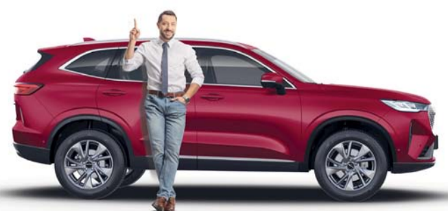
عروض حصريّة من هافال