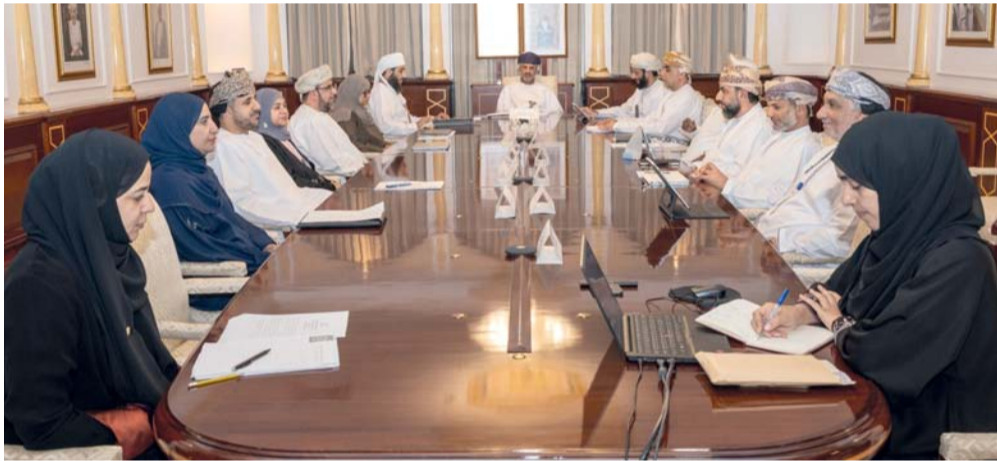
اللجنة الوطنية لأخلاقيات البيولوجيا أثناء اجتماعها أمس

الملاحظات التي تتعلق بالتوصيات الختامية للجنة الدولية المعنية بالمرأة حول استعراض التقرير الوطني الرابع لاتفاقية القضاء على جميع أشكال التمييز ضد المرأة (سيداو). بعد ذلك استعرضت مشاركة اللجنة في اجتماعات الدورة ٣١ للجنة الدولية لأخلاقيات البيولوجيا بباريس ١٦-١٧ سبتمبر ٢٠٢٤م. وكذلك استكمال مناقشة موضوع القضايا الأخلاقية المتعلقة بالإنجاب عند ذوي الإعاقة الذهنية.