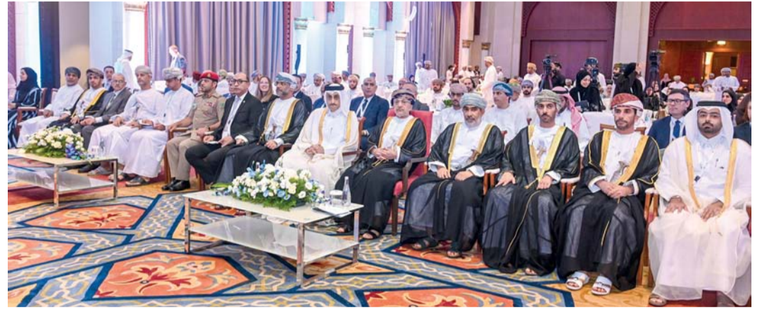
الملتقى يعقد ضمن فعاليات برنامج صور عاصمة السياحة العربية

عائدات السياحة الدولية بلغت أكثر من ١,٨ تريليون دولار أميركي