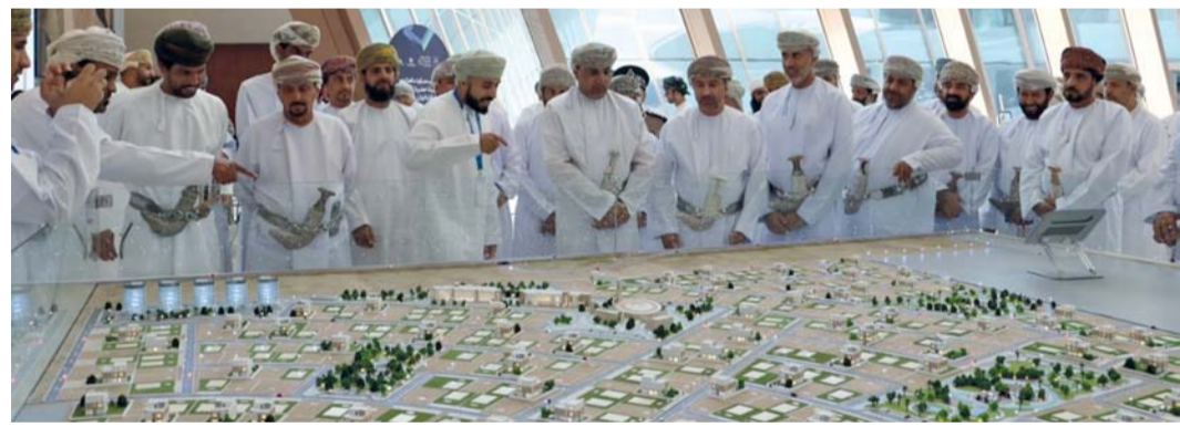
استعراض أبرز المشاريع المستقبلية والأحياء السكنية المتكاملة

منح. من سالم بن خليفة البوسعيدي: افتتح أمس المعرض المصاحب لفعاليات «أكتوبر العمران» في نسخته الرابعة بشعار (إشراك الشباب نحو خلق مستقبل حضري أفضل) الذي تنظمه المديرية العامة للإسكان والتخطيط العمراني بمحافظة الداخلية على مدى يومين برعاية سعادة الشيخ هلال بن سعيد الحجري محافظ الداخلية بحضور عدد من أعضاء مجلس الشورى وممثلي المجالس البلدية وطلبة المدارس والمعوين. يتضمن المعرض التوعوي مجموعة من الأركان التي تهدف إلى التعريف الزائرين على أبرز الخدمات الإسكانية التي تقدمها وزارة