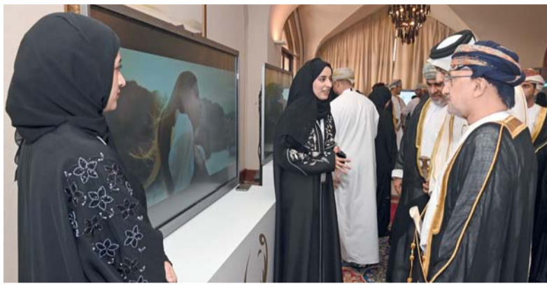
المعرض المصاحب للملتقى

انطلقت صباح أمس أعمال الملتقى العربي الثاني لإحصاءات السياحة والذي تستضيفه سلطنة عُمان ممثلة في المركز الوطني للإحصاء والمعلومات بالتعاون مع وزارة التراث والسياحة وجامعة الدول العربية، وذلك برعاية معالي سالم بن محمد المحروقي وزير التراث والسياحة وبحضور سعادة الدكتور خليفة بن عبدالله البرواني الرئيس التنفيذي للمركز الوطني للإحصاء والمعلومات، وتأتي استضافة الملتقى ضمن برنامج صور عاصمة السياحة العربية لعام ٢٠٢٤ ويستمر ثلاثة أيام. وقال معالي سالم بن محمد المحروقي وزير التراث والسياحة: تشهد المنطقة العربية نموا سياحيا ملحوظا قياسا ببقية المناطق الجغرافية الأخرى، كما أن حجم الاستثمار والتدفق السياحي كبير للغاية وهناك جهود منظمة من الجهات المسؤولة عن القطاع السياحي بالمنطقة العربية؛ لتوظيف المقومات التاريخية والطبيعية والتراثية في هذه المنطقة بما يليق بها وإسهامها في السياحة العالمية، كما أن هناك تأثيرا نسبيا على عدد السياح القادمين إلى سلطنة عُمان جراء الأحداث، وتمثل ذلك في إلغاء بعض الحجزات وهذا شيء متوقع، ولكن في المقابل فإن المؤشرات السياحية بسلطنة عُمان تشير إلى أن هناك نموا وتدفقا سياحيا ثابتا وبيش سياحة شتوية مضاعفة خلال الفترة القادمة خاصة وأن