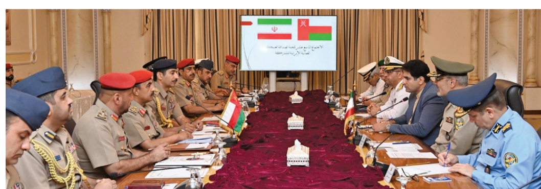
■ اجتماع لجنة الصداقة العسكريّة العُمانيّة الإيرانيّة

البلدين الصديقين. وقال معاليه في تصريح لوكالة الأنباء العُمانيّة إن مناقشاته خلال لقائه مع معالي السيد بدر بن حمد البوسعيدي وزير الخارجية بمسقط كانت مثمرة، وتناولت الأحداث الجارية في المنطقة، مُشيراً إلى أن سلطنة عُمان تقوم بأدوار كبيرة في حلحلة العديد من القضايا الإقليمية والدولية. ولفت معاليه إلى أن المنطقة تعيش حالة من التأهب، وقد تكون على حافة صراعات واسعة، خصوصاً في ظل الأوضاع المتوترة التي تشهدها حالياً. وأكد معاليه على أن بلاده في وضع الاستعداد التام