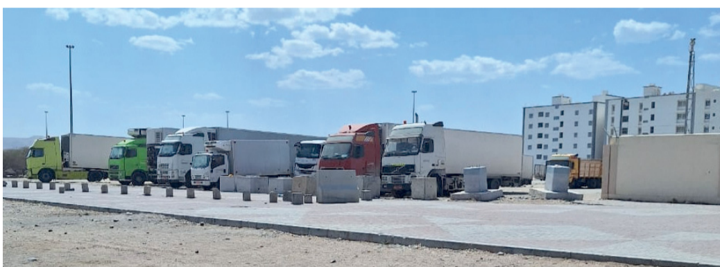
■ العضوائية وعدم الالتزام بالنظم المتبعة أدت إلى افتقاد الخصوصية للسكان

مشيرين إلى أن هذه المناشدات ليست وليدة اللحظة وإنما تم توجيهها سابقاً، وظل أصحاب الشاحنات فترة من الزمن ملتزمين إلا أنه خلال الفترة الأخيرة، رجع الأمر إلى ما كان عليه، دون مراعاة لحرمان المكان والقاطنين فيه، وهذا يتطلب إيجاد الردع الذي يحافظ على خصوصية الأحياء السكنية وفق الأطر والنظم المعمول بها بما يضمن لهم الراحة والسكنية وانسيابية الحركة، بعيداً عن وجود العوائق التي تضيق عليهم التنقل والحفاظ على حياة هائلة تعود على الجميع بالنفع والأمان والاستقرار النفسي والمجتمعي.