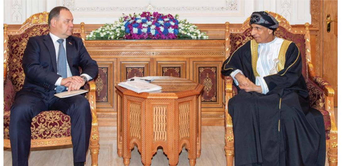
■ فهد بن محمود لدى استقباله رئيس الوزراء البيلاروسي

جولوفتشينكو رئيس وزراء جمهورية بيلاروس، خلال زيارته الرسمية الحالية لسلطنة عُمان. جرى خلال المقابلة استعراض علاقات الصداقة والتعاون القائم بين البلدين الصديقين والدور الذي تضطلع عليه مجموعة الصداقة البرلمانية بين سلطنة عُمان وجمهورية بيلاروسيا في دعم وتطوير التعاون الثنائي خصوصاً في المجالات التشريعية. وتطرقت المقابلة إلى التطور الكبير الذي تشهده سلطنة عُمان على المستويين المحلي والدولي، والقواسم المشتركة بين البلدين خاصة فيما يتعلق بتطوير التعاون البرلماني، والتبادل التجاري، والصناعي، وفي مجال النقل والاتصالات والعلاقات المتميزة بين الطرفين، وأهمية توسيعها وتعزيزها.