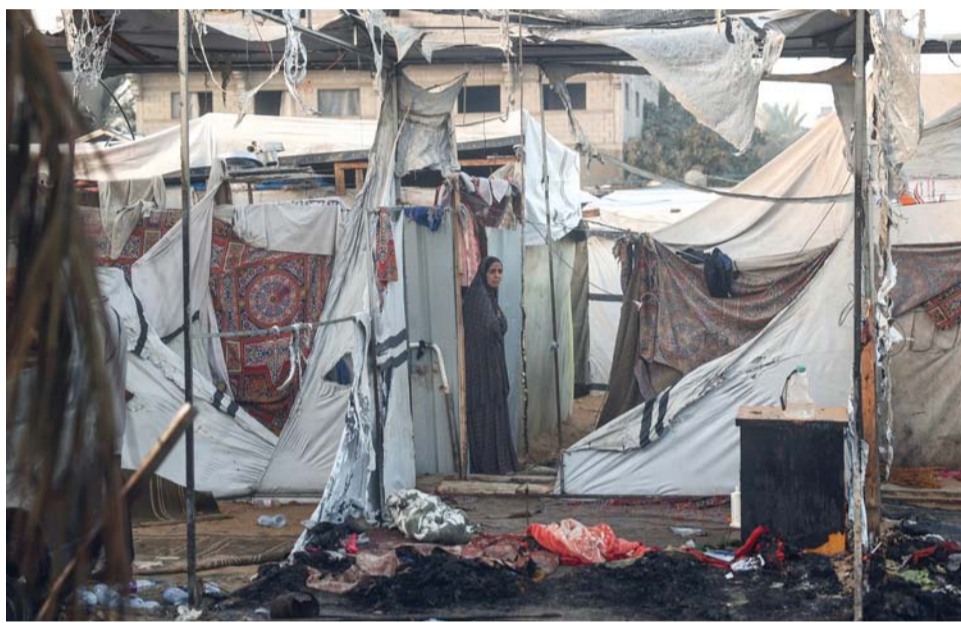
فلسطينية تتفحص الدمار الذي أعقب غارة للجيش الإسرائيلي حول خيام النازحين داخل أسوار مستشفى شهداء الأقصى في دير البلح وسط قطاع غزة

مستشفى شهداء الأقصى وسط القطاع. وكان الاحتلال نفذ عدة غارات على مخيم النصيرات والبريج أدت لاستشهاد نحو ٢٥ فلسطينياً. ويواصل جيش الاحتلال عملياته العسكرية البرية في جباليا شمال قطاع غزة لليوم العاشر على التوالي. وتحاصر قوات الاحتلال شمال غزة من جميع الاتجاهات وتمنع دخول المواد الغذائية والطبية. وقال الإعلام الحكومي إن نحو ٣٠٠ فلسطيني استشهدوا خلال الحملة وإن عدداً من جنائين الشهداء لا تزال في الشوارع وتحت ركام المنازل. كما يتعرض شمال غزة لمجاعة تهدف لإخراج السكان منه. واستشهد فلسطينيان واصيب خمسة في استهداف الاحتلال مجموعة من الفلسطينيين حاولوا العودة لمنزلهم في منطقة جباليا النزلة شمال غزة. وارتقى شهداء وسقط مصابون بقصف مدرسة الغالوجا شمال القطاع. واستشهد ثلاثة فلسطينيين ووقع مصابون إثر قصف إسرائيلي تجمعا للفلسطينيين في محيط مفترق الصاروخ شمال غزة. وارتقى شهيدان في قصف إسرائيلي استهدف فلسطينيين في محيط مدرسة عين جالوت بحي الزيتون جنوب مدينة غزة. وارتقى ثلاثة فلسطينيين بقصف إسرائيلي شمال مدينة رفح جنوب قطاع غزة. واستشهد الفلسطيني زايد العمور في قصف مدفعي إسرائيلي على بلدة الفخاري شرق مدينة خان يونس، وفي الضفة اعتقلت قوات الاحتلال الإسرائيلي ٢٥ فلسطينياً من محافظة بيت لحم.