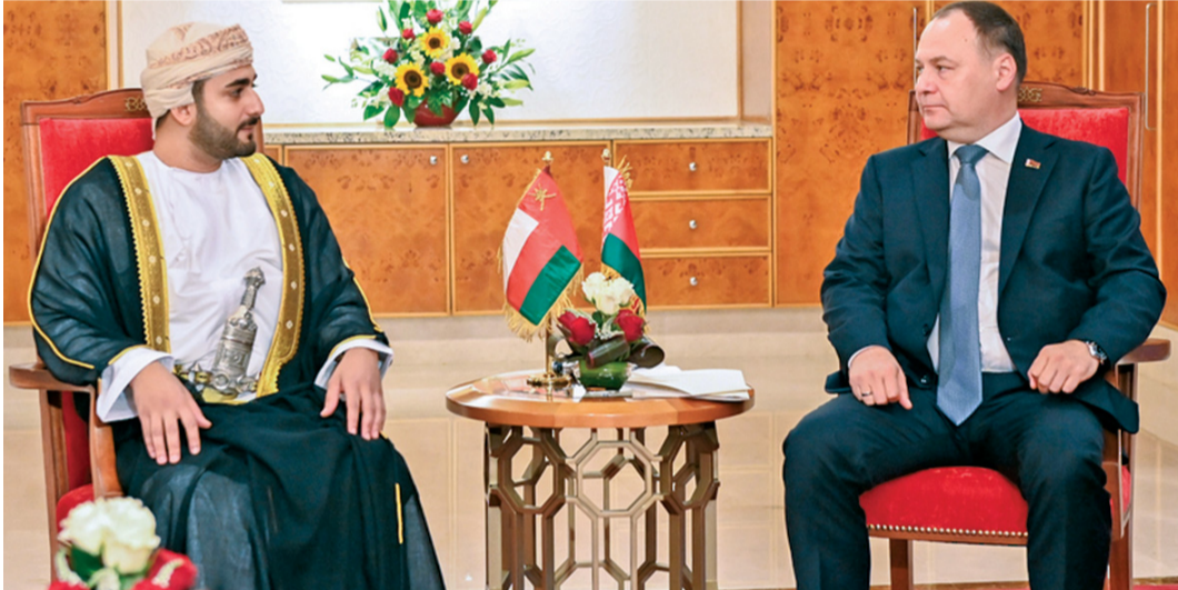
■ ذي يزن بن هيثم أثناء لقائه رومان جولوفتشينكو