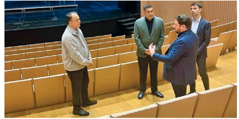
مركز أتاتورك الثقافي يعد واحداً من أبرز المعالم المعمارية والثقافية بتركيا

مسقط. العمانية: تنظم هيئة الوثائق والمحفوظات الوطنية الندوة العلمية (محافظة شمال الباطنة في ذاكرة التاريخ العماني) والمعرض الوثائقي المصاحب لها، في الفترة من ٢١ إلى ٢٣ أكتوبر الجاري، في محافظة شمال الباطنة بولاية صحار. وستناقش الندوة ٢٩ ورقة عمل يلقيها عدد من الباحثين، مقسمة على ٣ محاور هي: المحور التاريخي والسياسي، والمحور الاقتصادي والاجتماعي، والمحور الثقافي. وتهدف الندوة إلى التعريف بالدور التاريخي الذي قامت به محافظة شمال الباطنة عبر تاريخها وانعكاس ذلك الدور على تاريخ المحافظة بوجه خاص