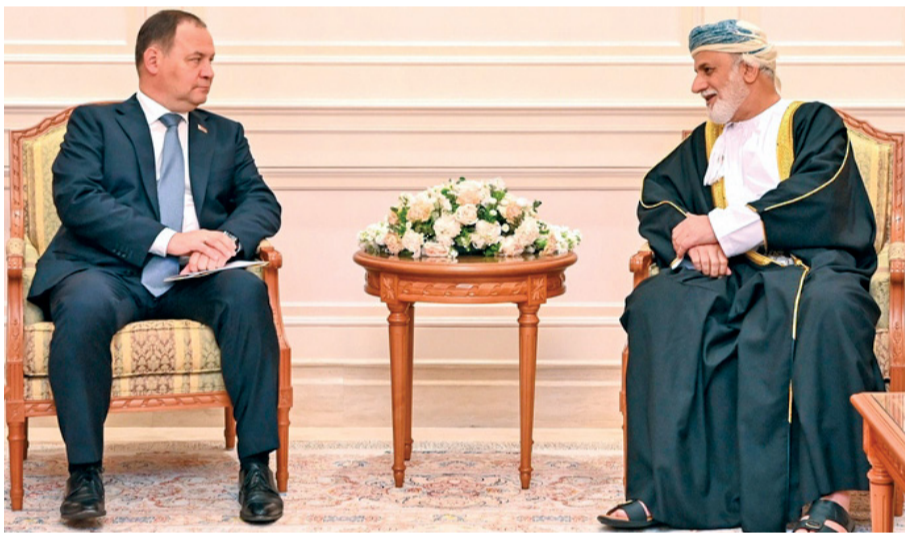
■ ... يستقبله عبد الملك الخليفي

جولوفتشينكو رئيس وزراء جمهورية بيلاروس، خلال زيارته الرسمية الحالية لسلطنة عُمان. جرى خلال المقابلة استعراض علاقات الصداقة والتعاون القائم بين البلدين الصديقين والدور الذي تضطلع عليه مجموعة الصداقة البرلمانية بين سلطنة عُمان وجمهورية بيلاروسيا في دعم وتطوير التعاون الثنائي خصوصاً في المجالات التشريعية. وتطرقت المقابلة إلى التطور الكبير الذي تشهده سلطنة عُمان على المستويين المحلي والدولي، والقواسم المشتركة بين البلدين خاصة فيما يتعلق بتطوير التعاون البرلماني، والتبادل التجاري، والصناعي، وفي مجال النقل والاتصالات والعلاقات المتميزة بين الطرفين، وأهمية توسيعها وتعزيزها.