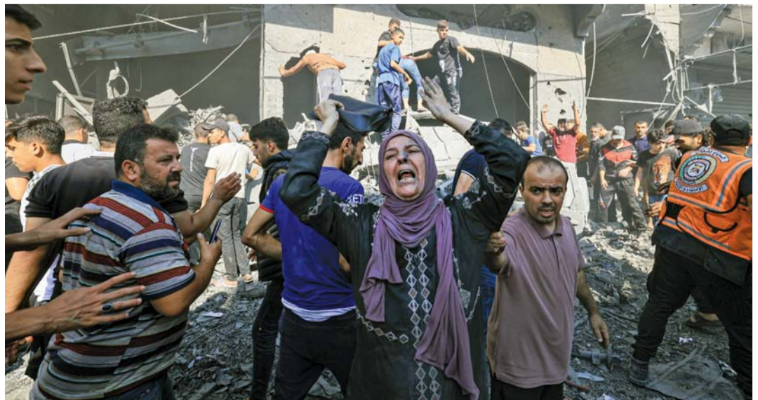
الصورة الفائزة لسيدة تنتحب جراء قصف إسرائيلي أثناء البحث عن ضحايا وسط ركام بيت في خان يونس يوم ١٧ أكتوبر ٢٠٢٣.

وقال محمود الهمص، العامل لحساب وكالة فرانس برس، بعد تسلمه الجائزة إنه يهدي هذه الأخيرة لجميع الصحفيين الذين يغفون الحرب في غزة بشجاعة ونزاهة.