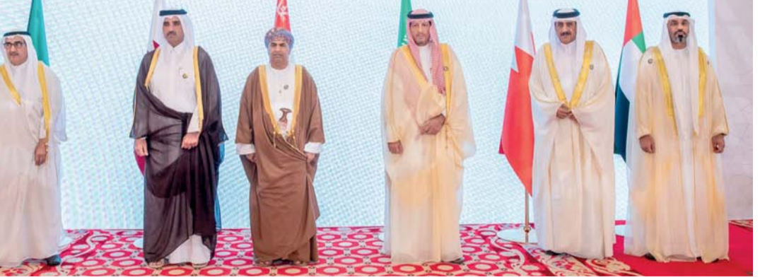
الاجتماع العاشر للجنة الوزارية المعنية بمكافحة الفساد بدول مجلس التعاون

اللجنة التوجيهية لشبكة العمليات العالمية لسلطات إنفاذ القانون المعنية بمكافحة الفساد للفترة (٢٠٢٥ - ٢٠٢٧)، وكذا التهنئة إلى جهاز الإمارات للمحاسبة لانتخابه عضواً في اللجنة التوجيهية للشبكة لذات الفترة. وأشار معالي الشيخ رئيس الجهاز إلى ما تضمنه جدول أعمال الاجتماع لعدد من الموضوعات ذات الأهمية ومنها الأذلة التخصصية المتعلقة بالإفصاح ودليل تعزيز النزاهة في الشركات المملوكة للدولة التي أعدت وفق المعايير المهنية المتعارف عليها والتي يتعين تعميم الاستفادة منها وبما يمكن القائمين عليها تحقيق النتائج والأهداف المرجوة منها بكفاءة وفاعلية، وبما يسهم في النهوض بأداء الأجهزة المعنية بمكافحة الفساد بدول المجلس نحو آفاق أرحب. وتم خلال الاجتماع استعراض ومناقشة عدد من الموضوعات الرئيسية، ومن أبرزها انضمام مسقط. العمانية: تشارك سلطنة عمان ممثلة بجهاز الرقابة المالية والإدارية للدولة في الاجتماع العاشر للجنة الوزارية المعنية بمكافحة الفساد بدول مجلس التعاون لدول الخليج العربية والذي عقد بالعاصمة القطرية الدوحة. وقد ترأس معالي الشيخ غصن بن هلال العلوي رئيس جهاز الرقابة المالية والإدارية للدولة وفد سلطنة عمان. وقد ألقى معاليه كلمة توجه خلالها لهيئة الرقابة الإدارية والشفافية بالتهنئة لتولي دولة قطر رئاسة اجتماعات الدورة (٤٤) بمجلس التعاون لدول الخليج العربية، كما توجه معاليه بالتهنئة إلى هيئة الرقابة ومكافحة الفساد بالملكة العربية السعودية الشقيقة على اختيارها رئيساً