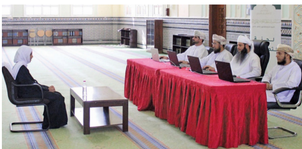
■ تقييم إحدى المشاركات في المسابقة

كاملاً، والمستوى الثاني (حفظ ٢٤ جزءاً متتالياً)، والمستوى الثالث (حفظ ١٨ جزءاً متتالياً)، والمستوى الرابع (حفظ ١٢ جزءاً متتالياً لمن هم في سن ٢٥ عاماً فما دون)، والمستوى الخامس (حفظ ٦ أجزاء متتالية لمن هم في سن ١٤ عاماً فما دون)، والمستوى السادس (حفظ ٤ أجزاء متتالية لمن هم في سن ١٠ أعوام فما دون)، بينما المستوى السابع (حفظ جزئين متتاليين لمن هم في سن ٧ سنوات فما دون). تهدف المسابقة إلى تشجيع العُمانيين على حفظ القرآن الكريم والالتزام بتعاليمه، وتكوين جيل قرآني يحمل كتاب الله ويتقن تلاوته، وتعزيز حضور سلطنة عُمان في المسابقات القرآنية الدولية. ✨