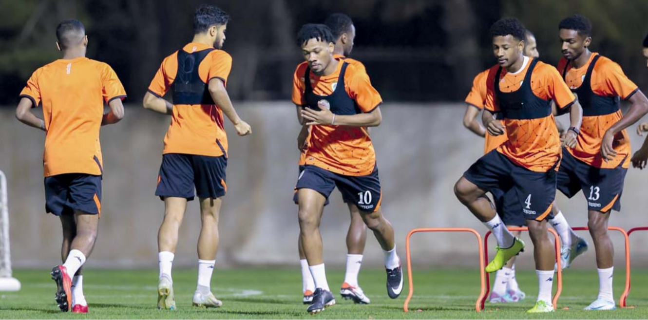
■ من الحصص التدريبية للمنتخب