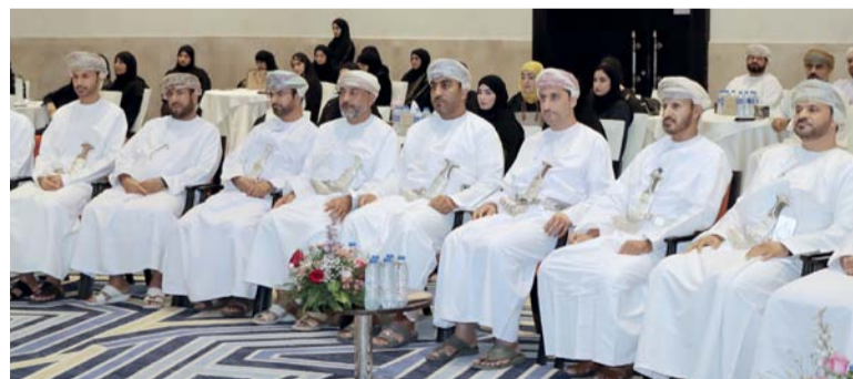
الحضور المشارك في الملتقى

المؤسسية وثقافة العمل بقطاع المصافي والصناعات البترولية ومجموعة أوكيو على أهمية التعاون بين القطاعين الحكومي والخاص والشركات الهادفة للمساهمة بشكل إيجابي في دفع العملية الاقتصادية والاجتماعية في سلطنة عُمان تماشيا مع رؤية عمان ٢٠٤٠، التي تركز على الاستفادة في كافة الموارد وتنويع الاقتصاد، والتنمية الاجتماعية والحوكمة كما أدت مناقشات الملتقى في إيجاد الكثير من الحلول الملموسة والأفكار النيرة والتي من الممكن الاستفادة بها في كثير من جوانب العمل في هذه القطاعات. وشهد الملتقى تقديم أوراق عمل متخصصة في تطوير بناء العمل في المؤسسات الحكومية والخاصة؛ منها ثقافة العمل في المؤسسات الحكومية، وتعزيز المهارات الشخصية في بيئة العمل، وما صاحبها من جلسات مفتوحة لمناقشة محاور الملتقى الرئيسية.