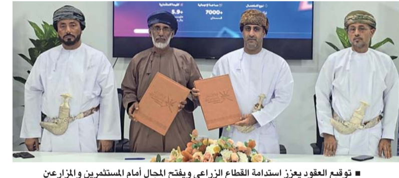
توقيع العقود يعزز استدامة القطاع الزراعي ويفتح المجال أمام المستثمرين والمزارعين

بورصة مسقط تغلق مرتفعاً ٠,٧٨ بالمائة مسقط. العمانية: أغلق مؤشر بورصة مسقط ٣٠٠ يوم أمس عند مستوى ٤٨٠٢,٧٢ نقطة مرتفعاً ٣٧,١ نقطة وبنسبة ٠,٧٨ بالمائة مقارنة مع آخر جلسة التداول التي بلغت ٤٧٦٥,٦٠ نقطة. وبلغت قيمة التداول مليونين و٣٥٠ ألفاً و٨٨٣ ريالاً عمانياً مرتفعة بنسبة ٣٥,٧ بالمائة مقارنة مع آخر جلسة التداول التي بلغت مليوناً و٤٩٩ ألفاً و٩٣٠ ريالاً عمانياً. وأشار التقرير الصادر عن بورصة مسقط إلى أن القيمة السوقية ارتفعت بنسبة ٠,٢٢٩ بالمائة عن آخر يوم تداول وبلغت ما يقارب ٢٤,٧٠ مليار ريال عماني. وبلغت قيمة شراء غير العمانيين في البورصة ٥١٢ ألف ريال عماني مشكلاً ما نسبته ٣٥,١٤ بالمائة، فيما بلغت قيمة بيع غير العمانيين ٢١٩ ألف ريال عماني أي ما نسبته ١٠,٧٥ بالمائة، بينما ارتفع صافي الاستثمار غير العماني ٢٩٣ ألف ريال عماني وبنسبة ١٤,٣٩ بالمائة.