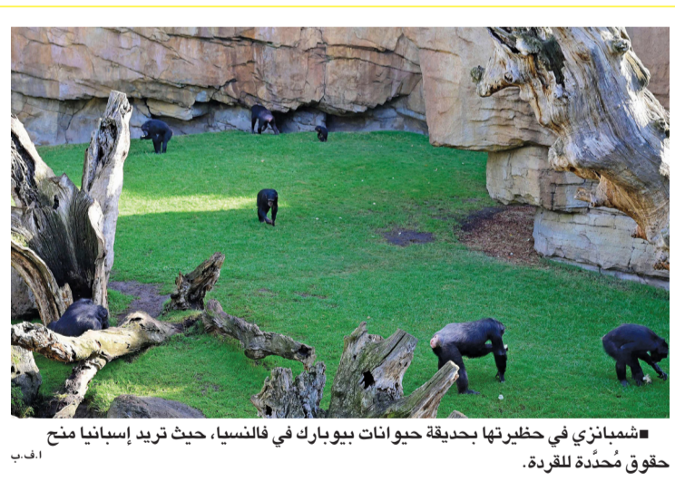
شيمبانزي في حظيرتها بحديقة حيوانات بوبارك في فالنسيا، حيث تريد إسبانيا منح حقوق مُحَدثة للقردة.

هاراري - العُمانية: رصدت زيمبابوي أول حالات إصابة بفيروس جدرى القردة دون الكشف عن تفاصيل نوع السلالة. وقالت وزارة الصحة في زيمبابوي في بيان لها إن الحالة الأولى لطفل يبلغ من العمر ١١ عاماً ظهرت عليه أعراض المرض الشهر الماضي بعد سفره إلى جنوب أفريقيا، فيما تعود الحالة الثانية لشباب يبلغ من العمر ٢٤ عاماً أصيب بالإعياء بعد سفره إلى