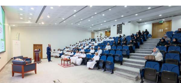
■ تسليط الضوء على إجراءات تأسيس شركة الشخص الواحد

الشخص الواحد وخصائصها. كما تم تسليط الضوء على إجراءات تأسيس شركة الشخص الواحد واكتسابها الشخصية المعنوية، بالإضافة إلى شرح كيفية إدارتها وتنظيم شؤونها القانونية. وتطرقت الحلقة أيضاً إلى الحالات والإجراءات القانونية لانقضاء الشركة. الجدير بالذكر أن وزارة العدل والشؤون القانونية هي الجهة المنوط بها الإشراف على شؤون المحامين وفقاً للاختصاصات المسندة إليها بموجب المرسوم السلطاني رقم (٢٠٢٠/٨٨)، وتأتي هذه الحلقة ضمن سلسلة الحلقات التي تقدّمها الوزارة والتي تهدف من خلالها إلى رفع كفاءة المشتغلين في المحاماة، وتعزيز الخبرات لديهم. ✨