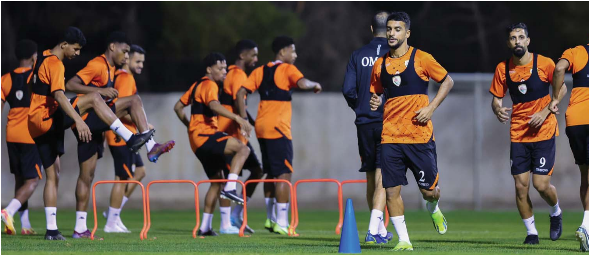
من الحصة التدريبية للمنتخب

وهو واحد من الفرق الآسيوية التي صنعت مجداً كروياً لها بعد تألق كبير في نهائيات أمم آسيا بالدوحة، وقبل هذا وذاك فريق عنيد أمام جماهيره وبملعبه، كما أن هدفه ذات الهدف الذي يدخل به منتخبنا لمواجهة لتحقيق أهداف عديدة قبل استكمال المنافسات في شهر نوفمبر القادم بإذن الله تعالى. منتخبنا يدخل مواجهة وهو في قمة الجاهزية والروح المعنوية العالية، فهو الفريق الذي ضرب بقوة في الجولة الماضية على حساب الكويت رباعية نظيفة أعادت له الثقة بنسبة ١٠٠٪ بعد البداية السلبية في الجولتين الثانية والثالثة، كما أن الانتصار الكبير والأداء الرائع المتوازن