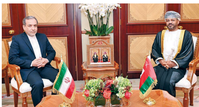
■ بدر البوسعيدي أثناء لقائه وزير الخارجية الإيراني

أي سيناريو، مشدداً على أن الدبلوماسية هي السبيل الوحيد لمنع الأزمات الكبيرة في المنطقة، وتجنب تصعيد التوترات والحروب، مُشيراً إلى أهمية الاستقرار في التعاون مع سلطنة عُمان والدول الأخرى لمواجهة التحديات الإقليمية عبر التنسيق والمشاورات لتعزيز الأمن والاستقرار في المنطقة. كما عقدت لجنة الصداقة العسكرية العُمانيّة الإيرانية المشتركة اجتماعها السنوي ويستمر يومين. وترأس الجانب العُماني في الاجتماع العميد الركن حامد بن عبدالله البلوشي مساعد رئيس أركان قوات السلطان المسلحة للعمليات والتخطيط السيد بدر بن حمد البوسعيدي وزير الخارجية بمسقط كانت مثمرة، وتناولت الأحداث الجارية في المنطقة، مُشيراً إلى أن سلطنة عُمان تقوم بأدوار كبيرة في حلحلة العديد من القضايا الإقليمية والدولية. ولفت معاليه إلى أن المنطقة تعيش حالة من التأهب، وقد تكون على حافة صراعات واسعة، خصوصاً في ظل الأوضاع المتوترة التي تشهدها حالياً. وأكد معاليه على أن بلاده في وضع الاستعداد التام