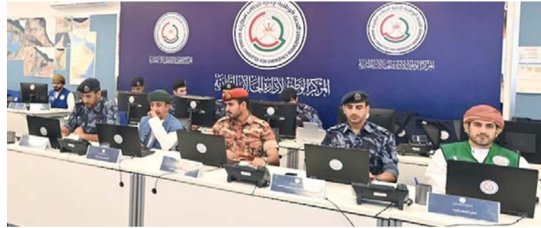
رفع درجة الجاهزية والاستعداد للتعامل مع تأثيرات الحالة

من جانب آخر أكد قطاع الخدمات الأساسية جاهزيته للتعامل مع تأثيرات الحالة المدارية التي من المحتمل على عدد من محافظات سلطنة عُمان ابتداء من اليوم حتى ١٧ من أكتوبر الجاري، وذلك من خلال تفعيل خطط الاستجابة الطارئة بالقطاعات الأساسية الفرعية (الطرق والكهرباء والاتصالات والمياه والصرف الصحي والوقود وإدارة النفايات) ونشر أرقام مراكز الاتصالات بالخدمات الأساسية. وجرى تفعيل القطاع بناء على التوجيهات التشغيلية الصادرة من اللجنة الوطنية لإدارة الحالات الطارئة استناداً إلى التقارير الصادرة من المركز الوطني لإدارة الحالات الطارئة وقطاع الرصد والإنذار المبكر ممثلاً بالمركز الوطني للإنذار المبكر من المخاطر