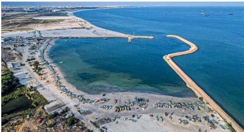
■ موانئ الصيد البحري تعد محور الارتكاز للقطاع السمكي بما فيها الأنشطة المتعلقة بالصيد والصيداين

وتسعى وزارة الثروة الزراعية والسمكية وموارد المياه إلى تطوير موانئ الصيد في مختلف محافظات سلطنة عُمان لتكون بيئة جاذبة للاستثمارات مع تعزيز فرص الاستفادة من الموارد السمكية وتوفير العديد من الخدمات العامة والخاصة داخل نطاق الميناء لرفع مساهمة قطاع الثروة السمكية في الناتج المحلي الإجمالي.