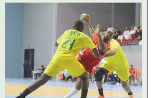
صورة أرشيفية من مسابقات كرة اليد

تنتهي يوم الخميس القادم السابع عشر من الشهر الجاري المهلة التي حددها الاتحاد العماني لكرة اليد للأندية الراغبة بالمشاركة في مسابقات الموسم الرياضي الجديد ٢٠٢٤/٢٠٢٥، حيث تشمل مسابقات الموسم الجديد ٩ بطولات متنوعة منها بطولة كأس السوبر التي تقام لأول مرة بمشاركة ٤ أندية؛ هي نادي عمان والسيب ومسقط وأهلي سداب وتقام منافساتها خلال الفترة من ١٤ إلى ١٦ ديسمبر القادم، وستكون أولى البطولات دوري الناشئين لحواليد ٢٠٠٨ الذي ينطلق في الأول من شهر نوفمبر القادم ودوري الشباب لحواليد ٢٠٠٦ و٢٠٠٧ وينطلق يوم ٨ نوفمبر القادم ودوري الدرجة الثانية يبدأ يوم ٦ ديسمبر المقبل ودوري الدرجة الأولى ينطلق يوم ٢٠ ديسمبر القادم ومسابقة درع الوزارة في شهر يناير ٢٠٢٥ ودوري الشواطئ للناشئين في شهر فبراير ٢٠٢٥ ودوري الشواطئ للرجال في شهر فبراير ٢٠٢٥ والدوري النسائي في فبراير ٢٠٢٥. وكان اتحاد اليد قرر فتح باب التسجيل للاعبين المحليين والأجانب في الفترة الأولى للدرجتين الأولى والثانية خلال الفترة من ٢٢ سبتمبر الماضي ولغاية ٣٠ نوفمبر القادم، أما باب التسجيل في الفترة الثانية سيقام خلال الفترة من ١ إلى ٣٠ يناير ٢٠٢٥.