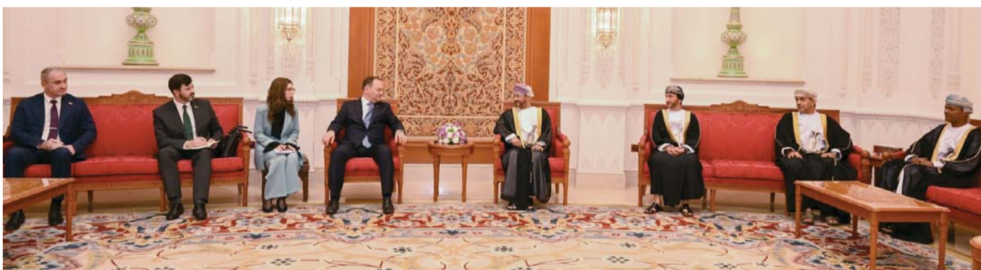
رئيس الوزراء البيلاروسي لدى وصوله البلاد، وفي استقباله بدر بن حمد

كما أن هناك اتفاقية إنشاء «مركز ثقافة اللغة العربية» التي تم التوقيع عليها في ٢٠١٦ ضمن هيكلية جامعة مينسك الحكومية، وعادة ما يرسل المركز طلبة لدراسة اللغة العربية في جامعة السلطان قابوس، ومن المتوقع أن يلتحق طلبة من جمهورية بيلاروس بجامعة السلطان قابوس في شهر يناير ٢٠٢٥م. وهناك مذكرة تفاهم في مجال التراث والثقافة تم التوقيع عليها في مسقط بتاريخ ١ أبريل ٢٠١٨م، ومذكرة تفاهم بين المتحف الوطني العُمانى ومتحف التاريخ الطبيعي في جمهورية بيلاروس في مجال العمل الثقافي والمتحفى تم التوقيع عليها في مارس ٢٠١٨م.