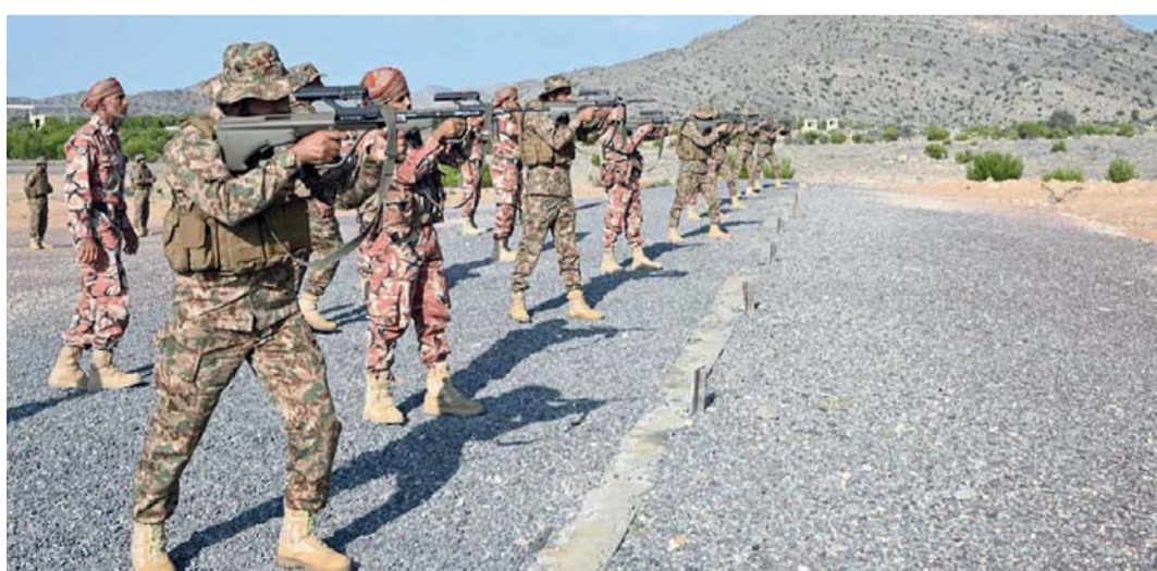
التمرين يهدف إلى إدامة الكفاءة القتالية والجاهزية لمنتسبي الجيش السلطاني العُماني

جمهورية باكستان الإسلامية، وإسناد من سلاح الجو السلطاني العُماني. ويشتمل التمرين الذي تستمر مجرياته حتى الحادي والعشرين من أكتوبر الجاري على عدد من المعامل العسكرية والتدريبات المشتركة ضمن خطة التمرين، بهدف إدامة الكفاءة القتالية والجاهزية العملياتية