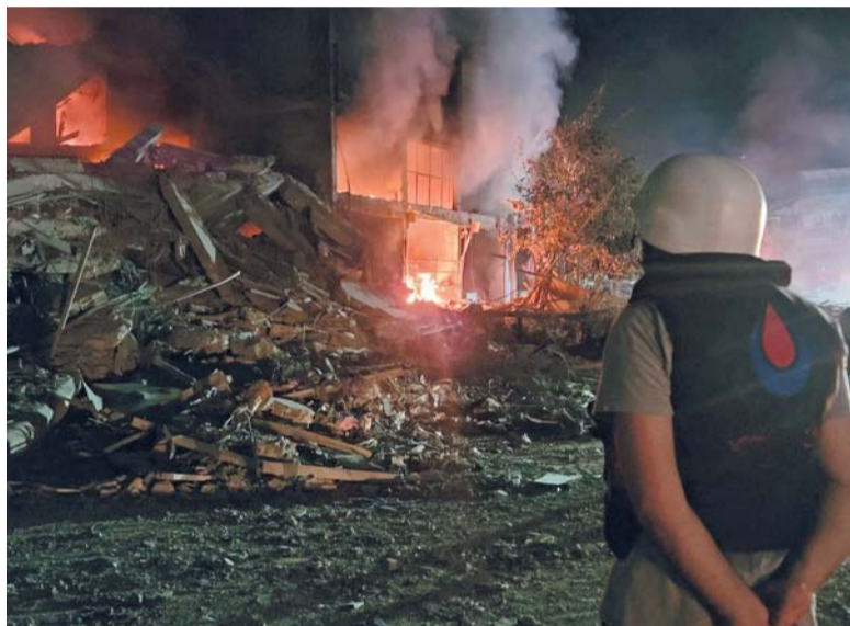
لبناني يُعاين آثار القصف الإسرائيلي بمدينة النبطية بجنوب لبنان.

وتضيف «القيادة الجنوبية لا تقدم خطة للخروج، والجيش الإسرائيلي لم يحقق حتى الآن معظم أهداف الحرب: لا إطلاق سراح ١٠١ رهينة، ولم يقض على يحيى السنوار، ولم يتمكن من حل حماس.. يبدو يوماً بعد يوم أننا سنغرق مع وُجُل غزة. وفي لبنان يعتمد الجيش الإسرائيلي على إخلاء قرى حدودية، بشكل عام، سيطر الجيش على معظم الخط شمال السياج الحدودي لكن الخطط للمستقبل غير واضحة. من جانبه، أعلن حزب الله أنه ينوي العمل بأسلوب حرب العصابات: للاستفادة من حقيقة أن إسرائيل ليست مهتمة بحرب استنزاف. وتقول الصحيفة إن الجيش يعمل في نابلس وجنين وطولكرم. ويحاول بالتعاون مع الشباب الحفاظ على مستوى من الهجوم والعمليات بطريقة لا تحول الضفة إلى جبهة أخرى قوية».