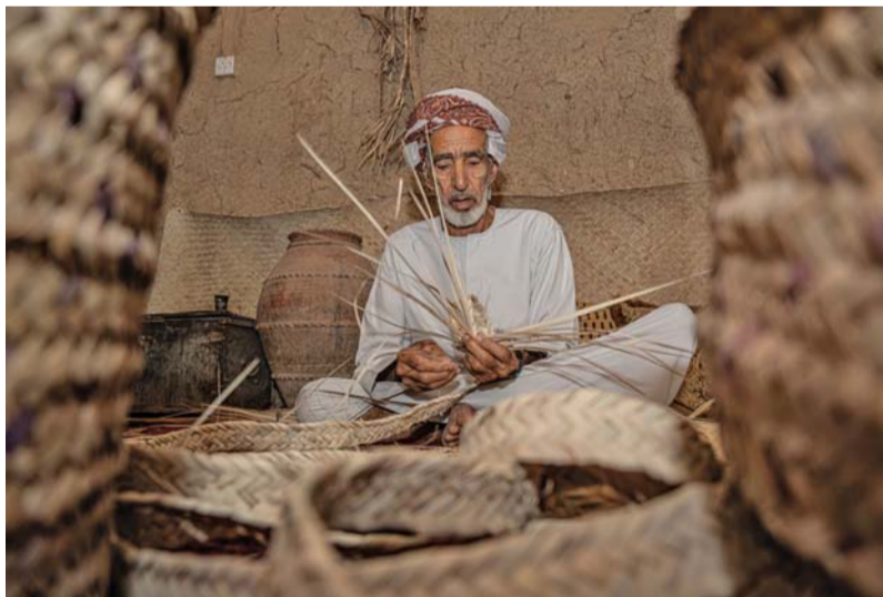
■ العمل بعدسة سامية البطاشية