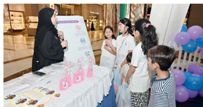
تعريف الزوار بأمراض الروماتيزم المختلفة