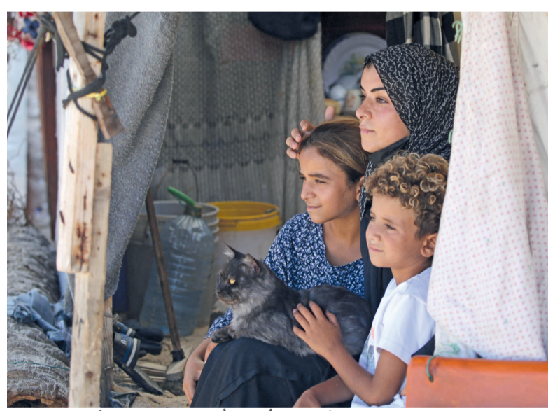
عائلة فلسطينية نازحة تجلس خارج خيمتها في مخيم مؤقت على شاطئ مدينة غزة.

استمرت «إسرائيل» في ارتكاب المجازر بحق الفلسطينيين في قطاع غزة؛ لترتفع حصيلة العدوان «الإسرائيلي» إلى (٤٢,٢٢٧) شهيداً و(٩٨,٤٦٤) مصاباً منذ السابع من أكتوبر الماضي. وقالت سرايا القدس إن مقاتليها قصفوا بعدد من الضواحي مدينة عسقلان ومستوطنات غلاف غزة. وفي جبهة لبنان، قال حزب الله إنه قصف مصنعا للمواد المتفجرة جنوب حيفا بصواريخ وصفها بالنوعية، وهاجم لليوم الثاني بمسيرات انقضاضية قاعدة الدفاع الجوي غربي هذه المدينة. تفاصيل ..... ص ٥