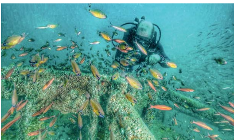
■ المزرعة المرجانية تمثل بيئة مناسبة للغوص البحري والترفيه

المختصين بدائرة الثروة السمكية بالمحافظة، من خلال عمليات الغوص المتواصلة للمزرعة ورصد نمو وتكون الأعشاب المرجانية وتواجد الكائنات البحرية المتنوعة التي تم رصدها في الشعاب الصناعية التي تم إنزالها في موقع المشروع.