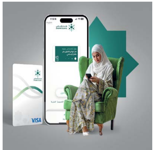
■ خدمات سهلة يقدمها ظفار الإسلامي لإنجاز معاملات زبانه المصرفية

المصرفية للزبائن وتجعلها في متناول اليد، ويمكن تسجيل الدخول للتطبيق عبر خاصية تمييز الوجه وبصمة الإصبع، وبإمكان المستخدم إتمام العديد من العمليات عبر التطبيق مثل إعادة شحن رصيد الهاتف النقال لمشتري عمائل وأوريدو وفريدي ورنه، ودفع فواتير الهاتف النقال والهاتف الثابت، ودفع فواتير الكهرباء والماء، وخدمات بطاقة الخصم المباشر تفاصيل البطاقة، وتغيير الحد الأعلى للسحب النقدي، وإيقاف البطاقة، وتفعيل البطاقة للاستخدام خارج سلطنة عمان، وخدمات بطاقة الائتمان الدفع، وتفصيل البطاقة، والكشوفات، وإيقاف تحويل الأموال وتحويل إلى طرف ثالث، وتحويل الفوري، وأوامر الدفع، وغيرها من الخدمات.