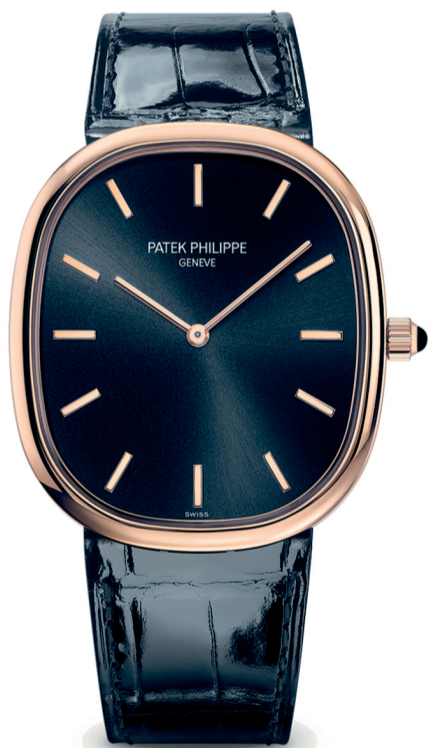
ساعة GOLDEN ELLIPSE كود رقم 5738R

Patek Philippe Boutique at القرم Al-Qurum MUSCAT - 22009991