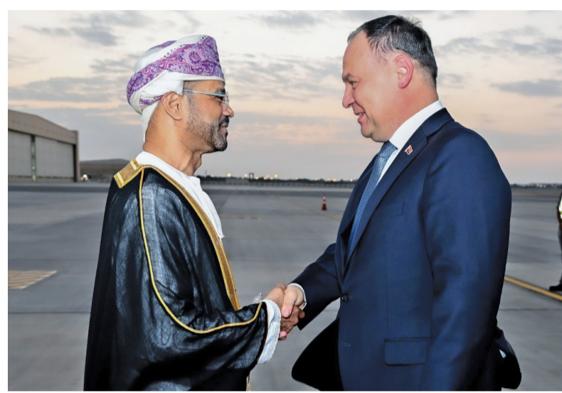
رئيس الوزراء البيلا روسي لدى وصوله البلاد وفي استقباله بدر بن حمد

توقعات ببدء تأثيرات الحالة المدارية مساء اليوم