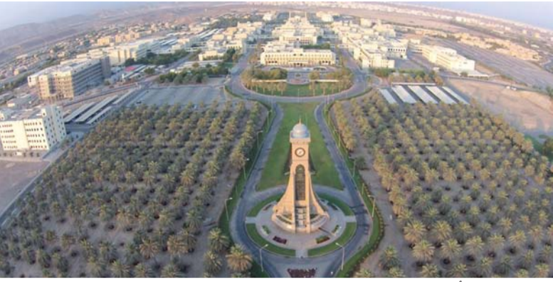
■ سلطنة عُمان تعد أول دولة في منطقة الشرق الأوسط تستضيف أعمال هذا المؤتمر الدولي