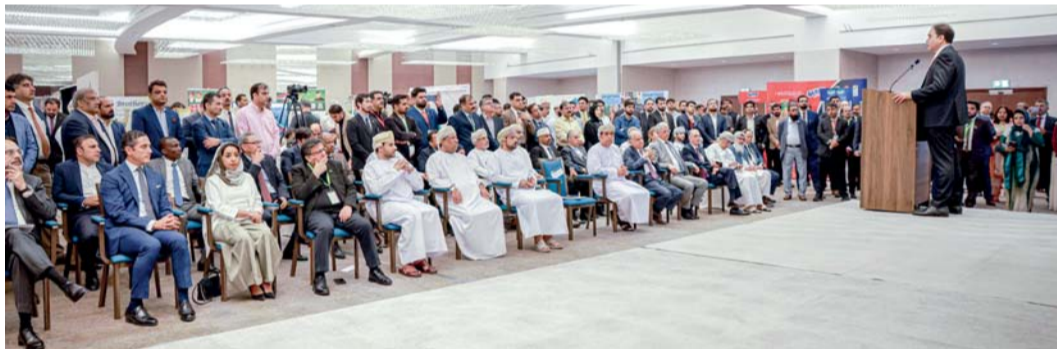
المنتدى تضمن جلسة نقاشية حول آفاق التعاون والبيئة التشريعية الداعمة للاستثمار

تتطلب الصور عالية الجودة دوراً مهماً في استراتيجيات التسويق الحديثة، حيث تعتبر أدوات قوية لجذب وإشراك الجمهور. على عكس الصور العادية أو منخفضة الجودة، تنقل الصور عالية الجودة الاحترافية والمصادقية والاهتمام بالتفاصيل، مما ينعكس إيجابياً على هوية