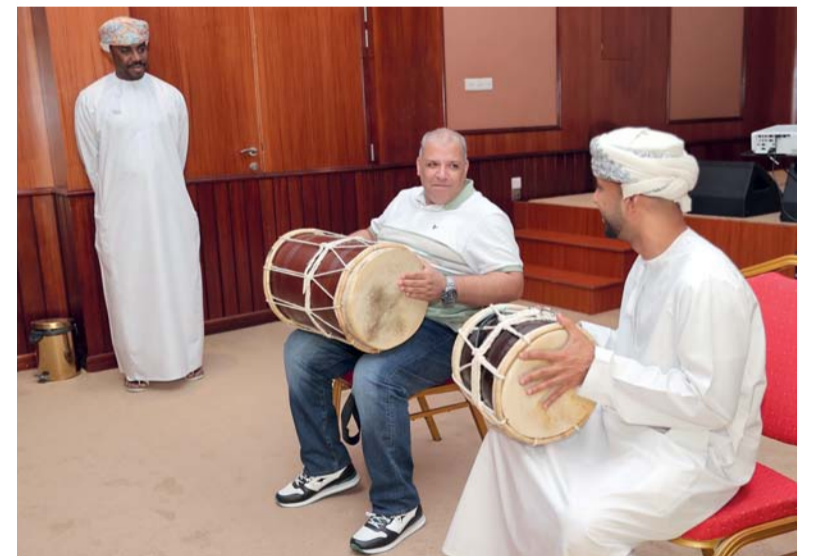
■ شارك بالحلقة (٢٥) معلماً ومعلمة مادة المهارات الموسيقية