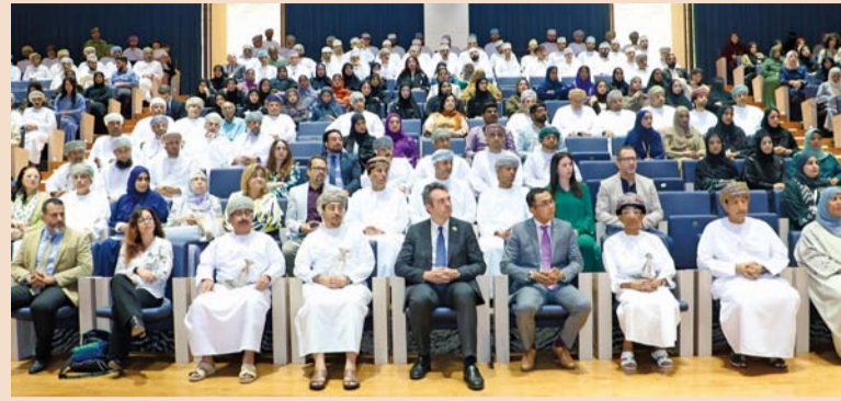
■ حضور ندوة حماية وتعزيز التراث الثقافي العماني الإيطالي

وقال سعادة بييرلويجي ديليا، السفير الإيطالي المعتمد لدى السلطنة خلال كلمته: