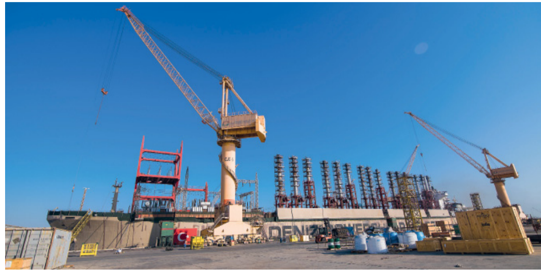
توطين الاستثمارات احد ثمار الحوافز التي تقدمها سلطنة عُمان

الخدمة، ويقدمون الدعم اللازم للمستثمر وتوجيهه بعد ذلك ومساعدته في الحصول على الوثائق الرسمية من خلال مكاتب الخدمة المتاحة في مرافق الصالة، مثل فتح حساب بنكي، وسجل الشركة التجاري، وغيرها من الوثائق والخدمات. وأضافت إن الصالة وفرت لكل مستثمر ومشروع استثماري «مدير علاقات»، الذي بدوره يقوم برعاية المستثمر طوال رحلته الاستثمارية ومتابعة طلباته مع الجهات المختصة والرد على كافة استفساراته وتسجيل طلباته وتصنيفها وتوجيهها للمختصين وتحديث بياناته وبيانات المشروع الاستثماري بشكل مستمر وتقديم الاقتراحات والدعم اللازم وأيضا متابعة وخدمة المستثمر إلى ما بعد مرحلة تنفيذ المشروع الاستثماري في سلطنة عُمان، كما توفر الصالة «مسارات واضحة للمستثمرين» حسب نوع وطبيعة المشروع الاستثماري وذلك بالتعاون والتكامل مع الجهات الموجودة في صالة استثمر في عمان. كما تم إعداد دليل «استخدام