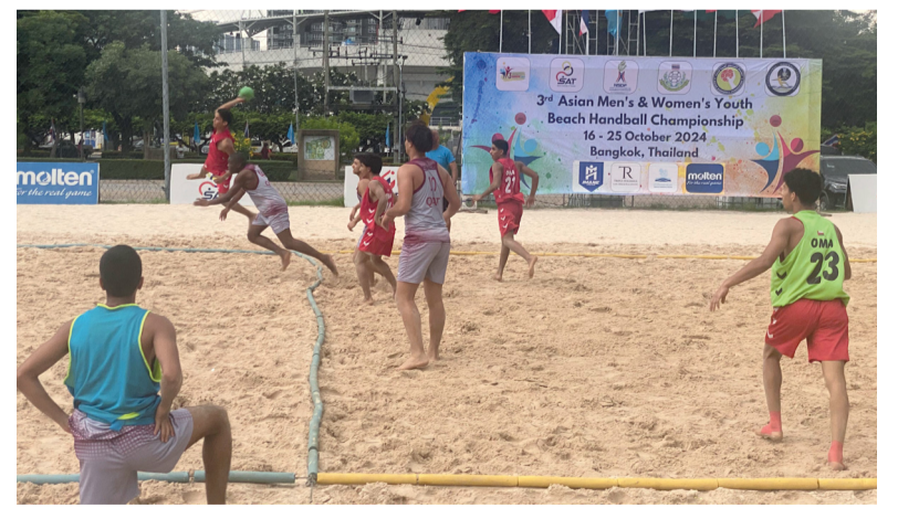
لاعب منتخبنا في محاولة التسديد على مرمى المنتخب القطري

الإربعاء المقبل أمام المنتخب الإيراني حامل اللقب حيث لعب بالتنشيط الأساسية واستطاع ان يقدم أداء ومستوى مشرفاً منذ بداية المباراة رغم فارق الخبرة والاستعدادات للمنتخب القطري الذي سبق له وان تأهل لكأس العالم مرتين لكن منتخبنا كان ندا قوية له وخسر الشوط الاول بنتيجة ١٢/٩ وفي الشوط الثاني قام المدرب الوطني جابر البلوشي بسلسلة تغييرات في صفوف منتخبنا وطريقه للعبة واستطاع منتخبنا مجاراة المنتخب القطري في اللعب لكن فارق الخبرة كان له دور كبير في حسم النتيجة والمباراة لصالح المنتخب القطري لينتهي الشوط الثاني بخسارة منتخبنا ١٤/١٢ والمباراة صفر/٢ وعقب المباراة لعب الفريقان ركلات الجزاء الترجيحية والهدف الذهبي من اجل التعود عليه قبل المشاركة في البطولة الآسيوية.