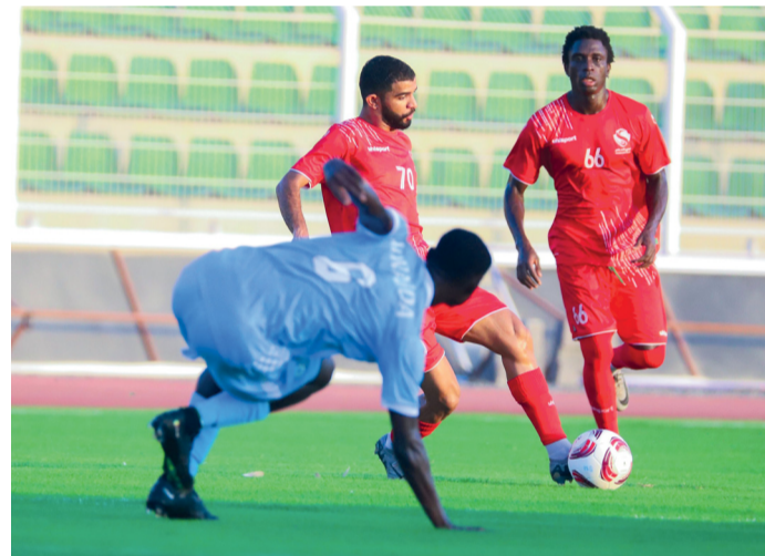
من مباريات دوري الدرجة الأولى

المضامير أمام الطليعة والمباراة على ملعبه وهذا يعطيه الدافع القوي للظهور بمستوى مختلف، وستكون الكفة متساوية بين مسقط والمضيبي، حيث يتواجدان في قاع الترتيب برصيد نقطتين وفوز أحدهما على الآخر يجعله يتقدم خطوة وربما خطوات إذا ما استفاد من خسارة الفرق الأخرى، فرق أهلي سداب والمضيبي ومسقط لم تتذوق طعم الفوز حتى الآن، واكتفت بتعادلين وخسارة واحدة، ولقاءات اليوم مهمة لتعديل المسار قبل فوات الأوان.