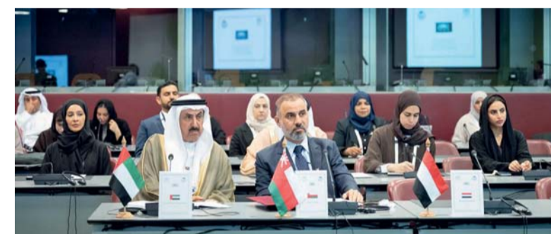
وفد سلطنة عُمان أثناء مشاركته في أعمال الجمعية العامة والإجتماعات المصاحبة لها

إدراج البند الطارئ في جدول أعمال الجمعية العامة، والمناقشة العامة حول موضوع «الاستفادة من العلم والتكنولوجيا والابتكار من أجل مستقبل أكثر سلماً واستدامة»، إلى جانب مناقشة أثر الذكاء الاصطناعي على الديمقراطية وحقوق الإنسان وسيادة القانون، إضافة إلى استعراض تقارير اللجان الدائمة. كما يشارك وفد مجلس عُمان في حلقة نقاش مشتركة بين الاتحاد البرلماني الدولي وجمعية الأماناء العامين للبرلمانات الوطنية، والذي تطرق إلى التحضير والمشاركة في المؤتمر الـ ٣٧ للطرائق للاتحاد البرلماني العربي، المقرر عقده غداً (الثلاثاء)؛ بهدف مناقشة اعتداء الاحتلال الإسرائيلي على دولة فلسطين والجمهورية اللبنانية، وبحث الحلول لوقف العدوان الغاشم. وفي هذا الشأن اختارت المجموعة العربية بالاتحاد البرلماني الدولي، سعادة خالد بن هلال المعولي، رئيس مجلس