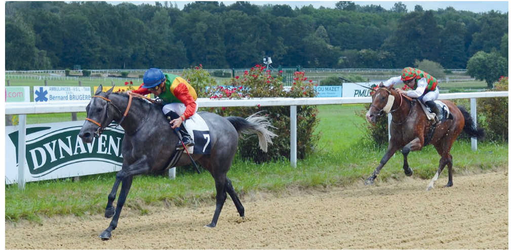
صورة أرشيفية للفرس الصافنات