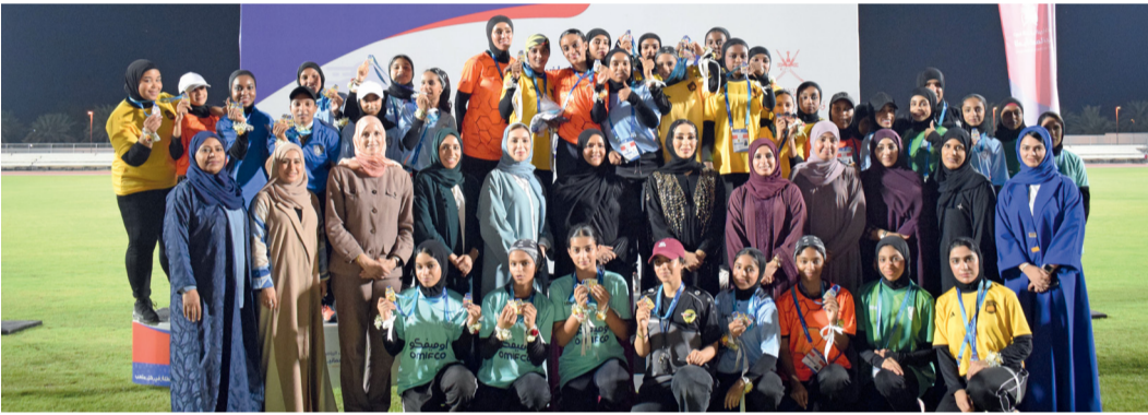
صورة جماعية للفرق المنجحة بالمراكز الثلاثة الأولى في بطولة ألعاب القوى للفتيات