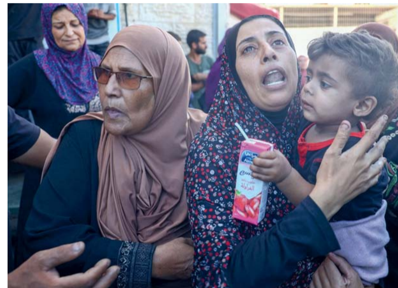
فلسطينية تودع أقاربها الذين استشهدوا في غارة إسرائيلية على مخيم البريج للاجئين، وذلك لدى تشييعهم من مستشفى شهداء الأقصى في دير البلح وسط قطاع غزة.

الخرطوم. وكالات: قتل ٢٣ شخصاً وجرح أكثر من ٤٠ آخرين إثر قصف للجيش السوداني استهدف أحد المعسكرات الرئيسية لقوات الدعم السريع في الخرطوم، بحسب ما قالت غرف الطوارئ في العاصمة السودانية. وأكدت غرف الطوارئ وهي مبادرة شبابية لتقديم المساعدات الإنسانية للمدنيين المتضررين من الحرب في السودان - في بيان نشرته على صفحتها الرسمية على فيسبوك إن هناك ٢٣ حالة وفاة مؤكدة وأكثر من ٤٠ جريحاً تم نقلهم، إلى ثلاثة مستشفيات.