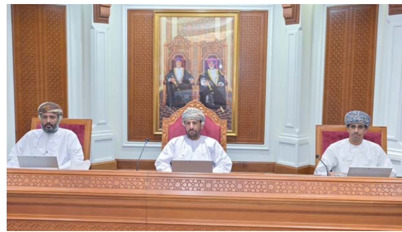
مناقشة دعم الابتكار في المجالات الاقتصادية والاجتماعية