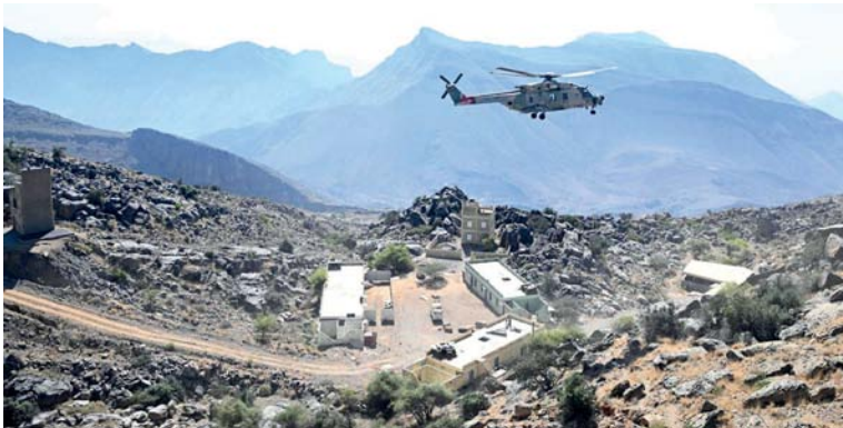
■ التدريب على القتال في المناطق الجبلية

■ المديرية العامة لليونسكو تتسلم أوراق اعتماد مندوبة سلطنة عمان بالمنظمة