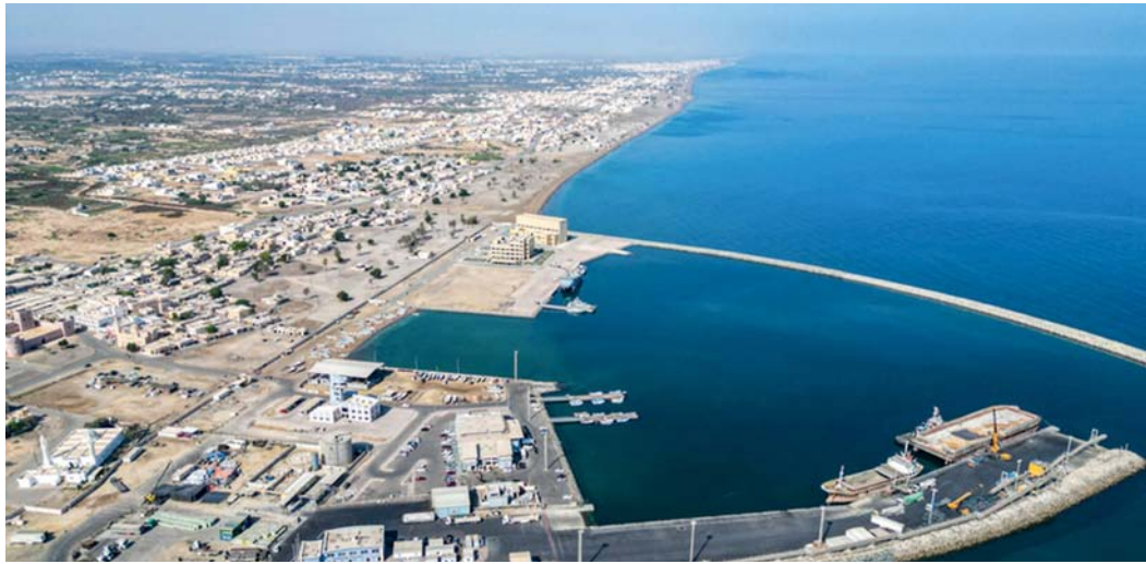
المدينة الصناعية تعزز الاقتصاد وتوفر فرص العمل وتجذب الاستثمارات الأجنبية والمحلية

السوق الصناعية، أشار مساعد مدير عام المدينة إلى أن «مدائن» انتهت من إسناد مناقصة مشروع الخدمات الاستشارية للتصميم والإشراف على إنشاء مدينة السوق الصناعية، وبدأت الشركة التي وقع عليها الاختيار في تنفيذ هذا المشروع فعلياً، ويتضمن إعداد مخطط تفصيلي عام شامل للمدينة الصناعية وتطوير المرحلة الأولى التي تشتمل على عدد من الخدمات مثل شبكات الطرق والمياه والصرف الصحي والإنارة وخزانات المياه والسياس الآمن وألات المراقبة وتصميم مبنى الخدمات وعدد من الوحدات الجاهزة في مجمع مدائن الريادي ودراسة عدد من الفرص الاستثمارية في المساحة المطورة بالإضافة إلى تنفيذ عدد من الدراسات منها دراسة فحص التربة والدراسات المرورية والدراسة الطبوغرافية والدراسة البيئية.