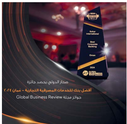
صحار الدولي يحصد جائزة أفضل بنك للخدمات المصرفية التجارية - عمان ٢٠٢٤

فكرة متكاملة حول مستجدات الأسواق لتمكينهم من اتخاذ قرارات استثمارية بعيدة المدى على أيدي مستشارون ماليين حيث يقدمون للزبائن خطة مالية شاملة واقتراح استراتيجيات وخيارات المالية، الأمر الذي يساهم في إحداث ثورة في العمليات المصرفية. ويمكن البنك زبائنه من مضاعفة فرص عوائد استثماراتهم وتوفير