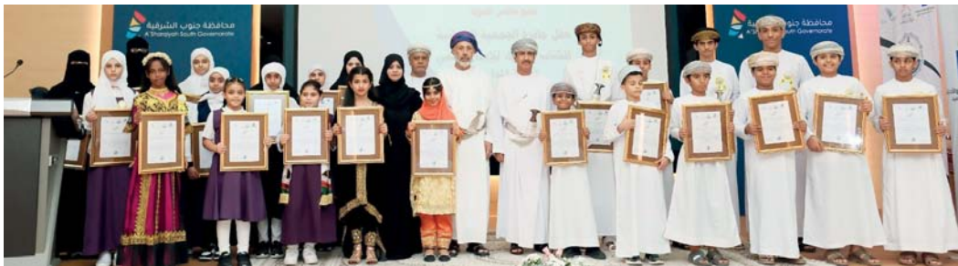
المسابقة تهدف إلى الاهتمام بتنمية المواهب ورعايتها

بيدها وتشجيعها. وأضاف: ولعل من أهم الأهداف التي عملت المديرية العامة للتربية والتعليم بمحافظة جنوب الشرقية في تحقيقها، تشكيل الفريق المكلف بالجائزة والذي نفذ بدوره ما تم جدولته من برامج مخطط لها منذ شهر سبتمبر ٢٠٢٣م في سير وتنفيذ برنامج الجائزة والظهور بالمستوى المطلوب، وحتى التقييم النهائي على مستوى سلطنة عُمان في ٣٠ يونيو ٢٠٢٣م، وما تم بينهما من التعريف بالجائزة والتقييم المحلي والخطوات المنفذة لذلك