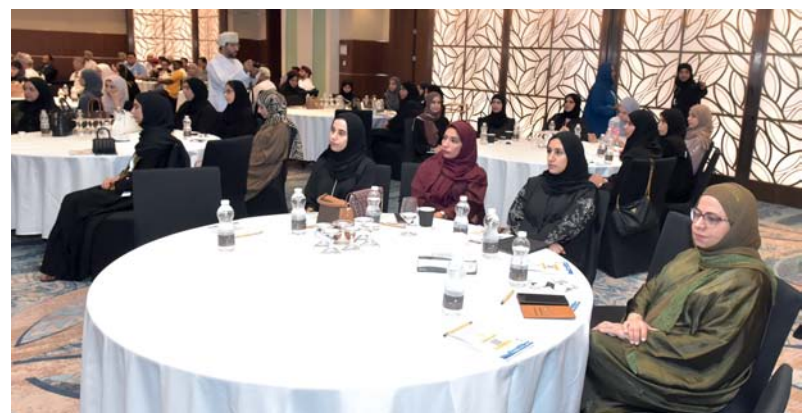
■ المؤتمر يُعزّز الوعي بأهمية الصحة النفسية