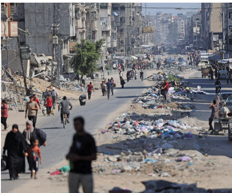
فلسطينيون يحملون أمتعتهم أثناء فرارهم من مناطق شمال قطاع غزة حيث شن الاحتلال هجوماً برياً وجوياً مكثفاً لا سيما في مدينة جباليا وما حولها.

مسقط، العُمانية: أعلنت وزارة الأوقاف والشؤون الدينية عن فتح باب التسجيل للراغبين في أداء شعيرة الحج من سلطنة عُمان لموسم ١٤٤٦هـ، بدءاً من يوم الإثنين الموافق (٤) من نوفمبر القادم، وحتى يوم الأحد (١٧) من نوفمبر ٢٠٢٤. وأشارت الوزارة إلى أن عملية التسجيل ستكون عبر النظام الإلكتروني لتسجيل حجّج سلطنة عُمان (www.hajj.om). يُذكر أن حصّة سلطنة عُمان لهذا العام تبلغ (١٤) ألف حاجّ.