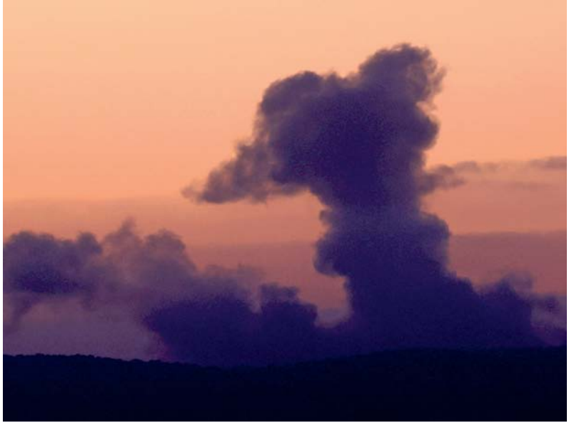
■ عمود من الدخان يتصاعد في جنوب لبنان جراء القصف الإسرائيلي.

وأشارت إلى أن قوات الاحتلال ارتكبت ٥ مجازر بحق العائلات في القطاع، أسفرت عن استشهاد ٤٩ وإصابة ٢١٩ آخرين، خلال ٢٤ ساعة. وأوضحت أن عددًا من الضحايا لا يزالون تحت الركام وفي الطرقات، ولا تستطيع طواقم الإسعاف والدفاع المدني الوصول إليهم. إلى ذلك يواصل الاحتلال الإسرائيلي قصف جباليا ومخيمها شمال قطاع غزة جواً وبراً، مخلفاً عشرات الشهداء والجرحى، وسط عمليات نسف مبرعات سكنية، في ظل حصار متواصل منذ سبعة أيام. واستشهد وأصيب العشرات بينهم أطفال ونساء،