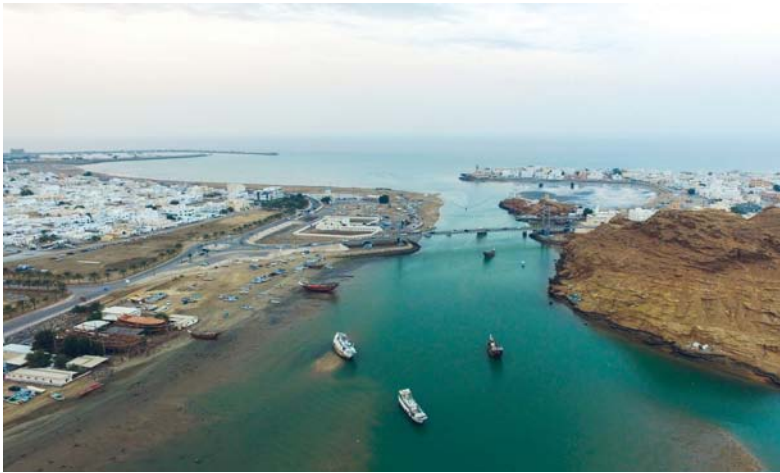
■ الملتقى يعزز التعاون بين الدول العربية في مجال الإحصاء السياحي