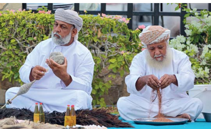
كبار السن أثناء تقديم عرض للصناعات الحرفية

والرعاية لكبار السن وتعزيز مكانتهم في المجتمع، وتوجه بالشكر إلى الرعاة والمشاركين والداعمين الذين أدوا دوراً كبيراً في دعم المهرجان وإنجاحه سواء من خلال الدعم المادي أو المشاركة الفعالة في الأنشطة المختلفة الذي أثمر عن نجاح هذا المهرجان بفضل مساهماتهم السخية والتزامهم تجاه المجتمع.