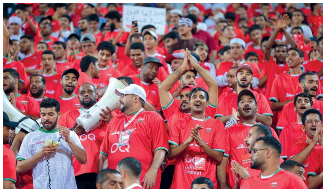
جماهيرنا الوفية كان لها دور كبير في مؤازرة منتخبنا