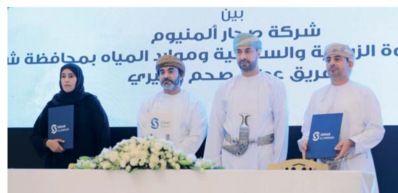
الاتفاقيتان تساهمان في تعزيز الاستدامة البيئية ودعم العمل الخيري