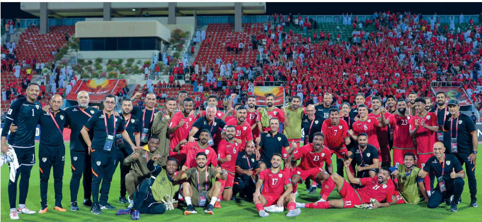
احتفال لاعبي منتخبنا بالفوز على المنتخب الكويتي