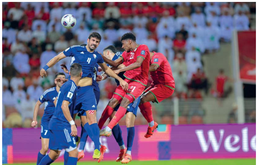
من لقاء منتخبنا مع شقيقه المنتخب الكويتي