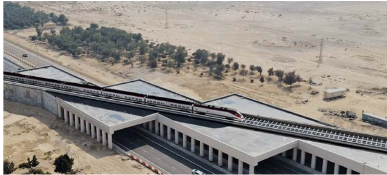
■ مشروع شبكة السكك الحديدية العمانية الإماراتية المشتركة يمثل حلقة رئيسية في سلسلة موحدة للنقل

مسقط. العمانية: تبدأ غداً «الائتمين» أعمال الملتقى العربي الثاني لإحصاءات السياحة الذي ينظمه المركز الوطني للإحصاء والمعلومات بالتعاون مع وزارة التراث والسياحة وجامعة الدول العربية ويستمر ثلاثة أيام. يري حفل افتتاح الملتقى معالي سالم بن محمد المحرق وزير التراث والسياحة. ووضعت منى بنت سعيد العبرية مديرة دائرة التواصل والإعلام بالمركز رئيسة اللجنة المنظمة للملتقى أن استضافة سلطنة عمان هذا الملتقى جاءت بالتزامن مع اختيار ولاية صور عاصمة للسياحة العربية لعام ٢٠٢٤، حيث يهدف إلى تعزيز التعاون بين الدول العربية في مجال الإحصاء السياحي وتطوير المؤشرات الإحصائية المستخدمة في قياس وتحليل السياحة.