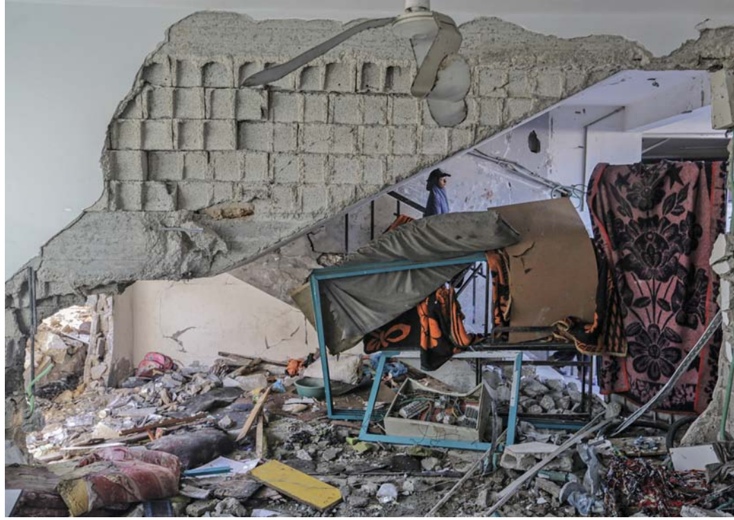
■ آثار الدمار جراء هجوم إسرائيلي داخل مدرسة أحمد الكردي، حيث لجأ الفلسطينيون بعد فرارهم من منازلهم في دير البلح.

بيروت - القدس المحتلة - وكالات: أعلن حزب الله أنه استهدف «بصيلة من الصواريخ» قاعدة عسكرية إسرائيلية في جنوب مدينة حيفا الواقعة شمال إسرائيل. وقال حزب الله في بيان إن مقاتليه قاموا صباح السبت بقصف قاعدة عسكرية إسرائيلية «بصيلة من الصواريخ النوعية». من جانبه حذر الجيش الإسرائيلي السبت سكان جنوب لبنان من العودة إلى منازلهم «حتى إشعار آخر»، مشيرًا إلى أن القتال متواصل في المنطقة. وكتب المتحدث باسم الجيش للإعلام العربي أفخاي أرعي على منصة إكس أن الجيش «يواصل استهداف مواقع حزب الله في قراكم أو بالقرب منها» موضحًا «من أجل سلامتكم، يُمنع العودة إلى منازلكم حتى إشعار آخر». في منشور منفصل، كرر أرعي دعوة سابقة إلى العاملين الصحيين والفرق الطبية في جنوب لبنان لتجنب استخدام سيارات الإسعاف، زاعمًا أنها تستخدم من جانب مقاتلي حزب الله.