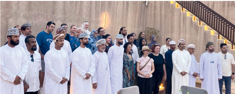
صورة جماعية للمشاركين في الجولة السياحية بمحافظة جنوب الباطنة

المصنعة. من خليفة الفارسي: ومثلي الشركات السياحية والمشرفين على الأنشطة السياحية والفندقية.