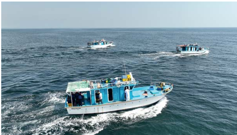
مختبرات الأمن الغذائي تركز على جذب الاستثمارات وتعزيز المحتوى المحلي والقيمة المضافة والتشغيل

وأكد أنه سيتم في ختام أعمال المختبر إطلاق ١٠ خدمات بمنصة «شروات» التي ستكون شاملة لكل الخدمات التي تقدمها وزارة الثروة الزراعية