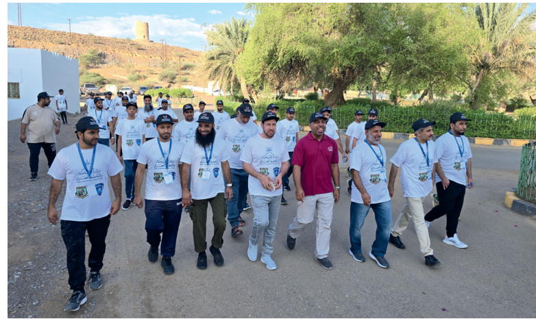
الفعالية تهدف إلى إشراك الشباب في تعزيز السياحة المستدامة

تأتي هذه الفعالية في إطار الجهود الرامية إلى تعزيز الوعي بالرياضة وأهمية الأفلاج كأحد العناصر الرئيسية في التراث الثقافي العماني، وتسليط الضوء على دورها التاريخي في تلبية احتياجات الزراعة والمياه.