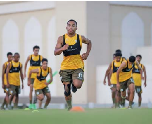
تدريبات منتخبنا الوطني لناشئي

يخوض اليوم منتخبنا الوطني لناشئي كرة القدم تجربة ودية أمام شقيقه المنتخب اليمني في الساعة الخامسة وخمس دقائق مساءً على ملعب استاد السيب الرياضي، وذلك في إطار برنامج إعداد المنتخبين للمشاركة في التصفيات أمم آسيا التي ستقام خلال الفترة من ٢٣ إلى ٢٧ أكتوبر الجاري، حيث يلعب منتخبنا في المجموعة الخامسة التي تضم أيضاً سنغافورة (المضيفة) وجوام وطاجيكستان، أما المنتخب اليمني فيسليعب في المجموعة التاسعة التي تضم أيضاً فيتنام (المضيفة) وقرغيزستان وميانمار يتأهل صاحب المركز الأول من كل مجموعة من المجموعات العشر إلى جانب أفضل ٥ منتخبات حاصلة على المركز الثاني، إلى النهائيات التي تستضيفها السعودية خلال الفترة من ٣-٢٠ أبريل من عام ٢٠٢٥ ويسمى منتخبنا من تجربة اليمن إلى الخروج بنتائج جيدة خصوصاً وأن المنتخب اليمني يضم في صفوفه عناصر جيدة خاضت خلاله الفترة الماضية عدة تجاربية وظهرت بمستويات فنية عالية، وعقب تجربة اليمن سيختتم منتخبنا معسكره الداخلي الذي بدأ يوم السابع من الشهر الجاري على أن يستأنف تدريباته يوم الأربعاء القادم استعداداً للسفر إلى سنغافورة للمشاركة في التصفيات. وكان منتخبنا خاض مباراة ودية أمام شباب نادي فنجان فاز فيها بخمسة نظيفة.