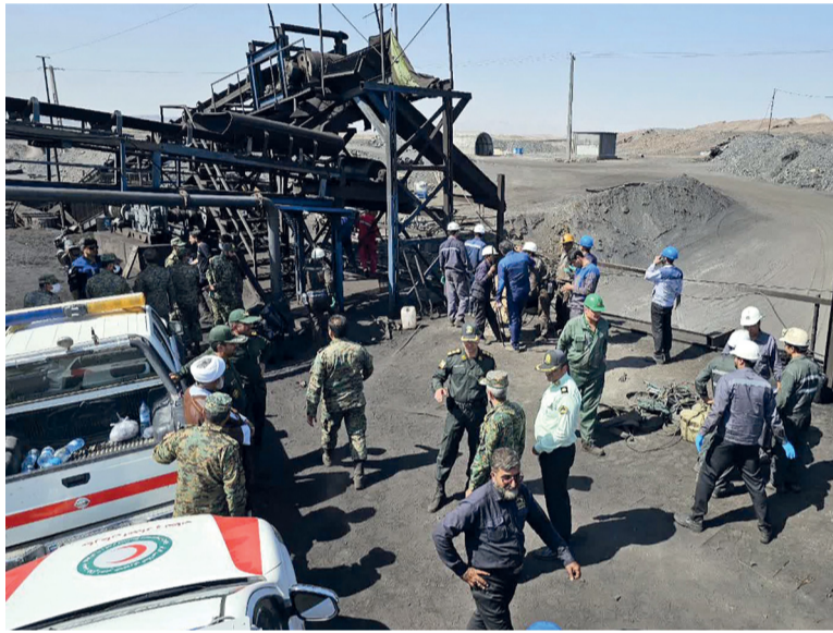
قوات الأمن تنتشر في مكان انفجار منجم الفحم في إيران

إلى أن عدد العمال المتواجدين ناهز ٧٠ شخصا على الأقل. وأضاف أن تسرب غاز الميثان أدى إلى الانفجار في كثلتين من المنجم. وبث التلفزيون الرسمي مشاهد لسيارات إسعاف ومروحيات تتوجه إلى مكان الحادث لنقل المصابين إلى المستشفى. كذلك، أظهرت مشاهد مصورة نشرتها إرنا جثث عدد من الضحايا الذين كانوا يرتدون زي العمل، بينما تم نقلهم من الموقع على عربات تابعة للمنجم.