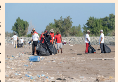
جمع أكثر من ٤٧ كيساً من النفايات المتنوعة

مصادرنا الطبيعية، وتأكيداً على أهمية صون البيئة العمانية كأولوية من الأولويات الوطنية لرؤية عُمان ٢٠٤٠. تم جمع أكثر من ٤٧ كيساً من النفايات المتنوعة، شملت عبوات بلاستيكية وإطارات تالفة، وشباك صيد، وأجزاء من سلاح نافقة، حيث تعد سلطنة عُمان موطناً لعدد من السلاح البحرية المهددة بالانقراض، حيث يشكل التلوث بالبلاستيك وشباك الصيد الملقاة في المياه تهديداً كبيراً لتلك السلاحف.