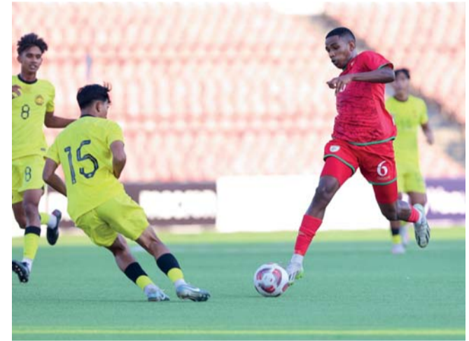
من مباراة منتخبنا وماليزيا