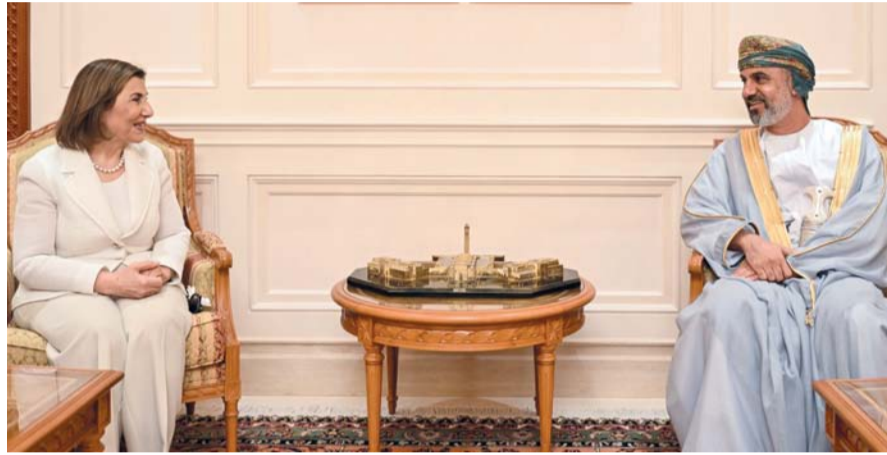
■ خالد المعولي أثناء استقباله بثينة شعبان

استقبل سعادة خالد بن هلال المعولي، رئيس مجلس الشورى صباح أمس بمقر المجلس، معالي الدكتورة بثينة شعبان المستشارية السياسية والإعلامية للرئيس السوري ورئيسة أمناء مؤسسة وثيقة وطن والوفد المرافق لها. وفي بداية اللقاء رحب سعادته بمعالي الدكتورة متمنياً لها وللوفد المرافق طيب الإقامة في سلطنة عُمان، راجياً أن تسهم الزيارة في تعزيز علاقات الصداقة والتعاون القائمة بين سلطنة عُمان والجمهورية العربية السورية في شتى المجالات. من جانبها أعربت معاليها عن سعادتها والوفد المرافق لها بزيارة سلطنة عُمان، مشيدة بالعلاقات التاريخية المتينة