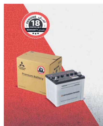
بطاريات ميتسوبيشي الأصلية تقدم أداء فائقًا

البطارية. ومع ضمان ١٨ شهرًا، تقدم هذه البطاريات للسائقين شعورًا كاملاً بالأمان، مع ثقة مطلقة في الأداء وحماية دائمة طول الطريق.