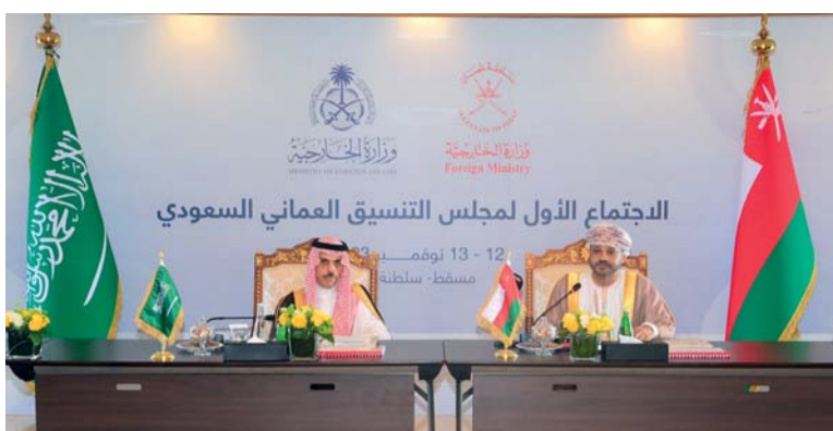
مجلس الأعمال السعودي يسهل إلى تعزيز العلاقات التجارية والاستثمارية

الرياض - الغماني: تحفي المملكة العربية السعودية الشقيقة اليوم بيومها الوطني الرابع والتسعين الذي يصادف الـ ٢٣ من سبتمبر من كل عام، وقد حققت منجزات عدة وفق رؤية متكاملة، بقيادة خادم الحرمين الشريفين وولي عهده، لتحقيق النمو والازدهار، وتواصل سلطنة عُمان والمملكة العربية السعودية الشقيقة بقيادة حضرة صاحب الجلالة السلطان هيثم بن طارق المعظم وأخيه خادم الحرمين الشريفين الملك سلمان بن عبدالعزيز آل سعود ملك المملكة العربية السعودية، حفظها الله ورعاها. تعزيز التعاون في مختلف المجالات والقطاعات انطلاقاً من العلاقات المتينة بما يعود بالنفع على بلديهما وشعبيهما الشقيقتين. ويسعى البلدان إلى تطوير الاستثمارات المتبادلة بينهما في التقنيات المتطورة والابتكار ومشاريع الطاقة والطاقة المتجددة والصناعة، والجال الصحي والصناعات الدوائية، والتطوير العقاري، والسياحة، والصناعات البترولية والكيمويات، والصناعات التحويلية، وسلاسل الإمداد والشراكة اللوجستية، وتقنية المعلومات والتقنية المالية بالإضافة إلى مجالات اقتصادية وتجارية أخرى.