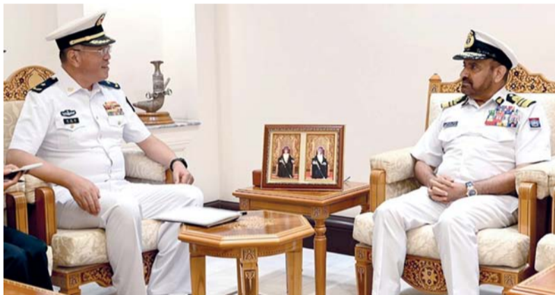
■ عبدالله الرئيسي أثناء استقباله تونج شينج هاي

بحري علي بن محمد البلوشي مساعد رئيس الأركان للإدارة والسياسة، وعدد من كبار الضباط برئاسة أركان قوات السلطان المسلحة. كما استقبل اللواء الركن بحري سيف بن ناصر الرحبي قائد البحرية السلطانية العُمانية بمكتبه بمعسكر المرتفعة أمس اللواء بحري تونج شينج هاي نائب مدير إدارة اللوجستيات بالقوات البحرية بجمهورية الصين الشعبية والوفد المرافق له الذي يزور سلطنة عُمان حالياً. تم خلال المقابلة تبادل الأحاديث الودية وبحث وجهات النظر في عدد من المجالات البحرية ذات الاهتمام المشترك. حضر المقابلة العميد الركن بحري جاسم بن محمد البلوشي مدير عام العمليات والخطط، والعميد الركن بحري (مهندس) عوض بن عبدالرحمن المعمرى مدير عام الهندسة واللوازم بالبحرية السلطانية العُمانية.