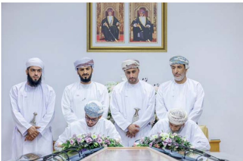
تعزيز دور المساجد في خدمة المجتمع

وقع مكتب محافظ شمال الباطنة صباح أمس عدد من العقود الخاصة بمساهمات وزارة الأوقاف والشؤون الدينية لدعم الجوامع والمساجد المتأثرة بمشروع الباطنة الساحلي، تم توقيع العقود مع وكلاء المساجد في ولايات صحار وشناص وصحم والخابورة والسويق، بإجمالي ١٠ عقود بتكلفة مليونين و٣٤٥ ألف ريال عماني، وذلك بحضور سعادة محمد بن سليمان الكندي محافظ شمال الباطنة، وسعادة أحمد بن صالح الراشدي وكيل وزارة الأوقاف والشؤون الدينية، إلى جانب عدد من أصحاب السعادة ولاة ولايات المحافظة، وكبار المسؤولين في