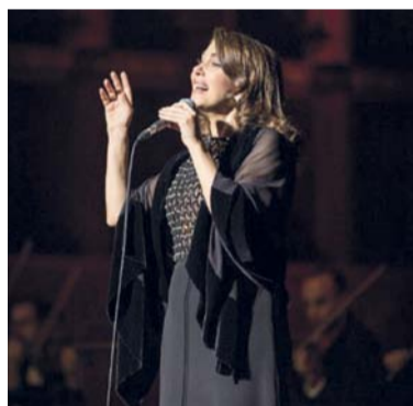
يوم المرأة العمانية يشهد مشاركة الفنانة ماجدة الرومي

تفتتح دار الأوبرا السلطانية مسقط عروض شهر أكتوبر المقبل بعرض (الحفل التكريري) للمؤلف الموسيقي الشهير جوزيبي فيردي، والذي يتم عرضه لأول مرة في سلطنة عمان من قبل المركز الوطني للفنون