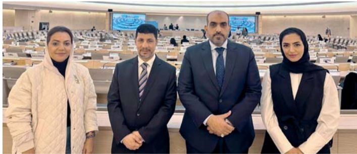
■ وفد اللجنة العُمانية لحقوق الإنسان

تبدأ اليوم بمدينة نيويورك بالولايات المتحدة الأمريكية أعمال اجتماع الجمعية العامة للأمم المتحدة الرفيع المستوى بشأن مقاومة مضادات الميكروبات والتي تستمر حتى يوم ٢٧ من شهر سبتمبر الجاري. وتشارك السلطنة، ممثلة بوزارة الصحة، في هذا الاجتماع، بوفد يرأسه سعادة الدكتور أحمد بن سالم المنظري وكيل الوزارة للخطيط والتنظيم الصحي، حيث تأتي مشاركة الوزارة في هذا الحدث لإبراز قيادتها واستبقايتها في مكافحة مقاومة مضادات الميكروبات واستكمالاً لجهود سلطنة عمان في التصدي لها، وتعزيزاً لمخرجات المؤتمر الوزاري الثالث الرفيع المستوى وبيان مسقط الذي صادق عليه ٤٧ دولة.