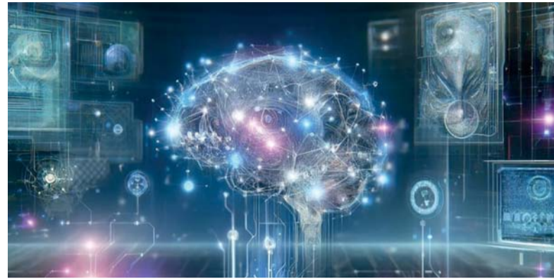
مسقط . الوطن

أطلقت سلطنة عُمان «البرنامج الوطني للذكاء الاصطناعي والتقنيات الرقمية المتقدمة» ضمن إطار رؤية عُمان ٢٠٤٠ التي تسعى لجعل تقنية المعلومات والاتصالات من بين القطاعات الأساسية والمحفزة للاقتصاد الوطني. حيث يمتد البرنامج من العام الحالي وحتى نهاية عام ٢٠٢٦م ليشمل عددًا من المبادرات والمشروعات الموكّبة للمنتجات العالمية في مجال الذكاء الاصطناعي، أبرزها إنشاء المنصة الوطنية للبيانات المفتوحة لدعم رواد الأعمال والمستثمرين وتمخذي القرار، وإنشاء مركز وطني للبحث والتطوير في الذكاء الاصطناعي لدعم الباحثين والأكاديميين، إضافة إلى إنشاء «إستوديو» للذكاء الاصطناعي ليكون نقطة التقاء بين المتخصصين في الذكاء الاصطناعي والشركات والمؤسسات التي تبحث عن حلول تقنية باستخدام الذكاء الاصطناعي، وإنشاء نموذج لغوي عُماني يتم تدريبه على المحتوى العُماني الثقافي والتاريخي والفني والعلمي باستخدام الذكاء الاصطناعي التوليدي، وإنشاء مركز للثورة الصناعية الرابعة بالتعاون مع وزارة الاقتصاد وبالشراكة مع المنتدى الاقتصادي العالمي، إلى جانب تنفيذ مبادرات الحوسبة الكمية لنشر الوعي وتعزيز البحث والتطوير وتبني