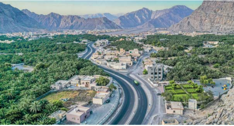
المشروع يهدف إلى تشجيع أهالي مسندم على الاستثمار في إنشاء وتطوير النزل السياحية