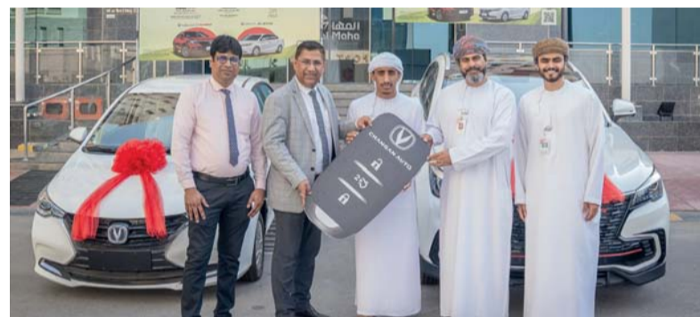
تسليم الفائز بالجائزة الكبرى

ملحوظة في عدد المستخدمين، ونؤكد في المهما التزامنا بتقديم أفضل الخدمات لعملائنا، مع استمرار العروض والجوائز على مدار العام.