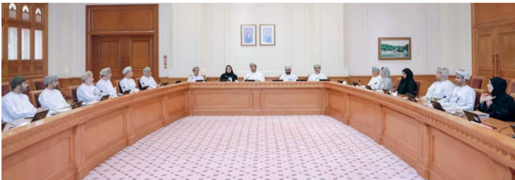
اللجنة خلال استضافتها المسؤولين من وزارتي «التجارة والصناعة» و«الاقتصاد»

مسقط - «الوطن»: تبدأ اليوم فعاليات الحلقة الإقليمية الثانية لتقييم وإدارة مخزون أسماك الكنعند التي تنظمها وزارة الثروة الزراعية والسمكية وموارد المياه وبالتعاون مع الهيئة الإقليمية لمصادر الأسماك (الريكوفا) وتعد فعالياتهما خلال الفترة من ٢٣ - ٢٥ من شهر سبتمبر الجاري، وستناقش الحلقة محاور علمية أهمها: تقييم حالة المخزون الحالي لأسماك الكنعند في سواحل دول المنطقة ودراستها وتحليلها علمياً واحصائياً ومراجعة جودة البيانات المستخدمة في التقييم ودور الهيئة الإقليمية لمصادر الأسماك (الريكوفا) في تحسين جودة البيانات المستخدمة في التقييم وتقديم التوصيات العلمية في مجال البيانات والتقييمات ومناقشة أوجه دعم منظمة الأمم المتحدة للأغذية والزراعة (الفاو) لجهود دول المنطقة محلياً وجمعياً في دراسة مخازين أسماك الكنعند.