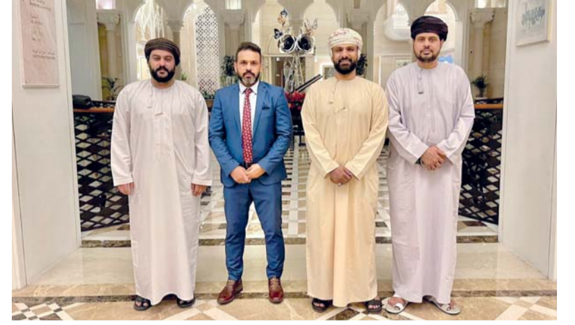
وفد نادي ظفار المشارك في مراسم سحب قرعة البطولة

حارس مرمى وهداف البطولة. وخصص اتحاد كأس الخليج العربي لكرة القدم مساهمة مالية للأندية المشاركة وغيرها من الجوائز المالية التحفيزية وفقاً للائحة، حيث تم تخصيص مبلغ مالي قدره ٣٠٠ ألف دولار للأندية المشاركة في البطولة، بالإضافة إلى مكافأة التأهل للدور نصف النهائي بمنح كل ناد مشارك مبلغاً مالياً قدره ١٠٠ ألف دولار، فيما ستكون هناك مساهمة للسفر للعب خارج الأرض، تمنح لكل ناد مشارك مبلغاً مالياً قدره ٣٠ ألف دولار في كل مباراة يلعب فيها خارج أرضه، بالإضافة إلى مكافأة الفوز في المباراة والتي تبلغ قيمتها ٣٠ ألف دولار في كل مباراة يحقق فيها الفوز.