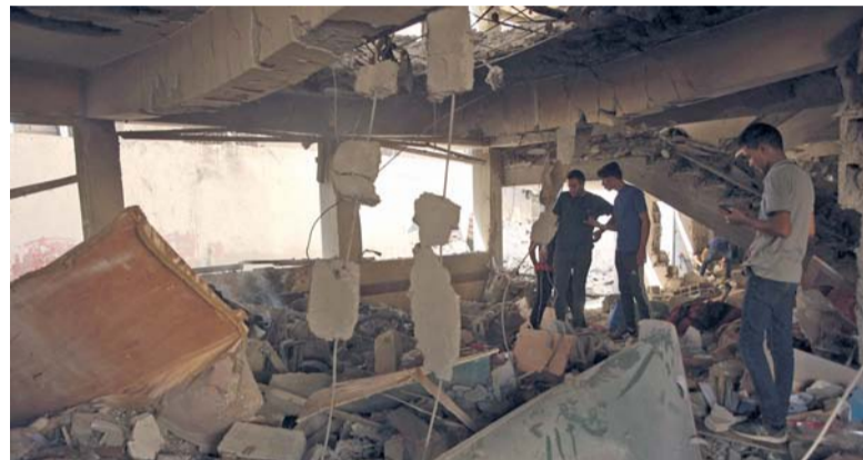
فلسطينيون يعانون الأضرار في موقع غارة إسرائيلية على مدرسة تؤولي فلسطينيين نازحين في حي الزيتون بمدينة غزة.

وأضافت الوزارة أن «أنظمة الدفاع الجوي المناوبة دمرت ١٥ طائرة مسيرة أوكراينية منها ٦ فوق بحر آزوف، و ٤ فوق مقاطعة روستوف، واثنان فوق كورسك، ومسيرة واحدة في كل من مقاطعات أستراخان وبييلجورود وفورونيج».