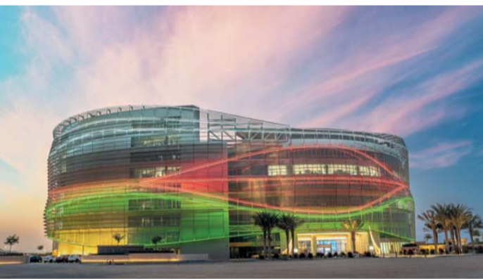
تقنية RedCap تلبى احتياجات تطبيقات إنترنت الأشياء «IoT»

تطبيقات إنترنت الأشياء (IoT) المتزايدة بفضل سرعتها العالية وكفاءتها في استهلاك الطاقة. ستتيح هذه التقنية تشغيل مجموعة واسعة من الأجهزة والتطبيقات التقنية، بدءًا من الأجهزة الذكية القابلة للارتداء وصولًا إلى الأجهزة الصناعية المتقدمة.