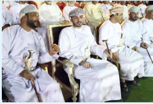
راعي المناسبة والحضور