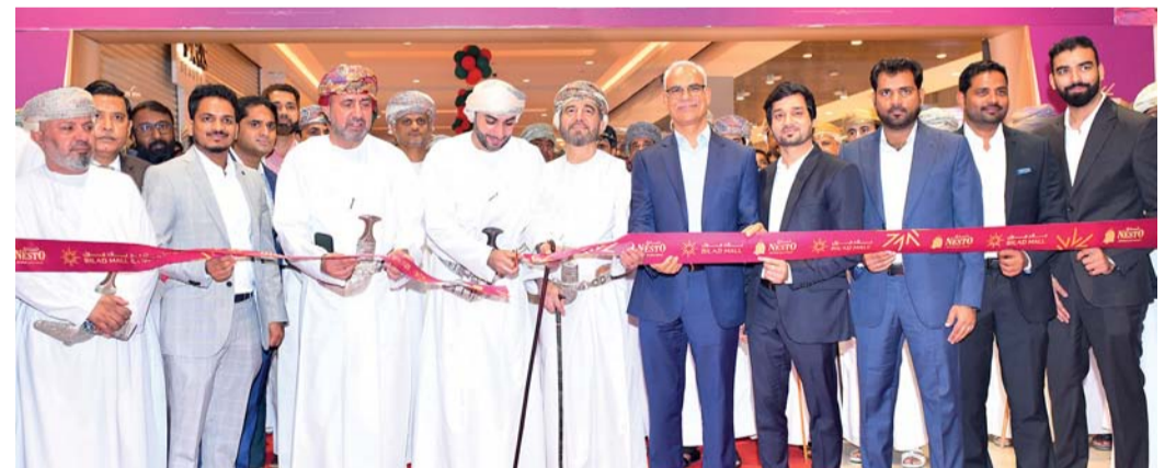
لحظة قص الشريط إيداناً بافتتاح نستو هايبر ماركت بالمعبيلة

نستو، ونحن ملتزمون بتقديم تجارب بيع بالتجزئة لا مثيل لها مع منتجات وخدمات عالية الجودة للمجتمع المحلي. كما أن بلاد مول ليس مجرد مركز تسوق عادي بل هو مركز تجاري صغير ومتكامل يوفر حلاً شاملاً لجميع احتياجات الأسرة ويستضيف مجموعة متنوعة من المستأجرين الذين يقدمون خدمات البيع بالتجزئة المتنوعة. الجدير بالذكر أن نستو تخطط مستقبلاً إلى افتتاح خمسة مشاريع أخرى خلال العامين المقبلين، مما يساهم في إجمالي سبعة مشاريع قيد التنفيذ حالياً في سلطنة عُمان.