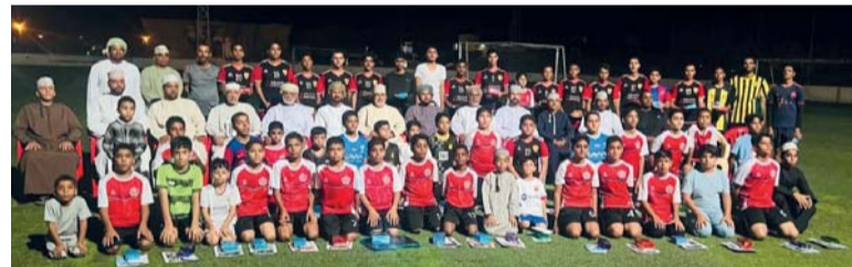
صورة جماعية للاعبين المكرمين مع راعي الحفل والحضور

وشهدت المباريات الافتتاحية للدورة تنافساً كبيراً وإثارة من خلال أشواطها حيث استطاع فريق سداب المستضيف التغلب على نظيره فريق النهضة بهدفين مقابل هدف، وفي المباراة الثانية التي جمعت فريق مقنبات والريضة تغلب فريق مقنبات على فريق الريح بهدفين مقابل هدف واحد.