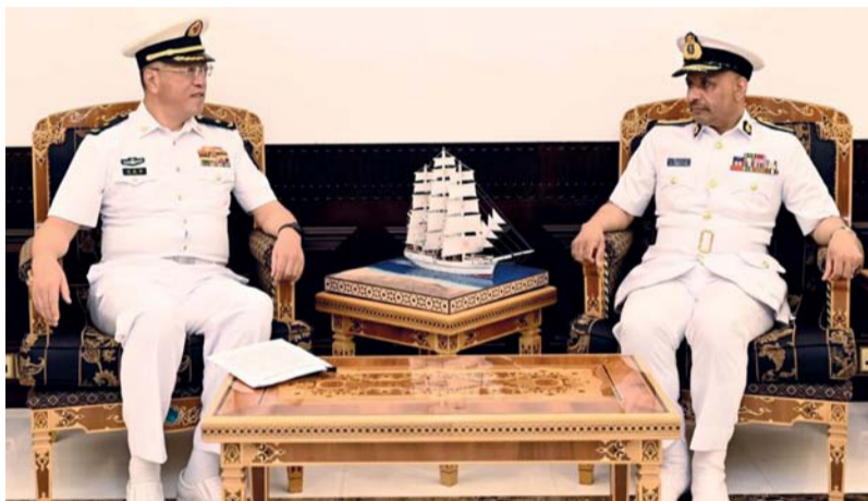
■ .. ويستقبله سيف الرحبي

مسقط، العُمانية: استقبل الفريق الركن بحري عبدالله بن خميس الرئيسي رئيس أركان قوات السلطان المسلحة بمكتبه بمعسكر المرتفعة أمس اللواء بحري تونج شينج هاي نائب مدير إدارة اللوجستيات