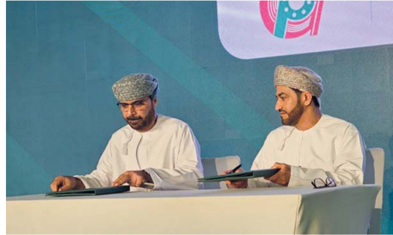
الاتفاقيات والعقود تأتي ضمن التزامات خطط المحتوى المحلي