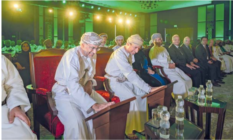
البرنامج يعمل على تحويل التحديات إلى فرص بروح الابتكار

وأشار معاليه إلى أن نسبة التعمين في الشركات المشغلة بقطاع النفط والغاز وصلت إلى ٩٢٪، مما يعكس التزام القطاع بتطوير الكوادر العمالية والإسهام في التنمية الاقتصادية، وكلنا طموح بأن نتغلب على تحديات المرحلة القادمة ومتطلباتها من التنمية الاقتصادية وتنويع مصادر الدخل وبناء اقتصاد متقدم وسوق عمل تنافسي، ومن أبرز هذه التحديات ضمان إيجاد وظائف مستدامة بناء على التوجهات السامية، ودعم القاعدة الصناعية لتحسين البيئة التنافسية و قدرة المشاركين بالمنظومة الاقتصادية ضمان جاذبية الاستثمار، وخصوصا بتطوير الفرص المتعلقة بالمنتجات والخدمات الاستراتيجية أو عالية الأثر، مؤكدا العمل على نقل التجربة إلى قطاعات المعادن والطاقة المتجددة والهيدروجين والتخطيط المتكامل لجميع المشاريع الاستراتيجية والتنموية القادمة. وعلى هامش حفل تدشين برنامج مجد تم توقيع ١٢ عقدا بقيمة إجمالية تزيد عن ١٧٢,٥ مليون دولار أميركي، حيث أن جميع الاتفاقيات وإسنادات الأعمال تتضمن إنفاق إلزامي مع الشركات الصغيرة والمتوسطة أو الشركات التابعة لبرنامج ريادة الأعمال، وشراء منتجات محلية، والتزامات لخطط تعمين ضمن خطط المحتوى المحلي المدججة بالعقود.