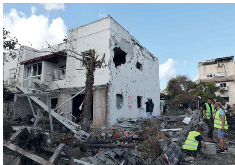
موقع ضربة شنها حزب الله اللبناني في كريات بياليك بمخطة حيفا بإسرائيل.

أن الأدلة الجنائية باشرت عملها لتحديد هويات الأشلاء.