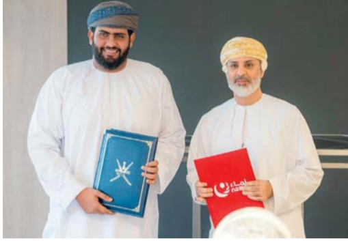
العقود تساهم في توفير أعمال للمؤسسات الصغيرة والمتوسطة

وعلى هامش توقيع برنامج التعاون جرى توقيع عقود وفرص أعمال بين شركات مجموعة نماء مع ٨ مؤسسات صغيرة ومتوسطة، حيث وقعت مجموعة نماء عقداً مع شركة ثريبايز لإعداد الإستراتيجية الإستراتيجية للمجموعة، ووقعت الإتصالية للمجموعة، ووقعت نماء لخدمات المياه عقداً مع أطلس الدولية للاستشارات الهندسية للإشراف على الخدمات الإستشارية لإنشاء شبكات الصرف الصحي في عدد من المناطق بولاية السيب، ومع مشاريع الربى التجارية لتوريد صمامات لتقليل الضغط، ووقعت شركة نماء لخدمات زفان عقداً مع مشاريع النجد للخدمات البتروكيماوية لتصميم وإنشاء توصيلات الصرف الصحي الجديدة في محافظة ظفار.