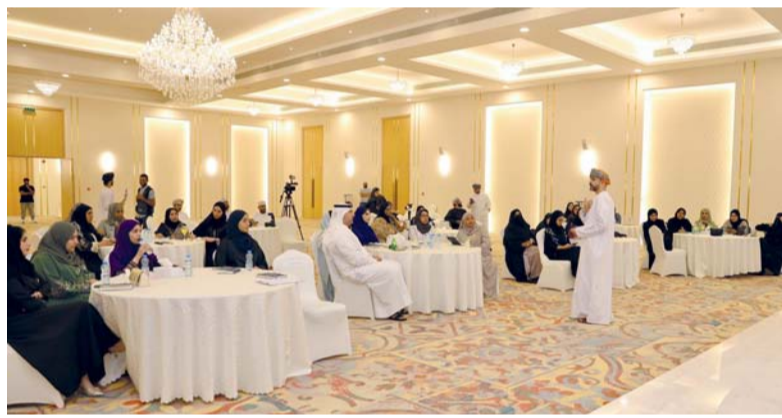
حلقة العمل تساهم في تطوير مهارات رواد الأعمال

ونظمت وزارة النقل والاتصالات وتقنية المعلومات بالتعاون مع وزارة التجارة والصناعة وترويج الاستثمار وهيئة تنظيم الاتصالات والبنك المركزي العماني ومكتب محافظ جنوب الشرقية جولة تعريفية بالبرنامج الوطني للاقتصاد الرقمي وأهم برامجها التنفيذية ومنها التحول الرقمي الحكومي، والتجارة الإلكترونية، والتقنيات المالية، والبنية الأساسية الرقمية؛ بدءاً من محافظة جنوب الشرقية ومن ثم بقية المحافظات. يأتي ذلك بهدف التعرف بالتوجهات والمشاريع الحكومية في مجال الاقتصاد الرقمي في سلطنة عمان. تضمن البرنامج في أولى محطاته عدة عروض وجلسات نقاشية مفتوحة؛ حيث بدأ البرنامج بعرض تقديمي عن البرنامج الوطني للاقتصاد الرقمي وأهدافه ومؤثراته. واستعرضت وزارة التجارة والصناعة وترويج الاستثمار ورقة عمل حول البرنامج التنفيذي للتجارة الإلكترونية؛ حيث تم تقديم إنجازات الخطة الوطنية والرؤى المستقبلية لتعزيز الثقة بين المستهلكين والتجار مما يساهم