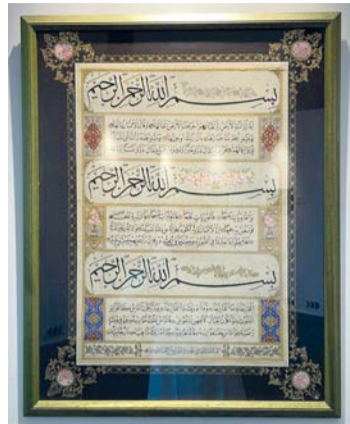
مسقط - «الوطن»:

شارك عدد من الخطاطين العمانيين في مهرجان البدر بإمارة الفجيرة بدولة الإمارات العربية المتحدة، وهي مبادرة في حب رسول الله صلى الله عليه وسلم في نسخها الثالثة هذا العام التي تقام بالشارقة مع مدرسة الخط والزخرفة بالفجيرة، حيث أقيمت الفعالية بمركز الفجيرة الإبداعي التابع لوزارة الثقافة والشباب، وذلك احتفالاً بذكرى المولد النبوي الشريف وتستمر حتى ٢٦ من سبتمبر الجاري.