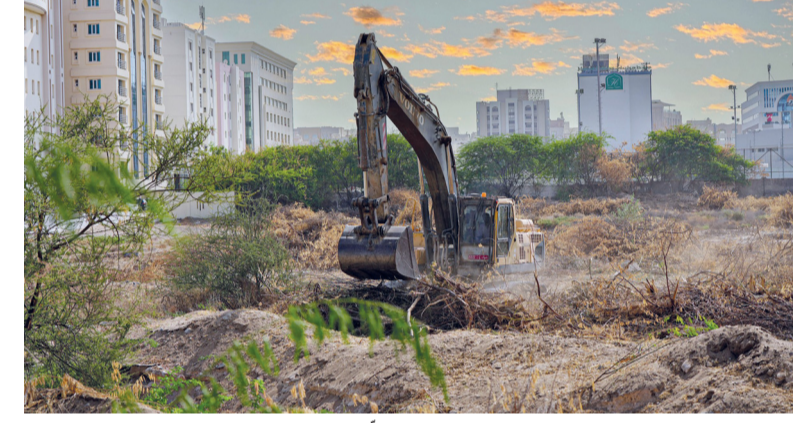
وضع برنامج متكامل للحد من انتشار المسكيت،

مسقط - «الوطن» : تواصل إدارة الثروة الزراعية وموارد المياه بمحافظة مسقط تنفيذ الحملة الوطنية لإزالة أشجار الغاف البحري المسكيت بالتعاون مع المؤسسات الحكومية والخاصة ذات الصلة، وذلك في منطقة الخوير بولاية بوشهر والجفنين بولاية السيب والرملة بولاية قريات. وتعد منطقة الخوير بولاية بوشهر أحد الأماكن المتضررة، والتي تم رصد تجمعات لشجرة المسكيت وانتشرت فيها بسهولة بشكل كبير على مساحة ٣٠ فدانا، حيث تعيق مجرى الوادي، بالإضافة إلى ضررها لأساسيات المباني، كما أن جذورها تسبب تداخلا مع النباتات والحشائش الموسمية ذات الجذور السطحية عن طريق منافستها على الماء والعناصر الغذائية، فيما تسبب حبوب اللقاح حساسية لدى بعض الأشخاص.