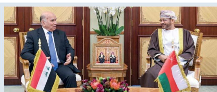
بدر البوسعيدي أثناء استقباله فؤاد حسين

حول مسيرة العلاقات التي تربط سلطنة عُمان بالمملكة المتحدة. كما تم استعراض عدد من مجالات التعاون وسبل تطويرها بما يحقق مصالح البلدين الصديقين، إلى جانب التطرق إلى عدد من الأمور ذات الاهتمام المشترك. ﷻ