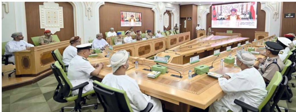
البرنامج يهدف إلى تطوير المهارات والقدرات القيادية

بدأت صباح امس في مبنى مجلس عُمان أعمال البرنامج التدريبي لتأهيل قيادات الصف الثاني لعدد من منتسبي الأمانة العامة لمجلس الشورى، الذي يستكمل من خلاله المجلس خطته في تطوير مهارات موظفيه في مختلف التقسيمات الإدارية وتأهيلهم في مجال صنع القرار وفقاً لرؤية عُمان ٢٠٤٠م. ويهدف البرنامج إلى رفع الأمانة العامة ببيانات متمكنة تساعد في صنع القرار بشكل رشيق وفعال؛ لتعزيز الإنتاجية المؤسسية واستثمار الوقت والجهد بهدف تطوير الأداء المؤسسي لمنتسبي الأمانة