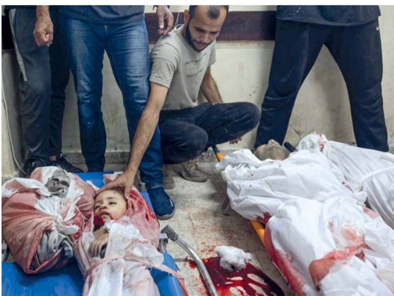
أب فلسطيني يودع جثمان طفله الذي استشهد في القصف الإسرائيلي على النصيرات وسط قطاع غزة.

وقال مسؤول كبير في الحكومة الإسرائيلية في نهاية الأسبوع «أشك في أن الأميركيين سيقدّمون عرضا في النهاية». من ناحية أخرى، قال أسامة حمدان، المسؤول الكبير في حماس، أن زعيم رئيسي المنتخب السياسي يحيى السنوار «سيبعث قريبا برسالة إلى الشعب الفلسطيني والعالم».