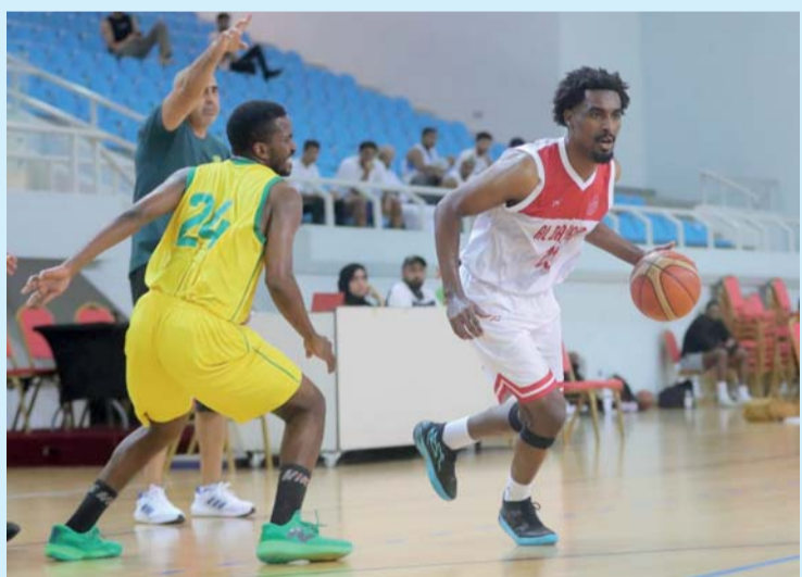
■ لقاء السيب والبشائر

وفي الربع الثاني ظهر السيب بشكل أفضل وبدأ مهاجما في محاولة منه لتقريب النتيجة والتعديل، وتمكن لاعبه رشيد