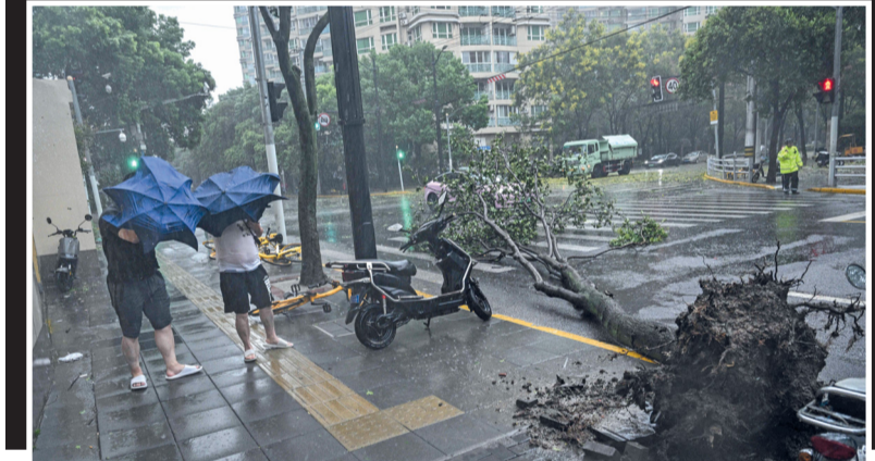
رجلان يحتمان من الرياح القوية والأمطار بمظلتئهما، بينما يعبران الطريق بجوار شجرة سقطت جراء إعصار بيبينكا في شنغهاي

مسقط - «الوطن» : تواصل إدارة الثروة الزراعية وموارد المياه بمحافظة مسقط تنفيذ الحملة الوطنية لإزالة أشجار الغاف البحري المسكيت بالتعاون مع المؤسسات الحكومية والخاصة ذات الصلة، وذلك في منطقة الخوير بولاية بوشهر والجفنين بولاية السيب والرملة بولاية قريات. وتعد منطقة الخوير بولاية بوشهر أحد الأماكن المتضررة، والتي تم رصد تجمعات لشجرة المسكيت وانتشرت فيها بسهولة بشكل كبير على مساحة ٣٠ فدانا، حيث تعيق مجرى الوادي، بالإضافة إلى ضررها لأساسيات المباني، كما أن جذورها تسبب تداخلا مع النباتات والحشائش الموسمية ذات الجذور السطحية عن طريق منافستها على الماء والعناصر الغذائية، فيما تسبب حبوب اللقاح حساسية لدى بعض الأشخاص.