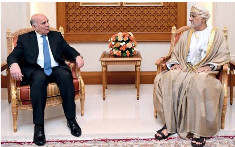
شهاب بن طارق أثناء استقباله فؤاد حسين