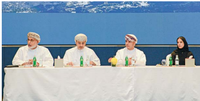
المُحدَّثون في المؤتمر

منظومة رصد جودة الهواء المحيط لتشمل معظم مناطق سلطنة عُمان. ومن جانبه استعرض الدكتور محمد بن سيف الكلباني، مدير عام الشؤون البيئية في هيئة البيئة العُمانية، الكلمة الرئيسية، مشيراً إلى مواجهة كوكبنا لأزمة حقيقية في الصحة والأمن، والتحديات البيئية السريعة، والتحديات الاقتصادية الهائلة التي جعلت من الضرورة اتخاذ إجراءات مناخية فورية أمرًا لا مفر منه لحماية الأرواح البشرية