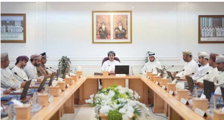
المجلس البلدي بمحافظة البريمي أثناء اجتماعه أمس

مسقط - «الوطن»: بدأ مجلس الدولة أمس بتنفيذ برنامج تدريبي يستهدف الموظفين بعنوان: (إعداد مشروعات القوانين والصياغة القانونية وتنسيق الأحكام) ويستمر حتى الخميس المقبل، يقدمه الدكتور أحمد بن علي بن عرابية المدرب والمستشار القانوني. يركز البرنامج على الصياغة القانونية وتنسيق الأحكام ويستمر حتى الخميس المقبل، يقدمه الدكتور أحمد بن علي بن عرابية المدرب والمستشار القانوني. يركز البرنامج على