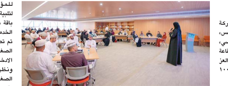
«العز بنس» تتضمن مجموعة من الخدمات المالية المرنة

وإحداث تأثير دائم بها. حالياً فهي تدير مركز اللغة والاختبار التابع لمعهد عمان لخدمات التدريب. بالإضافة إلى ذلك، فهي المديرية التنفيذية لرئيس مجلس إدارة شركة الخدمات التعليمية العمانية، ولها دور رئيس في توجيه المبادرات الاستراتيجية للمؤسسة. تم تصميم برنامج «العز بنس»