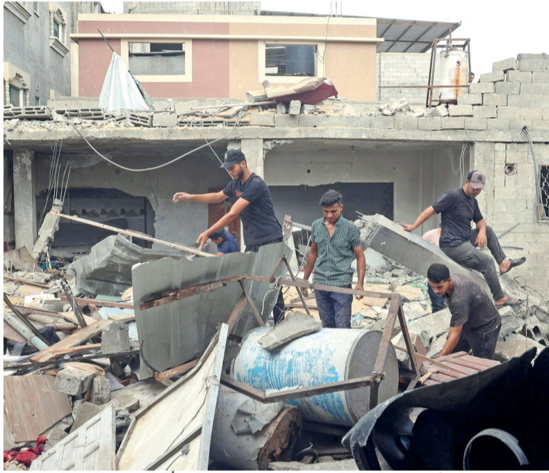
فلسطينيون يتفقدون أنقاض منزل بعد القصف الإسرائيلي، في النصيرات وسط قطاع غزة.