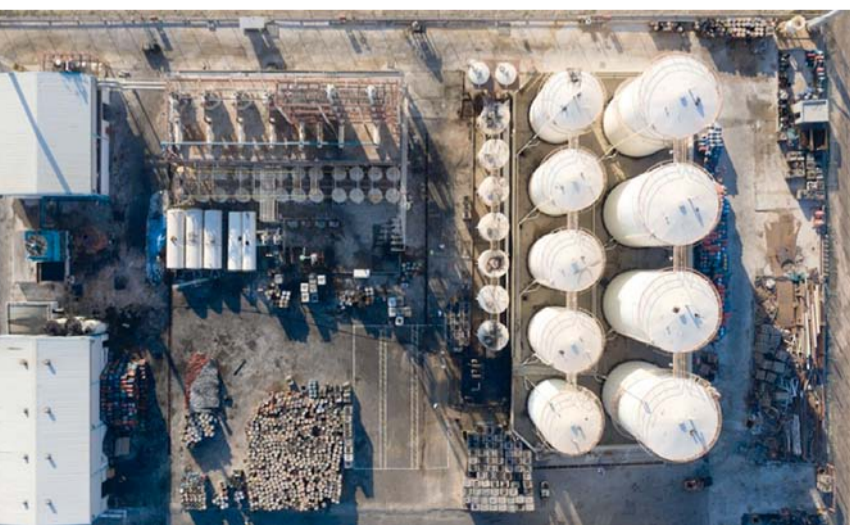
الفرص الاستثمارية المطروحة تشمل مشروعات متنوعة، وتساهم في زيادة القيمة المضافة للاقتصاد الوطني

النوعية التي من شأنها تحفيز الاقتصاد الوطني والإسهام في التشغيل المحلي. وأضاف، في تصريح لوكالة الأنباء العُمانية، أن الحكومة تسعى إلى تأطير فرص استثمارية على مستوى جميع محافظات سلطنة عُمان وفي قطاعات واعدة ضمن خارطة جغرافية متكاملة، ويمكن للمستثمرين استكشاف هذه الفرص عبر المنصة الإلكترونية كونها توفر خدمات متكاملة للمستثمر لبدء مشروعه الاستثماري. وأشارت إلى أنه يمكن للمستثمر تسجيل الدخول للمنصة والإطلاع على خارطة الفرص الاستثمارية والقطاعات الاستثمارية وحزم الحوافز والاستثمارية المقدمة إضافة إلى جميع المعلومات التي يحتاجها المستثمر عن البيئة الاستثمارية في سلطنة عُمان. يذكر أن عدد الفرص الاستثمارية، التي تم تطويرها عبر صالة استثمار في عُمان وبالتعاون مع الشركاء من مختلف الجهات الحكومية، بلغ منذ عام ٢٠٢٣ وحتى الآن ما يقارب ٧٠ فرصة استثمارية في القطاعات اللوجستية والسياحية وتقنية المعلومات والأمن الغذائي والتعدين والصناعات التحويلية. وانطلقت صالة «استثمر في عُمان» في يناير ٢٠٢٣ لتكون محطة متكاملة لجذب المستثمرين من أصحاب رؤوس الأموال من أفراد وشركات وغيرها من أجل الاستثمار في القطاعات الاستراتيجية النوعية التي تتجه سلطنة عُمان لتعزيز الاستثمار الأجنبي المباشر فيها.