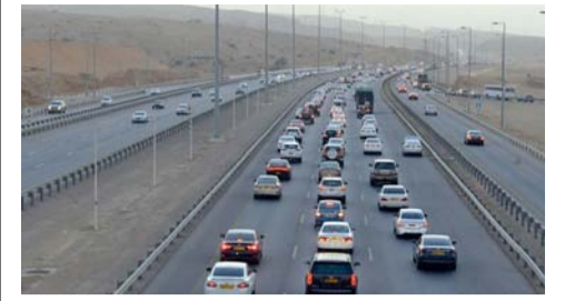
التسجيل الخصوصي يستحوذ على ٧٩,٤ بالمائة من المركبات المسجلة

ويهدف برنامج التعاون الذي وقعته من جانب الهيئة سعادة حليمة بنت راشد الزرعية رئيسة هيئة تنمية المؤسسات الصغيرة والمتوسطة ومن جانب مجموعة نماء أحمد بن عامر المحرزي الرئيس التنفيذي لمجموعة نماء إلى دعم المؤسسات الصغيرة والمتوسطة للنمو والتوسع وتنفيذ برامج وأنشطة تعزز من تمكين رواد الأعمال ويشمل برنامج التعاون توفير فرص أعمال للمؤسسات الصغيرة والمتوسطة في مجال الكهرباء والمياه والصرف الصحي من خلال برامج