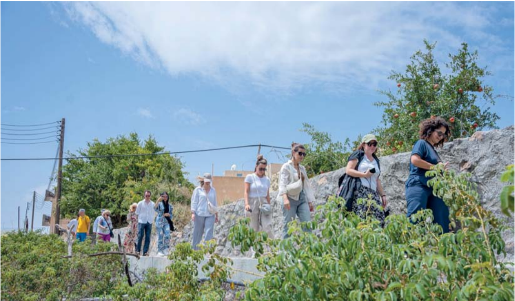
الفعالية تعزز مكانة سلطنة عمان كوجهة سياحية رئيسية على خارطة السياحة العالمية

شهدت أسواق عدد من المشاركين في فعالية (مرحبا أوروبا) التي نظمتها وزارة التراث والسياحة لـ ٧٠ شركة سياحية من الأسواق الأوروبية (فرنسا وألمانيا وإيطاليا والمملكة المتحدة وإيرلندا وسويسرا وأستراليا ودول الشمال) بالتطور الذي يشهده القطاع السياحي في سلطنة عمان، مؤكداً أن الفعالية قدمت صورة شاملة للشركات المشاركة والتي سينعكس دورها لاحقاً في ترويجها لسلطنة عمان منوهين أن فعالية (مرحبا أوروبا) تعد إضافة قيمة للمساهمة في تعزيز التعاون مع هذه الشركات لجذب السياح من الأسواق المستهدفة والمساهمة في تبادل الخبرات والمعرفة مع الشركات النظيرة لها في سلطنة عمان. وأكد المشاركون أن القلاع والحصون والأسواق الشعبية والعادات العُمانية أعطت طابعاً سياحياً مختلفاً عن باقي الدول وتسهم في جذب السياح إلى سلطنة عمان في مختلف المواسم. بالإضافة إلى أن استخدام طرق التواصل المتكررة تساهم في تعزيز تنمية العلاقات وتبادل الخبرات في المجال السياحي، مؤكداً على أن هذه اللقاءات التي تستضيفها سلطنة عمان تعمل على تعزيز