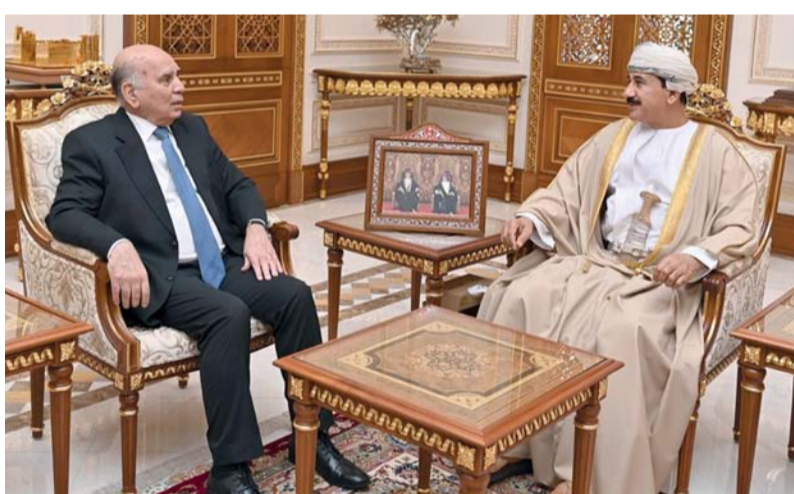
... ويستقبله سلطان النعماني

الوطيدة بين البلدين الشقيقين وسبل تطويرها، ومناقشة عدد من الموضوعات ذات الاهتمام المشترك. حضر اللقاء سعادة سفير جمهورية العراق المعتمد لدى سلطنة عمان. كما استقبل معالي الفريق أول سلطان بن محمد النعماني وزير المكتب السلطاني بمكتبه صباح أمس معالي الدكتور فؤاد حسين نائب رئيس مجلس الوزراء وزير الخارجية بجمهورية العراق الشقيقة، تم خلال اللقاء تبادل الأحاديث الودية والموضوعات ذات الاهتمام المشترك، وبحث سبل تعزيز التعاون القائم بين البلدين الشقيقين بما يحقق المصالح المشتركة.