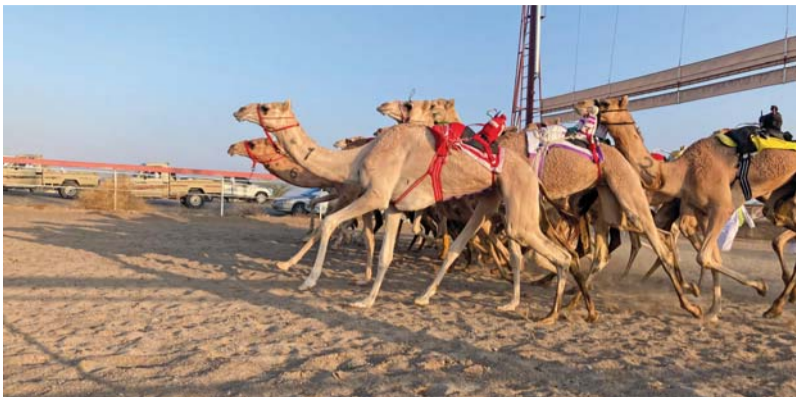
صورة أرشيفية من سباقات الهجن الأهلية

أعلن الاتحاد العماني لسباقات الهجن عن برنامجها للموسم الجديد لسباقات الهجن الإلهية ٢٠٢٤/٢٠٢٥. حيث تفتتح منافسات الموسم الحالي بالمهرجان السنوي عبر سباق ولاية بركاء بميدان الفليج وولاية ادم بميدان البشائر خلال الفترة من ٤ إلى ٦ من شهر أكتوبر القادم، على ان تقام مسابقة المزاينة الأولى بميدان الفليج بولاية بركاء خلال الفترة من ٩ إلى ١٣ أكتوبر والسباق الثالث بعام في ميدان الفليج وميدان البشائر بادم خلال الفترة من ١٠ إلى ١٢ نوفمبر وبعدها بعام سباق تنافسي مع مزاينة ومحالية في ثمريت خلال الفترة من ١١ إلى ١٧ نوفمبر ثم يتم سباق الرابع خلال الفترة من