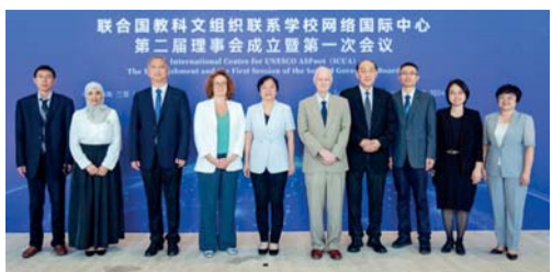
أثناء مشاركة وفد سلطنة عُمان في الاجتماع

بكين . العُمانية: تشارك سلطنة عُمان ممثلة باللجنة الوطنية العُمانية للتربية والثقافة والعلوم في الاجتماع الأول لأعضاء مجلس إدارة المركز الدولي لشبكة المدارس المنتسبة لليونسكو (ICUA)، المنعقد بمحافظة هاينان بجمهورية الصين الشعبية، ويستمر حتى ٢١ سبتمبر الجاري. ويناقش الاجتماع عدّة موضوعات رئيسية، منها الشراكات الدولية، واعتماد الخطط والبرامج السنوية للمركز للعامين ٢٠٢٤-٢٠٢٥، وهيكلة المركز، والميزانية الخاصة لعام ٢٠٢٥، وتوصيات المؤسسات الحكومية والمنظمات الإقليمية والدولية التي يعمل معها المركز. ويصاحب الاجتماع زيارات لبعض المدارس الصينية المنتسبة لليونسكو، للاطلاع على برامجها التعليمية، بالإضافة إلى زيارات لبعض المواقع التراثية المسجّلة في قائمة التراث العالمي لليونسكو. ﷻ