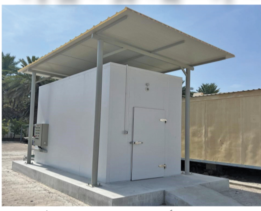
مواصفات فنية تتلاءم مع طبيعة اللقاحات والأمصال

مسقط - «الوطن» : دشنت وزارة الثروة الزراعية والمسكية وموارد المياه ١١ غرفة تبريد خاصة لحفظ اللقاحات البيطرية المستخدمة بالمشروع الوطني لتحسين الثروة الحيوانية، وذلك في مختلف محافظات سلطنة عُمان. وذلك في إطار المساعي المستمرة لتطوير الخدمات البيطرية في سلطنة عُمان. تأتي هذه الخطوة لضمان الحفاظ على سلسلة التبريد أثناء التخزين، حيث توفر هذه الغرف ظروف التخزين المناسبة والقياسية التزاماً بالممارسات التخزينية الجيدة «GSP»، حيث إن اللقاحات البيطرية تعد مستحضرات بيطرية شديدة الحساسية تستوجب عناية خاصة، سواء أثناء الاستلام والتخزين والتداول. وأوضحت الوزارة أن الغرف تأتي بمواصفات فنية تتلاءم مع طبيعة اللقاحات والأمصال. وتعد هذه الغرف خطوة مهمة ضمن الجهود لتطوير وتحسين الأنشطة المرتبطة بعملية التحسين للوقاية من الأمراض الوبائية وتعزيز الصحة الحيوانية والصحة العامة.