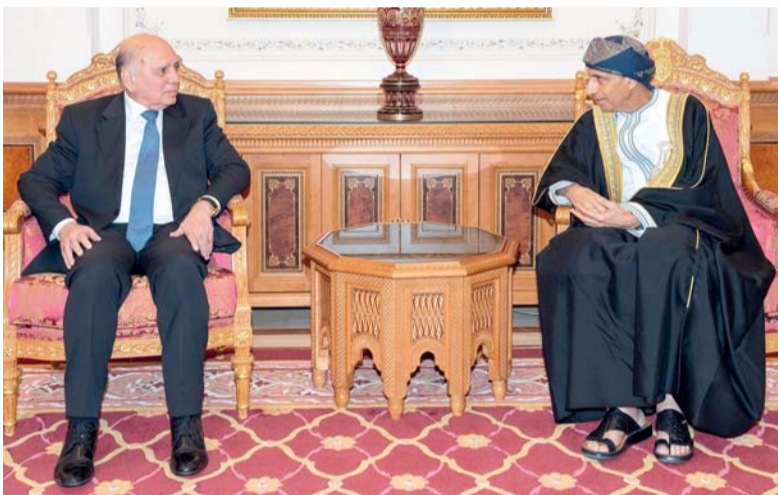
فهد بن محمود لدى استقباله فؤاد حسين

الوطيدة بين البلدين الشقيقين وسبل تطويرها، ومناقشة عدد من الموضوعات ذات الاهتمام المشترك. حضر اللقاء سعادة سفير جمهورية العراق المعتمد لدى سلطنة عمان. كما استقبل معالي الفريق أول سلطان بن محمد النعماني وزير المكتب السلطاني بمكتبه صباح أمس معالي الدكتور فؤاد حسين نائب رئيس مجلس الوزراء وزير الخارجية بجمهورية العراق الشقيقة، تم خلال اللقاء تبادل الأحاديث الودية والموضوعات ذات الاهتمام المشترك، وبحث سبل تعزيز التعاون القائم بين البلدين الشقيقين بما يحقق المصالح المشتركة.