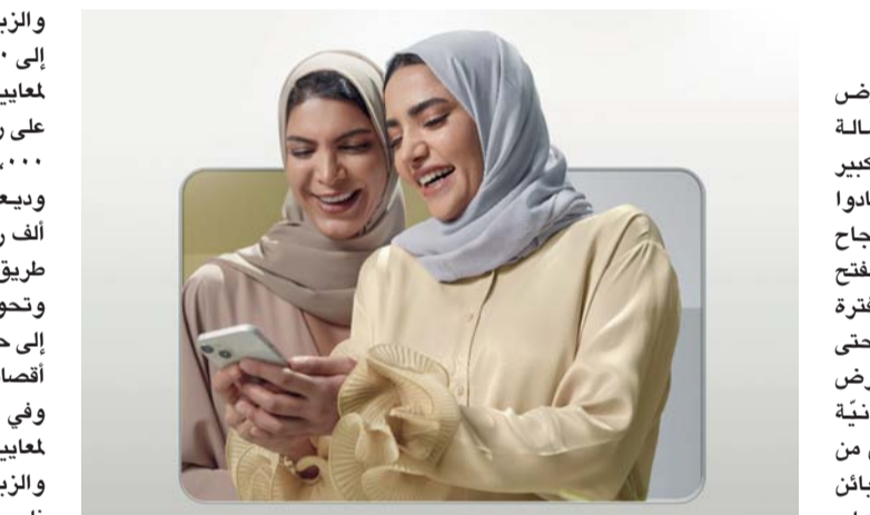
مزايا مُتعددة يُقدّمها برنامج «دعوة زبون»

والزبائن الجدد على جوائز مالية تصل إلى ٥٠ ريالاً عُمانياً عند استيفاء الزبون لمعايير الأهلية التي تشمل الحصول على راتب الجوهر الذي يتراوح بين ١,٠٠٠ - ٣,٤٩٩ ريال عُمانياً أو تحويل وديعة بقيمة ١٠ آلاف إلى ٢٩,٩٩٩ ألف ريال عُمانياً في حساب التوفير عن طريق فتح حساب جديد في بنك مسقط وتحويل الوديعة إلى هذا الحساب أو إلى حساب موجود لدى البنك خلال مدة أقصاها شهر واحد بعد إتمام الدعوة. وفي حالة الدعوات الناجحة المستوفية لمعايير الأهلية، فسيحصل زبون الجوهر والزبون الجديد على ٥٠ ريالاً لكل دعوة ناجحة. وتعتمد المشاركة في برنامج المكافآت لدعوة زبون جديد الخاص بأصالة للأعمال المصرفية المميزة والجوهر للأعمال المصرفية الحصرية من بنك مسقط على الحالات الناجحة مع البنك والتي تتضمن استيفاء الزبون لمعايير الأهلية.