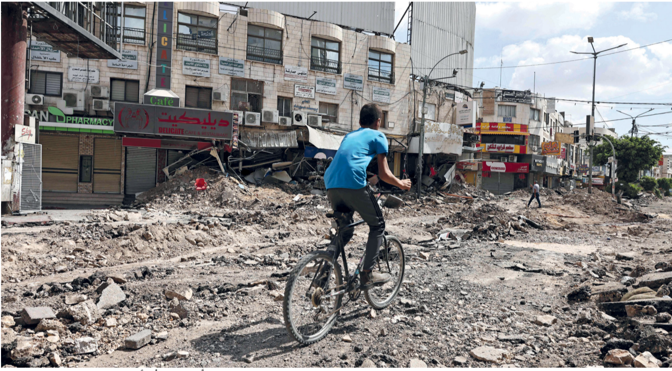
صبي فلسطيني يركب دراجته عبر شارع رئيسي مدمر في وسط جنين بالضفة الغربية المحتلة.