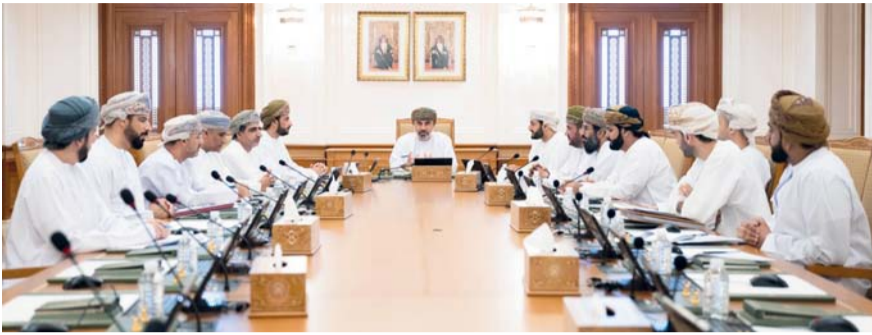
مكتب مجلس الشورى أثناء الاجتماع

باستمرار جهود الوزارة على تطوير استراتيجيات تدريس اللغة الإنجليزية في جميع الصفوف الدراسية وذلك لأهميتها في اكتساب الطلبة المهارات المطلوبة. ومن ضمن الردود الوزارية التي تم النظر فيها خلال اجتماع مكتب المجلس، رد معالي الدكتور وزير العمل على طلب الإحاطة المقدم حول تعمين وظيفة مدير محطة تعبئة الوقود، حيث تضمن الرد جهود الوزارة في حصر المحطات غير الملتزمة بتعيين العمانيين مديراً للمحطة، كما أنه يتم رفض أي طلبات توظيف مخالفة، حيث تم إرفاق كشف بأعداد العمانيين العاملين في الوظيفة. كما تم خلال الاجتماع استعراض تقرير اللجنة الصحية والاجتماعية بشأن خريجي تخصص علوم الصيدلة، والذي تضمن تمهيداً عن أهمية وظيفة الصيدلة وأهم التحديات التوظيفية في السلطنة مشفوعاً بإحصائيات تفصيلية عن عدد الباحثين عن عمل في تخصص الصيدلة، حيث تركزت الاستضافات على تقديم تحليل تفصيلي للتحديات التي تواجه الخريجين في التوظيف الحكومي والخاص، وانتهاء بتوصيات اللجنة في توظيف الخريجين.