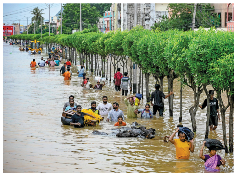
أشخاص يحملون أمتعتهم أثناء عبور شارع غمرته المياه بعد هطول أمطار غزيرة، في مدينة فيجاياوادا الهندية.

طهران. أ ب: لقي ٦ أشخاص من الإيرانيين والهنود حتفهم في غرق باخرة إيرانية قبالة سواحل الكويت، وفق ما أفاد الإعلام الرسمي في الجمهورية الإسلامية. ونقلت وكالة «إرنا» عن المدير العام للسلامة والحماية في هيئة الموانئ والملاحة البحرية ناصر بسنده قوله إن الباخرة الإيرانية «أرابختر ١» تعرّضت لحادثة غرق، في المياه الكويتية، بعد ظهر الأول من سبتمبر. وأشار إلى أن عمليات البحث والإنقاذ بدأت «منذ اللحظات الأولى» بالتعاون بين الهيئات المعنية في البلدين.