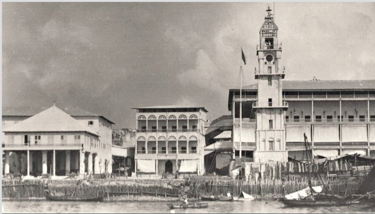
■ بيت الحكم في الوسط قبل القصف البريطاني

لوقوف على ما حدث بعد الحماية الألمانية؛ تابعونا في الجزء القادم.