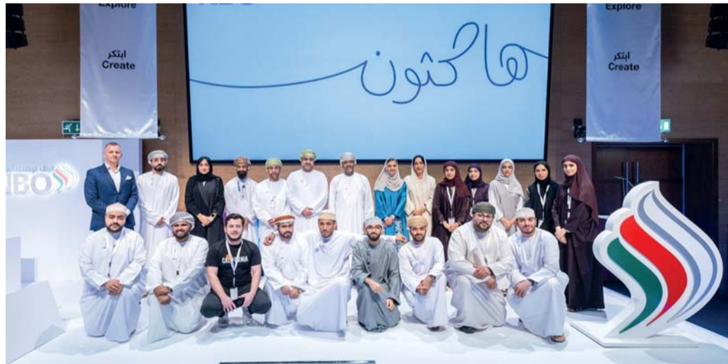
■ صورة جماعية للفائزين مع راعي الاحتفالية والمسؤولين في البنك

مسقط. العمانية: بلغ سعر نפט عمان الرسمي أمس تسليم شهر نوفمبر القادم ٧٦ دولاراً أميركياً و٦٣ سنتاً. وشهد سعر نפט عمان أمس ارتفاعاً بلغ ٢٢ سنتاً مقارنة بسعر أمس الأول الإثنين، البالغ ٧٦ دولاراً أميركياً و٤١ سنتاً. وعلى الصعيد العالمي ارتفعت أسعار النفط معوضة بعض خسائرها في أواخر الأسبوع الماضي مع استمرار توقف صادرات النفط الليبية وانحسار المخاوف من زيادة إنتاج «أوبك بلس» اعتباراً من أكتوبر القادم. وارتفع خام غرب تكساس الوسيط الأميركي ٤٩ سنتاً أو ٠,٧٪ إلى ٧٤,٠٤ دولار. وصعدت العقود الأجلة لخام برنت ٥٩ سنتاً أو ٠,٨٪ لتصل عند التسوية إلى ٧٧,٥٢ دولار للبرميل، وفي جلسة يوم الجمعة، خسرت برنت ١,٤٪ وغرب تكساس الوسيط ٠,٣٪. ومن المقرر أن تزيد ٨ دول أعضاء في «أوبك+» إنتاجها بمقدار ١٨٠ ألف برميل يوميا في أكتوبر المقبل، ضمن خطة للبدء في الإلغاء التدريجي لأحدث شريحة من تخفيضات الإنتاج البالغة ٢,٢ مليون برميل يوميا مع الاستمرار في إجراء تخفيضات أخرى حتى نهاية عام ٢٠٢٥.