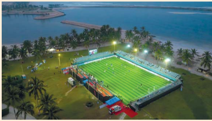
البطولة تشهد مشاركة ثمانية فرق من منطقة الخليج

سوكا ٢٠٢٤، حيث سيتنافسون مع نخبة من الفرق من جميع أنحاء العالم. وشهدت القرعة الأخيرة للبطولة، التي أجريت في ٢٠ أغسطس الماضي في مجمع السلطان قابوس الثقافي والترفيهي، حضور شخصيات بارزة من داخل سلطنة عمان وخارجها.