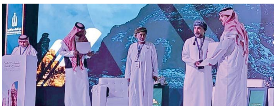
■ مناقشة إحدى عشرة ورقة علمية في ثلاث جلسات حوارية

شراكات إقليمية ودولية بين المراكز المعنية والإعداد لمستهدفات الملتقى الـ٢٤ والذي سوف تستضيفه سلطنة عمان العام القادم. وتضمن الملتقى في جلسته الأولى الاجتماع الخاص بأعضاء اللجنة العمومية، فيما تم مناقشة إحدى عشرة ورقة علمية في ثلاث جلسات حوارية تناولت جوانب عدة في مجال التاريخ الحديث والمعاصر لدول مجلس التعاون وإرثها الثقافي والمعرفي. جدير بالذكر أن الجمعية تأسست