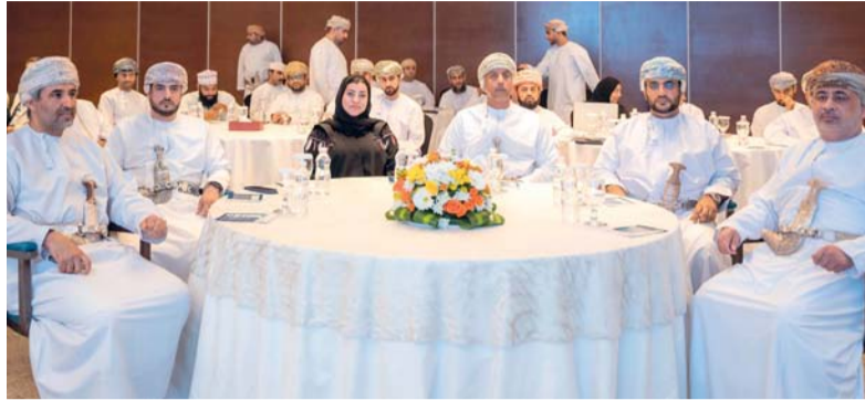
الجلسة تطرقت إلى القوانين والدعم الحكومي المتعلق بالطاقة المتجددة

وقال: إن دعم هذه المؤسسات في تبني حلول الطاقة المتجددة يمثل خطوة جوهرية نحو تحقيق أهداف التنمية المستدامة والحياد الصفري بحلول عام ٢٠٥٠م. واختتمت الحلقة بجلسة عصف ذهني للتحديات التي تواجه المؤسسات الصغيرة والمتوسطة المستخدمة للطاقة المتجددة والمؤسسات العاملة فيها، وتطرقت الجلسة إلى القوانين والتشريعات المتعلقة بالطاقة المتجددة والتسهيلات والدعم الحكومي المقدم، بالإضافة إلى عرض الحلول والمبادرات المقترحة.