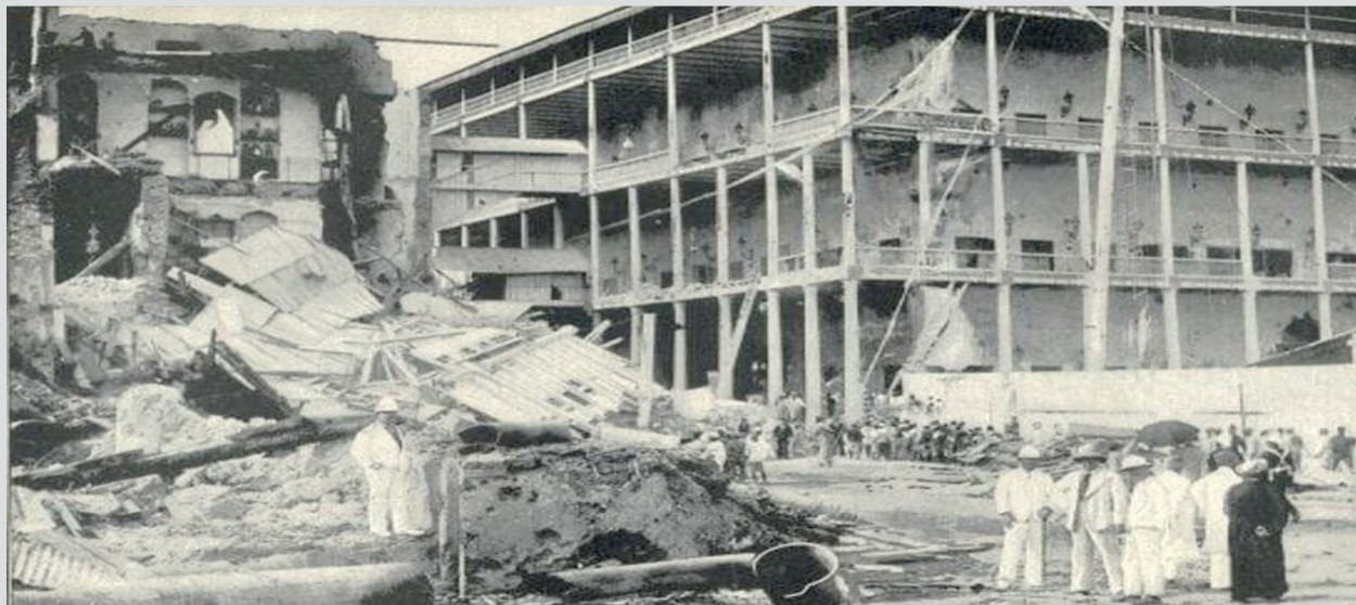
■ بيت الحكم بعد القصف

السلطاني، وأعلن نفسه سلطاناً على زنجبار، وحصل على مبايعة عريضة من العُمانيين، وأمر الفرقاطة السلطانية جلاسجو بأن تضرب