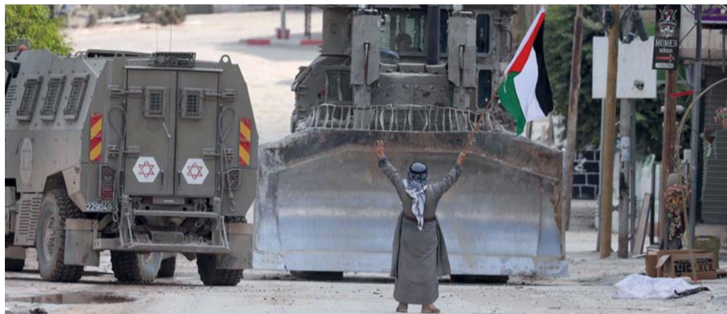
فلسطيني يرفع العلم ويلوح بعلمة النصر بينما تسير مركبات مدرعة وجرافة للاحتلال في أحد الشوارع بطولكرم أمس.