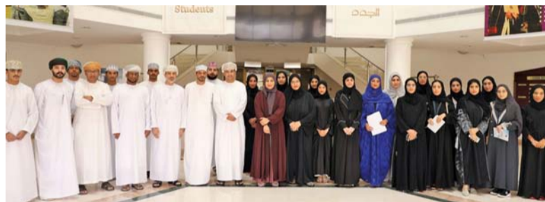
المعسكر يسهم في تعزيز المعرفة واكتساب المهارات للمشاركين

الجماعي، ورشة بعنوان «مقدمة في التكنولوجيا المالية: مستقبل المال والتمويل»، حيث تناول تأثير التكنولوجيا على التمويل وأمثلة لتطبيقات التكنولوجيا المالية.