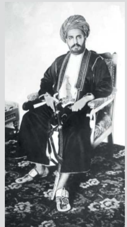
■ السلطان خالد بن برغش

السلطاني، صالح مرياجني القمري بمعاوضة السيد خالد، وبطاعة أوامره. بعد وفاة السلطان حمد