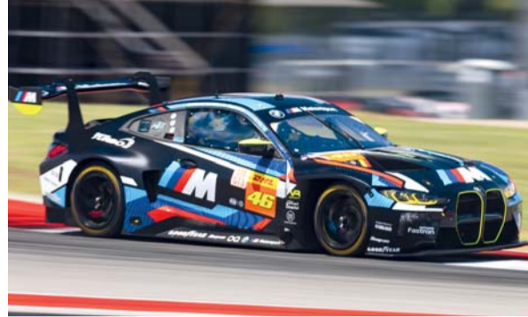
سيارة الحارثي فوق حلبة أوستن بولاية تكساس

الفريق فقد نقاطا ثمينة كانت مراكز المقدمة لكن الحظ عاند الفريق للمرة الثالثة في هذه البطولة.