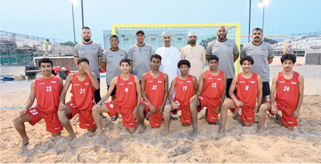
لقطة جماعية لمنتخب ناشئي كرة اليد الشاطئية