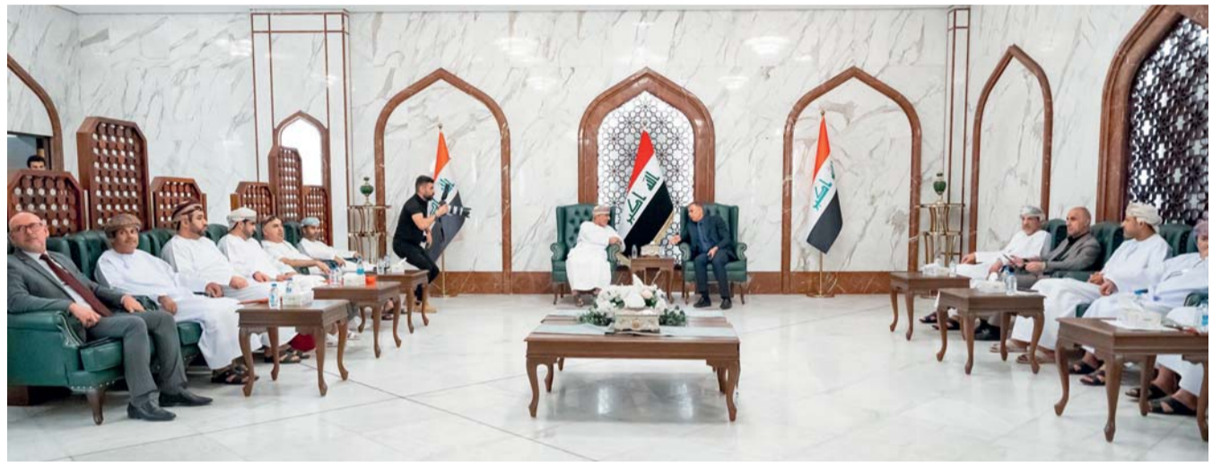
■ خلال استقبال بعثة المنتخب الوطني

قال الشيخ محمود بن مهنا الخروصي سفير سلطنة عمان في العراق أثناء استقباله لبعثة منتخبنا في مطار البصرة : الحمد على سلامة الوصول للبعثة، وقد جرى استقبالهم استقبالا ممتازا رفقة الاخوة العراقيين، بالنسبة للجوانب اللوجستية في الملعب فقد قمنا ظهر أمس بزيارة لاستاد جذع النخلة، واطلعنا على مقاعد الجماهير العمانية وهي في موقع متميز وتم حجز ٣٠٦٦ مقعدا للجماهير العمانية، والدخول سيكون عبر البوابة رقم ١٤ وسيكون توجه الجماهير مباشرة إلى هذه البوابة ، والحمد لله كل الأوضاع مستقرة، أمنيا تم تجهيز عدد من رجال الأمن للتنظيم، نحن اطلعنا على كل الأمور اللوجستية بالنسبة