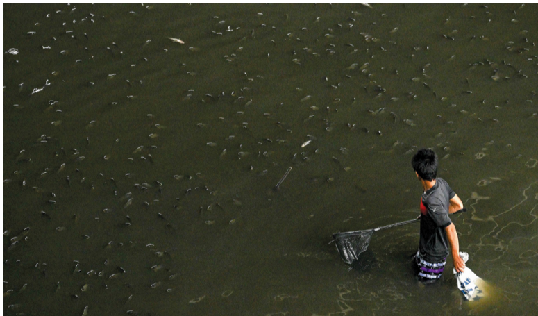
رجل يصطاد سمكة البلطي الأسود في قناة بالعاصمة التايلاندية بانكوك.

ويرقات الحززون. وبالإضافة إلى التأثير البيئي، تبدي الحكومة قلقاً بشأن تأثير هذه الأسماك على مجال تربية الأسماك الحيوية في المملكة. وقالت نائبة رئيس اللجنة البرلمانية التي شكلت لمعالجة انتشار الأسماك ناتاشا بونشينساوات، عبر وكالة الصحافة الفرنسية «بين فبراير و٢٨ أغسطس، تم اصطياد مليون و٣٣٢ ألف كيلوجرام من أسماك البلطي السوداء: ٥٩٠ ألفاً و٨٤٠ كيلوجراماً من مصادر المياه الطبيعية و٧٤٣ ألفاً و٥٥٠ كيلوجراماً من أحواض التربية». وأضافت «تحدثنا إلى السكان وتبين لنا أن انتشار أسماك البلطي ازداد سوءاً، إن عُثر على أعداد منها في قنوات صغيرة، وهو ما لم يكن يُسجل في السابق».