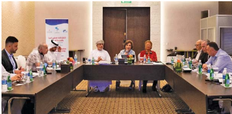
المنتدى يستعرض عددا من التجارب الإعلامية الناجحة