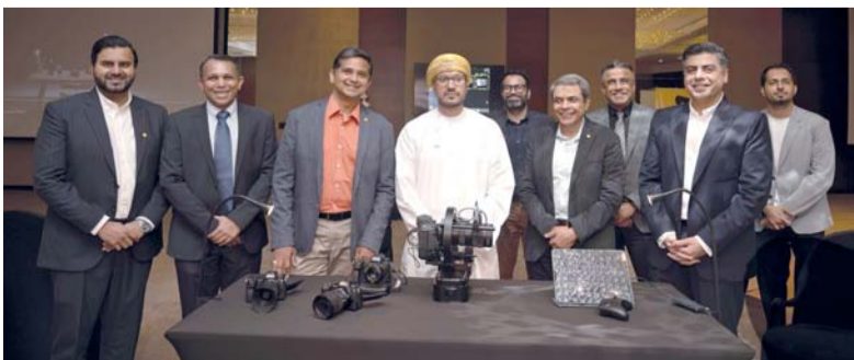
■ المسؤولون في شركتي كيمجي رامداس ونيكون عقب تدشين الكاميرات الجديدة