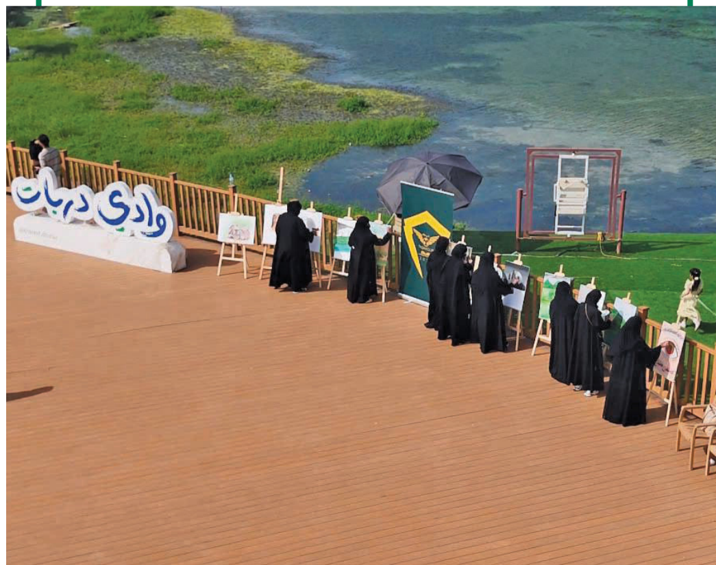
المشاركات أثناء رسم الطبيعة من وادي دربات

نظم نادي طاقة الرياضي فعالية فنية بعنوان «طاقة تلهمنا» تمثلت في ممارسة هواية الرسم في أجواء الطبيعة الخلابة في وادي دربات وبرج العسكر، وذلك بمشاركة مجموعة من الفنانات من ولاية طاقة، حيث استلهمن من جمال الطبيعة إبداع الأعمال الفنية التي تعكس روعة البيئة المحيطة وتفاصيلها. وتأتي هذه الفعالية في إطار جهود النادي