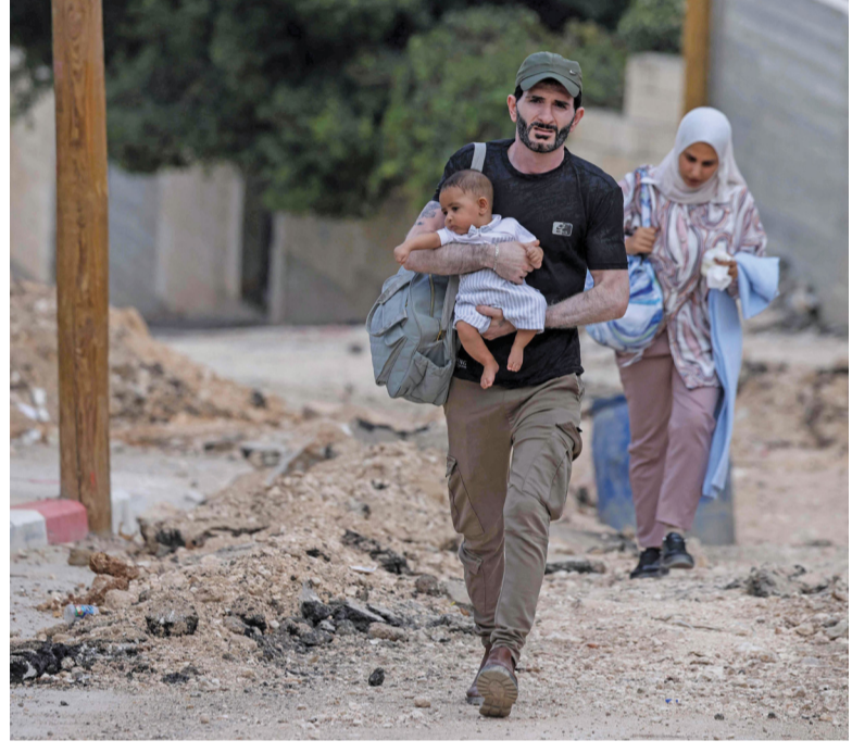
أفراد عائلة فلسطينية يُخلون مخيم جنين للاجئين في الضفة الغربية المحتلة أمس .

مسقط . العمانية: وقعت سلطنة عُمان . ممثلة بوزارة الطاقة والمعادن . أمس بمسقط اتفاقية مع شركة دلبيل للنفط (المشغل) لاستكشاف وتطوير منطقة الامتياز رقم (١٥) بمحافظة الظاهرة البالغ مساحتها (١٣٨٩) كيلومتراً مربعاً . في خطوة استراتيجية نحو تعزيز احتياطات النفط والغاز وزيادة معدلات الإنتاج .