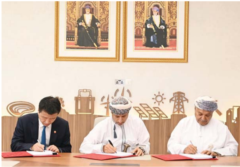
الاتفاقية تتضمن حفر عدة آبار لتقييم الإمكانات الهيدروكربونية في المنطقة