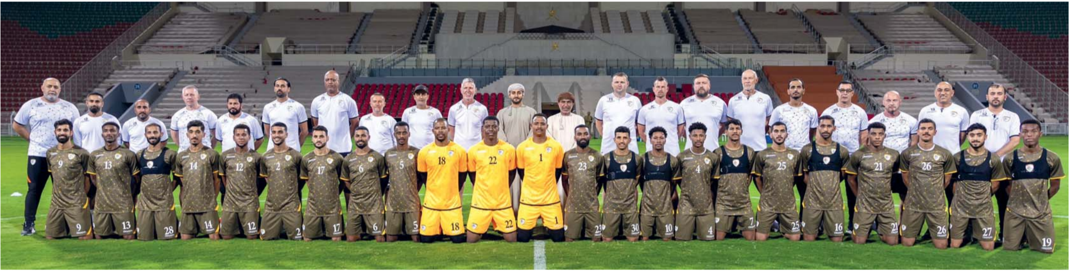
صاحب السمو ذي يزن بن هيثم آل سعيد مع لاعبي منتخبنا وجهازه الفني والإداري

بتوقيت العراق، فيما ستكون العودة عند الساعة الثالثة فجر الجمعة ٦ سبتمبر والوصول إلى مسقط عند الساعة السادسة وخمس وعشرين دقيقة بإذن الله تعالى.