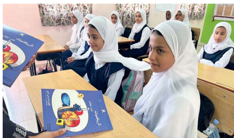
توزيع الكتب الدراسية بإحدى مدارس جنوب الباطنة

إلى مدارسهم البالغ عددها ١٠٥ مدارس بمختلف ولايات المحافظة. وقد استعدت المدارس بشكل مبكر لاستقبال الطلاب في عامهم الدراسي الجديد، سواء كانوا المستجدين أو المنقولين للمراحل الدراسية المختلفة وتبصيرهم بأهمية المحافظة لهذا اليوم بوضع برنامج متكامل لطلابها من خلال تشكيل اللجان المختلفة التي قامت باستقبال الطلاب صباحاً وتوزيعهم على الفصول الدراسية حسب الكثافة المعدة إلى جانب تفعيل برنامج استقبال الطلبة المستجدين للجان المدرسية وحث الطلبة على الجد والمثابرة والمحافظة على الكتاب المدرسي.