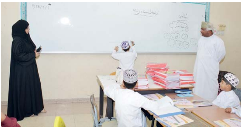
استعدادات من كافة النواحي الفنية والإدارية بجنوب الشرقية

له وانتظم الطلبة بالحضور في يومهم الأول والذي بدأ بطابور الصباح قدم فيه مختلف البرامج والقيت الكلمات التي تحدثت عن أهمية العلم وتبصيرهم بمميزات المدرسة وحرص الحب والانتماء لها والعطاء لخدمة الوطن والمجتمع، وتعزيز زيادة انتفاع الطالب للمدرسة ومدى التزامهم بالقوانين والأنظمة المدرسية والتفكير بها والاهتمام بالذاكرة والتحصي الدراسي، كما توجه المدة إلى جانب تفعيل برنامج استقبال الطلبة المستجدين للجان المدرسية وحث الطلبة على الجد والمثابرة والمحافظة على الكتاب المدرسي.