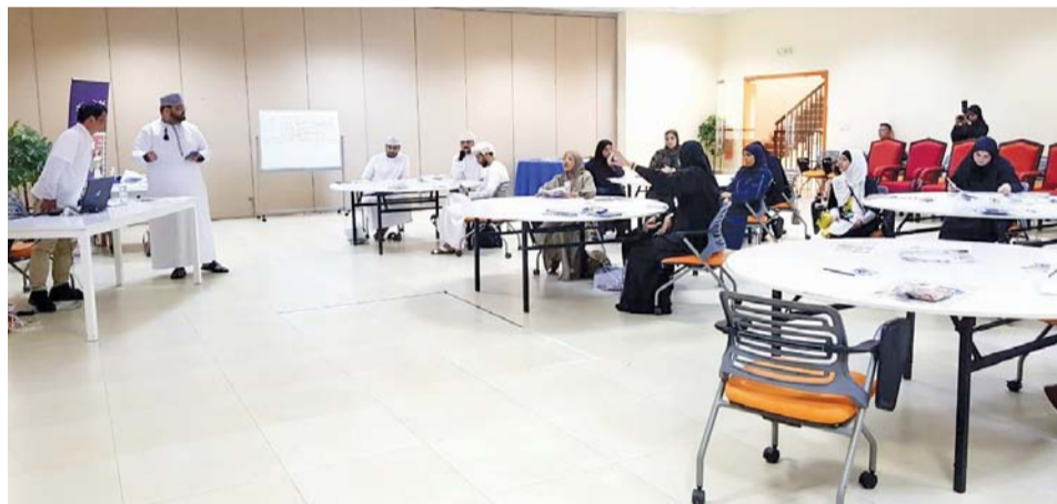
الحلقة تهدف إلى دعم ورعاية المواهب الشابة في مجال القصص المصورة

المصاحبة للملتقى الأدبي والفني للعام ٢٠٢٤م حيث تهتم الفعالية الصابحية والمسائية. تأتي الحلقة ضمن الفعاليات