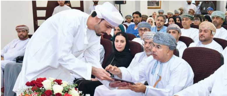
هلال السبتى أثناء تدشين المبادرات

إجراء ١٠٠٠ عملية نزول أبيض في مستشفى النهضة، و ٥٠٠ عملية نزول أبيض أخرى تجرى في مستشفى خولة في مبنى الرعاية النهارية بمعدل ٨ حالات موزعة بين الأوقات الصباحية والمسائية للإسهام في تقليص قوائم الانتظار بنسبة ٥٠٪. تأتي مبادرة تفعيل العيادة المسائية لقسم الأسنان وجراحة الفم والوجه والفكين بمستشفى النهضة خلال ٣ أشهر من ضمن المبادرات التي أطلقتها وزارة الصحة بتفعيل العيادات المسائية، حيث سيعاين أكثر من ٩٠٠ مريض خلال مدة تنفيذ المبادرة لتقليص قوائم الانتظار إلى أسبوعين للحالات الطارئة حداً أقصى وستصل مدة الانتظار إلى أقل من ٦ أسابيع للمواعيد الاعتيادية. وتشمل المبادرات أيضاً مبادرة إتمام علاج الحالات العاجلة من ذوي الاحتياجات الخاصة لعلاج الأسنان تحت التخدير العام خلال ٤ أشهر، حيث تصل قائمة الانتظار الحالية إلى أكثر من ٣٠٠ مريض مما سيساعد من تقليل قوائم انتظار العمليات خلال ٤ أشهر، بحيث يُزاد عدد غرف العمليات لمرضى الأسنان من ذوي الاحتياجات الخاصة تحت التخدير العام خلال أيام الأسبوع.