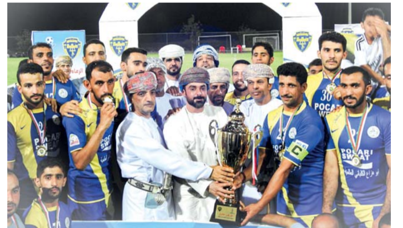
تتويج فريق البليدة بالبطولة