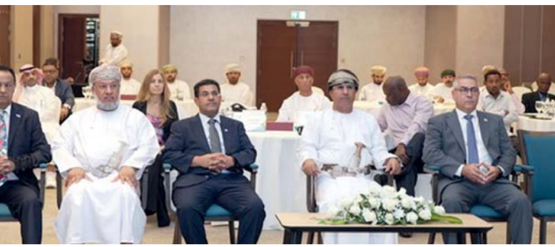
الحلقة تهدف إلى تعزيز الاستجابة المبكرة لتقسي الجراد

جدير بالذكر أن أحكام قانون استثمار رأس المال الأجنبي تسري على كل شخص طبيعي أو اعتباري غير عماني يؤسس مشروعاً استثمارياً في سلطنة عُمان