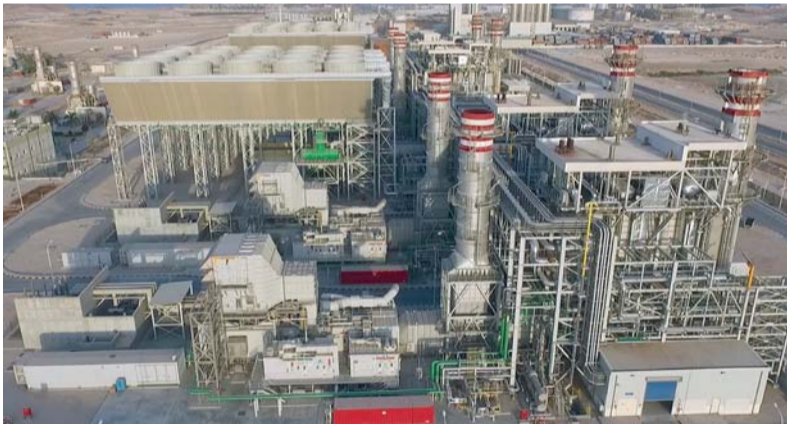
صافي إنتاج سلطنة عُمان من الكهرباء بنهاية يونيو الماضي بلغ ١٩٤٢٤,٥ جيجاوات/ ساعة

من جانب آخر أوضحت الإحصائيات أن إجمالي كمية المياه المنتجة في سلطنة عُمان بلغ بنهاية يونيو الماضي نحو ٢٤٨ مليوناً و٣٦٦ ألفاً و٨٠٠ متر مكعب، مقارنة بـ ٢٥٥ مليوناً و٨٤٨ ألفاً و٧٠٠ متر مكعب بنفس الفترة من عام ٢٠٢٣ م.