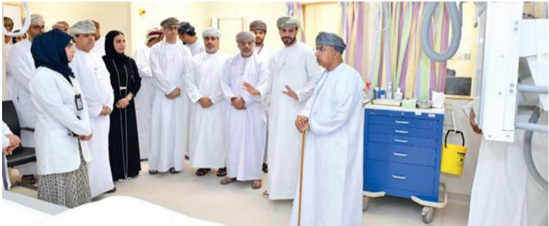
المبادرات تهدف إلى تقليص قوائم الانتظار في المستشفيات