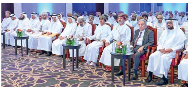
المؤتمر تطرق إلى أحدث التقنيات المستخدمة في تعزيز الحياة الحضرية

الأولوية للاستدامة والحفاظ على البيئة. يُذكر أن مؤتمر المدن الذكية المستدامة يأتي ضمن ملتقى صلالة الهندسي في نسخته الثالثة، ويهدف إلى تبادل الخبرات والمعارف بين المشاركين واستكشاف أحدث الأساليب في تطوير المدن الذكية المستدامة من خلال تسهيل تبادل الأفكار المبتكرة وتعزيز الشراكة بين الجهات الحكومية والأكاديمية المعنية ومؤسسات القطاع الخاص.