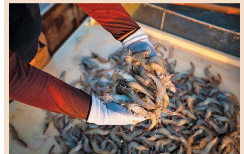
إنتاج سلطنة عُمان من الصيد الحرفي للروبيان في موسم ٢٠٢٣م بلغ ٢٧٦١ طناً

وأشار العريمي إلى أن كمية إنزال الروبيان من الصيد الحرفي لعام ٢٠٢٣م كانت جيدة وذات قيمة اقتصادية ممتازة للصيادين وغيرهم من المنتفعين من قطاع الثروة السمكية، مشيراً إلى أن سعر الكيلو الواحد من