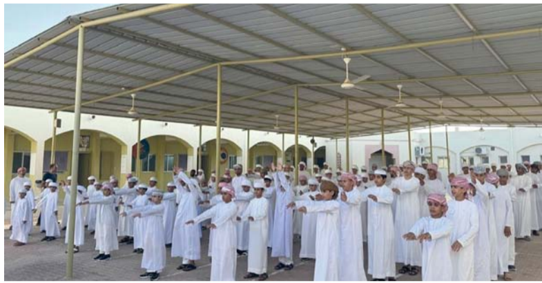
طابور الصباح في مدرسة بمحافظة البريمي