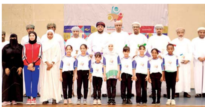
صورة جماعية لرعي المناسبة والمكرمين والمشاركين في حفل الختام

بالمحافظة مشاركة واسعة من الفئات العمرية المستهدفة بلغت ٢٣٠٠ مشاركاً ومشاركة من مختلف ولايات المحافظة، حيث تم تنفيذ العديد من الفعاليات والأنشطة تطلعت في المراكز الرياضية والتي بلغ عددها ١١ مركزاً في رياضات القدم والفروسية والسباحة وكرة الطائرة والكراتيه وغيرها من الرياضات.