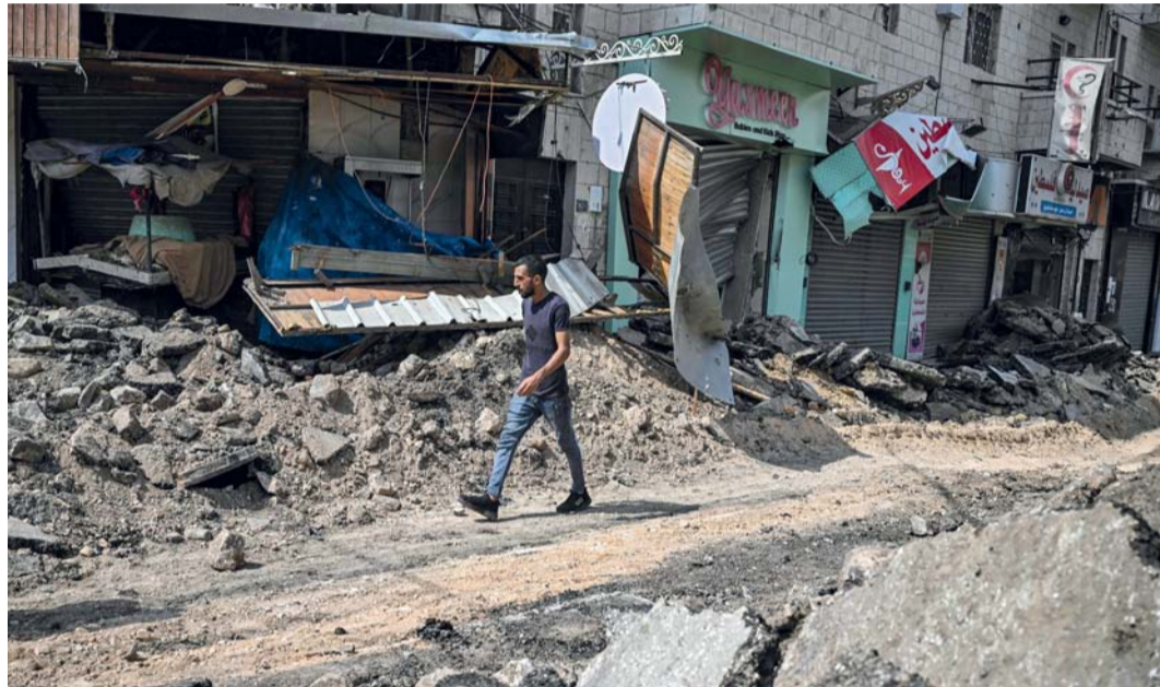
فلسطيني يسير بالقرب من المتاجر المتضررة في شارع مرقته الجرافات خلال غارة إسرائيلية في مدينة جنين بالضفة الغربية المحتلة.