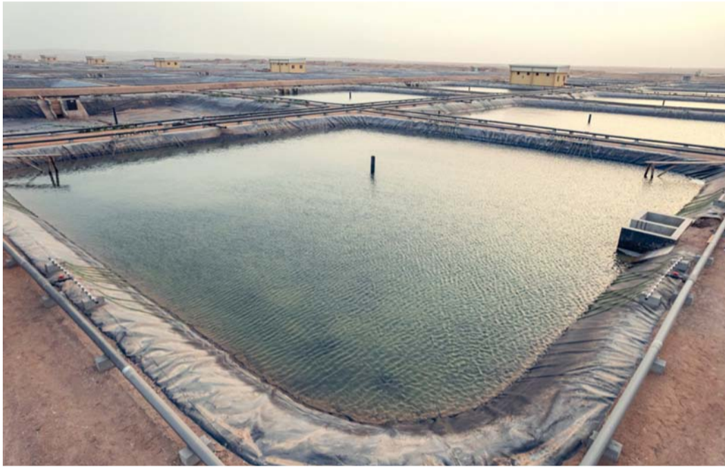
الدمج يساهم في الارتقاء بالأداء وجودة المنتجات وتقليل التكاليف التشغيلية

وأكد البيان الصادرة من جهاز الاستثمار العماني بأنه سيتم تقييم التزامات الشركتين في ضوء المشروعات الجاري تنفيذها، والتعاقدات السارية مع المقاولين؛ لضمان عدم تأثر تلك الالتزامات جراء تنفيذ مشروع الدمج.