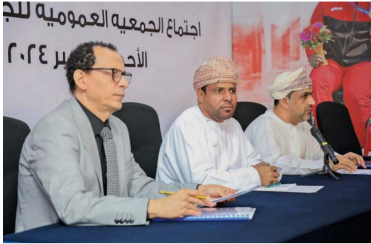
من اجتماع الجمعية العمومية لاتحاد الطائرة

وأشار بأن لجنة الرياضيين ستكون حلقة الوصل بين اللاعبين والاتحاد والعمل على تطوير الكثير من الجوانب لمهام لجنة الرياضيين وجميع أعضاء اللجنة يملكون الخبرة الجيدة في مجال اللعبة، حيث كان الجميع كلاعبين ومدربين في مشوارهم السابق وهذا بدوره يستخدم احتياجات اللعبة وتطويرها.