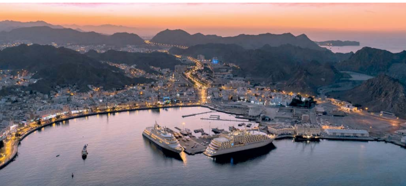
الموسم الشتوي في سلطنة عمان يمنح المسافرين على متن الطيران العماني فرصة استكشاف مناطق الجذب السياحي

الطيران العماني فرصة استكشاف العديد من المناطق ذات الجذب السياحي في مسقط وما حولها وسط اعتدال الجو وانخفاض درجات الحرارة، بالإضافة إلى الاستمتاع بالعديد من الفعاليات التي تعد بتجارب لا تنسى. كما يمكن للمسافرين الذين يحملون تذكرة ذهاب وعودة إلى أي وجهة ضمن شبكة وجهات الطيران العماني مروراً بمسقط الاستفادة من هذا العرض ولفترة محدودة، عبر تعبئة نموذج الطلب عبر الإنترنت خلال سريان فترة العرض التي تنتهي بحلول ٣٠ نوفمبر المقبل. كما يخضع العرض لبعض الشروط والأحكام حيث إن الإقامة المجانية في الفندق تشمل الغرفة فقط وتخضع للتوافر عند الحجز، وينطبق توقف واحد كحد أقصى لكل تذكرة ذهاب وعودة.