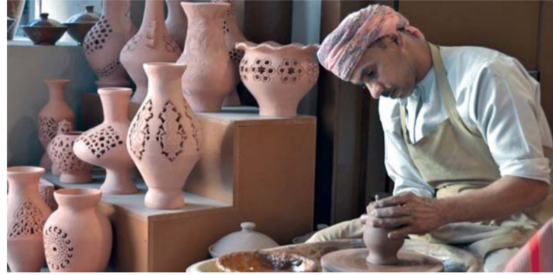
القرار يأتي لتحقيق التوازن بين جلب الاستثمارات النوعية وتشجيع مشروعات رواد الأعمال

ويأتي القرار لإيجاد التوازن بين جلب الاستثمارات النوعية وتشجيع مشروعات رواد الأعمال في ظل الأولوية التي توليها الحكومة لتمكين المؤسسات الصغيرة والمتوسطة التي تعزز الاقتصاد العماني، وحافز للعمالين لتأسيس المشاريع الخاصة بهم وإيجاد فرص عمل جديدة للمواطنين، ويمكن للمستثمر العماني الاستثمار في جميع الأنشطة المحظورة مزاولة الاستثمار الأجنبي فيها، كما يهدف القرار إلى إتاحة الفرصة للمشروعات الصغيرة والمتوسطة المملوكة للعمالين بهذه القطاعات وضمان عدم تأثر المشروعات والأنشطة المتعلقة بالهوية الوطنية