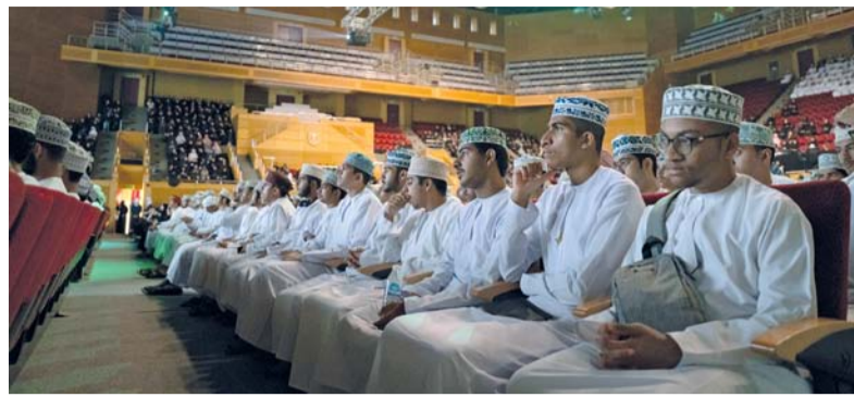
تعريف الطلبة بالجهات والمراكز الموجودة في الحرم الجامعي

اللقاءات المهمة وأوقات وأماكن أداء امتحانات البرنامج التحضيري. وقدم صاحب السمو السيد الدكتور فهد بن الجلندي آل