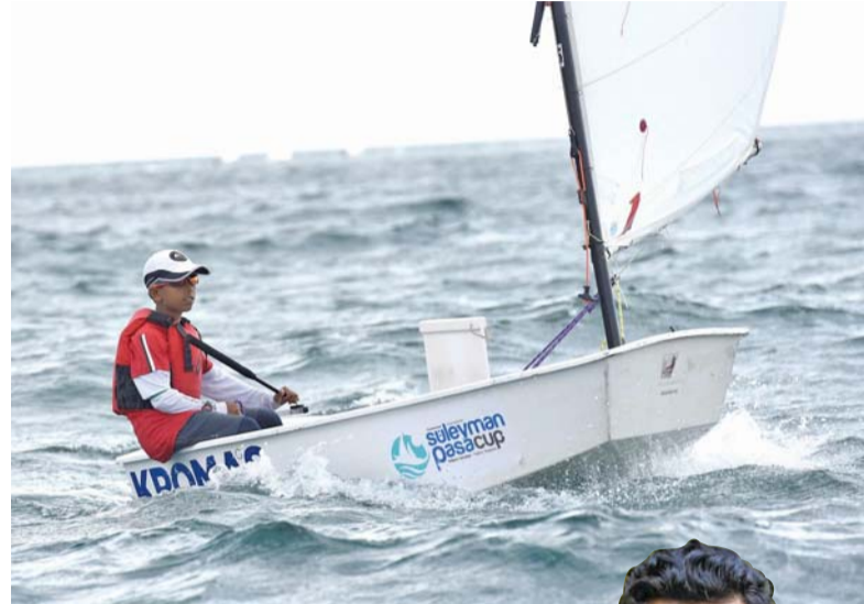
مشاركة كبيرة ستشهدها البطولة