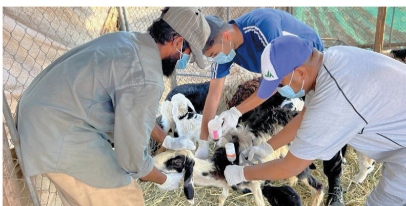
المشروع يسهم في تقليل الأمراض الوبائية والمعدية التي تصيب الحيوانات

رأساً من المعز والضأن والأبقار وبيجمالي جرعات بلغت (٤٦١ ألفاً و ٩٠٨) جرعات مختلفة من اللقاحات التي تم اعتمادها في هذا المشروع تتمثل في تحصين الحيوانات ضد أمراض الطاعون والمجترات الصغيرة والجدي وضد أمراض التسسم المعوي والحُمى القلاعية والسُعار. وأكد الشبلي على أن المشروع الوطني لتحسين الثروة الحيوانية سيسهم في تقديم التوعية والتثقيف الصحي لمربي الثروة الحيوانية وذلك بتعريفهم بالأسس الحديثة في التربية على استخدام التقنيات المتطورة في القطاع الحيواني.