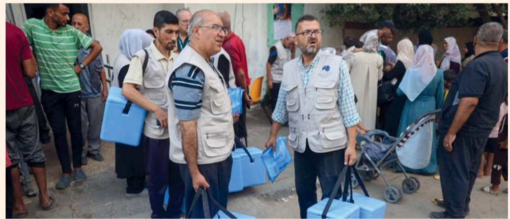
عاملون صحيون يحملون حاويات مملوءة بلقاحات شلل الأطفال خلال حملة تطعيم في الزوايدة بوسط قطاع غزة.

وأعلن عن حملة التطعيم بعد أن سُجّلت الشهر الماضي أول حالة شلل أطفال منذ ربع قرن. وبدأت الحملة رسمياً أمس، وسبق أن تم السبت تطعيم عدد غير محدد من الأطفال