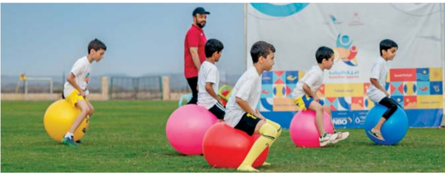
من الأنشطة الرياضية لصيف الرياضة

ممارسة الرياضة لدى مختلف الفئات العمرية من الذكور والإناث، ورفع مستوى الوعي بأهمية ممارسة النشاط البدني والمساهمة في تحسين مؤشرات الصحة واللياقة البدنية العامة لدى المشاركين، كما ساهم في صقل مواهبهم وبناء شخصياتهم ليكونوا أفراداً لهم دور بارز في دفع عجلة التنمية، وخدمة المجتمع المحلي.