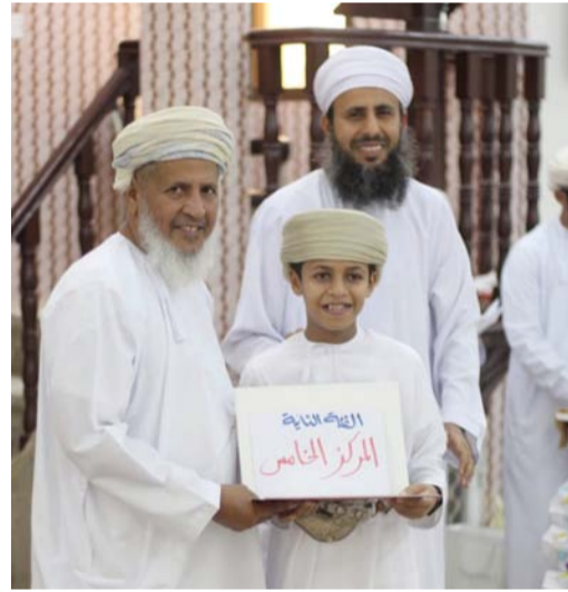
تكريم المجيدين والمشاركين في المصنعة