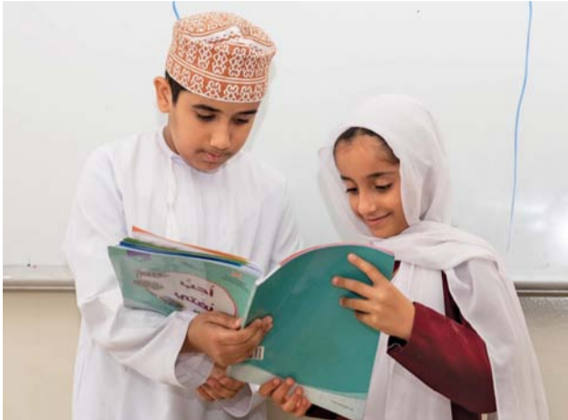
■ تطوير المناهج الدراسية من أولويات وزارة التربية والتعليم

المدارس بالمديرية التعليمية بمحافظات سلطنة عمان لبدء عامهم الدراسي الجديد ٢٠٢٤/٢٠٢٥ م، منهم (٤٠٩١٢٢) طالبا، و(٢٥٥٥٧) طالبة، أما طلبة الصفوف (٤-١) فبلغ عددهم (٣٠٧٧٦٥) طالبا وطالبة منهم: (١٥٥٤٤٩) طالبا و(١٥٢٣١٦) طالبة، في حين وصل عدد طلبة الصفوف (٥-٨) إلى (٢٧٥٩٥٣) طالبا وطالبة، منهم (١٣٨٦٢١) طالبا، و(١٣٧٣٣٢) طالبة، وفي الصفوف (٩-١٢) وصل عدد الطلبة إلى (٢٢٧٦٦١) طالبا وطالبة، منهم: (١١٥٠٥٢) طالبا، و(١١٢٩٠٩) طالبات.