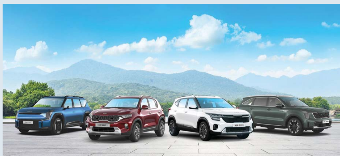
■ أفضل تشكيلة من سيارات كيا بعروض جذابة

تمتيز بكاميرا تحذير عند ركن السيارة. أما كيا سورينتو الجديدة كلياً فتتوفر مع محرك V٦ سعة ٣,٥ لتر مع خيار ٧ و٨ مقاعد، تعد الدفع الرباعي سيارة عائلية مثالية.