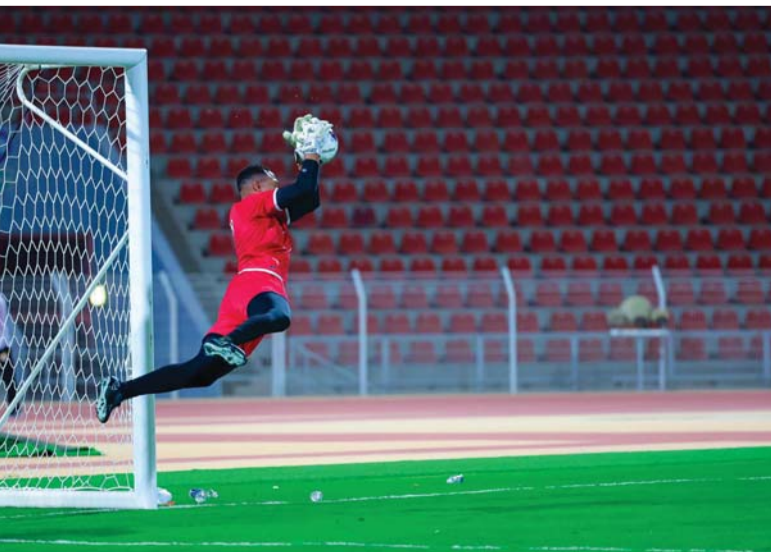
تدريبات مكثفة لحراس المنتخب

من أبرز الأوراق الراحبة في كل محفل رياضي هو التفاعل الجماهيري مع المنتخب، والسعي الحثيث إلى دعمه في مختلف المباريات المحلية والخارجية، وتركزت الجهود على توفير البيئة التشجيعية المناسبة والإيجابية من خلال توفير الأدوات المختلفة مثل القمصان والأعلام وأدوات التشجيع للجماهير والرابطة، والحرص مع الشركاء على تسهيل عملية الوصول إلى بوابات المجمع والاستاد والدرجات وتيسير الحصول على المشروبات والأغذية، بالإضافة إلى العمل على مجموعة من الأهازيج العمانية بالتعاون مع جماهير المنتخب الوطني، كما تعمل الحملة على إيجاد فعاليات مصاحبة تقام على هامش المباريات المقبلة، تهدف هذه الفعاليات إلى تعزيز تجربة المشجعين وضمان تقديم أجواء احتفالية مميزة للعائلات والجماهير، إضافة إلى توفير شاشات خارجية ومتطوعين للمساهمة في عمليات التنظيم.