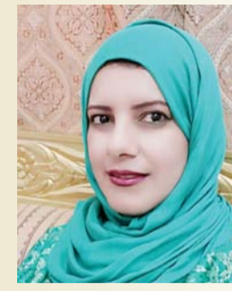
■ بدرية البدرية

تقيم اليوم سفارة اليابان بالتعاون مع وزارة الثقافة والرياضة والشباب حلقة فن القصص المصورة الياباني (المانجا) وتستمر الفعالية لمدة ٤ ايام، وذلك بمركز الشباب في ولاية صور بمحافظة الشرقية، يقدم الحلقة ٣ مدربين من اليابان متخصصين في مجال رسم القصص المصورة لفن المانجا. وتهتم الفعالية بمنح المشاركين فرصة لاستلهام أعمالهم من معالم وتاريخ صور العريق المرتبط بالبحر والسفن وسوف تنطلق الفعاليات يوميا لمدة اربعة ايام خلال الفترتين الصباحية والمسائية، حيث تبدأ الفترة الصباحية في التاسعة وتستمر حتى الثانية عشرة والنصف، أما الفترة المسائية فانها تنطلق من الثالثة والنصف وتستمر حتى الخامسة والنصف، وتستهدف الفعالية الفئة من عمر ١٨ سنة فما فوق . وتهدف الحلقة إلى دعم ورعاية المواهب