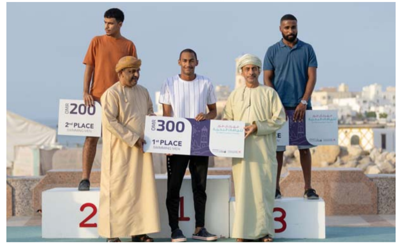
تكريم الفائزين بمسابقة السباحة لفئة الكبار

اختتمت بولاية صور فعاليات «مهرجان صور للرياضات البحرية» الذي نظّمته وزارة التراث والسياحة و مكتب محافظ جنوب الشرقية بالتعاون مع عدد من الجهات الحكومية والخاصة، ضمن البرنامج التنفيذي لصور عاصمة السياحة العربية ٢٠٢٤ والذي أقيم خلال الفترة من ١٨ وحتى ٢٨ أغسطس ٢٠٢٤، بشاطئ