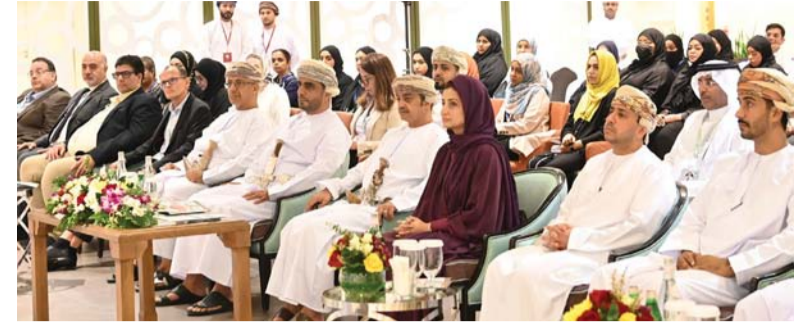
أثناء بدء أعمال المؤتمر

المرورية عبر مختلف وسائل الإعلام ومنصات التواصل الاجتماعي، والوجود الشرطي على الطرق والقرب من المدارس، من أجل ضمان توجيه حركة المرور بشكل فعال ومنع الازدحامات والاختناقات المرورية، وتقديم الدعم والمساعدة لمستخدمي الطرق. وأشار العميد مهندس مدير عام المرور إلى ضرورة الالتزام بالقوانين والتقييد