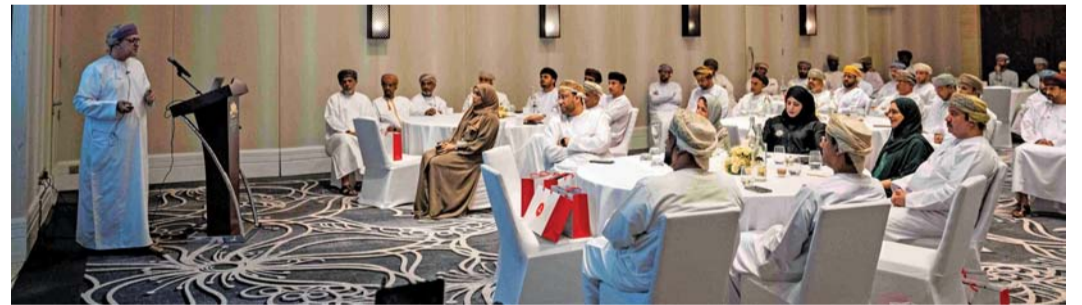
بنك مسقط يعرف الزبائن بمختلف التطورات في قطاع الأعمال