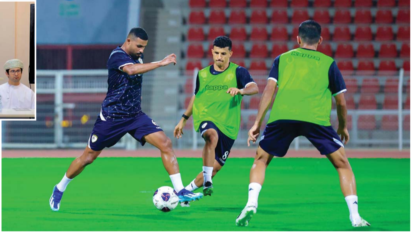
معنويات عالية للاعبينا في الحصة التدريبية