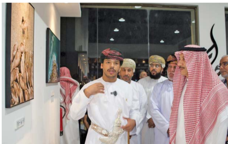
■ جانب من حفل الافتتاح

هذا الحدث يمثل له مرحلة جديدة في مسيرته الفنية، مضيفاً أن المعرض يجسد رحلة شخصية ومهنية تهدف إلى تحفيز الشباب على متابعة أحلامهم وتحقيقها. يُذكر أن معرض حلم يتضمن عددا من الحلقات الفنية التي تهدف إلى تبادل الخبرات وتعزيز المهارات الفنية لدى المشاركين. ويحتوي المعرض على مجموعة متنوعة من الصور الفوتوغرافية التي تتحدث عن سلطنة عمان وتتنوع بين صور الطبيعة حياة الإنسان، الأزياء العمانية، والعادات والتقاليد، مما يعكس جمال وتفرد الثقافة العمانية و هذه الأعمال الفوتوغرافية تقدم لمحة عن التراث العماني الأصيل وتمزج بين الماضي والحاضر بأسلوب فني يعكس مهارة المصور وإبداعه.