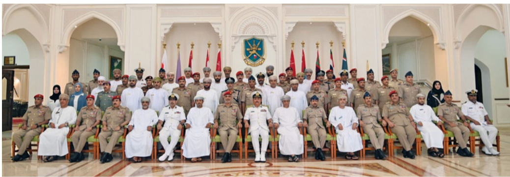
افتتاح نؤرة الدفاع الوطني

فتح باب تسجيل الطلبة المتأخرين عن التسجيل بالصف الأول للعام الدراسي 2024/2025م