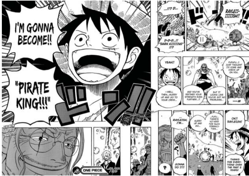
■ فن القصص المصورة

الشابة في مجال رسم القصص المصورة وتعلم التقنيات الأساسية للرسم والتصميم لفن المانجا من مصورها وانشاء قصص مصورة مستلهمة من البيئة العمرانية لمدينة صور . تتكون الفعالية من عدد من المحاور منها التعرف على الأساليب والتقنيات المستخدمة في فن رسم الاشكال والشخصيات، بدءا من رسم الخطوط البسيطة الي الصورة المكتملة، وسبل تصميم الشخصيات وأساليب التلوين وابتكار صورة مذهلة، للوصول في نهاية المطاف الى ابتكار شخصياتهم الخاصة.