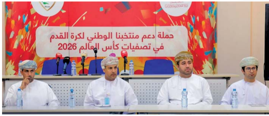
من المؤتمر الصحفي