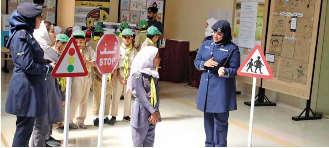
برامج توعية للطلبة في مجال السلامة المرورية