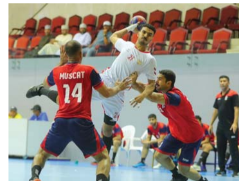
الموسم الجديد يشمل ثمانين مسابقة متنوعة

المولد ٢٠٠٦/٢٠٠٧ والانطلاقة يوم ٢٧ سبتمبر المقبل، أما دوري الدرجة الأولى الذي يشارك فيه ٨ أندية وهي نادي عمان البطل ومسقط الوصيف والسبب ونزوى وصلالة وأهلي سداب ومجيس والشباب فسينطلق يوم ٢٥ أكتوبر القادم والمسابقة الرابعة دوري الدرجة الثانية.