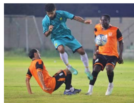
من لقاء الخابورة ومسقط

سواء في الدوري بعد فوزين أمام الشباب و صور و ٦ نقاط وضعته في المركز الرابع بنهاية الجولة الثالثة مع مباراة مؤجلة، وكذلك اللقاء الودي أمام مسقط، أما المدرب الوطني ناصر الحجري فقال إن التجارب الودية ساعدت على تجانس لاعبيه وفرصة مناسبة للتخضير الجدد قبل الدخول في منافسات دوري الدرجة الأولى والمباراة الافتتاحية لفرقة أمام أهلي سداب في السابع عشر من سبتمبر القادم.