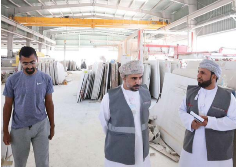
محافظة الظاهرة مؤهلة لاستقطاب العديد من المشاريع الاقتصادية والاستثمارية المحلية والأجنبية

رؤية مستقبلية طموحة تهدف إلى تطوير مشروع متعدد الاستخدامات ويعزز هوية مدينة عبري كوجهة تجارية وترفيهية محلياً وإقليمياً، موضحاً أن المساحة الإجمالية للمشروع تبلغ ٢ مليون متر مربع بقيمة استثمارية قدرها ١٨٣ مليون ريال عماني ومن المتوقع أن يتم البدء في تنفيذ المرحلة الأولى من المشروع خلال العامين المقبلين. أملاً أن يوفر هذا المشروع فرصاً وظيفية مباشرة وغير مباشرة وفرص أعمال للمؤسسات الصغيرة والمتوسطة وتنشيط قطاعات مختلفة كتجارة التجزئة والبناء والصيانة والخدمات والضيافة والمطاعم، حيث يتكون المشروع من ٣ فنادق ومركز تسوق ومناطق سكنية للتطوير العقاري والتجاري وأماكن ترفيهية ومنتجعات ومنتزهات ومركز للشباب.