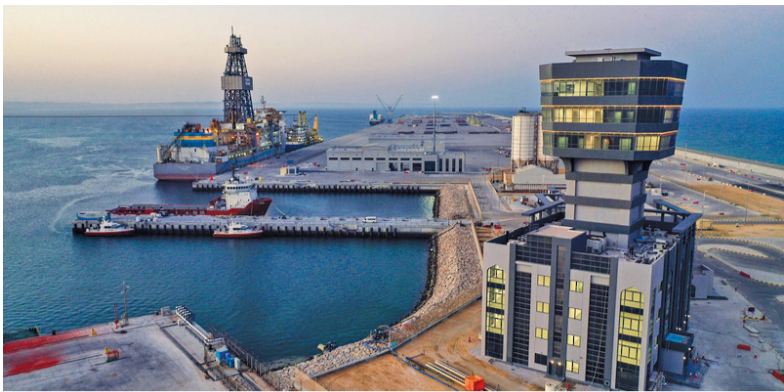
■ محافظة الوسطى مؤهلة لتكون معبراً تجارياً بحرياً للبضائع الدولية ومركزاً لوجستياً لصناعة وصيانة السفن التجارية