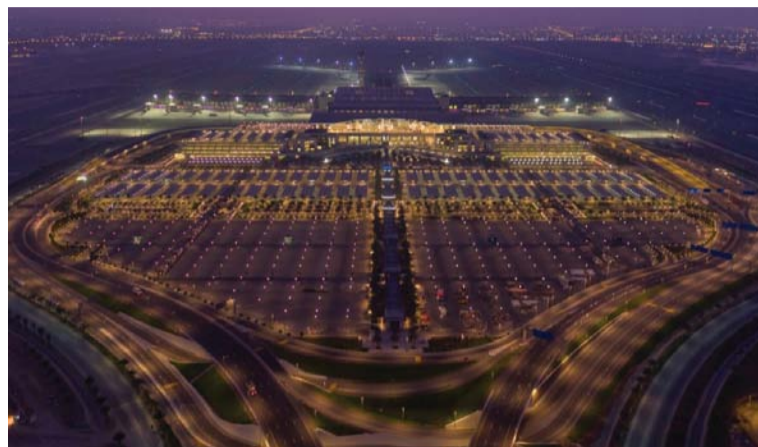
■ الوكالة أكدت أن سلطنة عمان تمكنت من خفض الدين العام إلى نحو ٣٦,٥ بالمائة من الناتج المحلي الإجمالي بنهاية عام ٢٠٢٣

■ بلغ عدد زوار خريف ظفار منذ بداية الموسم وحتى ١٥ أغسطس الماضي نحو ٨١٦ ألفاً و٨١ زائراً بارتفاع نسبته ١٠,٣ بالمائة مقارنة مع الفترة نفسها من عام ٢٠٢٣، حيث بلغ العدد ٧٣٩ ألفاً و٨٨٤ زائراً، وفق ما جاء في التقديرات الأولية لأعداد زوار خريف ظفار ٢٠٢٤ الصادرة عن المركز الوطني للإحصاء والمعلومات.