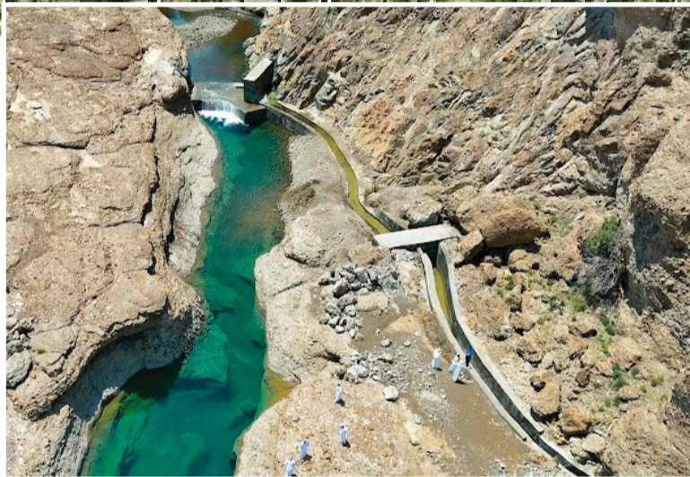
فلج واسط من أبرز الأفلاج التي يتم بها ري المزروعات في القرية