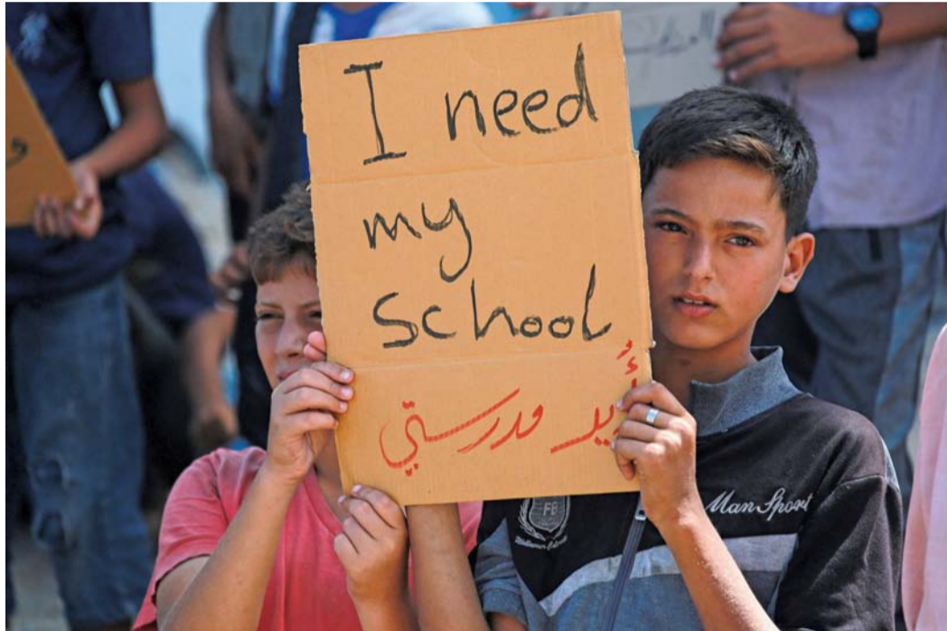
فلسطينيون يحملون لافتات خلال احتجاج يطالب بإنهاء العدوان والعودة إلى المدرسة قبل العام الدراسي الجديد، بجوار مبنى مدرسة متضرر في خان يونس جنوب قطاع غزة أمس.

وقالت في بيان إن «المرشحين أديبا بشكل علني استعدادهما لخوض المناظرة بميكروفونات مفتوحة طوال مدتها للسماح بتبادل (آراء) موضوعي بين المرشحين، لكن يبدو أن دونالد ترامب يسبح لمن يديرونه بأن يناقضوه». وأضافت «هذا محزن».