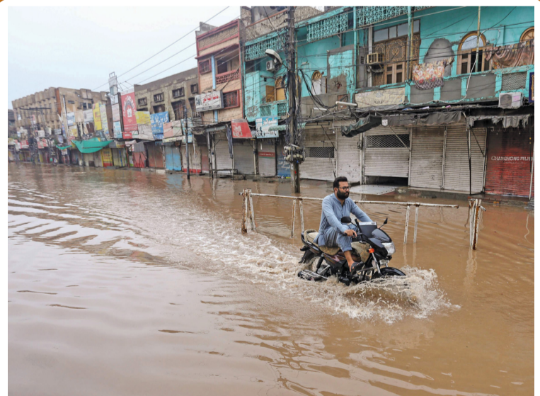
سائق يقود دراجته النارية عبر مياه الفيضانات التي غمرت أحد الشوارع بمنطقة ملتان بباكستان بعد هطول أمطار موسمية غزيرة.

جنيف . عواصم . وكالات: أكدت ناطقة باسم منظمة الصحة العالمية أن قطرات الرذاذ هي طريقة «ثانوية» لانتقال مرض جدري القردة، مشددة على ضرورة إجراء أبحاث إضافية لفهم كيف تحدث عدوى هذا الفيروس بشكل أفضل. ينتشر جدري القردة من شخص إلى آخر عبر «اتصال جسدي وثيق» بحسب منظمة الصحة العالمية. وأعلنت الناطقة باسم منظمة الصحة مارجريت هاريس خلال مؤتمر صحفي دوري في جنيف «إذا كنت تتحدث إلى شخص ما من قرب وإذا كنت تتنفس باتجاهه وإذا كنت قريباً منه جسدياً، هناك احتمال أن تنتقل قطرات الرذاذ إلى الشخص الآخر، إذا كانت لديك تقرحات».