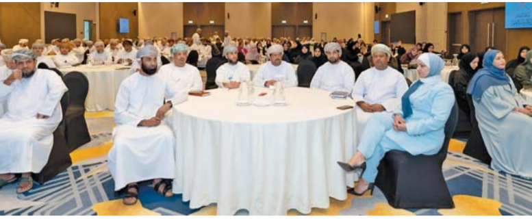
■ اللقاء يهدف إلى تطوير قدرات المشرفين الأوائل