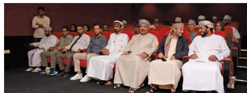
■ عرض ٩ أعمال قصيرة تنوعت بين الروائية والوثائقية

عرض مجموعة من الأفلام السينمائية لمخرجين يملكون التجربة والخبرة، بالإضافة إلى جلسة نقاشية يتعرف من خلالها الحضور على تجربة المخرجين السينمائيين. وأضاف العامري أن الليالي تتضمن مشاهدة أعمال سينمائية متنوعة لمخرجين متعددين، تهدف إلى نشر الثقافة السينمائية في سلطنة عُمان، والمساهمة في تكوين جمهور يملك الوعي السينمائي. ■