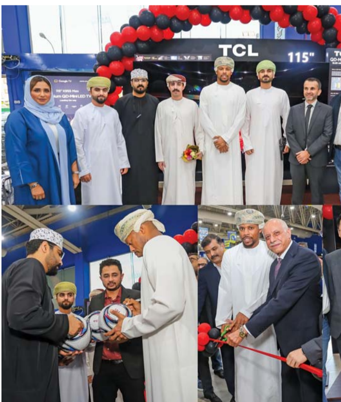
الحضور تعرفوا عن قرب على أكبر تلفاز QD-Mini LED بحجم ١١٥ بوصة

كشفت مؤخرا TCL العلامة التجارية العالمية الثانية في مجال التلفزيونات والأولى في فئة التلفزيونات بحجم ٩٨ بوصة، عن أكبر تلفاز QD-Mini LED بحجم ١١٥ بوصة من طراز X955 MAX في سلطنة عمان. أقيمت فعالية الإطلاق في متجر إكتسرا عمان في مسقط، معلنة عن خطوة هامة في توسع TCL داخل المنطقة. بحضور مسؤولين من شركة جينتكو، الموزع الحصري لـ TCL في سلطنة عمان، وممثلين عن العلامة التجارية TCL. وفايز الرشيد حارس المنتخب الوطني العماني لكرة القدم وسفير العلامة التجارية جينتكو، الذي قام بافتتاح الحدث. ويمتاز تلفاز TCL بحجمه الكبير والذي يصل إلى ١١٥ بوصة وبمواصفات إستثنائية X955 Max QD-Mini LED بسطوع يصل إلى ٥٠٠٠ نيت، وأكثر من ٢٠,٠٠٠ منطقة إضاءة داخلية، وتقنية QLED Pro، ومعدل تحديث ١٤٤ هرتز، ونظام صوت Hi-Fi من ONKYO ٢,٢,٦، تجمع هذه الميزات المتطورة لتوفير تجربة سينمائية لا مثيل لها بجودة عالية جداً للصوت والصورة.