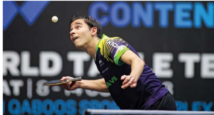
نهائي فردي رجال بطولة العالم للتنس مسقط ٢٠٢٣ (صورة إرشيفية)

العالمية والاتحاد الدولي لكرة الطاولة، وستقام المنافسات من خلال برنامج يومي مستمر، يبدأ في تمام التاسعة والنصف صباحا ويستمر لغاية الثامنة والنصف مساء، حيث يتنافس اللاعبون من الجنسين على عدد من فئات البطولة المختلفة، وسيتم تطبيق قوانين الاتحاد الدولي لكرة الطاولة في هذه البطولة، وستتطلق البطولة بأقامة الأتوار التمهيدية فردي الرجال وفردي السيدات.