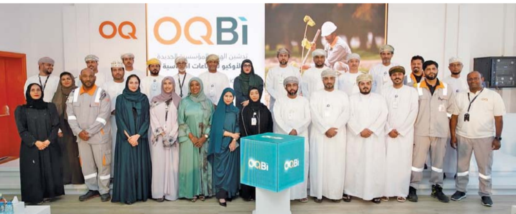
الهوية الجديدة لـ «أوكيو صلالة»، تعكس التوجه الاقتصادي والتزامها بالتنوع لتعظيم العوائد

صناعات، مثل: المخصبات، والسماذ الصناعي، وسماذ البوريا، ومنتجات التنظيف والمبردات. أما مصنع الميثانول، فقدرته التشغيلية تصل إلى ٣٠٠٠ طن متري يوميا. وتستخدم منتجات الميثانول في مجموعة متنوعة من التطبيقات الصناعية؛ حيث يدخل الميثانول في صناعات متعددة مثل: صناعة البلاستيك والألياف الاصطناعية، كما يستخدم في صناعة الأدوات الطبية والكيميائية. ويعد مصنع الغاز البترولي المسال من أهم مشروعات تحويل الطاقة في سلطنة عُمان؛ حيث يسهم في تعزيز سلسلة القيمة المضافة للغاز. وتصل قدرته التشغيلية إلى ١٠٠٠ طن يوميا، وينتج البروبان والبيوتان والمكثفات، ويتم الاستفادة من منتج الغاز البترولي المسال محليا لتغذية محافظتي ظفار والوسطى بغاز الطبخ؛ ما يعزز القيمة المضافة. ويصدر ما نسبته ٩٠٪ من الإنتاج إلى الخارج.