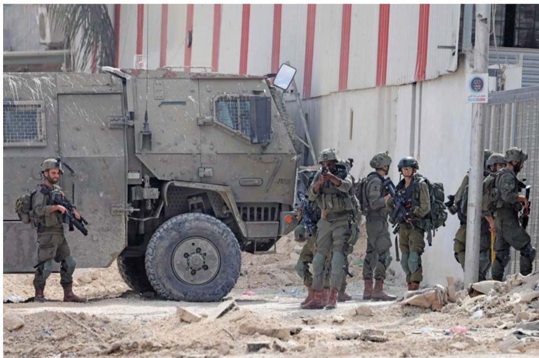
جنود الاحتلال يدهمون مخيم نور شمس للاجئين الفلسطينيين بالقرب من مدينة طولكرم في الضفة الغربية المحتلة أمس.