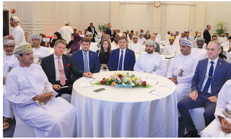
المنتدى أكد على التعاون الثنائي خاصة في مجالات الإنتاج الصناعي والزراعة وتقنية المعلومات