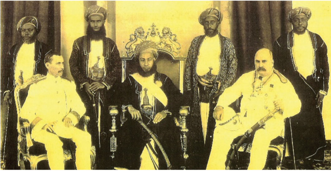
السُلطان حمد بن توييني بن سعيد (١٨٩٣ - ١٨٩٦ م)