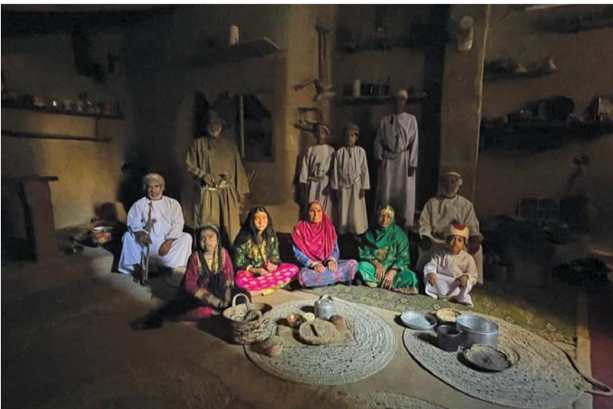
براعة العمانيين في التخطيط العمراني