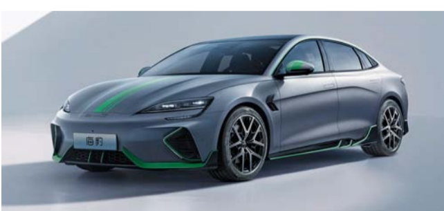
■ بي واي دي تخطط على تقديم المزيد من المركبات الصديقة للبيئة

وسرعة صفر-١٠٠ كم/س في ٣,٩ ثانية، ومدى ٥٢١ كم (بناءً على ظروف الاختبار القياسية)، وتتميز بميزات مثل قفحة سقف بانورامية، وكاميرا بزوايا ٣٦٠ درجة، وتنجيد جلدي فاخر مع تهوية للمقاعد وسخان ونظام كبح أي في حالات الطوارئ. إضافة أخرى إلى تشكيلة سيارات الدفع الرباعي، أظهرت سيارة الدفع الرباعي الهايبرد الكهربائية سونج بلس تنوعاً من خلال مزيجها من محرك بنزين بقوة ١٢٨ حصاناً ومحرك كهربائي بقوة ٢٠١ حصان، مما يعد بدمى مشترك يصل إلى ١٠٠٠ كم مع ميزات عديدة. كما تم تجهيز سيارة تشين بلس بأحدث نظام ثنائي الوضع من شركة بي واي دي، وذلك باستخدام قوة المحرك الهايبرد، يوفر مزيجاً من محرك بنزين بقوة ١٠٨ حصاناً ومحرك كهربائي بقوة ١٩٤ حصاناً ويصل إلى تسارع من صفر إلى ١٠٠ كم / ساعة في ٧,٣ ثانية وغيرها الكثير.