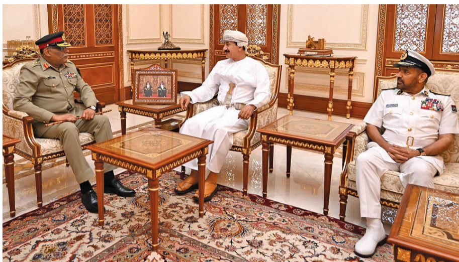
سلطان العُماني أثناء استقباله ساهر شمشاد ميرزا

مقر الكلية اللواء الركن بحري علي بن عبدالله الشديدي أمر كلية الدفاع الوطني. واستمع الفريق أول رئيس هيئة الأركان المشتركة بجمهورية باكستان الإسلامية والوفد المرافق له إلى إيجاز عن كلية الدفاع الوطني ورؤيتها وما تقدمه من برامج إستراتيجية تُعنى بإعداد كفاءات وطنية إلى المستوى الاستراتيجي، إلى جانب التطرق إلى المهام والواجبات المنوطة بالكلية وبما يتناسب والأهداف الوطنية.