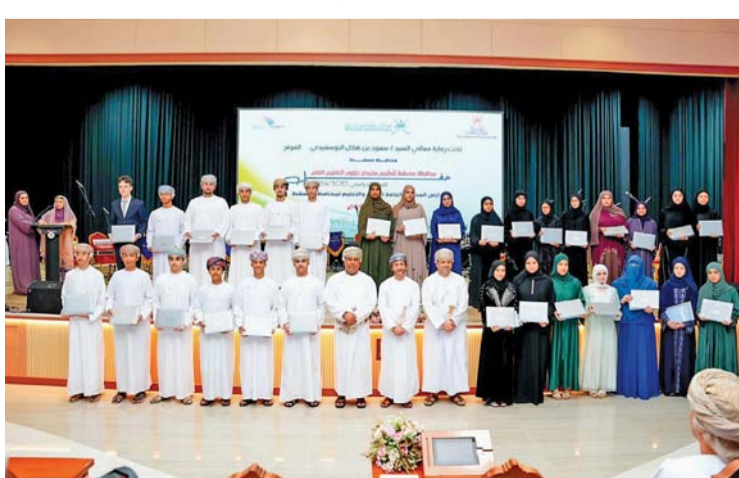
التكريم يأتي في إطار دعم وتشجيع الطلبة المجيدين

استهل الحفل بكلمة ألقاها الطلبة المكرّمون، أعربوا فيها عن شكرهم وتقديرهم لهذه اللقطة الكريمة، معتبرين أن هذا التكريم يشكّل حافزاً لمواصلة تحقيق الإنجازات، وقد تضمن الحفل عرضاً مرئياً بعنوان: (همم نحو القمم)، استعرض أهم