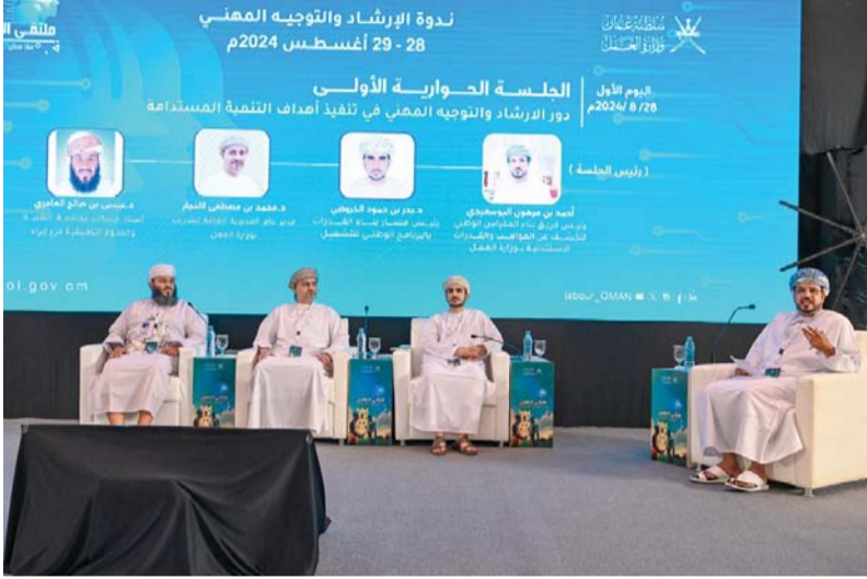
الجلسة استعرضت آلية تطوير منظومة الإرشاد والتوجيه المهني وفق المعايير المهنية