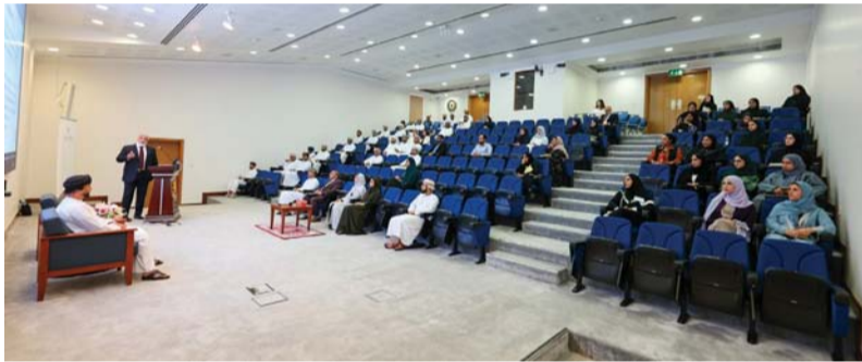
■ المحاضرة تطرقت إلى أسباب قيام الشركات بالإكتتاب الأولي