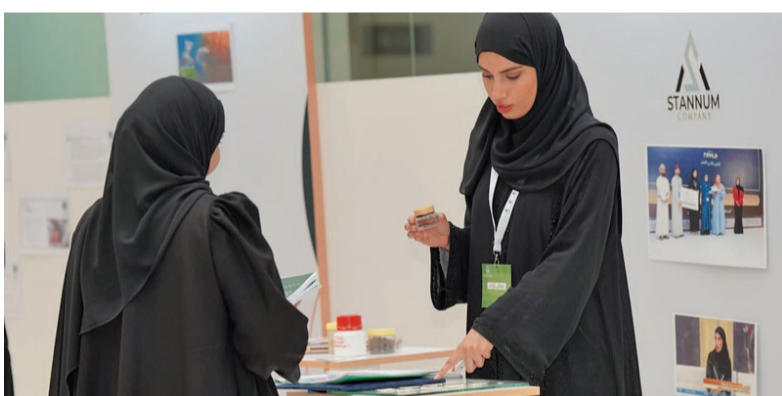
■ الفريق استخدم تقنيات حديثة لإعادة تدوير الألمنيوم

يستخدم في العديد من التطبيقات المهمة مثل تغليف الأدوية، وصناعة الأغلفة، وتطوير بعض المستحضرات الصيدلانية، وحتى في الصناعات الإلكترونية، لما يتمتع به المنتج من خصائص مثل المرونة والمتانة، ما يجعله خياراً مثالياً لمجالات متعددة تسعى إلى تقليل البصمة الكربونية. جدير بالذكر أن المشروع يساهم في بناء اقتصاد دائري أكثر استدامة، ويدعم التوجه العالمي نحو حماية البيئة والحفاظ على الموارد الطبيعية، كما يسعى فريق العمل لتوسيع استخدام «جرينيلوم»، من خلال زيادة مرافق إعادة التدوير، والابتكار التكنولوجي، بالإضافة إلى تعزيز الممارسات المستدامة على المستوى العالمي.