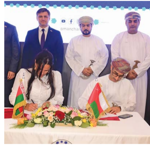
المنتدى الأعمال العماني البيلا روسي شهد توقيع عدد من مذكرات التفاهم

وأمن بيلا روسيا تسعى إلى دعم التعاون في العديد من المجالات سيما تكنولوجيا المعلومات في ضوء امتلاك بيلا روسيا حاضنة بها ألف شركة تعمل في العديد من المقومات لتكون بوابة لمنتجات بيلا روس إلى أسواق واعدة في دول مجلس التعاون وأسيا. وأضاف أن المنتدى حرص على التأكيد على تحفيز التعاون الثنائي خاصة في مجالات الإنتاج الصناعي والزراعة وتقنية المعلومات،