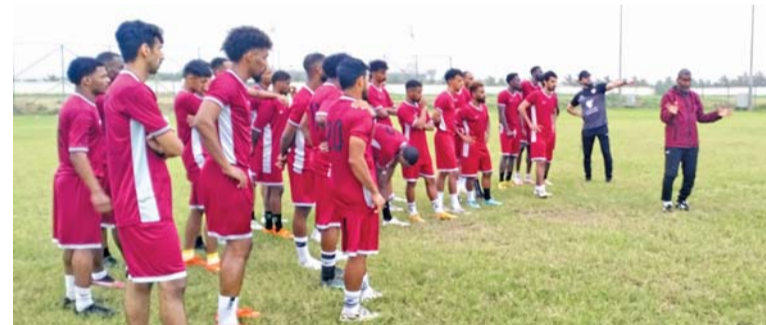
من تدريبات الاتحاد اليومية استعدادا لدوري تمكين