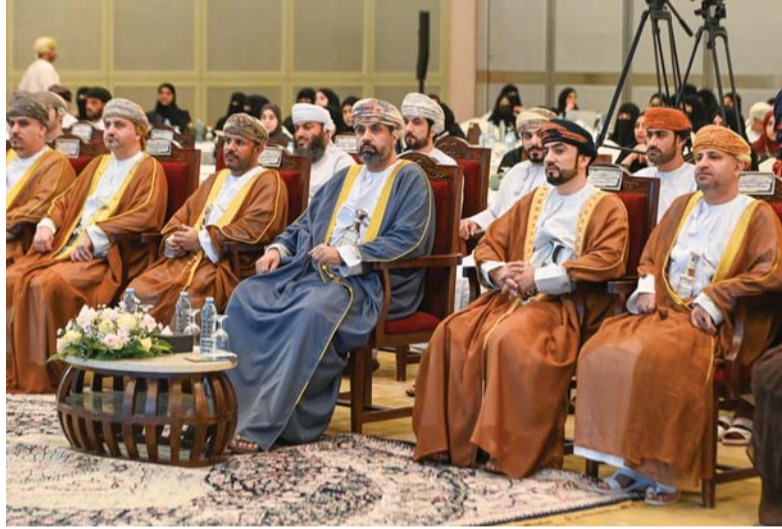
الندوة تناقش أهمية التدريب على رأس التعليم في التوجيه المهني

بالإضافة إلى استخدام التمكين الشخصي ومنهجياته في الإرشاد والتوجيه المهني، وفق الإطار الوطني للكفاءات الوظيفية. من جهة أخرى، دشنت وزارة العمل ممثلة بدارسة الإجابة بالمديرية العامة للتطوير وضمان الجودة مبادرة «تجربة رحلة المستقبل» التي تهدف إلى استخدام مجموعة من الأدوات الفعالة لتشخيص الواقع الفعلي لإجراءات تقديم الخدمات والتعرّف على فرص التحسين الممكنة لتجويدها، بهدف تعزيز كفاءة خدماتها بما يحقق رضا المستفيدين ولبلي طموحاتهم.