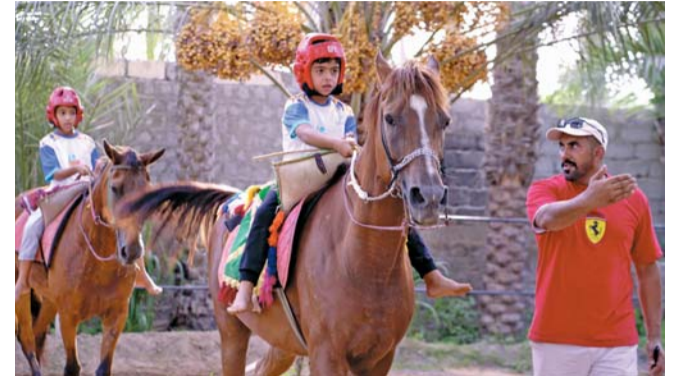
من فعاليات وأنشطة صيف الرياضة بجنوب الشرقية