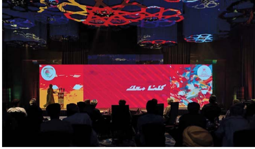
من مراسم تدشين الحملة

يترقب الوسط الرياضي في السلطنة وخاصة مجلس إدارة نادي ظفار وجماهيره ومحبوه قرار المحكمة الكروية حول قضية الزعيم، والتي منعت من الحصول على الرخصة الاسبوعية والمشاركة بدوري عمانتل حتى هذه اللحظة، بالإضافة إلى تعليق مبارياته في الجولات الثلاث الماضية، ومن المنتظر صدور قرار المحكمة الكروية حول قضية نادي ظفار صباح اليوم، والذي على إثره سيحدد الكثير من الجوانب المتعلقة بدورينا وقبلها نادي ظفار الذي من المتوقع أن لا يرضى قرار سقوطه للدرجة الأولى في