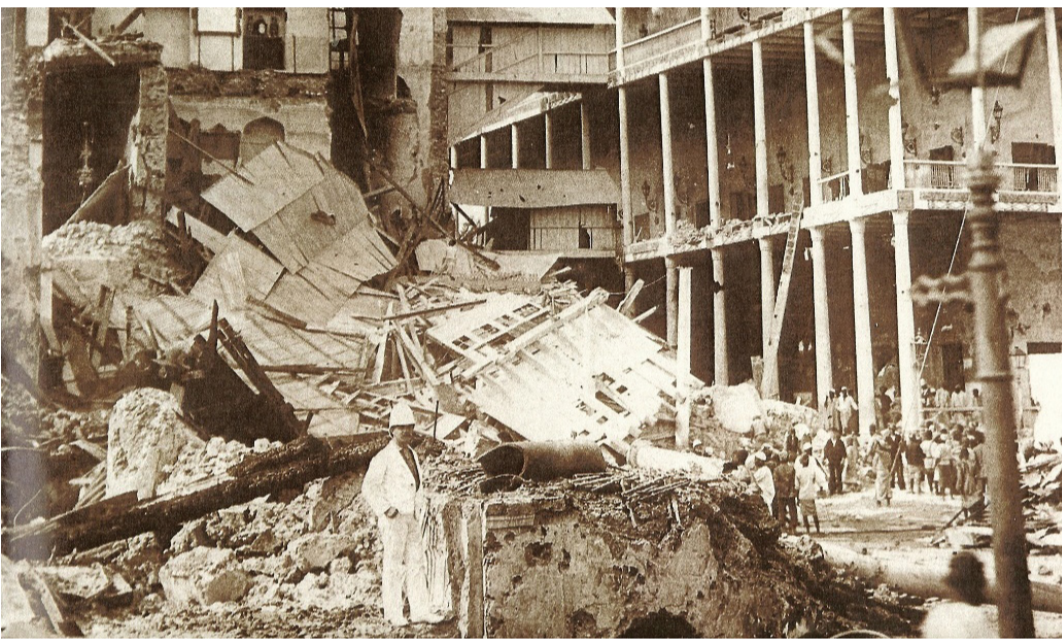
بيت الحكم وقد تهدم بالكامل، وأضرار متوسطة في بيت العجائب