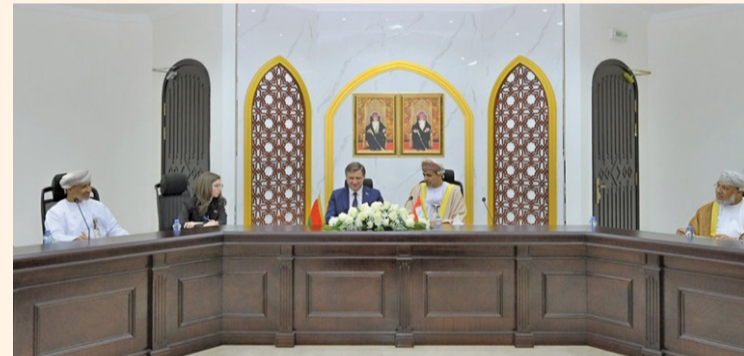
الجانبان أكدا على التعاون في مجال البحوث والدراسات العلمية

الغرفة التجارية في جمهورية بيلا روسيا أوجه التعاون بين البلدين الصديقين في مجالات الثروة الزراعية والسمكية والحيوانية وموارد المياه والأمن الغذائي وإمكانات التعاون في مجال البحوث والدراسات العلمية وتبادل الخبرات والزيارات والاستفادة من تجربة بيلا روسيا في تطوير وتنمية القطاعات الزراعية والسمكية والمائية. جاء ذلك خلال استقبال معالي الدكتور سعود بن حمود الحبسي وزير الثروة الزراعية والسمكية وموارد المياه بمكتبه أمس معالي أليكسي بوغدانوف وزير مكافحة الاحتكار