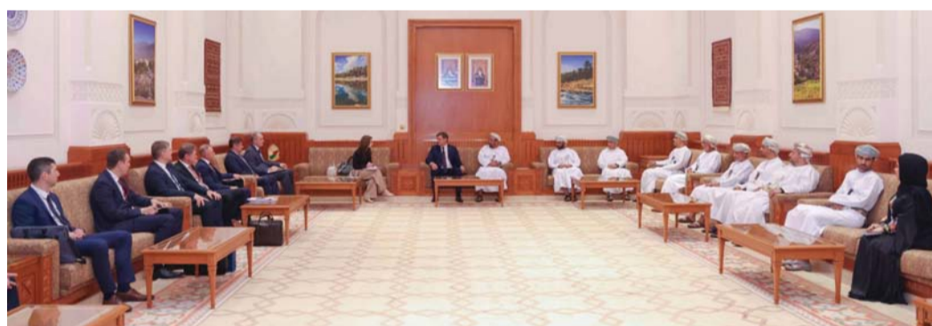
الجانبان استعرضا العلاقات الثنائية بين البلدين

المشتركة بين البلدين خصوصاً فيما يتعلق بتطوير التعاون البرلماني، والتبادل التجاري، والصناعي، وفي مجال النقل والاتصالات وعلى العلاقات المتميزة بين الطرفين، وأهمية توسيع هذه العلاقات وتعزيزها بين سلطنة عُمان وجمهورية بيلاروسيا، وفي ختام الزيارة قام معاليه والوفد المرافق له بجولة في مبنى المجلس تعرفوا خلاله على مرافقه المختلفة.