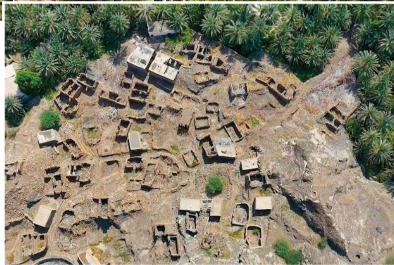
موقع واسط الأثري يعد من أبرز المواقع التاريخية الغنية بالقطع الأثرية

تعد قرية «واسط» واحدة من القرى البارزة في منطقة وادي الجزبي بولاية البريمي، إذ تمثل بوابة الولاية من الجهة الشرقية، وتفصل بين ولايتي البريمي وصحار، وتبعد عن مركز المدينة حوالي ٥٠ كيلومتراً وتمتد على مساحة واسعة تعزز من أهميتها الجغرافية والاستراتيجية. وتتميز بلدة واسط بمقومات