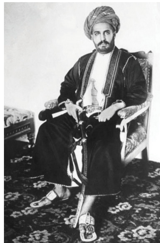
السُلطان خالد بن برغش بن سعيد بن سلطان

للإرادة الشعبية الزنجبارية أي اعتبار في ذلك؛ وهو ما دفع بالإدارة الإنجليزية إلى اختيار بديل العمل العسكري لإخراج السيد خالد من بيت الحكم، الذي كان قد فرض نفسه عليه، هو وبعض من مستشاريه وأتباعه. وبناءً على نصائح العمانيين، خرج السيد خالد من القصر، فاسخاً المجال للمرشح الذي اختارته الإدارة الإنجليزية للعرش، وهو ابن عمه، السيد حمد بن توييني بن سعيد بن سلطان، الذي نودي به سلطاناً على زنجبار، في اليوم نفسه. في ذلك اليوم نفسه، أن خروج السيد خالد من القصر، كان حقاً للدماء أيضاً، بعد أن لاحظ تأهب القوات البريطانية لاستعمال القوة لإخراجه وأتباعه من القصر عنوة. يُصور لنا (Lyne) هذا المشهد بالقول: إنه عندما سمع الجنرال ماثيوس بما فعله السيد خالد، استعان بعدد يصل إلى ١٦٠ من قوات مشاة البحرية البريطانية (Marines)، والقوات ذات السترات الزرق، المعروفة بالـ (blue-jackets)، الذين تقدموا نحو القصر، ووقفوا أمام بابه الرئيس، موجّهين فوهات بنادقهم الآلية تجاهه، وتمت المناداة على من بالداخل بالاستسلام.