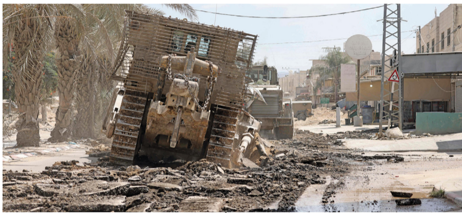
جرافة عسكرية إسرائيلية تجرف طريقاً أثناء مدهمة مخيم نور شمس للاجئين الفلسطينيين بالقرب من مدينة طولكرم في الضفة الغربية المحتلة أمس.

القدس المحتلة. «الوطن». وكالات: صعد الاحتلال «الإسرائيلي» من عدوانه على الفلسطينيين في قطاع غزة وسط سقوط يومي لعشرات الشهداء والجرحى، كما أقدم على مد جرائمه لتشمل الضفة الغربية المحتلة مرتكباً المجازر ومحاصراً المستشفيات تمهيداً لاقتحامها. وواصلت الطائرات «الإسرائيلية» قصفها لمختلف مناطق قطاع غزة، حيث ارتكب الاحتلال «الإسرائيلي» ثلاث مجازر ضد العائلات في قطاع غزة وصل منها للمستشفيات (٥١) شهيداً (١١٣) مُصاباً خلال (٢٤) ساعة لترتفع حصيلة العدوان «الإسرائيلي» على