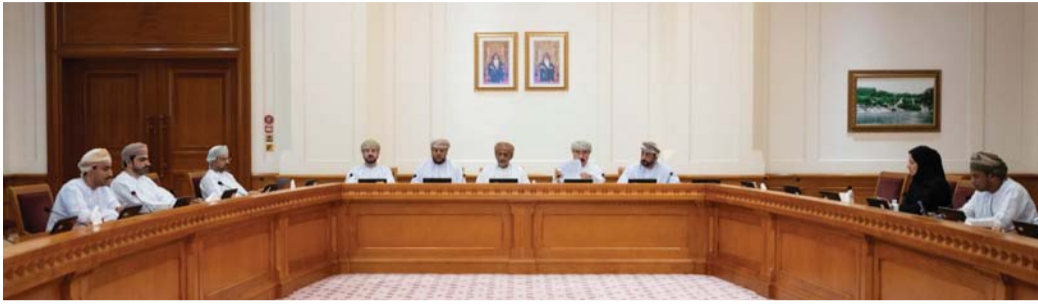
■ لجنة الخدمات والمرافق العامة أثناء لقائها المختصين من وزارة التنمية الاجتماعية