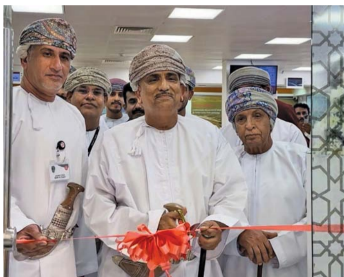
المركز الجديد إضافة مهمة ومميزة إلى شبكة مراكز أصالة