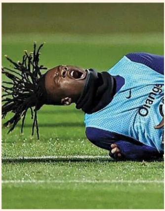
لحظة إصابة كامافينجا