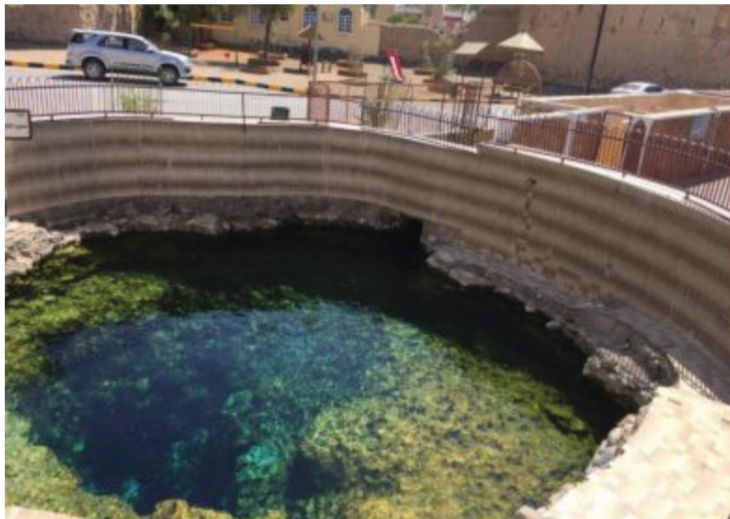
■ عين الكسفة