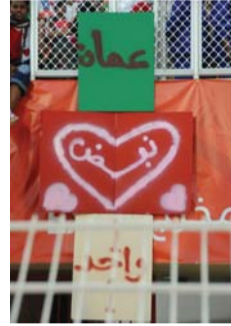
شعار الحملة الذي أطلق في خليجي ١٩ بمسقط

تشهد القاعة الرئيسية بفندق دبلو - القرم بدءاً من الساعة السابعة والنصف مساءً اليوم مراسم توشين حملة وطنية متكاملة الأركان خاصة بدعم المنتخب الوطني الأول لكرة القدم، في مسيرته بتصفيات المرحلة المهمة جداً المؤهلة لمونديال ٢٠٢٦ في أميركا وكندا والمكسيك، والتي يأمل من خلالها أبناء سلطنة عمان تحقيق حلم طال انتظاره، وهو الوصول لكأس العالم والتواجد بين الكبار في أكبر المحافل الكروية، هذه الحملة أطلقتها وزارة الثقافة والرياضة والشباب من أجل مساندة الاتحاد العماني لكرة القدم في مساعيه نحو تحقيق هذا الهدف، وكذلك توفير كافة السبل التي يمتنأها الجهاز الفني واللاعبين قبل صافرة البداية أمام العراق من معقله في البصرة بحلول الخامس من سبتمبر القادم إن شاء الله تعالى، قبل أن يستقبل الشمشون الكوري في مسقط.