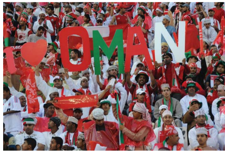
الجماهير العمانية تساند المنتخب في كافة المناسبات وتأمل الوصول إلى المونديال

رسائل إعلامية لدعم الأهم وفي ذات السياق، عقد صباح أمس لقاء مشترك بين عدد من أعضاء اللجنة الإعلامية بوزارة الثقافة والرياضة والشباب وعدد من وسائل الإعلام العمانية بكافة أطيافها، وذلك بقاعة الاجتماعات بمجمع السلطان قابوس الرياضي ببوش، وقد اتفق الحضور على ضرورة وضع رسائل إعلامية واضحة لدعم مسيرة منتخبنا في التصفيات الهامة، ومدى تأثير هذا الدعم على التحفيز الشخصي للاعبين، ودعم نفسي للمنتخب وضرورة تواجدهم الجماهير ودعمها سيقدّم دعماً نفسياً لمنظومة المنتخب وسيزيد من الأمل والتفاؤل والإثارة، إيجاد جو من الإيجابية والتفاؤل، تأثير الحضور الجماهيري وتفاعله مع الهتافات والشعارات المتفق عليها. كما تطرق الحضور إلى ضرورة الحديث