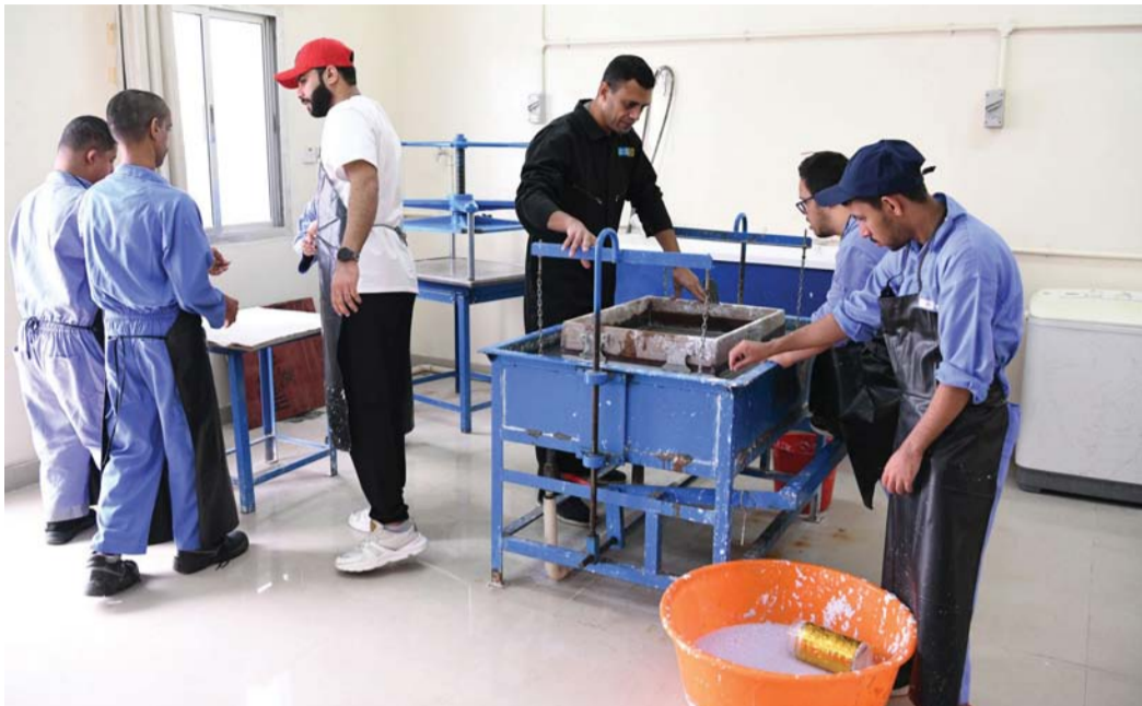
أثناء إحدى البرامج التأهيلية المقدمة للمتخصصين بالمراكز التأهيلية

ويبدأ دوام الفصل الأول للعام التأهيلي (٢٠٢٤/٢٠٢٥ م) للمتخصصين في مراكز التأهيل التابعة للجمعيات الأهلية يوم الأحد ١٦/٩/٢٠٢٤ م، وينتهي يوم الخميس الموافق ٢٩/٨/٢٠٢٤ م.