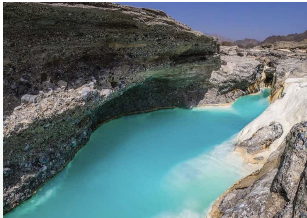
■ عين حن الكبريتية

ولياتهم، بحيث يتم العمل على تطويرها بالطريقة الصحيحة واستثمارها بشكل آمن بايجاد مستثمرين حقيقيين لبناء منتجات علاجية كوننا بحاجة الى المدن الطبية التي تضاهي العديد من الدول التي سبقتنا في هذا المجال، ولكن علينا ان نبدأ من حيث انتهى الآخرون وفي المقدمة البنية التحتية لتطوير هذه الثقافة وغرسها على ان تقوم المحافظات بالاجتهاد في صيانة العيون والآبار والأفلاج التي تحظى باهتمام ومزارات للسياحة العلاجية وجعلها مزارات للسياحة العلاجية وعلينا بالفعل استغلال تلك المزارات في غير مواسم السياحة وبالذات في فصل الشتاء، وعلينا الأخذ بعين الاعتبار ان المنتجات السياحية الآن متنوعة لدرجة أنها أصبحت وجهة على مدار العام في العديد من البلدان وأصبحت للسياحة العلاجية مصطلحات رائجة كثيرا في الأعوام الأخيرة، حيث يتجه الأشخاص إلى بعض الدول من أجل السياحة والعلاج في وقت واحد مما يشكل دخلا مهما ورافدا للاقتصاد الوطني.