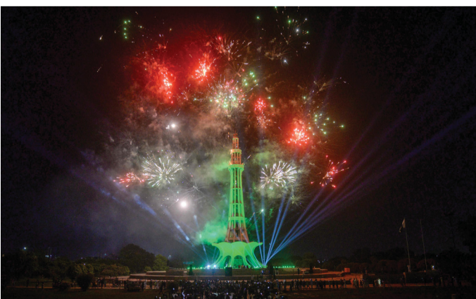
الألعاب النارية تضيء السماء فوق نصب منارة باكستان التذكاري أثناء الاحتفالات بعيد الاستقلال في لاهور

إسلام آباد. د. ب. أ: أصيب نحو ٧٠ شخصاً بسبب إطلاق النار في الهواء في عدة مناطق بمدينة كراتشي الباكستانية، وذلك أثناء الاحتفال بعيد الاستقلال، حسبما قالت مصادر في قطاع الإنقاذ لقناة جيو الباكستانية. وقالت المصادر إن من بين المصابين نساء وأطفال، ومع ذلك لم تقع وفيات. ويذكر أن شخصين لقيا حتفهما العام الماضي، في حين أصيب أكثر من ٨٠ آخرين بسبب إطلاق النار في الهواء في مناطق مختلفة بكراتشي أثناء الاحتفال بعيد الاستقلال.