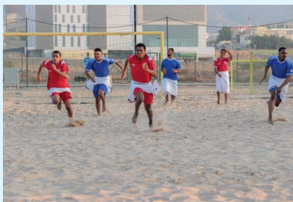
من منافسات سابقة للألعاب التقليدية