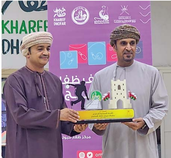
هدية لراعي الختام

سيغيب لاعب الوسط الفرنسي الدولي إدواردو كامافينجا عن صفوف فريقه ريال مدريد أسابيع عديدة، بعد تعرّضه لانتواء في الرباط الداخلي لركبته اليسرى خلال حصة تدريبية، وفقاً لما أعلنه نادي العاصمة الإسبانية في بيان له أمس، وقال حامل لقب الدوري الإسباني في بيانه الذي لم يُحدّد فيه كعادته مدة غياب لاعبه «بعد الفحوصات التي أجريت اليوم للاعبنا إدواردو كامافينجا، شخّصت إصابته بالانتواء في الرباط الجانبي الداخلي للركبة اليسرى»، غير أن الصحافة الإسبانية قدرت مدة الغياب بين ستة وسبعة أسابيع. وحصلت الإصابة بعد احتكاك بينه وبين زميله ومواطنه أوريليان تشواميني خلال حصة تدريبية، وقع على إثره أرضاً ممسكاً ساقيه اليسرى عشية نهائي كأس السوبر الأوروبية أمام أتلانتا، وسيغيب الدولي الفرنسي عن بداية الموسم مع فريقه، إضافة إلى الغياب عن النافذة الأولى لدوري الأمم الأوروبية مع السرب في السادس والتاسع من سبتمبر المقبل، وتشكّل هذه الإصابة ضربة قوية لبطول إسبانيا وأوروبا الحالي الذي قد يضطر إلى التقاعد مع لاعب وسط إضافي بعد اعتزال ضابط إيقاعه الألماني توني كروس وعدم تعويضه في سوق الانتقالات الصيفية.