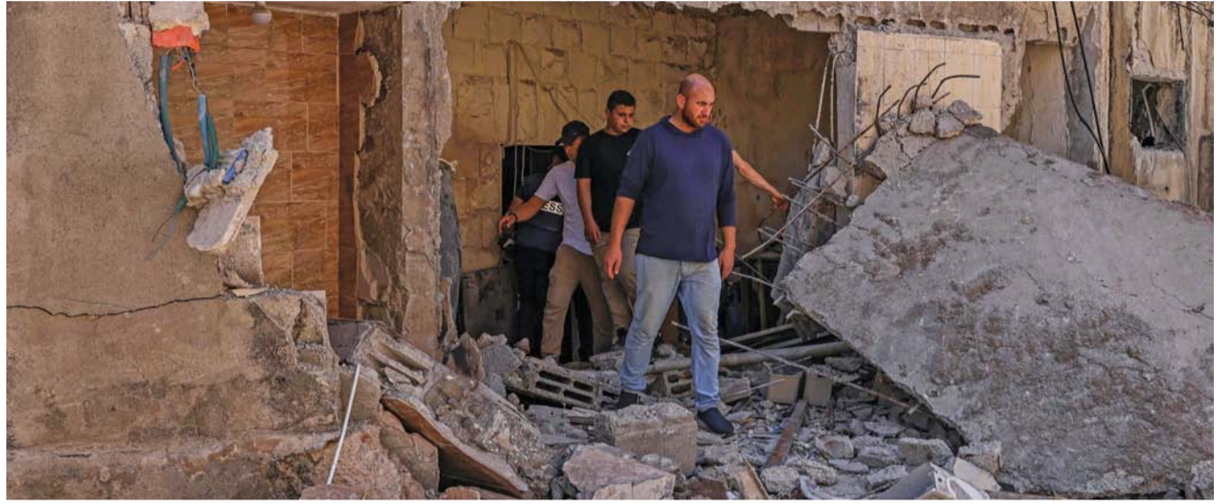
فلسطينيون يتفقدون مبنى تضرر جراء غارة للجيش الإسرائيلي في مدينة طوباس بالضفة الغربية المحتلة.

نيويورك . الغمانية: أبدى مكتب الأمم المتحدة لتنسيق الشؤون الإنسانية، قلقه العميق جراء ارتفاع عدد القتلى المدنيين والنزوح المتزايد، وسط تصاعد الأعمال العدائية عبر الخط الأزرق الفاصل بين لبنان والاحتلال الإسرائيلي. وأوضح المكتب الأممي في بيان، أن عدد الوفيات من المدنيين ارتفع على مدى الشهر الماضي، بنسبة ٢٠ في المائة ليصل إلى ١٢٠ وفاة منذ أكتوبر الماضي، نصفهم تقريباً من النساء والأطفال. وأشار إلى استهداف البنية الأساسية المدنية بشكل متكرر، حيث نقل عن منظمة الأمم المتحدة للطفولة (اليونيسف) أن أكثر من ١٢ محطة مياه تضررت، وباتت أربع منها الآن خارج الخدمة، ما يؤثر على الوصول إلى مياه الشرب الآمنة لأكثر من ٢٠٠,٠٠٠ شخص.