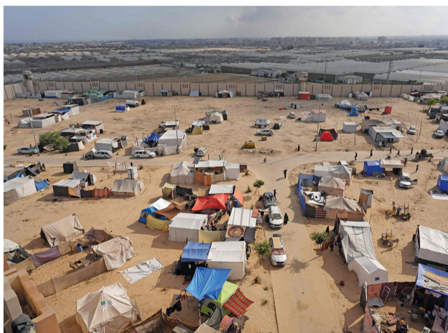
فلسطينيون يسرون بالقرب من خيام في ساحة سجن أصداء المركزي الذي أصبح مأوى للنازحين في خان يونس جنوب قطاع غزة.

وجدت في بيان صادر عن وزارة الخارجية دعوتها للمجتمع الدولي لتحمل مسؤولياته الواجبة عليه في إدانة وردع كافة الانتهاكات التي تتعارض مع القوانين والمواثيق الدولية الداعية لصون حرمة المقدسات الدينية واحترامها. يأتي ذلك فيما يستمر الاحتلال الإسرائيلي في عدوانه على قطاع غزة، حيث وصلت قوات الاحتلال قصفها مناطق عدة خلفت عشرات الشهداء والجرحى، فيما امتد العدوان للضفة الغربية، واستشهد ٥ فلسطينيين في اقتحام قوات الاحتلال مدينة طوباس وبلدة طمون. ومن المنتظر أن تبدأ جولة أخرى من المفاوضات اليوم الخميس في الدوحة، حيث تعزز الإدارة الأميركية تقديم إطار جديد للصفقة وممارسة ضغوط شديدة على الأطراف للموافقة الفورية على مبادئ المخطط. تفاصيل: ..... ص