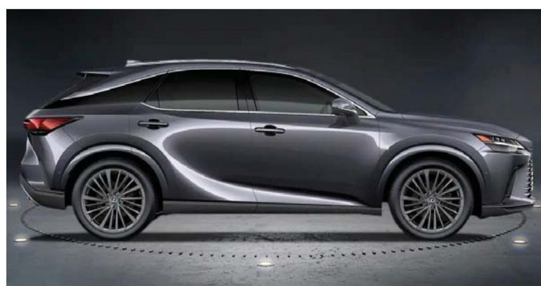
■ لكزس آر إكس لتوفير قوة للتكنولوجيا والابتكارات