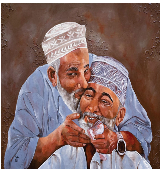
الرسم رواية تبرز تفاصيل الوجوه وتجاعيد الزمان