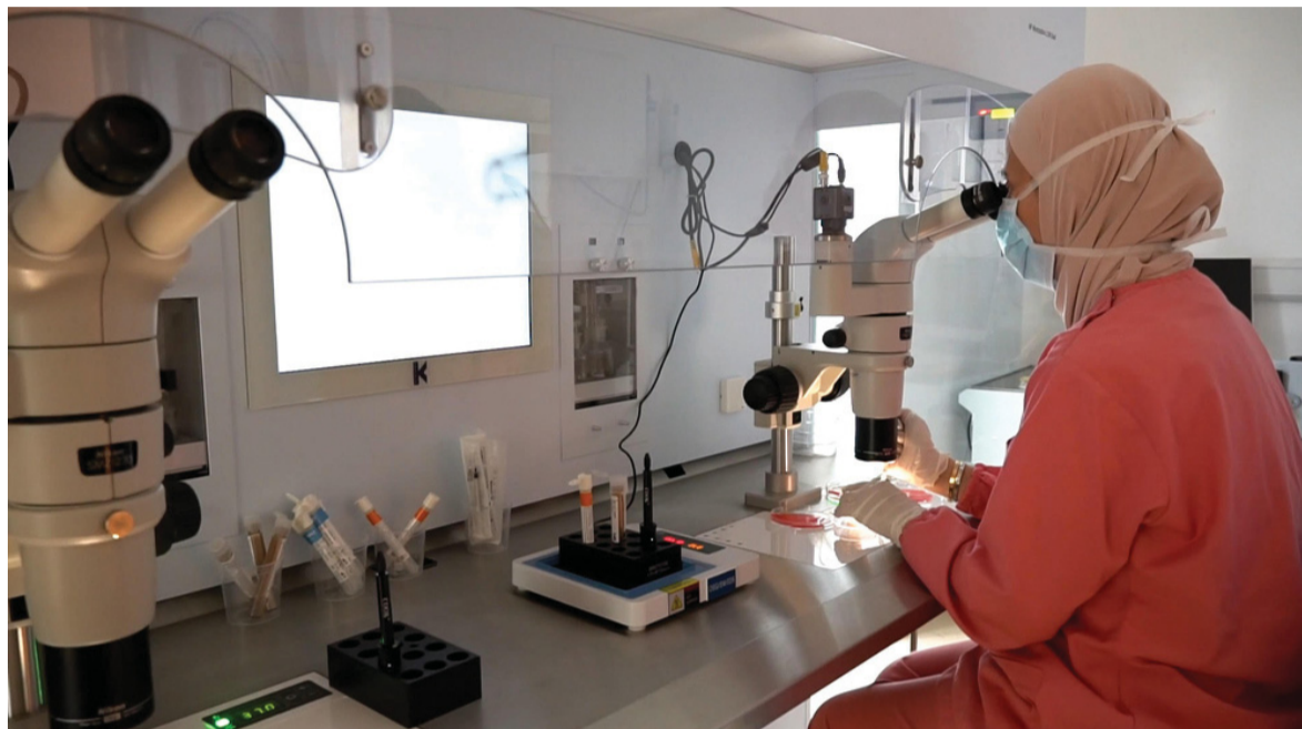
المركز يضم فريقاً طبياً لديه خبرة واسعة في مجال الإخصاب

المختبرات، لتوفير خدمات الرعاية الطبية المجانية بجودة عالية. ويتم اللجوء إلى تقنية أطفال الأنابيب في حالة انسداد قناة فالوب والعقم عند الذكور أو النساء المصابات باضطرابات الإباضة أو العقم غير المعروف سببه مع فشل الإجراءات والعلاجات الأخرى، وتجرى عمليات أطفال الأنابيب وفق شروط متعارف عليها عالمياً، أبرزها ألا يزيد عمر الأم على ٤٢ عاماً عند التسجيل للعلاج مع عدم وجود طفل سليم في الزواج الحالي على ألا يزيد مؤشر كتلة الجسم عند المرأة عن ٣٥ ما سيكون له تأثير إيجابي على نجاح العلاج، فيما يشمل الأعمار ٤٣ و ٤٤ مع وجود مخزون جيد للمبايض يتم التأكد منه مع نتائج الفحوصات.