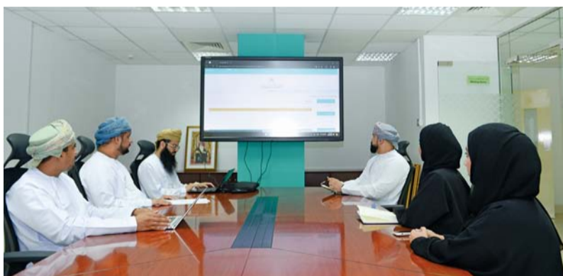
تبنى أحدث التقنيات لتعزيز الخدمات المقدمة

وتعني بمنح الموافقة المبدئية (رسالة عدم ممانعة) لموقع المشروع المقترح من ناحية التخطيط البيئي. وخدمة ترخيص تسجيل المصادر المشعة المغفلة التي تعني بمنح غرض تسجيل المصادر المشعة المغفلة.