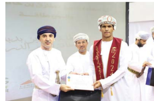
تقديم الهدايا والشهادات للطلبة المجيدين