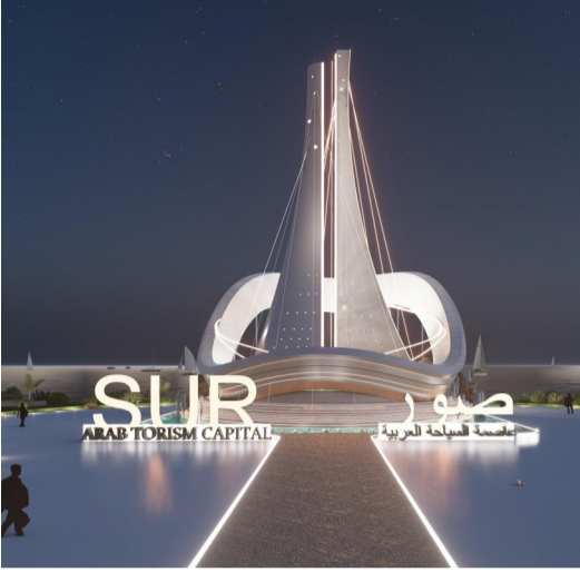
مشروع غنجة صور الفائز بالمركز الثالث