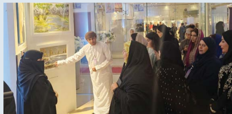
المهرجان يتضمن مجموعة متنوعة من اللوحات والمنحوتات والأعمال الفنية