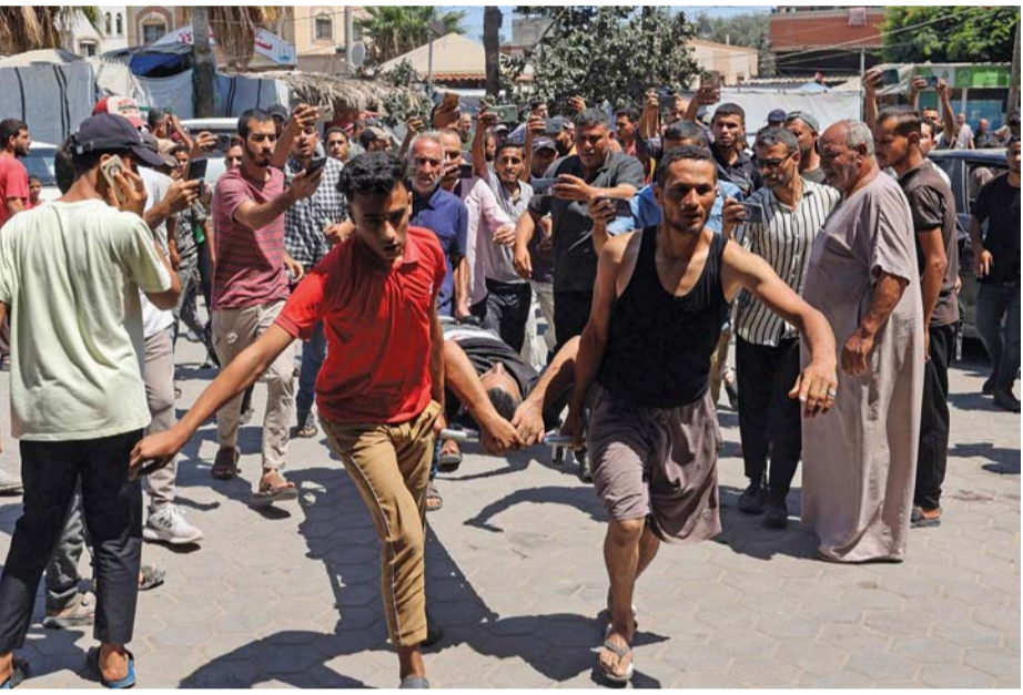
فلسطينيون ينقلون جرحى القصف الإسرائيلي إلى مستشفى شهداء الأقصى في دير البلح وسط قطاع غزة أمس