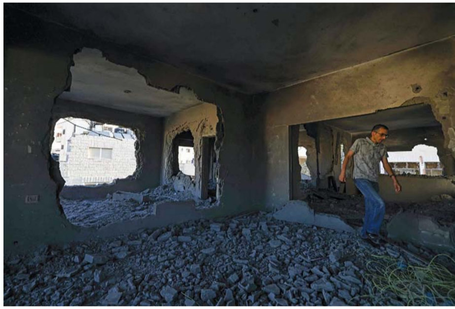
فلسطيني يتفقد الأضراس بعد أن هدمت قوات الاحتلال الإسرائيلي منزله في رام الله بالضفة الغربية المحتلة أمس