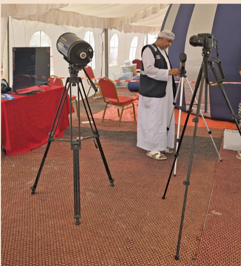
عدد من تلسكوبات المرصد متواجدة في الفعاليات

ويعرض المرصد صوراً للمجموعة الشمسية خلال فترة النهار، ويتيح مشاهدة البقع الموجودة في الشمس، وخلال فترة المساء يتم عرض صوراً للقمر وبعض الكواكب والمجرات والسدم الموجودة في السماء.