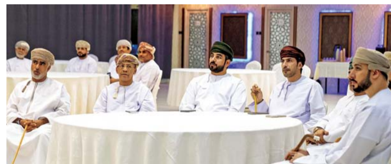
■ لقاءات النخبة في كافة أنحاء البلاد تقليد يحرس عليه البنك الأهلي