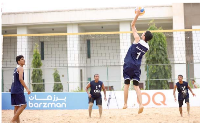
من مباريات الكرة الطائرة الشاطئية

الشاطئية، حيث فاز فريق تعليمية شمال الباطنة على تعليمية مسقط ١/٢ بالضربات الترجيحية في قمة مباريات الجولة، وحقق فريق جنوب الشرقية الفوز على تعليمية جنوب الباطنة ٠/٢ وبفئس النتيجة فازت تعليمية الداخلية على تعليمية ظفار. وانتهى اللقاء الرابع بفوز تعليمية الظاهرة على تعليمية شمال الشرقية ٠/٢ وسوف تختتم البطولة صباح يوم غد الخميس.