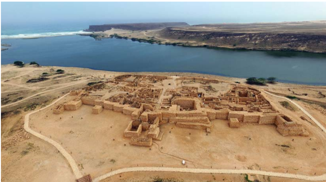
المزارات التاريخية تمثل عامل جذب مهم للزوار والسياح