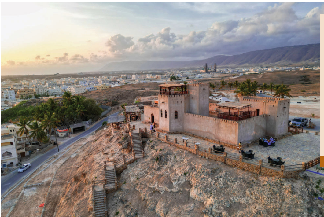
سلطنة عمان قدمت للبشرية صنوفاً من العلم والعمران ما يستحق الدراسة بتأمل وإمعان