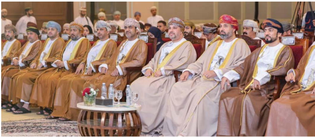
المنتدى يهدف إلى زيادة الإنتاجية والكفاءة في بيئة العمل

كما يشمل المنتدى الذي يقام على مدى يومين، تقديم مجموعة من أوراق العمل من بينها تمكين الموظفين من خلال إتقان هندسة الأوامر للذكاء الاصطناعي، والدور الاستراتيجي للتعليم المستمر في إعداد القوى العاملة لبيئة عمل متغيرة، واستخدام الذكاء الاصطناعي في رفع وتحسين إنتاجية الموظفين، بالإضافة إلى منصة الذكاء الاصطناعي وعلوم البيانات، والذكاء الاصطناعي في تحقيق التنمية المستدامة، فضلاً عن مهارات المستقبل ودور المؤسسات الحكومية في تعزيزها، وتطوير المهارات في الاقتصاد المتجدد.