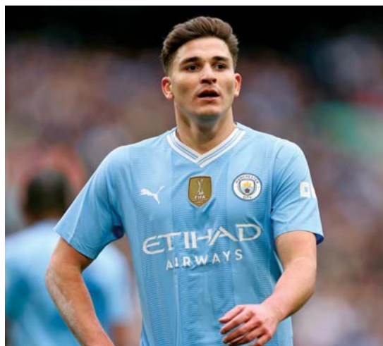
■ جوليان ألفاريز

ويأتي بيع ألفاريز، ليمنح أربابها جيدة لسيتي، الذي اشترى اللاعب من ريفر بلت الأرجنتيني مقابل ١٤ مليون جنيه إسترليني (١٨ مليون دولار)، كما يؤكد استعداد المدرب الإسباني جوسيب جوارديولا للسماح للاعب الفريق الإنجليزي غير السعداء بتواجدهم داخل ملعب (الاتحاد) بالرحيل. تمتع ألفاريز بنجاح مذهل في موسمه الأول مع سيتي (٢٠٢٢ / ٢٠٢٣).