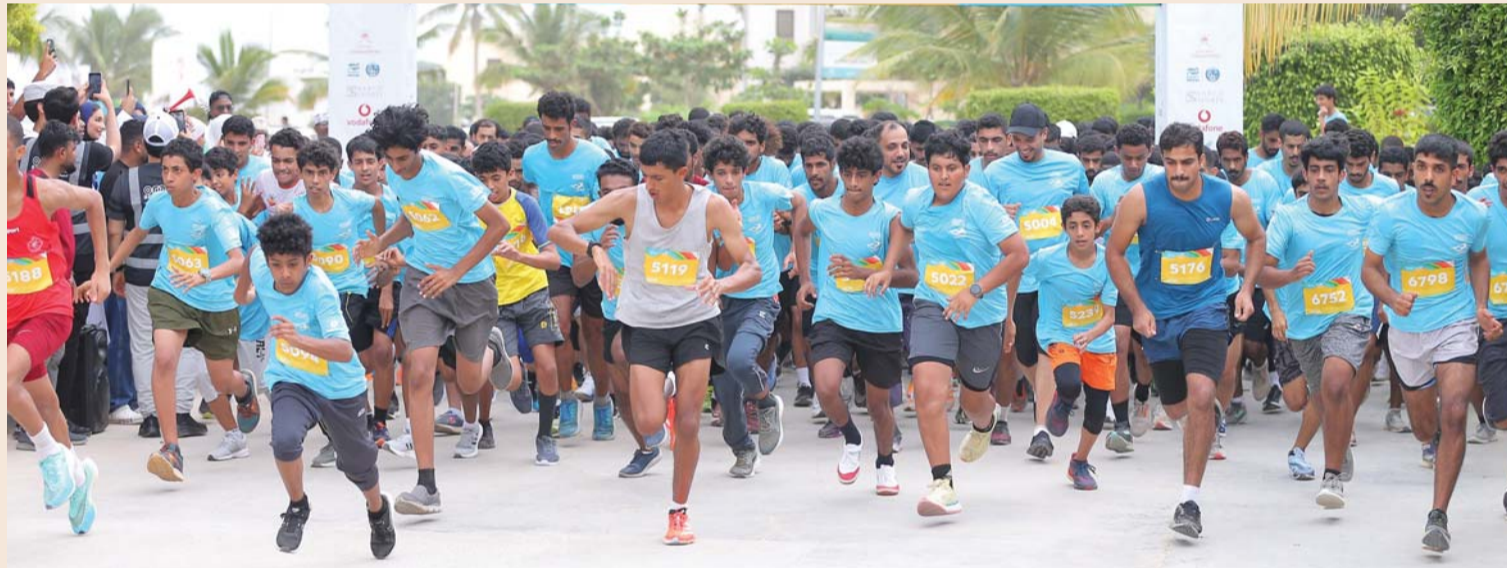
■ سباق الماراثون يستقطب العديد من الفئات العمرية

الرياضة والرياضيين والعائدين وشارك جميع فئات المجتمع الأمر الذي يعكس مدى ثقافة المجتمع ويرسخ مفاهيم الثقافة الصحية، وتساهم في إبراز الجوانب السياحية في كل محافظة وولاية، بالإضافة إلى إشراك المؤسسات الخاصة وغيرها ذات العلاقة بهذا الجانب، وخلق شراكة مجتمعية بينهم.