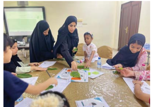
الحلقة تضمنت أنشطة علمية وإدراكية للأطفال