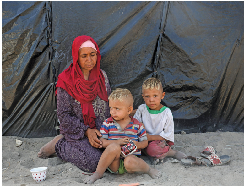
فلسطينية وطفلاها يجلسون أمام خيمتهم، بمخيم مؤقت للنازحين أقيم على جانب الطريق في دير البلح وسط قطاع غزة.

القدس المحتلة. «الوطن». وكالات: استشهد ٤٢ فلسطينياً بحصف الاحتلال لمناطق عدة في إطار عدوانه الشامل على قطاع غزة؛ ٣٠ منهم في مجازر بخان يونس ومخيم النصيرات وسط القطاع، وفي القدس المحتلة، قالت دائرة الأوقاف الإسلامية إن أكثر من ٢٢٥٠ مستوطناً متطرفاً اقتحموا باحات المسجد الأقصى المبارك منذ صباح أمس، فيما تسمى «تكري خراب الهيكل»، بحماية مشددة من شرطة الاحتلال يأتي ذلك برعاية حكومية من الاحتلال، حيث اقتحم وزير الأمن القومي الإسرائيلي المتطرف إيتامر