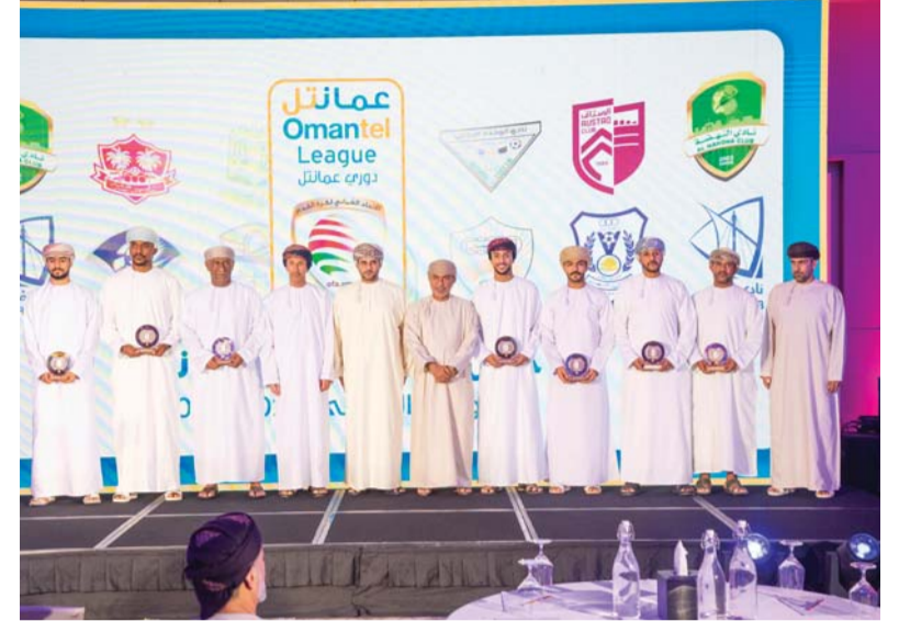
من احتفالية تكريم نجوم الموسم الماضي