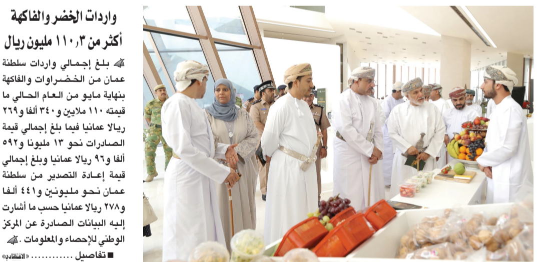
الإطلاع على محتويات المعرض