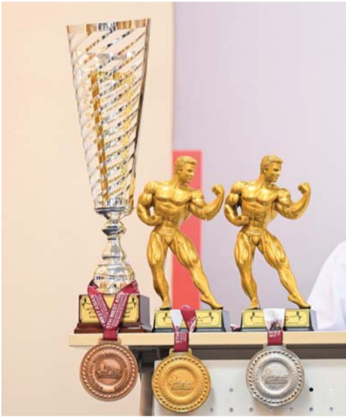
■ كأس البطولة والجوائز

وأضاف البحري: انطلاقاً لاستضافة بطولة غرب آسيا لبناء الأجسام والفيزيك، جاءت من «رؤية عُمان ٢٠٤٠»، وذلك للاهتمام بقطاع الشباب العماني واستقطاب البطولات الإقليمية والدولية، ووضع لعبة بناء الأجسام على خريطة الرياضة العالمية، وأيضا هدفاً كذلك من استضافة هذه