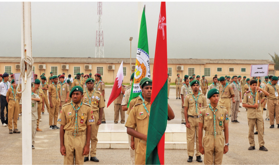
صقل مهارات الشباب ومعارفهم وتنمية خبراتهم الحياتية