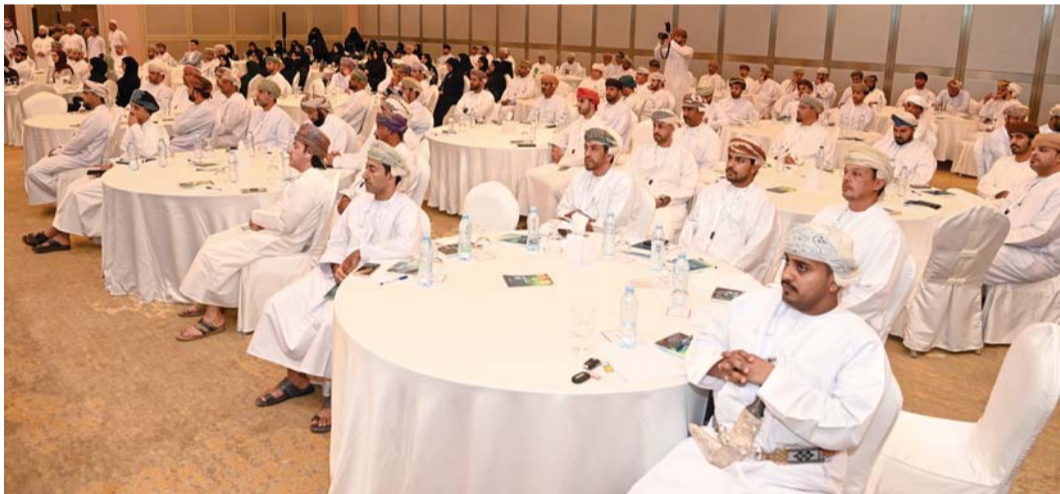
مجموعة أوراق عمل قدمها المنتدى لتمكين الموظفين

الحضري: قامت وزارة العمل باتخاذ خطوات متقدمة من خلال الرؤية والاستراتيجيات الاقتصادية والتعليمية والتدريبية والتشغيلية والتي تتواءم مع مستقبل العمل،