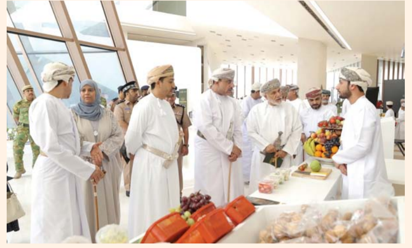
الإطلاع على محتويات المعرض

لله احتفالاً بمعرض استكشف أسرار موسم القيقظ الذي ينظمه المتحف بالتعاون مع شركة تنمية نخيل عُمان، وذلك تحت رعاية سعادة الشيخ هلال بن سعيد الحجري محافظ الداخلية. تضمن المعرض الذي يستمر حتى السابع عشر من الشهر الجاري، بمشاركة عدد من المؤسسات الحكومية والخاصة منها ركن لشركة تنمية نخيل عُمان وركن لبلدية مسقط وركن لوزارة الثروة الزراعية والسمكية وموارد المياه وركن للحصاد وركن لحرفة وركن للمرح.