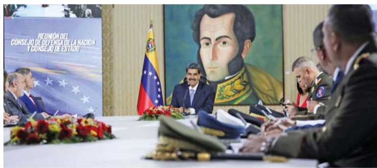
الرئيس الفنزويلي نيكولاس مادورو يجتمع بمجلس الدفاع الوطني ومجلس الدولة في مبنى وزارة الخارجية بكاراكاس

كابول ١٠.٨.٢٠٢٤. اتهمت حكومة طالبان القوات الباكستانية بقتل ثلاثة مدنيين هم امرأة وطفلان خلال اشتباكات على الحدود بين البلدين. حدث تبادل لإطلاق النار الاثنين قرب معبر تورخام الحدودي في ولاية ننگرهار الأفغانية حيث تبادل الطرفان الاتهامات بإثارة الاشتباك.