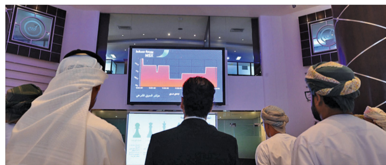
■ اتجاه المستثمرين الأجانب للشراء نتيجة تراجع أسعار الأسهم الأسبوع الماضي

المالية المدرجة في بورصة مسقط بنهاية الأسبوع الماضي إلى ٢٤ ملياراً و٣٨٧ مليون ريال عماني مسجلة خسائر أسبوعية عند ٣١,٨ مليون ريال عماني. وركز المستثمرون في تداولات الأسبوع الماضي على أسهم أوكيو لشبكات الغاز وبنك مسقط وبنك صحر الدولي التي استحوذت مجتمعاً على ٥٢ بالمائة من إجمالي قيمة التداول، فقد شهد سهم أوكيو لشبكات الغاز تداولات بقيمة ٨٨٢ ألف ريال عماني مستحوذاً على ٢٢,٦ بالمائة من إجمالي قيمة التداول، وشهد سهم بنك مسقط تداولات بقيمة مليون ٧٩٩ ألف ريال عماني، فيما شهد سهم بنك صحر الدولي تداولات بقيمة ٦٥٨ ألف ريال عماني تمثل ٧,٩ بالمائة من إجمالي قيمة التداول، وحلت عمانتل في المرتبة الرابعة بـ ٦٥١ ألف ريال عماني، وجاءت الخدمات في المرتبة الخامسة بتداولات بلغت حوالي ٥٠٥ آلاف ريال عماني. وتصدر سهم ظفار للتأمين الأسهم الراجحة مرتفعاً بنسبة ٩,٥ بالمائة وأغلق على ٢٣٠ بيسة، وارتفعت وحدات صندوق أمان الاستثماري بنسبة ٦,٥ بالمائة وأغلق على ٩٧ بيسة، وصعد سهم كلية مجان إلى ١١٠ بيسات مرتفعاً بنسبة ٤,٧ بالمائة. وجاء سهم المركز المالي في مقدمة الأسهم الخاسرة متراجحاً بنسبة ١٣,٣ بالمائة وأغلق على ٥٢ بيسة، وهبط سهم الخليج الدولية للكيماويات إلى ٦٦ بيسة متراجحاً بنسبة ٩,٥ بالمائة، وتراجع سهم المطاحن العمانية إلى ٤٨٠ بيسة مسجلاً هبوطاً بنسبة ٧,٥ بالمائة.