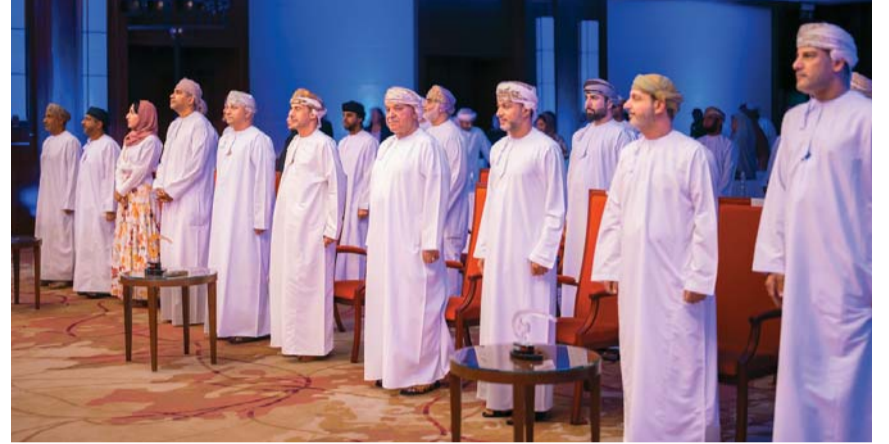
■ من حضور الحفل السنوي ١٦ لعمان للإبحار