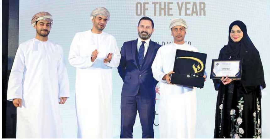
■ حصول عمان للإبحار على جائزة أفضل منظم أحداث رياضية على مستوى الشرق الأوسط

بفضل تلك الجهود، حققت سلطنة عُمان إنجازين بارزين تم تسجيلهما في موسوعة غينيس للأرقام القياسية. ففي عام ٢٠٢١، تم تسجيل رقم قياسي عالمي لأكثر حملة تنظيف الشواطئ بمشاركة ٧٣ جنسية مختلفة. وفي عام ٢٠٢٣، حققت رقماً قياسياً آخر أكبر جملة تم تشكيلها من عبوات البلاستيك الفارغة، حيث جمع المتطوعون أكثر من ٣٢,٣١٦ عبوة بلاستيكية واستخدموها لتشكيل عبارة «Project Earthlings has launched» من عمان، يأتي هذا الإنجاز في إطار الحملة الدولية التي أطلقتها الأمم المتحدة #بحار_نظيفة (CleanSeas) للحد من استخدام البلاستيك وتعزيز الوعي المجتمعي بأهمية الحفاظ على البيئة.