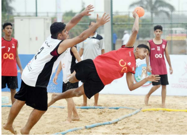
من مسابقة كرة اليد الشاطئية المدرسية

وتهدف البطولة الى نشر القيم التربوية والأخلاقية السامية والثقافة الرياضية بين طلبة المدارس، ونشر الوعي الرياضي بأهمية ممارسة الرياضة والنشاط الحركي، والمساهمة في اكتشاف المواهب الطلابية في الألعاب الشاطئية وتنميتها، والتعارف والإلتقاء بالقران وتوثيق أواصر الصداقة والتعاون من مختلف المحافظات التعليمية، والترويج للبنية التحتية والمنشآت الرياضية والشبابية في محافظة ظفار، مد جسور التعاون البناء مع مختلف الاتحادات واللجان الرياضية الوطنية والسلطة، وتقدير أهمية استثمار وقت الفراغ لدى الطلبة ببعض النشاطات الرياضية المفيدة، وتعزيز مفهوم الرياضة من أجل تعزيز السياحة الداخلية، وتوظيف النشاط الرياضي كأداة فعالة لخدمة الأهداف التربوية والتعليمية المختلفة، وتنمية قدرات الطلبة على تحمل المسؤولية والعمل بروح الفريق الواحد، وتوجيه الطلبة المجددين للاتحادات الرياضية ورفع المستوى الوطني بالمواهب، والمساهمة في إعداد القيادات الرياضية من المعلمين ومنحهم الفرص الكافية للمشاركة في برامج وأنشطة الاتحاد من خلال لجان التنظيم، والتحكيم، والتطوع والإعلام.