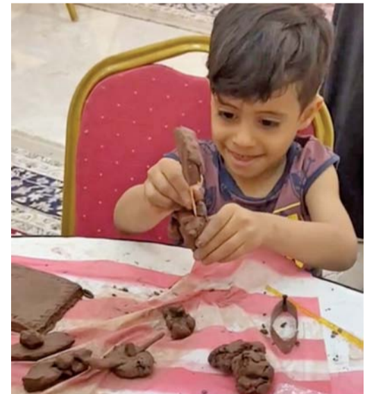
الحلقة استهدفت الأطفال الذين تتراوح أعمارهم من ١٠-٥ أعوام