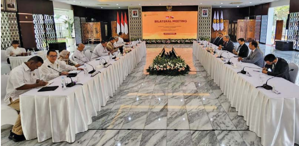
تعزيز التعاون وتبادل الخبرات في قطاعات الطاقة والمعادن مع إندونيسيا

مسقط . العمانية: بلغ إجمالي الإنتاج المحلي والاستيراد من الغاز الطبيعي بسلطنة عمان بنهاية شهر يونيو من العام الحالي نحو ٢٧ ملياراً و٥٨٦ مليوناً و٢٠٠ ألف متر مكعب بارتفاع نسبته ٥,٣ بالمائة مقارنة بنحو ٢٦ ملياراً و١٩٢ مليوناً و٣٠٠ ألف متر مكعب خلال نفس الفترة من العام الماضي. وبينت الإحصاءات الصادرة عن المركز الوطني للإحصاء والمعلومات أن المشاريع الصناعية استحوذت على ما نسبته ٦٤,٣ بالمائة من استخدامات الغاز الطبيعي بسلطنة عمان حتى نهاية شهر يونيو ٢٠٢٤م حيث بلغت الاستخدامات للمشاريع الصناعية ١٧ ملياراً و٧١٧ مليوناً و٣٠٠ ألف متر مكعب. وبلغ إجمالي استخدام الغاز الطبيعي لكل من حقول النفط ٥ مليارات و٤٢٨ مليوناً و١٠٠ ألف متر مكعب، ومحطات توليد الطاقة ٤ مليارات و٣١٦ مليوناً و٥٠٠ ألف متر مكعب، والمناطق الصناعية ١٢٤ مليوناً و١٠٠ ألف متر مكعب.