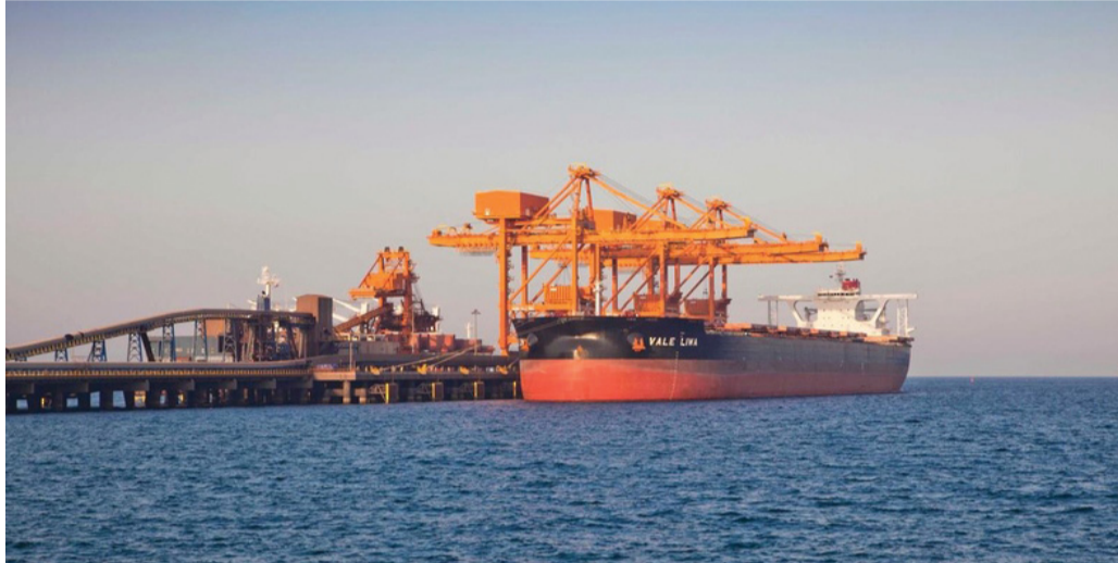
■ مركز توزيع فالي في سلطنة عُمان يتولى إدارة محطة بحرية بميناء صحر الصناعي

الأول من العام الجاري ارتفاعاً بلغ حوالي ٦١٠٩ علامات، بينما بلغ عدد براءات الاختراع في النصف الأول من العام الجاري ٤٢٨ اختراعاً. وأوضح أن زيادة الإقبال على تسجيل وتوثيق العلامات التجارية يأتي حرصاً من أصحاب العلامات التجارية على توثيق علاماتهم في الأسواق للمنافسة التجارية والحد من الغش والتلاعب، مشيراً إلى أن تقديم الطلب يتم عبر منصة عُمان للأعمال، وأكد على أهمية توثيق وتسجيل العلامة التجارية من أجل حماية حقوق المبدعين والحد من التزوير والغش التجاري والتقليد، والتميز في مجال السلع أو الخدمات. وأشار إلى أن ارتفاع الاهتمام بتسجيل العلامات التجارية في سلطنة عُمان يدل على زيادة الوعي المجتمعي بأهمية العلامة التجارية في قطاع الأعمال بوزارة التجارة والصناعة وترويج الاستثمار.