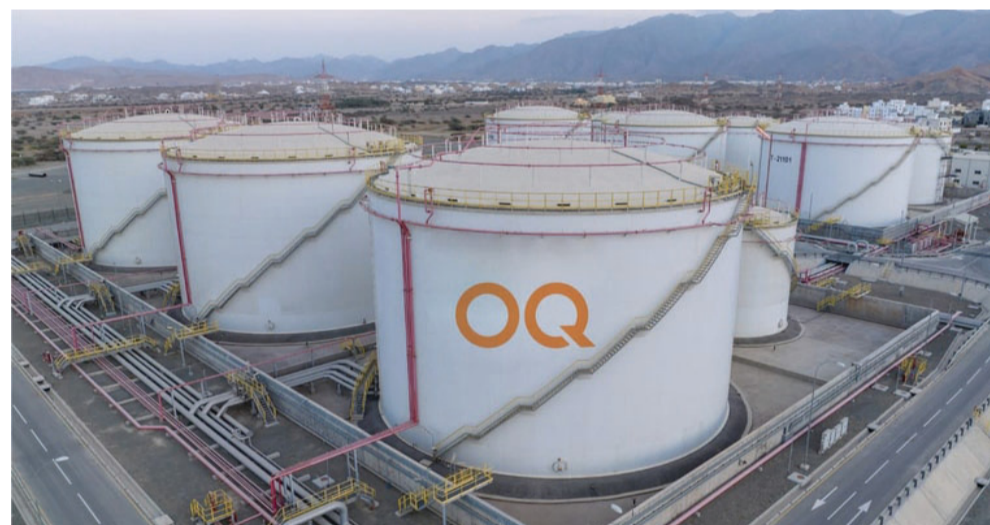
انخفاض طفيف في إنتاج المصافي والصناعات البترولية

سجلت مبيعاته مليوناً و٩٩٥ ألفاً و٢٠٠ برميل، وسجل إنتاج غاز البترول المسال ٤ ملايين و٤٨٤ ألفاً و٩٠٠ برميل في حين وصلت مبيعاته إلى ٥ ملايين و٣٣ ألفاً و٢٠٠ برميل. وفيما يخص البتروكيماويات توضح الإحصاءات ارتفاع إنتاج البنزين بـ ٦,٥ بالمائة مسجلاً ٨٣ ألفاً و٥٠٠ طن متري، فيما بلغ إنتاج الباراكسيلين ٢٦٥ ألفاً و١٠٠ طن متري مرتفعاً بما نسبته ٤,٦ بالمائة