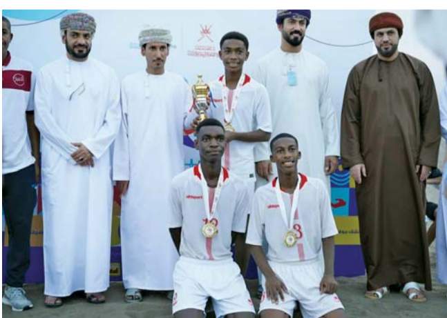
■ تتويج الفرق الفائزة في المسابقات

ولعبة شد الحبل، والكرة الطائرة الشاطئية، وكرة اليد النسائية، الصالات، واستعراض الخيالة، والطيران الشراعي، وحلقة تدريبية للإنعاش القلب لمستشفى بدر السماء الطبي، بعدها قام راعي الحفل بتكريم المركزين الأول والثاني لجميع الفعاليات. وقال الشيخ خالد بن عيسى الجنيبي نائب والي قريات، ما شهدت القافلة من فعاليات متنوعة رائعة جداً، حيث كان تنافس المشاركين في مختلف الألعاب مميز جداً، حظي باستحسان الحضور، واتقدم بالشكر لوزارة الثقافة والرياضة والشباب، ونادي قريات، والمشاركين والقائمين على الإعداد والتنفيذ للفعاليات لما بذلوه من جهود لإنجاح هذه القافلة.