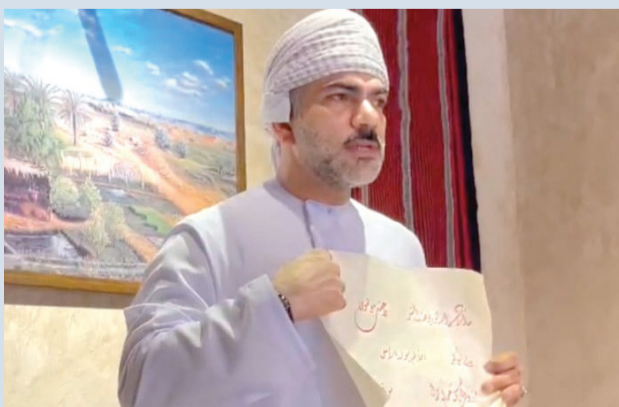
الحلقة تناولت جماليات الخط العربي

وكذلك أشار الأنصاري على أن الخط الجميل والواضح يدل على هدوء الأعصاب والتوازن