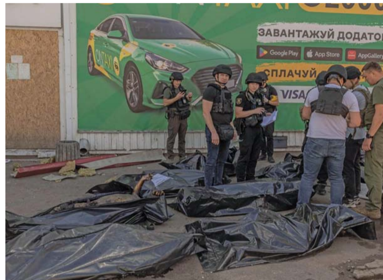
الشُرطة الأوكرانية تقف بجوار جثث قتلى في أعقاب غارة روسية بمنطقة دونيتسك الشريفة