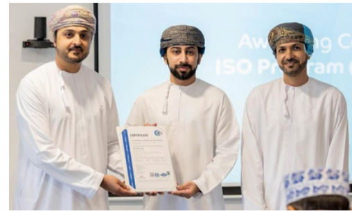
■ إحدى الشركات الحاصلة على اعتراف الأيزو