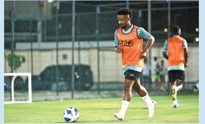
تدريباً لاعبي فريق صحار