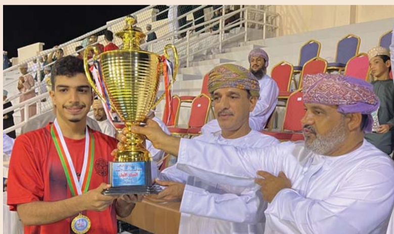
تتويج فريق النصر بطلا للبطولة