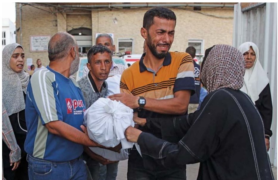
فلسطينيون ينتحبون أثناء نقل جثمان أحد أقاربهم من مستشفى المعداني لدفنه في أعقاب مجزرة التابعين أمس.