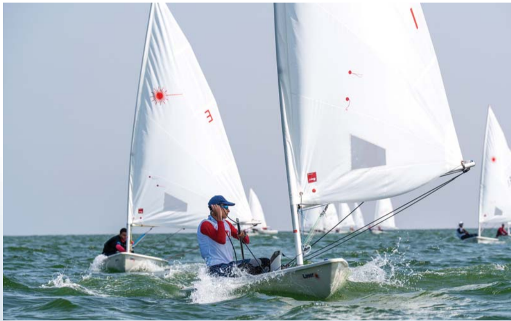
■ صورة أرشيفية من منافسات قوارب الإلكا