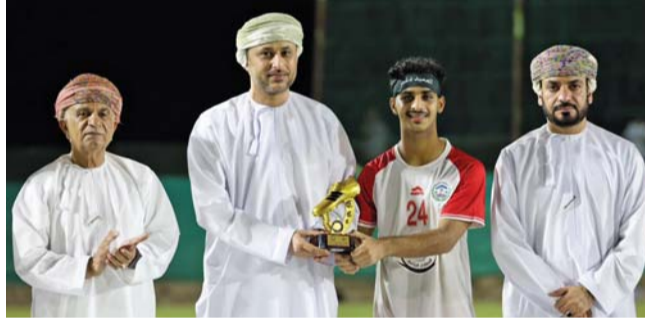
ويكرم اللاعبين المجددين في الدوري