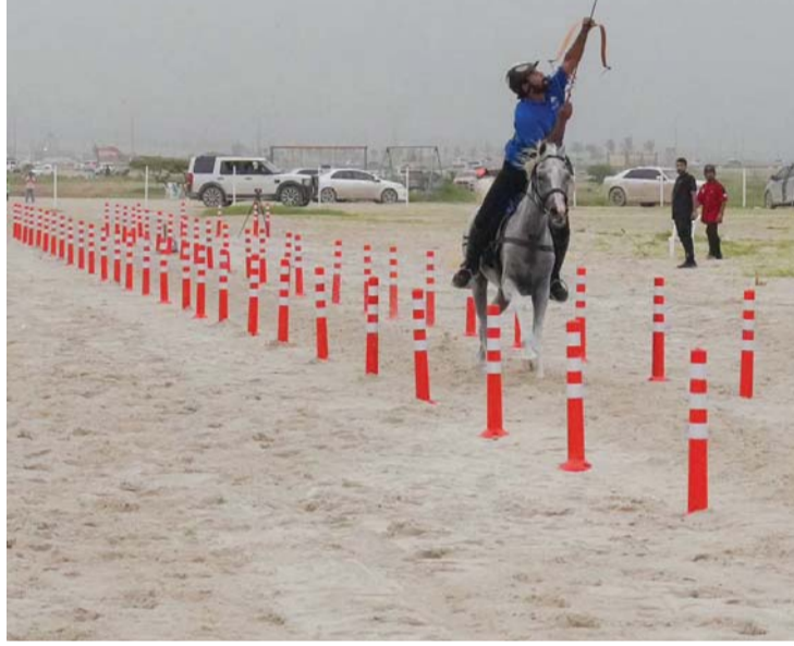
من منافسات البطولة

اختتمت بطولة الرماية بالقوس من على ظهر الخيل على ميدان الفروسية بسهل أتين، تحت رعاية محمد بن سعيد جداد رئيس مجلس إدارة شركة الخنجر للطور والبخور، وذلك ضمن فعاليات الفروسية بخريف ظفار، التي ينظمها الاتحاد العماني للفروسية والسباق، بالتعاون مع لجنة ظفار للفروسية وبشراكة ودعم من مكتب محافظ ظفار، وبلدية ظفار ودائرة المهرجان ببلدية ظفار، وشركة ظفار للسياحة وشركة مطاحن صلالة بمشاركة ١٨ فارساً. وشهدت البطولة منافسات قوية بين الفرسان عكست مدى استعدادهم لهذه البطولة التي ينظمها الاتحاد لأول مرة.