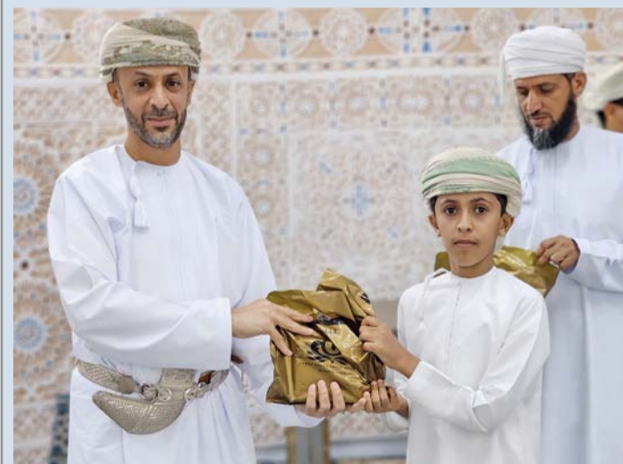
تكرم أحد الطلبة المجيدين