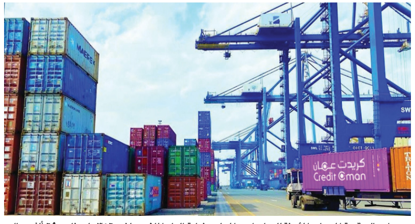
إجمالي قيمة المبيعات المؤمنة للصادرات والمحلي بنهاية العام الماضي بلغت ٣٥٦ مليوناً و٦٩٠ ألف ريال