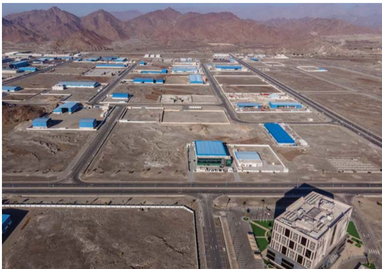
■ المحافظة تزخر بالعديد من المدن الصناعية الكبرى