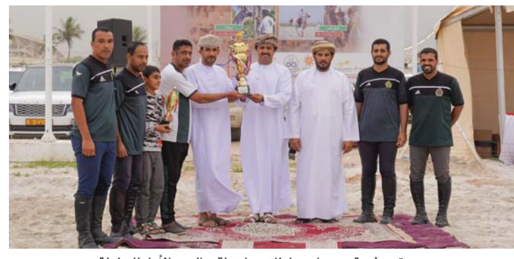
■ توج فريق مدرعات سلطان عمان بلقب اليوم الأول للبطولة