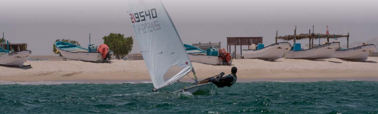
■ من تدريبات بحارة عمان للإبحار في المعسكر التدريبي برأس الحد