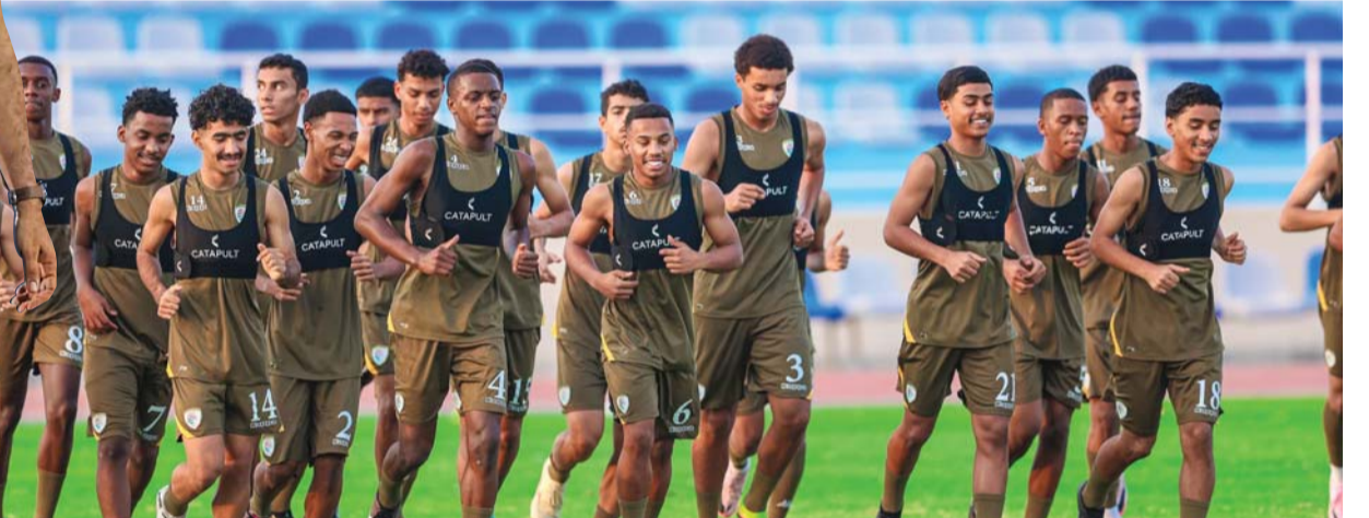
■ من تدريبات منتخبنا الوطني للناشئين لكرة القدم

■ تسحب اليوم الأربعاء قرعة بطولة اتحاد غرب آسيا الحادية عشرة التي يستضيفها الاتحاد الأردني لكرة القدم خلال الفترة من ٢ إلى ١١ سبتمبر المقبل والتي يشارك فيها منتخبنا الوطني للناشئين بجوار منتخبات الأردن المستضيف والبحرين وسوريا والعراق وفلسطين ولبنان واليمن والسعودية، وسيتم توزيع المنتخبات الـ ٩ على ثلاث