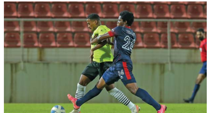
■ من مباراة النصر والوكيل

من أنهى الفريق الكروي الأول بنادي النصر مباراته الودية الثانية في إطار استعداداته للموسم الكروي ٢٠٢٤/٢٠٢٥ والتي خاضها مساء أمس الأول أمام نادي الوكيل القطري بالفوز ١/٤، وهي نتيجة كبيرة شهدت تألق العديد من الأسماء الجديدة التي ضمها الفريق في هذا الموسم والتي يأمل من خلالها العودة لمنصات التتويج التي غاب عنها طويلاً وخصوصاً في الدوري.. المباراة تعد التجربة قبل الأخيرة للفريق قبل صافرة بداية دوريها في الخامس عشر