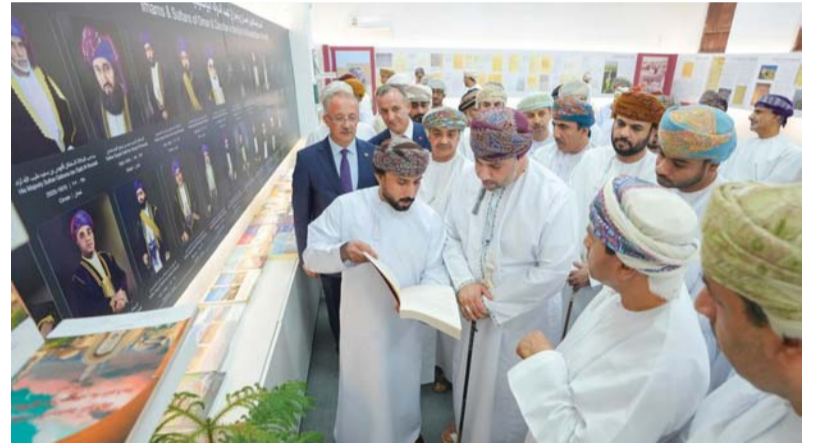
ركن عمان عبر التاريخ يتناول حكم النباهنة ودولة اليعاربة والدولة في عصر البوسعيديين حتى عصر النهضة المباركة