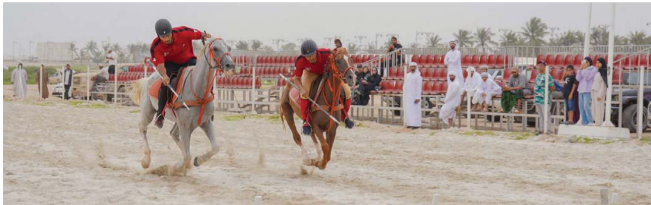
■ إثارة ومناصفة قوية شهدت البطولة