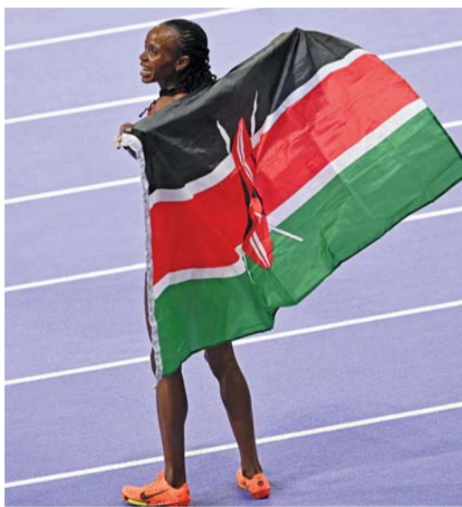
■ الكينية بياتريس تشيببت تحتفل بعد فوزها بنهائي سباق ٥٠٠٠ متر في أولمبياد باريس.

والأمر ذاته بالنسبة للإيطالية ناديا باتوتشيلتي التي نالت البرونزية بعدما أنهت السباق في المركز الرابع. لكن كيببيغون استعادت الفضية عقب استئنائها قرار إقصائها بحسب ما أفاد