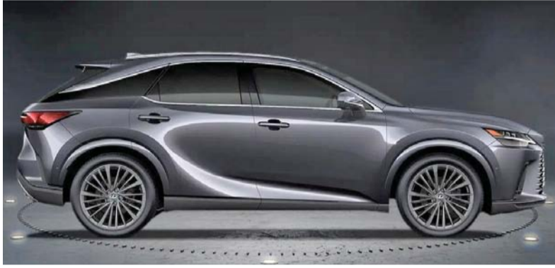
لكرس بمظهرها الساحر وأدوات التحكم المريحة عالية التقنية

إجمالية تبلغ ٢٤٧ حصاناً ويقترن بناقل حركة متغير نو تعنيق مستمر يتم التحكم فيه إلكترونياً وقود تبلغ ٢٠,٧ كم لكل لتر و يتوفر أيضاً نظام كهربائي هايبرد يجمع بين محرك توربيني سعة ٢,٤ لتر ومحرك كهربائي، والذي يوفر قوة مشتركة تبلغ ٣٦٦ حصاناً مقترنة بناقل حركة آلي نو ٦ سرعات. وتمثل لكرس آر إكس الفئة الرائدة بمظهرها المميز وخطوطها الجريئة وتصميماتها المذهلة من خلال شاشة العرض الأمامية وشاشة الرؤية بانورامية ومرآة الرؤية الخلفية الرقمية ونظام الصوت المحيطي الفاخر مارك ليفنسون ونظام ترفيه للمقاعد الخلفية مقاس ١٢,٣ بوصة مع سماعتين ونظام المزلاج الإلكتروني المدمج. وتمنح لكرس الأولوية لسلامة الركاب وتوفر أحدث ميزات السلامة التي تلي أنق التفاصيل مثل منظمات المصابيح الأمامية لتحقيق رؤية واضحة أثناء الظروف الجوية غير المستقرة وهي مجهزة بسنة وسائد هوائية للسائق والركاب، ووسائد هوائية ستائرية جانبية، ونظام مكابح آلية أوتوماتيكية، وتقنيات المساعدة على تغيير المسار، ونظام مراقبة النقطة العمياء ونظام تعليق متغير متكيف، ومساعد الحفاظ على المسار تتبع المسار بالإضافة إلى نظام دخول مضاء بالاهتزاز متعدد نظام استشعار السلامة بالألوان من لكرس، نظام ما قبل الاصطدام، نظام تثبيت السرعة التكيفي، تنبيه مغادرة المسار وأربعة أجهزة استشعار أمامية وخلفية لركن السيارة.