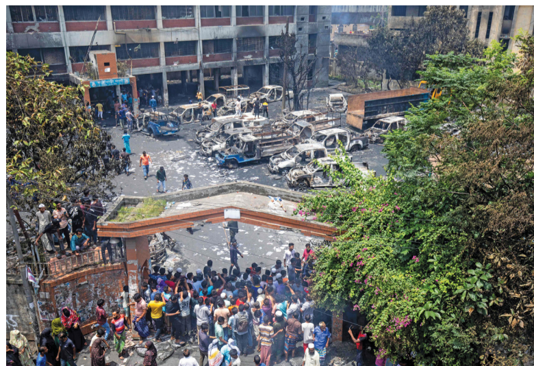
أشخاص يتجمعون لرؤية مركز شرطة جاترا بارباري المحترق، حيث أشعل المظاهرون النار فيه خلال الاحتجاجات التي شهدتها العاصمة البنجلاديشية دكا.