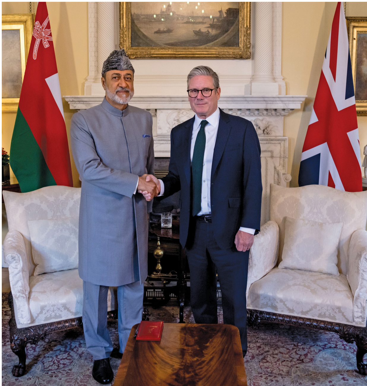
جلالة السلطان ورئيس وزراء المملكة المتحدة يتبادلان وجهات النظر حول مستجدات الأحداث الجارية في الساحتين الإقليمية والدولية والقضايا ذات الاهتمام المتبادل في مقر رئاسة مجلس الوزراء بالعاصمة لندن