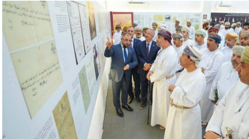
المعرض يسلط الضوء على العلاقات الدبلوماسية بين سلطنة عُمان والجمهورية التركية