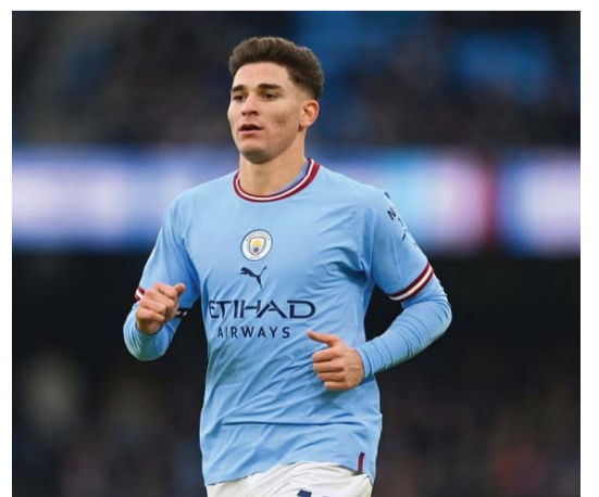
■ خوليان ألفاريس

لندن. أ. ف. ب. يبدو أن الأرجنتيني خوليان ألفاريس، مهاجم مانشستر سيتي الإنجليزي، في طريقه للانتقال إلى أتلتيكو مدريد الإسباني في صفقة ضخمة كما أشارت وسائل إعلام إنجليزية أمس الثلاثاء، وتحدثت التقارير أن أتلتيكو سيدفع مبلغا مقداره ٨١ مليون جنيه استرليني (١٠٤ ملايين دولار) للحصول على خدمات بطل العالم الذي شارك مع منتخب بلاده في كوبا أميركا الأخيرة عندما توجت باللقب وفي دورة الألعاب الأولمبية المقامة حاليا في باريس حيث خرج فريقه من الدور ربع النهائي، وكان ألفاريس انتقل إلى صفوف مانشستر سيتي مقابل ١٤ مليون جنيه استرليني فقط، قادما من ريفر بلايت في يناير ٢٠٢٢ وتوج في صفوفه بطلا لإنجلترا مرتين وبوري أبطال أوروبا. بيد أن ألفاريس شارك احتياطيا في معظم مباريات فريقه، نظرا لتواجد الهدف النرويجي إرلينج هالاند في خط المقدمة، وعلى الرغم من ذلك سجل في صفوفه ٣٦ هدفا على مدار موسمين. وسيلعب ألفاريس في حال انتقاله رسميا، بإشراف مواطنه المدرب دييجو سيميوني وسجل بدلا من المهاجم الإسباني ألفارو موراتا المنتقل إلى ميلان الإيطالي، ويسعى أتلتيكو مدريد إلى تعزيز صفوفه لمنافسة العملاقين ريال مدريد وبرشلونة بعد حلوله رابعا في الموسم الماضي. وسبق لفريق العاصمة أن حصل على خدمات المهاجم الآخر النرويجي ألكسندر سورلوث وقلب دفاع منتخب إسبانيا الفائز بكأس أوروبا روبان لو نورمان.