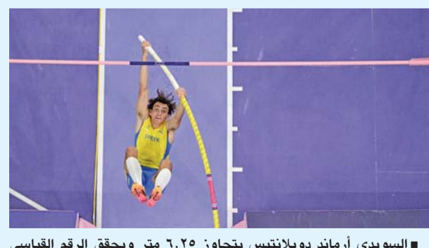
■ السويدي أرماند دوبلانتيس يتجاوز ٦,٢٥ متر ويحقق الرقم القياسي العالمي الجديد في نهائي القفز بالزانة للرجال في دورة الألعاب الأولمبية باريس ٢٠٢٤ باستناد سان دوني.

تحطيم رقمه القياسي للمرة التاسعة في سلسلة استهلها في لقاء تورون البولندي في ٨ فبراير ٢٠٢٠. وحسم ابن ٢٤ عاماً الذهبية بعدما كان الوحيد الذي نجح في تجاوز الستة أمتار قبل أن يحطم بعدها رقمه القياسي العالمي بتسجيله ٦,٢٥ م. وتقدم على الأمريكي سام كندريكس (٥,٩٥ م) واليوناني إيمانويل كارليس (٥,٩٠ م) اللذين نالا الفضية والبرونزية تواليًا. وبات دوبلانتيس ثالث لاعب في القفز بالزانة إن كان عند الرجال أو السيدات يتوج باللقب الأولمبي مرتين على التوالي بعد الأمريكي بوب ريتشاردز (١٩٥٢ و ١٩٥٦) والروسية يلينا إيسينبايفا (٢٠٠٤ و ٢٠٠٨).