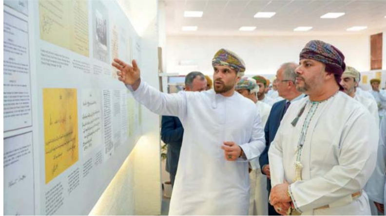
المعرض ضم بين جنباته سبعة أركان رصينة المحتوى

افتتح صاحب السمو السيد مروان بن تركي آل سعيد محافظ ظفار مساء أمس الأول المعرض الوثائقي (ذاكرة وطن في أرض اللبان) بمحافظة ظفار ضمن فعاليات عودة الماضي (السعادة)، الذي تنظمه هيئة الوثائق والمحفوظات خلال ٥-٢١ أغسطس الجاري. يهدف المعرض إلى نشر المعرفة من خلال إكساب الكفاءات الوطنية المعارف والعلوم، وتنمية التواصل والترابط بالمجتمع المحلي والمجتمعات الأخرى. كما يأتي المعرض تأكيداً من الهيئة لما للوثائق من ضرورة وأهمية في البحث العلمي والإبداع الفكري. حضر الافتتاح معالي البروفيسور أوغور أونال رئيس أرسيف الدولة برئاسة الجمهورية التركية، وسعادة السفير التركي محمد حكيم أوغلو سفير الجمهورية التركية لدى سلطنة عُمان، وسعادة الدكتور حمد بن محمد الضوياني رئيس هيئة الوثائق والمحفوظات الوطنية، وعدد من المسؤولين والمسؤولين والشيوخ والشهراء. يوثق المعرض الوثائقي الذي يضم أكثر من ١٣٠٠ وثيقة (مطبوعة ورقمية) الدور الحضاري والتاريخي للسلطنة عبر حقبة زمنية مختلفة، ودور العُمانيين في الإسهام الحضاري بالحضارة الإنسانية، إلى جانب التعريف بالدور التاريخي والحضاري الذي قامت به محافظة ظفار عبر حقبة زمنية مختلفة. ويسلط المعرض الضوء على العلاقات الدبلوماسية بين سلطنة عُمان والجمهورية التركية ويستعرض عدداً من الوثائق التاريخية والرسائل والبرقيات الدبلوماسية بين البلدين. ويضم المعرض بين جنباته سبعة أركان. ■■