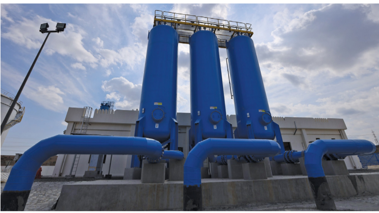
أحد المشروعات الاستراتيجية التي تنفذها الشركة

في تنفيذها إلى مراحل متقدمة وبتكلفة إجمالية تبلغ ١٢٥ مليون ريال عماني، ويبدأ المشروع من محطة تحلية المياه الجديدة في أصيلة بولاية جعلان بني بو علي بمحافظة جنوب الشرقية وينتهي في ولاية المضياي بشمال الشرقية حيث يغذي المشروع ولايات المحافظتين من خلال مد خطوط من الأنابيب يبلغ إجمالي أطوالها ٣١٢ كيلو متراً وإنشاء ٤ محطات ضخ جديدة بالإضافة إلى تعزيز ٣ محطات قائمة وإنشاء ١٧ خزاناً للمياه على طول الخط الناقل بإجمالي سعة تخزينية تصل إلى ٢٦٥ ألف متر مكعب، كما يتضمن المشروع جميع الأعمال المدنية والميكانيكية والكهربائية، والأنظمة اللازمة للمراقبة والتحكم في منشآت المشروع. ومن المشاريع الاستراتيجية التي تعمل نماء لخدمات المياه على تنفيذها حالياً مشروع حلول المياه طويلة الأمد لولاية السيب بتكلفة ٤٥ مليون ريال عماني ونسبة إنجاز بلغت ٤٦ بالمائة، ومن المتوقع الانتهاء من المشروع في الربع الأخير من العام المقبل ٢٠٢٥ م. وأوضح مدير عام المشاريع للقاعات الأوسط والغربي ببناء لخدمات المياه أن المشروع يشتمل على أعمال إنشائية لخزانات مياه في كل من: الخوض السادسة، والرسل، وقرية الخوض. مشيراً إلى أن المشروع يتضمن