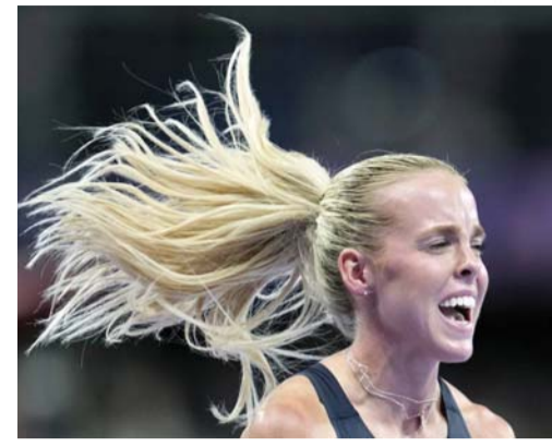
■ كيلي هودجكينسون

باريس. أ. ف. ب. أ: حازت البريطانية كيلي هودجكينسون ذهبية سباق ٨٠٠ م في الألعاب الأولمبية في باريس ٢٠٢٤. وسجلت هودجكينسون (٢٢ عاماً) وقتاً قدره ١:٥٦,٧٢ دقيقة، متقدمة على الإثيوبية تسيغي دوغوما صاحبة الفضية (١:٥٧,١٥ د) والكينية ماري مورا التي اكتفت بالبرونزية (١:٥٧,٤٢ د). وفي غياب حاملة اللقب الأمريكية اثنيغ مو، ارتقت هودجكينسون إلى التوقعات كاحدى أبرز المرشحات لنيل المعدن الأصفر. حيث سيطرت على السباق بشكل شبه كامل