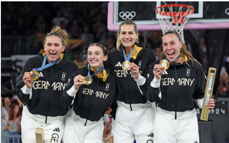
■ المنتخب الألماني للسيدات المتوج بذهبية كرة السلة الثلاثية في أولمبياد باريس.