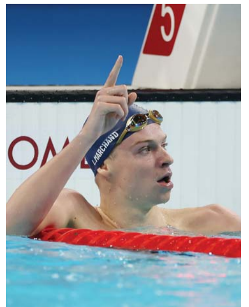
■ ليون مارشان خلال مشاركته في مسابقة السباحة

عبرت العلامة التجارية الراقية أوميغا مؤخرا عن سعادتها بتألق سفير علامتها الفرنسي ليون مارشان الذي واصل حصد الذهب في منافسات أولمبياد باريس ٢٠٢٤ حيث فاز بميداليتين ذهبيتين وحقق رقمين أولمبيين جديدين، الأول رقم أولمبي جديد في سباق ٢٠٠ متر فراشة رجال، هو ١:٥١,٢١ والثاني رقم أولمبي جديد في سباق ٢٠٠ متر صدر رجال، هو ٢:٠٥,٨٥، كما حقق ميدالية ذهبية ثالثة وثالث رقم قياسي أولمبي في هذه النسخة من الألعاب الأولمبية.