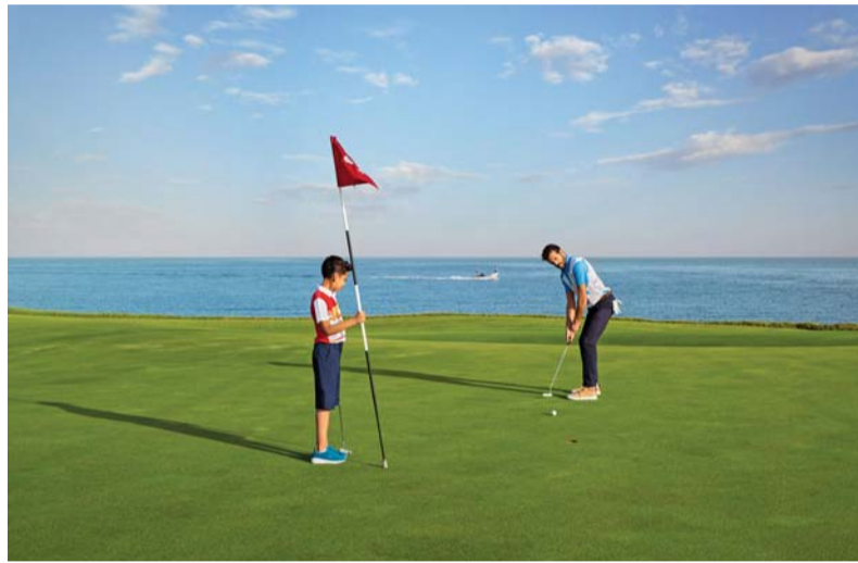
الموج مسقط بناء مجتمع نابض بالحياة

مناطق خضراء بمساحة تزيد عن ٢٦٥,٠٠٠ متر مربع و١٨ حديقة ما يرسخ التزامه المستمر بحماية البيئة والذي يعكس على اهتمامه بنشر الشباب المرجانية الصناعية بطول ٤٠,٠٠٠ متر مربع بالتعاون مع وزارة الثروة الزراعية والسمكية. كما استقطب منذ افتتاحه، استثمارات أجنبية مباشرة تتجاوز قيمتها ٨٨٣ مليون دولار أميركي (أي ما