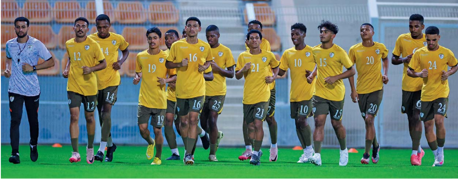
■ من تدريبات منتخبنا الوطني للشباب لكرة القدم