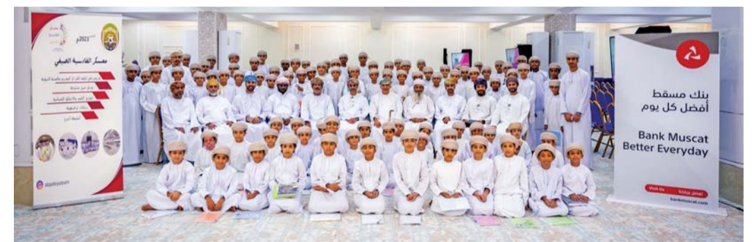
المشاركون في برنامج الثقافة المالية من بنك مسقط

وسلط الفريق الضوء على مواضيع مختلفة حول الثقافة المالية وحرصوا على تعريف المشاركين بمحتوى برنامج أكاديمية ماليات والذي يتضمن خمسة فصول، تناول الأول منها موضوع اتخاذ القرارات السليمة وتناول الفصل الثاني موضوع تعلم كسب المال بينما ركز الفصل الثالث على موضوع الإنفاق والإندثار ويسلط الفصل الرابع الضوء على موضوع تنمية أموالك في حين يركز الفصل الخامس على موضوع العطاء كما تم التركيز على دمج المعلومة مع الأنشطة التفاعلية لتسهيل إيصال الفكرة إلى المشاركين كما أن هذه الحلقة جاءت استكمالاً لحلقات أخرى نظّمها بنك مسقط مؤخراً في عدد من المدارس بمحافظة مسقط، ليصبح بهذا إجمالي عدد المستفيدين من الورش أكثر من ١٥٠ مشاركاً. يولي بنك مسقط مجال الاستدامة والمسؤولية المجتمعية اهتماماً كبيراً ويحرص على تعزيز ثقافة الوعي المالي ونتائجها الإيجابية لمختلف فئات المجتمع