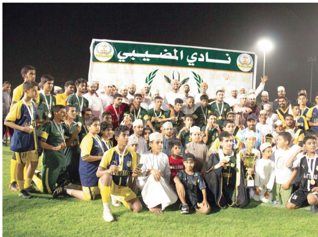
من تتويج فريق الاتحاد ببطولتي الشباب والناشئين