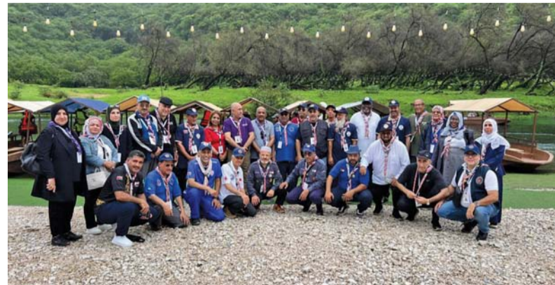
التعريف بأدوار رؤاد حركة الكشافة والمرشدات

يذكر أن الملتقى الكشفي العربي لرؤاد الكشافة والمرشدات والملتقى الكشفي العربي لتمكين الشباب زائر بالعديد من البرامج التدريبية والترفيه المتنوعة في الأيام القادمة.