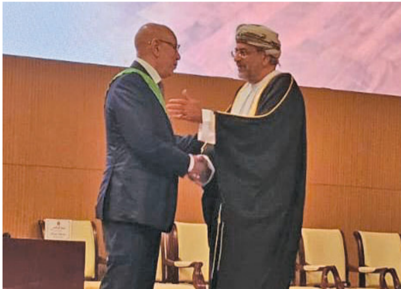
وزير الاقتصاد أثناء الحفل في تنصيب الرئيس الموريتاني

التعليم العالي: ٢٧٤ متقدما للجائزة الوطنية للبحث العلمي