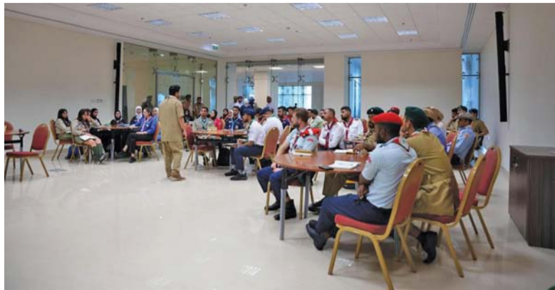
تعزيز فكرة التواصل بين الأجيال للمشاركين

للتحديات والفرص المتاحة، وهدفه هو العودة بأفضل الممارسات والابتكارات التي يمكنني نقلها وتطبيقها في جمعيتي الوطنية، والإسهام في تحقيق تقدم ملموس وإيجابي للشباب العربي، كما أسعى أيضاً لبناء شبكة علاقات قوية مع قادة وشباب من مختلف الدول العربية، مما يمكنني من التعاون المستقبلي وتبادل الخبرات بشكل مستمر.