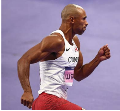
الكندي داميان وارنر خلال مشاركته في سباق العشاري ٤٠٠ متر للرجال.