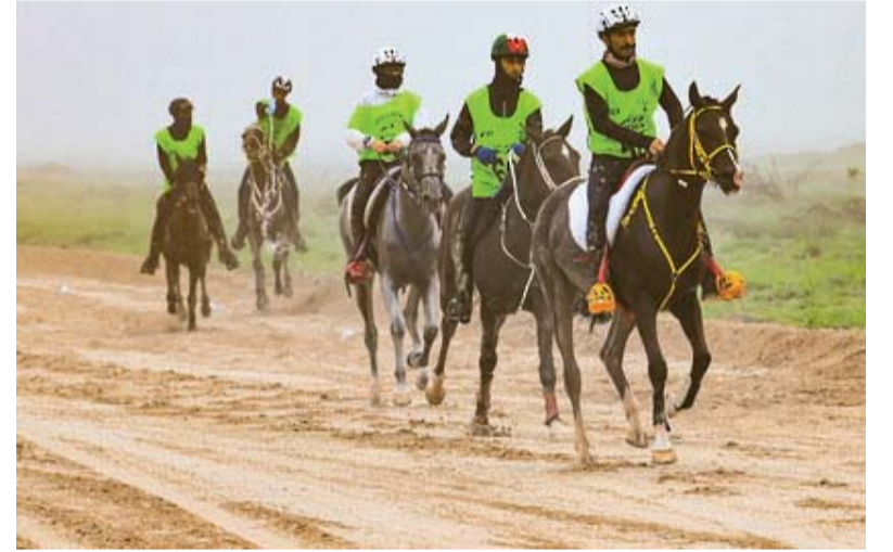
الفرسان المشاركون في السباق