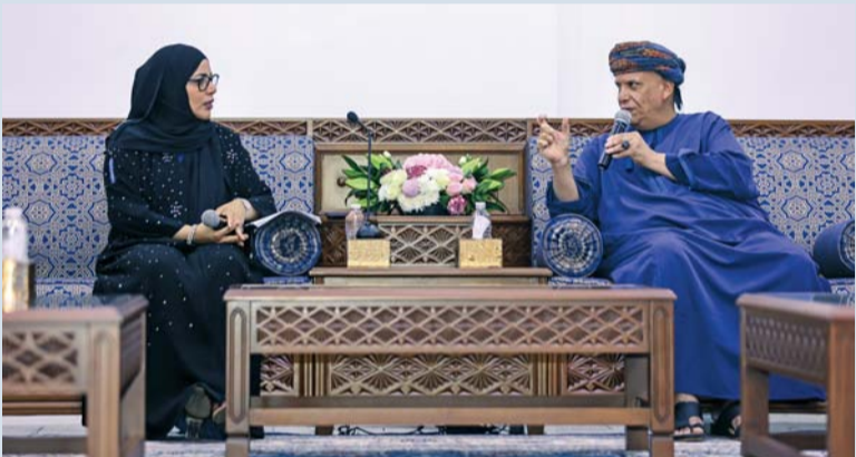
الجلسة عرفت بالأثر والدراما والتشكيل ومدى تأثيرها على الوعي الثقافي