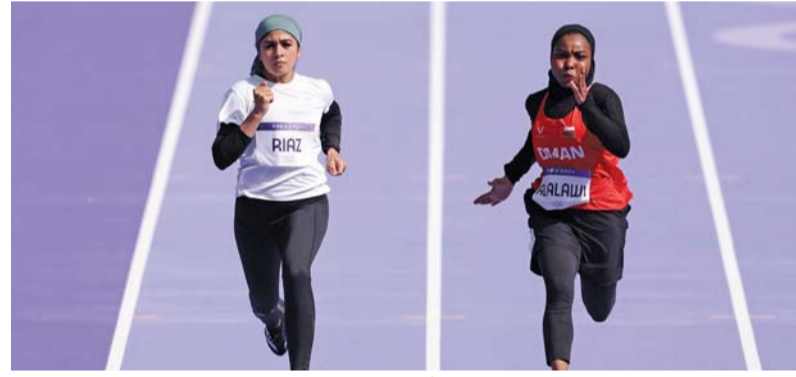
■ مزون العلوية أثناء مشاركتها في السباق

وحول مشاركته في هذه النسخة من الأولمبياد قال شعيب الزدجالي: «تأتي مشاركتي في دورة الألعاب الأولمبية باريس ٢٠٢٤ كضابط فحص المنشطات، حيث إنني جزء من فريق متخصص تنافسوا للحصول على هذا الشرف، وتمكنت من اجتياز جميع الاختبارات والشروط المطلوبة،