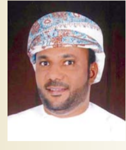
خالد الداودي شاعر عماني