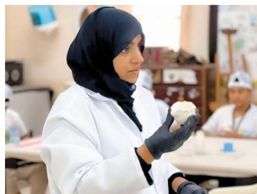
أميرة الناصرية شاركت في العديد من المعارض ببصماتها وتشكيلاتها الفنية

الاساسية والصحيحة في إنتاج أعمال ذو قيمة هادفة والاستخدام الامثل للخامات البيئية والتي وجدت كل التشجيع والقبول سواء في المحيط المحلي والخليجي بإنتاج أعمال زخرفية وفنية متقنة تستخدم كهدايا وزينة للبيوت بجانب صناعة العطور والبخور برائحتها الزكية التي تفوح في مختلف المناسبات الاجتماعية.