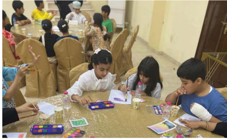
إحدى فعاليات البرنامج الصيفي بشناص