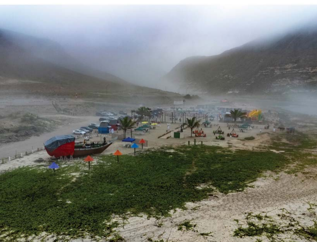
مشاريع رواد الأعمال تشكل إضافة نوعية لموسم الخريف

بإضافة إلى دليل ترويجي إلكتروني يتضمن أكثر من ٣٠ مؤسسة صغيرة ومتوسطة ومشروع نشط في مختلف المواسم وتقديمها كقصص نجاح ملهمة في المحافظة وفي سلطنة عمان. كما تتضمن الحملة الترويج لعدد من المؤسسات الصغيرة والمتوسطة والنوادر الإسلامية المجتمعية بنهاية مايو من العام الحالي حوالي ٧,٦ مليار ريال عماني أي ما نسبته ١٨,١٪ من إجمالي أصول القطاع المصرفي في سلطنة عمان مسجلة ارتفاعاً