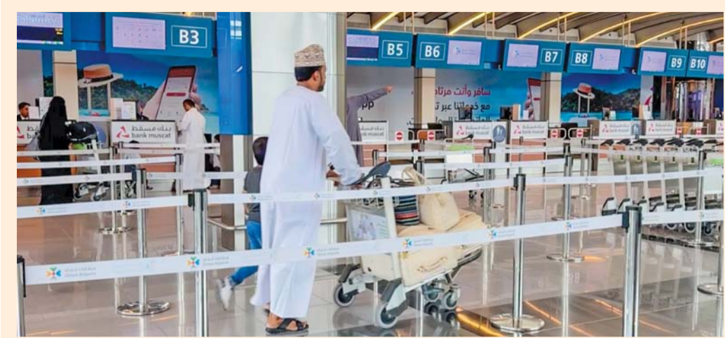
ارتفاع حركة المسافرين بمطار صلالة