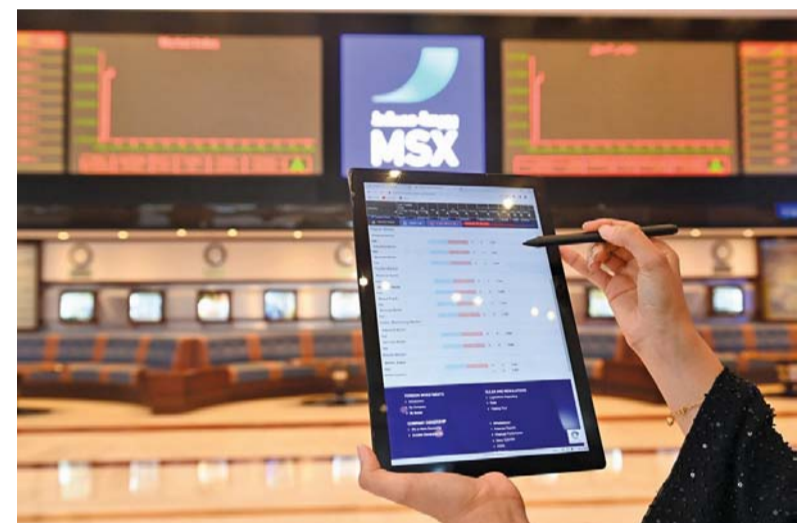
ارتفاع أسعار الأسهم وأحجام وقيم التداول

مسقط. العمانية: رفعت المؤسسات الاستثمارية المحلية مشترياتها ببورصة مسقط الأسبوع الماضي لتدفع المؤشر الرئيس للبورصة للصعود مع ارتفاع أسعار الأسهم وأحجام وقيم التداول وصعدت قيمة التداول الأسبوع الماضي إلى حوالي ١٦٠,٢ مليون ريال عماني مقابل ١٤,٧ مليون ريال عماني في الأسبوع الذي سبقه مسجلة زيادة بنسبة ٩,٥ بالمائة، وارتفع عدد الصفقات المنفذة من ٢٧٧٨ صفقة إلى ٣٥٢١ صفقة. واستحوذت مشتريات المؤسسات الاستثمارية المحلية خلال الأسبوع الماضي على ٧٣ بالمائة من إجمالي قيمة التداول مقابل مبيعات بنسبة ٢٦,٨ بالمائة من التداولات، ودفعت طلبات الشراء من المؤسسات الاستثمارية المحلية أسعار الأسهم إلى الصعود لتدفع المؤشر الرئيس للبورصة والمؤشرات القطاعية لتحقيق مكاسب جديدة بعد التراجعات التي شهدتها في الأسابيع الماضية. وسجل المؤشر الرئيس لبورصة مسقط الأسبوع الماضي ارتفاعاً بنحو ١١ نقطة وأغلق على ٤٦٦٧ نقطة مستأنفاً صعوده بعد أسبوعين من التراجع، وسجل مؤشر القطاع المالي أفضل صعود مرتفعاً ٦١ نقطة، وارتفع المؤشر الشرعي بنحو ٣ نقاط، وارتفع مؤشر قطاع الصناعة