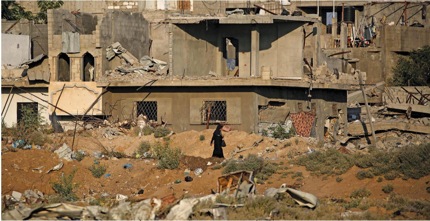
فلسطينية تسير بجوار أنقاض المباني التي دُمّرت خلال القصف الإسرائيلي، بالقرب من مخيم المغازي للاجئين بغزة.