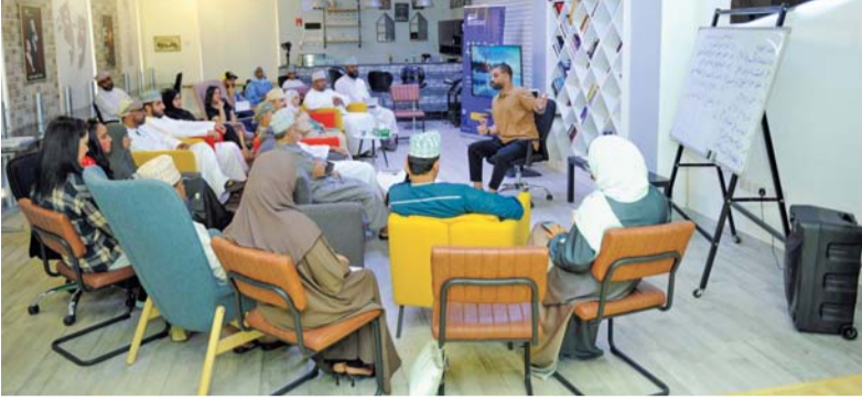
الفعاليات تضمنت عروضاً متنوعة للأفلام السينمائية السورية