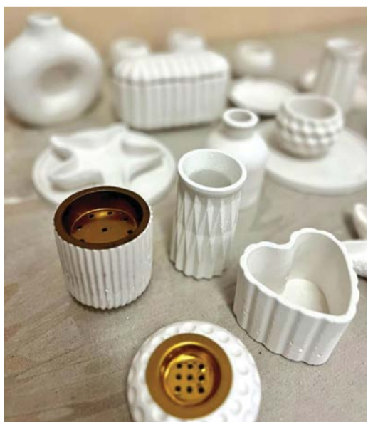
الخامات البيئية مصدر رئيسي في كافة نتاج أعمالها المتنوعة