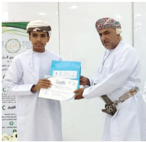
تكريم الطلبة المشاركين في البرامج الصيفية