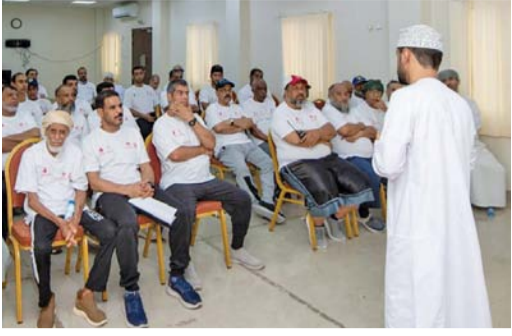
تعزيز الروابط الاجتماعية بين كبار السن