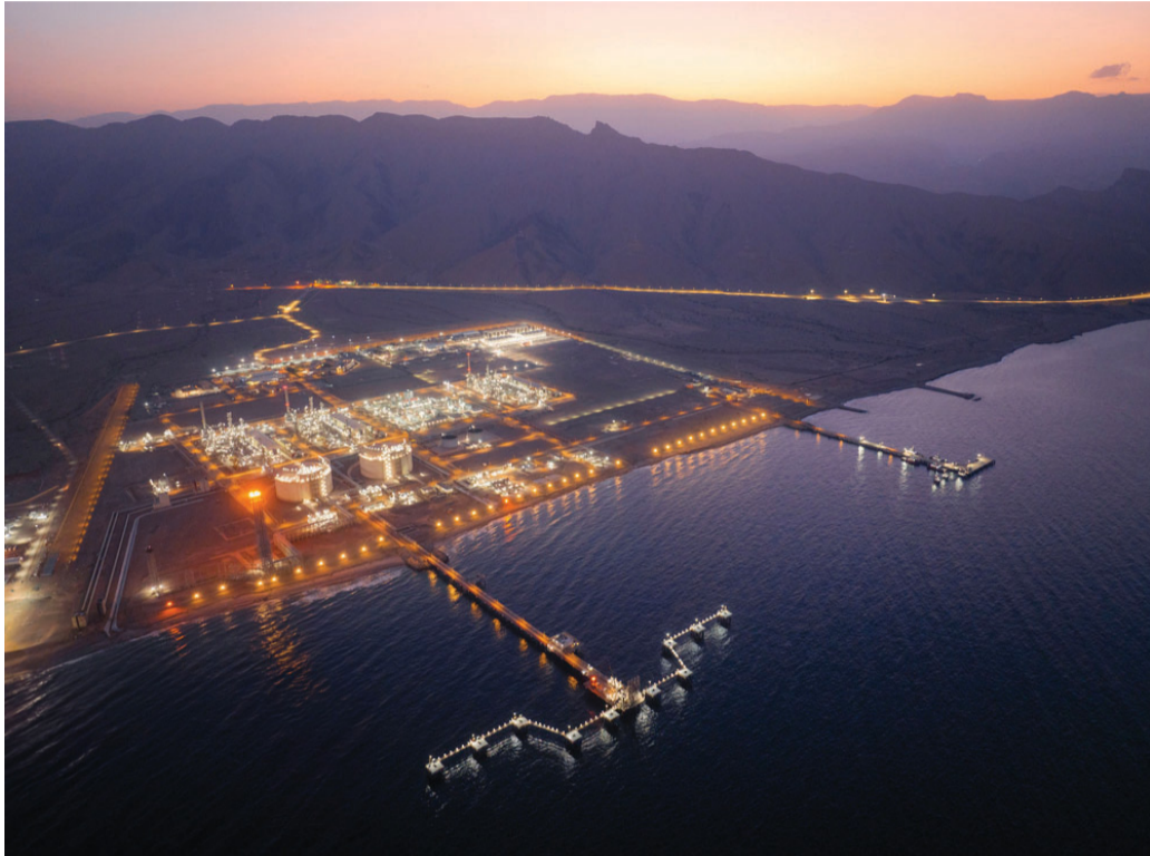
القاطرة الجديدة سترفع إنتاج سلطنة عُمان من الغاز المسال إلى ١٥,٢ مليون طن سنوياً

مرافق وخدمات حديثة. حققت مجموعة عمران نمواً قياسيًّا في أدائها المالي خلال عام الماضي لتسجل صافي ربح بواقع ٣١,٦ مليون ريال عماني، بنسبة نمو تبلغ ١٩٩ بالمائة مقارنة بعام ٢٠٢٢ كما سجلت المجموعة نمواً في إيراداتها خلال العام الماضي بنسبة ٤٤,٦ بالمائة لتبلغ ٧٠,٤ مليون ريال عماني، فيما بلغ إجمالي قيمة أصول المجموعة نحو ٦٧١ مليون ريال عماني.