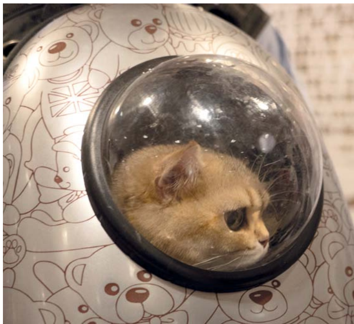
قطعة تظهر داخل علبة زجاجية داخل متحف شنغهاي بالصين، حيث أقيمت أول أمسية للقطط وسط عروض مميزة وحضور لافت.

مانيلا. د ب أ: قالت قوات خفر السواحل الفلبينية أمس إن الغواصين قاموا بإغلاق تسعة صمامات تسبب التسريب في ناقلة للنفط غرقت في الفلبين، وذلك لمنع تسرب المزيد من شحنتها في خليج مانيلا. وكانت الناقلة ام تي تيرا نونفا تحمل ١٤ مليون لتر من الوقود الصناعي عندما غرقت الخميس الماضي في خليج مانيلا قبالة بلدة ليماي في إقليم باتان، غرب العاصمة. وقال المتحدث باسم خفر السواحل ارماند باليلو إن الغواصين التابعين لشركة إنقاذ خاصة، استعان بها ملاك الناقلة، وضعا حتى الآن طبقتين من مانع التسرب حول صمامات التسرب، ويراقبون الوضع لمعرفة ما إذا كانت الطبقات ستصمد أم لا. وقال باليلو إن طول البقعة النفطية ربما تقلص إلى ٣ كيلومترات مقارنة بـ ١٤ كيلومتراً أمس الأول السبت، بعد استخدام مصاد تنشيت لاحتواء البقعة.