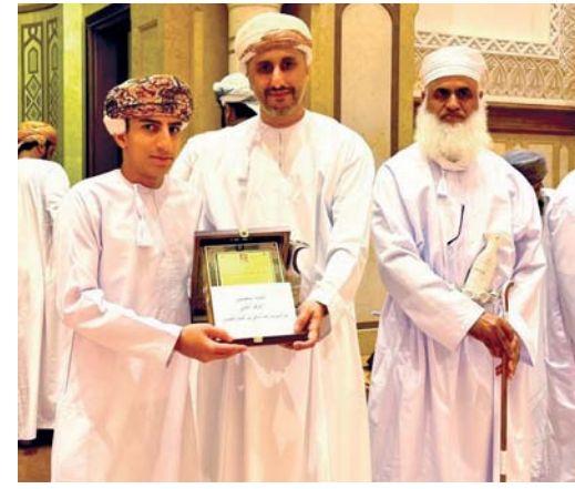
تكريم أحد الفائزين في المسابقة

وقال الشيخ سيف بن سلطان الغافري: يجد الأهالي صعوبة في قضاء أي خدمة ضرورية أو على سبيل المثال أعطال المركبات أو إصلاح الأبواب والنوافذ