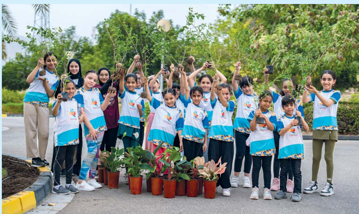
صورة جماعية للمشاركين في إحدى المبادرات

وتهدف هذه المبادرات إلى رفع مستوى الوعي الصحي والنفسية وتعزيز الصحة العامة إضافة إلى إشراك فئات المجتمع التطوعي مع الجهات الحكومية.