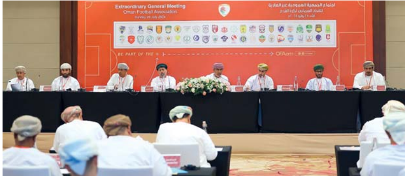
أعضاء مجلس إدارة الاتحاد خلال الاجتماع