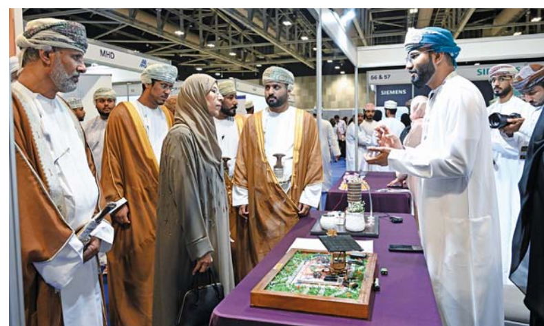
إبراز المشاريع الطلابية في المعرض