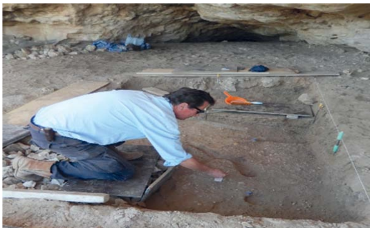
أعمال التنقيب الفعلية تبدأ بإزالة طبقات التربة والكشف عن القطع الأثرية والهيكل