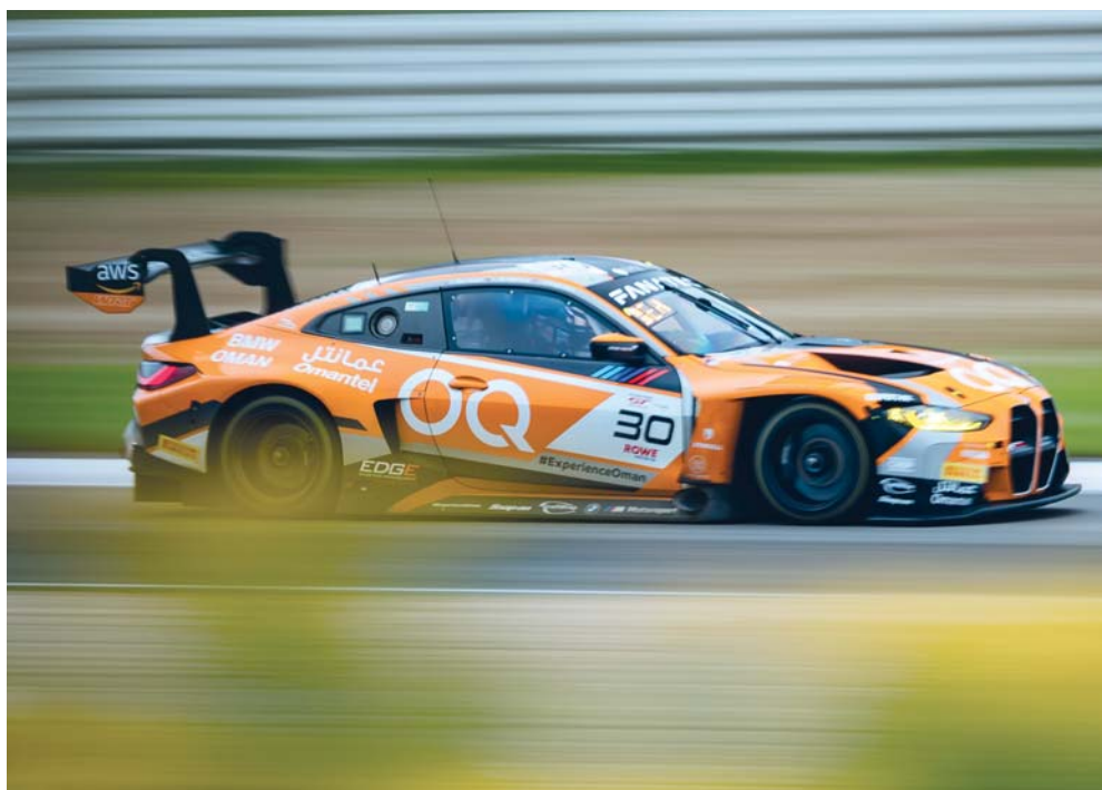
سيارة فريق عمان للسباقات خلال المشاركة في السباق

أسدل الستار على مباريات بطولة دوري الهواة (شجع فريقك) بالداخلية بإقامة المباراة النهائية على الملعب الرئيسي بالمجمع الرياضي بنزوى بقاء جمع طرفي النهائي بين فريقي السد (إزكي) وهيل (سمائل) وذلك تحت رعاية سعادة سالم بن حمد المحروقي عضو مجلس الشورى ممثل ولاية آدم بحضور ممثلي الفرق المشاركة واللجنة المنظمة، وقد اتسمت المباراة بالندية والإثارة وسط حضور جماهيري من محبي الفريقين، وسعى كل فريق بإحراز هدف التقدم مع عدد من الفرص المهددة وفي الدقيقة ٦١