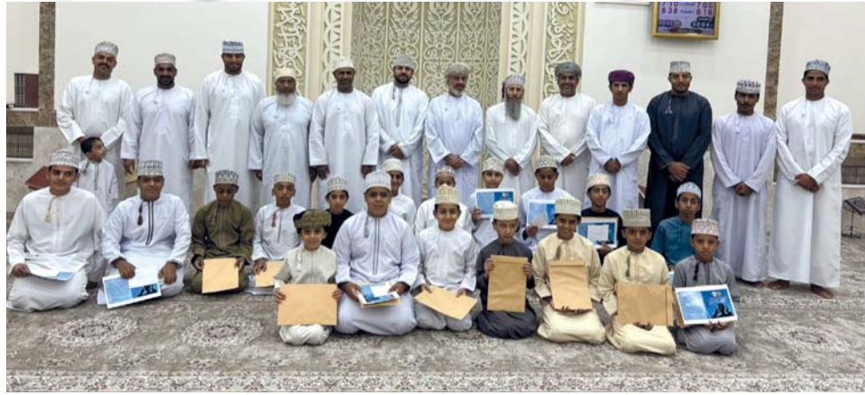
تكريم الطلاب الفائزين

احتفل فريق الاتحاد التابع لنادي بهلاء بختام مسابقة رفع الأذان لشعائر الصلوات الخمس بمسجد حارة بيمان. وقد شارك في هذه المسابقة ٧٧ مشاركاً تأهل أحد عشر منهم للمرحلة النهائية، والتي تهدف لاستغلال وقت فراغ المواهب الناشئة خلال الإجازة الصيفية وتنشئتها على المبادئ الإسلامية السامية وغرس القيم الإسلامية في نفوسهم منذ الصغر. وفي ختام الحفل تم تكريم الطلاب الفائزين.