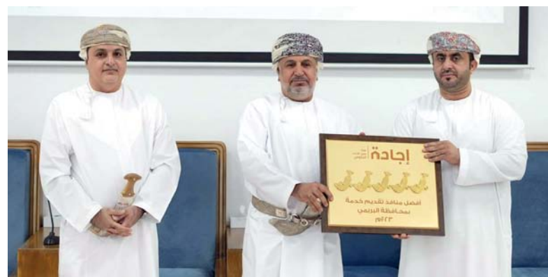
تكريم الجهات الحاصلة على المركز الثلاثة الأولى

العمراني وجهود الزملاء في المديرية العامة للإسكان والتخطيط العمراني بمحافظة البريمي، مضيفاً أن هذا التكريم جاء بناء على معايير ومقاييس الأداء لدى وزارة العمل، تماشياً مع مساعي منظومة الإجابة المؤسسية. وفي الختام هنأ سعادته الجهات الفائزة وقدم تقديم خدمات ذات جودة عالية تحقق رضا المستفيدين وتلاصق احتياجاتهم، ودعماً لها لمزيد من التميز والإجابة في رفع كفاءة وفعالية أداؤها خلال الفترة القادمة تحقيقاً لأهداف منظومة الإجابة المؤسسية، مؤكداً أن هذا التكريم حافزاً للوحدات الحكومية للوصول لأعلى مستويات الأداء.