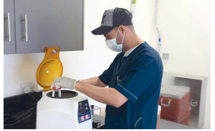
تحديث الإفادات الصحية البيطرية بالشهادات الصادرة من الجهة البيطرية المختصة بسلطنة عمان

رفع الحظر عنها تمثل أعلى معايير الصحة البيطرية. وفي هذا الصدد، تم اعتماد ما يفوق ١٤ بروتوكولا بينيا لاستيراد الحيوانات الحية ومنتجاتها خلال الأعوام من ٢٠٢٢ وحتى العام الحالي، كما تم تحديث ما يفوق الـ ٥٠ اشتراطا صحيا بيطريا لاستيراد خلال الفترة.