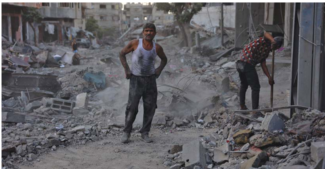
فلسطيني يتفقد الدمار بينما يقوم آخر بإزالة أنقاض مبنى سكني دُمر في غارة إسرائيلية بقطاع غزة

وبتعليمات من المستوى السياسي، وفرض وقف إطلاق النار في قطاع غزة، وضمان امتثال إسرائيل لقواعد القانون الدولي وقرارات محكمة العدل الدولية التي فرضت تدابير مؤقتة لمنع ارتكاب جريمة الإبادة الجماعية. ميدانياً، أعلنت وزارة الصحة الفلسطينية في غزة أن الاحتلال الإسرائيلي ارتكب ٣ مجازر ضد العائلات في القطاع وصل منها للمستشفيات ٦٦ شهيداً و٢٤١ مصاباً. وأكدت الوزارة ارتفاع حصيلة العدوان إلى ٣٩٣٢٤ شهيداً و ٩٠٨٣٠ مصاباً منذ السابع من أكتوبر الماضي. وقالت ما زال عدد من الضحايا تحت الركام وفي الطرقات لا تستطيع طواقم الإسعاف والدفاع المدني الوصول إليهم.