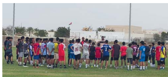
من تدريبات الفرق السنوية بنادي بهلاء