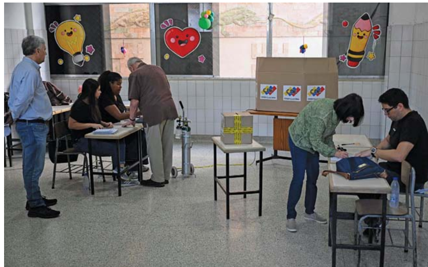
أشخاص يُدلون بأصواتهم خلال الانتخابات الرئاسية الفنزويلية بالعاصمة كراكاس

كراكاس. أ ف ب: نظمت فنزويلا أمس انتخابات رئاسية يسودها توتر شديد بين خصمين يعد كلاهما بالنصر، الرئيس المنتهية ولايته نيكولاس مادورو الذي حذر من «حمام دم» ومرشح «التغيير» إدموندو جونزاليس أورتيا. ودعي حوالي ٢١ مليون ناخب من أصل ٣٠ مليون فنزويلي للتوجه إلى مراكز الاقتراع للإدلاء بأصواتهم. ويخوض السباق عشرة مرشحين، لكن المنافسة تنحصر في الواقع بين مادورو (٦١ عاماً) المرشح لولاية ثالثة من ست سنوات، والدبلوماسي السابق جونزاليس أورتيا (٧٤ عاماً) الذي حل بصورة مفاجئة محل زعيمة المعارضة ماريا كورينا ماتشادو الواسعة الشعبية عند إعلان السلطات عدم أهليتها للترشح. وتُشير استطلاعات الرأي إلى تقدّم المعارضة بفارق كبير لكن بعض المراقبين يؤكدون أن المنافسة شديدة. أما النظام، فيستند إلى أرقام أخرى ليؤكد ثقته في النصر.