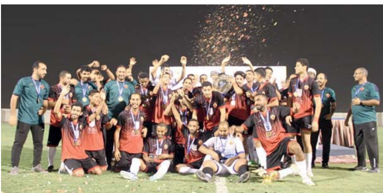
نتيجة فريق السد بلقب الدوري على مستوى محافظة الداخلية