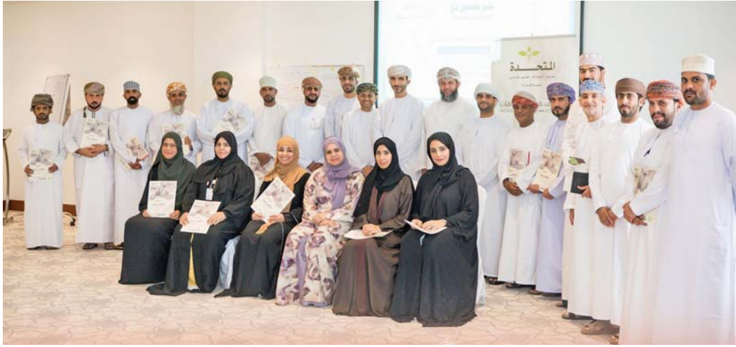
الموظفون المشاركون في الدورة التدريبية