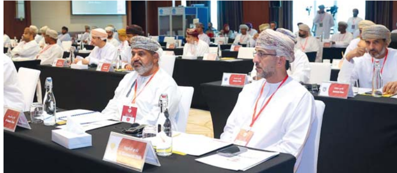
رؤساء وممثلو الأندية خلال اجتماع الجمعية العمومية

عقدت صباح أمس الجمعية العمومية للاتحاد العماني لكرة القدم اجتماعها غير العادي، وذلك بقاعة المؤتمرات بفندق كراون بلازا - مرتفعات المطار - برئاسة سالم بن سعيد بن سالم الوهبي رئيس مجلس إدارة الاتحاد العماني لكرة القدم، وبحضور ممثلي الاتحاد الدولي لكرة القدم عصام السحبياني وأحمد حراز، وممثلي الاتحاد الآسيوي شاهين رحمانى ومحمد العبو، وأعضاء مجلس إدارة الاتحاد وممثلي الأندية المنتسبة للاتحاد، في البداية، ألقى رئيس الاتحاد كلمة الافتتاح، ورحب بالحضور، ثمنا دورهم البارز في خدمة كرة القدم العمانية، وإسهاماتهم الفاعلة في تنفيذ برامج الاتحاد وأنشطته.