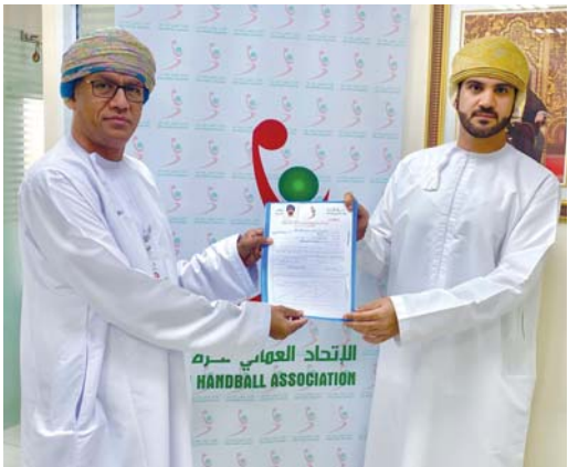
المختار الهنائي يقدم أوراق ترشحه لمنصب نائب الرئيس