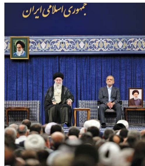
المرشد الأعلى الإيراني آية الله خامنئي والرئيس المنتخب مسعود بزشكيان خلال حفل تعصيب الرئيس الجديد وحصوله على مرسوم تعيين رسمي في طهران

طهران. د ب أ: حصل مسعود بزشكيان أمس على مرسوم تعيينه رئيساً جديداً لإيران بعد أن تم انتخابه في وقت سابق من الشهر الجاري. وحصل بزشكيان على مرسوم تعيينه وعلى مباركة من المرشد الأعلى للجمهورية الإسلامية الإيرانية آية الله علي خامنئي، وبذلك صار الرئيس التاسع للجمهورية الإسلامية. وحضر مراسم التعصيب في مسجد الخميني بالعاصمة طهران، النخبة السياسية في إيران، بالإضافة إلى عدد من الدبلوماسيين الأجانب. ومن المقرر أن يؤدي بزشكيان اليمين الدستورية رسمياً أمام البرلمان، غداً الثلاثاء. كما سيقيم بعد ذلك بتقديم نوابه وأعضاء حكومته.