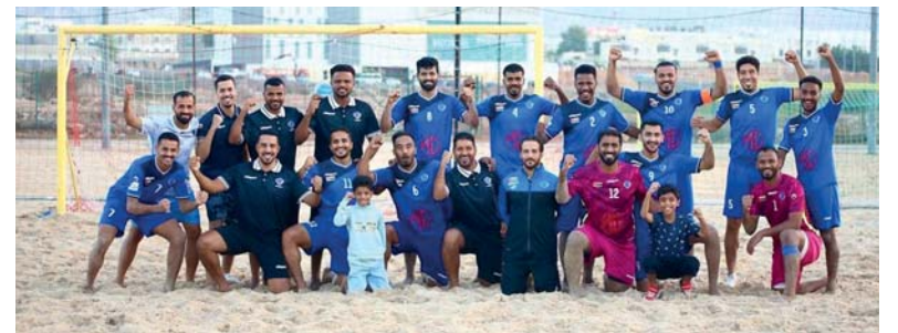
فريق العامرات لكرة القدم الشاطئية