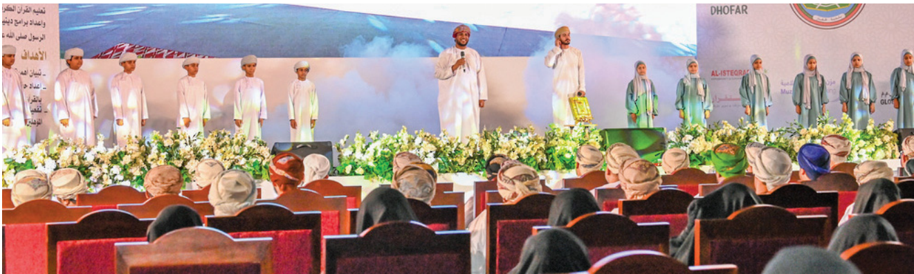
الملتقى يسعى إلى تحفيز حفظة كتاب الله على مواصلة الحفظ وتشجيع مختلف شرائح المجتمع

المديرية العامة للأوقاف والشؤون الدينية بمحافظة ظفار.