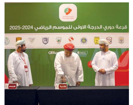
من سحب قرعة المجموعات لدوري الدرجة الأولى لكرة القدم

الأولى سيكون في السابع عشر من سبتمبر القادم إن شاء الله تعالى. جاءت نتائج القرعة بتواجد كل من صلالة، فنحاء، السلام، بوش، نزوى، الوحدة، بهلاء في المجموعة الأولى، بينما ضمت المجموعة الثانية كلا من المضبي، الاتحاد، أهلي سداب، مسقط، الطليعة، سمائل، الجدير بالذكر، أن جوائز الدرجة الأولى للموسم الجديد ستكون على النحو التالي: سيحصل بطل الدرجة الأولى على مبلغ قدره (٢٠) ألف ريال عماني ودرع البطولة مع (٥٠) ميدالية ذهبية، فيما يحصل الوصيف على مبلغ قدره (١٥) ألف و (٥٠) ميدالية فضية، وستحصل الأندية المتأهلة للمرحلة النهائية على مبلغ (١٠٠٠) ريال عماني لكل فريق.