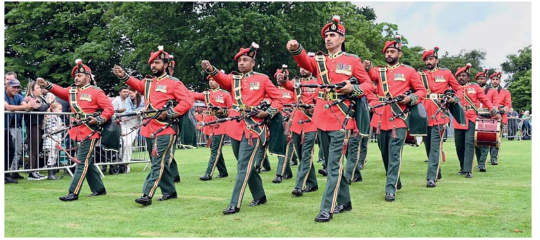
الفرقة العمانية حصدت المركز الأول في مسابقة المشاة والانضباط العسكري والمركز الخامس في مسابقة العزف

إدنبرة - العمانية: حققت موسيقى الجيش السلطاني العماني أولى إنجازاتها ضمن مشاركتها في المسابقة العالمية للموسيقى والمقامة حالياً في اسكتلندا بالملكة المتحدة، حيث حصلت موسيقى الجيش السلطاني العماني على المركز الأول في مسابقة المشاة والانضباط العسكري، وأحرزت المركز الخامس في مسابقة العزف التي أقيمت بمدينة دومبارتون وبمشاركة (١٢٨) فريقاً من مختلف دول العالم. وتحدث العقيد الركن أحمد بن سالم الشكري مدير موسيقى الجيش السلطاني العماني عن المسابقة قائلاً: مع انطلاق المرحلة الأولى من المسابقة العالمية للفرق والطبول في اسكتلندا، استطعنا