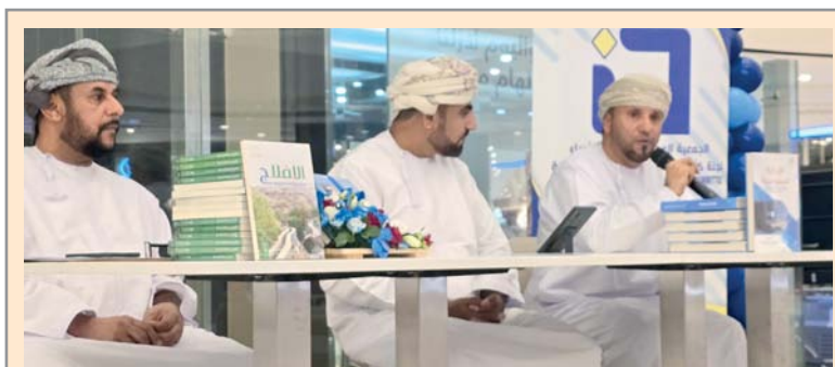
المشاركون في الأمسية الأدبية