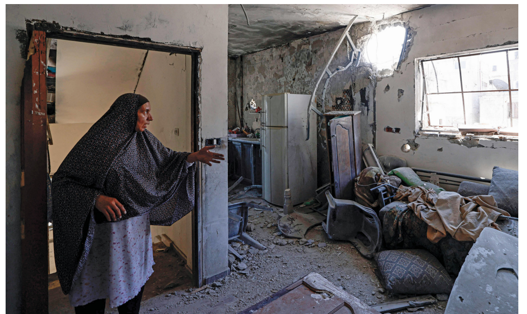
فلسطينية تشير إلى الدمار الذي لحق بمنزلها في أعقاب غارة «إسرائيلية» عنيفة بمخيم بلاطة للاجئين شرق مدينة نابلس في الضفة الغربية المحتلة، حيث تنس إسرائيل عدواناً ضد الضفة بالزمان مع مجازرها المستمرة في قطاع غزة.

من جهة أخرى شن جيش الاحتلال الإسرائيلي غارات على البقاع وجنوب لبنان بغية هجوم مجدل شمس بالجولان المحتل، حيث أعلنت إسرائيل أنها رفعت جاهزيتها إلى المستوى التالي للقتال في الشمال.