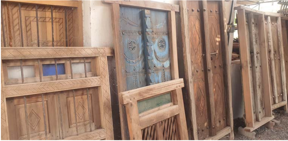
■ المجيني جمع العديد من الأبواب والنوافذ والمناديس الخشبية القديمة