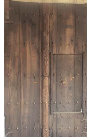
■ أحد الأبواب المصنوع من خشب الساج

حاجته الحياتية في العديد من المجالات والنقش على الخشب فن يوثق تاريخ العمارة العمانية. وأوضح المجيني: بحوزتي العديد من الأبواب