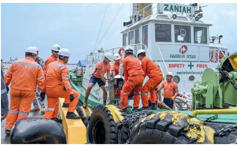
أفراد من خفر السواحل يقومون بتحميل الكاشطات لاستخدامها في معالجة التسرب النفطي بميناء في مقاطعة باتان بالفلبين