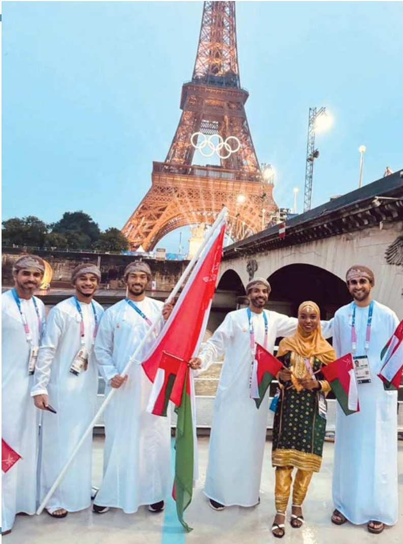
بعثة سلطنة عُمان عقب المشاركة في حفل الافتتاح

تشاركت سلطنة عُمان في مراسم حفل الافتتاح الرسمي لدورة الألعاب الأولمبية الصيفية في نسختها الثالثة والثلاثين «باريس ٢٠٢٤»، وذلك على ضفاف نهر السين في قلب العاصمة الفرنسية باريس، وقد أبهرت فرنسا العالم بأكمله بعد أن قدمت حفلاً مذهلاً وتاريخياً لافتتاح الأولمبياد وسط حضور رسمي ورياضي وجماهيري كبير، تقدمهم الرئيس الفرنسي إيمانويل ماكرون وعدد كبير من رؤساء وممثلي الدول وبحضور توماس باخ رئيس اللجنة الأولمبية الدولية.