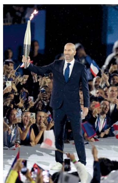
زيدان يحمل الشعلة الأولمبية