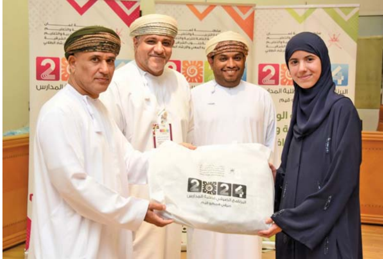
تكريم الطلبة المشاركين في جنوب الشرقية

والناشط الصيفية في صقل مهارات ومعارف الطلبة المشاركين في الأنشطة الثقافية والعلمية والرياضية وبرامج الحاسب الآلي والذكاء الاصطناعي وإلى جانب غرز قيم السمات العماني وعن أصالته والعادات الاجتماعية. وقالت المديرية أميرة بنت خليفة الناصرية بأن المراكز الصيفية حققت مؤشرات ناجحة ومشاركة واسعة، حيث قدمت بعض البرامج والأنشطة التعريفية في مجال كيفية دمج العطور وصناعة المخمرات وعن تنسيق الزهور وحول صناعة المنتجات الجبسية في مركز سيف بن سلطان وكبارة وتعريف من خلالها الطلبة والطالبات على مختلف الأعمال والصناعات المحلية.