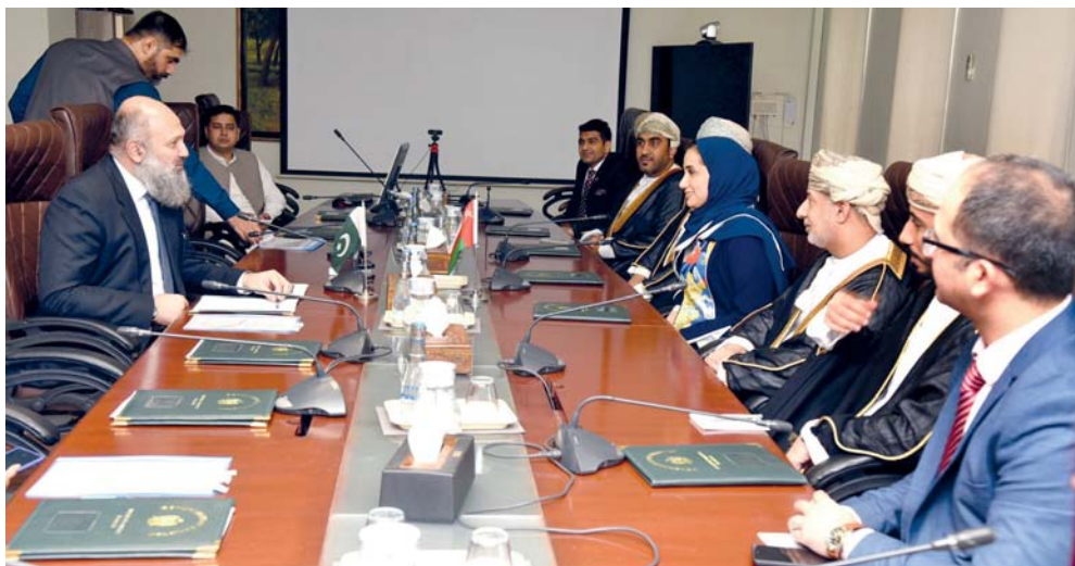
الزيارة تهدف لتسهيل حركة التجارة والاستثمار، واستغلال الفرص المتاحة

هدفت الزيارة إلى عقد سلسلة من اللقاءات والاجتماعات في جمهورية باكستان الإسلامية من بينها مع اتحاد غرف التجارة والصناعة الباكستانية، وأخرى إلى غرفة التجارة والصناعة في إسلام آباد، وغرفة التجارة والصناعة في روالبندي، والتي تأتي تعزيزاً للتعاون التجاري والاستثماري بين البلدين الصديقين، حيث شهدت العلاقات الاقتصادية الثنائية تطورات على الصعيدين التجاري والاقتصادي، ويعمل الجانبان على تعزيز أوجه التعاون لزيادة حجم التبادل التجاري، وتعزيز الاستثمارات المتبادلة، والتعاون في مجال الطاقة والزراعة، من جانب آخر يسعى البلدان الصديقان إلى تحقيق التكامل الاقتصادي من خلال تسهيل حركة التجارة والاستثمار، واستغلال الفرص المتاحة التي بدورها تحقق منافع مشتركة وتعزز دور القطاع الخاص في تطوير