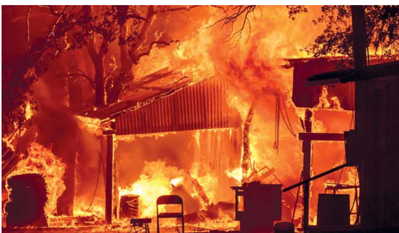
حريق ضخم في غابات بالقرب من مقاطعة تيهاما بولاية كاليفورنيا الأميركية

كاليفورنيا. أ ف ب: اضطر نحو ٤ آلاف شخص إلى مغادرة منازلهم في كاليفورنيا جراء حريق ضخم وعنيف كان يواصل تمدده بشكل خطير، على الرغم