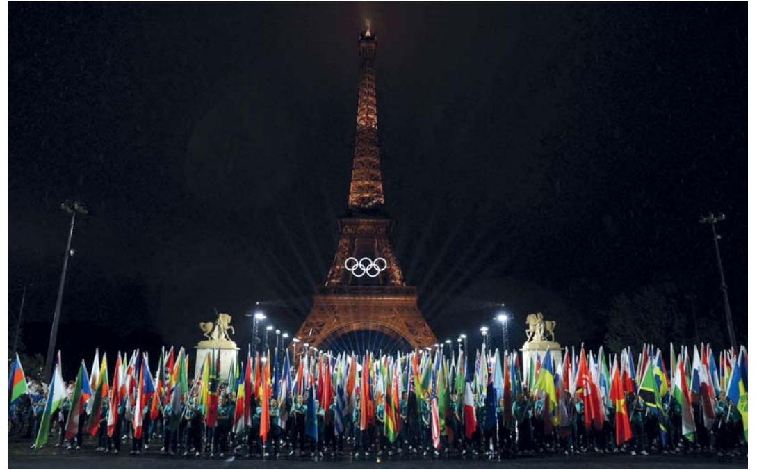
أعلام الدول المشاركة في حفل الافتتاح