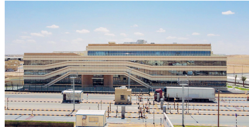
المنطقة تعد بوابة خليجية رئيسة لتجارة الترانزيت إلى اليمن

الزبيونة. العُمانيّة: تعد المنطقة الحرة بالزبيونة إحدى المناطق الحرة التابعة للهيئة العامة للمناطق الاقتصادية الخاصة والمناطق الحرة كأول منطقة حرة من نوعها في سلطنة عُمان وتقع في أقصى الجنوب الغربي على الحدود البرية مع الجمهورية اليمنية الشقيقة؛ ما يجعلها بوابة خليجية رئيسة لتجارة الترانزيت إلى اليمن ومنها إلى دول شرق إفريقيا.