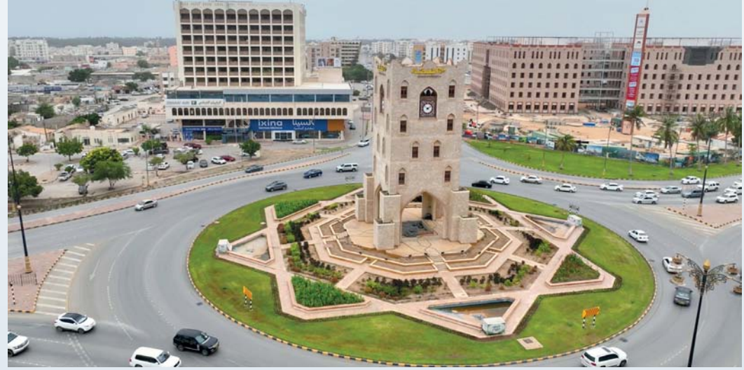
تعزيز الاستثمار في القطاعات التجارية والاقتصادية

المشروعات الخاصة بتطوير المواقع السياحية وتحسين الواجهات وغيرها من المشروعات التنموية الأخرى. وأشار سعادته إلى أن هناك خطة طموحة وموافقات لتنفيذ العديد من المشروعات في محافظة ظفار سيعلن عنها خلال الفترة المقبلة، ترتبط معظمها بتعزيز البنية الأساسية وتوسيع أعمال الطرق في مختلف ولايات المحافظة والتركيز على تحسين شبكة تصريف مياه الأمطار ودعم تطوير بعض المشروعات الشبابية وغيرها. وقال سعادته: نتيجة للعمل الدؤوب الذي عملت عليه محافظة ظفار خلال السنتين الماضيتين تم استحداث أنشطة وفعاليات بعد موسم الخريف، منها فعاليات موسمي الصرب والشتاء التي لقيت نجاحا كبيرا وأسهمت في توسيع النطاق الجغرافي للزوار في المحافظة، موضحاً أن معظم السياح خلال فترة الصيف يأتيون من مختلف محافظات