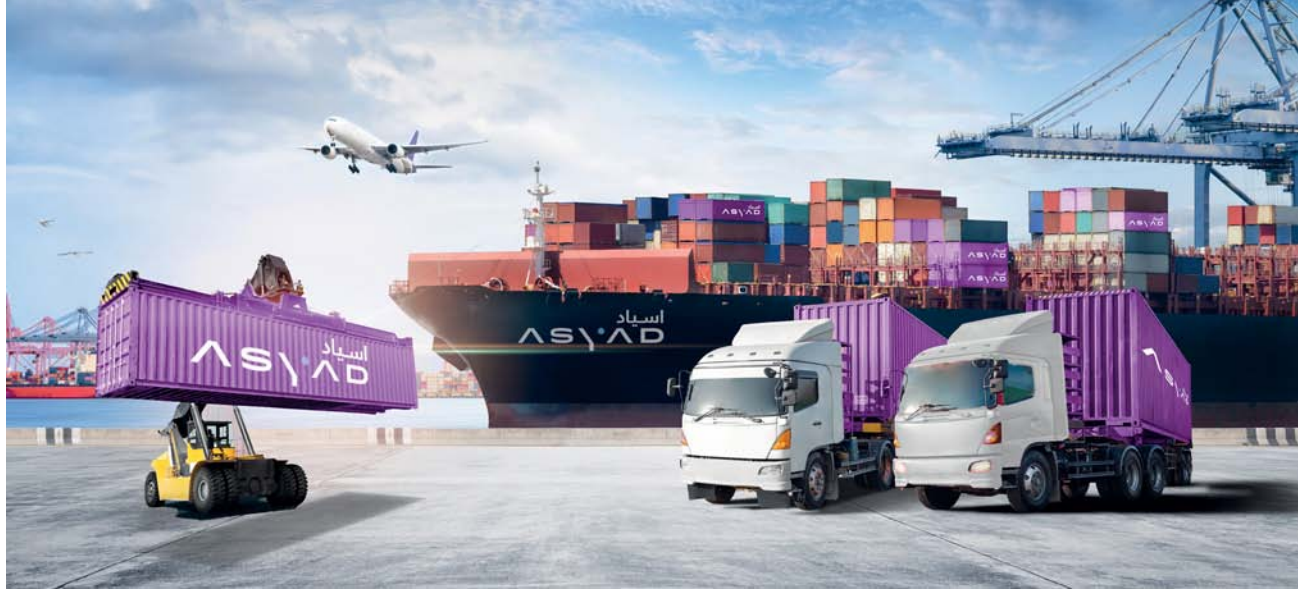
استحواد «أسباد» يعزز تنوع محفظة أصول المجموعة

من خلال المعارض في الأعمال في تعزيز التنمية المجالات المختلفة. وقال سعادة الدكتور جمعة بن أحمد الكعبي سفير مملكة البحرين لدى سلطنة عُمان: إن تنظيم النسخة الرابعة من هذا المعرض، يأتي استمراراً للنجاحات التي حققتها معرض المنتجات العمانية البحرينية في نسخته الثالث السابقة ليؤكد على دور رواد الأعمال في تعزيز التنمية الاقتصادية وفتح أسواق جديدة للمنتجات في البلدين الشقيقين. انطلقت حلقة العمل الأولى من المرحلة الثالثة من حلقات وعيادات جلب الاستثمار التي تنظمها وزارة النقل والاتصالات وتقنية المعلومات، بعنوان تعزيز الاستيراد والتصدير عبر الموانئ العمانية وبالتعاون مع البرنامج الوطني للترويج الاقتصادي، ورصد التحديات والعوائق المحلية والدولية التي تواجه الاستيراد والتصدير، كما تسلط الضوء على تبسيط الإجراءات، وتعزيز الحوكمة، ورفع كفاءة منظومة الاستيراد والمناطق الحرة وتهدف