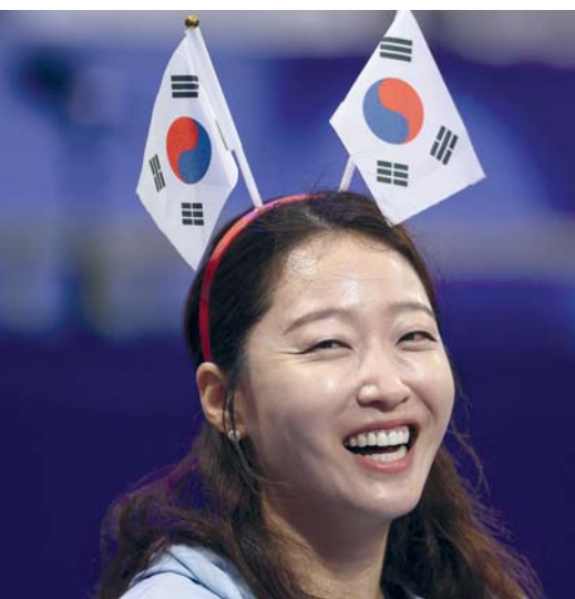
■ إحدى مشجعات كوريا الجنوبية تبسم أثناء مشاهدة مسابقة الجبازة في أولمبياد باريس .