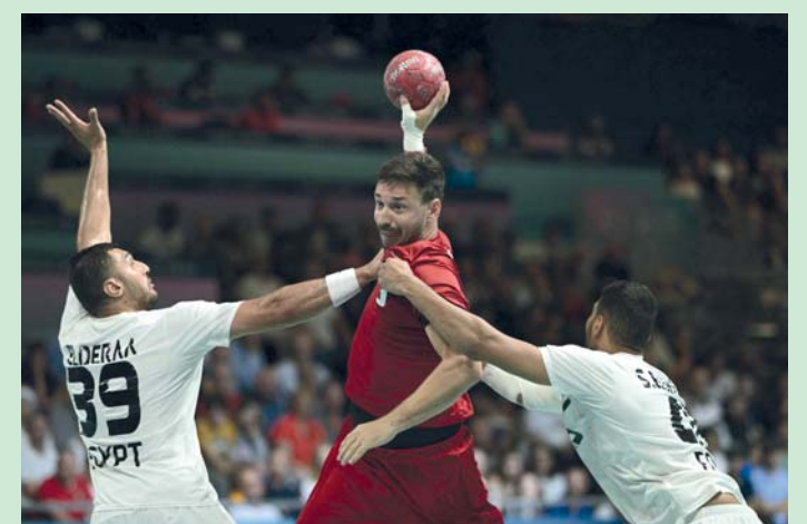
■ من مباراة مصر والمجر في مسابقة كرة اليد بالأولمبياد .

باريس . أ . ف . ب : بدأ المنتخب المصري لكرة اليد، رابع النسخة الاخيرة في طوكيو، مشواره في دورة الألعاب الأولمبية في باريس بفوز مستحق على نظيره المجرى ٣٥-٣٢ أمس السبت في الجولة الاولى من منافسات المجموعة الثانية. واستهل مصر، رابعة العالم في ٢٠٠١ في فرنسا، المباراة بشكل جيد وتقدمت ٢-٠ ووسعت الفارق إلى ٨ اهداف في إحدى فترات الشوط الاول (١٥-٧ و ١٦-٨)، لكن المجر عادت بقوة في الدقائق الأربع الاخيرة وقلصت الفارق إلى أربعة اهداف (١٥-١٩) في نهايته. وواصلت المجر فورتها مطلع الشوط الثاني ونجحت في إدراك التعادل مرتين (٢٣-٢٣ و ٢٤-٢٤) قبل أن