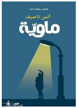
■ غلاف المجموعة القصصية