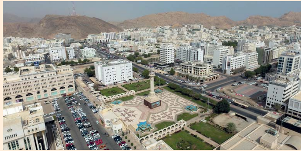
استمرار نمو الائتمان المصرفي في سلطنة عُمان

٥,٧ بالمائة والقطاعات الأخرى بنسبة ٣,٦ بالمائة. وسجل إجمالي الودائع لدى القطاع المصرفي نمواً بنسبة ٩,٢ بالمائة ليصل إلى نحو ٣٠ مليار ريال عماني بنهاية مايو من العام الحالي وضمن هذا الإجمالي وادّعت ودائع القطاع الخاص بنسبة ١٤ بالمائة لتبلغ ٢٠,٤ مليار ريال عماني. وفيما يتعلق بتوزيع إجمالي قاعدة الودائع للقطاع الخاص، أوضحت البيانات أن قطاع الأفراد استحوذ على الحصة الأكبر البالغة ٥٠,٤ بالمائة يليه قطاع الشركات غير المالية والائتمان والتي بلغت ٤٥,٤ بالمائة بنهاية مايو الماضي يليها قطاع الأفراد بنسبة ٤٥,٣ بالمائة أما النسبة المتبقية فتوزعت على قطاعات أخرى.