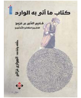
■ غلاف الكتاب