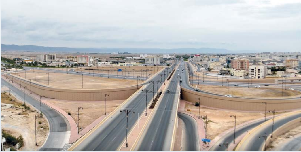
تطوير الواجهات وتنفيذ مشروعات الطرق

سلطنة عُمان ودول مجلس التعاون لدول الخليج العربية، في حين يأتي السياح إلى المحافظة خلال موسم الصيف من بعض الدول العربية مثل مصر وليبيا والجزائر إضافة إلى الدول الآسيوية كالصين وغيرها، بينما يأتي السياح خلال موسم الشتاء من الدول الأوروبية وأوروبا الشرقية وغيرها. وأكد سعادة الدكتور رئيس بلدية ظفار أن ملامح الأنشطة التجارية والاقتصادية والسياحية في محافظة ظفار أصبحت بارزة وتعمل المحافظة على العديد من الرؤى والاستراتيجيات التي من شأنها تحفيز النمو في هذه القطاعات وفتح المجال أمام المؤسسات الصغيرة والمتوسطة والشباب العُماني والمبتكرين وتعزيز الاستثمار في القطاعات التجارية والاقتصادية الأخرى سواء كانت مرتبطة بالقطاع السياحي أم بالموارد الطبيعية التي تتميز بها المحافظة.