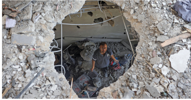
فلسطيني يتفقد الأضرار التي أعقبت غارة «إسرائيلية» عنيفة استهدفت مدرسة تؤوي نازحين في دير البلح وسط قطاع غزة.

يغلق اليوم مركز السلطان قابوس العالي للثقافة والعلوم التابع لديوان البلاط السلطاني باب التسجيل في مسابقة السلطان قابوس للقرآن الكريم في دورتها (الثانية والثلاثين) بمستوياتها السبعة. وقد أوضح المركز مؤخرًا بأن إعلان بدء التسجيل قد صدر عبر الموقع الإلكتروني (www.quran.gov.om)، وأن آخر موعد للتسجيل هو اليوم الموافق (٢٨) من يوليو الجاري، كما ستبدأ التصفيات التمهيديّة الأوليّة في الـ (١٩) من شهر أغسطس القادم. تفاصيل... ص ٤