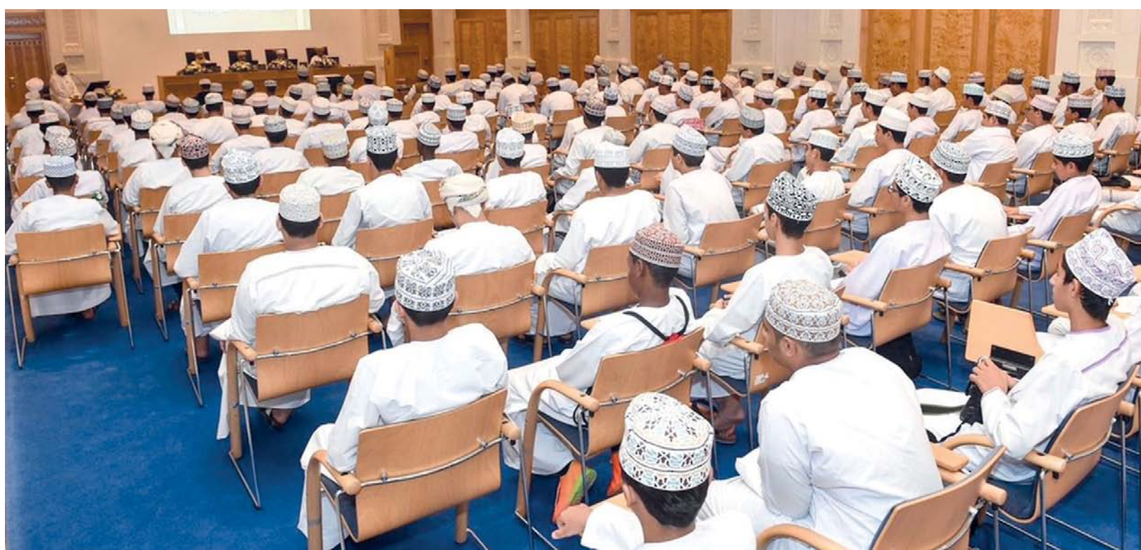
■ المسابقة تُسهم في توطيد مبادئ الدين الحنيف والأخلاق الفاضلة في الأسرة العُمانيّة

وتشتمل المسابقة على ٧ مستويات: الأول حفظ القرآن الكريم كاملاً، والثاني حفظ (٢٤) جزءاً متتالياً، والثالث حفظ (١٨) جزءاً متتالياً، والرابع حفظ (١٢) جزءاً متتالياً، والخامس حفظ (٦) أجزاء متتالية، والسادس حفظ (٤) أجزاء متتالية، والسابع حفظ جزءين متتاليين. ومن المتطلبات العامة لجميع المستويات: الالتزام بأحكام التجويد، والحفظ برواية حفص عن عاصم، والالتزام بالعلم في المستوى المشروط بمرحلة عمرية معيَّنة، وعلى من حصل على أحد المراكز الثلاثة الأولى من أي مستوى أن يشارك في مستوى أعلى منه للعام الذي يليه. وبلغ عدد المشاركين في المسابقة خلال الأعوام من ٢٠١٣م إلى ٢٠٢٣م (عدا عامي ٢٠٢٢م و٢٠٢١م؛ لتوقف المسابقة بسبب جائحة كورونا) ١٦ ألفاً و١١٨ مشاركاً ومشاركة. ■