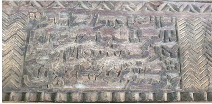
■ الأبواب والنوافذ الخشبية تمتاز بنقش العبارات الدينية والإسلامية