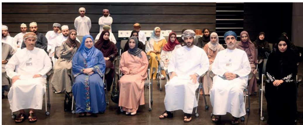
الجلسة العلمية تهدف إلى تشجيع الابتكار والتعاون

الجلسة التعريف بالاصطناعي، والجينوم وعلم الجينات والأمراض الوراثية في الإنسان، والحيوان، والنبات، والكائنات البحرية والدقيقة، والتطرق إلى دور الذكاء الاصطناعي في تحليل الجينات البشرية والكائنات الحية المختلفة، ومناقشة تطبيقات الذكاء الاصطناعي في تشخيص الأمراض، وتطوير العلاجات المتخصصة، فضلاً عن التنقيب بالاستعداد الوراثي للأمراض. كما استعرضت الجلسة دور تطبيقات الذكاء الاصطناعي في اكتشاف وتصنيف الأنواع النباتية والحيوانية، وأبرز التحديات الأخلاقية والقانونية المرتبطة بتحليل الجينوم باستخدام الذكاء الاصطناعي، ووضع الذكاء الاصطناعي ومستقبله في سلطنة عمان.