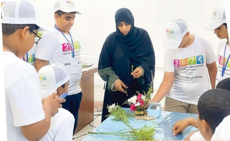
البرامج والناشط الصيفية بالظاهرة