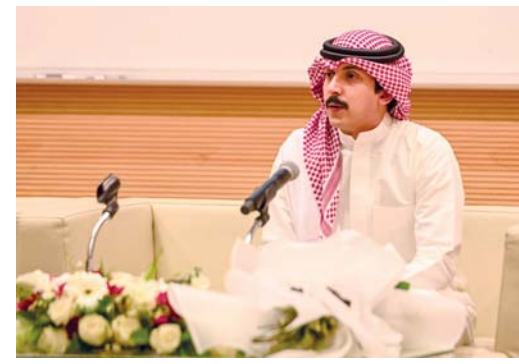
يشارك في المهرجان شعراء من داخل سلطنة عمان وخارجها

اختتم مركز ثقافة الطفل التابع لوزارة الثقافة والرياضة والشباب فعاليات البرنامج الصيفي لعام ٢٠٢٤، حيث شهد البرنامج الصيفي حضور عدد كبير من طلبة المدارس وصل ٤٠٠ مشاركاً من الفئة المستهدفة من سن ٦-١٦ سنة من الجنسين شاركوا في مختلف الحلقات المقدمة، حيث تضمن البرنامج الصيفي حزمة متنوعة من الفعاليات والبرامج مثلت في مجالات أدب الطفل، والرياضة، والفنون، والأمن والسلامة، والإرشاد والتوجيه. والتي هدفت إلى تطوير مهارات الأطفال وتعزيز ثقافتهم ومعرفة بمواضيع مختلفة، وتحفيز الفضول وتعزيز التعلم لدى الأطفال، حيث تم اختيار محاور هذه الفعاليات بعناية لتتناسب مع اهتمامات النشء، وفتح آفاق التعلم الإبداعي وتنمية المهارات العلمية لديهم. كما يدعم البرنامج تنمية قدراتهم الفنية والعلمية والاجتماعية، وتعزيزها في المشاركة في تنفيذ الحلقات بما يتناسب والمجالات المطروحة خلال