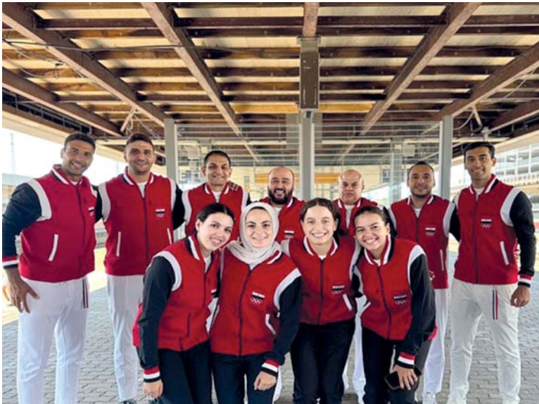
■ المنتخب المصري لتنس الطاولة

إدارة البعثة في القرية الأولمبية بتسجيل دخول اللاعبين. وتطلق منافسات تنس الطاولة يوم ٢٧ يوليو الجاري وتستمر حتى العاشر أغسطس القادم، في «باريس إكسبو بورت دو فرسا» بمشاركة ١٧٢ لاعباً مناصفة بين الرجال والنساء. ويشمل جدول المنافسات ٥ مسابقات، فردي وفرق الرجال، وفردي وفرق النساء إلى جانب الزوجي المختلط والتي تقام للمرة الثانية على التوالي بعد وجودها في طوكيو ٢٠٢٠.