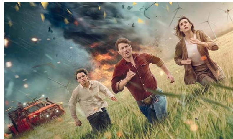
الفيلم يحكي عن أعاصير مدمرة حدثت بولاية أوكلاهوما الأميركية