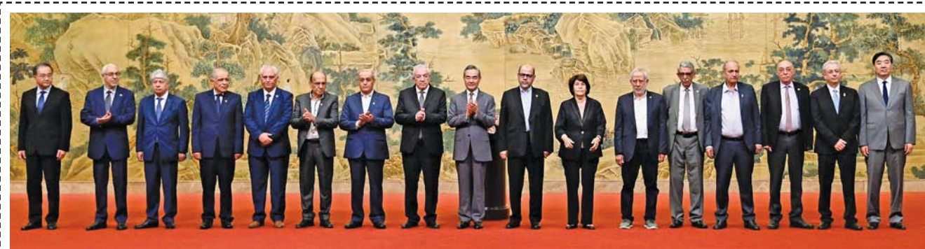
صورة جماعية لوزير الخارجية الصيني وانج بي مع أعضاء الفصائل الفلسطينية أثناء التوقيع على «إعلان بكين» في العاصمة الصينية بكين.