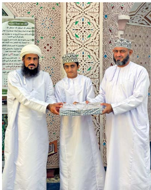
الملتقيات سعت إلى تنمية مهارات الطالب العلمية والفكرية