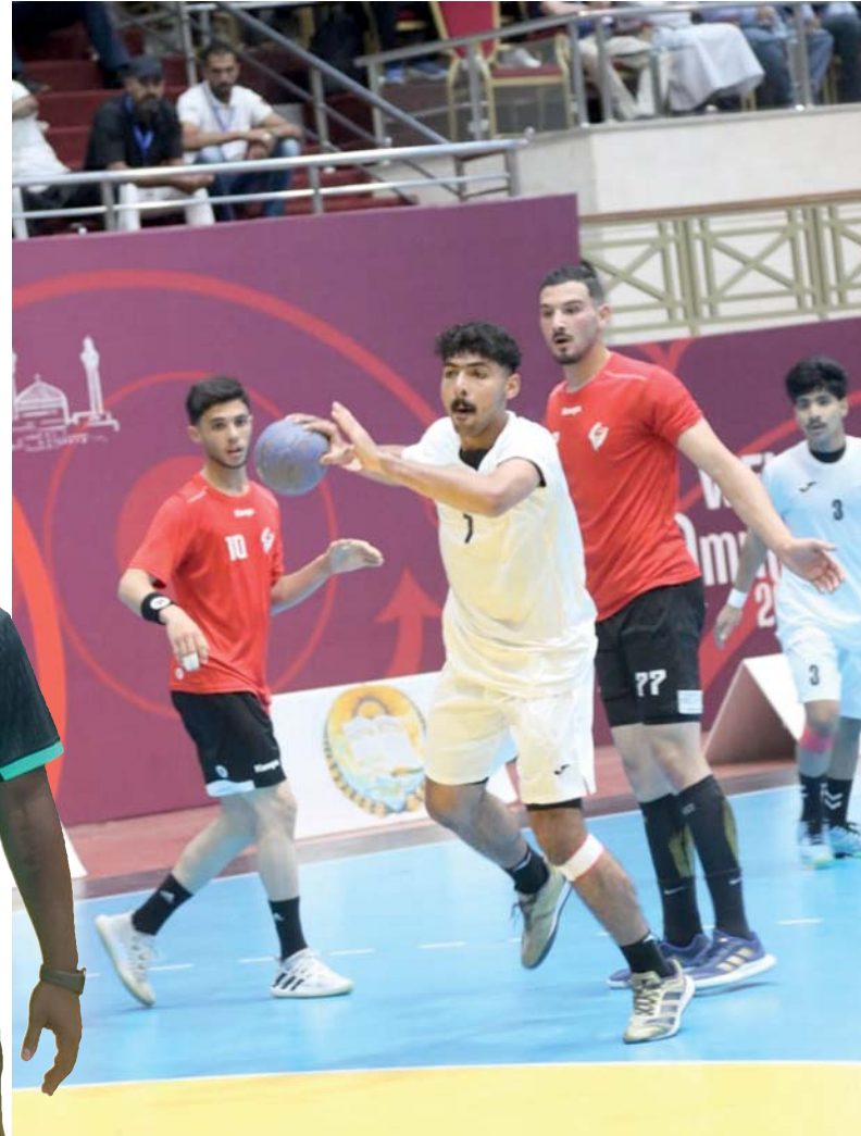
من لقاء منتخبنا مع الأردن بالدر الأول

سيكون عاملا مهما في التصنيف في البطولة القادمة ورغم طموحهما الظفر بمركز جيد لكنهما اصطدما بقوة المنافسة