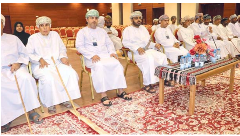
المشاركون تعرفوا على التسهيلات المقدمة للمؤسسات الصغيرة والمتوسطة

تقدم شركة كيا بسلطنة عمان لعشاق السيارات الرياضية متعددة الاستخدامات عرضاً حصرياً لفترة محدودة ضمن عرض أحاسيس الصيف لشراء سيارة سيلتوس تأمين وتسجيل مجاني للسنة الأولى وقسيمة امسح واربح المضمونة للحصول على فرصة للفوز بعملات ذهبية أو فرصة الفون بهاتف آيفون ١٥ سعة ٢٥٦ جيجابايت أو ترقية الخدمة لغاية