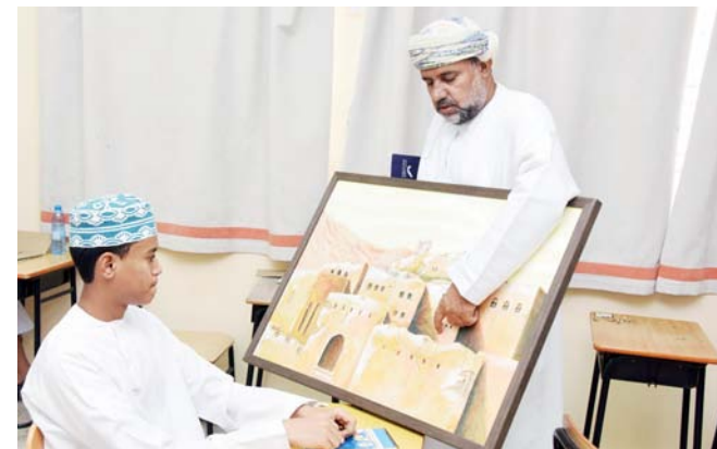
حلقات العمل ركزت على محور التطبيق العملي