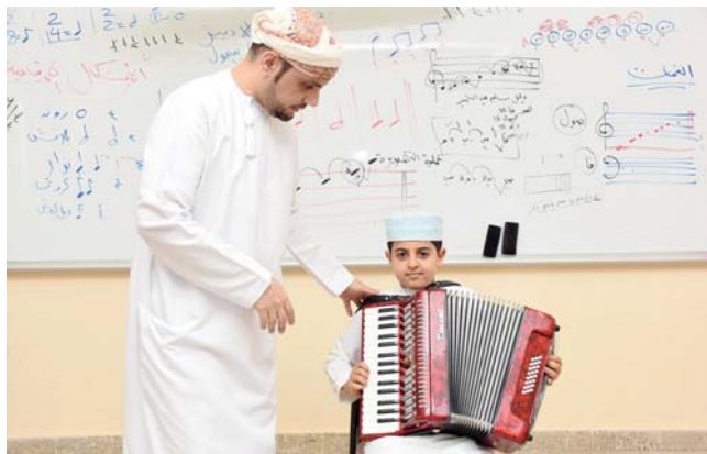
البرنامج ساهم في اكتشاف مواهب في مجالات متعددة