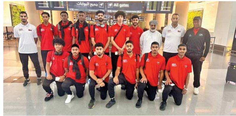
■ منتخبنا الوطني لكرة السلة للشباب

تحت ١٨ عاما، حيث يحرص الاتحاد على تأمين مشاركة المنتخب مع الأشقاء في البطولة الخليجية لكرة السلة التي تنطلق منافساتها في ٢٩ من هذا الشهر الجاري بدولة الكويت الشقيقة، ومعسكر المنتخب بالكويت بمثابة الحافز للاعبين والجهازيين الفني والإداري من أجل الوصول بالمنتخب المستوى الذي يمكنه من المنافسة في البطولة التي تأمل