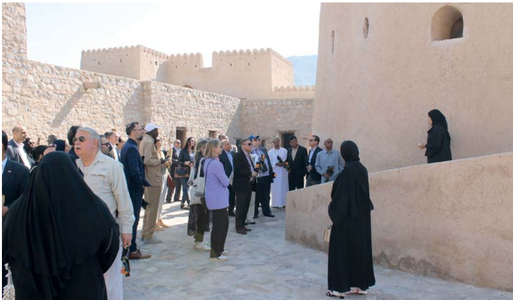
القلاع والحصون وجهة للكثير من زوار مسندم

وأضافت: إن طرح كل من حصن خصب وحصن الكمزارة وحصن بخا وحصن دبا في محافظة مسندم للاستثمار قبل الأفراد والقطاع الخاص يسهم ذلك بإنعاش الفرصة للمؤسسات والأفراد بتشغيل القلاع والحصون بالطرق المثلّي والابتكارية مع توفير فرص عمل، مؤكدة أن هذا التوجه يأتي ضمن الخطة الخمسية العاشرة لسلطنة عمان والتي جعلت من أولوياتها تطوير المواقع التراثية السياحية والمكونات الثقافية لإيجاد استثمار مستدام للتراث والثقافة والفنون ويسهم في نمو الاقتصاد الوطني