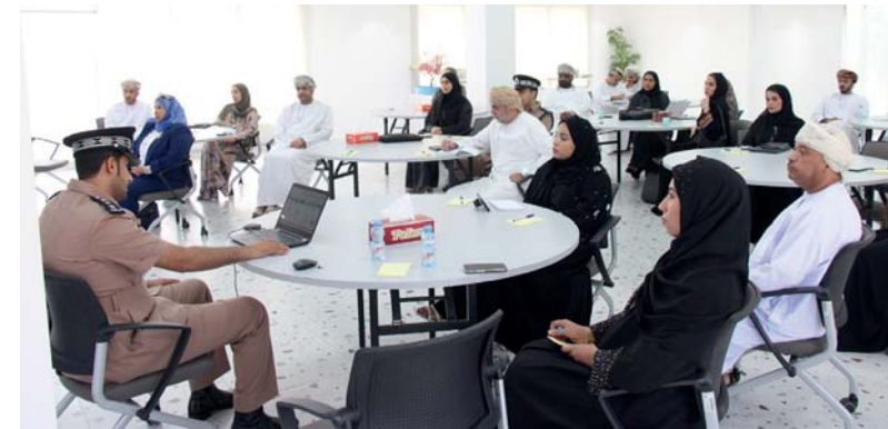
الحلقة تناولت التحديات المحلية والدولية التي تواجه الاستيراد والتصدير

بدأت أمس الحلقة الأولى من المرحلة الثالثة من ورش وعيادات جلب الاستثمار التي تنظمها وزارة النقل والاتصالات وتقنية المعلومات، بعنوان «تعزيز الموانئ العمانية، بالتعاون مع البرنامج الوطني للتنوع الاقتصادي، والجمعية اللوجستية العمانية وبمشاركة وزارة التجارة والصناعة وترويج الاستثمار، والإدارة العامة للمجمعات التجارية بشرطة عمان السلطانية والهيئة العامة للمناطق الاقتصادية والمناطق الحرة. تهدف حلقة العمل إلى وضع رؤية مشتركة لاستهداف أسواق عالمية جديدة، وبحث الفرص ورصد التحديات والعوائق المحلية والدولية التي