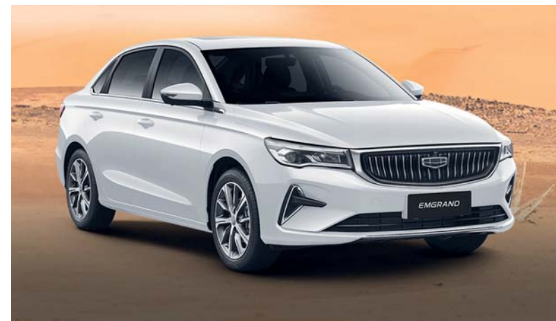
جيلي بميزات مبتكرة وتقنيات مستقبلية

كشفت جيلي عن تشكيلتها الجديدة للعام القادم ٢٠٢٥ بميزات مبتكرة وتكنولوجيا مستقبلية وتعرض مجموعة متنوعة من الطرازات بما في ذلك سيارات السيدان إمجران 7 المشهيرة وسيارة كوالري الرياضية متعددة الاستخدامات وسيارات السيدان بريفيش الفاخرة، وسيارة توجيلا SUV القوية ويتميز كل طراز بميزات مبتكرة وتقنيات مستقبلية مما يعد تجربة قيادة استثنائية للجميع.