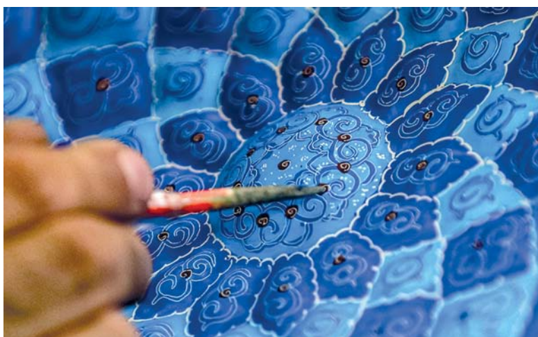
المينا فن ازدهر في العصرين الصفوي والسلجوقي في إيران

طهران. العمانية: المينا أو ميناكاري باللغة الفارسية هي تقنية إبداعية في الفن يتم استخدامها بواسطة دمج المعادن لتلوين وتزيين الأسطح المعدنية كالذهب والفضة والنحاس مع التصميمات التقليدية المكررة المثلثة على خلفية زهرية باللون الأزرق الفاتح والأخضر والأصفر أو الأحمر. المينا هو فن فاخر وبديع وله جذور ثقافية يجمع بين حرارة النار وسحر الألوان ويقوم بزخرفة المعادن حيث تعد مدينة أصفهان الإيرانية المدينة الوحيدة في إيران التي تشتهر بهذا الفن العريق.