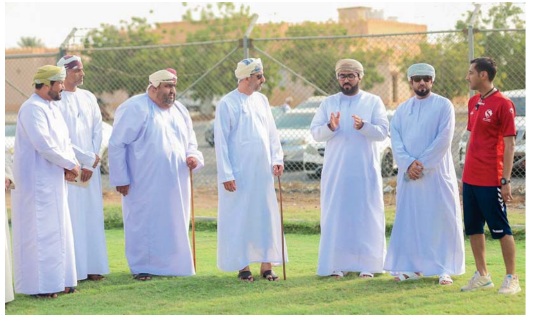
■ من الزيارة الاستطلاعية لملاعب نادي السلام