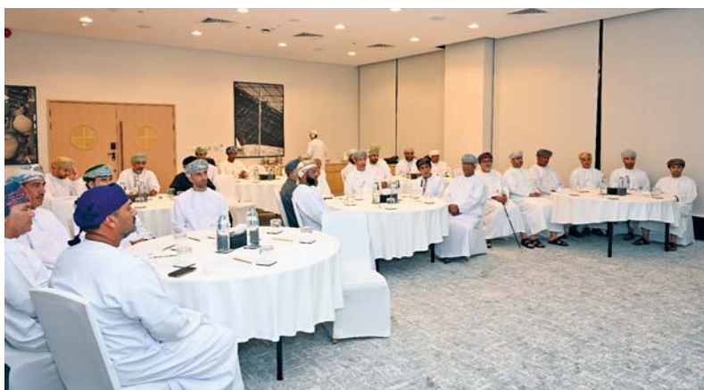
مساندة كبيرة للمشروع من قبل الجمعية العمومية للفريق