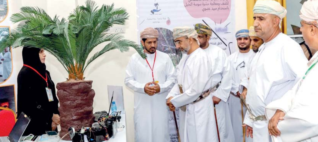
الملتقى يبرز المنتجات المحلية من الخضراوات والفواكه