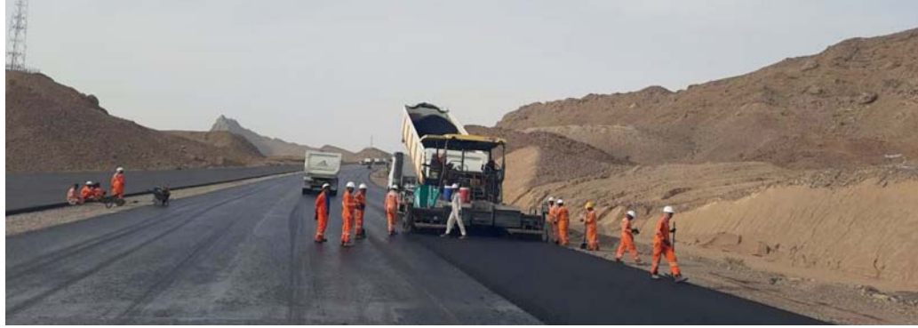
المسقط . الوطن :

كفاءة الطريق الحالي وتحويله إلى طريق مزدوج مكون من ثلاثة مسارات، بدءاً من ولاية الكامل وصولاً إلى ولاية صور بطول حوالي ٥٢ كيلومتراً، ورفع كفاءة الطريق من دوار بلاد صور إلى فندق صور بلازا وتحويله إلى طريق مزدوج مكون من مسارين بطول حوالي ٣ كيلومترات. ويشمل المشروع إنشاء تقاطع علوي، وإنشاء عدد من جسور العبور للأودية والجسور العلوية المقوسة، بالإضافة إلى إنشاء أنفاق للمركبات وأنفاق لعبور المشاة، كما سيتم استكمال أعمال