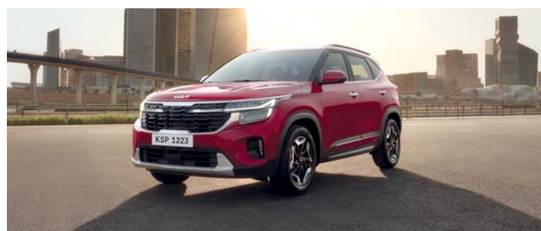
كيا سيلتوس بمميزات سلامة استثنائية

١٠ جرعات من العملات الذهبية أو مزايًا خدمة محدثة تصل إلى ٢٠,٠٠٠ كم لكل ٢٠ عاماً. ويتميز استكشاف سيارة سيلتوس بمحرك قوي سعة ١,٥ لتر ينتج ١١٣ حصاناً عند ٦٣٠٠ دورة في الدقيقة مقترناً بناقل حركة ذي عشيق مستمر وبشكل نهائي كما أنها توفر أداء استثنائياً وكفاءة مذهلة في استهلاك الوقود التي تبلغ ١٧ كيلو متراً مكعباً لكل لتر. كما أنها توفر قاعدة العجلات مقاس ١٨,٠٠٠ مم في ٤٣٨٥ مم صوتي بشاشة عرض مقاس ٨ بوصات متوافقاً مع أجهزة أبل كاربلاي و أندرويد أوتو. وتنفرد بمميزات السلامة والتقنية المتقدمة التي تم تصميمها مع مراعاة احتياجات الركاب، حيث زودت بخمسة مقاعد مهواة ومكيفة ألياً ونظام تثبيت السرعة ومساعدة تحديد المسار الإلكتروني ونظام التحذير من مسافة عند ركن السيارة وشاشة الرؤية الخلفية وأجهزة الاستشعار الأمامية والخلفية.