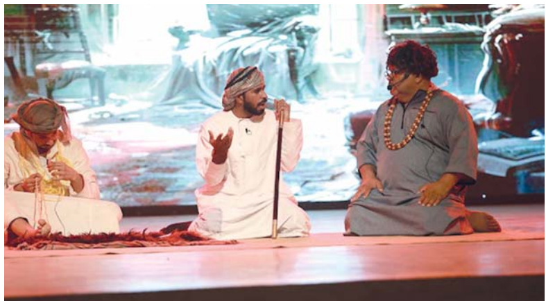
العرض المسرحي تناول وهم العلاج بالمشعر والشعوذة