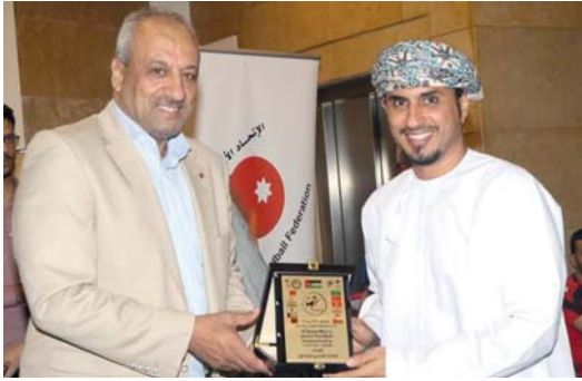
العلاوي يستلم درعا تذكارية من الاتحاد الأردني