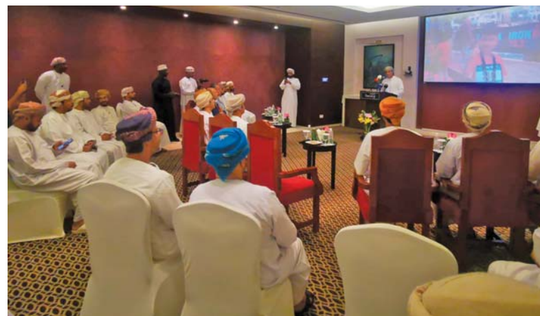
■ من فعاليات المؤتمر

وأضاف: نصف ماراثون صلالة (٢١ كم) يستهدف جميع فئات المجتمع، ويوفر لهم فرصة الجري على شاطئ الحافة، مما يعيد الذكريات للأجيال في منطقة الحافة، بلدية ظفار «الرجل الحديدي ٧٠,٣»، وسيشارك فيه هذا العام ٥٠٠ لاعب من ٥٦ دولة، وسيتمنافس ٤٠ منهم على بطاقات التأهل لبطولة العالم يختم موسم الخريف ويفتح موسم الشتاء ببطولتين مميزتين أثبتنا نجاحهما في الأعوام السابقة، ومن أهم الفعاليات الرئيسية تتضمن: «بلدية ظفار الرجل الحديدي ٧٠,٣»، و«بلدية ظفار ماراثون صلالة»، و«الطفل الحديدي»، و«فندق روتانسا»، و«فندق فنار» على حُسن الشراكة، والتي أصبحت جزءاً من هوية الفعاليات الرياضية في المحافظة.