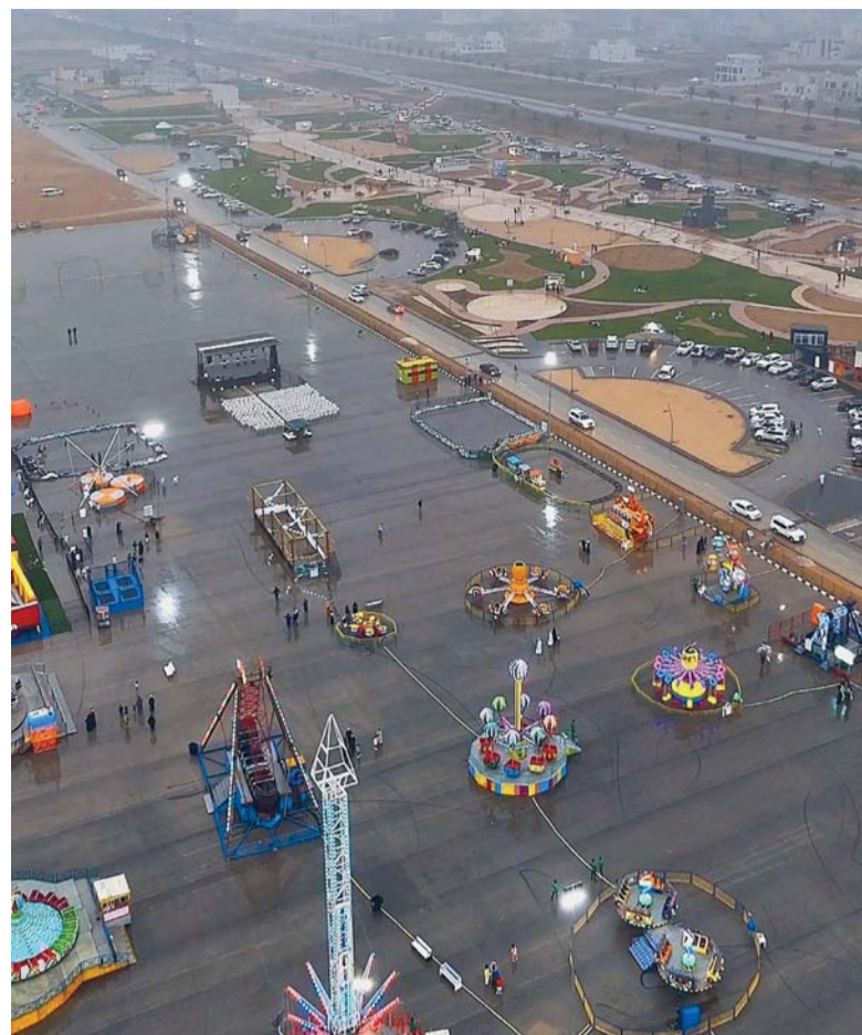
تطوير العديد من المواقع السياحية في خريف ظفار

يستوعب قرابة ٢٠٠ شاب تدرشين العديد من مواقع المقبلتة من بينها موقع «عودة» فعاليات موسم خريف ظفار الماضي، بحلته الجديدة الذي يحاكي البيئات المحلية في ووضوح سعادته بأنه سيتم