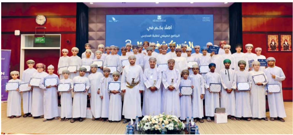
صحار الدولي يدعم مستمر للمبادرات الاجتماعية

مسقط. «الوطن»: شارك صحار الدولي، في حفل تخريج برنامج «المستكشف المالي» الذي نظّمته كلية الدراسات المصرفية والمالية، وبادر البنك بدعم البرنامج كراعٍ مصري حصري، وترجم هذه المبادرة الاستراتيجية التزام صحار الدولي بالإسهام في التنمية الاجتماعية والاقتصادية التي تشهدها سلطنة عمان. تم تنظيم حفل التخرج في كلية الدراسات المصرفية والمالية تحت رعاية سعادة الدكتور عبدالله بن خميس أمبوسعيد، وكيل وزارة التربية والتعليم للتعليم. وأكد خليل بن سالم الهدفي، رئيس