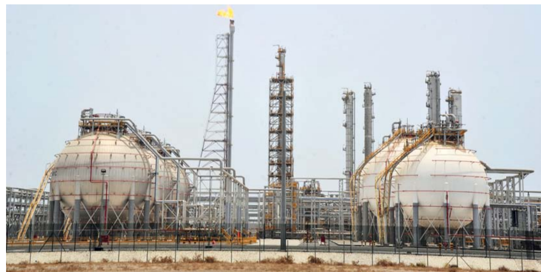
١٣ مليوناً و٢٨١ ألفاً و٣٠٠ برميل إنتاج زيت الغاز (الديزل) بنهاية شهر مايو الماضي

بالمائة مسجلاً ١٠٠ ألف و٥٠٠ طن متري وارتفعت مبيعاته بـ ٢٢,٦ بالمائة مسجلة ١٥ ألف طن متري. وارتفعت صادرات سلطنة عمان من وقود السيارات (٩١) بـ ٨,٦ بالمائة لتبلغ مليوناً و٣١١ ألفاً و٥٠٠ برميل، وسجلت صادرات وقود (٩٥) حتى نهاية مايو الماضي ارتفاعاً بـ ١٥٣ بالمائة لتبلغ ٥٧٢ ألفاً و٨٠٠ برميل في حين بلغت صادرات الديزل ٧ ملايين و٦٤١ ألفاً و٢٠٠ برميل، ومن وقود الطائرات مليونين و٨٩٨ ألف برميل فيما بلغت الصادرات من غاز البترول المسال ٢٣٧ ألف برميل. كما بلغت صادرات الباراكسيلين ٢١٩ ألفاً و٦٠٠ طن متري وسجلت صادرات البنزين ٦٨ ألفاً و٦٠٠ طن متري وبلغت صادرات البولي بروبيلين ٦٦ ألف طن متري.