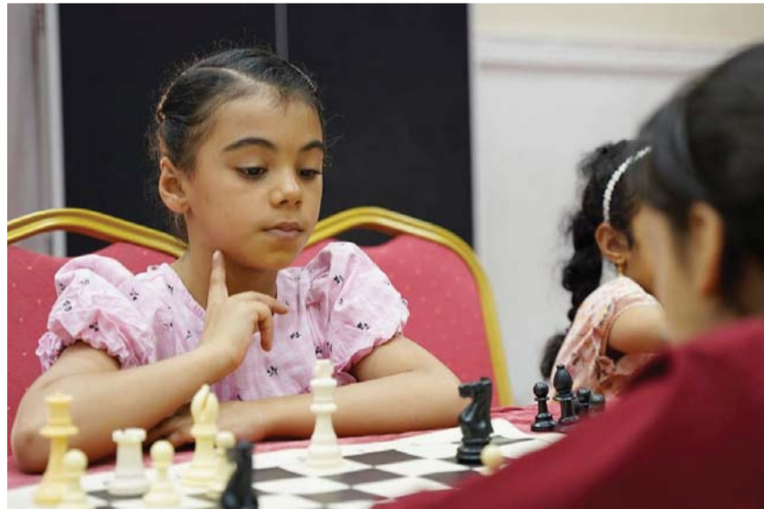
■ من مسابقة الشطرنج

تواصل بولايات محافظة الظاهرة عبري وينقل وضمك، فعاليات ومناشط صيف الرياضة للموسم الحالي والذي تنظمه إدارة الثقافة والرياضة والشباب بمحافظة الظاهرة بالتعاون مع الأندية الرياضية بالمحافظة وبمشاركة واسعة من افراد المجتمع وتفاعل كبير في الانشطة والبرامج الرياضية والترفيهية والاجتماعية، والتي تهدف الى رفع درجة اللياقة البدنية والصحية والمستوى الذهني للأطفال والناشئة واستغلال أوقات الفراغ في ممارسة الرياضة وبناء العلاقات الاجتماعية، واكتشاف المواهب في مختلف المجالات الرياضية، حيث تستكمل المراكز التدريبية الرياضية في محافظة الظاهرة انشطتها للاسبوع الرابع على التوالي، والتي تنوعت ما بين رياضة التزلج بالعجلات وتنس الطاولة والشطرنج في مركز التدريب بنادي عبري ونادي ينقل ومدرسة الديرز للتعليم الاساسي ومراكز تدريب اللياقة البدنية النسائية بنادي ضمك، والمجمع الرياضي بعبري وجمعية المرأة العمانية بيقول والقوال الرياضة في القرى البعيدة عن مراكز الولاية الرياضية متمثلة بالفرق الرياضية الأهلية البعيدة عن الأندية والمجمعات الرياضية، و القافلة الرياضية