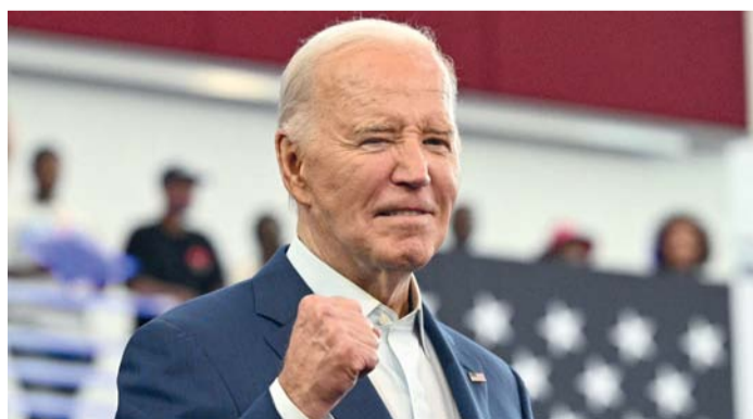
الرئيس الأمريكي جو بايدن أثناء حديث انتخابي بمدرسة رينيسانس الثانوية في ديترويت بولاية ميشيغان

ثانية، إذا قرر فعل ذلك، فهذا يعني عقد مؤتمر مفتوح في أغسطس. نحن نطلب منه اتخاذ هذا القرار. وأضافوا «لا نريد القول إننا نفضل مرشحاً آخر بدلاً منه (كنكنا) واتفقون من أن مرشحاً ديمقراطياً كفوّاً أو أكثر سيتقدمون».