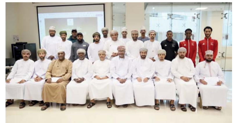
لقطة جماعية للمشاركين في المنتدى

صلالة. من عوض دهيش: نظمت اللجنة الأولمبية العمانية ممثلة في اللجان المساعدة والمعاونة لها مؤخرا بمحافظة ظفار منتدى الرياضيين في سلطنة عمان بمشاركة ٤٠ مشاركا من الرياضيين من الاتحادات الرياضية واللجان الرياضية والأندية من الرياضيين للجنسين، وذلك بمجمع السلطان قابوس الشبابي للثقافة والترفيه. وتأتي هذه الانشطة في اطار الانشطة والفعاليات والدورات التدريبية وورش العمل التي تنظمها اللجنة الأولمبية العمانية خلال العام ٢٠٢٤. اشتمل المنتدى على تقديم ثلاثة محاور رياضية تلامس وتهتم بالرياضيين في الجوانب الرياضية. المحور الأول الذي تحدث فيه الدكتور منصور