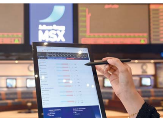
تداولات الأسبوع الماضي اتسمت بالحد من النشاط

مكاسب أسبوعية عند ٢١,٩ مليون ريال عماني، وجاء هذا الصعود في الوقت الذي قامت فيه بورصة مسقط بإدراج وحدات «صندوق جبل للاستثمار العقاري» برأسمال ١٧,٤ مليون ريال عماني. واتسمت تداولات الأسبوع الماضي بالحد من النشاط في انتظار مزيد من الصفقات المالية، وبلغ عدد الصفقات المنفذة الأسبوع الماضي ٢١٥٦ صفقة وهو أدنى مستوى من الصفقات الأسبوعية منذ ٨ أبريل الماضي، فيما سجلت قيمة التداول أدنى مستوى من التداولات الأسبوعية خلال العام الجاري بعد أن هبطت إلى ٧,٦ مليون ريال عماني. وتصدر «صندوق اللؤلؤ للاستثمار العقاري» الأوراق المالية الأكثر تداولاً من حيث قيمة التداول بـ ٩٢٨ ألف ريال عماني تمثل ١٢ بالمائة من إجمالي قيمة التداول، وجاءت شركة صناعة الكابلات العمانية في المرتبة الثانية بـ ٨٨٢ ألف ريال عماني ثم بنك صحران الدولي بتداولات بلغت ٨٦٤ ألف ريال عماني تمثل ١١,٢ بالمائة من إجمالي قيمة التداول. وارتفعت أسعار ٢١ ورقة مالية مقابل ٣٥ ورقة مالية تراجعت أسعارها ٢٢ ورقة