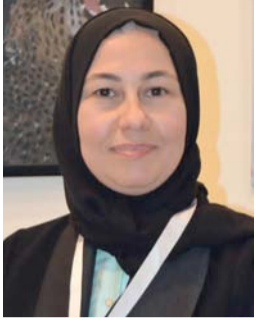
■ وفاق الحسن