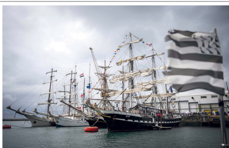
■ سفن شراعية ترسو أثناء افتتاح مهرجان بريست البحري الثامن شمال فرنسا، وهو أحد أكبر التجمعات البحرية في العالم

إصابات. كما ضربت عواصف قوية مهرجانا يقام في الهواء الطلق في سلوفاكيا، مما تسبب في إصابات وانهايار خيام وتوقف مؤقت للمهرجان. وانهارت خيمة كبيرة والعديد من الخيام الصغيرة أو تضررت خلال العاصفة، حسبما ذكرت وكالة أنباء «تاسر». وقال مركز التحكم إن خدمات الطوارئ نقلت ١٠ أشخاص أصيبوا بجروح بسيطة إلى مستشفيات قريبة. واضطر مهرجان بوهدوا، الذي أقيم من ١١ وحتى ١٣ يوليو في مطار تريشين غرب سلوفاكيا إلى وقف برنامجه مؤقتا بسبب الطقس السيء. وتم نشر أفراد بأعداد كبيرة من خدمات الطوارئ، ومن بينها الشرطة وفرقة الإطفاء. وتم تحويل قاعة ألعاب رياضية إلى مركز إيواء لزوار المهرجان. ■