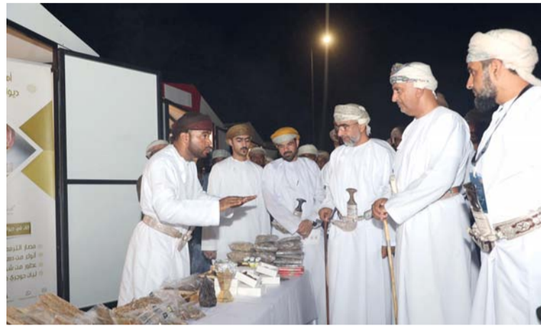
الملتقى يسهم في إيجاد إضافة نوعية للأنشطة السياحية في محافظة جنوب الشرقية

شهد الأسبوع الماضي العديد من الأحداث الاقتصادية والتي كان أبرزها، مشاركة سلطنة عمان في المنتدى الاقتصادي العربي الياباني الخامس، وناقش المنتدى عدداً من الموضوعات، منها: التنمية الاقتصادية المرنة، والتنمية الاقتصادية المستدامة بين الدول العربية واليابان، وتوسيع الاستثمار المتبادل والتنوع الاقتصادي والتعاون من أجل الابتكار، إلى جانب الجهد المشترك من أجل تغيير المناخ والمنتجات الخضراء، والمياه، وإدارة النفايات، والهيدروجين والأمونيا، واحتجاز وتخزين الكربون، والتقنيات الجديدة المتعلقة بالاتصالات السلكية واللاسلكية، والذكاء الاصطناعي، وبناء سلسلة توريد مرنة. تواصل فعاليات النسخة الثانية من ملتقى «أجواء الأشجرة» في محافظة جنوب الشرقية بحدائق الأشجرة العامة التي بدأت فعاليات النسخة الأولى يوم الأربعاء الماضي