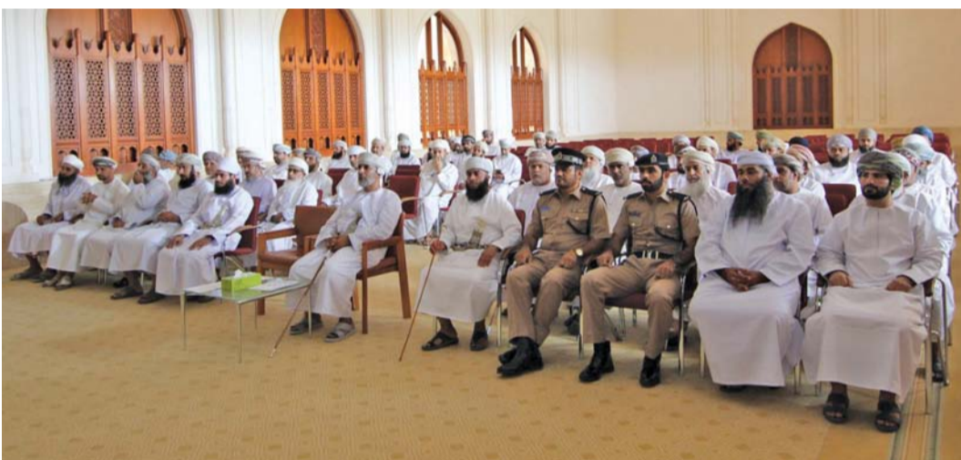
الندوة دعت لنشر المحبة والتأخي بين أفراد المجتمع