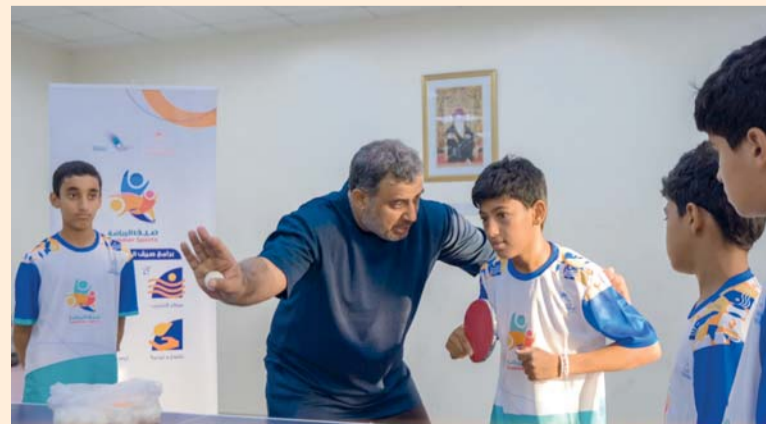
■ من البرنامج التدريبي للاعبين المراحل السنوية