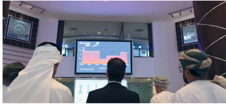
بورصة مسقط تسعى إلى تنشيط حركة التداول من خلال تنويع الأدوات الاستثمارية

وتمثل القيمة السوقية لسوق السندات والصكوك حوالي ١,٨ بالمائة من إجمالي القيمة السوقية للأوراق المالية المدرجة في بورصة مسقط التي بلغت بنهاية يونيو الماضي ٢٤ ملياراً و ٢٨٠ مليون ريال عماني. وبحسب عملية إعادة الهيكلة تم تخفيض حجم السندات من ٢٠ مليون سند إلى ١٠ ملايين سند بقيمة اسمية تبلغ ١٠٠ بيضة للسند الواحد، وتبعاً لذلك قامت بورصة مسقط بتخفيض عدد سندات شركة ظفار للتأمين المدرجة في البورصة اعتباراً من ٢ يونيو الماضي وحتى تاريخ استحقاقها في ٣٠ يونيو من عام ٢٠٢٥. وفي قطاع الصكوك أدرجت بورصة مسقط في النصف الأول من العام الجاري صكوك «ثال» بحجم ٥٥,٩ مليون ريال عماني، والإصدار الثالث من صكوك ميثاق بحجم ١٦,٥ مليون ريال عماني. وبلغت القيمة السوقية الإجمالية لسوق السندات والصكوك بنهاية يونيو الماضي ٤ مليارات و ٣٥٥ مليون ريال عماني.