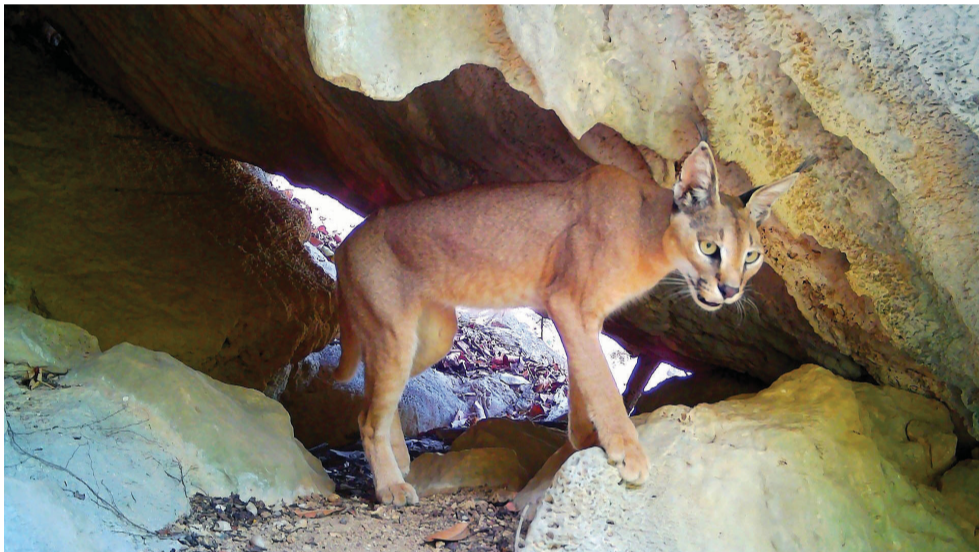
■ الوشق لم يحظ بالدراسات الكافية في شبه الجزيرة العربية

صلالة - العمانية : كشف تقرير علمي وقعه باحثون عُمانيون، عن مشاهد حديثة في جبال محافظة ظفار بسلطنة عُمان حول سلوك الافتراض لدى حيوان الوشق، الذي يُمثل أحد أنواع السنوريات واسعة الانتشار في شبه الجزيرة العربية. وأوضح التقرير الذي نشرته مجلة السنوريات التابعة للاتحاد الدولي لصون الطبيعة والصادرة في سويسرا بأن الوشق رُصد وهو يقوم باقتراس أنواع عدة من الثدييات، بما في ذلك القوارض الصغيرة، والوبر الصخري، وسُجل لأول مرة وهو يفترس حيوان النموس ذا الذيل الأبيض الذي يُعد أصغر حجماً منه بقليل، بعد رصده من قبل إحدى الكاميرات الخفية في محمية جبل سمحان الطبيعية. وفي هذا السياق، قال الدكتور هادي بن مسلم الحكامني أحد أعضاء الفريق البحثي في تصريح لوكالة الأنباء العمانية: إن هذه