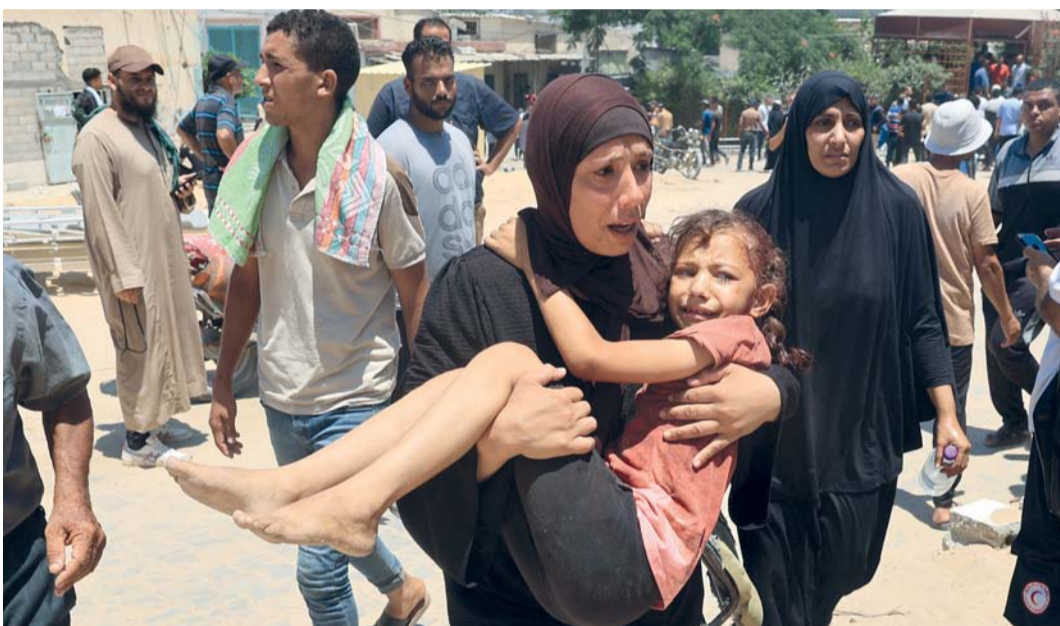
فلسطينية تحمل طفلتها المصابة جراء غارة إسرائيلية عنيفة في خان يونس جنوب غزة

أعلنت وزارة الصحة الفلسطينية في غزة استشهاد أكثر من ٧١ شخصا وإصابة ٢٨٩ آخرين جراء قصف إسرائيلي استهدف نازحين في منطقة مواصي محافظة خان يونس جنوب القطاع. وقالت الوزارة، في بيان أورده «المركز الفلسطيني للإعلام»، إن حصيلة الشهداء المرشحة للارتفاع لوجود حالات إصابة خطيرة ما زالت الطواقم الطبية تتعامل معها. ووفق المركز، «قصف جيش الاحتلال بسنة صواريخ عمارة سكنية على الطريق العام ما بين مفترق النص ودوار جامعة الأقصى في مواصي خان يونس التي سبق أن حدها الاحتلال منطقة أمنة، قبل أن يجري شن أزمّة نارية وقصف خيام