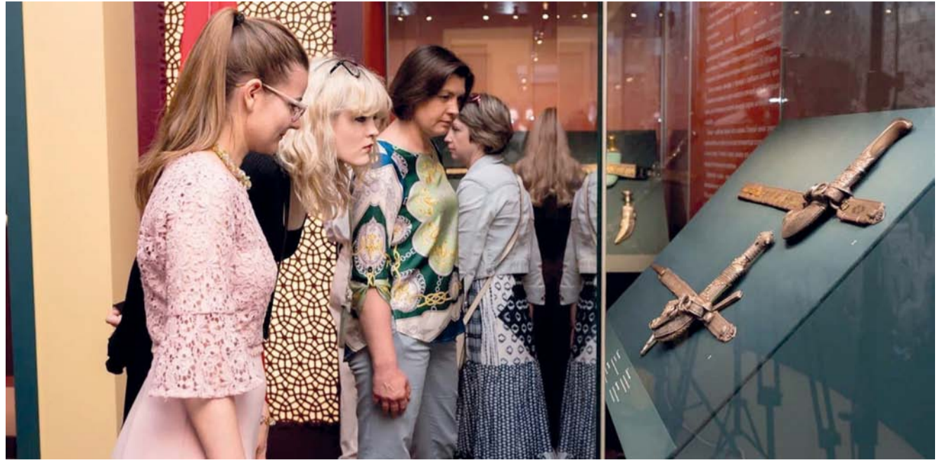
■ المعرض يُبرز براعة الحرفيين العمانيين في المشغولات الفضية