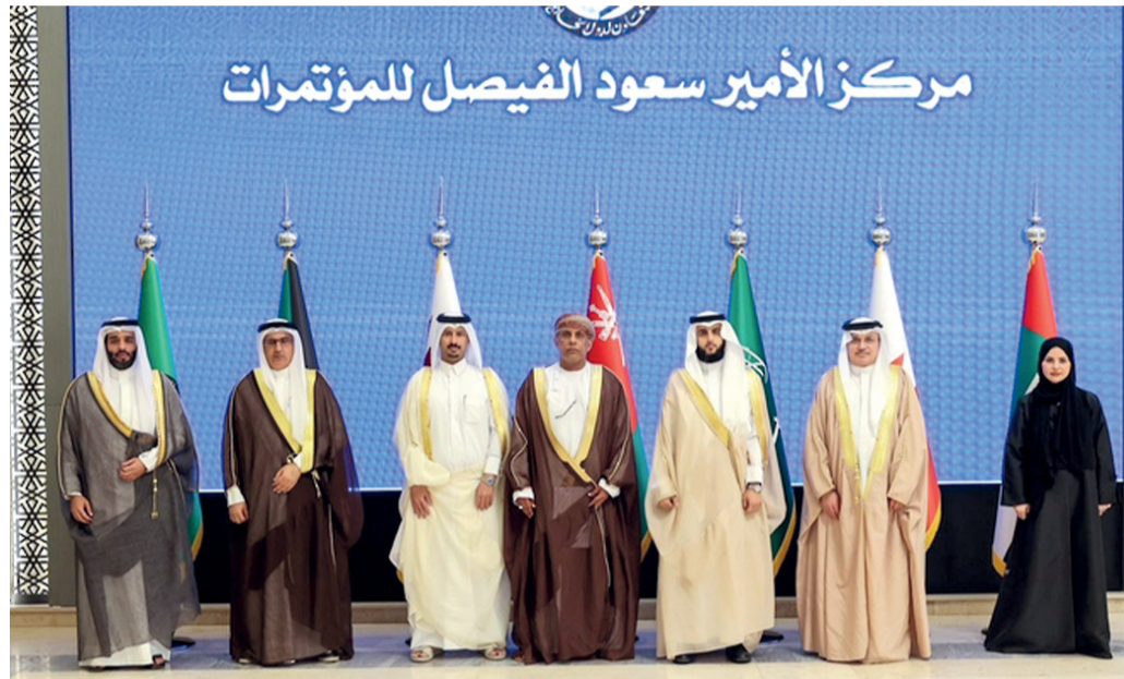
صورة جماعية للمشاركين في الاجتماع التشريعي لمجلس التعاون بالرياض