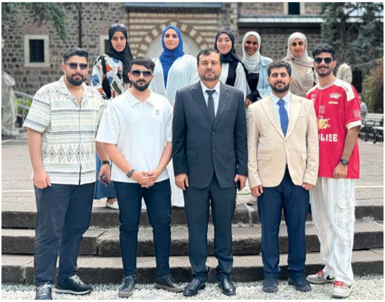
■ الطلبة المتفوقون أثناء زيارتهم لتركيا