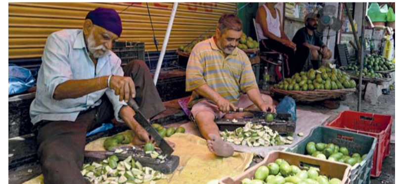
باعة ينتظرون الزبائن على أحد شوارع أمريتسار الهندية، حيث يعرضون أنواعاً عديدة من المانجو. (د ب أ)

نوبلهي. (د ب أ): ضخ المستثمرون المحليون ١٣,٧٩ مليون دولار أميركي في قطاع العقارات الهندي خلال الفترة من أبريل إلى يونيو - وهي قفزة خمسة أضعاف على أساس سنوي - متوقعين عوائد أفضل وسط طلب قوي، وفقاً لوكالة الاستشارات العقارية (فيستيان). وأصدرت فيستيان أمس السبت بيانات الاستثمارات المؤسسية في العقارات