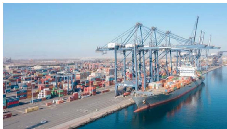
«كريدت عمان» تواصل جهودها لتقديم الخدمات للمصنعين والمصدرين لزيادة حجم مبيعاتها

عام ٢٠٢٤م نموًا في حجم المبيعات المؤمنة في قطاع المواد الغذائية والاستهلاكية بنسبة ٣٢ بالمائة وبقية إجمالية بلغت ٥٧ مليوناً و٢٢٣ ألف ريال عماني مقارنة بالفترة ذاتها من العام الماضي البالغة ٤٣ مليوناً و٣٢٩ ألف ريال عماني، في حين شهد قطاع المواد البترولية والمواد البترولية والمواد البترولية والمواد البترولية بنسبة ١٣٤ بالمائة وبقية إجمالية بلغت ١١ مليوناً و٣٢٣ ألف ريال عماني، فيما انخفضت قيمة المبيعات المؤمنة لقطاعات التعدين وصناعات الملابس لدى