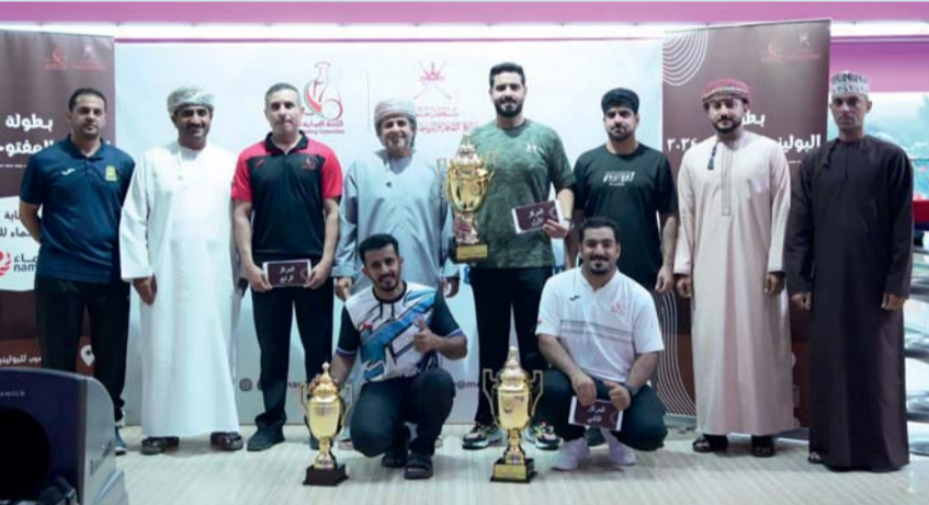
لقطة جماعية لأصحاب المراكز الأولى

واشار بان البطولة خرجت بنجاح وبتنظيم جيد من قبل اللجنة العمانية للبولينج والذين تقدم لهم كل الشكر والتقدير على المساهمة في دعم ونشر هذه اللعبة ولمسنا مدى الاهتمام الكبير من اللاعبين واللاعبات وكذلك من لاعبي المراحل السنوية الاهتمام الكبير بالمشاركة في مثل هذه البطولات والتي تخدم اللعبة وتطويرها وهي نواة جيدة لصلف اللاعبين لتمثيلهم للمنتخب الوطنية في المشاركات الخارجية متمنين لهم كل التوفيق والنجاح.