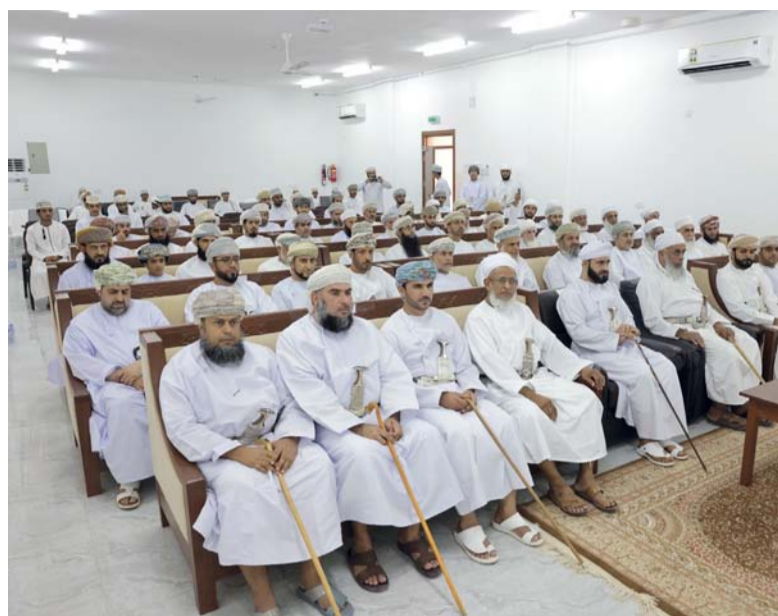
راعي الحفل وحضور افتتاح المدرسة

٣. تدفع رسوم المناقصة من خلال استخدام بطاقات الفيزا إلكترون أو بطاقات "الفيزا" الائتمانية الصادرة من البنوك العاملة بسلطنة عمان.