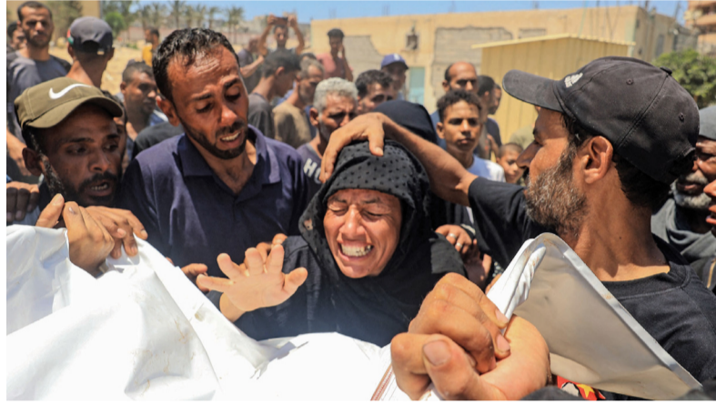
فلسطينية تنتحب على استشهاد أحد أفراد عائلتها في العدوان الوحشي الإسرائيلي بمواصي خان يونس جنوب غزة (الصورة من أ ف ب)

القدس المحتلة. «الوطن». وكالات: ارتكبت قوات الاحتلال الإسرائيلي مجزرتان جديدتان بحق الشعب الفلسطيني في إطار الإبادة الجماعية التي ينفذها الاحتلال، حيث قصف الاحتلال مخيمات النازحين في خان يونس به صواريخ، ما أسفر عن إصابة واستشهاد مئات الفلسطينيين. وأعلنت وزارة الصحة في غزة وصول ٧١ شهيداً وأكثر من ٢٨٩ مصاباً بعضهم في حالة خطيرة إلى مجمع ناصر الطبي إثر قصف الاحتلال مخيمات النازحين بخان يونس. من جانبها، نفت فصائل المقاومة الفلسطينية استهداف الاحتلال قيادات بمخيم النازحين في المواصي بخان يونس، مؤكدة أن مزاعمه لتبرير المجزرة واغتيال المدنيين، وقال المكتب