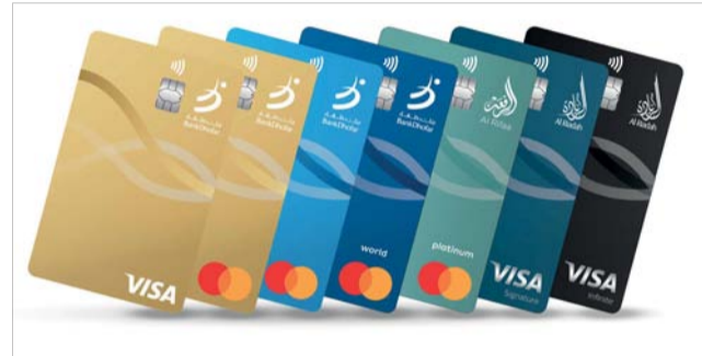
■ بطاقات بنك ظفار الائتمانية تعتبر مثالية في الرحلات

البطاقة حتى تحظى البطاقات بتقدير وقبول عالمي، وفرة ائتمانية بدون فوائد تصل إلى ٤٧ يوماً، إضافة إلى نقاط مكافآت على جميع معاملات الشراء (باستثناء إي-كوم وبطاقة الشركات) وتسهيلات السلفة النقدية في ملايين أجهزة الصراف الآلي في جميع أنحاء العالم (باستثناء إي-كوم).