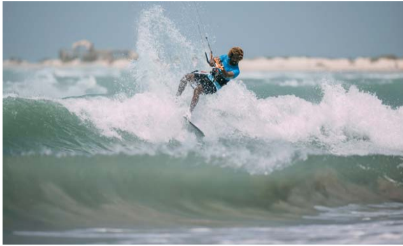
من استعراض أحد المتزلجين في البطولة

كما أشار مارسيلو إلى أن سباقات عُمان للتزلج المظلي ٢٠٢٤ أصبحت منصة جذب عالمية للرياضيين، وأن تنظيم هذه البطولة مستقبلاً سيوفر فوائد متعددة في المجالات الرياضية، السياحية، الثقافية، والاقتصادية، مما يسهم في تطوير رياضة التزلج المظلي محلياً وتعزيز مكانة سلطنة عُمان في هذا المجال. جدير بالذكر، أن سباقات عُمان للتزلج المظلي تأتي بتنظيم من الشركة العُمانية للتنمية السياحية (مجموعة عمران) بالتعاون مع عُمان للإبحار، والمشغل الوطني للسفر Visit Oman، ومركز مغامرات عُمان ومؤسسة Sea & Beach. وشهدت مشاركة رياضيين دوليين أبرزهم؛ وروبن لنتن، المحترف الهولندي الذي فاز بسباق ريد بول في عام ٢٠٠٥. إضافة إلى هانا وايتلي، بطلة بريطانيا في التزلج المظلي، وميتو مونتيرو، مدرب التزلج على الأمواج، وفرناندو فيرنانديس، الرياضي المتكبر في الألعاب الرياضية الشاملة لأشخاص ذوي الإعاقة.