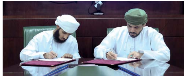
■ المذكرة تهدف إلى تعزيز بيئة استثمارية مستدامة في سلطنة عمان

من خلال تعزيز الثقافة المالية الإسلامية وتقديم حلول استثمارية متوافقة مع المبادئ الشرعية، استجابة للطلب المتزايد على منتجات وخدمات مالية تتسم بالاستقرار والشفافية، وتوفير بيئة مالية