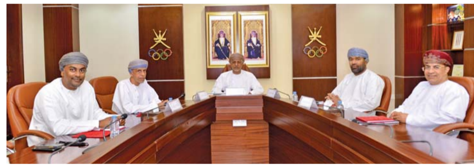
صورة أرشيفية من أحد الاجتماعات السابقة للمكتب التنفيذي

واختتم اجتماع المكتب التنفيذي الثالث للجنة الأولمبية العمانية بمناقشة العديد من الموضوعات التي أدرجت في بند ما يستجد من أعمال واتخذ بشأنها التوصيات والقرارات اللازمة.