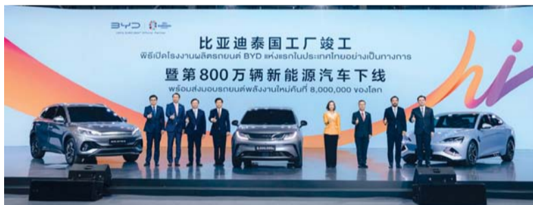
■ لحظة إطلاق السيارات الجديدة في مصنع شركة بي واي دي

شركة بي واي دي رائدة عالمياً ورائدة في صناعة سيارات الطاقة الجديدة في الصين، حيث إن استثمارها في تايلاند سيؤديها إلى الأمام من خلال تطوير صناعة مركبات الطاقة الجديدة عبر رابطة أمم جنوب شرق آسيا.