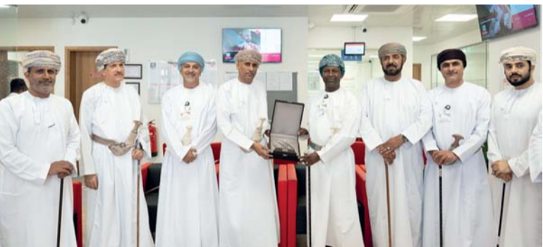
صورة جماعية عقب افتتاح بنك مسقط لفرعه في منطقة صحنوت

مختلف الخدمات للزبائن في كل مكان وتلبية متطلباتهم المصرفية المختلفة كما يمثل إضافة مميزة إلى الفروع الموجودة في ولاية صلالة بشكل خاص ومحافظة ظفار بشكل عام وهو امتداد للخدمات المصرفية التي يقدمها البنك لتتمثل القاطنين في هذه المنطقة وكذلك الزبائن لتنفيذ مختلف المعاملات المصرفية مؤكداً استمراره في افتتاح الفروع الجديدة لوكالة مختلف المستجدين والتطورات المصرفية مع حرص البنك على تجهيز هذه الفروع