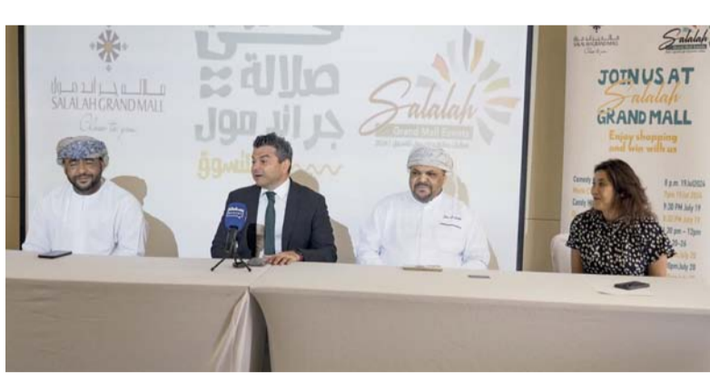
الفعاليات تتضمن العديد من الجوائز والمسابقات

وتتضمن فعاليات صلاة جرانند مول للتسوق لهذا العام إقامة مسابقة الجاليات للأماكولات، التي ستقام في صلاة جرانند مول ضمن فعاليات المول للتسوق، حيث سيفوز المشاركون بقسائم نقدية ودرع المول. بالإضافة إلى تنظيم مسابقة الإلقاء الشعري للأطفال حتى سن ١٦ سنة ضمن فعاليات صلاة جرانند مول للتسوق وذلك خلال الفترة من ١٥ وحتى ١٧ أغسطس القادم.