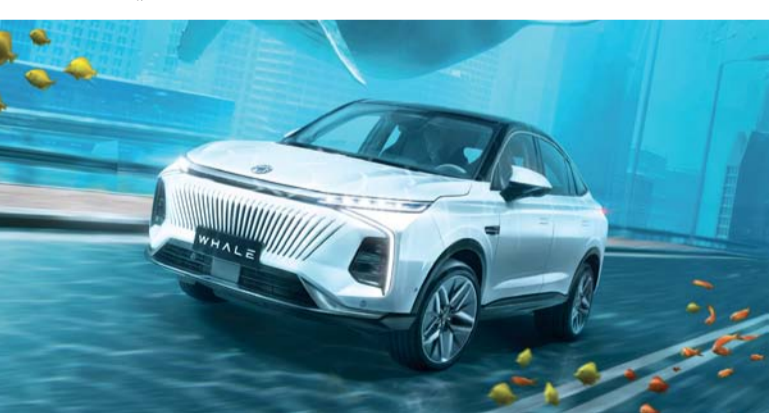
سيارات إم جي تقدم تجارب قيادة فريدة من نوعها