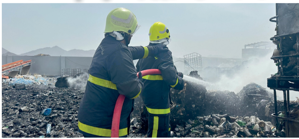
الحريق لم يسفر عن خسائر بشرية أو إصابات

ضبطت هيئة حماية المستهلك مؤسسة تجارية مختصة في قطاع الملابس والمنسوجات وخدماتها تقوم ببيع وتوزيع ملابس عسكرية (محظورة) غير مصرح بتداولها، وذلك في إطار الجهود التي تبذلها الهيئة في الحد من التجاوزات التي يقوم بها بعض الباعة والمزودين، وضبط السلع المحظورة والمخالفين. وتعود التفاصيل إلى تلقي المعنيين بدائرة تنظيم ومراقبة الأسواق بلاغاً من أحد المستهلكين يفيد قيام مؤسسة تجارية مختصة في قطاع الملابس والمنسوجات وخدماتها ببيع وتوزيع ملابس عسكرية (محظورة) غير مصرح بتداولها على عدد من المحال التجارية في محافظة مسقط بولاية السيب بغرض بيعها على المستهلكين، وعليه باشرت الهيئة في التحقق من صحة البلاغ ومداومة موقع مخزن المؤسسة وضبط ومصادرة عدد ٥٢٠ قطعة من الملابس العسكرية المحظورة وتحرير مخالفة ضد المؤسسة المذكورة، وجار استكمال الإجراءات القانونية ضد المخالفين، وبذلك تكون المؤسسة خالفت القرار رقم (٢٠١٩/٩) الخاص بحظر تداول الملابس العسكرية أو الشبيهة بها وملحقاتها.