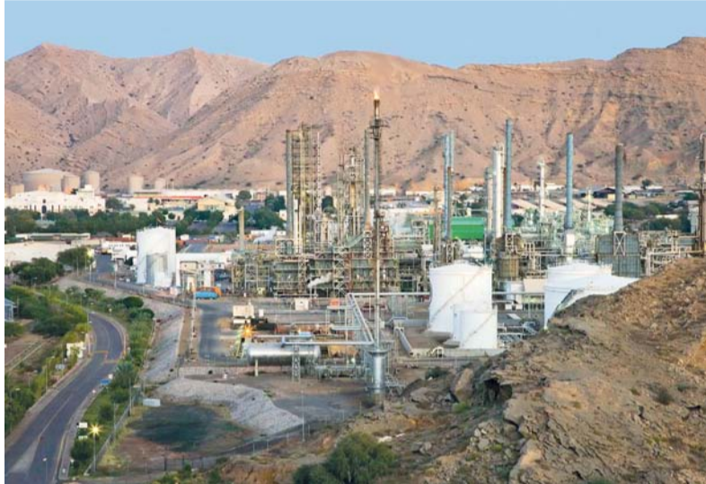
■ الإنفاق العام حتى نهاية مايو الماضي بلغ حوالي ٤ مليارات و٧٢٤ مليون ريال عماني