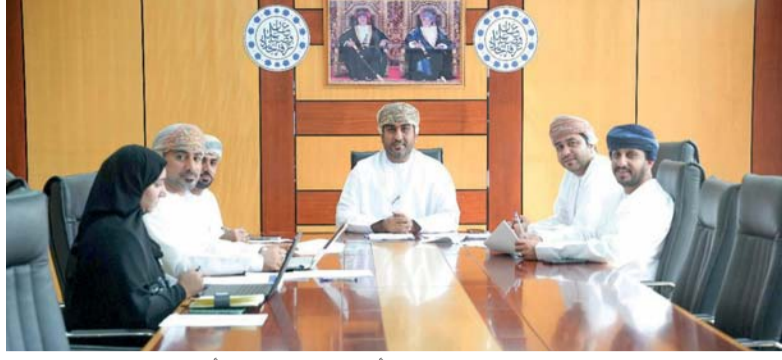
الاجتماع ناقش المبادرات التي تخدم أصحاب وصاحبات الأعمال بالمحافظة