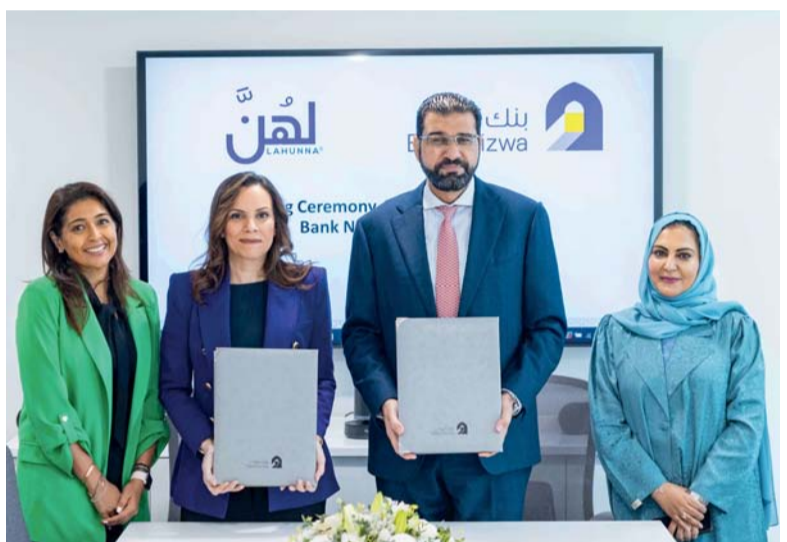
■ برنامج سدره يهدف إلى تاهيل ٦٠ امرأة عمانية

الجدير بالذكر أن الهيئة تجري هذه المسوحات بشكل شهري لتجويد خدمات الاتصالات المقدمة حسب الخطة السنوية من خلال نشر تقارير تغطية الجيل الخامس والرابع.