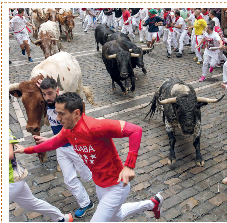
شباب يركضون أمام ثيران خلال سباق في إطار مهرجان بشمال إسبانيا