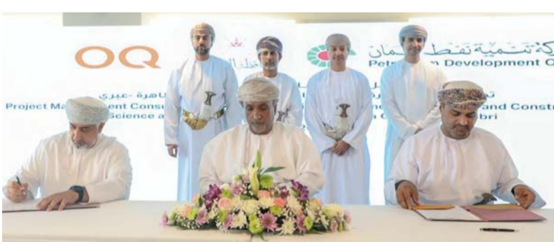
■ إنشاء المركز يأتي تجسيدا للمسؤوليات الاجتماعية للشركات الوطنية في خدمة المجتمعات المحلية

مركز للعلوم والابتكار خدمة المجتمع المحلي في المجالات التعليمية والثقافية والترفيهية، ويشمل مركزاً للابتكار، ومتحفاً، ومسرحاً مفتوحاً، وورشة المقاهي والمطاعم ومساحات خضراء وألعاب ترفيهية، ومرافق أخرى. ويعزز المركز إمكانيات محافظة الظاهرة في مجالات الابتكار والثقافة، ويفتح آفاقاً أوسع أمام الشباب العماني لوصول إبداعاتهم وتنمية مهاراتهم في المجالات العلمية والثقافية. وسيتم إدارة المشروع والإشراف عليه من قبل شركة تنمية نطق عمان حتى الانتهاء، وبعد ذلك سيتم تسليمه إلى مكتب محافظة الظاهرة للتشغيل والإدارة.