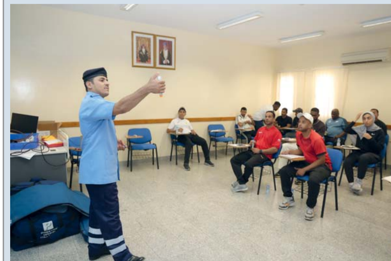
أحد المحاضرين في الحلقة التدريبية أثناء تقديم محاضراته

حيث جاءت نتائج القرعة كما يلي: المجموعة الأولى: (جماء، خفدي، عيني، نجوم الشرق، وبل)، والمجموعة الثانية: (العويبي، رياح الحيملي، الأرياف، الشعلة، الحجر الغربي)، أما المجموعة الثالثة: (الحزم، التضامن، الجزيرة، الضفتين، المزاحيط)، والمجموعة الرابعة: (الهلال، البادية، وادي السحتن، الاتحاد، الغشيب) وسوف تنطلق منافسات الدوري يوم الخميس القادم الثامن عشر من الشهر الجاري.