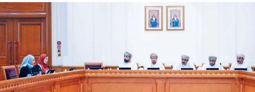
مناقشة المبادرات المقترحة في آلية الابتعاث الخارجي

عقدت لجنة التعليم والبحث العلمي والابتكار بمجلس الشورى لقاءً مع عدد من الأكاديميين المتخصصين في مجال التعليم صباح أمس، وذلك لمناقشتهم حول المبادرات المقترحة من قبلهم والمتعلقة بالتعليم، وآلية الابتعاث الخارجية في سلطنة عمان. وتضمن اللقاء تقديم عروض مرئية حول تلك المبادرات، تمحور العرض الأول حول مبادرة تتعلق بفكر الريادي لدى الطلبة في مختلف المراحل التعليمية؛ والذي تضمن تعريف أعضاء اللجنة بالمبادرة، وأهدافها وآلية تنفيذها، ومميزاتها، كما تم استعراض التحديات المترتبة بعدم تطبيق المبادرة في سلطنة عمان مستقبلاً. كما تخلل اللقاء تقديم عرض مرئي حول مبادرة تتعلق بتأسيس (هيئة دعم للاستثمار وصندوق المنح)، وتهدف