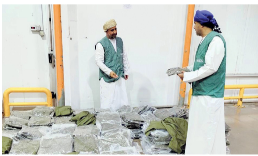
الملابس غير المصرح بتداولها