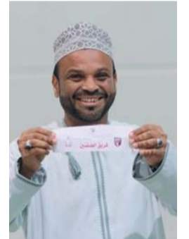
من سحب القرعة

انطلقت امس الأول الحلقة التدريبية لتأهيل الكوادر الفنية بالهيئات الرياضية والتي تنظمها وزارة الثقافة والرياضة والشباب ممثلة في دائرة الطب وعلوم الرياضية بالمديرية العامة للرعاية والتطوير الرياضي وبالتعاون مع هيئة الإسعاف والدفاع المدني وسط حضور ١٨ مشاركاً يمثلون الهيئات الرياضية المختلفة، وتعتبر دورة الإسعافات الأولية والإنعاش القلبي الرئوي ومزيل الرجفان الخارجي الآلي AED لمنقذ القلب هي عبارة عن دورة تدريبية معتمدة من جمعية القلب الأمريكية (AHA)، والقائمة على نظام الفصل الدراسي والشرح باستخدام الفيديو الخاص بالدورة تحت إشراف أحد المدربين المعتمدين للقيام بالدورة، وهي تعلم المتدرب كيفية الاستجابة للحالات الطارئة والقيام بالإسعافات الأولية، أو التعامل مع حالت الإختناق أو السكتات القلبية الطارئة في الدقائق القليلة الأولى لحين وصول أخصائي الطوارئ أو المتخصصين في الرعاية الصحية وتولييه المسؤولية. وفي هذه الدورة التدريبية يكتسب المتدرب أيضاً مهارات عدة مثل كيفية التعامل مع الزيف والتواءات المفاصل وكسور العظام والصدمات وغيرها من الحالات الطارئة الأخرى التي تستلزم استخدام الإسعافات