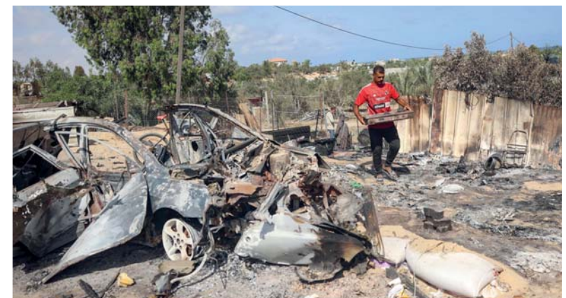
فلسطيني يحمل أغراضه بينما يسير بجوار سيارة دمرت خلال غارة إسرائيلية في منطقة المواصي شمال رفح بغزة.

أعلن جيش الاحتلال الإسرائيلي أنه ينفذ عمليات بتغطية جوية في شمال غزة أنت إلى استشهاد عشرات الفلسطينيين في حي الشجاعية. فيما أفادت مصادر طبية باستشهاد ٣١ فلسطينياً إثر تواصل القصف الإسرائيلي على مناطق متفرقة في قطاع غزة منذ فجر أمس.