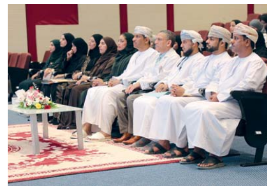
الحضور أثناء الحفل

والتثقيف في مجال الصحة العامة ودور الشركات المجتمعية المحلية الحكومية والخاصة في تحقيق أهداف المبادرة. كما تم استعراض أهم المشاريع المستدامة التي تسهم في تعزيز ثقافة الصحة العامة والمحافظة على البيئة. يذكر أن مشاركة جامعة الشرقية في مبادرة مؤسسات التعليم العالي تدرج أهميتها في تخرير جيل واع. كما تهدف هذه المبادرة إلى المحافظة على الصحة وتحقيق اشتراطات السلامة في البيئة الجامعية.