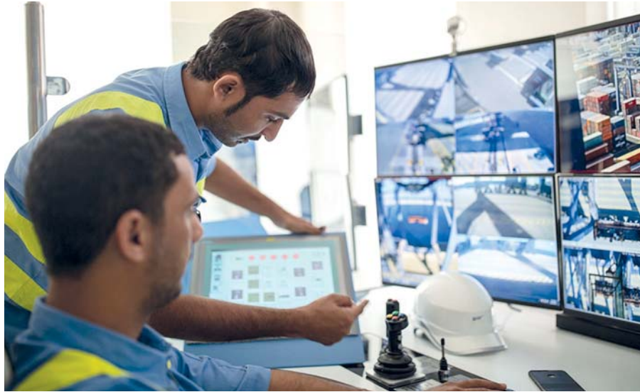
مشاريع محفظة التنمية الوطنية تتضمن مجموعة من القطاعات أبرزها الطاقة والصناعة والسياحة والغذاء واللوجستيات

مليون ريال عماني. وفي إطار الاستفادة من الثروات الطبيعية وتعزيز الاستثمار فيها وتصديرها إلى الأسواق العالمية بما يعود بالنفع على نمو الناتج المحلي الإجمالي؛ نجحت الشركة العمانية للغاز الطبيعي المسال في توقيع بنود ملزمة بهدف تصدير ١٠,٤ ملايين طن متري من الغاز الطبيعي المسال سنوياً بعد عام ٢٠٢٤م إلى عدد من الشركات العالمية حول العالم بما يدعم سمعة سلطنة عمان وموثوقيتها في التصدير في هذا القطاع الحيوي. وأعلنت مجموعة تنمية معادن عمان عن اكتشافات جديدة من خام النحاس بلغ مقدارها ٤,٨ مليون طن، ومن خام الكروم بلغت حوالي ١٦٣ ألف طن، بالإضافة إلى ١١١ مليون طن من السيليكات الناعمة و٩٨ مليون طن من السيليكات الصلبة، بالإضافة إلى الدولومايت بمقدار ٤٠١ مليون طن، وعملت الشركة العمانية للاستثمار الغذائي القابضة «ناتج» على التوسع في الزراعة التعاقدية في مشروع المروج للألبان وبدء تصدير حليب الإبل للمملكة العربية السعودية عبر توقيع اتفاقية مع شركة سوانتي السعودية، وأيضاً إيصال منتجات شركة تنمية نخيل عمان إلى ٨ أسواق جديدة وهي روسيا، وبيرو، والعراق، وليبيا، ومصر، وإيران، وقطر، والإمارات. وبهدف تعزيز الشراكات الاستثمارية مع القطاع الخاص والمستثمرين المحليين والخارجيين؛