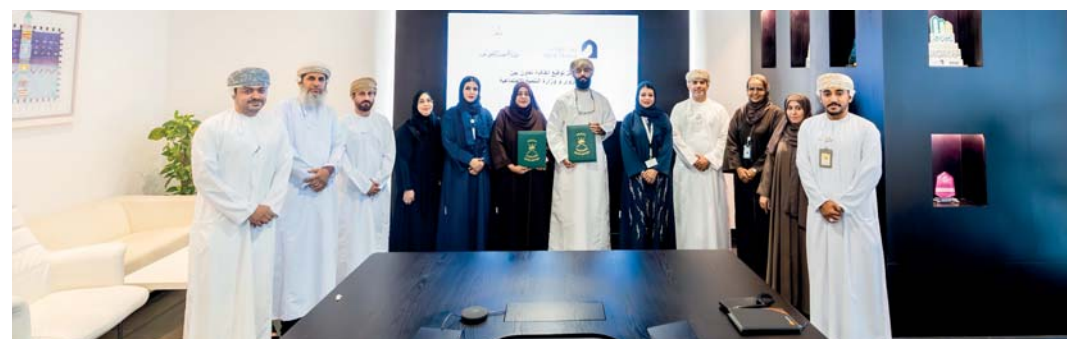
بنك نزوى يدعم حلقة المشغولات الجلدية للأشخاص ذوي الإعاقة