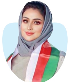
د. رقية بنت إسماعيل الظاهرية طبيبة وكاتبة عمانية

دعوني أخبركم عن خبايا الأحداث في غرفة العناية المركزة لهذا المولود الذي يردد تحت رحمة ربه، وضع له أمر (DNR) بعدم الإنعاش القلبي الرئوي بجسده الضئيل، موصل بأجهزة قياس نبضات القلب وأجهزة قياس الأكسجين وأجهزة الإنذار والتي جميعها تعترف لحنا بوتير حزين بأن الحالة حرجة لأقصى حدود، وأعيننا تتجلق بشاشات المؤشرات الحيوية تخبرنا عن قصة هذا المولود وملامح ما تبقى له في هذا العالم. لطالما انتظره والده بشوق، وحملته أنه في أحشائها تسعة أشهر حباً ليعيش بعد ولادته تسعة أيام عجا، مولوداً بمتلازمة من الابتلاءات الخلقية في القلب، لا تستطع إصلاحها يد أشهر الجراحين، ولا يسكنها أي طبيب. هذه الأعباء الوخيمة تلقى علينا ظلالها بتقلها، قلب مفطور. تذهب الطبيعة المتردية لتقلل الخبر للودين، تبدأ بمقدمات توجي بالفاؤل، إلا أن لغتنا الطبية تستبق الموقف، وتفرض الحتميات جرحها النازف، لتعلن عن النهاية والاقتراب من نقطة الصفر. حان موعد الدواع، في مشهد تتأجج