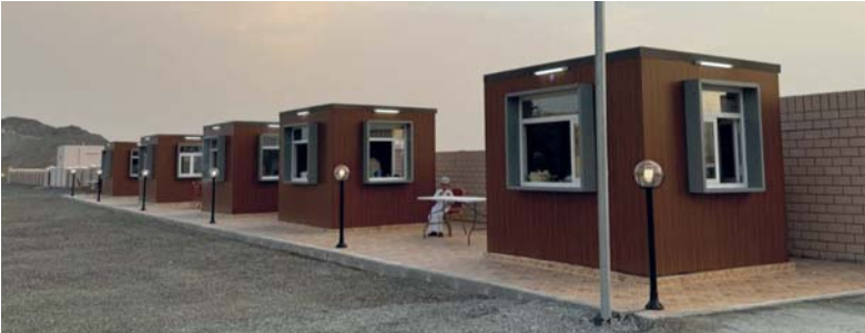
تشجيع الشباب على ريادة الأعمال

والتهريب وأماكن الجلوس، وأيضاً سهولة الوصول إلى هذه المنافذ من قبل الأهالي والعابرين. وأشار الجيائي إلى أن الهدف من إيجاد مثل هذا المشروع هو مساعدة هؤلاء الشباب لإيجاد المكان المناسب لعرض منتجاتهم وخلق فرص عمل لهم، وفي نفس الوقت تشجيعهم على ريادة الأعمال فتكون نقطة انطلاق لهم لتوسيع أعمالهم في المستقبل. ويحتوي المشروع على خمسة أكشاك (منافذ تسويق) تم تبنيها من قبل فريق بهلاء الخيري ولجنة التنمية الاجتماعية برئاسة سعادة الشيخ والي بهلاء. وقد بلغت تكلفة المشروع ٩٥٠٠ ريال عماني وتم إنجازه هذا المشروع في مدة ٦٠ يوماً.