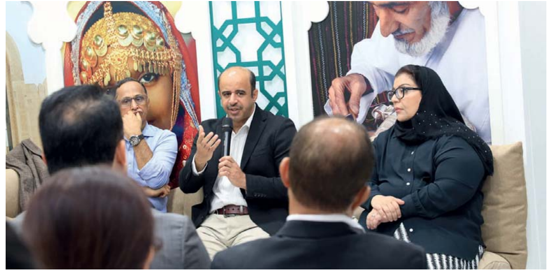
المشاركون في جلسة «الرواية.. دهشة السرد العُماني»

تعبّر عنا كأشخاص من الداخل وتكشف عن المجتمعات المعقدة وهذا من فنون الأوب. كما تحدث المشاركون في الجلسة الحوارية عن الترجمة والجوائز وأهميتها، مؤكدين على أن الجوائز تساعد على أن تكون مقروءاً من المجتمعات الأخرى وعلى ترجمة النصوص وأن الحصول على الجوائز لا يعني بالضرورة أنك روائي جيد فالقوة الحقيقية أن تخرق الزمن وتظل كاتباً مقروءاً، والفوز الحقيقي هو أن يملك الكاتب شيئاً أصيلاً للكتابة الإبداعية والوصول إلى القراءة العالمية. ✍