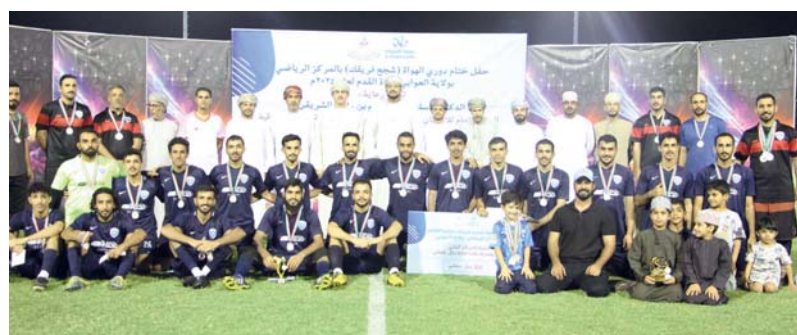
لقطة جماعية لفريق اتحاد العوابي بعد الفوز بالبطولة

في كولن، تخوض إسبانيا مواجهة جورجيا بمعنويات متناقضة كونها الفريق الوحيد الذي حصد تسع نقاط كاملة دون أن تهتز شباكيها في دور المجموعات، بينما فوز كبير على كرواتيا افتتحا 3-0 ثم إيطاليا حاملة اللقب 1-0. وقبل خوض دور الـ 16،