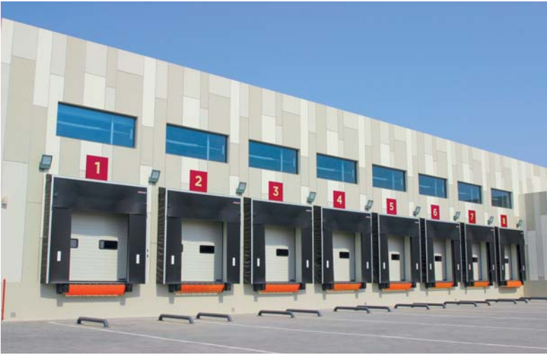
سوق سلال يعزز مكانة سلطنة عُمان في قطاع تداول الخضراوات والفواكه