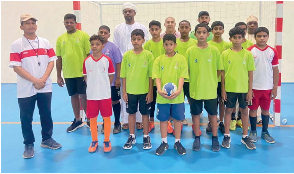
صورة جماعية لأعضاء اللجنة المشرفة مع لاعبي مركز صحم

قام أعضاء اللجنة المشرفة على مراكز إعداد الرياضيين لكرة اليد برئاسة العميد طيار متقاعد جميل بن سريد الحسني نائب رئيس الاتحاد العماني لكرة اليد رئيس اللجنة المشرفة وأعضاء اللجنة بزيارة مراكز التدريب برياضي صحم ومجيس، حيث التقى أعضاء اللجنة مع الأجهزة الفنية والإدارية للمركزين، حيث تمّ خلال اللقاء مناقشة توقيت بدء سير التدريبات للمرحلة الثالثة والوقوف على مستوى اللاعبين لما اكتسبوه من مهارات وتنفيذ فعاليات بالمرحلتين الأولى والثانية خلال الستة أشهر التدريبية لعامي 2023 / 2024 بإجراء تدريبات بواسطة المدرب العام للمركز وأخرى بواسطة مدرب المركز، كما تمّ الاطلاع على تحليل الإحصائيات بالحضور