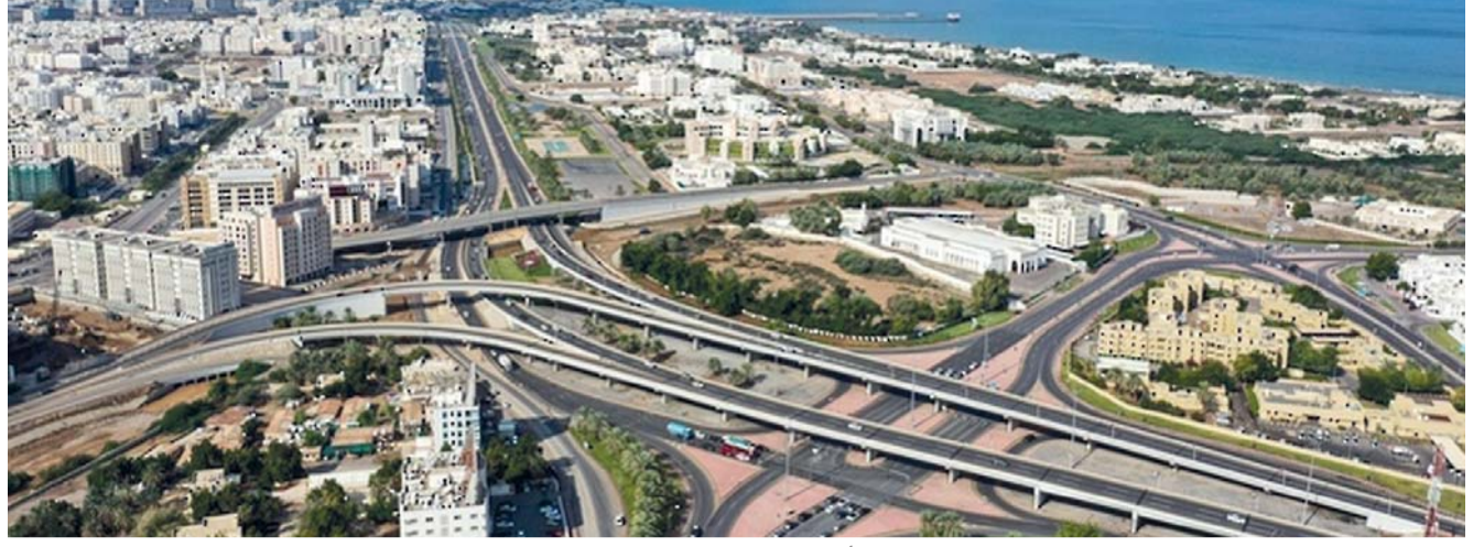
■ انخفاض الرقم القياسي لأسعار الشقق السكنية بنسبة ١٧,٣ بالمائة في سلطنة عمان

انخفض المؤشر في محافظة البريمي بـ ٥,٤ بالمائة، وجنوب الباطنة بـ ٠,٤، وفي محافظة جنوب الشرقية بـ ٢,٤ بالمائة، ومحافظة الظاهرة بـ ٨,٣ بالمائة. فيما ارتفع مؤشر الرقم القياسي في محافظة الداخلية بـ ٧,٥ بالمائة، ومحافظة شمال الباطنة بـ ١١,٢ بالمائة، ومحافظة شمال الشرقية بـ ١,٤ بالمائة و٨,١ بالمائة في محافظة الوسطى.