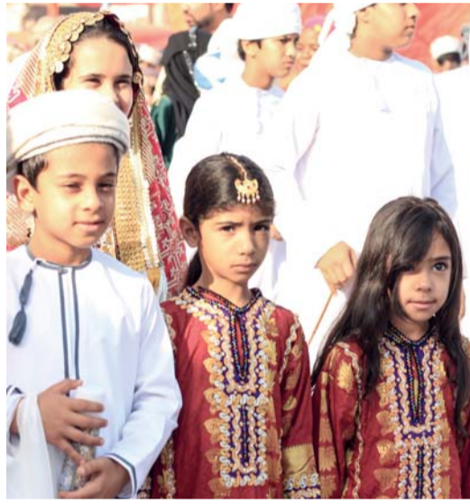
عدسة أحمد الحجري توثق جمال الزي العماني