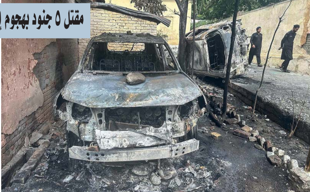
رجال شرطة باكستانيون يسحبون سيارات محترقة داخل مركز للشرطة في منطقة مدين بواي سوات

إسلام آباد. د. ب. أ: قتل ٥ جنود في هجوم إرهابي في إقليم خيبر بختونخوا شمال غرب باكستان، حسبما قال الجيش في بيان. وقالت «العلاقات العامة المشتركة بين الخدمات»، الجناح الإعلامي للجيش الباكستاني، إن الهجوم وقع عند انفجار عبوة ناسفة يدوية الصنع في مركبة لقوات الأمن في منطقة كورام. وأوضح البيان أن الجنود القتلى تتراوح أعمارهم بين ٢٤ عاماً و٣٣ عاماً وينحدرون من مناطق مختلفة من باكستان. ولم تعلن أي جهة مسؤوليتها عن الهجوم بعد ولم يوجه البيان أي اتهام إلى جهة معينة. حتى إعداد هذا الخبر للنشر.