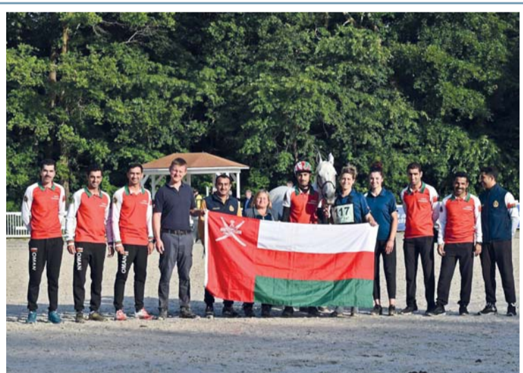
صورة جماعية لفرسان الخيالة السلطانية المشاركين ببطولة كأس العالم للقدرة بفرنسا