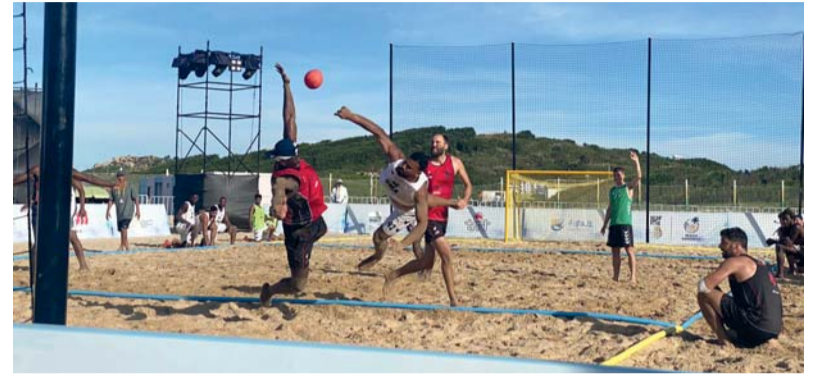
من لقاء منتخبنا والمنتخب الأمريكي

يختتم اليوم منتخبنا الوطني لكرة اليد الشاطئية مشاركته في كأس العالم الحادية عشرة لكرة اليد الشاطئية للرجال والنساء التي استضافتها مدينة بينجتان الصينية خلال الفترة من ١٨ إلى ٢٣ من يونيو الجاري. حيث سيخوض اليوم آخر مباراة له أمام منتخب بورتوريكو في الساعة التاسعة والنصف صباحا بتوقيت الصين لتحديد المركزين (١٥ - ١٦) في البطولة بعدما فقد منتخبنا آخر فرصة له للوصول إلى مراكز متقدمة بعد خسارته يوم أمس في مباراتين الأولى أمام أوروغواي بنتيجة ٢/١ وذلك ضمن مباريات تحديد المركز من ٩ - ١٦ ومن ثم تلقى خسارة جديدة أمام منتخب الولايات المتحدة