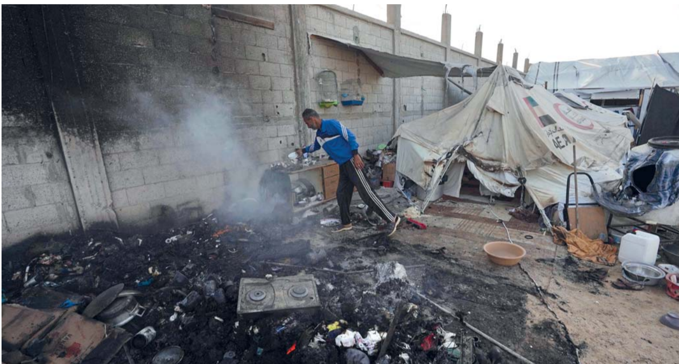
الدخان يتصاعد في منطقة خيام بعد غارة إسرائيلية على منطقة المواصي شمال غرب مدينة رفح الفلسطينية