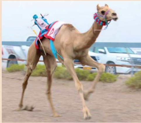
منافسة قوية شهدها السباق

أقيم على ميدان (طوي الشاوي) بولاية المصنعة بمحافظة جنوب الباطنة سباق (الريس) للهجن والذي نظمه أهالي قرية الشعبية بولاية المصنعة وشهد تفاعل ومشاركة واسعة من ملاك الهجن من الولاية والولايات المجاورة وجاء تنظيم سباق الهجن (الريس) في إطار المحافظة على تراث الأجداد وحضارتهم ولما تمثله الهجن العربية الأصيلة من تراث خالد، حيث تنافست الهجن المشاركة على عشرة أشواط (بكار وجعدان) وجاءت النتائج كالتالي الشوط الأول فطامين بكار ١٢٠٠ متر