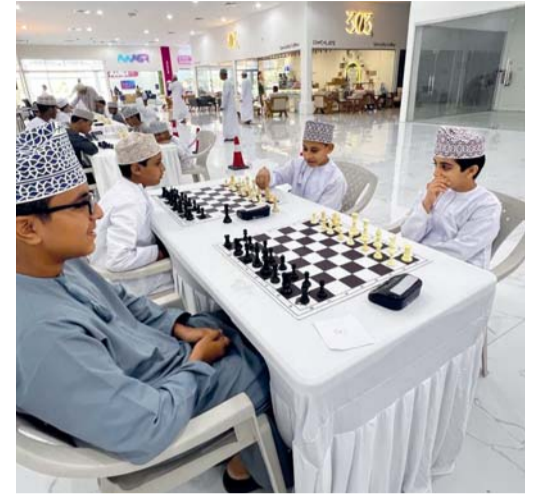
اللاعبون خلال مشاركتهم في مسابقة الشطرنج

واشتمل المهرجان على مجموعة من سباقات السباحة في المياه المفتوحة ومشاركة القوارب