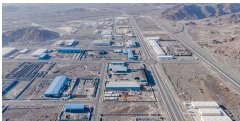
المشروع يقام على مساحة تتجاوز ١٠ آلاف متر مربع