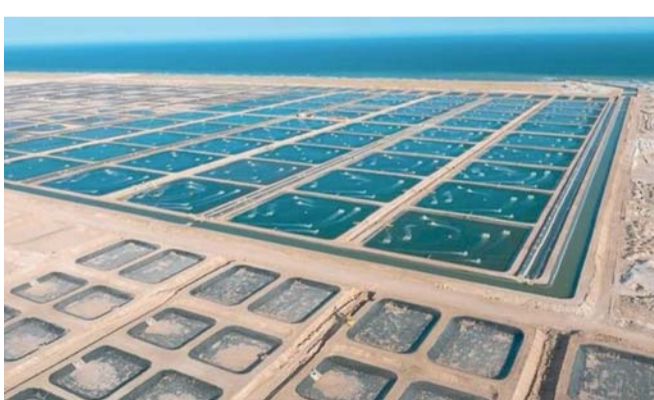
القيمة الاستثمارية للمشروعات السمكية التي تم تنفيذها والجاري تنفيذها بلغت أكثر من ١٦٢ مليون ريال عماني

الثروة الزراعية والسمكية وموارد المياه تنفيذها خلال الفترة القادمة لتكون دعماً للقطاع والصيديين، مثل مصانع القيمة المضافة (تعليب الأسماك)، وسوق الأسماك بولاية محوت، وميناء الصيد البحري بولاية محوت، وتوسعة ميناء الصيد البحري بالكبي في ولاية الجازر، ومراكز تجميع الأسماك بهيتام ورأس مدركة بالدقم، وعدد من مشروعات الاستزراع السمكي بالمحافظة، ووضّح أن القيمة الاستثمارية للمشروعات التي تم تنفيذها والجاري تنفيذها بلغت أكثر من ١٦٢ مليون ريال عماني كما توجد مشروعات للاستزراع السمكي بقيمة تزيد على ٧٧٠ مليون ريال عماني ومن المؤمل البدء في تنفيذها خلال الفترة القادمة. وأشار مدير عام الثروة الزراعية والسمكية وموارد المياه بمحافظة الوسطى إلى أن الوزارة أطلقت في محافظة الوسطى عدداً من الفرص الاستثمارية في مشروعات الاستزراع السمكي مثل استزراع الروبيان الهندي الأبيض في ولاية محوت، والروبيان ذو الأرجل البيضاء في ولاية الجازر وبر الحكمان، والصفيلج العماني في صوقرة والمنطقة الاقتصادية الخاصة بالدقم، وأسماك زعنفة (الحمام) في ولاية الدقم ومشروع استزراع الروبيان في منطقة رأس مدركة بولاية الدقم المطروح في منصة تطوير.