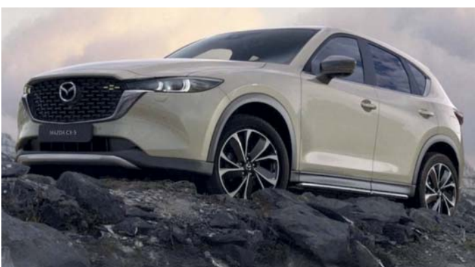
■ مازدا CX-5 تقدم تجربة قيادة مثيرة

تعتبر مازدا CX-5 من أبرز الطرازات من فئة اس يو في للسائقين بسرعة واحدة وتعد من السيارات المفضلة بين العملاء بسبب تصميمها الراقى وتحكمها الديناميكي وميزاتها ولعب مركز تاول للسيارات دوراً حاسماً في تقديم تجربة القيادة الاستثنائية لسيارة مازدا CX-5 بسلطنة عمان لأكثر من خمسة عقود من التاريخ حيث إنه اشتهر بالتميز بالجودة ورضا العملاء وخدمة ما بعد البيع.