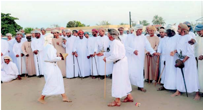
المواطنون بالمصنعة يقدمون أحد الفنون الشعبية