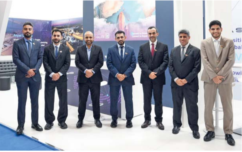
■ المشاركة جاءت بهدف ترسيخ مكانة أسيد كمزود عالمي للحلول اللوجستية.