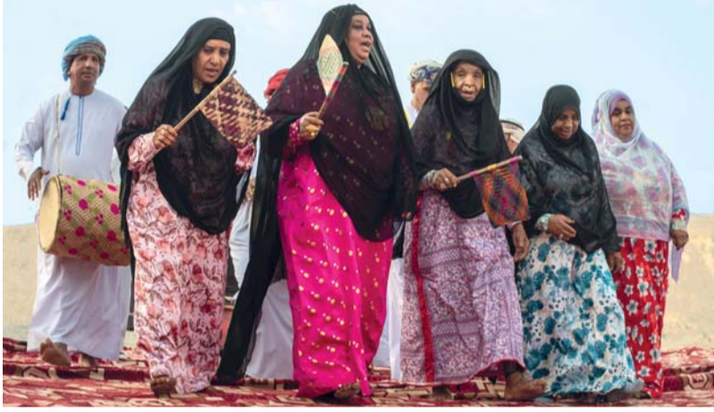
فنون شعبية وعادات وتقاليد عمانية بعدسة موسى الحجري