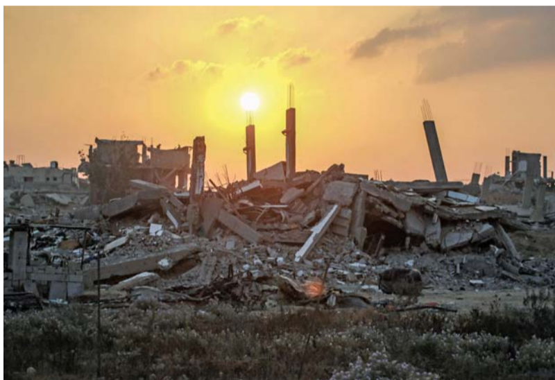
مخلة شروق الشمس فوق المباني المدمرة في خان يونس بفعل العدوان الإسرائيلي المستمر لليوم ٢٦٠ على قطاع غزة

ارتكب الاحتلال الإسرائيلي مجزرتين مروعتين بمخيم الشاطئ وحى التفاح بقطاع غزة في إطار عدوانه المستمر على الفلسطينيين في القطاع مما أسفر عن عشرات الشهداء والمصابين، فيما ينتهج الاحتلال الحرق والتعطيش في الضفة الغربية. واستشهد (٤٢) فلسطينياً جراء هجمات جوية إسرائيلية، استهدفت عدداً من المنازل المأهولة بالسكان في حيّ التفاح شمال شرق مدينة غزة. وأوضح شهود عيان بأنهم فوجئوا بشن الطيران الحربي الإسرائيلي، سلسلة غارات على منازل سكنية في حيّ التفاح، مما أدى إلى تطاير أشلاء الضحايا، في المكان. وجاءت المجزرتان في غزة بعد يوم من ارتكاب جنود الاحتلال (٣) مجازر بالقطاع الفلسطيني المحاصر وصل منها للمستشفيات جثث (١٠١) شهيد، و(١٦٩) جريحاً خلال (٢٤) ساعة. إلى ذلك قال المكتب الوطني للدفاع عن الأرض ومقاومة الاستيطان في تقريره الدوري إن الضفة تحت وطأة إرهاب وحرمان المستوطنين وسياسة التعطيش وتقليص كميات المياه. وتابع المكتب في تقريره «في الأجواء شديدة الحرارة، التي اجتاحت الضفة الغربية في الأسابيع الماضية، امتدت يدّ الإرهاب الإسرائيلي، الذي ينطلق من المستوطنات والبؤر الاستيطانية، لتشعل الحرائق في عديد المناطق، حتى أصبح الفلسطيني يعيش في قلق على الممتلكات والمنازل وعلى الحياة كذلك. وتابع ذلك في امتداد لاعتداءات المستوطنين، التي لا تنقطع، حيث شهدت مختلف المحافظات على امتداد الأشهر السنة الأولى من هذا العام أكثر من (٦٠٠) اعتداء للمستوطنين، كان من بينها حرق منازل وحقول ومركبات في أكثر من محافظة». تفاصيل.....ص ٥