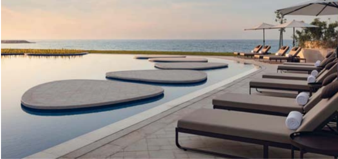
■ المشروع يشمل وحدات سكنية تحمل علامة سانت ريجيس التجارية

علامة سانت ريجيس للمرة الأولى إلى سلطنة عمان بمثابة خطوة إضافية ومهمة في رحلتنا لتقديم خدماتنا الفخمة في أنحاء العالم، وجاء اختيارنا لسلطنة عمان بفضل مقوماتها ومميزاتها المتعددة، حيث تعد وجهة سياحية مزدهرة تنفرد بجمالها الطبيعي وثقافتها الغنية وكرم ضيافتها الأصيلة وبتطلع إلى الترحيب بضيوفنا للانغماس بجميع حواسهم في تجربة ضيافة لا تنسى والاستمتاع بخدماتنا المميزة وأجوائنا الخاصة التي تشتهر بها العلامة التجارية سانت ريجيس.