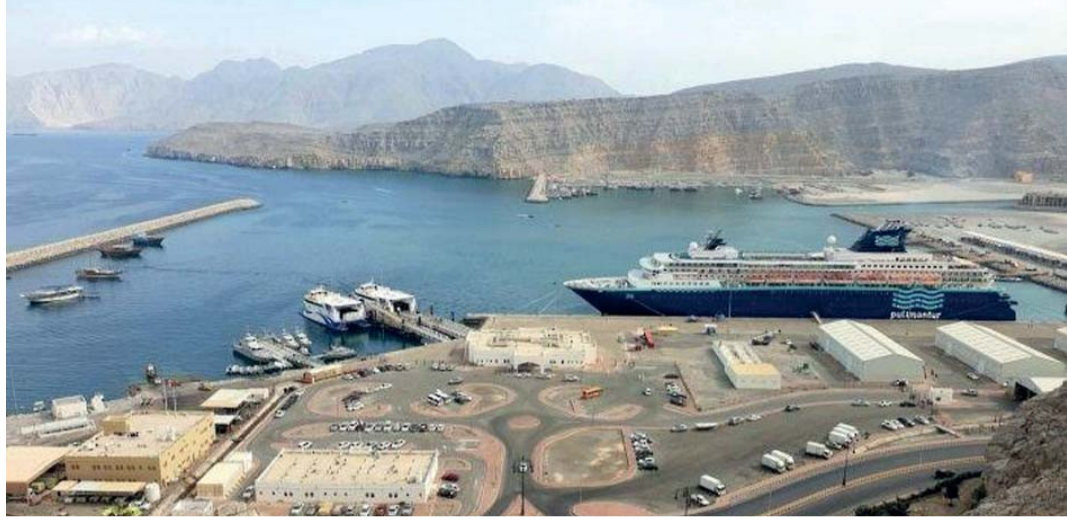
■ محافظة مسندم شهدت حراكاً في التنمية الحضرية في مختلف الجوانب خلال الفترة الماضية

٢٠٢٨. ويُن معاليه أنه تم البدء في تطوير الواجهات البحرية في الولايات الساحلية ونيابة ليما، حيث وصلت نسبة الإنجاز في الواجهة البحرية بولاية حُصِبَ «شاطئ بصة»، إلى نحو ٩٥ بالمائة والجاهزية الكاملة ستكون خلال شهر أغسطس المقبل، وفي ولاية مسندم، أشار معاليه إلى أن هناك جملة من الأراضي الاستثمارية أسندت للعديد من المستثمرين في ولايات بخا ومدحا ودبا بالإضافة إلى تنفيذ مخطط لإعادة إنشاء منتجع في ولاية دبا من قبل مجموعة عُمران، مضيفاً أن الأعمال الإنشائية في مشروع «منتجع رأس العامود» بولاية حُصِبَ قطعت شوطاً مناسباً، كما سيتم أيضاً تنفيذ منتجع تابع لمجموعة «كلوب ميد» بالولاية والمتوقع الانتهاء منه في عام