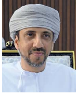
■ إبراهيم البوسعيدي

وقال معالي السيد إبراهيم بن سعيد البوسعيدي محافظ مسندم إن المحافظة شهدت خلال الفترة الماضية حراكاً في التهيئة الحضرية في مختلف الجوانب شملت المناطق السكنية ومراكز المدن، مشيراً إلى أن هناك عدة مشروعات جارٍ تنفيذها وبعضها قارب على الانتهاء ومنها ما هو في مرحلة الدراسات الاستثمارية. ووضع معاليه في تصريح لوكالة الأنباء العُمانية أن محافظة مسندم التزمت نسبياً بالمبلغ المرصود لها ضمن برنامج تنمية المحافظات والبالغ ٢٠ مليون ريال عُماني خلال الخطة الخمسية الحالية. وأشار معاليه إلى أن نسبة الإنجاز بمشروع تطوير ميناء الصيد البحري بولاية