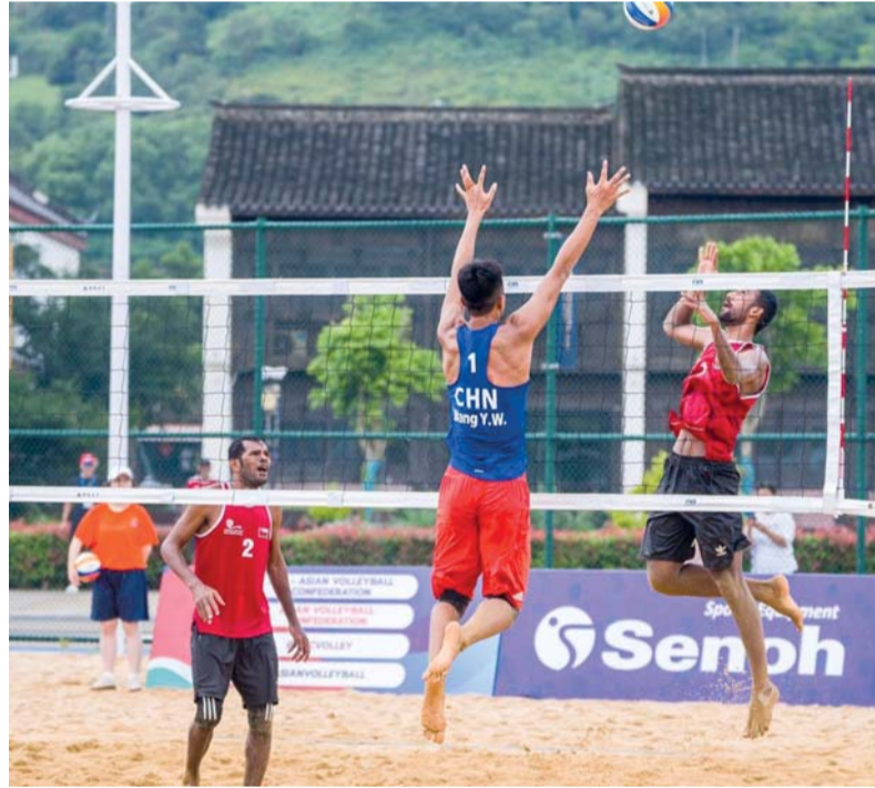
من مباراة منتخبنا للطائرة الشاطئية مع الصين