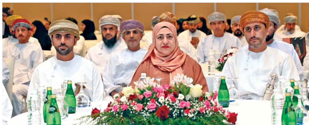
الملتقى يهدف لتعزيز التواصل بين مختلف القطاعات الحكومية

نظم مكتب محافظ شمال الباطنة يوم أمس بفندق راديسون بلو صحار ملتقى شمال الباطنة السياحي تحت رعاية معالي الدكتورة رحمة بنت إبراهيم المحروقة وزيرة التعليم العالي والبحث العلمي والابتكار وبحضور عدد من أصحاب السعادة والمهتمين بالجانب السياحي، حيث يأتي هذا الملتقى في إطار الجهود المبذولة لتعزيز الدور السياحي في المحافظة وشمل على العديد من الفعاليات والأنشطة المصاحبة. وقال سعادة محمد بن سليمان الكندي محافظ شمال