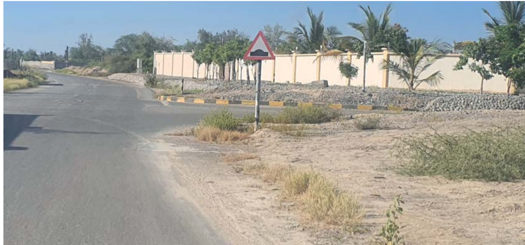
الطريق يمتد لمسافة كيلومترين ويمر بين عدد من المزارع

ناشد أهالي ولاية المصنعة سالكو شارع وادي المدفع الجهات المعنية بسرعة إنارة الشارع والنظر في التنفيذ في القريب العاجل نظراً للمخاطر التي يحملها الطريق في ظل انعدام الرؤية وعدم وجود إنارة، والتي نتج عنها وقوع عديد الحوادث إثر عبور الحيوانات السائبة للشارع، حيث يمتد الشارع بطول كيلومترين (٢ كم)، ويمر بين عدد من المزارع والمنازل والمخططات السكنية، إلى جانب وجود النزل الخضراء على الطريق والاستراحات الخاصة. (الوطن) رصدت آراء الأهالي الذين تحدثوا عن الصعوبات والعراقيل التي تواجههم بشكل يومي من مخاطر الطريق.