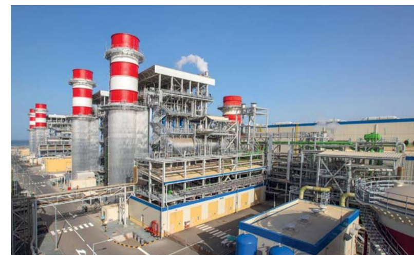
ارتفاع صافي إنتاج الكهرباء

مسقط - العُمانية : سجل إجمالي إنتاج سلطنة عُمان من الكهرباء حتى نهاية شهر مارس الماضي، ارتفاعاً بنسبة ٧ بالمائة ليبلغ ٨١٥٢,٣ جيجاوات بالساعة مقارنة بـ ٧٦١٩,٦ جيجاوات بالساعة في الفترة نفسها من العام الماضي . وبيّنت الإحصاءات الصادرة عن المركز الوطني للإحصاء والمعلومات أن محافظات شمال الباطنة وجنوب الباطنة والظاهرة سجلت إجمالي إنتاج بـ ٥٠٤٩,٨ جيجاوات بالساعة. وارتفع إجمالي الإنتاج بمحافظة مسقط بنسبة ٣٠,٩ بالمائة ليبلغ ٢٩,٨ جيجاوات بالساعة، فيما ارتفع بمحافظة ظفار بـ ١٧,٢ بالمائة ليبلغ ١١٣,٧ جيجاوات بالساعة. كما ارتفع إجمالي الإنتاج بمحافظة شمال الشرقية وجنوب الشرقية بـ ١٥,٣ بالمائة ليبلغ ١٨٥٣,٦ جيجاوات بالساعة، فيما انخفض إجمالي الإنتاج بمحافظة الوسطى بنسبة ٥٢,٤ بالمائة ليبلغ ٢٩,٥ جيجاوات بالساعة، وبمحافظة مسندم ارتفع إجمالي الإنتاج بـ ٧,٢ بالمائة مسجلاً ٧٦,٧ جيجاوات في الساعة، وأشارت الإحصاءات إلى أن صافي إنتاج سلطنة عُمان من الكهرباء حتى نهاية شهر مارس الماضي ارتفع بنسبة ٦,٨ بالمائة ليبلغ ٧٨٧٩,٦ جيجاوات في الساعة. من جانب آخر أوضحت الإحصاءات أن إجمالي كمية المياه المنتجة في سلطنة عُمان بلغ بنهاية مارس الماضي نحو ١٢٢ مليوناً و ١١١ ألفاً و ٢٠٠ متر مكعب، مقارنة بـ ١٢٢ مليوناً و ١٣٦ ألفاً و ٧٠٠ متر مكعب في الفترة نفسها من العام الماضي.