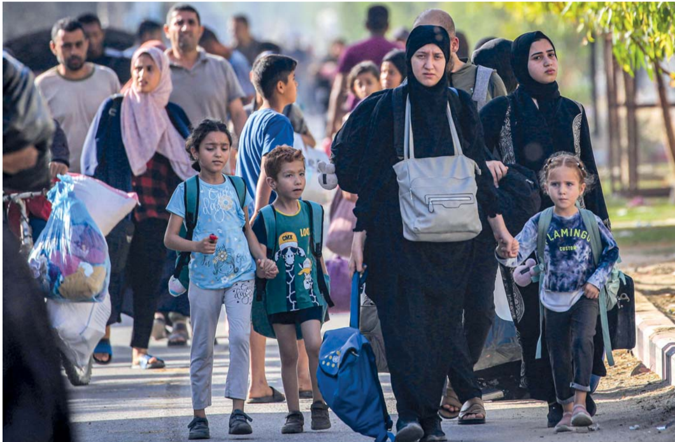
نازحون من الأجزاء الشرقية من دير البلح يتجهون إلى وسط المدينة في قطاع غزة.

موسكو . د.ب.أ: اتفقت سوريا وروسيا على التعاون الفني في المجالين الضريبي والجمركي، وتعزيز التعاون في القطاعين المصرفي والتأميني. ووفق الوكالة العربية السورية للأنباء (سانا) عقد وزير المالية السوري كنان ياغي اجتماعاً مع نظيره الروسي أنطون سيلوانوف في مدينة سانت بطرسبورج، وذلك على هامش المنتدى الاقتصادي الدولي المنعقد بها. وتناول الاجتماع تعزيز التعاون الاقتصادي والمالي بين البلدين، كما تم الاتفاق على الإسراع في توقيع مشروع مذكرة التفاهم بين وزارة الاقتصاد والتجارة الخارجية والاتحاد الاقتصادي الأوراسي، والتي ستمتخ المنتجات السورية مزايًا تفضيلية ضريبية وجمركية عند دخولها لدول الاتحاد.