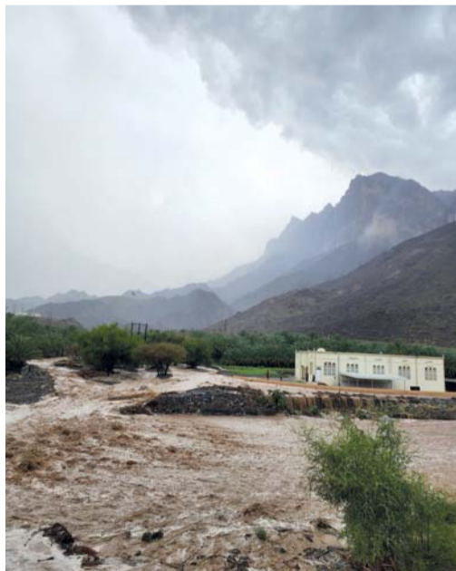
جريان الشعاب بوادي السحتن