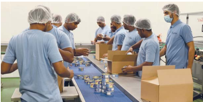
■ توظيف العمانيين وإكسابهم الخبرات والمهارات اللازمة

مع عدد الصيادين المحليين لشراء الأسماك ذات الجودة العالية للاستخدام سواء في الأسواق المحلية أو الخارجية، والتعاقد مع المؤسسات الصغيرة والمتوسطة لتزويد المصنع بالأسماك وتسويق وتوزيع منتجات الشركة في السوق المحلي بالإضافة إلى تزويد المصنع ببعض المنتجات اللازمة للإنتاج كالزيوت والأملاح وعلب التغليف وغيرها. وأضاف أن الشركة ستوقع خلال الفترة القادمة اتفاقية مع عدد من الشركات العمانية لتزويد المصنع بخلاص الطاقة الشمسية، موضحاً أن الشركة طرحت مناقصة لإنشاء مصنع علب التونة بجانب مصنع سمك البقم مدته ٥ سنوات لرفع السوق المحلي بهذه المنتجات.