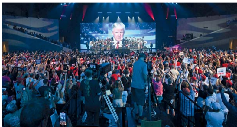
الرئيس الأمريكي السابق والمرشح الرئاسي الجمهوري دونالد ترامب أثناء مشاركته في حدث سياسي مع أنصاره بكنيسة دريم سيتي في ولاية أريزونا.

واشنطن . أ.ف.ب: تضمّنه من مخالقات، تخلى بعدما انتقد بشدة التصويت بالبريد في الانتخابات الأمريكية معتبرًا أنه من أسباب هزيمته في ٢٠٢٠ م. باهظًا في سعيه للعودة إلى كبير، يتضمن «عمليات تزوير مكثفة».