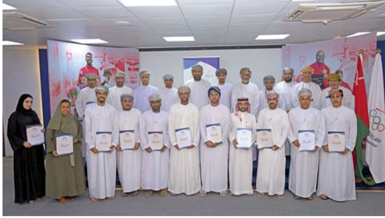
صورة جماعية لراعي الختام والمشاركين في الدورة