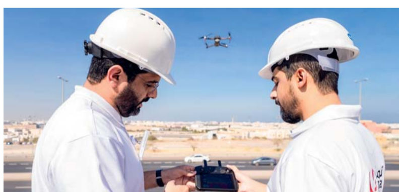
استخدام «الدرون» للكشف عن التسريبات غير المرئية بمسح المسارات

نجحت شركة «نماء خدمات المياه» في تقليل كمية فاقد المياه بنسبة ١٨٪ وذلك خلال الفترة من بدء أعمال الشركة في ٢٠٢١ حتى نهاية ٢٠٢٣. وتعد مشكلة فاقد المياه بسبب التسريبات المرئية وغير المرئية في الشبكات مشكلة عالمية ذات نطاق كبير، حيث يصل حجم الفاقد جراء ذلك إلى نحو ثلث مياه الشرب في العالم، وتتعدد الأسباب التي تؤدي إلى حدوث هذه المشكلة، ومن أكثرها شيوعاً تهاك الأنابيب وتآكلها أو تعرضها للتلف نتيجة أعمال الحفر والإصلاحات وغير ذلك من الأسباب. وتعمل «نماء خدمات المياه» على اتخاذ طرق متعددة للتصدي لهذه المشكلة، من خلال استخدام أحدث التقنيات والأجهزة الحديثة وتوظيف تقنيات متقدمة وأدوات فعالة للحد من فاقد المياه نتيجة التسريبات. وقد حققت الشركة نجاحات ملحوظة في هذا المجال، وتسعى جاهدة لمواصلة هذه الإنجازات خلال العام الحالي ٢٠٢٤ للتقليل من فاقد المياه.