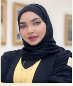
أيام قنديل شاعرة عمانية