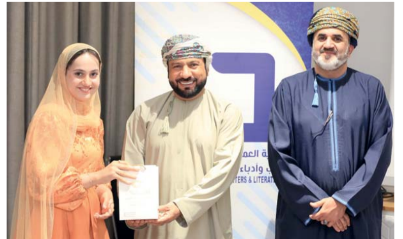
راعي المناسبة قام بتكريم المشاركين في الفعالية