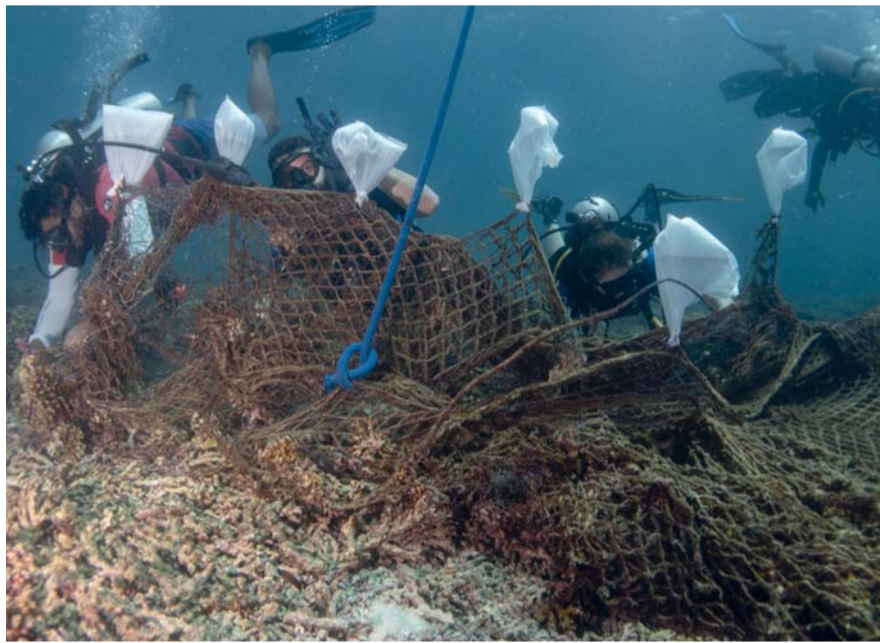
جزر الديمانيات المحمية الطبيعية البحرية الأولى في سلطنة عُمان

تخلعت عُمان للإبحار والشركة العمانية للاتصالات «عمانتل» مبادرة تنظيف أعماق البحار والمحيطات من المخلفات البلاستيكية وشباك الصيد، بالتعاون مع القسم التجاري «سي.عُمان» وهيئة البيئة، وذلك تزامناً مع احتفال الأمم المتحدة باليوم العالمي للمحيطات الذي يصادف الثامن من يونيو من كل عام. شارك في المبادرة التي أقيمت بالقرب من جزر الديمانيات ٢٩ غواصاً محترفاً، بينهم ٨ غواصين من مركز «سي.عُمان» للغوص التابع لعُمان للإبحار، وغواصون متطوعون من الشركة العمانية للاتصالات «عمانتل»، وبطل الغوص العُماني عمر الغيلاني صاحب الرقم العالمي السابق في رياضة الغوص الحر. وتعد جزر الديمانيات، المحمية الطبيعية البحرية الأولى في سلطنة عُمان، وكثراً طبيعياً غنياً بتنوعها البيولوجي، حيث تحتوي على مجموعات نادرة من الشعاب المرجانية التي تشمل عدة أنواع، وتعد موطناً لأكثر من ١٠٠ نوع من الأسماك المرجانية و٥٧٩ نوعاً من أسماك الشعاب المرجانية. ويأتي التركيز على البحار والمحيطات كمصدر مستدام، استلهاماً من رؤية عُمان ٢٠٤٠ التي ركزت على حماية البيئة وصون الموارد الطبيعية كإحدى أولويات الحكومة التي تهدف إلى إيجاد بيئة محمية تحقق التوازن بين المتطلبات البيئية والاقتصادية والاجتماعية.