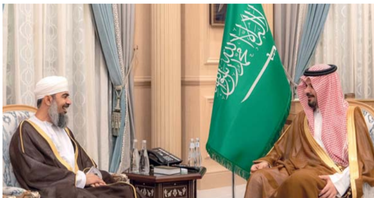
■ أمير المدينة المنورة أثناء استقباله سلطان الهنائي