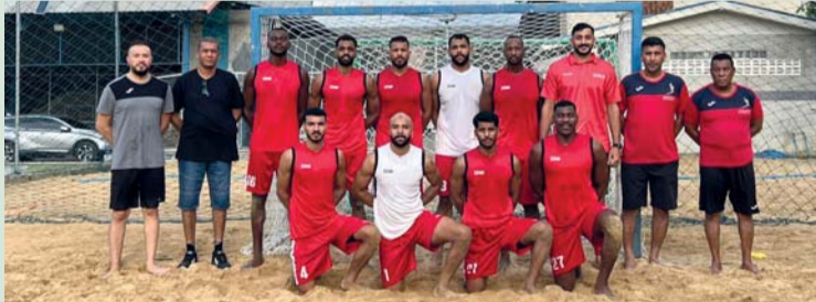
منتخبنا الوطني لكرة اليد الشاطئية

الأول للمباراة انتهى بتقدم منتخبنا ٨/١٤، وفي الشوط الثاني فاز منتخبنا بفارق هدف واحد ٢٢/٢٣ لتنتهي المباراة بفوز منتخبنا ٢/صفر.