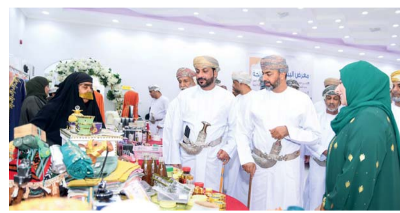
إبراز الأعمال والمنتجات المحلية وتسويقها

شناصر. من إبراهيم الفارسي: احتفل أمس الأول مجمع شناصر الصحي بيوم الإداري المبدع في فعالية أقيمت بالمجمع بحضور الدكتور يوسف بن عبدالله الكعبي رئيس مجمع شناصر الصحي تم فيه تكريم الطاقم الإداري في مجمع شناصر الصحي لدورهم في الرقي بالخدمات الصحية المقدمة. وحملت الاحتفالية عنوان: (يوم الإداري المبدع)، تم خلاله ذكر دورهم الكبير وأنهم الجنود المجهولون في الخدمات الصحية، حيث كان لهم دور كبير في الرقي بالخدمات الصحية وعطائهم المستمر بصورة يومية وبدون انقطاع. وقد أشاد الدكتور يوسف الكعبي بجهود العاملين الصحيين والطاقم الإداري ودورهم الفعال في خدمة وطنهم، وفي الختام جرى تكريم الطاقم الفني الذين قاموا بأعمال إدارية في المجمع والموظفين المجيدين خلال الفترة الماضية.