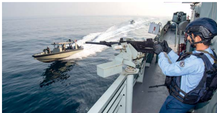
■ من مجريات التمرين البحري المشترك (خليج ٤)

■ أمير المدينة المنورة يستقبل رئيس بعثة الحج العمانية