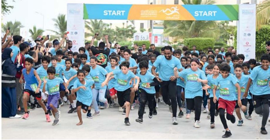
صورة أرشيفية من سباق ماراثون العمانية للنطاق العريض

تُوقّع اليوم وزارة الثقافة والرياضة والشباب ممثلة في صندوق دعم الأنشطة الثقافية والرياضية والشبابية. اتفاقية استثمار أراضى اللجنة الأولمبية العمانية والاتحادات الرياضية مع شركة المهام لتسويق المنتجات النفطية، وذلك في الساعة الحادية عشرة صباحاً بفندق دبلو مسقط. وتأتي هذه الاتفاقية في إطار الجهود التي يبذلها الصندوق لتحقيق عوائد مالية مستدامة للاتحادات الرياضية واللجنة الأولمبية في إطار رؤية عُمان ٢٠٢٤.