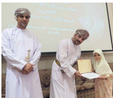
■ أثناء تكريم طفلة فائزة في المسابقة

وقد استهدفت المسابقة فئات الناشئة تشجيعاً لهم وتحفيزاً لحفظ القرآن الكريم ومراجعتها، اشتمل الحفل على تلاوة آيات من القرآن الكريم، وكلمة اللجنة المنظمة تناولت المراحل التي مرت فيها المسابقة.