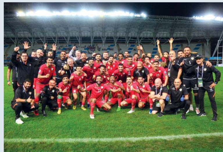
صورة جماعية للاعبين منتخبنا عقب الفوز على الصين تايبيه والتأهل إلى كأس أمم آسيا.

تأكيد تأهله لنهائيات أمم آسيا ٢٠٢٧ بقلائته النظيف في شباك الصين تايبيه مساء الخميس الماضي، احتل بها صدارة المجموعة برصيد (١٢) نقطة. تفاصيل.....«الرياضي»