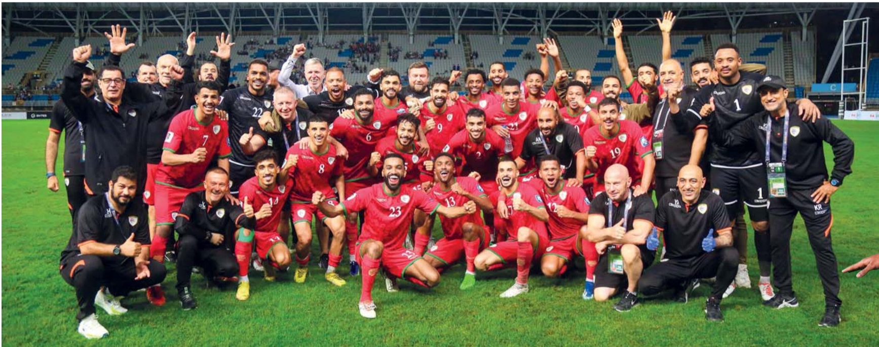
صورة جماعية للاعبى منتخبنا عقب الفوز على الصين تايبيه والتأهل إلى كأس أمم آسيا.