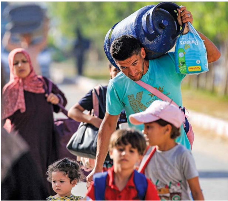
رجل يحمل أسطوانة غاز الطبخ على كتفه وهو يمضي مع نازحين آخرين من الأجزاء الشرقية من دير البلح إلى وسط المدينة في وسط قطاع غزة.

المقاومة أنها استهدفت مروحية إسرائيلية من نوع أباتشي بصاروخ (سام ٧) شرق المدينة. كما قالت سرايا القدس إنها قصفت بدفعة صاروخية مقر قيادة فرقة غزة في موقع رعيم، في ظل مواصلة جيش الاحتلال عملياته في دير البلح وشرق البريج ورفع. تفاصيل.....صه