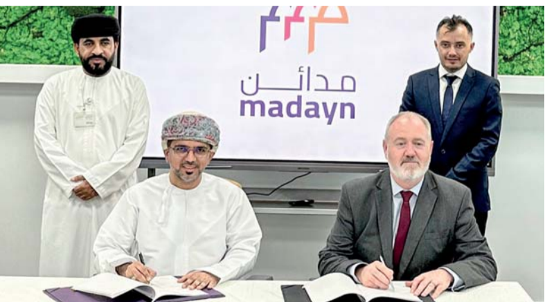
■ جانب من توقيع الاتفاقية

مسقط . «الوطن» : وقعت واحة المعرفة مسقط الزراع التقني للمؤسسة العامة للمناطق الصناعية مدائن اتفاقية مع شركة الوادي للطاقة الشمسية لإنشاء محطة توليد الطاقة الشمسية الكهروضوئية، حيث تقدر تكلفة هذا المشروع بحوالي نصف مليون ريال عماني وسيعمل بسعة إنتاجية تبلغ ١,٤ ميغا واط، ومن المتوقع تركيب وتشغيل المحطة في حرم الواحة خلال سنة من تاريخ توقيع الاتفاقية على أن يمدد العقد لمدة ٢٥ سنة، وستتولى خلالها الشركة المعنية جميع أعمال التركيب والتشغيل والصيانة اللازمة للمنظمة. وتأتي هذه الاتفاقية ضمن رؤية مدائن الرامية لتوفير بيئة أفضل للعيش والعمل وضمان استمرارية الحفاظ على البيئة خاصة