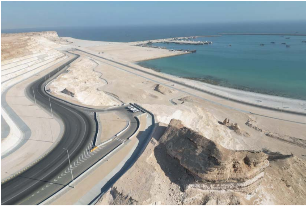
■ إنشاء الطرق الإسفلتية وخدمات الكهرباء والمياه والصرف الصحي

البدء في تنفيذها بعد إسناد المناقصة، ومن المتوقع أن يتم اختيار الشركة والإعلان عنها خلال نهاية هذا العام. وأشار إلى أن المنطقة الاقتصادية الخاصة بالدقم تنفذ حالياً دراسة استشارية لإعداد مخطط تفصيلي للصناعات المرتبطة بالطاقة الخفيفة والهيدروجين الأخضر وربطها مع الشق السفلي من الصناعات التحويلية للهيدروجين عبر تصميم ممر مشترك لعبور مسارات الخدمات من الشق العلوي لإنتاج الطاقة إلى الشق السفلي. كما أنه حتى الآن تم التوقيع على ٧ اتفاقيات لإنتاج الطاقة النظيفة من الشمس والرياح ثم إنتاج الهيدروجين، موضحاً أن قيمة الاستثمار لهذه المشروعات بلغت أكثر من ٣٠ مليار دولار أميركي ويتوقع أن تنتج حوالي مليون طن من الهيدروجين في ٢٠٣٠. ويبيّن أن الهيئة العامة