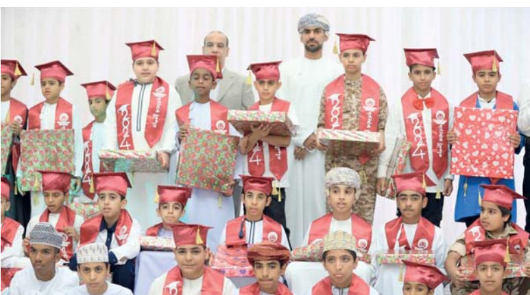
صورة تذكارية للطلبة المجيدين