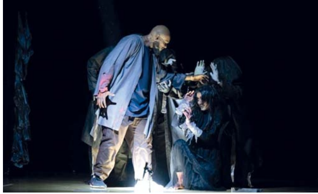
مسرحية أنصاف من إخراج المصطفى اليافعي وتأليف طارق هاني