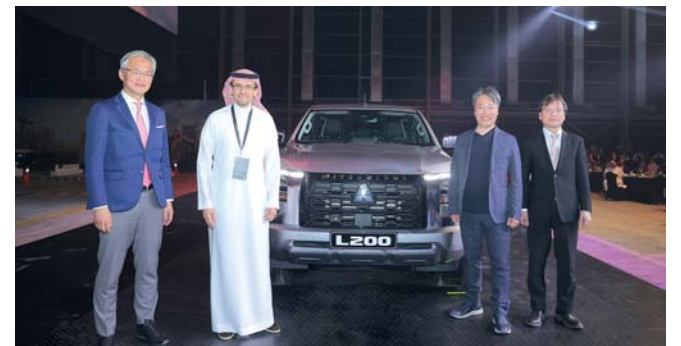
عدد من المسؤولين في ميتسوبيشي موتورز لحظة تدين السيارة الجديدة

من التجهيزات الأخرى التي تعزز الأداء وتنوع الاستخدامات. ويفضل الخلوص الأرضي الأكبر وأنماط القيادة السبعة المتطورة المصممة خصيصاً للقيادة على الرمال والحصى والتضاريس الصخرية وغيرها وتوفر سيارة L200 تجربة قيادة سلسة وممتعة مهما كانت طبيعة الطريق. وتضع سيارة ميتسوبيشي L200 الجديدة كلاً معايير الأمان على رأس أولوياتها، حيث تم تجهيزها بأحدث أنظمة الأمان مثل نظام تخفيف حدة التصادم الأمامي، والتحذير من مغادرة المسار، والتحذير من النقطة العمياء، وشاشة المراقبة متعددة الاتجاهات (Multi Around Monitor)، وإمكانية توصيل الهاتف المتحرك لاسلكياً عبر Android Auto و Apple Car Play. وتعمل هذه الابتكارات بتناغم تام لتوفير أعلى مستويات الأمان وراحة البال للسائق والركاب على حد سواء. كما تعكس سيارة L200 الجديدة كليا التزام شركة ميتسوبيشي موتورز بالبيئة والاستدامة، حيث تهدف إلى تقليل الانبعاثات والحد من أثر السيارة على البيئة. ويفضل المحرك فائق الكفاءة واستخدام مواد التصنيع الصديقة للبيئة، تسعى الشركة من خلال سيارة L200 إلى بناء مستقبل أكثر حفاظاً على البيئة دون التضائل عن الأداء الفائق أو مستويات الراحة التي لا مثيل لها.