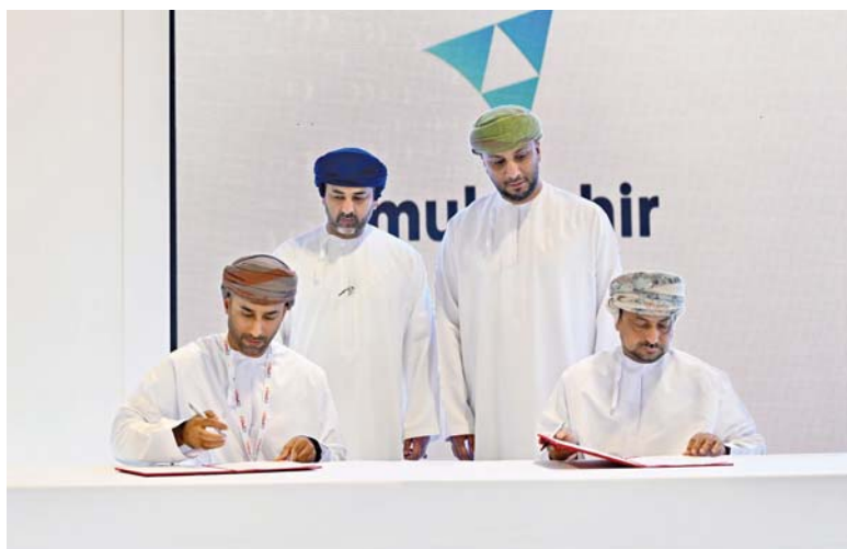
أثناء توقيع الاتفاقية