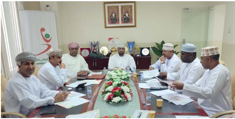
من اجتماع لجنة المنتخب بحضور الأعضاء والجهاز الفني لمنتخبنا للشباب

وكانت لجنة المنتخب الوطنية والمدرّب عقدت يوم أمس اجتماعا مع الجهاز الفني والاداري لمنتخبنا الوطني للشباب لكرة اليد لمناقشة استعدادات المنتخب من الفترة الماضية التي خاض فيها المنتخب تدريبات والمرحلة القادمة التي تسبق المشاركة في البطولة والتي تتضمن معسكرا داخليا مغلقا ومعسكرا خارجيا يسبق موعد انطلاق البطولة.