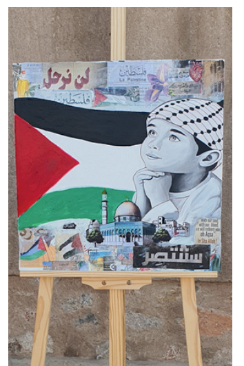
٢٥ لوحة فنية تنوعت في الشكل والمضمون