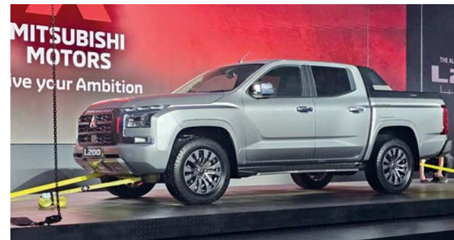
سيارة ميتسوبيشي L200 الجديدة قوة في مختلف التضاريس