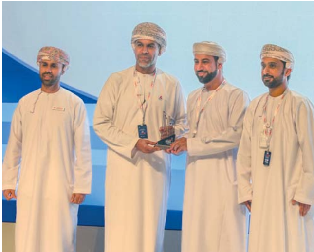
الجائزة تتويج للهيئة لتمييزها في تقديم خدمات رقمية رائدة في قطاع الاستثمار

وتمكنهم من استخدام التقنيات الحديثة والاستفادة منها في عمليات التخطيط العمراني والتوسع المستقبلي وإمكانية طباعة الخرائط. وتعتبر هذه الجائزة تويجاً للهيئة لتمييزها في تقديم خدمات رقمية رائدة في قطاع الاستثمار وخدمة المستثمرين، وتقديراً لجهودها نحو التحول الرقمي من خلال قيامها بتبني برامج وتطبيقات إلكترونية بهدف تسهيل الإجراءات وتوفير خدمات سريعة وأمنة وشاملة للمستثمرين. وفي هذا الإطار تعمل الهيئة على خطة استراتيجية للتحول الرقمي لتعكس التزامها المستمر نحو الابتكار والتطوير وتوظيف التقنيات الحديثة لتحسين تجربة المستثمرين والمستفيدين من خلال الخدمات التي تقدمها، علاوة على اتباعها لأفضل الممارسات للارتقاء بخدماتها التي تقدمها في جميع المناطق التي تُشرف عليها.