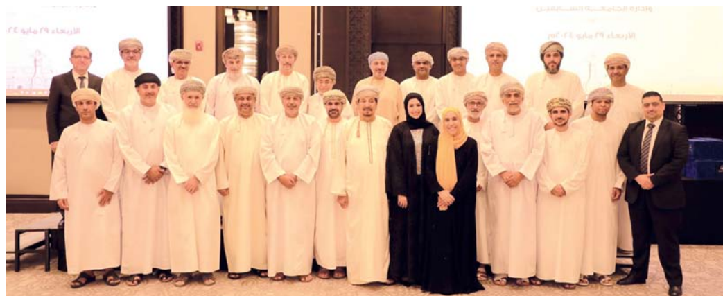
التكريم جاء تقديرًا للجهود المثمرة والبناء لأعضاء

معدودة والتي أصبحت بعزم المخلصين سرخاً علمياً نفتخر به حيث بدأت نشاطها الأكاديمي في عام ٢٠٠٩م، واستعرض البوسعيدي أهم الإنجازات التي تحققت ومن أهمها حفل الافتتاح الذي تشرفت به الجامعة بافتتاح حضرة صاحب الجلالة السلطان هيثم بن طارق المعظم. بن حمد البوسعيدي رئيس مجلس أمناء جامعة الشرقية كلمة نيابة عن رئيس مجلس الإدارة وأعضاء مجلس الأمناء والإدارة قال فيها: تحفل اليوم بمرور ١٥ عاماً على تأسيسها وتتمتع بالإنجازات التي تحققت ومن أهمها حفل الافتتاح الذي تشرفت به الجامعة بافتتاح حضرة صاحب الجلالة السلطان هيثم بن طارق المعظم.