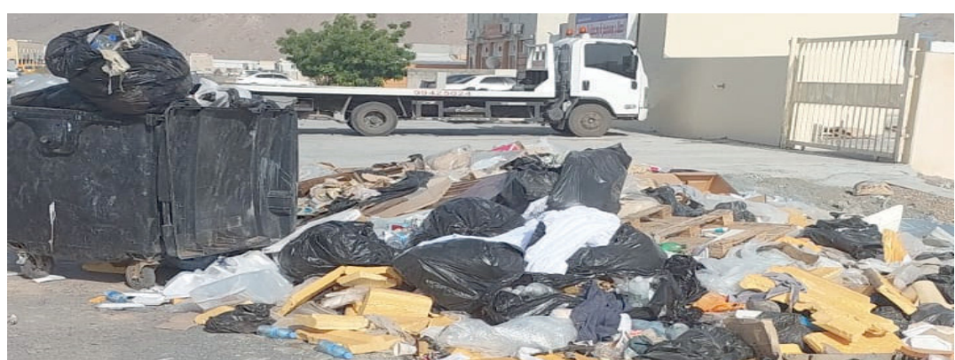
تراكم وتكدس النفايات والمخلفات في الشوارع والمجمعات السكنية بصورة لافتة

إطاره الذي يحتوي مهامه وأدواره بعيداً ما يجب الوقوف عليه من الحفاظ على البيئة ويعطي انطباعاً دون تحسن الشركة والبلديات والمسؤولية الكاملة. وناشد بضرورة إيجاد السبل التي تعزز من عملية الحفاظ على البيئة من قبل الجهات المعنية ممثلة في حوكمة المهام التي تحسن من عملية إدارة النفايات والمخلفات بما يساهم في تحقيق الأهداف البيئية والاستفادة منها وإيجاد بيئة حاضنة لها قادرة من الاستفادة من إعادة التدوير بما يساهم في رفد الاقتصاد الوطني، مبيناً أن تراكم النفايات يؤدي إلى انتشار وتكاثر الحشرات والقوارض وتكاثر البعوض يساعد على انتشار الأمراض الجلدية وأمراض التنفس والربو بسبب انبعاث الغازات والروائح الكريهة منها، كما تؤثر على جمالية المظهر العام وكل هذه الآثار تعود مضارها على راحة المجتمع وصحة المواطن.