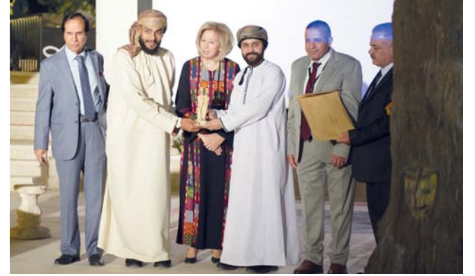
من تكريم الوفد العماني الفائز بالجائزة