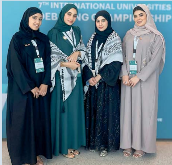
الفريق العماني المشارك بالبطولة