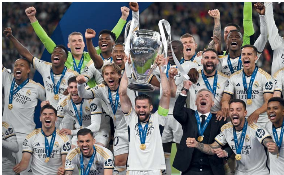
لاعبو ريال مدريد الإسباني يحتفلون بالتتويج بلقب دوري الأبطال للمرة الـ ١٥.

١٠٠ مليون يورو وتوزيع غير مسبق لحقوق صورته. ووافق ريال مدريد، الذي عادة ما يكون حذرا جدا بشأن هذا الجانب، على استئناء هذا اللاعب الاستثنائي والابتعاد عن تقاليده، وتحدثت وسائل الإعلام الأسبانية عن توزيع ٨٠ في المئة مقابل ٢٠ في المئة لصالح المهاجم الفرنسي. أما بالنسبة لزملائه في الفريق في المستقبل، فقد بادر بيلينغهام الى الإشادة به بعد نهائي دوري الأبطال بقوله «أنا لا أختار أعضاء الفريق وبالتالي لا أقوم بإجراء الانتقالات، لكن كيليان مبابي، ياله من لاعب! من لا يريد اللعب مع لاعب رائع مثله».