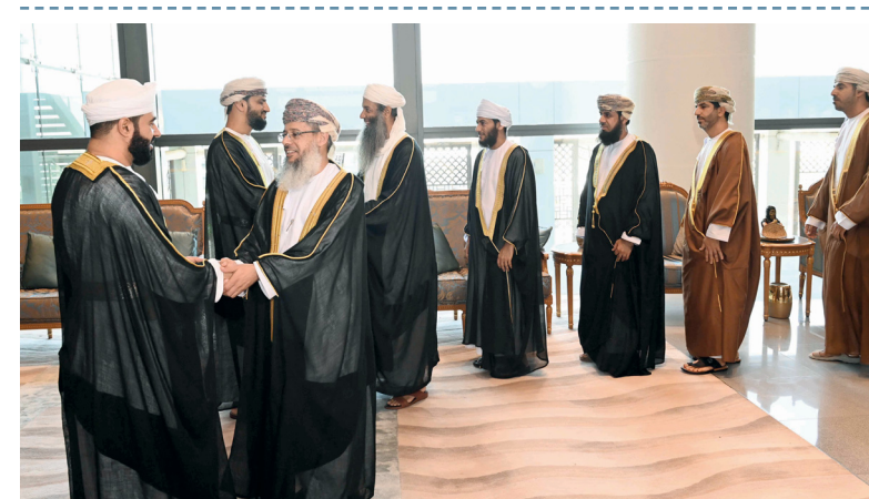
البعثة تتشكّل من وفد الإفتاء والإرشاد الديني والوفد الإداري والمالي