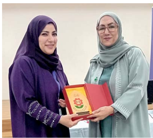
أثناء تكريم إحدى المشاركات في الدورة