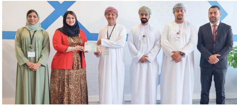
الجائزة تؤكد على ريادة بنك مسقط في تقديم الخدمات المصرفية الخاصة

وعبر الشيخ أيمن الحوسني الرئيس التنفيذي لـ «مطارات عُمان» عن سروره بنجاح هذه المشاركة والتي جاءت ضمن استراتيجية الشركة لتقديم صورة بارزة لأبرز التقنيات والابتكارات في عالم المطارات لسهولة وسرعة الإجراءات للمسافرين. حيث تم استعراض حلولنا التقنية المبتكرة في مجال الطيران والمطارات، والتي تعزز من تجربة السفر من خلال التحول الرقمي. مؤكداً أن «مطارات عُمان» تمثل نموذجاً بين مختلف