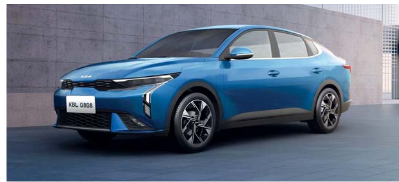
سيارة كيه 3 الجديدة كلاً

تم تطبيق شكل الجسم الجانبي والكسوة السوداء لجعل المظهر الجانبي للسيارة يبدو أنيقاً ومبتعاً، مما يزيد من الجاذبية إلى أقصى حد. ومع سيارة كيه 3، استفادت كيا من متطلبات المشترين ضمن فئة سيارات الصالون، وشركات