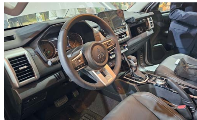
تكنولوجيا حديثة ومتطورة من الداخل

من التجهيزات الأخرى التي تعزز الأداء وتنوع الاستخدامات. ويفضل الخلوص الأرضي الأكبر وأنماط القيادة السبعة المتطورة المصممة خصيصاً للقيادة على الرمال والحصى والتضاريس الصخرية وغيرها وتوفر سيارة L200 تجربة قيادة سلسة وممتعة مهما كانت طبيعة الطريق. وتضع سيارة ميتسوبيشي L200 الجديدة كلاً معايير الأمان على رأس أولوياتها، حيث تم تجهيزها بأحدث أنظمة الأمان مثل نظام تخفيف حدة التصادم الأمامي، والتحذير من مغادرة المسار، والتحذير من النقطة العمياء، وشاشة المراقبة متعددة الاتجاهات (Multi Around Monitor)، وإمكانية توصيل الهاتف المتحرك لاسلكياً عبر Android Auto و Apple Car Play. وتعمل هذه الابتكارات بتناغم تام لتوفير أعلى مستويات الأمان وراحة البال للسائق والركاب على حد سواء. كما تعكس سيارة L200 الجديدة كليا التزام شركة ميتسوبيشي موتورز بالبيئة والاستدامة، حيث تهدف إلى تقليل الانبعاثات والحد من أثر السيارة على البيئة. ويفضل المحرك فائق الكفاءة واستخدام مواد التصنيع الصديقة للبيئة، تسعى الشركة من خلال سيارة L200 إلى بناء مستقبل أكثر حفاظاً على البيئة دون التضائل عن الأداء الفائق أو مستويات الراحة التي لا مثيل لها.