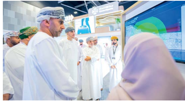
«مطارات عُمان» استعرضت أحدث التقنيات والحلول المبتكرة المقدمة

المطارات العالمية في خدماتها وإجراءاتها السلسة التي تمثل بيئة مريحة لجميع المسافرين سواء في مطار مسقط الدولي أو مطار صلالة وكذلك مطاري الدقم وصحار. خاصة وأن مطاراتنا نالت العديد