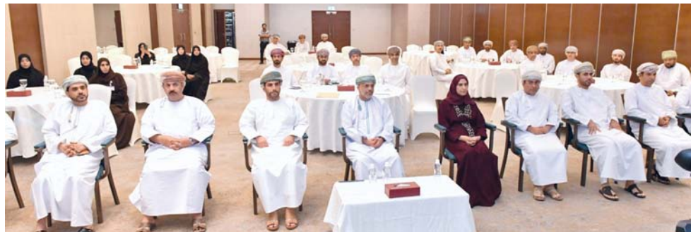
«تصوير: عبد الفتاح الغافري»