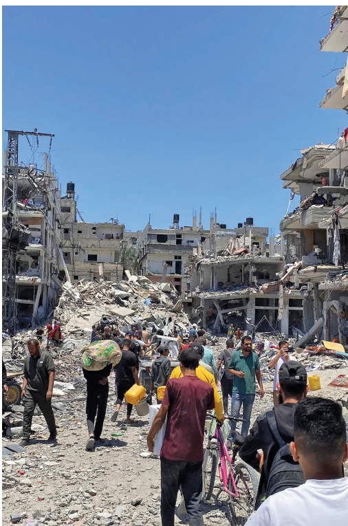
صورة نشرتها وكالة الأنباء الفلسطينية «وفا»، لفلسطينيين يتفقدون آثار الدمار الذي خلفه العدوان الإسرائيلي على مخيم جباليا.

قالت وزارة الصحة الفلسطينية في قطاع غزة إن الاحتلال الإسرائيلي ارتكب (٤) مجازر ضد العائلات في القطاع، وصل منها للمستشفيات (٦٠) شهيداً و(٢٢٠) مصاباً خلال (٢٤) ساعة. وأشارت الصحة في التقرير الإحصائي اليومي لعدد الشهداء والجرحى جراء العدوان الإسرائيلي المستمر لليوم الـ (٢٤٠) على قطاع غزة إلى ارتفاع حصيلة العدوان إلى (٣٦٤٣٩) شهيداً و(٨٢٦٢٧) مصاباً منذ السابع من أكتوبر