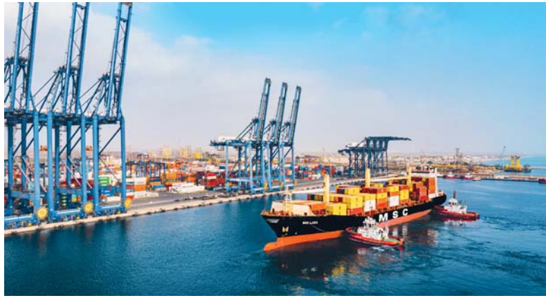
جملة إيرادات الضرائب والرسوم بنهاية العام الماضي سجلت ارتفاعاً بنسبة ١٠ بالمائة

زيادة مصروفات دعم المنتجات النفطية، وزيادة الإنفاق على المشروعات الإنمائية. وانخفضت المصروفات الجارية بنهاية عام ٢٠٢٣م بنسبة ١ بالمائة مسجلة نحو ٨ مليارات و ٥٥٤ مليون ريال عماني، مقارنة بالمعتمد في ميزانية عام ٢٠٢٣م بنحو ٨ مليارات و ٦٢٠ مليون ريال عماني. وبلغ الإنفاق الفعلي لوحدات الدفاع والأمن مليارين و ٨٩٤ مليون ريال عماني، منخفضاً بـ ١٠٦ ملايين ريال عماني مقارنة بالمعتمد في ميزانية عام ٢٠٢٣م، وارتفعت المصروفات الفعلية للوزارات المدنية بنهاية عام ٢٠٢٣م بنسبة ٤ بالمائة مسجلة نحو ٤ مليارات و ٦١٦ مليون ريال عماني، مقارنة بالمعتمد في ميزانية عام ٢٠٢٣م البالغة ٤ مليارات و ٤٢٠ مليون ريال عماني؛ ويعزى هذا الارتفاع إلى زيادة الإنفاق في بعض القطاعات. وارتفع إجمالي المصروفات للمشروعات الإنمائية للوزارات والوحدات الحكومية المدنية