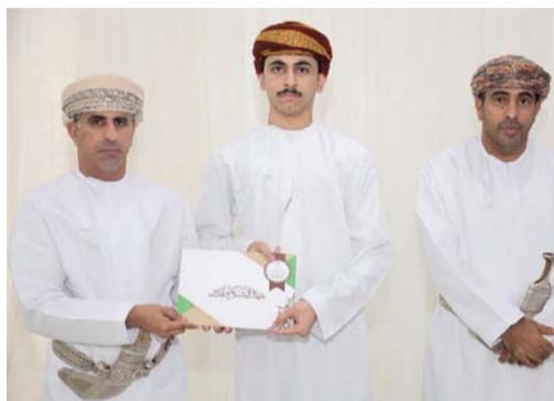
تكريم أحد الطلبة في شمال الباطنة