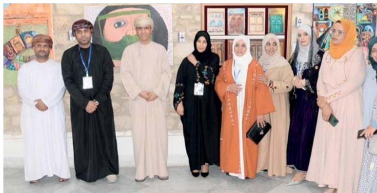
الوفد التشكيلي العماني المشارك في المعرض العالمي

كبير بالبحث عن الفنان وإرثه الثقافي، حيث تسهم هذه الملتقيات في إثراء لغة الحوار والتبادل الثقافي والفني ودعمها وتحفيزها واستقطاب الطاقات الإبداعية وانتشارها، راقية من الأعمال التشكيلية من مختلف المدارس الفنية.