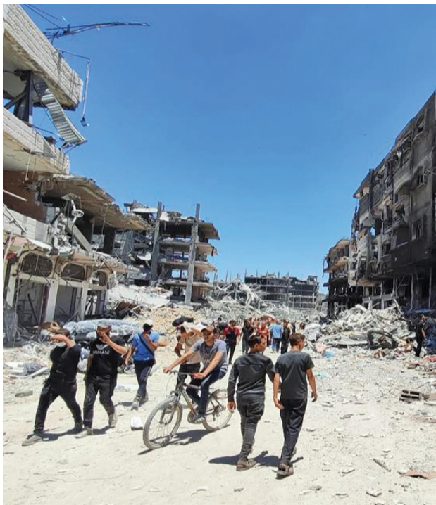
فلسطينيون يعودون إلى منازلهم بعد انسحاب قوات الاحتلال الإسرائيلي من مخيم جباليا وسط دمار كبير خلفته في المنطقة.