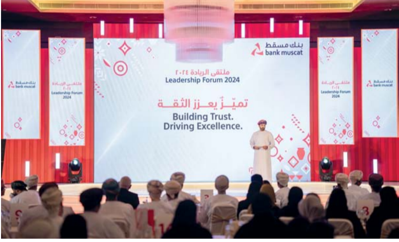
ملتقى بنك مسقط يساهم في تعزيز جودة العمل