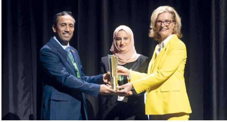
حصول منصة «بيانات» على الجائزة يعد اعترافاً دولياً بكفاءتها الإلكترونية

أداء قطاع سوق رأس المال من خلال توفير بيئة استثمارية محفزة وتنمى الثقة والجاذبة لرؤوس الأموال المحلية والأجنبية، وهو ما يواكب تحقيق متطلبات رؤية عمان ٢٠٤٠ في الوصول إلى تحقيق مستهدفات التحول الرقمي وتوفير المناخ الاستثماري المناسب. وأوضح سعادته أن رحلتنا في هذا المشروع انطلقت منذ البداية برؤية راسخة نحو توليف التطور التقني لتسهيل عمليات الإفصاح والاستفادة من اللغة المعيارية الموحدة في قراءة القوائم المالية وتقديم المعلومات الجوهرية لكافة المتعاملين في بورصة مسقط، وإضفاء خصائص التحليل والمقارنة التي تلبي احتياجات المستثمر الشغوف لبناء محفظته الاستثمارية بقواعد استثمارية منهجية وعلمية، والغاية تعزيز الإفصاح والشفافية عن أداء الشركات المدرجة وتعزيز الجاذبية للاستثمار في بورصة مسقط بما يسهم في الارتقاء بتصنيفها إلى سوق ناشئة.