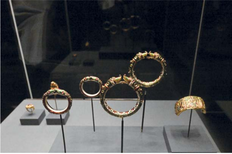
المعرض يضم ١٣٠ قطعة فنية فريدة

بحجر كريم يحمل أقدم وأكبر نقش باسم الحاكم التيموري (أولوج بيك)، حفيد أمير تيمور (تيمورلنك)، وتم نقشه قبل وفاته في عام (١٤٤٩م)، وقلادة من حجر اليشم باسم الإمبراطور المغولي (شاه جهان) تعود إلى الفترة (١٦٣٧ و ١٦٣٨م)، وكذلك خاتم رماية باسم الإمبراطور خلال الفترة (١٦٥١ - ١٦٥٢م). ويشمل المعرض أيضاً مجموعة متعددة من الخناجر والسكاكين والسيوف مُرصعة بالجواهر الثمينة كالإلماس والأحجار الكريمة تُعكس بهاء الحضارة الإسلامية الهندية، وتقدم صناعة السيوف والخناجر في تلك الفترة. كما يضم المعرض خاتم رماية تميز بنقش البسملة وأسماء الله الحسنى، ودرع مُرصع بالجواهر، وقباب وحليّات مُزخرفة للدرع، بالإضافة إلى صولجان احتفالي، ومقبض عصا مُرصع بالجواهر، ومجموعة من الأنية المنزلية المزينة منحوتة فنياً، كما تميّزت الزينة النسائية في المجموعة بالأشكال والتصاميم الفريدة مُرصعة بالإلماس والأحجار الكريمة ذات الألوان الزاهية، إلى جانب العديد من المقتنيات التي تعكس التنوع بين الفنون وحياة القصور في شبه القارة الهندية.