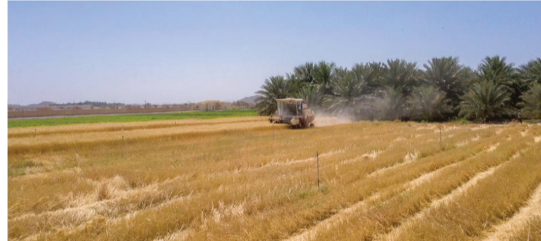
شراء محصول القمح العماني يشجع على تحقيق الأمن الغذائي بالبلاد

القمح العماني يحظى بقبول لدى المستهلكين نظراً لجودته العالية في الأسواق المحلية والإقليمية. وأشار إلى أن خطوة شركة المطاحن العمانية بشراء زراعة القمح في سلطنة عمان كجزء من استراتيجيتها لتعزيز منظومة الأمن الغذائي وتشجيع المزارعين على زراعة، موضحاً أن زيادة كمية القمح هذا العام يؤكد على أن