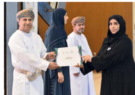
تكريم إحدى المعلمات بالظاهرة

بمحافظة شمال الباطنة بتكريم (١٦٤) طالباً وطالبة من المجيدين لدبلوم التعليم العام بمدارس الولاية للعام الدراسي ٢٠٢٣-٢٠٢٤ في احتفالية مميزة أقيمت بقاعة بتونيا نظمتها مجلس أولياء الأمور. رعى الفعالية سعادة الشيخ عبدالله بن سالم بن حمدان الحجري والي شخاص. اشتمل الحفل على تقديم عدّة فقرات منها فقرة ترحيبية قدمتها مدرسة الحضارة المشرفة.