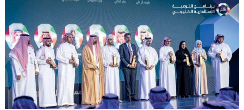
الجائزة تمثل إحدى مبادرات برنامج التوعية الاستثمارية الخليجي «ملم»