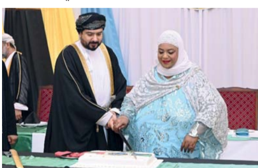
الحفل استعرض فرص الاستثمار في البلدتين كتب. عبدالله الجرداني:

أقامت سفارة جمهورية تنزانيا المتحدة بمحافظة مسقط حفل استقبال بمناسبة العيد الوطني والذكري (٦٠) لاتحاد تنجانيقا وزنجبار لتشكل الجمهورية. رعى الحفل الذي أقيم بفندق شيراتون عمان معالي ميسر بن محمد اليوسف وزير التجارة والصناعة وترويج الاستثمار وحضره عدد من أصحاب السعادة المسؤولين بسلطنة عمان ورؤساء البعثات الدبلوماسية المعتمدين لدى السلطنة وعدد من المسؤولين بوزارة الخارجية. وألقت سعادة فاطمة محمد رجب سفيرة تنزانيا لدى السلطنة كلمة أشادت فيها بالعلاقات العمانية التنزانية القوية والمتينة والتي تتميز بالاستقرار والصداقة العميقة. وبكرت أن العلاقات الطبية بين تنزانيا وعمان والتي تعود إلى فترة التجارة منذ العصور القديمة بين البلدتين ظلت تنمو منذ ذلك الحين حتى يومنا هذا، وقد تعززت هذه العلاقات من خلال تبادل الزيارات بين قيادات البلدين، فضلاً عن التعاون في المجالات الاقتصادية. تضمن الحفل عدداً من العروض المرئية عن السياحة في تنزانيا وفرص الاستثمار في قطاعات التعدين والنفط والغاز والزراعة والاقتصاد الأزرق والعقارات والنقل وغيرها من المجالات، كما تضمن الحديث عن إنجازات اللجنة العمانية التنزانية المشتركة خلال الفترة الماضية ودورها في الفترة المقبلة، كما ألقى عدد من الشعراء قصائد شعرية باللغتين العربية والسواحيلية تحدثت عن عمق العلاقات الأخوية بين البلدين. وعلى هامش الحفل أقيم معرض للمنتجات التنزانية احتوى على أنواع المأكولات والملابس والاكسسوارات والعمارة والبخور ومجسمات الزينة.