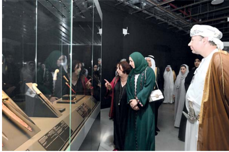
الحضور يتعرفون على مقتنيات وتفاصيل المعرض