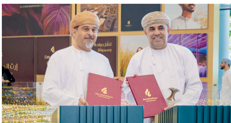
عقب توقيع إحدى اتفاقيات تطوير مدينة السلطان هيثم

شهدت سلطنة عُمان الأسبوع الماضي عدداً من المناسبات والفعاليات، حيث وقعت وزارة الإسكان والتخطيط العمراني (٥) للمؤتمرات والمعارض.