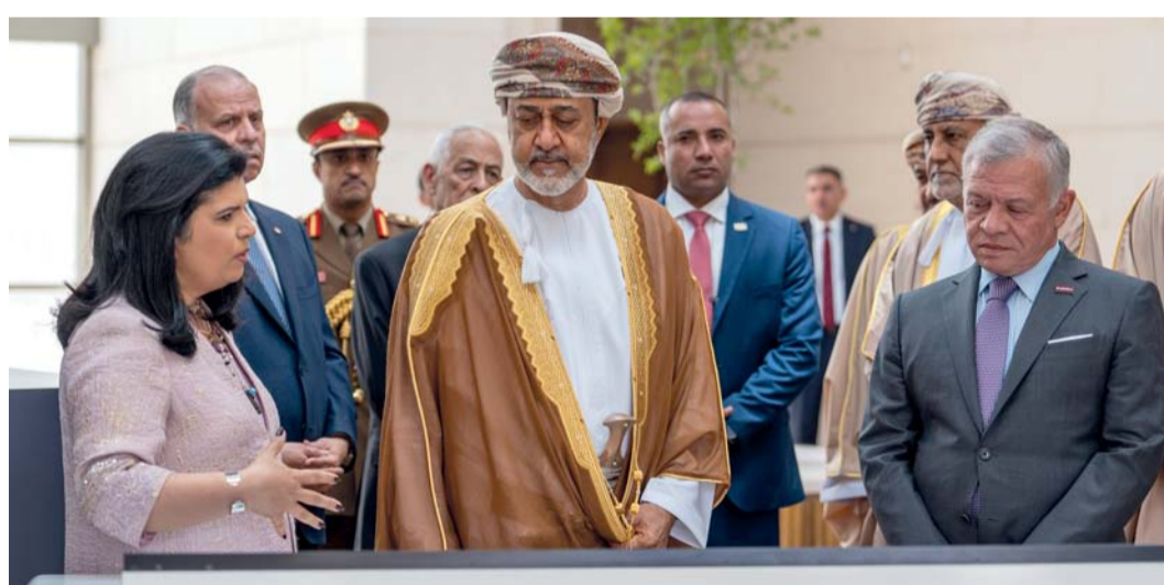
■ جلالة السلطان أثناء زيارته متحف الأردن بالعاصمة عمان يرافقه أخوه عبدالله الثاني، حيث استمع جلالته إلى شرح متكامل عما يحتويه المتحف من أقسام

وفي ختام الزيارة، عبر صاحب الجلالة السلطان هيثم بن طارق المعظم - حفظه الله ورعاها - عن أفر شكره وتقديره لأخيه صاحب الجلالة الملك عبدالله الثاني ابن الحسين. حفظه الله ورعاها. على حسن الاستقبال وكرم الضيافة، اللذين حظي بهما جلالته والوفد المرافق له في المملكة الأردنية الهاشمية. ■■