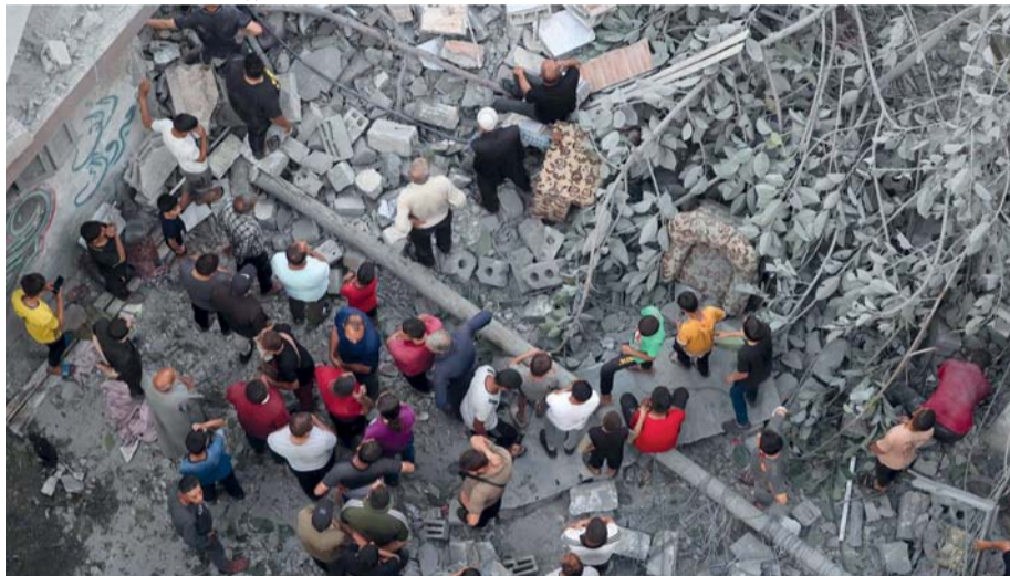
فلسطينيون يبحثون عن ناجين في موقع الغارة الإسرائيلية على حي الدرج في مدينة غزة.

بكين ١٨ أ.ب. أعلنت الصين انتهاء المناورات العسكرية الواسعة النطاق التي كانت تجريها منذ الخميس حول تايوان، وتخلها تشدد في لهجة بكين حيال تايبيه وصل إلى حد التلويح بالحرب، بعد أيام من تصريحات اعتبرتها انفصالية للرئيس التايواني الجديد لاي تشينج-تي. ومساء الجمعة، قال مديع في قناة سي بي تي في-٧، التلفزيون الرسمي الصيني المسؤول عن الأخبار العسكرية، إن الجيش الصيني «أكمل بنجاح» مناورات «السيف المشترك 2024». وأعلنت بكين الخميس بدء مناورات عسكرية ليومين حول تايوان، معتبرة ذلك «عقوبة» على «أعمال انفصالية»، وفق ما أفادت وسائل إعلام رسمية. وأتت المناورات بعد ثلاثة أيام من أداء لاي تشينج-تي الذي تصفه الصين بأنه «انفصالي خطر» اليمين رئيساً جديداً للجزيرة التي تتمتع بحكم ذاتي. من ناحية أخرى أقر عميل سابق لوكالة الاستخبارات المركزية الأمريكية «سي أي آيه» بالتجسس لصالح الصين، وفق ما أعلنت وزارة العدل الأمريكية. وأقر الكسندر بوك تشينج ما (٧١ عاماً) المولود في هونغ كونج والذي حصل على الجنسية الأمريكية، بتزويد السلطات الصينية في العام ٢٠٠١ «كمية كبيرة من المعلومات المصنفة سرية بشأن الدفاع الوطني الأمريكي»، على رغم أنه لم يعد موظفاً في الوكالة منذ ١٢ سنة خلت.