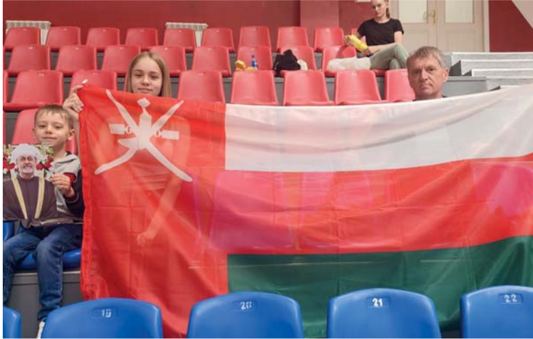
عائلة من كازاخستان ترفع علم سلطنة عُمان وصورة السلطان هيثم

وفي الربع الثالث من المباراة سعى منتخبنا إلى إحراز هدف وحصل على عدد من الفرص، ولكن تمكن منتخب إندونيسيا من إحراز هدف لتصل النتيجة إلى 4/1. وفي الربع الأخير من المباراة أضاع لاعبو المنتخب عددًا من الركنيات الجزائية التي كانت كفيلة بتعديل النتيجة فيما استغل المنتخب الإندونيسي تلك الفرصة وأحرز هدفًا وعاد منتخبنا وأحرز هدفه الثاني من ركنية عبر اللاعب أسامة رمضان. واستغل بعدها فرصة لركنية جزائية وأحرز الهدف الثالث عبر اللاعب طلال محمد، وأحرز المنتخب الإندونيسي هدفًا. وكان المنتخب قريبًا من تعديل النتيجة بعد أن أضاع عددًا من الفرص السهلة لينتهي