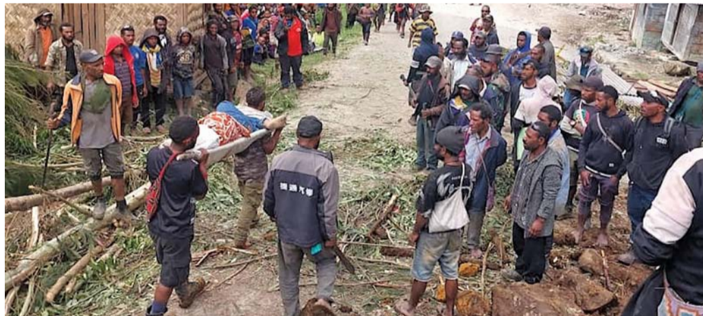
فرق الإنقاذ تحمل شخصاً مصاباً على نقالة جراء انهيار أرضي بقرية بمقاطعة إنجا في بابوا غينيا الجديدة

بور موريسي. أ. ب. أفاد مسؤولون محليون بأن ٣ أشخاص على الأقل قضاوا جراء كارثة انزلاق تربة واسع النطاق ضربت أكثر من ست بلدات في مرتفعات بابوا غينيا الجديدة مرجح أن تكون أدت إلى طمر الكثير من المنازل وأوقعت عدداً كبيراً من الضحايا. وضربت الكارثة مناطق بعيدة من ولاية إنجا عندما كان السكان نياماً في منازلهم. وقال حاكم الولاية بيتر إبياتاس لوكالة الأنباء الفرنسية إن الكارثة تسببت «بخسائر بشرية ومادية» وسط تقارير غير مؤكدة أن مئات الأشخاص طمروا جراءها. وأكد أن «أكثر من ست بلدات» معنية بانزلاق التربة هذا واصفاً الوضع بأنه «كارثة طبيعية غير مسبوقة تسببت بأضرار هائلة». من جهته قال الرئيس الأميركي جو بايدن إنه «صدم بالخسائر في الأرواح وبالدمار»، مضيفاً أن الولايات المتحدة «مستعدة للمشاركة» في جهود إعادة الإعمار مع شركاء مثل أستراليا ونيوزيلندا. وضربت الكارثة خصوصاً بلدة كاوكالام. وأرسل إلى المكان فريق للاستجابة العاجلة يضم أطباء وعسكريين وعناصر من الشرطة ووكالات من الأمم المتحدة لتقييم الأضرار ومساعدة الجرحى. وأظهرت مشاهد صورت في المكان انهيار جرف صخري كبير وترتبه من تلة ماونت مونجالو التي يغطيها نبات كثيف. وانتشر الركام الصخري والاشجار المقتلعة والوحول على مسار يصل إلى الوادي.