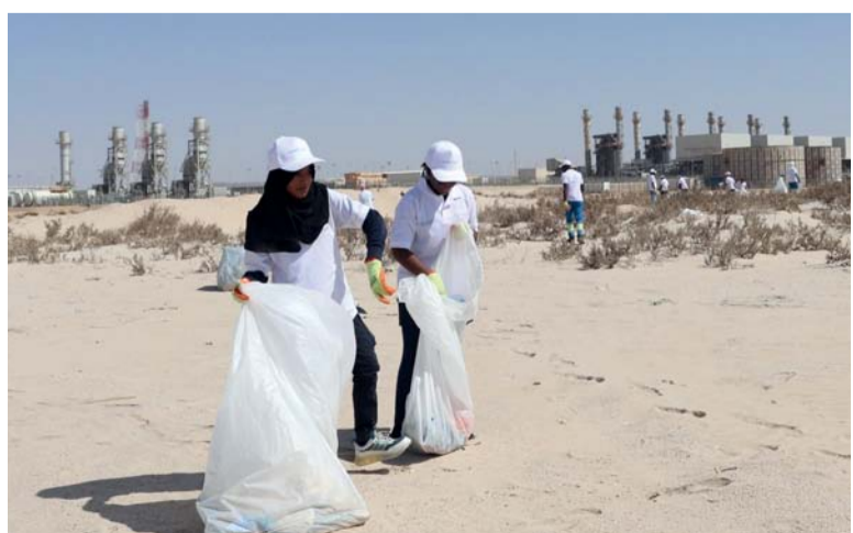
الحملة تهدف إلى رفع مستوى الوعي البيئي

نظمت إدارة المنطقة الاقتصادية الخاصة بالدقم حملة نظافة لشاطئ العنتوت بشعار «شواطئ نظيفة لبيئة صحية»، والتي شارك فيها أفراد من المجتمع المحلي وعدد من الشركات والمؤسسات العاملة في المنطقة، تم خلالها تنظيف الشاطئ وتمت الاستعانة بشاحنة متخصصة نتج عنها إزالة كميات كبيرة من المخلفات البلاستيكية والأخشاب وشباك الصيد مما جعل الشواطئ نظيفة. تهدف الحملة إلى تعزيز ورفع مستوى الوعي البيئي وإظهار مدى الآثار والأضرار البيئية المترتبة من رمي المخلفات في البحر أو على اليابسة. وقد شاركت عدة جهات لدعم هذه الحملة وهي مستشفى الدقم، ومدرسة السعد العالمية، وشركة مرافق المركزية، وشركة بيئة وشركة النهضة.