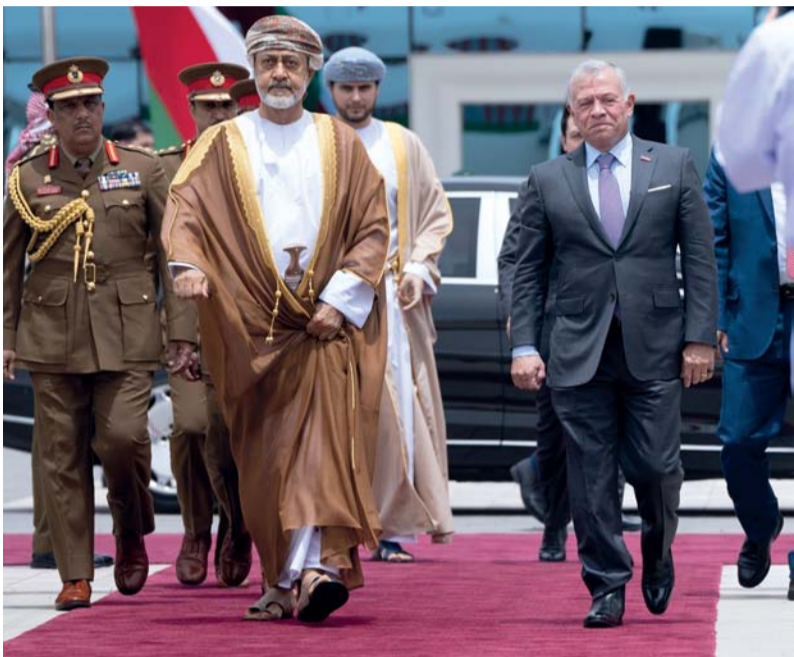
■ جلالة السلطان لدى مغادرته الأردن وعبدالله الثاني في مقدمة مؤدعيه