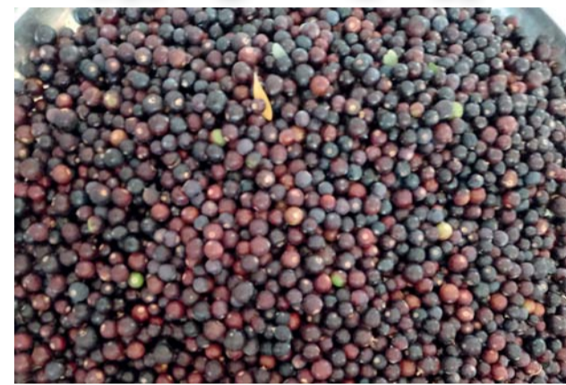
بوت الجبل الأخضر

من قبل عامة الناس، مشيراً إلى أن قيمة الكيلوجرام لكل منهما (٣) ريالاً عُمانية، وهي أسعار جيدة رغم بداية موسم حصاد هاتين الفاكهتين.