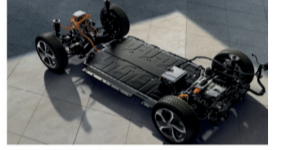
المنصة الكهربائية العالمية النموذجية

نقدم لكم سيارة كيا EV6، السيارة الكهربائية التي تعيد تعريف التنقل المستخدم بدون انبعاثات. تضع سيارة EV6 معياراً جديداً مع تجربة قيادة مستقبلية راقية. للاستمتاع بتجربة مباشرة للمركبات يرجى زيارة صالات العرض في مسقط (الوطنية والمواخ). الاعتماد الدولية للسيارات ش.م.م (س.ت رقم ١٧-٧١٨٣)، الوطنية: ٩٢٨٥٨٠٠٤، المواخ: ٩٩٤٧٣١٧٤