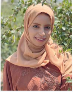
فتحية الفجرية *كاتبة عمانية