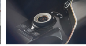
التحول عن طريق السلك (sbw) ناقل الحركة الدوار