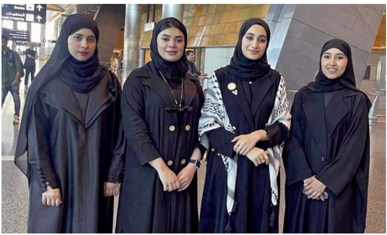
الفريق المشار في المناظرات