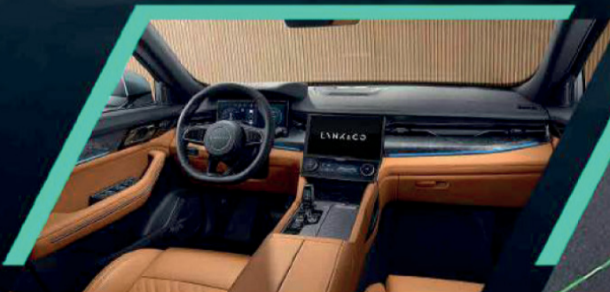
مقصورة من الدرجة الأولى تصميمات داخلية فاخرة