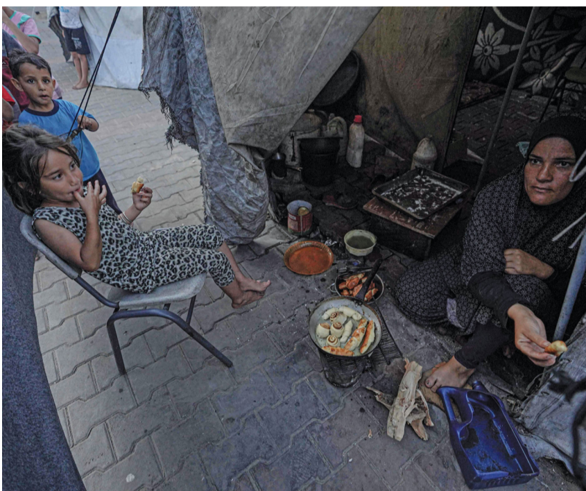
■ في ظلّ النزوح والحصار لا يجدُ الفلسطينيون سوى الحطب يوقدونه ليعنوا عليه ما يسدّ جوع أبنائهم والصورة من دير البلح.

آراء اليوم رأي «الوطن»، المنظومة الدولية أمام اختبار حقيقي من ثمار الصود والتضحيات فرح التي لم تعرف الفرح جرائم الأموال والظواهر الجسيمة استنزاف التصدي يجب إيقافه