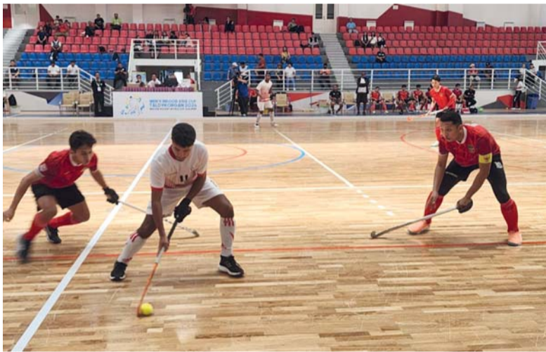
من لقاء منتخبنا أمام إندونيسيا