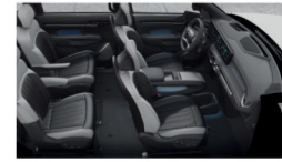
مقاعد متعددة (٧ و٦ مقاعد اختيارية)