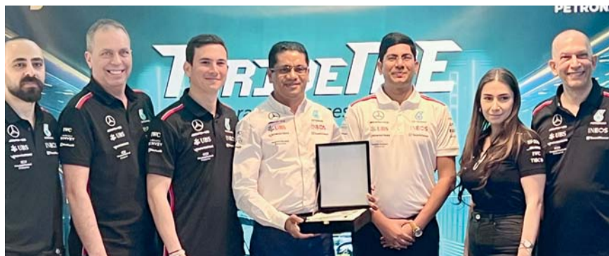
الجائزة تعد شهادة على التأثير الإيجابي الذي أحدثته عينت للسيارات