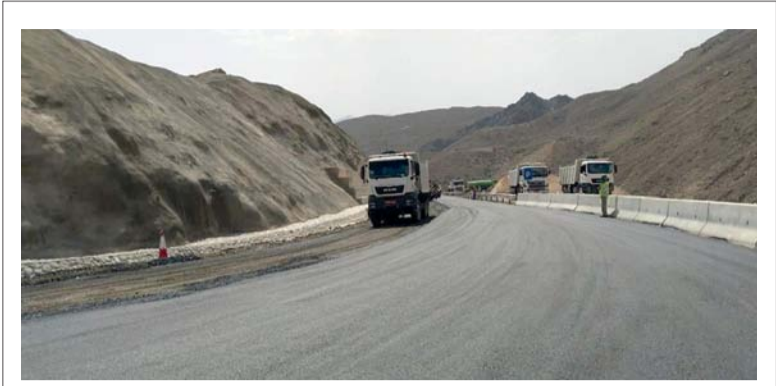
حصر الطرق بهدف عمل التحسينات في بعض التصاميم

ويجمع المعرض المؤسسات الحكومية المعنية بقطاع الاتصالات وتقنية المعلومات، مع الشركات الحكومية العاملة في القطاع، والشركات التقنية الكبيرة والمتوسطة والناشئة، إلى جانب رواد الأعمال في المجال التقني، والمبتكرين، والخبراء، والمهتمين بالتقنية، والجمهور العام المستفيد من الخدمات والتقنيات الرقمية. ويعد المعرض منصة لعرض أحدث الخدمات الإلكترونية للمؤسسات الحكومية والخاصة، وأبرز الابتكارات،