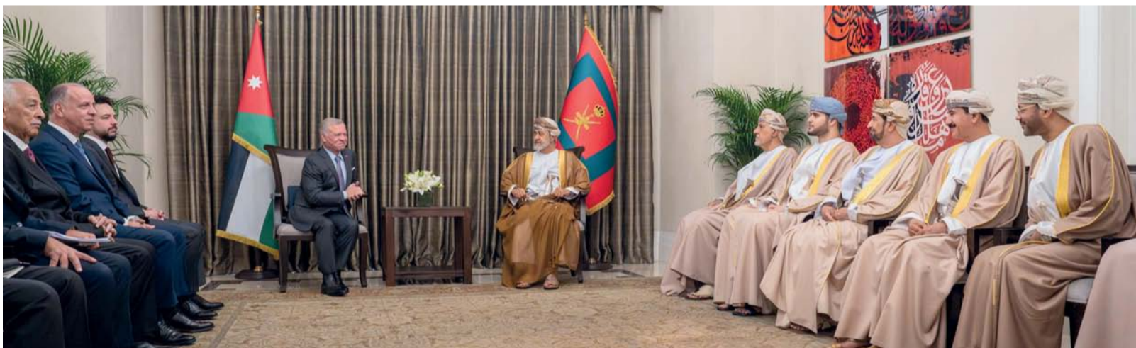
■ جلالة السلطان خلال لقائه بأخيه العاهل الأردني بمقر إقامة جلالته في قصر الندوة بالعاصمة عمان، حيث جرى تبادل الأحاديث الأخوية التي تعبر عما يجمع البلدين من علاقات متميزة

الثاني ابن الحسين ملك المملكة الأردنية الهاشمية بزيارة إلى متحف الأردن بالعاصمة عمان صباح الخميس الماضي، في إطار زيارة «دولة» يقوم بها جلالة السلطان إلى المملكة. وفور وصول الموكب المقل لجلالتهما، بحضور صاحب السمو الملكي الأمير الحسين بن عبدالله الثاني ولي عهد المملكة الأردنية الهاشمية إلى متحف الأردن، كان في استقبالهم سمو الأميرة سمية بنت الحسين نائبة رئيسة مجلس أمناء المتحف. وقد تجول جلالة سلطان البلاد المفدى في أروقة متحف الأردن، مستمتعاً. أيده الله. إلى شرح متكامل عما يحتويه من أقسام تسرد حكاية مليون ونصف مليون سنة من الوجود البشري والإرث التاريخي على أرض الأردن، من العصر الحجري القديم حتى الزمن الحاضر من خلال عرضها في قاعات التسلسل التاريخي.