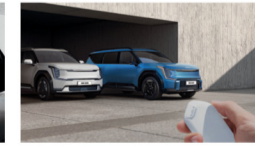
نظام لصف السيارة ألياً