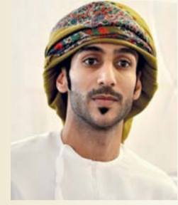
أحمد المقبالي شاعر عماني

ويذكرني وجهها بالساحرة في قصص الأميرات ديزني، إذ لها أنف طويل وعينان واسعتان ووجه جعده السنين كأنها أخذت أعمار أبناء كل فرد توفي في العائلة ليزداد عمرها، ذات شعر أشيب لونه رصاصي وكأنه لم يخضب قط،