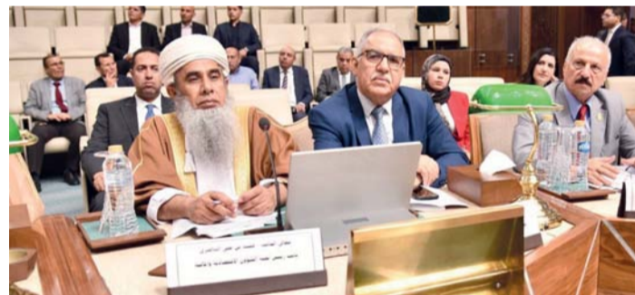
الاجتماع ناقش تطورات ومستجدات الأوضاع السياسية والأمنية والاجتماعية بالمنطقة العربية

في المنطقة العربية، بما يخدم حماية المصالح العربية والمساهمة في تحقيق الاستقرار والنمو والتكامل في الوطن العربي، كجزء من تطوير أدوات منظومة العمل العربي المشترك، وبما يساهم في حماية وصيانة الأمن القومي العربي، كما استعرضت اللجان رؤى برلمانية لحلحلة الأزمات الراهنة وكذلك مشاريع القوانين التي يعكف البرلمان العربي على إعدادها، تمهيداً لاعتمادها من الجلسة العامة، وناقشت لجنة الشؤون التشريعية والقانونية وحقوق الإنسان، عدداً من الملفات المطروحة على جدول الأعمال، وفي مقدمتها الاجتماع المشترك مع رئيس لجنة الميثاق العربي لحقوق الإنسان، إضافة إلى تقرير اجتماع اللجنة المشتركة المعنية بالإشراف على إعداد قانون مكافحة التمر في العالم العربي، والمسودة الثانية لمشروع تقرير حالة