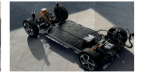
المنصة الكهربائية العالمية النموذجية

تم تصميم سيارة كيا EV9 الجديدة كلياً لإحداث تحول في مستقبل التنقل. نقدم لكم مركبات مستدامة وصديقة للبيئة خالية من انبعاثات الكربون. حيث يمكنك اكتشاف عالم المركبات الكهربائية بتصميمها المذهل وميزاتها الحديثة. فم بتجربة المركبات المتاحة للعرض في مسقط في صالات عرض الوطنية والمواخ اليوم. الاعتماد الدولية للسيارات ش.م.م (س.ت رقم ١٧-٧١٨٣)، الوطنية: ٩٢٨٥٨٠٠٤، المواخ: ٩٩٤٧٣١٧٤