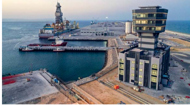
توقعات بأن تبلغ نقطة تعادل سعر النفط في سلطنة عُمان بين ٧٠.٦٥ دولار أميركي للبرميل