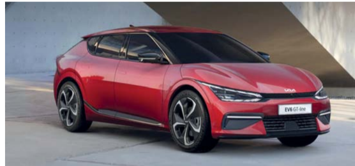
كيا الكهربائية الجديدة بالعديد من أنظمة السلامة

وهائلة مما يضمن تجربة قيادة لا مثيل لها لجميع من يجلس خلف عجلة القيادة وتتمتع أيضاً بزمان على مجموعة ناقل الحركة لمدة ٥ سنوات لكل ١٠٠,٠٠٠ كم وضمان ضد الثقوب لمدة ٣ سنوات لكل ١٠٠,٠٠٠ كم. كما تتميز كيا EV6 ببطارية تبلغ سعتها ٧٧,٤ كيلوات في الساعة مع محرك أمامي بقدرة ٧٤ كيلوات ومحرك خلفي بقدرة ١٦٥ كيلوات ويأتي محركها ثنائي بقوة ٣٢٠ حصاناً ويحتوي على عناصر خارجية سوداء اللون، بما في ذلك قوالب أقواس العجلات والمعالجات الجانبية والواجهات الأمامية والخلفية ويمكن السفر لمسافات طويلة تصل إلى ٥٢٨ كيلومتراً وتتميز بمجموعة من الميزات