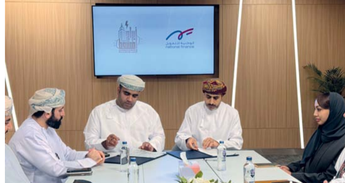
توقيع الاتفاقية بين «الوطنية للتمويل» وأبراج مسقط للإلكترونيات

يمكن للمستهلك شراء السلع التي يختارها بكل سهولة. وتعكس الجهود المتضافرة التي تبذلها الوطنية للتمويل في شراكتها مع كبار تجار التجزئة فهم الشركة العميق لاحتياجات المستهلكين المتغيرة وتقانيها في تقديم حلول تمويل استهلاكية شاملة تتعامل بمهارة مع كافة التحديات وتدرك كلاهما خلال هذه الشراكة المثمرة رغبة العملاء في الحصول على منتجات عالية الجودة وتضمن دائماً تقديم تجربة تسوق سلسة وممتعة.