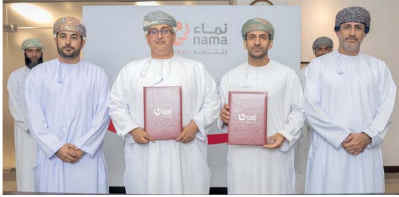
الاتفاقية ستعمل على إيجاد أحدث الطرق والابتكارات والتقنيات

شهد الأسبوع الماضي العديد من الأحداث الاقتصادية والتي كان أبرزها، إصدار وكالة فيتش تقرير تصنيفها الائتماني عن سلطنة عُمان الذي أكبت فيه التصنيف الائتماني عند «BB+» مع نظرة مستقبلية مستقرة، نتيجة تراجع الدين العام كنسبة من الناتج المحلي الإجمالي، والأثر الإيجابي من الإجراءات على المالية العامة.