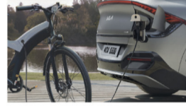
ميزة الشحن من السيارة على تيار متردد بقوة ٢٢٠ فولط