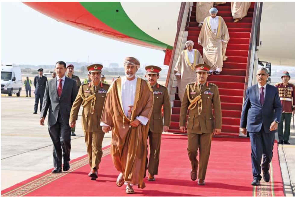
■ جلالة السلطان لدى عودته إلى أرض الوطن بعد أن اختتمت زيارة «دولة» للمملكة الأردنية الهاشمية

■ مسقط. العمانية: عبر حضرة صاحب الجلالة السلطان هيثم بن طارق المعظم وأخوه جلالة الملك عبدالله الثاني ابن الحسين ملك المملكة الأردنية الهاشمية. حفظهما الله ورعاهما. عن اعتزازهما بمستوى العلاقات التاريخية الراسخة التي تجمع سلطنة عُمان والمملكة الأردنية الهاشمية، وحرصهما على البناء على تلك العلاقات لتوطيد آليات التعاون في شتى المجالات وصولاً لتحقيق التكامل المنشود. جاء ذلك في بيان مشترك بين سلطنة عُمان والمملكة الأردنية الهاشمية بمناسبة زيارة «دولة» حضرة صاحب الجلالة السلطان هيثم بن طارق المعظم. حفظه الله ورعاها. إلى المملكة الأردنية الهاشمية. ■■