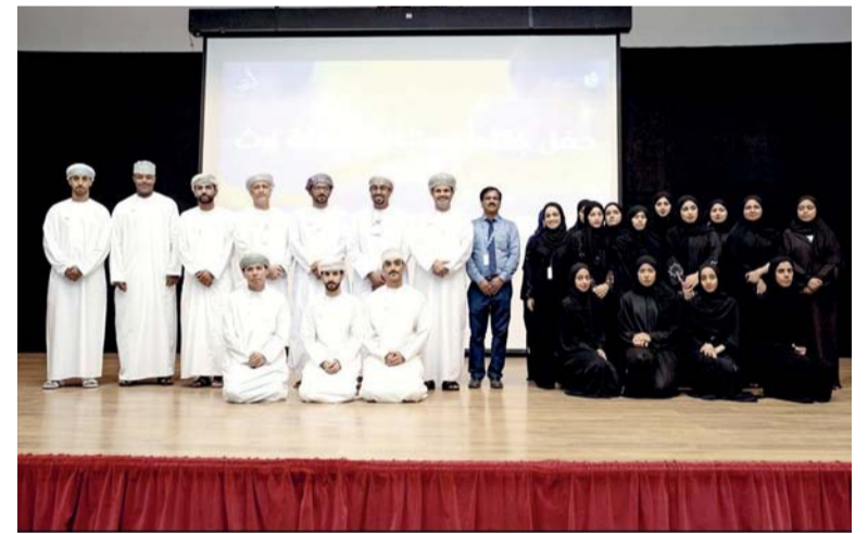
صورة جماعية لعدد من المشاركين والمشاركات في الحملة

الشروع والانطلاق في التوثيق والسرد لهذا الإرث العظيم، قبل أن يغيب الموت من بقي من كبار السن الذين يحملونه). غلاف الكتاب