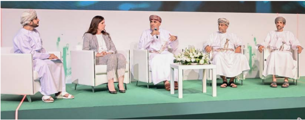
الجلسات تناولت واقع وأفاق التنمية المحلية والمكثبات التي تعزز التوجه الاستراتيجي نحو اللامركزية