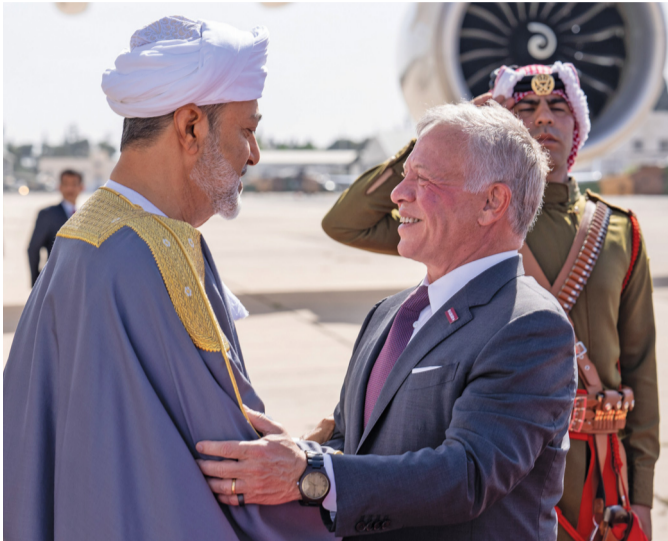
جلالة السلطان والعاقل الأردني في مقدمة المستقبليين