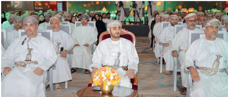
ذي يزن بن هيثم أثناء رعايته افتتاح «منتدى اقتصاديات المحافظات ٢٠٢٤»

مسقط، العمانية: رعى صاحب السمو السيد ذي يزن بن هيثم آل سعيد وزير الثقافة والرياضة والشباب حفل افتتاح «منتدى اقتصاديات المحافظات» والذي يستعرض الرؤى الاستراتيجية لتعزيز اللامركزية والتنمية المحلية واستغلال الميزات التنافسية لسلطنة عمان. تفاصيل ..... «التقاضي»