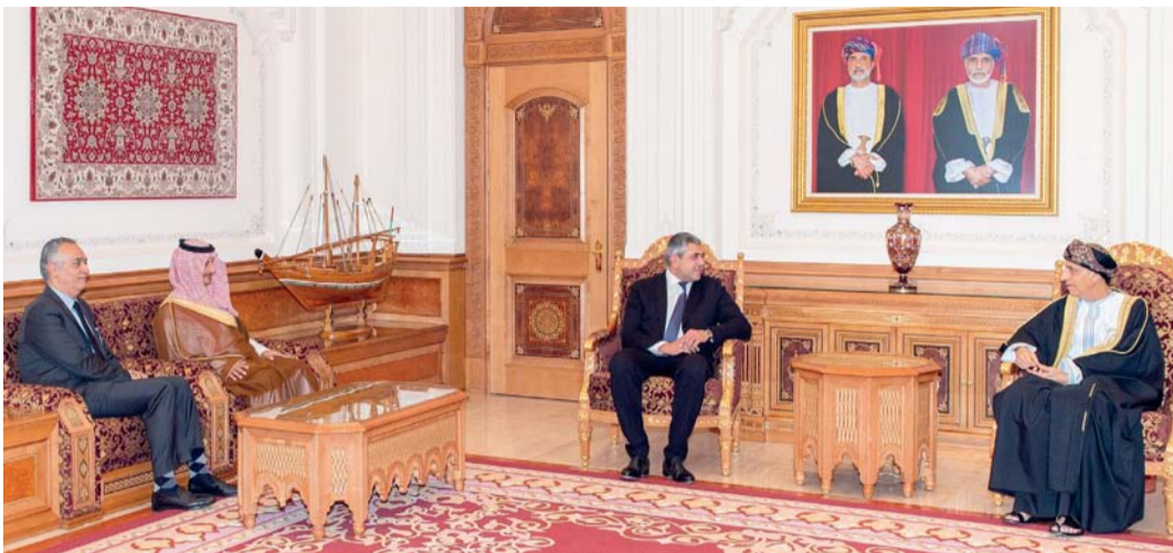
فهد بن محمود لدى استقباله رؤساء الوفود المشاركين في الاجتماع

في التنوع الاقتصادي، وتوفير المزيد من فرص العمل. كما أعرب سؤوه عن تقديره لدور المنظمة العالمية للسياحة في تطوير القطاع السياحي ما جعل منطقة الشرق الأوسط بشكل خاص تتبوأ مركزاً متقدماً أكثر المناطق نمواً في جذب السائحون وتهيئة السبل لهم على مستوى العالم. تناول الحديث خلال المقابلة