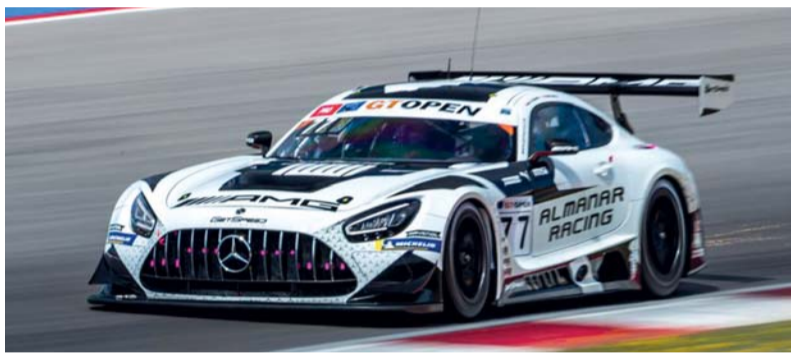
سيارة فريق المنار للسباقات خلال المشاركة في البطولة

وسيواجه ثنائي «فريق المنار للسباقات» منافسة قوية من عدد من السائقين والفرق، الرياضية بمُجمّع السلطان قابوس الرياضي بجوشر ونظمتها لجنة الرياضة المدرسية بمحافظة مسقط بالاتحاد العماني للرياضة المدرسية بالتعاون مع الاتحاد العماني لكرة اليد واللجنة النسائية، وتأتي هذا البطولة في إطار الجهود المبذولة بين الاتحاد المدرسي والاتحاد العماني لكرة اليد حيث تهدف البطولة إلى توفير الظروف الملائمة لاكتشاف المواهب الرياضية وحصرها وإشراكها في المنافسات المختلفة على مستوى المدارس وتفعيل شراكة فاعلة بين لجنة الرياضة المدرسية والاتحاد العماني لكرة اليد بشكل يساهم في تعزيز مشاركة الطالبات ودعم الرياضة المدرسية كما ستسهم البطولة في بث روح التنافس الشريف والروح الرياضية بين الطالبات وهذا الهدف الذي تسعى اللجنة إلى تحقيقه من إقامة البطولة.