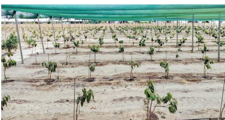
المزارع النموذجية تساهم في تعزيز منظومة الأمن الغذائي

من المحاصيل عبر كافة التقنيات الحديثة في المجال الزراعي، وزيادة مساحة الرقعة الخضراء بالولايات، ورفع السوق المحلي وزيادة الدخل لدى المزارعين وتوفير ثمار من أصناف مختلفة للسوق المحلي والإسهام في إحلال الواردات وتطوير زراعة ورعاية وحصاد الأشجار بالإضافة إلى رفع كفاءة توزيع وتسويق وتصنيع المنتجات وإيجاد فرص عمل للمواطنين العمانيين. وأضاف أن المزارع النموذجية في محافظة جنوب الباطنة توفر وتستخدم أراضي لإنتاج أصناف زراعية محلية مثل المانجو والعنب وغيرها بمواصفات ومقاييس تتناسب مع توجهات وزارة الثروة الزراعية والسمكية وموارد المياه لتكون على مستوى عالٍ من الإنتاجية والتنمية المستدامة على المدى البعيد لرفع السوق المحلي. وأشار المهندس إلى أنه يشترط في الحصول على إقامة المزارع النموذجية أن تكون