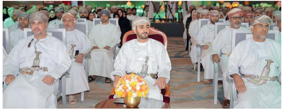
ذي يزن بن هيثم خلال رعايته افتتاح «منتدى اقتصاديات المحافظات ٢٠٢٤»