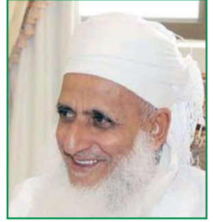
يجيب عن أسئلتكم سماحة الشيخ العلامة أحمد بن حمد الخليفي المفتي العام للسلطنة

نريد منكم سماحك أن تبينوا لنا مناسك الحج باختصار؟ مناسك الحج تكون على ثلاث كفايات، لأن من يذهب إلى حج بيت الله الحرام فيما أن يكون مفردا بالحج وحده، وإما أن يكون قارنا بين الحج والعمرة، وإما أن يكون متمتعا بالعمرة إلى الحج، فأما المفرد بالحج فإنه يهل من أول الأمر بالحج بحيث يقول: (لبيك اللهم لبيك، لبيك لا شريك لك لبيك، إن الحمد والنعمة لك والملك لا شريك له، ثم يقول: لبيك بحجة تمامها وبلاغها عليك يا الله يعني أنه قاصد أداء فريضة الحج من غير أن يدرج العمرة في ضمن هذا الأداء، وعندما يصل إلى هناك إن كانت ثم فرصة فإن من أهل العلم من يرى أن يطوف بالبيت الحرام، ومنهم من يرى أن الطواف قد