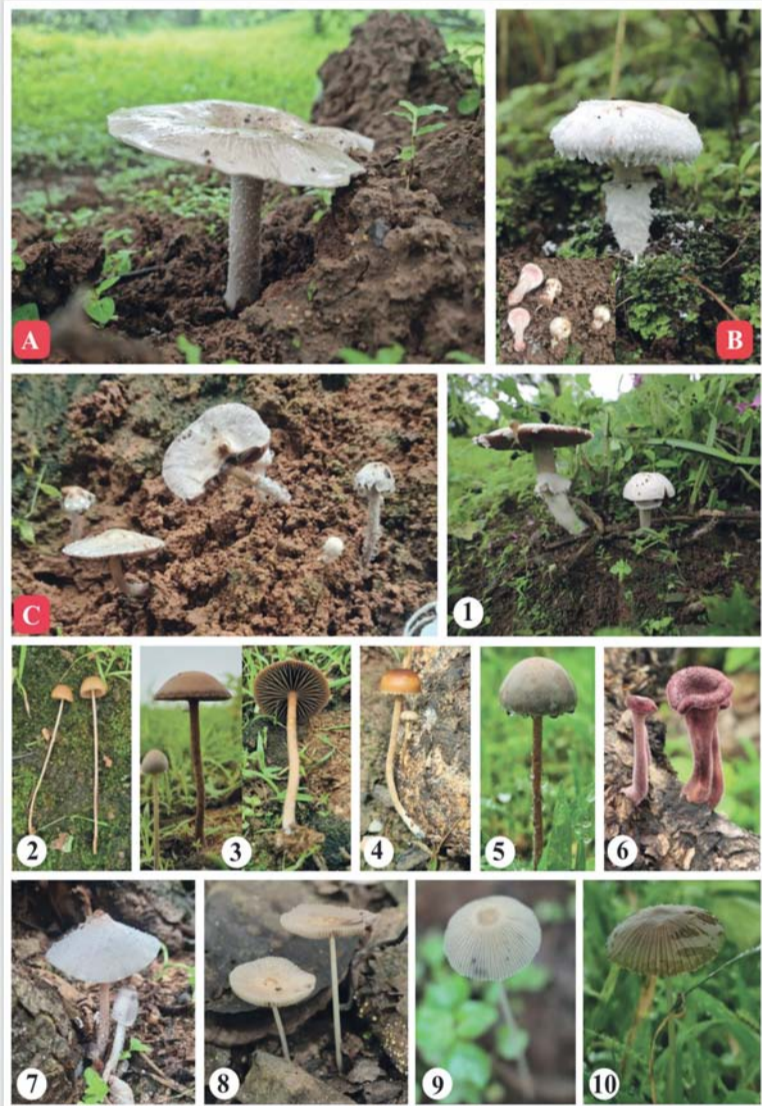
صورة مجمعة للفطريات المكتشفة حديثاً

رعى المؤتمر الصحفي وأعلن عن الاكتشافات معالي الأستاذة الدكتورة رحمة بنت إبراهيم المحروقية وزيرة التعليم العالي والبحث العلمي والابتكار، وحضره الفريق البحثي ومجموعة من المسؤولين في قطاعات البحث العلمي والاستثمار والصناعة، وممثلون عن المجتمع المحلي بالإضافة إلى مجموعة من طلبة المدارس والجامعات. ويضم الاكتشاف ثلاثة أنواع من الفطريات الكبيرة تعرف لأول مرة في العالم وعشرة فطريات كبيرة أخرى تسجل لأول مرة في عُمان والجزيرة العربية. وتم جمع الفطريات من مناطق مختلفة من محافظة ظفار في خريف العام الماضي ٢٠٢٢ وتوصيفها بالمختبرات باستخدام التقنيات الحديثة التي تعتمد على التسلسل الجيني لهذه