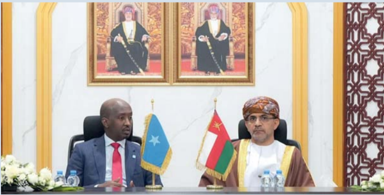
الجانبان أكدا على تعزيز التجارة والاستثمار في المنتجات السمكية

مسقط. العمانية: ناقشت سلطنة عمان وجمهورية الصومال الفيدرالية تعزيز التعاون في مجال الثروة السمكية ومجال الصيد التجاري والاستزراع السمكي والقيمة المضافة، وتبادل الخبرات وتنمية القدرات، إضافة إلى تعزيز التجارة والاستثمار في الأسماك والمنتجات السمكية مع مراعاة جميع المتطلبات والظروف بين البلدين، والعمل على توحيد المواقف في مختلف القضايا ذات الصلة في المحافل والاجتماعات الدولية. جاء ذلك خلال لقاء معالي الدكتور سعود بن حمود الحيسي وزير الثروة الزراعية والسمكية وموارد المياه، أمس، معالي أحمد حسن آدم وزير الثروة السمكية والاقتصاد الأزرق بجمهورية الصومال الفيدرالية الذي يزور سلطنة عمان حالياً.