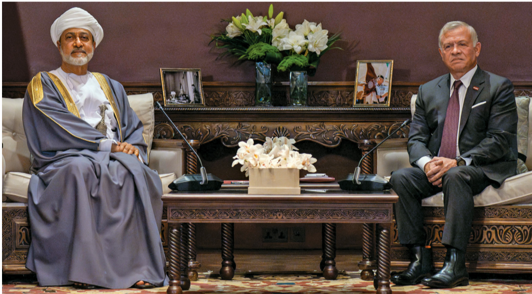
جلالة السلطان والعاقل الأردني أثناء جلسة المباحثات الرسمية بقصر بسمان بالعاصمة عمان

عمان، العمانية: عقد حضرة صاحب الجلالة السلطان هيثم بن طارق المعظم وأخوه جلالة الملك عبد الله الثاني ابن الحسين ملك المملكة الأردنية الهاشمية، حفظهما الله ورعاهما، جلسة مباحثات رسمية موسعة مساء أمس بقصر بسمان بالعاصمة الأردنية عمان. كما جرى خلال الجلسة استعراض آفاق التعاون الثنائي المشترك بين البلدين الشقيقين وسبل تطويره في مختلف المجالات في ظل ما يجمعهما من وشائج وروابط تاريخية وطيدة، وبما يعزز المصالح المشتركة ويغود بالنفع والخير على الشعبين العماني والأردني، كما تبادل العاهلان وجهات النظر حول كافة القضايا ذات الاهتمام المتبادل بين القيادتين على الساحتين العربية والدولية خصوصاً الأوضاع الرأهنة في قطاع غزة وعموم الأراضي الفلسطينية المحتلة، وأكد جلالتهما على ضرورة التوصل لوقف فوري ودائم لإطلاق النار في غزة وحماية المدنيين وتكثيف الجهود لإيصال المساعدات الإنسانية الكافية إلى جميع أنحاء القطاع. تفاصيل ..... ص ٢ و٣