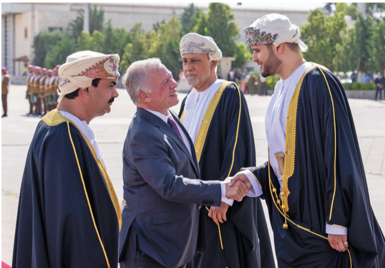
العاقل الأردني يصافح أعضاء الوفد الرسمي المرافق للمقام السامي