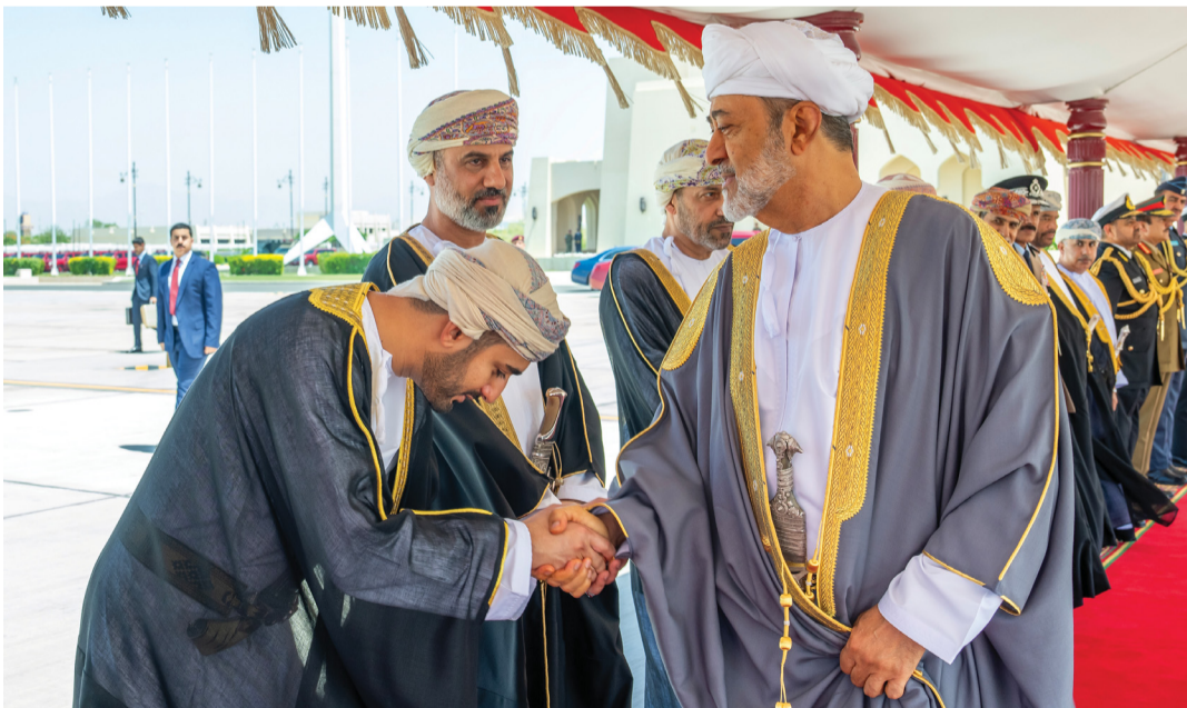
جلالة السُّلطان يُصافح كبار مُؤدعيه بالمطار السلطاني الخاص لدى مغادرة جلالته البلاد أمس متوجِّهاً إلى المملكة الأردنية الهاشمية

وفور دخول الموكب المقلَّ لجلالتهما إلى قصر بسمان أحاط الموكب الأحمر بالسيارة الرئيسية