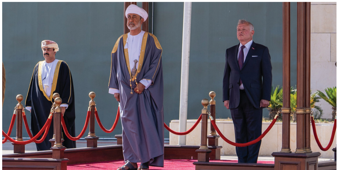
العاهلان لدى عزف السلام السلطاني والسلام الملكي الأردني

بحري سيف بن ناصر الرحبي قائد البحرية السلطانية العُمانية، واللواء الركن مسلم بن محمد جعوب قائد قسوة السُّلطان الخاصة.