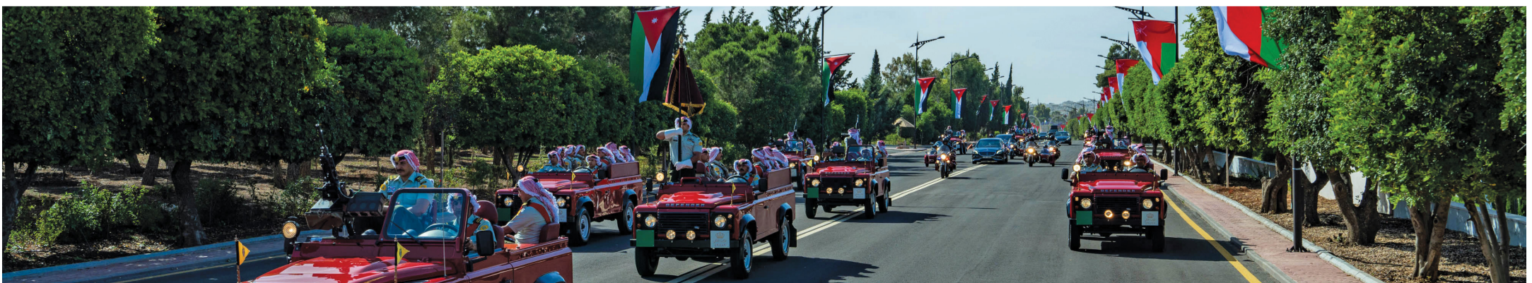
الموكب الأحمر يحيط بالسيارة الرئيسية المقلَّة لجلالة السلطان في تقليد ملكي أردني يعكس حفاوة الاستقبال.