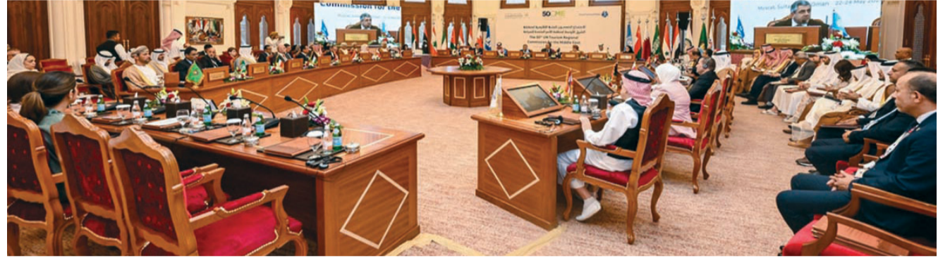
الاجتماع تطرق إلى التحديات التي تواجه قطاع السياحة في منطقة الشرق الأوسط

من جهته أكد معالي زوراب لونيكايفي الأمين العام لمنظمة الأمم المتحدة للسياحة أن منطقة الشرق الأوسط شهدت الفترة الماضية نشاطاً سياحياً مثيراً، لافتاً إلى أن قطاع السياحة تغير بشكل كبير خلال السنوات الماضية، وذلك نتيجة للتطورات المختلفة في التقنيات المتوفرة وفي مجالات التواصل والتعليم. وأشار معالي مكرم مصطفى القيسي وزير السياحة والآثار بالملكة الأردنية الهاشمية إلى أهمية الاجتماع لبحث سبل التعاون المشترك بين دول المنطقة ومنظمة الأمم المتحدة للسياحة للنهوض بقطاع السياحة وإبراز دوره الفاعل في دعم اقتصادات دول المنطقة ورفع مساهمته في الناتج المحلي الإجمالي وتوليد المزيد من فرص العمل بالإضافة إلى إيجاد الحلول المناسبة للتحديات التي تواجه نمو هذا القطاع.