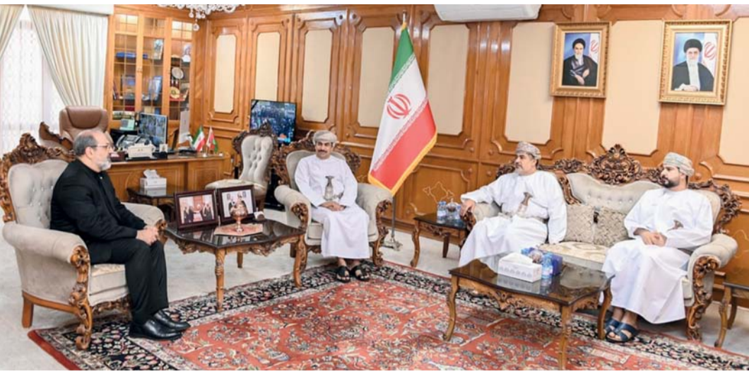
عدد من المسؤولين أثناء تأدية واجب العزاء