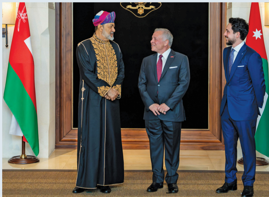
جلالة السُّلطان والعاهل الأردني أثناء مأدبة العشاء بقصر الحسينية

بقصر الحسينية بالعاصمة عمَّان على شرف أخيه جلالة السُّلطان المعظم بمناسبة زيارة جلالته للمملكة. حضر المأدبة الوفد الرسمي المرافق لجلالة السُّلطان المعظم وعددٌ من كبار المسؤولين الأردنيين. ﷻ