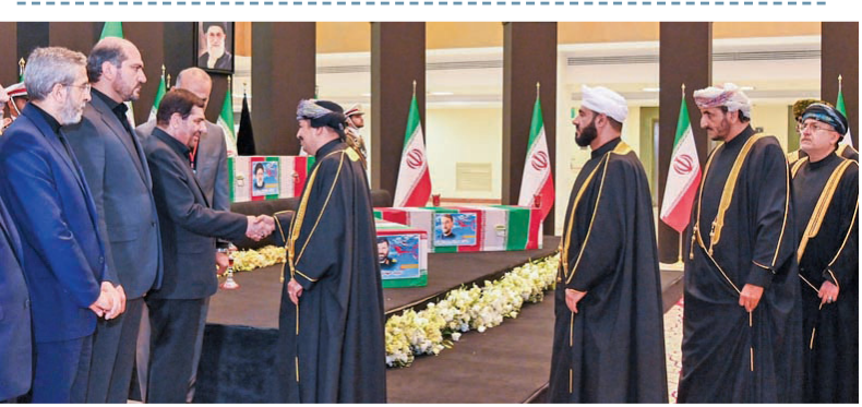
الوفد الرسمي يُقدم تعازي ومواساة جلالته إلى رئيس السلطة التنفيذية المكلف بالجمهورية الإسلامية الإيرانية.