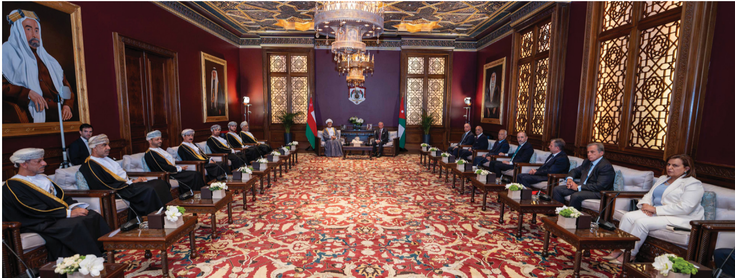
جلالة السلطان والعاقل الأردني أثناء جلسة المباحثات الرسمية الموسعة بقصر بسمان بالعاصمة عمان