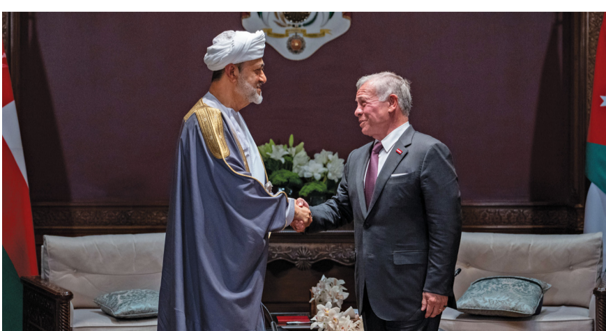
جلالة السلطان والعاقل الأردني يتبادلان أرفع الأوسمة بمناسبة زيارة «دولة» يقوم بها جلالته للمملكة الأردنية الهاشمية

عُمان. العُمانيّة: تبادل حضرة صاحب الجلالة السلطان هيثم بن طارق المعظم وأخوه جلالة الملك عبدالله الثاني ابن الحسين ملك المملكة الأردنية الهاشمية الشقيقة. حفظهما الله ورعاهما. الأوسمة بمناسبة زيارة «دولة» يقوم بها جلالته للمملكة. ففتح جلالة السلطان المعظم. أيده الله. أخاه جلالة الملك «وسام آل سعيد» وهو أرفع وسام عُماني تقديراً من لدن جلالته للعاقل الأردني واعتزازاً بعمق الروابط الأخوية المتينة التي تجمع البلدين والشعبين الشقيقين. فيما قلد جلالة الملك عبدالله الثاني ابن الحسين أخاه جلالة السلطان المعظم قلادة الحسين بن علي» أرفع وسام أردني تجسيدا للعلاقات التاريخية المتميزة التي تربط البلدين والشعبين العُماني والأردني الشقيقين.