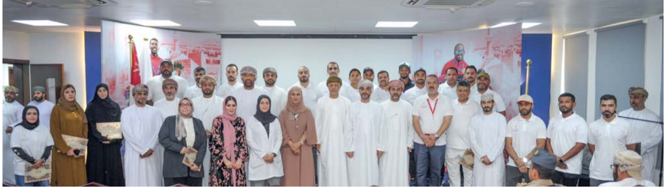
■ صورة جماعية لرعاية الختام والحضور والمشاركين

خلال زيارته، استعرض الدكتور بلحسن مالوش برنامج الفيفا العالمي لتطوير كرة القدم، وناقش جوانب فنية وتنظيمية متعددة مع المسؤولين في الاتحاد العُماني، بهدف تعزيز التعاون بين الفيفا والاتحاد العُماني وتطوير البنية التحتية لكرة القدم