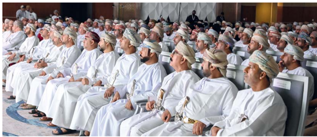
المنتدى يستعرض توجهات برنامج تنمية المحافظات نحو استغلال الميزات النسبية التنافسية في المحافظات

بالمحافظات، موضحاً أن هذه المبادرة ستعمل على تمكين القطاع السياحي في تنمية اقتصاد المحافظات عن طريق دعم المشروعات التي تستغل الميزات النسبية لكل محافظة وتحقق جدوى ملموسة في تنمية المجتمعات المحلية والمؤسسات الصغيرة والمتوسطة وإيجاد فرص عمل جديدة لأبناء المحافظات. واشتمل المنتدى على عقد ثلاث جلسات حوارية تناولت واقع وأفاق التنمية المحلية في سلطنة عُمان والمكثبات التي تعزز التوجه الاستراتيجي نحو اللامركزية، حيث جاءت الجلسة الحوارية الأولى تحت عنوان «التنمية المستدامة للمحافظات»، في حين جاءت الجلسة الحوارية الثانية بعنوان «مكثبات التنمية الاقتصادية للمحافظات: اللامركزية والتحول الرقمي والاستثمار»، أما الجلسة الحوارية الثالثة فجاءت بعنوان «المشاركة المجتمعية وتجارب التنمية الناجحة في المحافظات». وناقش المشاركون في المنتدى الوضع الراهن للتنمية في المحافظات وبرامج العمل والرؤى الاستراتيجية التي تستهدف توسعة أفاق التنمية المحلية اقتصادياً واجتماعياً والتغلب على التحديات.