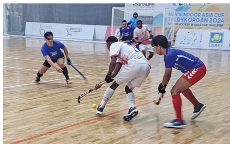
■ من لقاء المنتخب مع سنغافورة

استغل منتخبنا الوطني وصوله الباكر الى مدينة البطولة بالاستفادة من خوض مباراة ودية امام منتخب سنغافورة وذلك قبل الحصص التدريبية الاولى للمنتخب حيث تم التنسيق الباكر مع المنتخب السنغافوري من اجل هذا اللقاء الودي والذي انتهى بنتيجة ٣/٠ صفر لصالح المنتخب الوطني وقدم خلالها لاعبونا المستوى المطلوب منهم في ذلك اللقاء حيث عمل الجهاز الفني على اشراك اغلب اللاعبين عبر شواط واحد استمر لمدة خمس عشرة دقيقة.