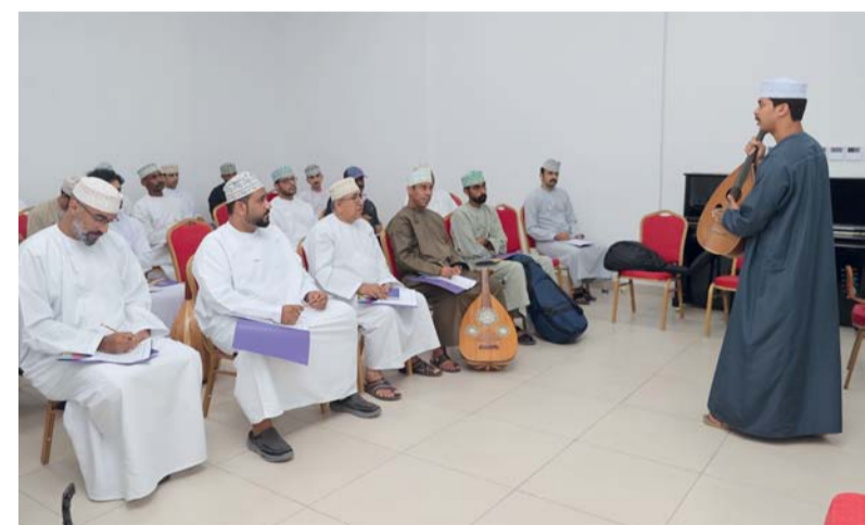
الدورة التدريبية تهدف إلى استقطاب المواهب الفنية في مجال الموسيقى

احتفل عُمان عبر الزمان بولاية منح يوم أمس باليوم العالمي للمتاحف الذي يصادف ١٨ من مايو وذلك تحت رعاية سعادة الشيخ الدكتور فيصل بن علي الزبيدي والي منح بحضور عدد من المدعوين. وألقى المهندس اليقظان بن عبدالله الصارثي مدير عام متحف عُمان عبر الزمان كلمة جاء فيها: تبرز المتاحف كمحطات مهمة، تحتضن في مساحتها قصصاً وأسراراً تاريخية، ومعارف غنية، تُثري حصيلة الزائر، بأحدث الأساليب والتقنيات، ومن مُنطلق زيادة الوعي بأهمية المتاحف وأوارها والتي تتجلى في التبادل الثقافي والتفاهم والتعاون والسلام بين الشعوب، يهدف متحف عُمان عبر الزمان إلى خلق بيئة ثقافية تعليمية بحثية تواكب رؤية عُمان ٢٠٤٠ باستخدام تقنيات حديثة تُقدم للزائر تجربة فريدة من التعلم والتفسير المتحفي لتاريخ عُمان من خلال ما يربو على ١٣٠٠ مقتنى. وسعيًا من