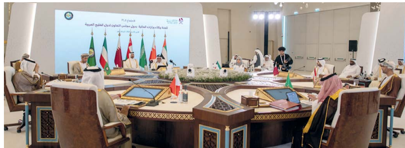
الاجتماع استعرض مستجدات موقف اتفاقية نظام ربط المدفوعات بين دول المجلس.

مستجدات دراسات ومشروعات الوحدة الاقتصادية بين دول مجلس التعاون بحلول عام ٢٠٢٥م، بالإضافة إلى متابعة