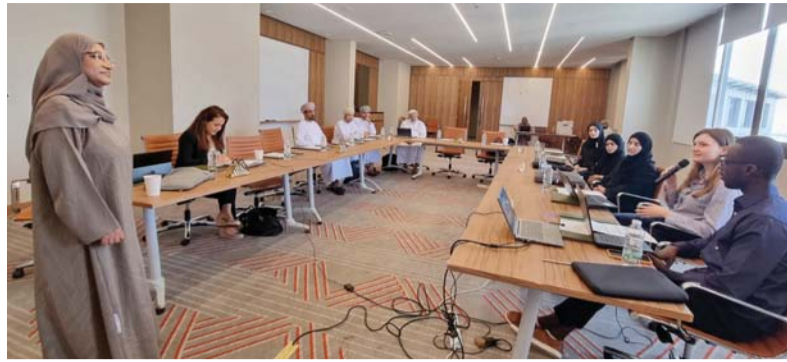
الحلقة تهدف إلى تعزيز التأهب والاستجابة في مجال الصحة العامة