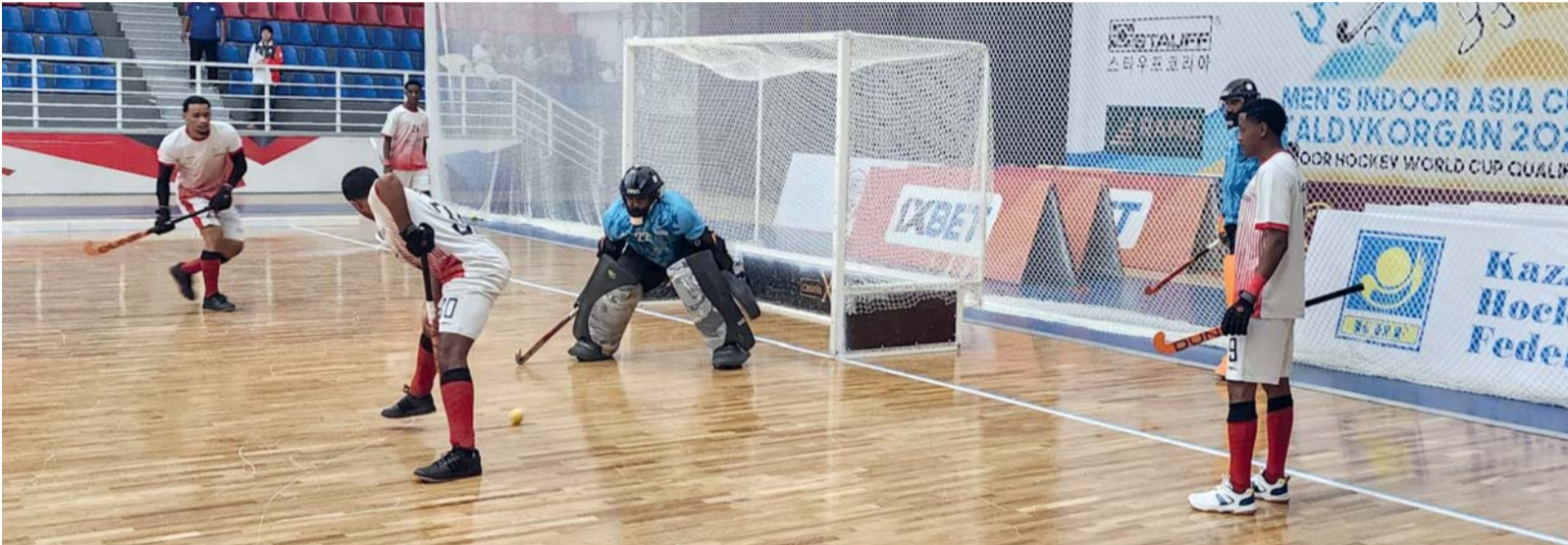
■ من الحصص التدريبية للمنتخب