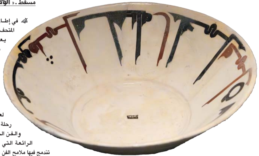
الوعاء يزينان ببعض الحكم والأمثال العربية

في إطار التعاون الثقافي القائم بين المتحف الوطني ومتحف اللوفر أبوظبي، يعرض المتحف الوطني قطعتين مُميزتين من مجموعة اللوفر أبوظبي لمدة عام واحد، وهما عبارة عن (وعاء منقوش بلونين مختلفين) يزينان بجمال الخط العربي، و لوحة فنية رمزية (الولاء للمربع) تعكس الفن التجريدي المعاصر، وهو ما يتيح لعموم الزوار فرصة الانطلاق في رحلة استكشافية في عالم الفن الإسلامي والفن الحديث، والتأمل في الإبداعات الرائعة التي تجسدها هذه القطع الفنية التي تندمج فيها ملامح الفن والثقافة والتاريخ. يعرض الوعاء المنقوش بلونين مختلفين في قاعة (عظمة الإسلام)، ويعود