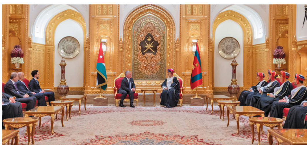
الزيارة حافز مهم لرفع مستوى التعاون بين البلدين في مختلف المجالات خصوصاً الجوانب الاقتصادية

ويشمل التعاون الثقافي بين البلدين الشقيقين عدّة جوانب أهمها المشاركة في الفعاليات الثقافية وتبادل الخبرات في كلا البلدين والمشاركة في المهرجانات الفكرية الأدبية بين الكتاب والأدباء العمانيين والأردنيين حيث يحرض الجانبان على المشاركة في معارض الكتاب الدولية التي تنظم في مسقط وعمان. ويقدّر عدد الطلبة العمانيين الدارسين بالجامعات الأردنية حتى مطلع العام الحالي ٢٣٧١ طالباً وطالبة.