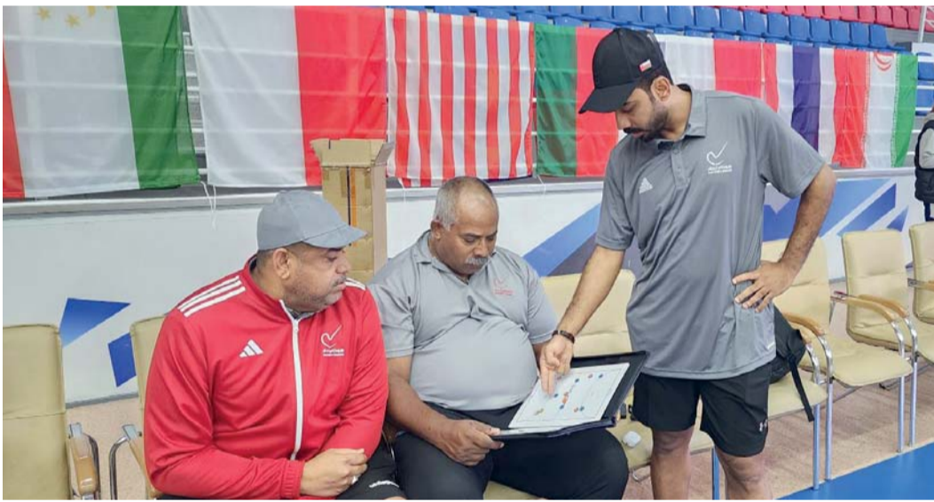
■ مشاورات بين أعضاء الجهاز الفني للمنتخب

والمنافسة على بطاقة التأهل الى النهائيات حيث أشار الى ان المنتخب لديه الإمكانيات الفنية الجيدة والتي تؤهله للمنافسة في هذه البطولة وذلك بعد الخبرة الجيدة التي اكتسبها اللاعبون من المشاركة الأخيرة في نهائيات كأس العالم لخماسيات الهوكي والتي أقيمت بمسقط.