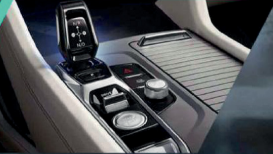
5 أوضاع للقيادة اقتصادي | رياضي | مريح الطرق الوعرة | فردي