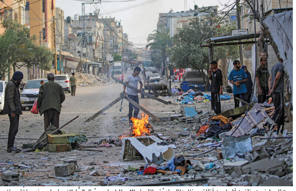
فلسطينيون ينقذون أشياء من أنقاض منزل عائلتي تعرض للقصف الإسرائيلي في حي تل السلطان برفح في جنوب غزة.

قالت وزارة الصحة الفلسطينية بقطاع غزة إن الاحتلال الإسرائيلي ارتكب (١٠) مجازر ضد العائلات في القطاع وصل منها للمستشفيات (١٠٦) شهداء و(١٧٦) مصاباً خلال (٢٤) ساعة، فيما ارتفعت حصيلة العدوان الإسرائيلي إلى (٣٥٥٦٢) شهيداً و(٧٩٦٥٢) مصاباً منذ السابع من أكتوبر الماضي. وواصلت الطائرات الإسرائيلية قصفها لمختلف مناطق قطاع غزة في اليوم (٢٢٧) من الحرب مخلفة العشرات من الشهداء والجرحى. ونفذت المقاومة الفلسطينية المزيد من العمليات ضد قوات الاحتلال في مخيم جباليا وشرق رفح، وسط اشتباكات ضارية مستمرة بهذين المحورين. يأتي ذلك فيما طلب المدعي العام للمحكمة الجنائية الدولية كريم خان في لاهاي أمس استصدار مذكرات توقيف ضد رئيس الوزراء الإسرائيلي بنيامين نتنياهو ووزير جيشه يوآف جالانت، وكذلك ضد قادة في حركة حماس في مساواة بين الضحية والجلاد.