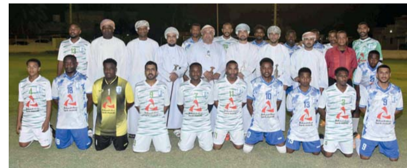
صورة جماعية لاعبي فريق الهرم