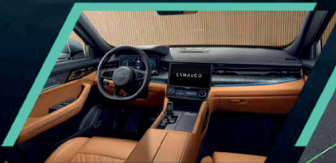
مقصورة من الدرجة الأولى تصميمات داخلية فاخرة