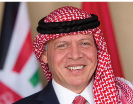
الزيارة تجسيدا للاستمرارية في التعاون والعلاقات الدبلوماسية الوثيقة بين البلدين وتشكل فرصة لاستكشاف مجالات جديدة.

مسقط. العُمانية: يقوم حضرة صاحب الجلالة السلطان هيثم بن طارق المعظم. حفظه الله وراعاه. بزيارة «دولة» إلى المملكة الأردنية الهاشمية يوم غد الأربعاء. جاء ذلك في بيان صادر عن ديوان البلاط السلطاني فيما يأتي نصه: «تأكيداً على أواصر الإخاء المتبادل والعلاقات المتجدرة القائمة بين سلطنة عُمان والمملكة الأردنية الهاشمية الشقيقة وترجمة لحرص قيادتيهما الحكيمتين على توطيدها وتعزيزها، والسعي إلى الارتقاء بها لتحقيق الأهداف المرسومة والغايات السامية للبلدين، سيقوم بمشيشة الله تعالى وتوفيقه حضرة صاحب الجلالة السلطان هيثم بن طارق المعظم. حفظه الله وراعاه. بزيارة دولة