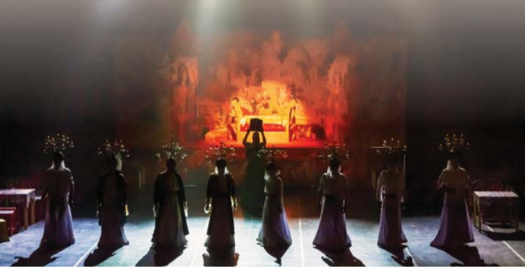
العرض يحتفي بأشهر القصص الخالدة في ذاكرة السرد العربي

حضور دار الأوبرا السلطانية مسقط سوف يحلقون في عوالم (ألف ليلة وليلة) عبر هذا العرض النابض بالحياة والذي يحتفي بأشهر القصص الخالدة في ذاكرة السرد العربي.