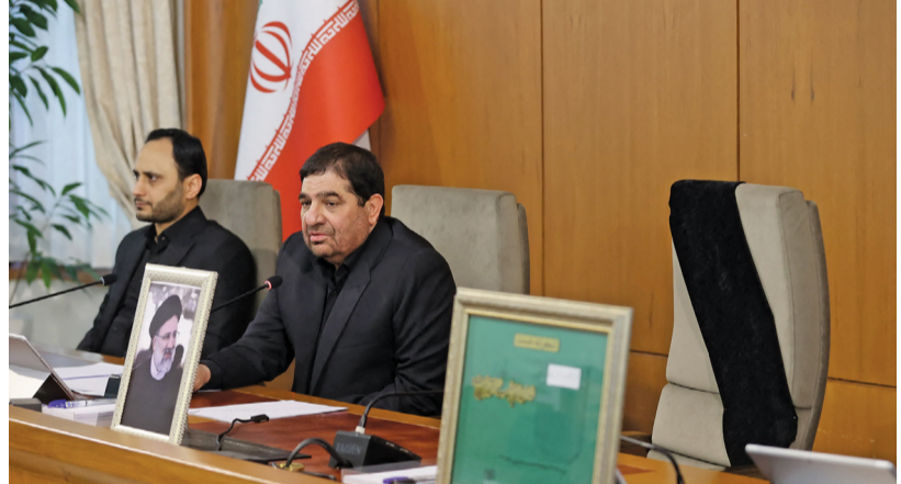
النائب الأول للرئيس الإيراني محمد مخبر يخاطب مجلس الوزراء إلى جانبه مقعد الرئيس الراحل إبراهيم رئيسي فارغاً.

محمد مخبر يتولى مهام الرئاسة في إيران مسقط. العُمانية: قال المتحدث باسم مجلس صيانة الدستور الإيراني هادي طحنان نظيف إن النائب الأول للرئيس الإيراني محمد مخبر، سيتولى مهام الرئاسة بعد موافقة القائد الأعلى، وسيتم اتخاذ الترتيبات اللازمة لانتخاب الرئيس خلال (٥٠) يوماً. وأضاف المتحدث أن الدستور نص على مثل هذه الحالات، فبعد موافقة المرشد الأعلى، سيتولى النائب الأول للرئيس صلاحيات الحكومة. ووضح أنه سيتم تشكيل مجلس من رئيس مجلس الشورى الإسلامي ورئيس السلطة القضائية وغيرهم من المسؤولين.