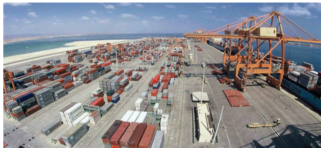
زيادة في حجم التبادل التجاري مسجلاً ٧٤,٥ مليون ريال بنهاية ٢٠٢٣

إلى وقف العدوان الإسرائيلي على قطاع غزة، وإيصال المساعدات الإنسانية بشكل فوري وكاف إلى جميع أنحاء القطاع وضرورة استمرار التنسيق والتشاور حول سبل وقف الأوضاع الكارثية في غزة، والتوصل لوقف دائم وفوري لإطلاق النار. وذكر سعادته أن هناك توافراً مستمراً عبر إطار سلسلة من اللقاءات التي تهدف إلى تعزيز العلاقات التجارية والاقتصادية بين البلدين الشقيقين وإيجاد فرص وشركات استثمارية، خصوصاً أن هذه العلاقات باتت تشهد حراكاً واسعاً وزخماً أكبر بعد لقاء القائدين في عام ٢٠٢٢ الذي تم على إثره تشكيل فريق عمل أردني عماني مشترك لمناقشة وبحث فرص الاستثمار والتعاون الاقتصادي بين البلدين.