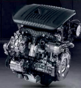
MHEV محرك E 2.0TD T5 توربو