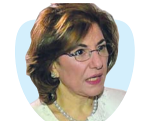
أ.د. بثينة شعبان كاتبة سورية