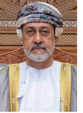
جلالة السلطان هيثم بن طارق - حفظه الله وراعاه -

لقد عرف العالم عمان عبر تاريخها العريق والمشرف، كياناً حضارياً فاعلاً، ومؤثراً في نماء المنطقة وأزدهارها، واستتباب الأمن والسلام فيها، تتناوب الأجيال، على إعلاء رايها، وتحرض على أن تظل رسالة إرثا عظيماً، وغايات سامية، تبني ولا تهدم، وتقرب ولا تباعد، وهذا ما سنحرص على استمراره، معكم وبكم، لنؤدي جميعاً بكل عزم وإصرار دورنا الحضاري وأمانتنا التاريخية.