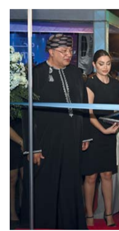
جيلي تفتتح صالة عرض حديثة في الحيل

وحصل على جائزة خاصة كما تم تهيئة المشترين الأوائل لسيارة جيلي بريفيس مما يمثل بداية رحلتهم مع هذه السيارة الرائعة. وأعرب المتحدث باسم مركز تاول للسيارات عن حماسه قائلاً: سعداء للغاية بتقديم جيلي بريفيس الجديدة للمستهلكين الطموحين في سلطنة عمان حيث تجسد سيارة السيدان هذه مزيجاً مثالياً من الأناقة والقوة والميزات التكنولوجية والسلامة والراحة، مما يعكس تفاني جيلي في الابتكار والجودة ورضا العملاء ونحن على ثقة من أن بريفيس سوف تتجاوز توقعات عملائنا كما تهدف صالة العرض الخاصة بنا إلى توفير بيئة ترحيبية حيث يمكن للعملاء استكشاف أحدث عروضنا بشكل مريح.