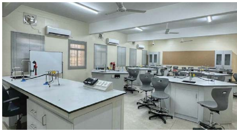
المشروع يتكون من ٤٠ فصلاً دراسياً ومكاتب إدارية ومختبرات

عملية الاستلام للمشروع سبقها الدراسية والمرافق الإدارية من مطابقتها للمواصفات والوقوف على كافة الفصول التي يتكون منها المبنى والتأكد المعتمدة من المديرية العامة