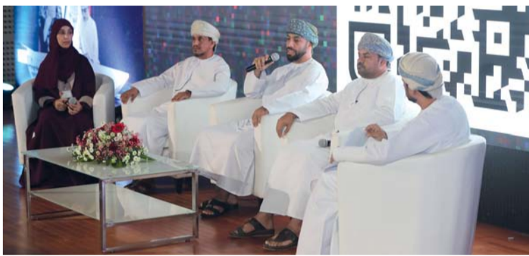
الحفل صاحبه جلسات حوارية وحلقات متنوعة

كما تضمنت الحفل جلسة حوارية حول دور المتاحف في التعليم والبحث العلمي بمشاركة متخصصين في الشأن المتحف من جامعة العلوم التطبيقية والتقنية ومن متحف عُمان عبر الزمان ومن وزارة التربية والتعليم ومتحف بيت الزبير بالإضافة إلى إقامة مجموعة من الحلقات منها حلقة (في ترميم المقتنيات الخشبية) قدمت فيها أساسيات صون وترميم اللقى المصنوعة من الأخشاب حيث صاحب الحلقة تطبيقاً عملياً وورشته أخرى حول (الباحث العلمي) وهي عبارة عن مسابقة يتم