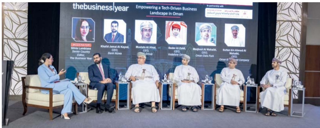
أوراق العمل ناقشت تمكين الأعمال القائمة على التكنولوجيا

كتبت: عبدالله الشريقي: سجلت عمانتل خلال الربع الأول من العام الجاري إيرادات بلغت نحو ٧٢٨,١ مليون ريال عماني، لتحقيق صافي ربح بحوالي ٤٠,٦ مليون ريال عماني، وتجاوزت قيمة العقود المسندة للشركات المحلية ٤٩,٥ مليون ريال عماني منها ٥,٧ مليون ريال عماني مبالغ لأعمال المسندة للمؤسسات الصغيرة والمتوسطة حتى نهاية عام ٢٠٢٣م واستفادت منها ٥١ مؤسسة. كما بلغت نسبة تغطية شبكة الجيل الخامس في المناطق المأهولة بالسكان بلغت ٩٢ بالمائة، ونسبة رضا المجتمع على الخدمات التي تقدمها الشركة وصلت إلى ٧٥ بالمائة، جاء ذلك خلال اللقاء الإعلامي الذي نظّمته الشركة أمس في مقرها الرئيسي بمدينة العرفان.