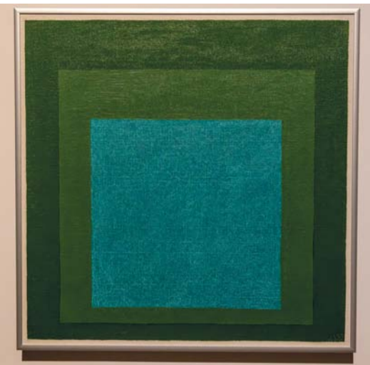
«الولاء للمربع»، لوحة فنية تعكس الفن التجريدي المعاصر

عميق لتكون أشبه بدراسة محورية في تفاعلات الألوان وتفاوت درجاتها. كما أن منهجية ألبير، لا سيما من خلال سلسلة المربعات التي أبدعها وكتابه المؤثر (تفاعل اللون)، تسلط الضوء على إسهامه في الفن التجريدي كلفة عالمية تعيد تعريف العلاقات الفنية بالواقع الملموس وسط معتكك التحديات التي شهدها القرن العشرون.