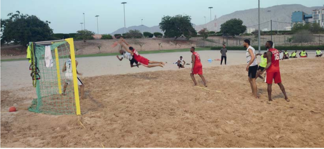
من المباراة الودية بين منتخبنا والعروبة