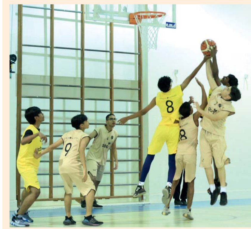
صورة أرشيفية من منافسات بطولة كرة السلة