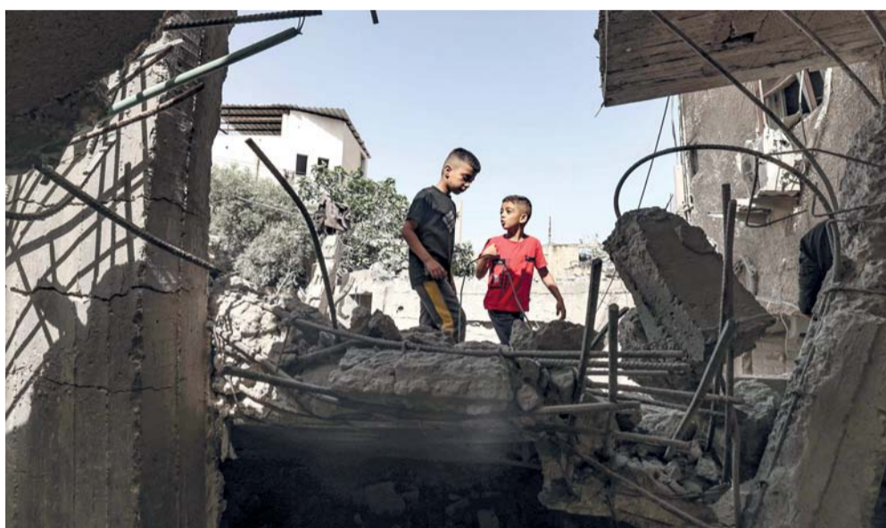
أطفال فلسطينيون يسرون وسط أنقاض مبنى ضربته غارة إسرائيلية ليلاً في مخيم جنين للاجئين بالضفة الغربية المحتلة.