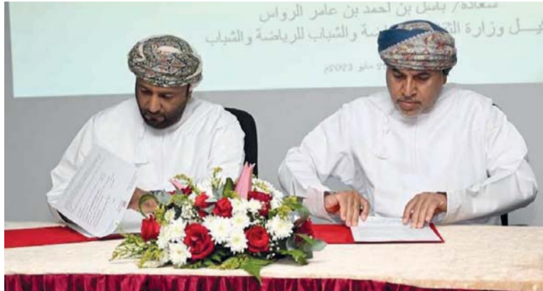
صورة أرشيفية من توقيع اتفاقية بين اتحاد الطائرة والأندية لمراكز إعداد الرياضيين

أوقفت وزارة الثقافة والرياضة والشباب بشكل رسمي مراكز إعداد الرياضيين بالاتحاد العماني لكرة الطائرة في سابقة جديدة وبعد قرابة عام من توقيع الاتفاقية وهو المشروع الذي أطلقته الوزارة من أجل دعم الرياضيين في مختلف الألعاب والمسابقات للأندية بهدف تعزيز الرياضيين والاستفادة منهم للمستقبل ورفد المنتخبات الوطنية بتلك الكوادر التي ستكون