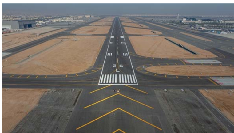
المرج يساهم في تعدد مسارات الإقلاع والهبوط حسب متطلبات لوائح منظمة «الايكاو»

سلطنة عمان تشارك في الاجتماع الـ ٢٢ لوزراء الإسكان بدول المجلس بالدوحة