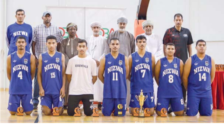
صورة جماعية للاعبين نزوى الحاصل على المركز الثالث