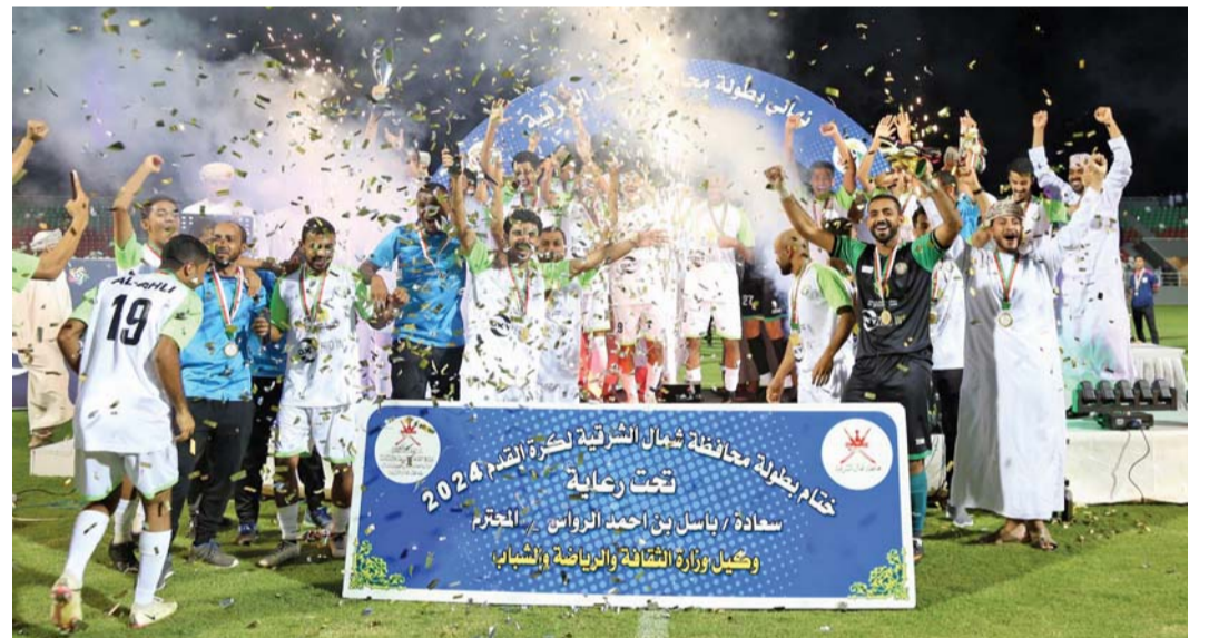
فرحة لاعبي فريق أهلي المضبي المتوج بلقب البطولة

اختتمت بمجمع إبراء الرياضي بطولة محافظة شمال الشرقية لكرة القدم والتي نظمتها مكتب محافظة شمال الشرقية بالشراكة مع عدد من المؤسسات بالقطاع العام والخاص، بتتويج فريق أهلي المضبي بطلا للبطولة بفوزه على فريق نجوم المضبي بركلات الجزاء الترجيحية بعد انتهاء الوقت الأصلي بالتعادل الإيجابي بهدف لكل فريق، جاء ذلك في المباراة النهائية التي أقيمت برعاية سعادة باسل بن أحمد الرواس وكيل وزارة الثقافة والرياضة والشباب وبحضور سعادة محمود بن يحيى الذهلي محافظ شمال الشرقية، وعدد من أصحاب السعادة ولاة المحافظة وأعضاء مجلس الشورى ممثلي ولايات شمال الشرقية، جمع من الحضور وجماهير الفريقين.