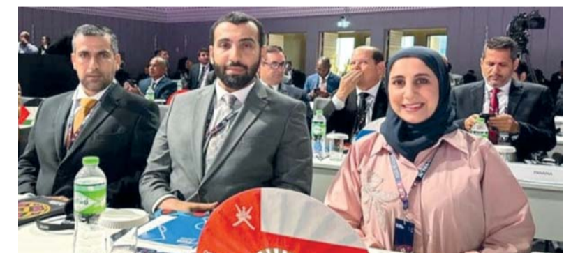
وقد أُنحَد الكرة المشارك في اجتماع الفيفا

بحقوق استضافة كأس العالم لكرة القدم النسائية ٢٠٢٧، بعد حصولها على تأييد الأغلبية من القرارات. وشهدت عمومية الاجتماع الدولي، فوز البرازيل بالأعمال والتصويت على عدد