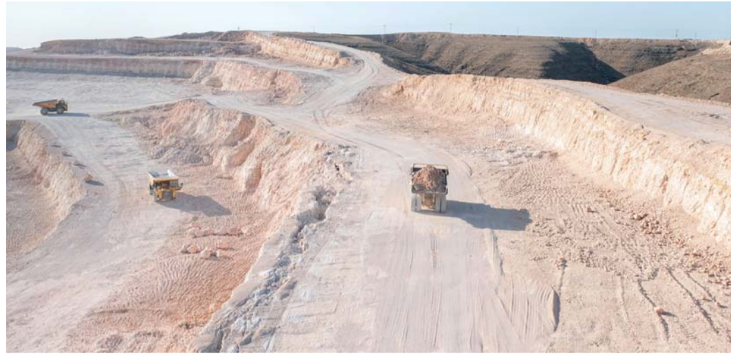
المنتجات المعدنية تستحوذ على القيمة الأعلى من الصادرات السلعية غير النفطية بقيمة ٨٣٩ مليون ريال عماني

مسقط . العمانية: سجل الميزان التجاري لسلطنة عمان بنهاية فبراير الماضي فائضا بلغ مليارا و٦٩٣ مليون ريال عماني مقارنة بالفترتين السابقتين من عام ٢٠٢٣ المسجلة فائضا عند مليار و٣٧٨ مليون ريال عماني، وفق ما بينت الإحصاءات المبدئية الصادرة عن المركز الوطني للإحصاء والمعلومات. وأشارت الإحصاءات إلى أن قيمة الصادرات السلعية بنهاية فبراير الماضي بلغت ٤ مليارات و٤١٤ مليون ريال عماني، مرتفعة بنسبة ١٩,٥ بالمائة عن الفترة نفسها من العام الماضي والبالغة ٣ مليارات و٦٩٥ مليون ريال عماني، في حين بلغت قيمة الواردات السلعية المسجلة لسلطنة عمان مليارين و٧٢١ مليون ريال عماني مرتفعة بنسبة ١٧,٤ بالمائة بنهاية فبراير الماضي مقارنة بالفترتين السابقتين من العام الماضي البالغة مليارين و٣١٧ مليون ريال عماني. ويعزى ارتفاع قيمة الصادرات بشكل رئيسي إلى ارتفاع قيمة صادرات سلطنة عمان من النفط والغاز إلى مليارين و٥٦٦ مليون ريال عماني بنسبة ٧,٢ بالمائة عن نهاية فبراير ٢٠٢٣ والبالغة مليارين و٣٩٤ مليون ريال عماني. ومن ضمن صادرات النفط والغاز بنهاية فبراير الماضي، بلغت قيمة صادرات سلطنة عمان من النفط الخام مليارات و٩٠٥ ملايين ريال عماني، مسجلة ارتفاعا بنسبة ٢١,٥ بالمائة عن الفترة ذاتها من العام الماضي، في حين تراجعت قيمة صادرات النفط المصفى إلى ٢١٠ ملايين ريال عماني وبنسبة ١٩ بالمائة، كما انخفضت قيمة صادرات سلطنة عمان من الغاز الطبيعي المسال إلى ٤٥١ مليون ريال عماني وبنسبة ٢٠,٥ بالمائة، مقارنة بنهاية فبراير ٢٠٢٣.