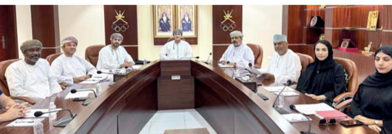
اجتماع مجلس إدارة الاتحاد العماني للجولف

بقيادة صاحب السمو السيد ذي يزن بن هيثم آل سعيد، لإدعمه رياضة الجولف، كما أشاد المجلس ببقاء أعضاء الجمعية العمومية وانتخابهم لقيادة دفة الاتحاد للفترة القادمة على مواصلة العمل لتوطيد العلاقة مع أندية الجولف بسلطنة عمان المساهمة بنشر اللعبة وتوسيع قاعدة الممارسين. وبارك المجلس نتائج المنتخبات السنوية للجولف لهذا العام، والذي حقق المركز الثاني في فئة الشباب تحت ١٨ سنة والتي أقيمت بدولة قطر، وكذلك الحصول على الميدالية الفضية والتي تحققت للمنتخب في دورة الألعاب الخليجية الأولى للشباب والتي أقيمت بدولة الإمارات العربية المتحدة بمدينة أبو ظبي تحت إشراف اللجنة الأولمبية العمانية، والتأكيد على ضرورة الاستفادة والمشاركة في جميع الدورات الرياضية والتي تقام تحت مظلة اللجنة الأولمبية العمانية.