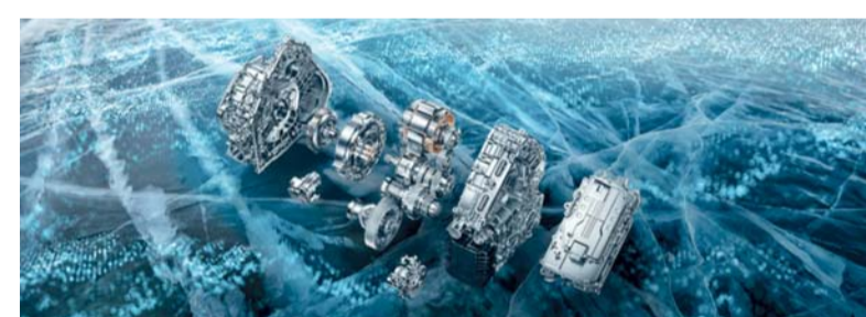
استراتيجية شيري تقدم نظام بيئي جديد