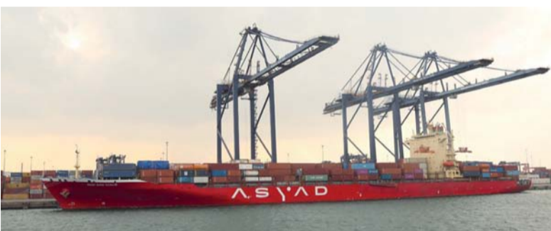
مجموعة أسياد تواصل التأكيد على التزامها بتقديم حلول شحن بحرية مبتكرة

مجموعة أسياد ممثلة في شركة أسياد للنقل البحري مكتباً تجارياً في سنغافورة، في خطوة استراتيجية تعزز من حضورها العالمي وقدرتها التشغيلية في أحد أهم مراكز الشحن العالمية لتقديم حلول شحن بحرية فاعلة لمختلف الشركات العالمية، وربطها مع كبرى