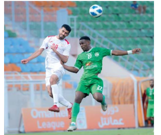
صورة أرشيفية من مباريات دوري عمانتل