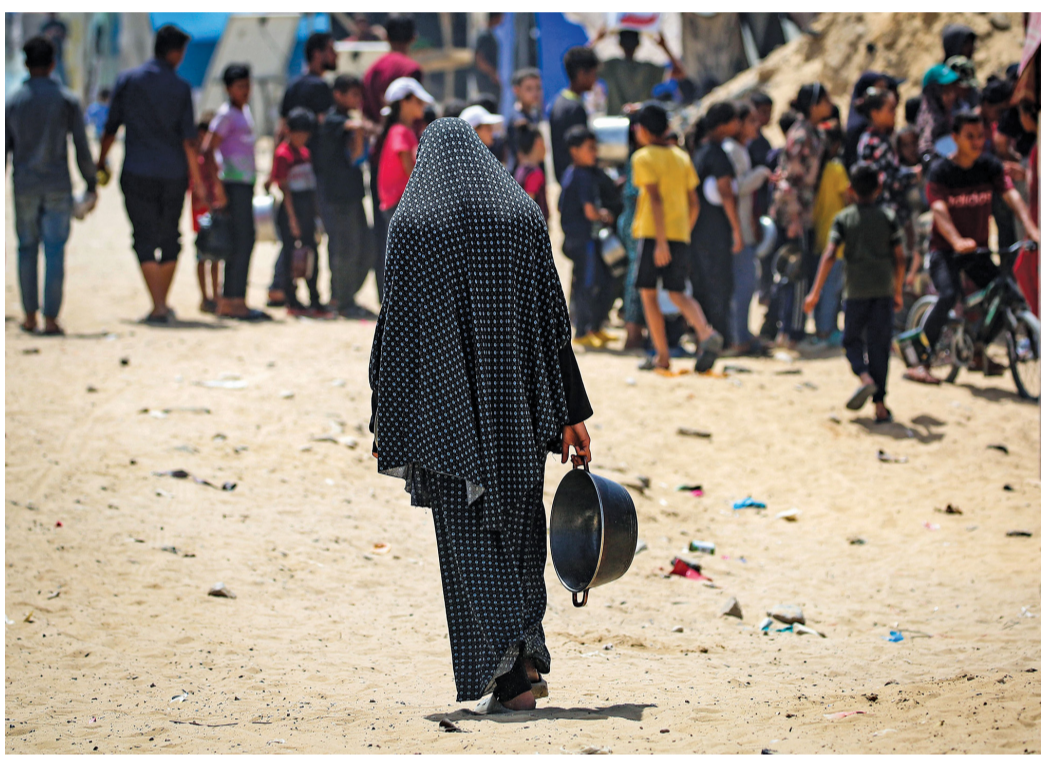
فلسطينية تحمل إناء فارغا وهي تسير نحو نقطة توزيع المواد الغذائية في خان يونس بجنوب قطاع غزة.