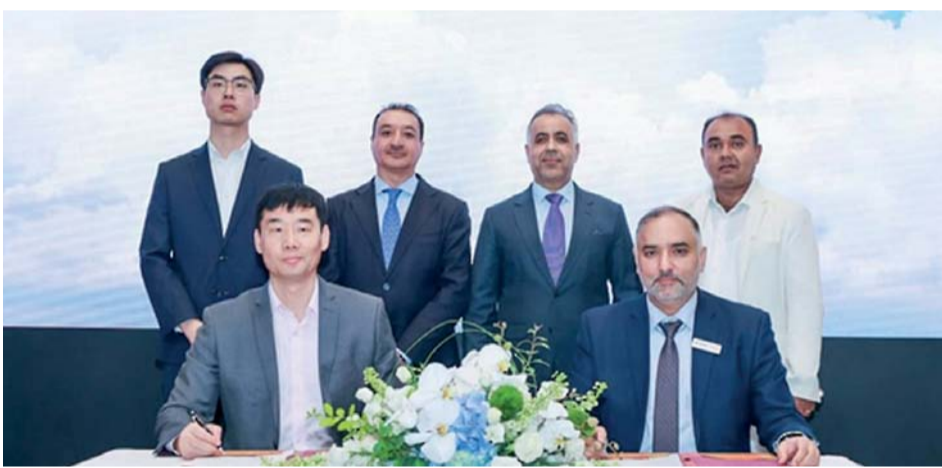
الاتفاقية كجزء من جذب الاستثمارات الأجنبية المباشرة إلى سلطنة عُمان

بالحرارة، والأغلفة البلاستيكية والطلاءات البلاستيكية الواقية للمركبات المعدنية. وأضاف أن هذا المشروع المشترك يعد المصنع العاشر في مجمع لدائن بمدينة صحار الصناعية، ونقله نوعية للمنتج الصناعي في سلطنة عُمان؛ ما سيعزز من سلسلة الإنتاج والإمكانات الصناعية. ويمثل مجمع لدائن لصناعات البوليمر الذي تزيد مساحته عن مليون متر مربع، موقعاً رئيساً لصناعة البوليمر في سلطنة عُمان ويطمح من خلال رؤيته إلى جذب الاستثمارات في قطاعات مختلفة تشمل البناء والتشييد، والرعاية الصحية، والتغليف، واستقطب منذ إنشائه العديد من الاستثمارات، وقد وقع خلال عام ٢٠٢٣ على اتفاقيات لإنشاء ٩ مشروعات بقيمة ٨٨ مليون دولار أميركي.