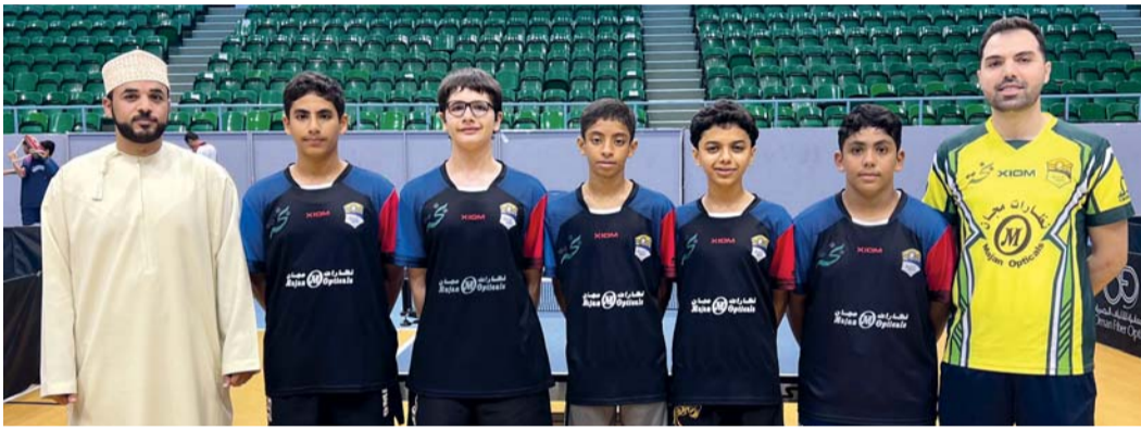
صورة جماعية للاعبين من نادي عبري بطلاً لفئة الفرق

النهائي وتغلب على ناصر البلوشي في دور ربع النهائي وفي الدور الـ ١٦ تاهل بنظام الباي. وعلى مستوى الفرق، توج نادي عبري بلقب البطولة بعد حصوله على ١٠ نقاط من خمسة لقاءات، حيث شارك بالبطولة ستة أندية وهي: عبري- صحم قريات- الرستاق- صلالة. السيب، وقد شهدت المنافسات تنافساً كبيراً بين المشاركين بالبطولة، وفاز لاعبو نادي عبري في كافة المباريات، حيث تغلبوا على نادي صحم بنتيجة ٣-١، وعلى نادي قريات بنتيجة ٣-٠، وعلى نادي السيب بذات النتيجة وكذلك على نادي صلالة والرستاق، وجاء نادي صحم ثانياً برصيد تسع نقاط ونادي صلالة ثالثاً برصيد ثمانية نقاط.