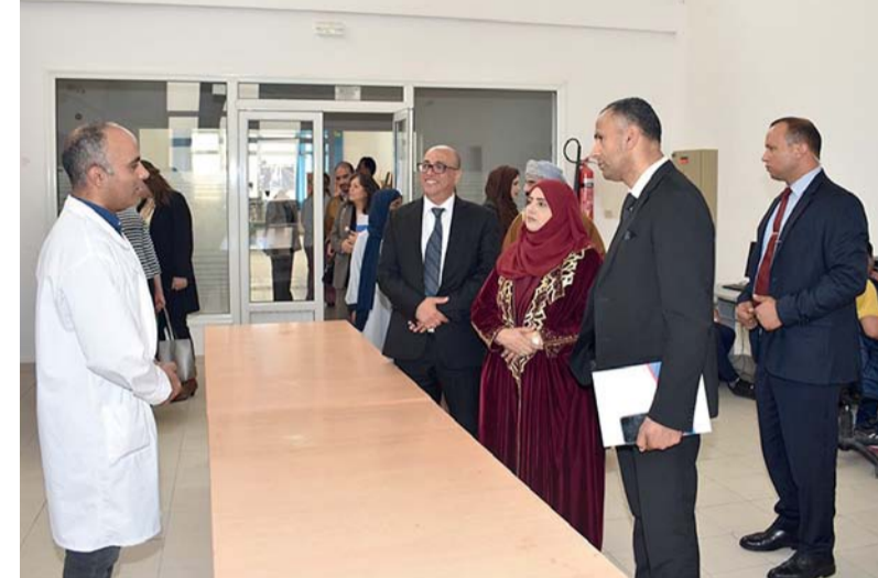
ليلى النجار أثناء زيارتها إحدى المؤسسات

أهالي بركة الموز يطالبون بالإسراع في تنفيذ مشروع النطاق العريض بركة الموز - «الوطن»: يكون هناك تحرك لمعالجة أسباب ومشاكل ضعف شبكة الإنترنت، كان هناك تراجع في مستوى الخدمة، حيث بدت الشبكة في الكثير من الأوقات شبه مشلولة، حتى بالنسبة للمنازل القريبة من أبراج الاتصالات والتي كان يفترض أن تكون الخدمة في أفضل مستوياتها. ومع ما تشهده بركة الموز من حراك عمراني وسكاني وتجاري كبير جداً، واتساع نطاق طالب الخدمة من سكان المنطقة، أو الآلاف من الطلبة سواء طلبة جامعة نزوى الذي يتجاوز عددهم ١٠ آلاف طالب، أو بالنسبة للطلبة الدارسين في الكليات والجامعات الحكومية والخاصة بالمحافظة، ويختون من بركة الموز وفي الوقت الذي كان الجميع ينتظر أن يتمتعوا بالخدمة، وقامت معاليمه بزيارة المركز الدولي للنهوض بالأشخاص ذوي الإعاقة، الذي يُعنى بتنفيذ برامج التربية المختصة الموجهة للأشخاص ذوي الإعاقة غير القادرين على الاندماج المدرسي، والعمل على إنجاز البحوث والدراسات والتوثيق والتكوين في مجال الإعاقة. كما قامت بزيارة مركز البحوث والدراسات والتوثيق والإعلام حول المرأة «الكريديف»، وتعرفت على مهامه في تكريس حقوق النساء ودعم حضورهن في الحياة العامة والسياسية والاقتصادية والاجتماعية والثقافية، وتقديم توصيات لسن القوانين واتخاذ الإجراءات الضرورية للقضاء على جميع أشكال التمييز ضد المرأة، التي يسعى المركز لتحقيقها وسبل تدليل تحدياتها.