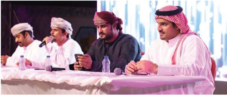
الشعراء المشاركون في الأمسية الشعرية