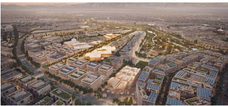
سلطنة عُمان تتميز بقوانين وإجراءات مشجعة للاستثمار

العُمانيّة لتنمية الاستثمارات الوطنية «تنمية»، بدور مدير الاستثمار بالتعاون والشراكة مع «سيكو» البنك الإقليمي المتخصص في مجال إدارة الأصول المصرفية الاستثمارية. ويتزامن إطلاق الصندوق مع التطورات المتتالية التي تشهدها أسواق رأس المال العُمانيّة، بما في ذلك الإعلان عن عدد من الاكتتابات الجديدة، وإصدار لوائح عمليات صناعة السوق. وتكثف بورصة مسقط جهودها التسويقية من خلال الحملات الترويجية الإقليمية وعمليات التطوير التحفيزية والتي شملت تعديلات ملموسة على بعض المتطلبات التنظيمية لأسواق رأس المال خاصة فيما يتعلق بالضرائب على الأرباح الموزعة.