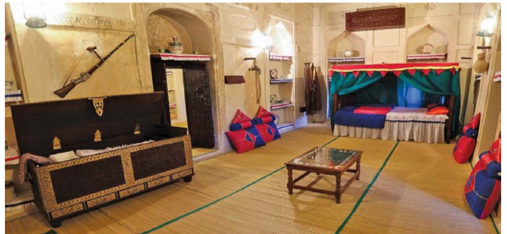
٣٠ متحفا حكوميا وخصوصا في سلطنة عمان حتى نهاية عام ٢٠٢٣ م

احتفلت سلطنة عمان ممثلة بوزارة التراث والسياحة مع نظيراتها من دول العالم امس السبت باليوم العالمي للمتاحف الذي يصادف ١٨ من مايو من كل عام، والذي جاء هذا العام تحت شعار (المتاحف للتعليم والبحث) حيث يسلط الاحتفال هذا العام الضوء على الدور المحوري للمتاحف في التعليم والبحث. ويهدف الاحتفال باليوم العالمي للمتاحف في هذا العام إلى التأكيد على أهمية المتاحف باعتبارها مؤسسات تعليمية ديناميكية تعزز التعلم، والاكتشاف والوعي والفهم الثقافي.