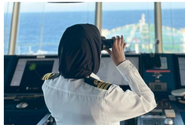
تمكين المرأة العاملة في القطاع البحري بسلطنة عمان أسهم بشكل كبير في الاقتصاد البحري