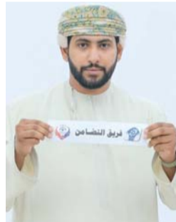
سحب قرعة الفرق المشاركة في دوري الهواة بنادي الشباب

والسلام)، وضمت المجموعة الثانية (الجنيحة والبرامد والحضيب والباسط)، وفي المجموعة الثالثة (الصفاية وشباب الشاطئ والنعمان والسوادي)، وفي المجموعة الرابعة فرق (الاتحاد الشرقي وجبل السوادي والهرم ونجوم الحرادي)، والمجموعة الخامسة (شباب المراع والجزيرة وأفي وحبراء)، أما المجموعة السادسة (القرحة والمريصي واللاجال والشمال)، وتضم المجموعة السابعة (الترحيب وشباب مسلمات وشباب الحفري وسانتوس)، وفي المجموعة الثامنة (شباب قري والمزرع والرميس والتضامن).