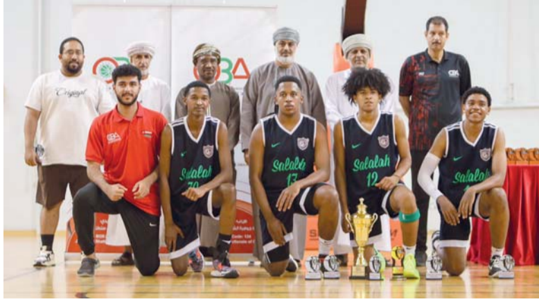
صورة جماعية للاعبين نادي صلالة الحاصل على المركز الثاني