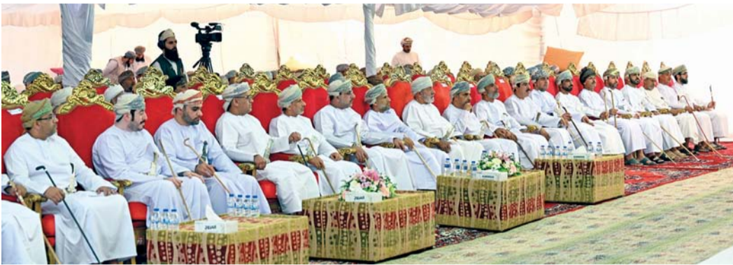
الحضور أثناء افتتاح ممشى زكيت بإزكي

احتفلت قرية زكيت بولاية إزكي بافتتاح مشروع المشى الصحي بجهود أهلية وتمويل من شركة (أوميفكو)، بتكلفة إجمالية بلغت ٣١٧ ألف ريال عماني وبمسافة كيلومتر ونصف. رعى الحفل سعادة الشيخ هلال بن سعيد الحجري محافظ الداخلية وبحضور عدد من أصحاب السعادة.