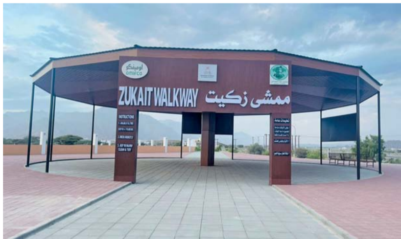
الممشى سيُسهم في حماية البلدة من فيضان الأودية