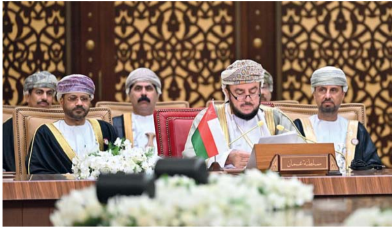
■ أسعد بن طارق لدى ترؤسه وفد سلطنة عُمان في القمة العربية بالبحرين

الأزمة السورية بما يحفظ سيادتها ووحدة أراضيها. افتتح اللواء الركن مطر بن سالم البلوشي قائد الجيش السلطاني العماني عدداً من المنشآت والمباني العسكرية بقطاع مسندم في محافظة مسندم؛ مواكبة لمسيرة التطوير والتحديث المستمر، ولتسخير كافة الإمكانيات والمقدرات بما يضمن إدامة وتعزيز المستويات العالية لدى منتسبي الجيش السلطاني العماني.