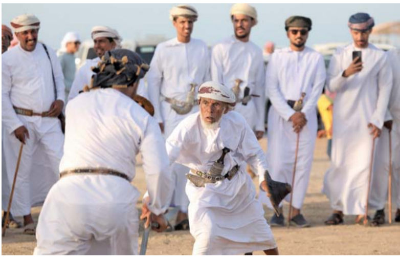
فقرات تنوعت بين عراقة الماضي وجمالية الحاضر