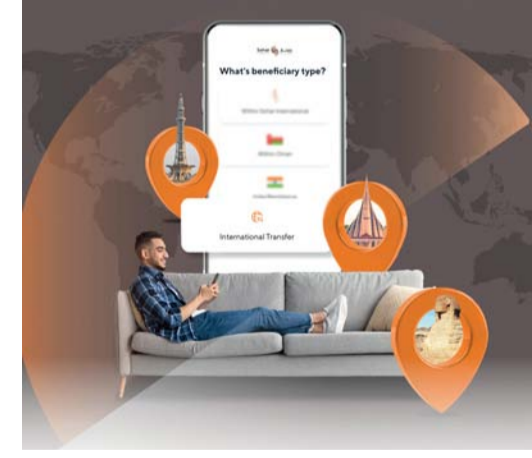
زبائن صحار الدولي يمكنهم تحويل الأموال بشكل فوري عبر الهواتف الذكية