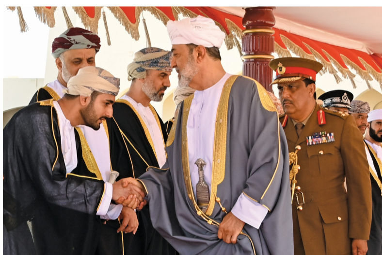
■ جلالة صافح ذي يزن بن هيثم آل سعيد

للقضاء، ومعالى نصر بن حمود الكندي أمين عام شؤون البلاط السلطاني، ومعالى الدكتورة مديحة بنت أحمد الشيبانية وزيرة التربية والتعليم، ومعالى الفضل بن أحمد الحارثي أمين عام مجلس الوزراء، ومعالى الفريق حسن بن محسن الشريقي المفتش العام للشرطة والجمارك، ومعالى الفريق سعيد بن علي الهاللي رئيس جهاز الأمن الداخلي، ومعالى الدكتور محمد بن سعيد المعمرى وزير الأوقاف والشؤون الدينية، ومعالى الدكتور هلال بن علي السبتي وزير الصحة، والفريق الركن بحري عبدالله بن خميس الرئيسي رئيس أركان قوات السلطان المسلحة، واللواء ركن مطر بن سالم البلوشي قائد الجيش السلطاني العُماني، واللواء ركن طيار خميس بن حماد الغافري قائد سلاح الجو السلطاني العُماني، واللواء ركن بحري سيف بن ناصر الرحبي قائد البحرية السلطانية العُماني، واللواء الركن مسلم بن محمد بن تمان جعيب قائد قوة السلطان الخاصة.