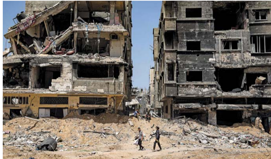
دمار واسع خلفه العدوان الإسرائيلي في خان يونس.