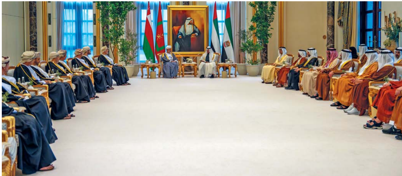
جلالة السلطان ورئيس الإمارات أثناء جلسة المباحثات الرسمية الموسعة في قصر الوطن بالعاصمة أبوظبي