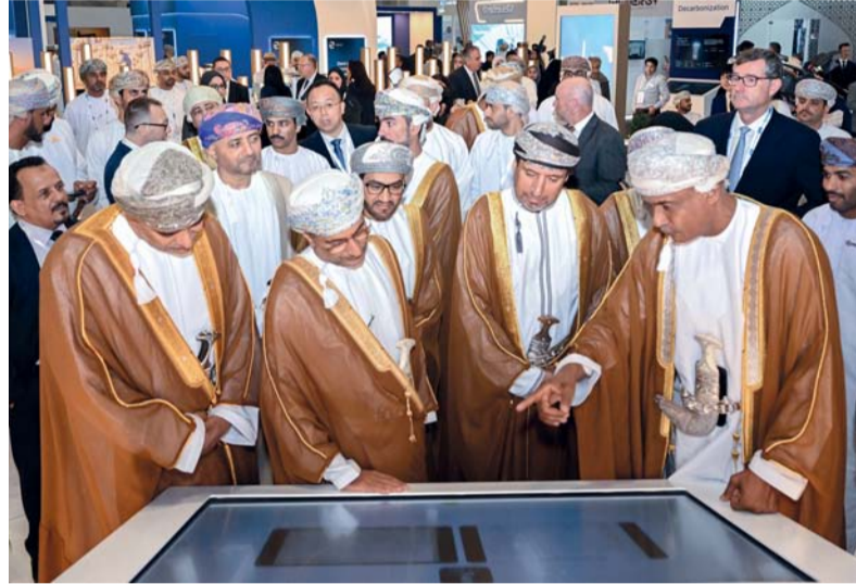
أكثر من ٣٠٠ شركة مشاركة تستعرض أحدث ما توصلت إليه الابتكارات في قطاع النفط والطاقة المتجددة

وتتضمن أعمال المؤتمر، مؤتمر جمعية مهندسي البترول الذي يُركّز على موضوع «الطاقة الميسرة والمستدامة والنظيفة»، ويهدف إلى تعزيز المناقشات حول أحدث الابتكارات والتكنولوجيا وأفضل الممارسات في الصناعة التي تعزز الانتقال العالمي للطاقة، كما يشهد المعرض جلسات عامة وجلسات اللجان، وجلسات تقديم عروض معرفية عبر اللوائح والمنشورات التثقيفية التي تعزز تبادل المعرفة، وجلسات عرض لمشروعات رائدة.