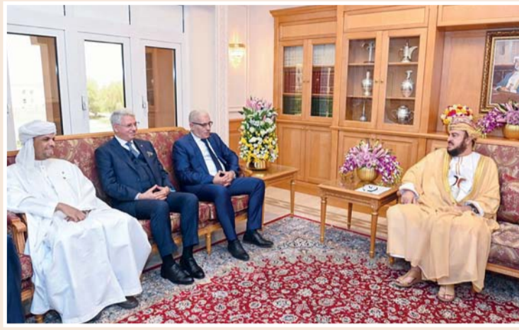
أسعد بن طارق أثناء استقبله إبراهيم بوغالي