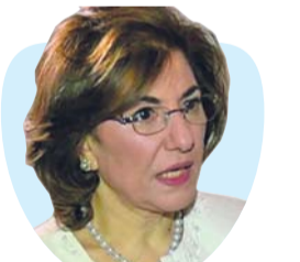
أ. د. بثينة شعبان

إن فلسطين تقدّم فرصة للعرفين والمؤمنين بخلص البشرية من هذا الخطر الصهيوني الإرهابي المحقق بأجيال أبائنا وأحفادنا كلها جميعاً، والعمل اليوم والتنسيق الجاد والحقيقي ضد الخطر الصهيوني الغربي هو مسؤولية إنسانية في أعلى أولويات البشر على هذا الكوكب.