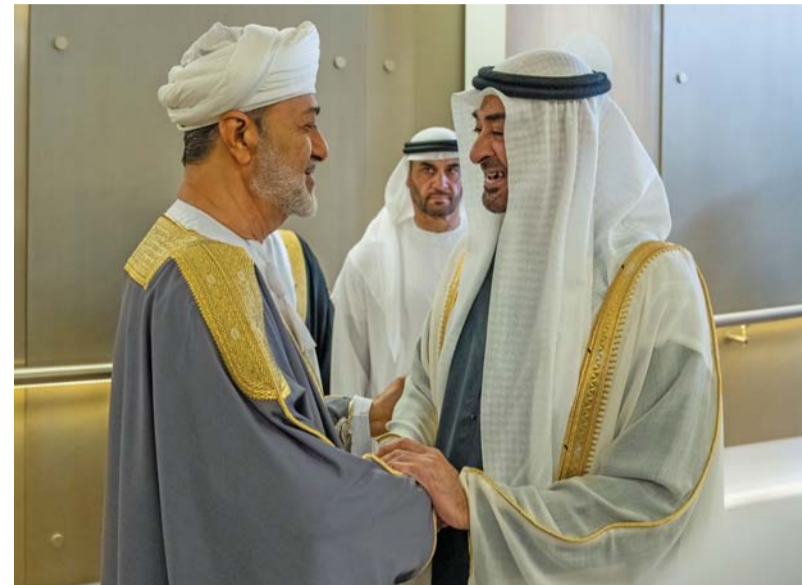
جلالة السلطان لدى وصوله أبوظبي وفي مقدمة مستقبليه رئيس الإمارات

الإعلان عن عدد من مذكرات التفاهم في مجالات الاستثمار والطاقة المتجددة والاستدامة إضافة إلى السكك الحديدية والتكنولوجيا والتعليم