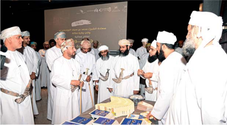
المعرض يلقي الضوء على الهوية والحضارة الإسلامية العُمانية