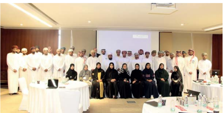
صورة جماعية للجانبين العماني والسعودي أثناء لقاء الأوس

بعد ذلك بزيارة لصالة استثمر في عمان؛ وسيشمل البرنامج اليوم «الثلاثاء» زيارة ميناء صحار والمدينة اللوجستية بصحار.