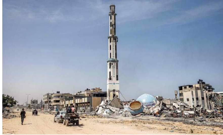
مركبات تمر بجوار المذئنة السليمة وأطلال مسجد الشهداء المدمر في خان يونس جنوب قطاع غزة.