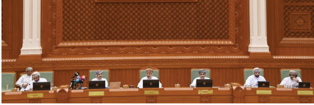
وزير الإعلام أثناء إلقاء بيان الوزارة

وتفرُّده اللافت في النأي بنفسه عن خطابات التطرف والغلو، مُشيراً إلى أنه لا يمكن تجاوز دور الخطاب الإعلامي في صناعة هذه الشخصية العمانية، وتمهيد مساراتها نحو المستقبل عبر تعزيز الخطاب المتزن، وتقدير كل الأفكار والآراء دون تطرف أو شطط في الفكر أو في القول، وهذه هي سمة الوحدة الوطنية لنسج هذا المجتمع، حيث كان للرسالة الإعلامية دور أساسي في تجسيدها، وتقوية دعائمها الفضلى.