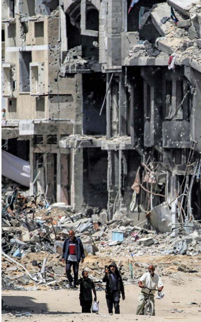
فلسطينيون يسرون وسط المباني المدمرة في خان يونس جنوب قطاع غزة.

مدريد . ا.ف.ب: حقق الحزب الانفصالي الباسكي «إيوسكال هيريا بيلدو» الذي يعدّ وريث الجناح السياسي لمنظمة إيتا، اختراقاً انتخابياً تاريخياً في الانتخابات التي جرت الأحد في منطقة الباسك بشمال إسبانيا. وصار هذا الحزب يشغل ٢٧ مقعداً، مقابل ٢١ من قبل، من أصل ٧٥ في برلمان المنطقة، أي أنه بات ممثلاً بعدد من النواب مساو لعدد نواب «الحزب القومي الباسكي» المحافظ الذي يهيمن على الحياة السياسية في المنطقة منذ عقود. لكن «الحزب القومي الباسكي» الذي خسر أربعة مقاعد وحصد أكثر من ثلاثين ألف صوت إضافية، سيحتفظ مبدئياً بالسلطة في هذه المنطقة الصناعية الغنية، التي يسكنها ٢.٢ مليون نسمة وتتمتع بإمكانات هائلة (الصحة، التعليم، الشرطة، السجون. ويتوقع محللون أن يبقى في السلطة الائتلاف الحاكم في المنطقة الذي يضم الحزب القومي الباسكي والإشتراكيين بزعامة رئيس الوزراء الإسباني بيدرو سانشيز الذي حلّ في المرتبة الثالثة في التصويت. وأعلن رئيس الحزب أندوني أورثوزار أن «الحزب القومي الباسكي فاز في الانتخابات»، وبالتالي «ستولي مسؤولية تشكيل الحكومة الإقليمية».