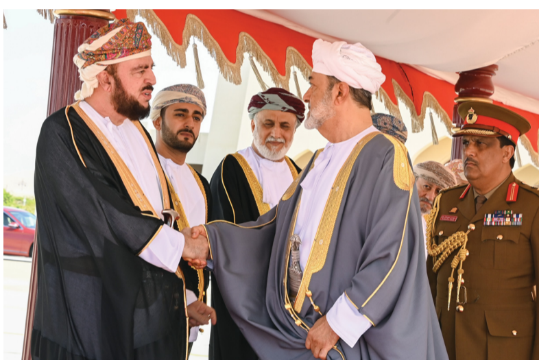
■ جلالة السلطان لدى مغادرته أمس البلاد وفي مقدمة مودعيه أسعد بن طارق