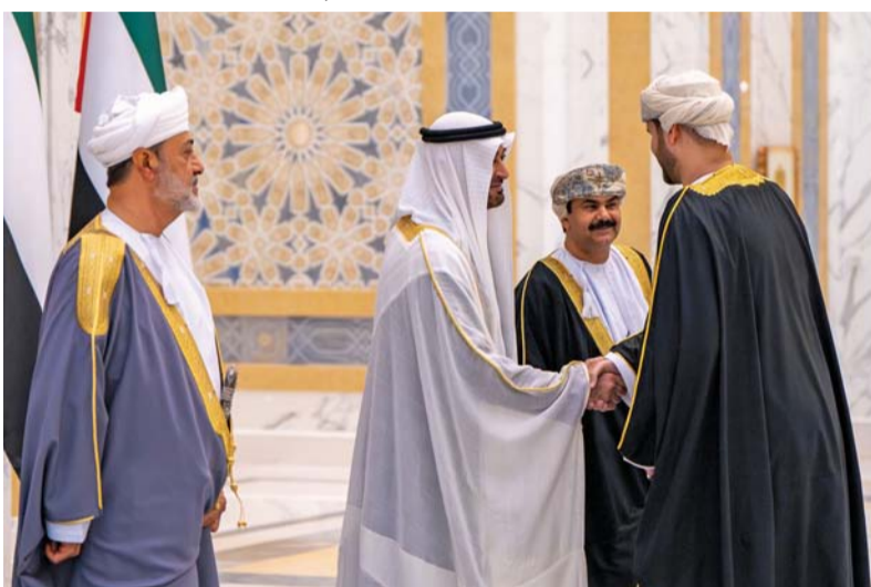
رئيس الإمارات يصافح الوفد الرسمي المرافق لجلالة السلطان