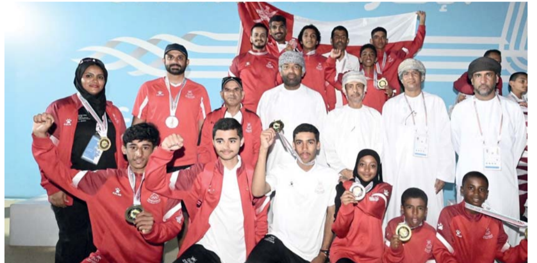
فرحة البحارة و البعثة بالميداليات