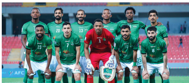
■ فريق النهضة

وأن المباراة تعد مهمة وطنية يدخلها ممثل الوطن والتي ستخدم الكرة العمانية في قادم الوقت إن تمكن النهضة من تحقيق إنجاز السيب، وبعقدي أن الدخول المجاني الذي أكدته إدارة النهضة هو بمثابة دعوة مفتوحة للجماهير العمانية التي يجب أن تحضر اليوم رفقة وابط الأندية وبشكل تحفيزي موحد واضعين نصب أعينهم خدمة الكرة العمانية والمساهمة في إنجاز جديد لها.