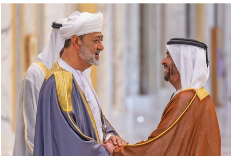
جلالته يصافح كبار مستقبليه

كما نشيد بالتزام المسؤولين في البلدين لتحقيق رؤيتنا المشتركة على أرض الواقع من خلال البدء في تنفيذ مشاريع استثمارية مشتركة في قطاعات استراتيجية، وخاصة في قطاع الطاقة المتجددة والصناعات المرتبطة بها، وكذلك تدشين مشروع سكك الحديد لربط سلطنة عُمان بشبكة قطارات الإمارات، والربط الكهربائي وغيرها من المشاريع.