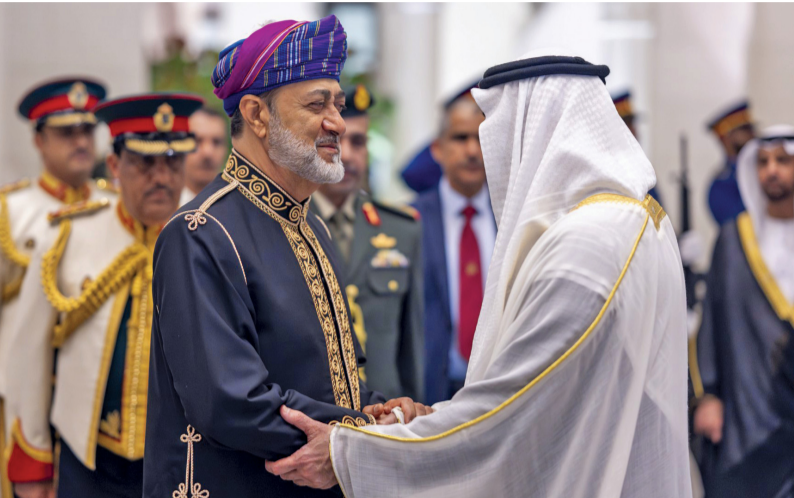
■ جلالة السلطان ورئيس الإمارات العربية المتحدة يتبادلان الترحيب والحديث الأخوي أثناء مأدبة العشاء الرسمية بقصر الوطن