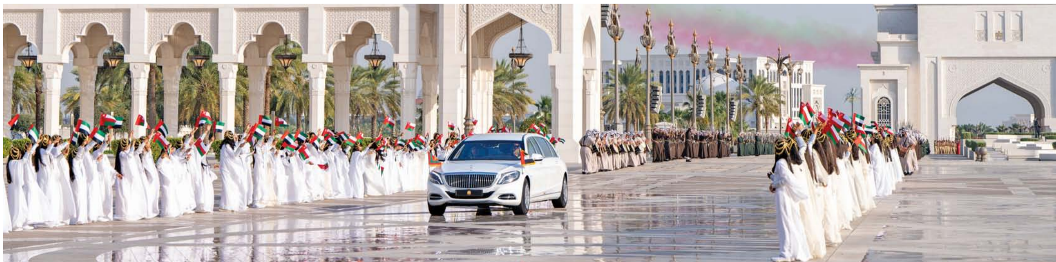
مراسم استقبال رسمية وشعبية ترحيباً بجلالة السلطان