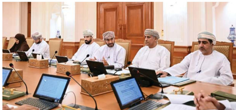
أثناء اجتماع أعضاء مكتب المجلس

استعرض أمس مكتب مجلس الشورى طلب المناقشة المقدم من أصحاب السعادة أعضاء المجلس إلى معالي الدكتورة وزيرة التربية والتعليم بشأن ما ألت إليه الحالة الجوية (منخفض المطير)، وتأثيراتها على مدارس محافظة شمال الشرقية، حيث تضمن الطلب رغبة أصحاب السعادة الأعضاء في الوقوف على الأسباب المؤدية لحوادث الوفيات من طلبة المدارس في ولاية المضبيبي. ويعد طلب المناقشة إحدى أدوات المتابعة المتاحة لأعضاء المجلس وفق المادة (٦٩) من قانون مجلس عمان والتي تنص بأن: «يجوز بناء على طلب كتابي موقع من خمسة أعضاء على الأقل، وبعد موافقة مجلس الشورى بأغلبية الأعضاء الحاضرين، طرح أحد الموضوعات العامة التي تدخل في اختصاص المجلس للمناقشة وتبادل الرأي فيه مع وزراء الخدمات. وعلى رئيس مجلس الشورى إبلاغ مجلس الوزراء بطلب المناقشة؛ لدعوة الوزير لحضور جلسة المناقشة التي يتم تحديدها بالاتفاق بين المجلسين، ويدير الموضوع في جدول أعمال تلك الجلسة، وللوزير المختص طلب تأجيل الرد إلى جلسة لاحقة. ويكون لجميع أعضاء المجلس الاشتراك في المناقشة وتوجيه الأسئلة شفويًا إلى الوزير، وتكون الأولوية في الكلام للوزير كلما طلب ذلك، وعلى رئيس المجلس قفل باب المناقشة إذا رأى أنه قد تم استيفاءؤها. وللمجلس أن يصدر في شأن الموضوع المطروح للمناقشة ما يراه مناسبًا من توصيات أو رغبات». كما كلف المكتب لجنة التعليم والبحث العلمي والابتكار بالمجلس باستضافة الجهات ذات الاختصاص للوقوف على الأسباب المتعلقة بحدوث وفيات طلبة مدارس ولاية المضبيبي، ودراسة الإجراءات المتخذة من قبلها في التعامل مع الموضوع، وبحث الحلول