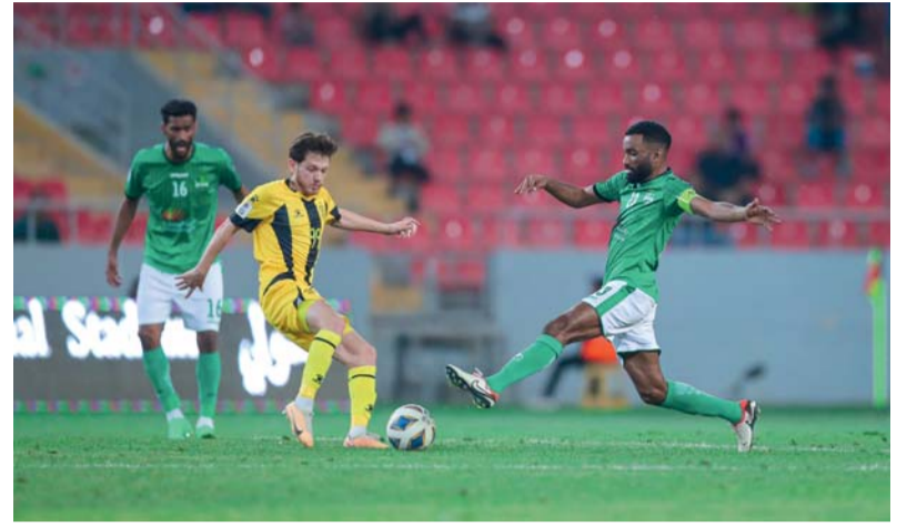
■ غاب المستوى عن الرّاقى فتفوّق العهد ذهاباً

٤(أ.ف.ب): قلب باريس سان جرمان الفرنسي تحلّفه ذهاباً على أرضه ٢-٣ أمام برشلونة الإسباني إلى فوز ٤-١ مستغلاً النقص العددي في صفوف منافسه ليبلغ الدور نصف النهائي من دوري أبطال أوروبا لكرة القدم، وتقدم برشلونة بهدف جناحه البرازيلي رافينيا في الدقيقة ١٢، لكن نقطة التحول كانت لدى طرد مدافعه الأوروغوياني رونالدو أراوخو في الدقيقة