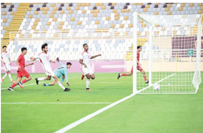
■ هدف مباراة المنتخب الأول