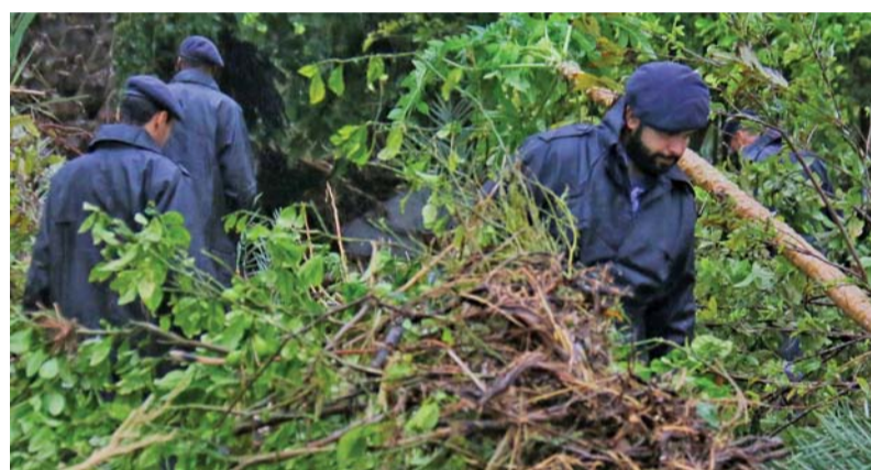
■ شرطة عُمان السلطانية تواصل البحث عن مفقودين

وبرامج التأهيل وبناءً على مؤشرات الحالة الجوية؛ قررت وزارة التنمية الاجتماعية استمرار تعليق العمل وبرامج التأهيل في المراكز الحكومية والأهلية والخاصة ونور الحضانات إلى غاية اليوم «الخميس» على أن