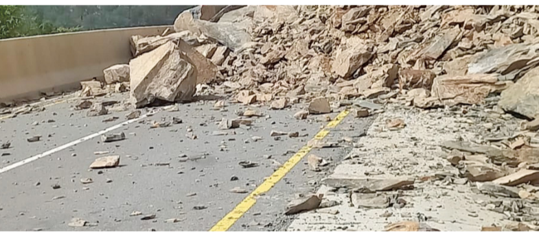
■ أحد الطرق المتضررة

وتواصل قوات السلطان المسلحة مع الحالة الجوية الاستثنائية (منخفض المطير) والتي تعرضت لها سلطنة عُمان، وذلك من خلال تقديم كافة أوجه الدعم والإسناد للجهات الحكومية العسكرية منها والأمنية والمدنية، وباقي القطاعات الأخرى بسلطنة عُمان في إطار خطة اللجنة الوطنية لإدارة الحالات الطارئة. وتستمر اللجنة العسكرية الرئيسية لإدارة الحالات الطارئة بقوات السلطان المسلحة في اجتماعاتها بمقر رئاسة أركان قوات السلطان المسلحة بمعسكر المرتفعة، للوقوف على كافة الجوانب المتعلقة بالاستعدادات والجاهزية للتعامل مع تداعيات الحالة الجوية الاستثنائية، بترأس الاجتماعات العميد الركن حامد بن عبد الله البلوشي مساعد رئيس أركان قوات السلطان المسلحة للعمليات والتخطيط رئيس اللجنة العسكرية لإدارة الحالات الطارئة وبحضور أعضاء اللجنة. كما واصلت وزارة الصحة تفعيل مركز إدارة الحالات الطارئة الذي تم تفعيله يوم السبت الماضي؛ استجابة للحالة الجوية الاستثنائية، حيث عقد اجتماع مرئي مع مديري عموم المديرية الصحية في كافة المحافظات المتأثرة بالحالة الجوية،