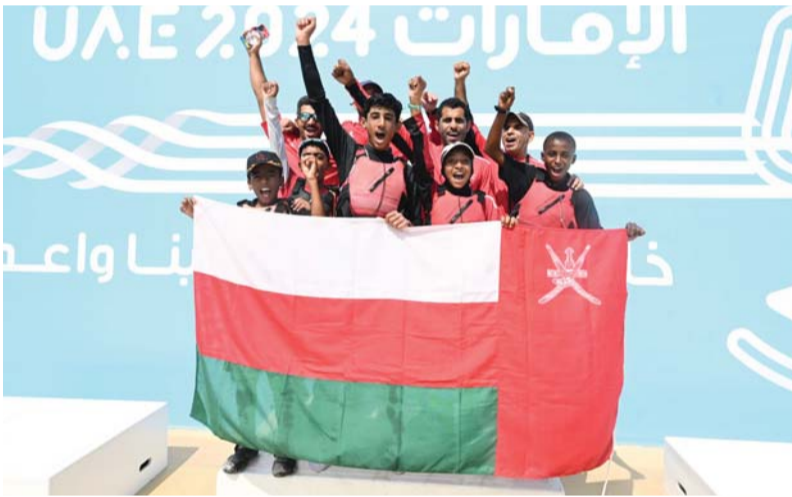
■ فرحة بكرة المنتخب بالحصول على ذهبية الفرق