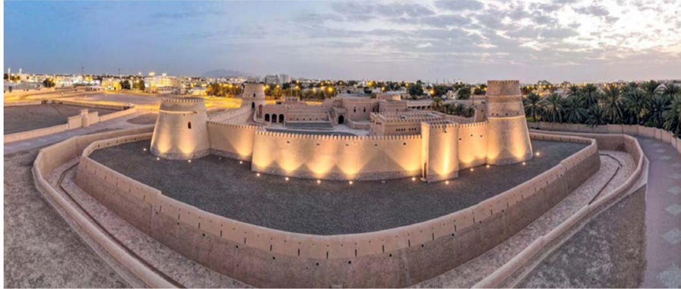
المعلم والمواقع الأثرية تبقى شاهدة على الحضارة العمانية على مر العصور

وصون التراث من خلال توثيق المواقع التاريخية والأثرية وترميمها إلى جانب أعمال التنقيب الأثري وتسجيل القطع الأثرية المكتشفة بالإضافة إلى إبراز المواقع عالميا، وتأهيل المواقع للاستثمار من خلال طرحها كمشاريع تسهم في نمو الاقتصاد المحلي ضمن رؤية (عمان ٢٠٤٠). وسجلت وزارة التراث والسياحة ما يقارب ٣٦ ألف موقع أثري، فيما بلغ عدد المعالم التاريخية ٣ آلاف و٥٢٥ معلما، وبلغ عدد المعالم المرمة ٣٦٦ معلما في كافة محافظات سلطنة عُمان حتى عام ٢٠٢٣ م؛ وذلك بهدف حمايتها من الاندثار لتبقى شاهدة على الحضارة العمانية على مر العصور. الجدير بالذكر أن اليوم العالمي للتراث هو اليوم الذي اقترح من قبل المجلس الدولي للمعلم والمواقع (ICOMOS) عام ١٩٨٢م، وأقر لاحقا من قبل الجمعية العامة لمنظمة الأمم المتحدة للتربية والعلم والثقافة (اليونسكو) في عام ١٩٨٣م، ويهدف الاحتفال إلى تعزيز الوعي بأهمية التراث الثقافي للبشرية ومضاعفة الجهود اللازمة لحماية التراث والمحافظة عليه، مع تسليط الضوء على المسؤولية المشتركة بين دول العالم للمحافظة على التراث الإنساني.