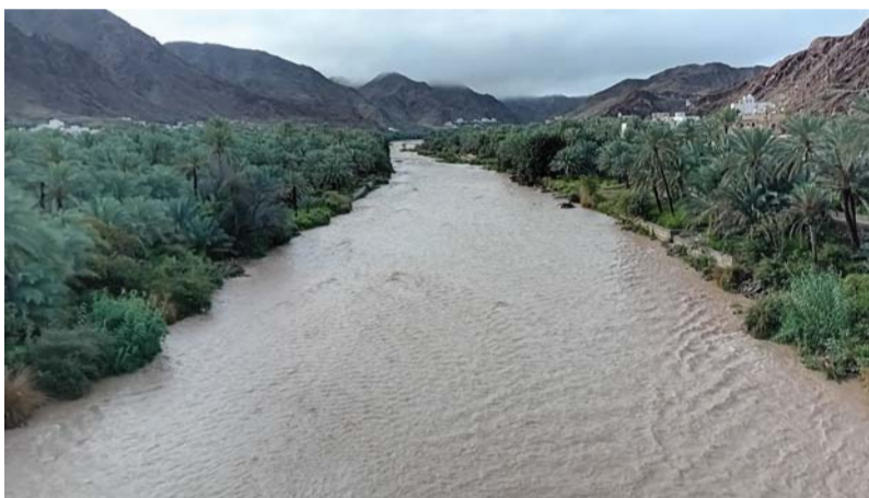
■ جريان وادي بني هني بالرسنق

جران الأودية وتجمع المياه. أما في ولاية الخابورة فهطلت أمطار غزيرة وجريان عدد من الأودية بكميات جارفة، أدت إلى جرف مزارع قائمة وجرف عدد من الأشجار والسيارات والأضرار بالطرق الفرعية. أما ولاية السويق فقد شهدت هطول أمطار شديدة الغزارة أدت إلى جريان الشعاب والأودية، مما تسبب في انقطاع الحركة المرورية لعدد من الطرق وتراكم الأتربة والحجارة. ودعا مكتب محافظ شمال الباطنة المواطنين والمقيمين بالمحافظة للحذر والبقاء في أماكن آمنة، وتجنب الأماكن التي تتجمع فيها المياه والأودية، وشدد على أهمية الالتزام بالتعليمات الملونة عبر وسائل الإعلام الرسمية. كما قام مكاتب أصحاب السعادة ولاة محافظة شمال الباطنة بالتعاون مع الجهات المختصة، بتفقد المناطق المتضررة جراء الحالة الجوية؛ «منخفض المطير» وذلك لمراقبة الأضرار والتعامل معها لضمان عودتها إلى الوضع الطبيعي. وتواصل بلدية شمال الباطنة ممثلة بدواورها في المحافظة، جهودها في التعامل مع الحالة الجوية، إذ باشرت فرق النظافة الميدانية أعمالها لقيام بشطف الشوارع الرئيسية والخدمات، ووسط الأحياء السكنية، وتنظيف مجاري تصريف المياه من العوالم التجارية إلى جانب نفوق عدد من الحيوانات في المزارع. كما هطلت أمطار على ولاية لوى أدت إلى جريان عدد من الأودية منها وادي الزهيمي ووادي رجب بكميات مياه جارفة ملحقة أضرراً مادية في البنية التحتية بالولاية، كما تعرضت ولاية صحح لأمطار شديدة الغزارة وجريان الشعاب والأودية على معظم المناطق الجبلية حتى وصولها إلى المناطق الساحلية مع انقطاع الحركة المرورية في طرق الخدمة، بسبب