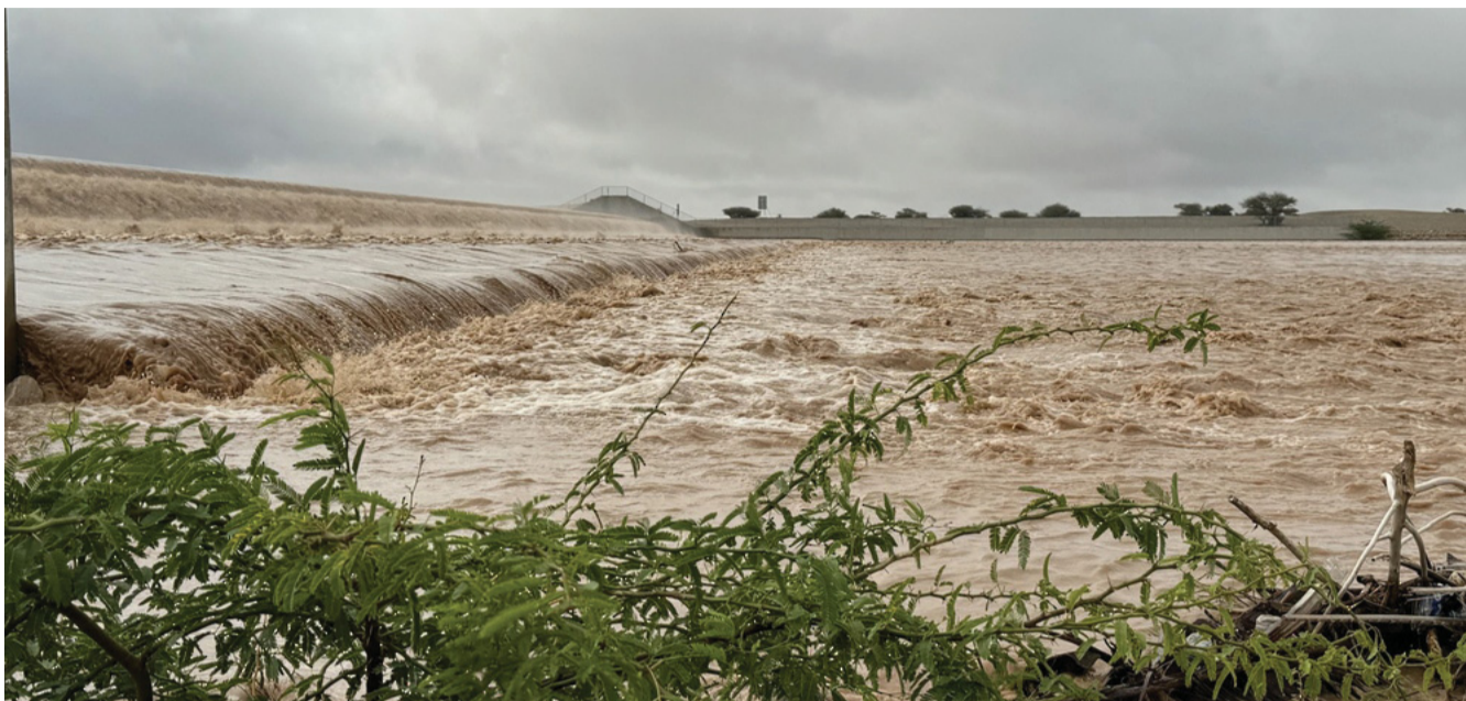
■ امتلاء أحد السدود