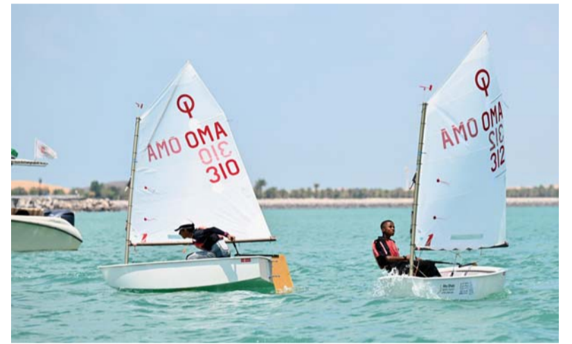
■ بكرة المنتخب في مسار السباق