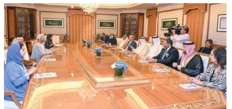
بدر بن حمد أثناء استقباله رؤساء لجان مكافحة الاتجار بالبشر

المنتدى الحكومي لمكافحة الاتجار بالأشخاص في الشرق الأوسط في دورته الخامسة بعنوان «مكافحة الاتجار بالبشر عبر تشريعات وإجراءات العمل، الذي عقد بمسقط أمس على أهمية المراجعة الدورية للتشريعات النافذة، سواء المعنية بشكل مباشر بمكافحة الاتجار بالأشخاص، أو المعنية بالعمل في القطاعات الأهلية لضمان مواكبتها تطورات الجريمة ووسائل ارتكابها، إلى جانب تضمينها الأدوات اللازمة للتوسع في تفعيل الدور الرقابي والوقائي لمفتشي العمل. وأكد المنتدى الذي استضافته سلطنة عُمان - ممثلة بوزارة الخارجية - على إنشاء مجموعة عمل فنية تضم ممثلين عن الجهات المشاركة والأمانة العامة الدائمة للمنندى، ومكتب الأمم المتحدة المعني بالمخدرات والجريمة ومنظمات وأجهزة الأمم المتحدة ذات الصلة، للعمل على وضع خريطة لتنفيذ التوصيات، ومتابعة ما تم بشأنها، لضمان تحقيق الأهداف المرجوة من المنتدى. ودعا إلى الاستفادة من خبرات الدول المشاركة في مجال إجراءات تفتيش العمل وقواعد الرقابة ومتابعة شركات الاستقدام والتوظيف والبيانات التنسيق بين الدول المستضيفة للعمالة ودول المصدر في مجال