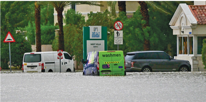
مركبات تحاول السير في شارع غمرته المياه بعد هطول أمطار غزيرة في دبي أول أمس

دبي، ١٧ أبريل: شهدت الإمارات هطول أكبر كميات أمطار في تاريخها الحديث خلال يوم أمس الأول، وتسببت في إغلاق شوارع وتعطل مركبات وتوقف رحلات طيران وتحويل الدراسة والعمل الحكومي للنظام الإلكتروني. وقال المركز الوطني للأرصاد بالإمارات في بيان أمس إن الكميات القياسية للأمطار التي هطلت على الدولة خلال الساعة الماضية «تعد حدثاً استثنائياً في التاريخ المناخي لدولة الإمارات منذ بداية تسجيل البيانات المناخية وهي الأغزر منذ ٧٥ عاماً، ومن المتوقع أن