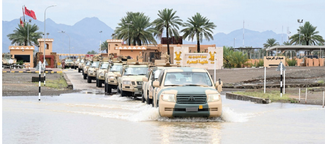
■ جهود متواصلة لقوات السلطان المسلحة للتعامل مع الحالة الجوية

تشير التوقعات وتحليل المركز الوطني للإنذار المبكر من المخاطر المتعددة من خلال البيان رقم (٢) إلى استمرار تدفق وتشكل السحب وهطول أمطار متفرقة الغزارة، تكون رعدية أحياناً على محافظة ظفار والأجزاء الساحلية لمحافظة الوسطى وتستمر لغاية غد الجمعة ١٩ أبريل ٢٠٢٤. كما تشير التوقعات إلى انحسار الحالة الجوية على المحافظات الشمالية لسلطنة عُمان مع فرص تشكل السحب وهطول أمطار متفرقة خلال فترة الظهيرة على جبال الحجر والمناطق المجاورة لها. ■