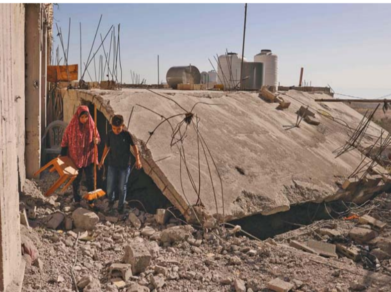
أفراد عائلة يقومون بإزالة الركام بعد تدمير الاحتلال منزلهم في قرية بني نعيم بالضفة الغربية.

المصابين من تحت الأنقاض. إلى ذلك قال مدير منظمة الصحة العالمية تيدروس أدهانوم جيبريسوس، إن حجم الدمار الذي لحق بمستشفيات قطاع غزة مفرح، مجدداً المطالبة بحماية المستشفيات وعدم مهاجمتها. وقال جيبريسوس في منشور على منصة «إكس» «أجربنا مع شركائنا تقييماً لوضع مستشفى الشفاء والمصابين من تحت الأنقاض. إلى ذلك قال مدير منظمة الصحة العالمية تيدروس أدهانوم جيبريسوس، إن حجم الدمار الذي لحق بمستشفيات قطاع غزة مفرح، مجدداً المطالبة بحماية المستشفيات وعدم مهاجمتها. وقال جيبريسوس في منشور على منصة «إكس» «أجربنا مع شركائنا تقييماً لوضع مستشفى الشفاء في محاولة لإعادة تأهيله. ودعا جيبريسوس مجدداً إلى وقف إطلاق النار، قائلًا إن الدواء الرئيسي الذي يحتاجه الناس في غزة هو السلام. وبحسب وزارة الصحة، فإنه اعتباراً من ٢٢ فبراير الماضي، يعمل في قطاع غزة ١٢ مستشفى بشكل جزئي، ٦ منها في الشمال و٦ في الجنوب، إضافة إلى ثلاثة مستشفيات ميدانية تعمل جزئياً.