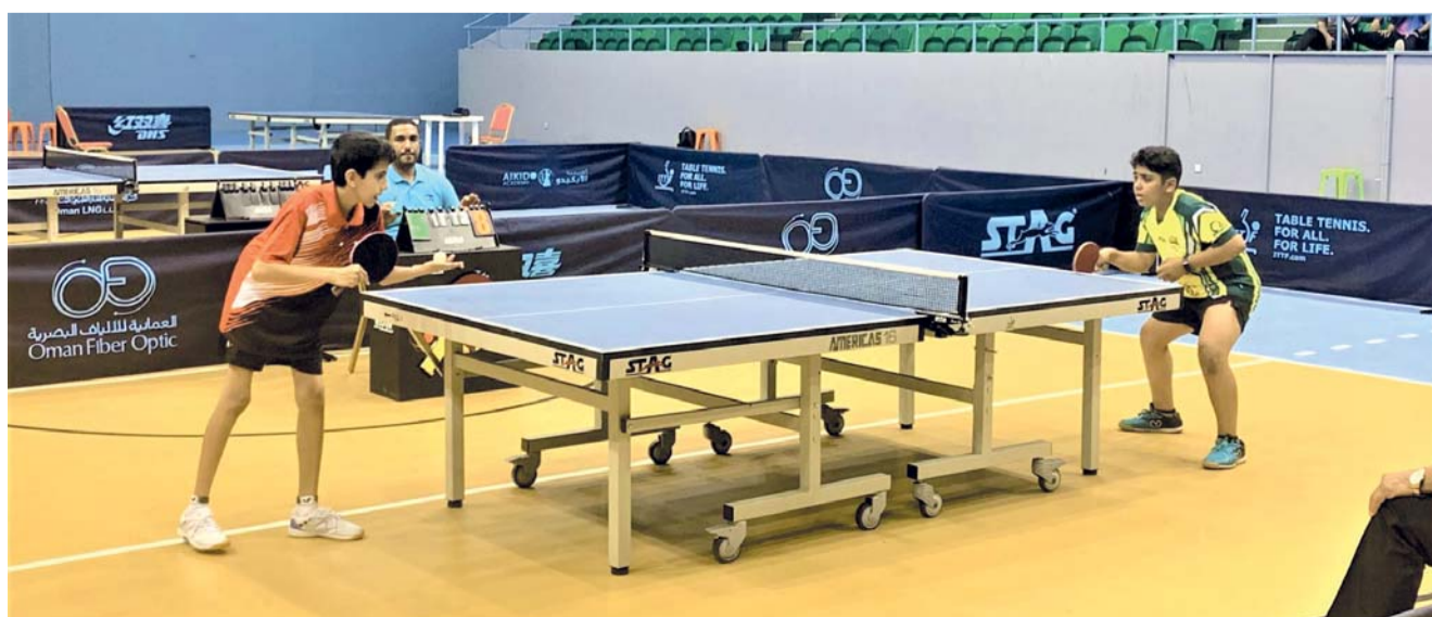
■ صورة أرسيفيّة من منافسات البطولة الماضية

تبدأ مساء اليوم بالصالة الرئيسية لمجمّع السلطان قابوس الرياضي ببوشر، منافسات بطولة فردي البراعم لكرة الطاولة لعام ٢٠٢٤م، بمشاركة أكثر من ٦٤ لاعباً يمثلون عدة أندية وهي: عبري - صحم - نخل - قريات - الرسّاق - الاتفاق - صلالة - ينقل - السيب، وستقام منافسات البطولة التي ينظمها الاتحاد العماني لكرة الطاولة لمدة ثلاثة أيام على أن يكون إقامة الأندية النهائية مساء بعد غد السبت.