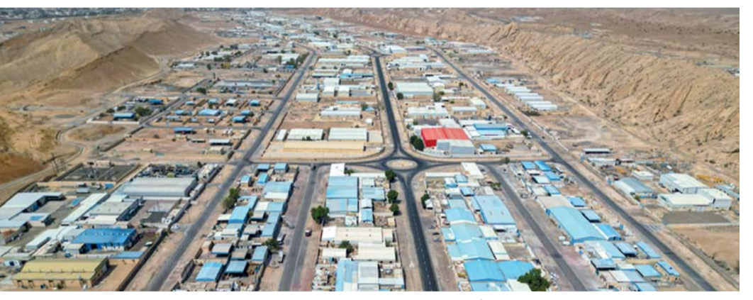
٧١ رائداً وأعمال استفاد من برنامج جاهزية بمحافظة البريمي في ٢٠٢٣ م

البريمي . العُمانية: بلغ عدد المؤسسات الصغيرة والمتوسطة المسجلة لدى إدارة هيئة تنمية المؤسسات الصغيرة والمتوسطة بمحافظة البريمي (٣٠٢٧) مؤسسة حتى نهاية عام ٢٠٢٣ م. وأوضحت الإدارة أن عدد المؤسسات الصغيرة والمتوسطة بمحافظة البريمي بلغ (٥٧١)، إذ تتوفر المؤسسات حسب الحجم إلى (٢٥١) مؤسسة صغيرة، و (٤٦٠) مؤسسة متوسطة، فيما بلغ عدد المؤسسات غير المسجلة على بطاقة ريادة الأعمال (٢٤٥٦) مؤسسة. وأشارت الإحصاءات إلى أن المستفيدين من برنامج جاهزية رائد الأعمال في محافظة البريمي خلال العام ٢٠٢٣ م بلغ (٧١) رائداً ورائدة أعمال، وبلغ إجمالي المستفيدين من الدعم الحرفي في المحافظة خلال العام الماضي