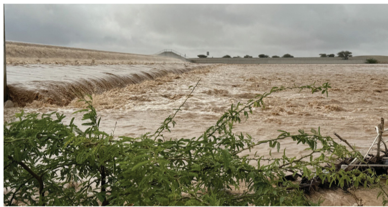
■ امتلاء أحد السدود

المتعددة إلى انحسار تأثير الحالة الجوية على المحافظات الشمالية لسلطنة عُمان مع فرص تشكل السحب وهطول أمطار متفرقة خلال فترة ما بعد