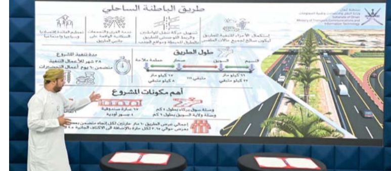
الطريق يساهم في إيجاد العديد من الفرص السياحية والاقتصادية

على تنفيذ ازدواجية وصلة سوق بركاء بطول ٤ كم ووصلة ولاية السوق بطول ٦ كيلومترات مع إنشاء جسر السويق على طريق الباطنة العام؛ حيث سيعمل هذا الربط المزوج على تعزيز الحركة التجارية والاقتصادية وربط مكونات المنظومة اللوجستية بين مينائي بركاء والسويق، ومدينة خزان الاقتصادية والطرق الوطنية. جدير بالذكر أن مشروع طريق الباطنة الساحلي يبدأ من ولاية بركاء وينتهي في خطة ملاحه بولاية شخاص بطول إجمالي (٢٤٤) كيلومترا، حيث تم تقسيم المشروع إلى مرحلتين تشمل المرحلة الأولى على جزأين يبدأ الأول من تقاطع النسيم بولاية بركاء وحتى ميناء السويق بطول ٦٦ كم فيما يبدأ الجزء الثاني من ميناء صحار وحتى خطة المرحلة الثانية للمشروع من ميناء السويق وحتى ميناء صحار بطول ١١١ كم.