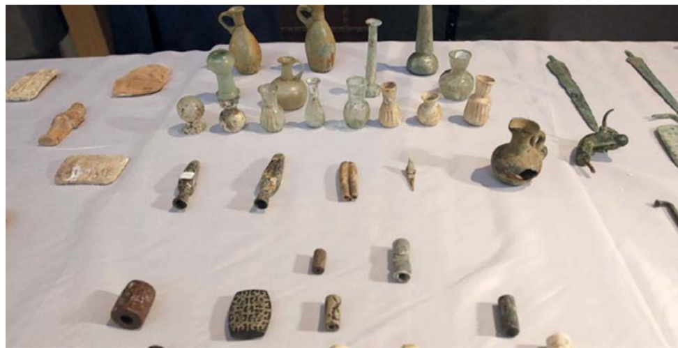
القطع المكتشفة تؤرخ لحضارة العراق وتوثق إسهاماتها الإنسانية

الولايات المتحدة خلال السنوات الماضية كانت قد نهبت بعد الغزو الأمريكي للعراق عام ٢٠٠٣.