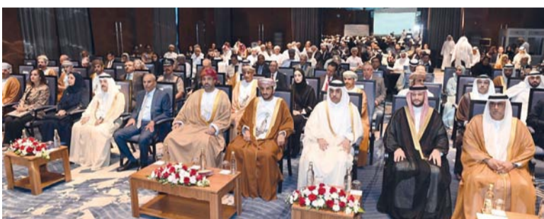
المنتدى يهدف لتنمية قدرات العاملين في مكافحة جريمة الاتجار بالبشر

أن سلطنة عُمان استحدثت وحدة التفتيش المشتركة بين وزارة العمل ومؤسسة الأمن والسلامة بهدف رفع جودة وكفاءة عمليات التفتيش وزيادة الفعالية في أداء المهام المرتبطة، ودعم عمليات التفتيش بخدمات المساندة الأمنية، بما يعكس إيجابًا على تكثيف الحملات التفتيشية على المنشآت المخالفة والأيدى العاملة السائبة، وكذلك تبسيط إجراءات العمل. وأفاد سعادته بأن اللجنة الوطنية لمكافحة الاتجار بالبشر أطلقت هذا العام خطة العمل الوطنية لمكافحة الاتجار بالبشر (٢٠٢٤-٢٠٢٦) لتعزيز جهود سلطنة عُمان في منع وقمع ومعالجة الاتجار بالبشر بمختلف صورته وأشكاله وتوفير الحماية اللازمة للضحايا، معربًا عن أمله في أن يتم خلال الأشهر القادمة إصدار قانون جديد لمكافحة الاتجار بالبشر، بعد تعديل وتطوير القانون الحالي. ولفت سعادته إلى أن مؤنق حقوق الإنسان عالمية في طبيعتها، ويجب على العالم أن يبطئها بعدالة ومساواة، ولكن للأسف هذا ما لا نراه على أرض الواقع الآن، فما يجري للفلسطينيين في قطاع غزة حاليًا من قتل وتجويع وتهجير من قبل سلطة الاحتلال الإسرائيلي أظهر بما لا يدعو للشك أن هناك ازدواجية صارخة في المعايير وانقسامًا في المبادئ والمواقف.