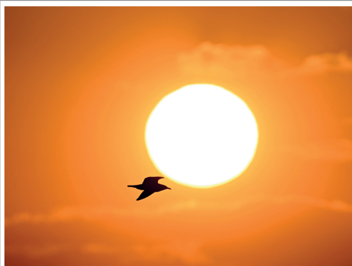
طائر نورس يحلق في السماء لحظة غروب الشمس في مرسيليا جنوب فرنسا

موسكو، ١٧ أبريل: دعت السلطات في منطقتي تيومين وكورغان الروسيين في غرب سيبيريا إلى عمليات إخلاء طارئة في عدة بلدات متضررة من فيضانات خطيرة في مناطق محاذية لكاناخستان، وأمر حاكم منطقة تيومين ألكسندر مور بعمليات «إخلاء طارئة للمناطق التي قد تتعرض لفيضانات، خصوصاً في قرى بالينكا ونوفوغوريفكا وأفونكينو الواقعة في جوار الحدود. وبلغ منسوب مياه النهر إيشيم في هذه المنطقة ٨٠٨ سنتيمترات في بعض الأماكن، في مستوى «خطير»، بحسب السلطات المحلية. وتلقى سكان مدينة إيشيم التي تضم نحو ٦٧ ألف نسمة رسائل نصية تدعوهم إلى المغادرة. وأقيمت مراكز إيواء مؤقتة لاستقبال النازحين.