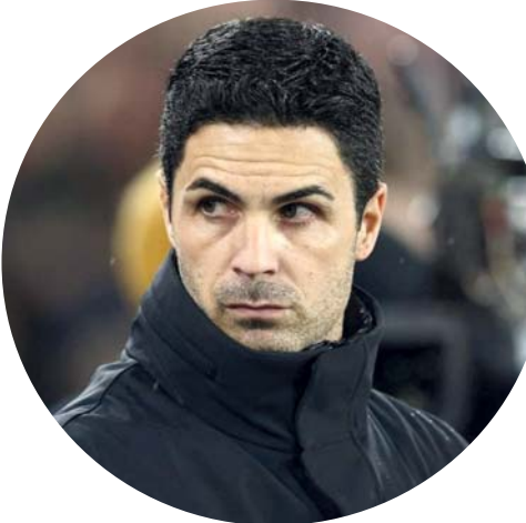
■ ميكيل أرتيتا

لندن. د. ب. أ: أشاد الإسباني ميكيل أرتيتا، المدير الفني لفريق أرسنال، بتحكم اللاعبين في مشاعرهم خلال المباراة التي تعادل فيها الفريق ٢ / ٢ مع بايرن ميونخ الألماني يوم الثلاثاء الماضي، في ذهاب دور الثمانية بدوري أبطال أوروبا لكرة القدم. وذكرت وكالة الأنباء البريطانية (بي إيه ميديا) أن أرتيتا اعترف بأن الأجواء كانت عاطفية للغاية في ملعب الإمارات، لكن لاعبيه نجحوا في التعامل مع ذلك الضغط بشكل جيد، ونجحوا في التسجيل في الدقائق الأخيرة.