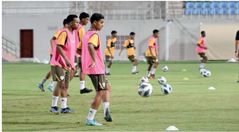
■ من تدريبات منتخبنا الوطني للناشئين لكرة القدم