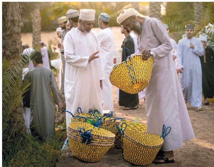
مشاهد ضوئية بعدسة موسى الحجري