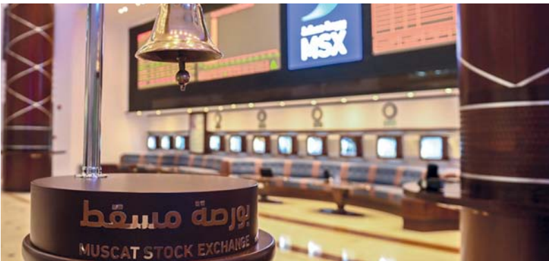
شهر فبراير الماضي سجل أعلى قيمة للتداول بنحو ١٢٩,٨ مليون ريال عماني

السادس من الصوك السيادية الأوراق المالية الأكثر تداولاً في سوق السندات والصوك بـ ١٠,٧ مليون ريال عماني، وجاء الإصدار بـ ٦٤ سندات التنمية الحكومية في المرتبة الثانية بـ ٩,١ مليون ريال عماني، ثم الإصدار الثالث من الصوك السيادية الذي شهد تداولات بنحو ٨,١ مليون ريال عماني.