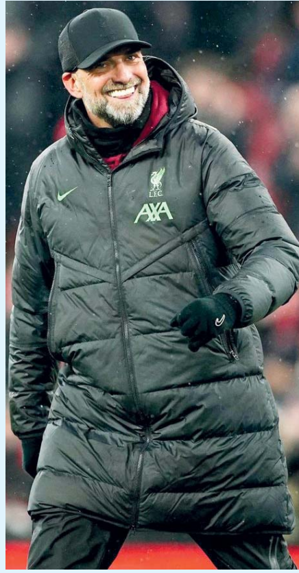
■ يورجن كلوب

دي جانيرو. د. ب. أ: اتفقت الألمانيان لورا سيجموند وتاتيانا ماريا على أن الأجواء في تصفيات بطولة كأس بيلي جين للتنس مميزة للغاية بعدما قادتا الفريق الألماني للتقدم على الفريق البرازيلي ٢ / صفر. وفي البداية، حققت سيجموند مفاجأة بالفوز ٦ / ٤ و ٦ / ٢ على المصنفة الأولى في البرازيل بياتريس حداد مايا، قبل أن تفوز ماريا على لورا بيجوسي ٢ / ٦ و ٤ / ٦. وكان هناك قرابة عشرة آلاف مشجع في ملعب جيناسيو دو إيبيرا في ساو باولو، وكانت حداد مايا على وجه التحديد