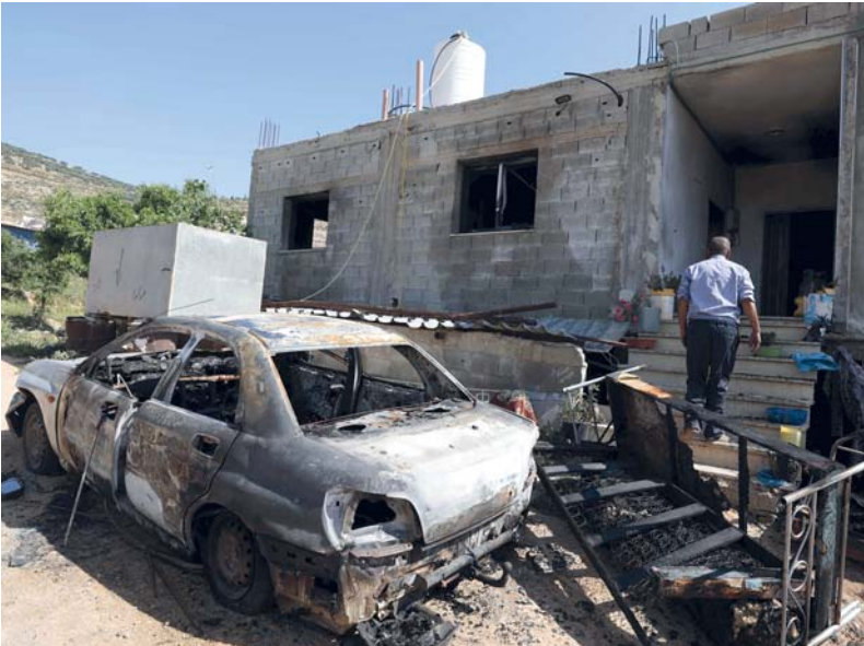
فلسطيني يدخل منزله المدمر في قرية المغير بالقرب من رام الله بالضفة الغربية المحتلة، بعد هجوم شنته مستوطنون إسرائيليون متطرفون على القرية