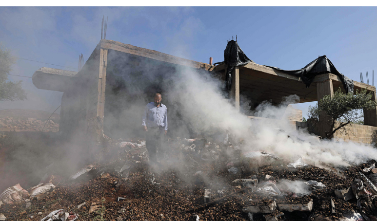
فلسطيني يتفقد الأضرار التي لحقت بمنزل جراء اعتداءات المستوطنين في قرية المغير بالقرب من رام الله في الضفة الغربية المحتلة أمس.

كثف جيش الاحتلال الإسرائيلي قصفه لليوم الثالث على مواقع وسط قطاع غزة، وذلك بعد إطلاقه عملية عسكرية مباغتة الخميس، معلناً تدميره أكثر من (٣٠) هدفاً. وتعليقاً على قصف وسط قطاع غزة، قالت حركة حماس إن القصف الإسرائيلي المكثف على الأحياء السكنية في مخيم النصيرات حلقة جديدة من حلقات حرب الإبادة الصهيونية ضد الشعب الفلسطيني. وفي وقت سابق، كشفت سرايا القدس الجناح العسكري لحركة الجهاد عن إيقاعها رتلاً عسكرياً إسرائيلياً في حقل الغام وعبوات برميلية شديدة الانفجار شمال النصيرات. وفي الضفة الغربية، اعتدت مجموعات من المستوطنين على قرى فلسطينية في شمال وشرق مدينة رام الله، وقاموا بإغلاق مدخل بلدة ترمسعيا شمال المدينة. تفاصيل: «الاقتصادي»