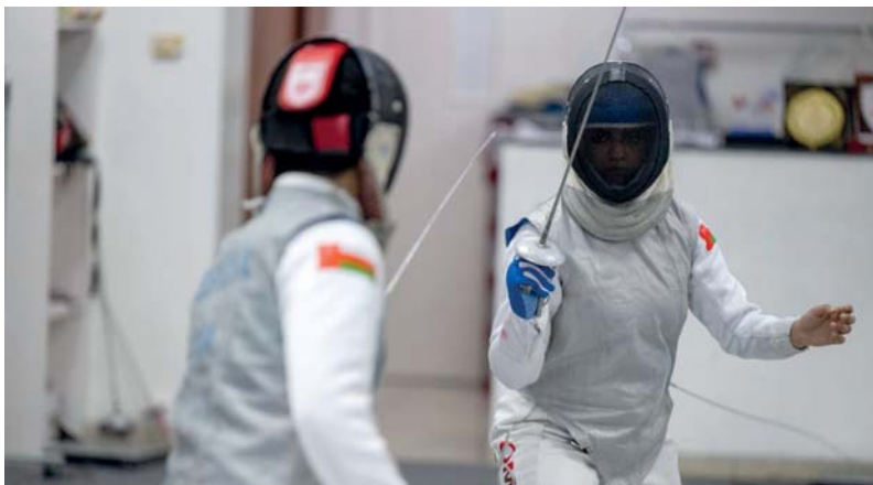
■ من تدريبات لاعبي منتخبنا للمبارزة