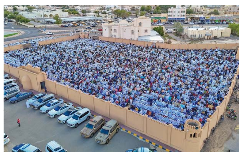
صلاة العيد في ولاية عبري

أمام المصلين عدد من المشايخ والوعاظ الدينيين حيث تشكل مناسبة عيد الفطر سعيدة بولاية بصور مع غيرها من محافظات ولايات سلطنة عمان فرصة لإعادة واستذكار واستحضار الصغير قبل الكبير العادات والتقاليد الأصيلة المتوارثة والواجبات الضرورية المستمدة من الدين الإسلامي الحنيف وترسم الفرحة على الجميع وهم يستقبلون أول أيام العيد.