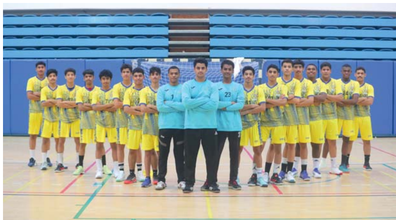
■ منتخبنا الوطني للناشئين لكرة اليد