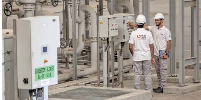
المبادرة تستخدم أحدث المعطيات التقنية

أنه بشكل عام يمكن تصنيف استراتيجيات إدارة مياه الصرف الصحي على أنها مركزية أو لامركزية. تعد استراتيجيات تجميع مياه الصرف الصحي المركزية ومعالجتها مكلفة من حيث الإنشاء والتشغيل، خاصة في المناطق ذات الكثافة السكانية المنخفضة والمجتمعات المتفرقة. من ناحية أخرى، فإن النهج اللامركزي لمعالجة مياه الصرف الصحي الذي يهدف للمعالجة بالقرب من المصدر يكتسب مزيداً من الاهتمام في الوقت الحالي. بحيث تتضمن المبادئ الرئيسية التي توظفها الأنظمة اللامركزية بمزايا جذابة تتمثل في كل من البساطة التشغيلية وفعالية التكلفة بتقليل نظام التجميع إلى الحد الأدنى، وكذلك استخدام تقنيات المعالجة المرنة، وتقليل الحمأة المنتجة، وإعادة استخدام الأمثل للمياه المعالجة بالقرب من الموقع. حيث تتوافق هذه الاستراتيجية مع نهج التنمية المستدامة التي يتم تحقيقها بطريقة ذات كفاءة اقتصادية وصديقة للبيئة وموفرة للطاقة.»