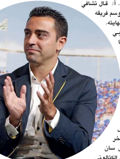
■ تشافي هيرنانديز

هيرنانديز، المدير الفني لفريق كان سيصبح كارثياً إذا لم ونكرت وكالة الأنباء (بي إيه ميديا) أن أعلن رحيله عن الهزيمة على ٣ / ٥ أمام في يناير وذلك بعد ونصف رأس الإدارة للفريق. وقال ذلك الوقت إن اللاعبين أكثر تلك المباريات في جيرمان الفرنسي، ٣ / ٢ في ذهاب دور أوروبا. وقال تشافي في القرار كنت متأكد من أن النحو، إذا لم يحدث ذلك ستكون كارثة ولقد أخبرت رئيس النادي بذلك». وأضاف: «لقد بحثت الأمر في النادي ولو لم أقرر ذلك ما كنا لننفس الأن». وبسؤاله حول إذا ما كان سيغير رأيه بشأن قراره أجب تشافي: «لقد أخبرتكم في كل مؤتمر صحفي أن لا شيء تغير». ويحتل برشلونة المركز الثاني في ترتيب الدوري الإسباني برصيد ٦٧ نقطة بفارق ثمانية نقاط خلف المتصدر ريال مدريد.