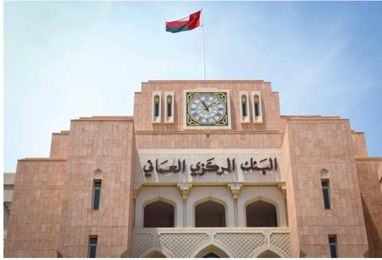
أقل سعر مقبول وصل إلى ٩٩,٦٢٥ لكل ١٠٠ ريال عماني

استحقاق تبلغ ٣٦٤ يوماً مبلغاً وقدره ٤٠,٧ مليون ريال عماني، وذلك بمتوسط سعر مقبول بلغ ٩٥,١٧٥ ريال عماني، ووصل أقل سعر مقبول إلى ٩٥,١٥٠ لكل ١٠٠ ريال عماني، فيما بلغ متوسط سعر الخصم ٨٣,٧٨٢ بالمائة، ومتوسط العائد ٥,٨٣٠,٧ بالمائة. قالت وزارة الاقتصاد إن الناتج المحلي الإجمالي لسلسلة عمان سجل نمواً بنسبة ١,٣ بالمائة بنهاية العام الماضي، وارتفع حجم الناتج المحلي الإجمالي، بالأسعار الثابتة، من ٣٧,٧ مليار ريال عماني بنهاية عام ٢٠٢٢ إلى ٣٨,٢ مليار ريال عماني بنهاية العام الماضي. وبلغ حجم الناتج المحلي الإجمالي، بالأسعار الجارية، ٤١,٨ مليار ريال عماني خلال العام الماضي منخفضاً بنسبة ٢,٨ بالمائة مقارنة مع عام ٢٠٢٢. وجاء النمو المحقق خلال العام الماضي بدعم رئيسي من ارتفاع القيمة المضافة للأنشطة غير النفطية حيث ساعدت مساهمتها في الناتج المحلي من ٢٦,٦ مليار ريال عماني في عام ٢٠٢٢ إلى ٢٧,٣ مليار ريال عماني بنهاية العام الماضي بنسبة نمو ٢,٤ بالمائة. وسجل نمو الأنشطة النفطية زيادة بحوالي ٠,٤ بالمائة لترتفع مساهمتها من ١٢,٣ مليار ريال عماني في عام ٢٠٢٢ إلى ١٢,٤ مليار ريال عماني في عام ٢٠٢٣.