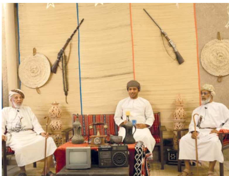
عدد من المشاركين في الجلسات الحوارية