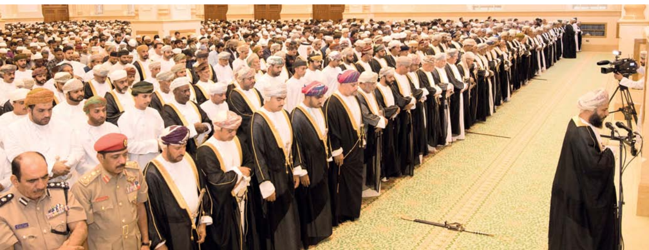
صلاة العيد في محافظة ظفار