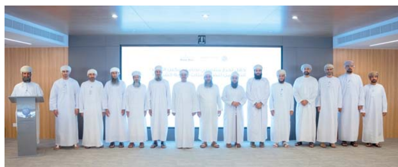
صورة جماعية للخريجين مع المسؤولين في بنك العز الإسلامي

احتفل بنك العز الإسلامي مؤخراً ممثلاً في إدارة الالتزام والتدقيق الشرعي بتخريج الدفعة الأولى من برنامج تمكين الصف الثاني من أعضاء هيئات الرقابة الشرعية، كما أعلن البنك عن استقبال الدفعة الثانية من المرشحين للبرنامج. يعد هذا البرنامج الأول من نوعه الذي يهدف إلى تعزيز معرفة الفقهاء العمانيين، ليصبحوا أعضاء في هيئات الرقابة الشرعية في سلطنة عمان مستقبلاً. ويأتي تحت مظلة «منار العز»، والتي تهدف إلى تعزيز الوعي والمعرفة