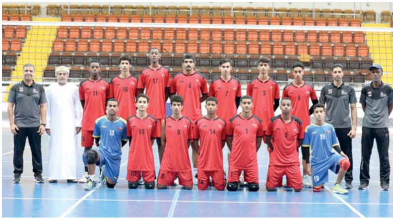
■ منتخبنا الوطني للشباب لكرة الطاولة