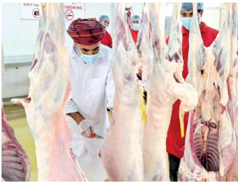
وضع الخطط المناسبة لتنظيم سير العمل بالمسالخ

بالإضافة إلى توفير العدد الكافي من القصابين والعاملين وعمال النظافة وكافة المعدات والمستلزمات. فقد قامت بلدية جنوب الشرقية ممثلة بدوائر البلدية بمتابعة الشركات المشغلة لتاكيد جاهزيتها من حيث توافر المعدات والأجهزة الخاصة بالذبح والتأكد من قدرتها على استيعاب عدد الذبوحات.