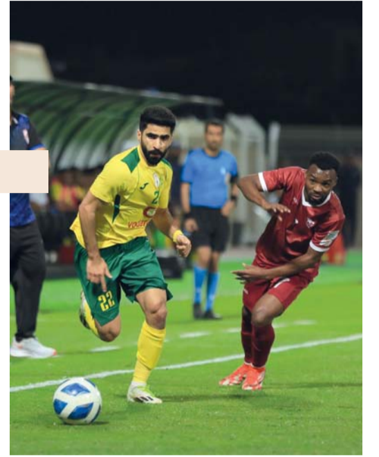
من مباريات دوري عمانتل

ارتأت رابطة الدوري العماني ان تقام المباريات الست بهذه الجولة في يوم واحد، حيث الوقت بات ضيقاً للاعبين والأجهزة الفنية وكل من ينتمي للوسط الرياضي في الانتعاش من تجهيزات العيد، خاصة وأن هناك اندية ستسافر إلى محافظات أخرى وبحاجة إلى