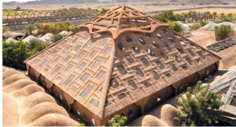
المشروع متكامل ويضم حديقة للحيوانات النادرة

بالإضافة إلى إيجاد قيمة مضافة اجتماعية من خلال إيجاد أجواء عائلية ترفيهية عند زيارة حديقة بالاطلاق على كل محتوياتها ومرافقها الترفيهية، أما المركز الرابع فهو المركز العلمي، بحيث يمكن لطلبة المدارس والجامعات والأكاديميين والمهنيين بالبحوث العلمية الاستفادة من هذا المشروع في إجراء الأبحاث والمشروعات العملية بأنواعها. وأضاف مدير عام المشروع أن عدد الحيوانات الحالية في الحديقة يبلغ «٣٠٠»، وسيترفع خلال الفترة القادمة، حيث تتوفر هذه الحيوانات من مختلف قارات ودول العالم، بالإضافة إلى حيوانات محلية وبعضها الآخر من دول الوطن العربي، مثل الأسود والنمور والحمار الوحشي وأنواع الغزلان، بالإضافة إلى الزواحف والطيور والحيوانات البرية التي تشتهر بها سلطنة عُمان، والتي تم تصميم حظائرها في بيئة مماثلة لبيئتها الأصلية في البراري والمراعي الخضراء.