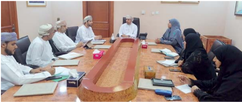
اجتماع فريق مشروع المسابقة

الماضية، والجهود المبذولة للحد من انتشار هذه الظاهرة.