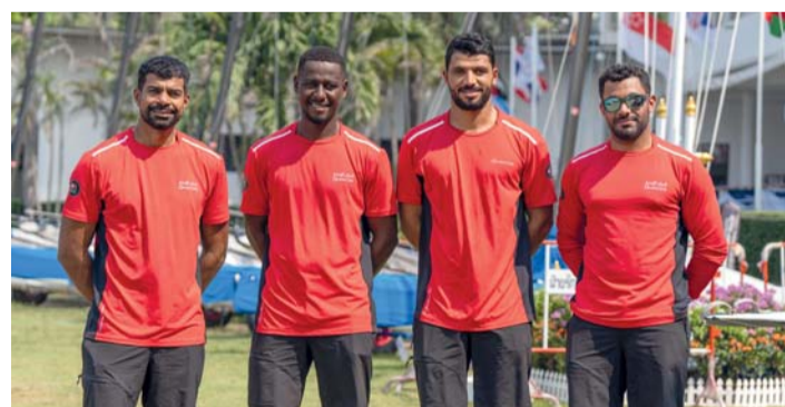
صورة جماعية لبحارة الفريق الأولمبي للإبحار الشراعي

حيث تم تخصيص السباق للمنتخبات الأولمبية التي لم تتمكن من التأهل خلال التصفيات السابقة.