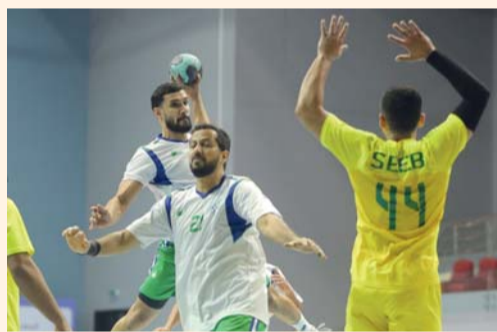
من مباريات دوري الدرجة الأولى لكرة اليد

عن المشاركة في بداية الموسم . وتلعب مباريات الدور الثاني بنظام الدوري من دورين « نهاب وايب » تجتمع نقاط ويكون الترتيب النهائي في المسابقات على النحو التالي : الفريق الذي يحصل على أكبر مجموع من النقاط يفوز ببطولة الدوري وإذا تعادل فريقان أو أكثر في مجموع النقاط على أي مركز يتم الترتيب وفق الآتي : مجموع النقاط التي حصل عليها كل فريق من الفرق المتعادلة في المباريات التي أقيمت بينهما فقط وإذا استمر التعادل يؤخذ بفارق الأهداف « ماله ناقصا ما عليه » بين الفرق المتعادلة في المباريات التي أقيمت بينها فقط وإذا استمر التعادل يؤخذ بفارق الأهداف « ماله ناقصا ما عليه » في جميع المباريات بعد استبعاد جميع اهداف مباريات الفريق الذي ينسحب من أي مباراة .