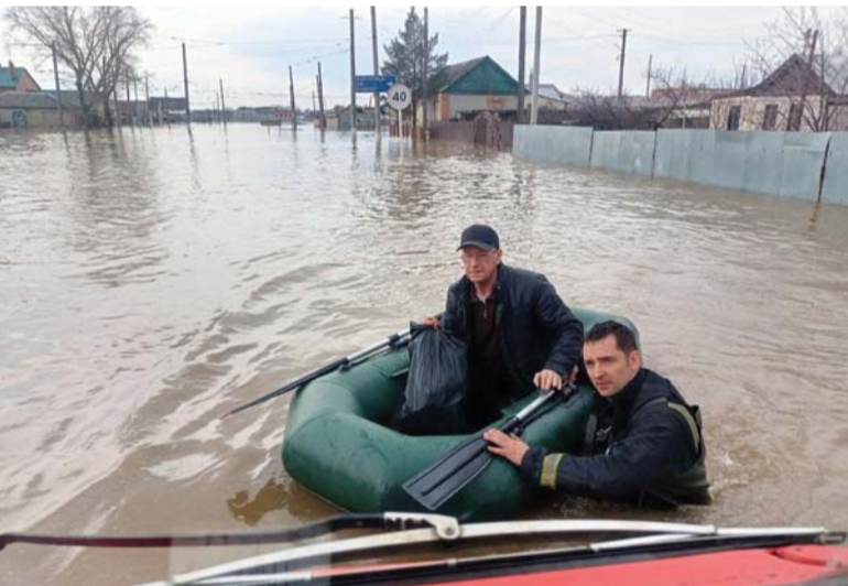
رجال إقناذ أثناء عمليات إجلاء السكّان جرّاء فيضان في بلدة أوركسك بعد يومين من انهيار سدّ جنوب شرق الطرف الجنوبي لجبال الأورال الروسية.

المنطقة الحدودية مع كازاخستان. والسد الذي انهيار جزئياً، تم تصميمه رسمياً بالارتفاع نفسه لمنسوب الأورال، النهر الكبير في المنطقة، أي ٥٠ متر، لكنه بلغ ٩٠,٦ متر حالياً جراء ذوبان الثلوج، بحسب السلطات الإقليمية. وأظهر مقطع فيديو نشرته وزارة الطوارئ الروسية لعمليات الإخلاء، دخول المياه إلى المنازل وإجلاء رجال الإنقاذ منبئين وأقدامهم مغمورة في المياه. وأكدت الوزارة أن أكثر من ٥٠٠ مخصص موجودون حالياً في أوركسك، على أن يتم إرسال مزيد من التعزيزات قريباً.