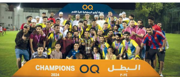
تتويج فريق نجوم الأخوة بلقب البطولة

أسدل الستار على بطولة أوكيو - المجموعة العالمية المتكاملة للطاقات - الرضائية بعد أن توج فريق نجوم الأخوة بطلاً للبطولة للمرة الأولى بعد فوزه على فريق شباب الزاهية بثنائية نظيفة، وذلك في المباراة التي أقيمت بملعب المجموعة في ميناء الفحل وتحت رعاية المهندس كامل بن بخت الشنقري المدير التنفيذي للمصافي والصناعات البترولية بمجموعة أوكيو، وبحضور عدد من المسؤولين بالمجموعة، وفي مباراة تحديد المركز الثالث والتي التقى فيها نادي الأهلي وفريق كوزموس والتي استطاع نادي الأهلي كسب المباراة والفوز بها بنتيجة ٢/١ ليحصل على المركز الثالث والميداليات البرونزية، وبالعودة إلى مجريات المباراة النهائية فقد شهدت المباراة حضوراً جماهيرياً كثيفاً متألاً به المكان، وكذلك شهدت الكثير من الجانب