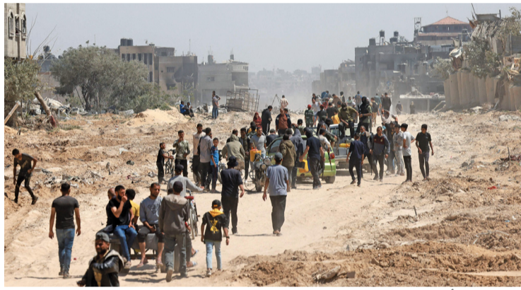
فلسطينيون كانوا نزحوا إلى رفح، يغادرون المدينة ليُعدوا إلى خان يونس بعد أن سحبت إسرائيل قواتها البرية من جنوب قطاع غزة.

«الوطن» تهني وتعاود الصدور بعد إجازة العيد بمناسبة حلول عيد الفطر المبارك يطيب لـ(الوطن) أن تهني قراءها الأعراف بهذه المناسبة الجليلة أعادها الله على حضرة صاحب الجلالة السلطان المعظم - حفظه الله ورعاه - والأمة العربية والإسلامية بالخير واليمن والبركات. وتعلن أنها ستعاود الصدور بعد إجازة العيد (الأحد ١٤ أبريل) ببيان الله وتوفيقه، وسيكون سؤال اليوم في مسابقة (الوطن) الرمضانية هو آخر سؤال في مسابقة هذا العام. كما يمكن متابعة أحدث الأخبار عبر تطبيق واتساب وحسابات (الوطن) على مواقع التواصل الاجتماعي.