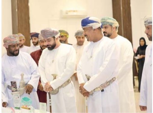
التعرف على الخدمات التي تقدمها الشبكة