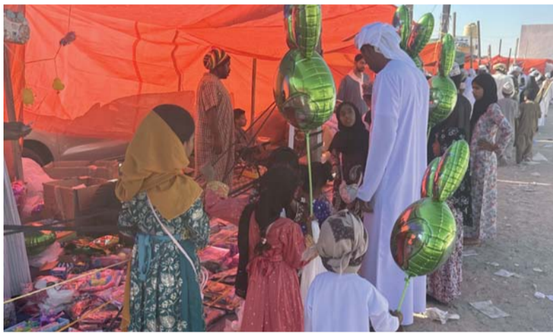
إقبال من الأطفال لشراء احتياجاتهم في جعلان بني بوعلی وجعلان بوحسن

مثل أدوات المشواء والحلويات المحلية والمكسرات وألعاب الأطفال ومختلف أنواع الهدايا خاصة أنها تقع بجانب سوق نخل التقليدي الذي بات يعج بالحركة التجارية بشكل متواصل مع اقتراب أيام عيد الفطر السعيد.