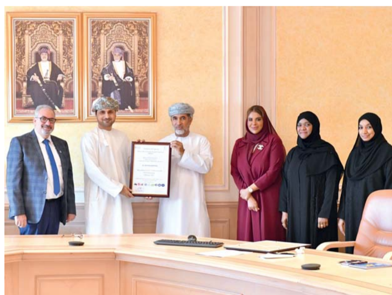
تطبيق مبادرة المستشفيات الصديقة لسلامة المرضى

تسلمت وزارة الصحة ممثلة بمركز ضمان الجودة شهادات الحصول على الاعتراف الدولي من منظمة الصحة العالمية لمستشفى المسرة ومستشفى نزوى ومستشفى الرستاق بصفقتها مؤسسات مراعية لسلامة المرضى برعاية سعادة الدكتور أحمد بن سالم المنظري وكيل وزارة الصحة للتخطيط والتنظيم الصحي، وبحضور سعادة الدكتور جان جبور ممثل مكتب منظمة الصحة العالمية في سلطنة عمان وذلك بالقاعة الرئيسية بديوان عام الوزارة.