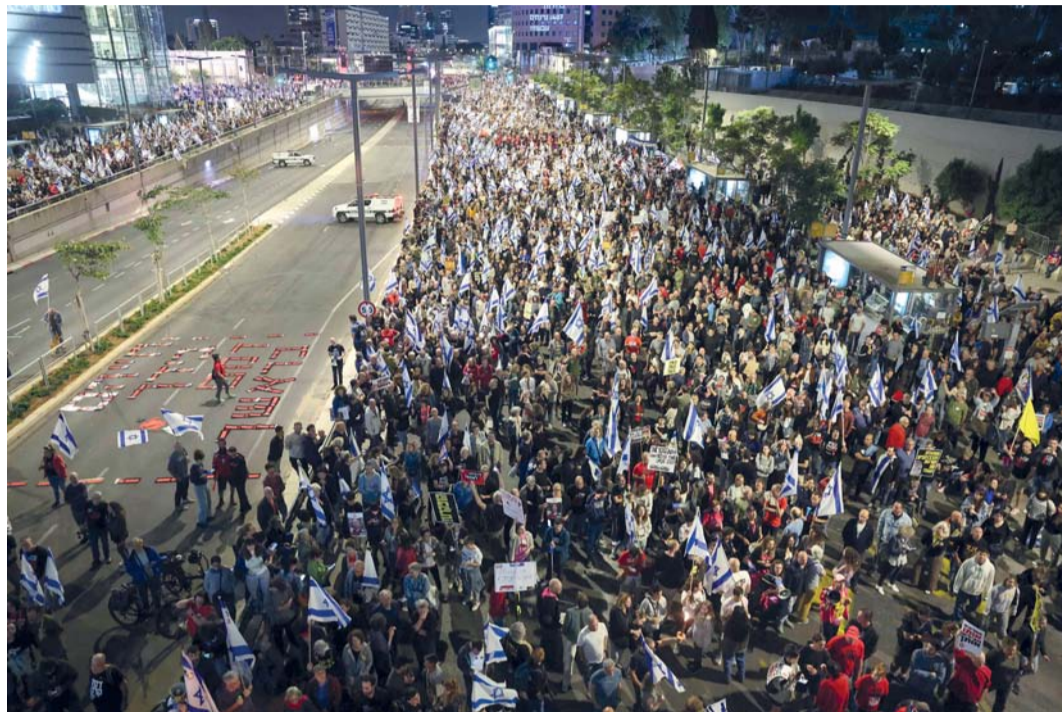
أقارب وأنصار الأسرى الإسرائيليين في غزة في احتجاجات أمام وزارة الجيش الإسرائيلي في تل أبيب