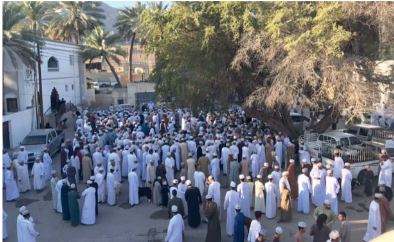
إقبال كبير من الباعة والمتسوقين شهدتها هبلة نخل أمس

كما شهدت هبلة العيد في شمال الباطنة إقبالاً كبيراً من الباعة والمتسوقين منذ ساعات الصباح الأولى لشراء مستلزمات العيد والأضاحي من الأغنام والابقار والجمال، بالإضافة إلى شراء الملابس والمواد الغذائية ومستلزمات المشواء والأعشاب والخناجر والعصي والأحزمة التقليدية والسيوف والملابس العمانية مثل المصار والكميم، حيث يقام هذا العام عدة هبلات في مختلف ولايات المحافظة ويرافقها عدد من الفعاليات خلال أيام عيد الفطر المبارك.