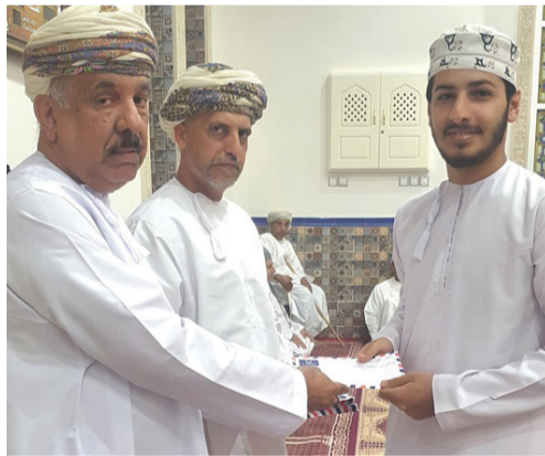
أثناء تكريم الفائزين في المسابقة