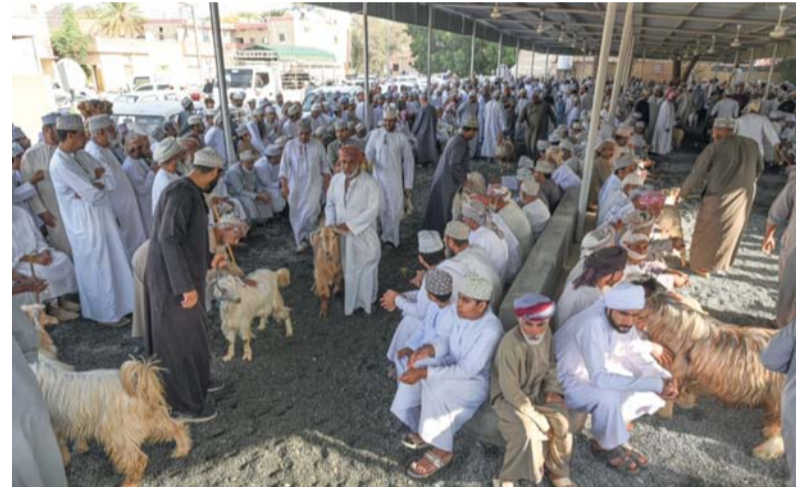
عرضة بيع الأغنام في هبلة بهلاء هبلة نخل