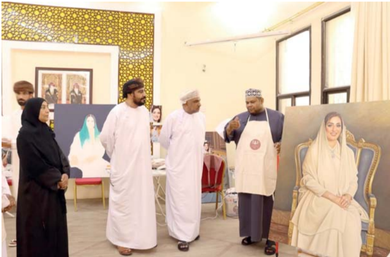
■ أحد المشاركين يشرح تفاصيل عمله الفني