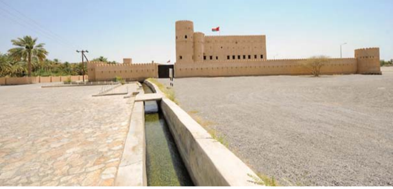
طلبات تسجيل الأبار بلغت ٢٠٥

عدد من الأكاديميين والمسؤولين والخبراء ورواد الأعمال. وتضمن العدد كذلك أبوابًا علمية أخرى مهمة مثل حوار مع باحث الذي تناول مشروعًا بحثيًا بعنوان «التنمر الإلكتروني ومدى تجريمه في القانون العماني وتقييم مدى انتشار الظاهرة» وتقديم جملة من المقترحات والتوصيات لها عبر استخدام المنهج العلمي الرصين والدعوة إلى تغليب بعض المواد القانونية التي تجرم التنمر الإلكتروني بجميع أنواعه، وفي باب إطلالة على الابتكار، أوردت المجلة مشروع ابتكار فريق طلابي من الجامعة الوطنية للعلوم والتكنولوجيا «تطبيق نديم»، الذي يقوم بقياس اضطرابات طيف التوحد، ويسهم في تعزيز الوعي المجتمعي بهذه الاضطرابات، ومساندة أولياء الأمور في التعامل مع الأطفال المصابين، وتقديم الاستشارات ومساعدتهم على متابعة تطور أبنائهم، وتتبع مراحل علاجهم من خلال التطبيق.