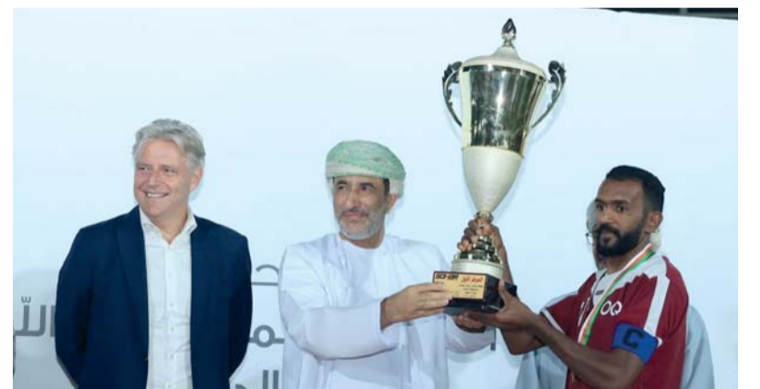
تتويج بطل المسابقة

بدأ حفل ختام البطولة بجولة لراعي الحفل والحضور على ركن الأسر المنتجة التي قدمت أجمل ما لديها من مأكولات ومشغولات يدوية، بعدها قام سعادة الشيخ محمد البوسعيدي والي صحار بالتعرف على الطواقم الإدارية والفنية ولإعجاب الفريقين إيدانا ببداية المباراة النهائية بين فريق أوكيو (أ) وأوكيو (ب) التي علق عليها المعلق المتأنق أحمد البلوشي من قناة بي ان سبورت.