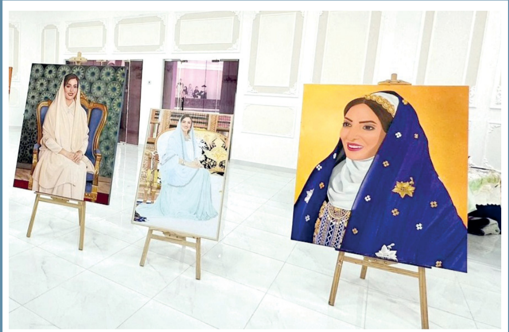
■ لوحات فنية لصورة السيدة الجليلة