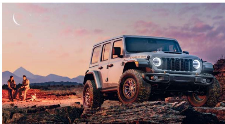
العروض توفر خيارات فريدة للعملاء

بفرصة الفوز بأحد جهزي أيفون من خلال سحب «ادخل واربح»، مما يزيد من الإثارة لقيمة لا تقبل المنافسة فحسب، بل تعكس أيضاً التزامنا بتحقيق رضا استثنائي لعملائنا.