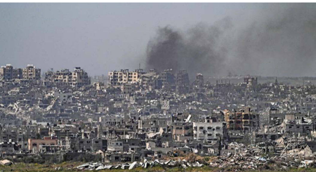
الدخان يتصاعد خلف المباني المدمرة بسبب الغارات الإسرائيلية على غزة.

إلى ذلك استشهد وأصيب عشرات الفلسطينيين إثر قصف طائرات ومدفعية الاحتلال الإسرائيلي مناطق متفرقة من قطاع غزة، مع دخول العدوان يومه الـ ١٨٠. وأفادت الأنباء بأن ٥ استشهاداً، وأصيب ١٠ آخرون، جراء قصف مدفعية الاحتلال عدداً من منازل في مدينة خان يونس. كما أن ثلاثة آخرين استشهدوا، وأصيب عدد آخر بجروح، في قصف مدفعي استهدف منازل جنوب شرق مدينة دير البلح وسط قطاع غزة. كما قصفت مدفعية الاحتلال عدة أحياء في مدينة غزة، منها الشيخ عجلين، وتل الهوى، والزيتون، ما أدى إلى إصابة عدد من الفلسطينيين نقلوا على إثرها إلى المستشفى المعمداني في المدينة. ويتمركز عدد من البتات وجرافات الاحتلال في محيط مدارس العودة شرق خان يونس وسط قصف مدفعي، فيما استهدفت زوارق الاحتلال بقذائفها ورشاشاتها منازل الفلسطينيين وخيام النازحين في منطقة المواصي بمدينة رنج وخان يونس، إضافة إلى استهداف محيط مستشفى ناصر، ومنطقتي البلد والفخاري بخان يونس بالقصف المدفعي، والغارات الجوية العنيفة. ودوت انفجارات ضخمة ناجمة عن تفجير جيش الاحتلال الإسرائيلي منازل الفلسطينيين في مدينة خان يونس، جنوب قطاع غزة.