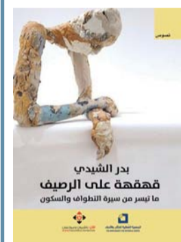
■ غلاف الكتاب