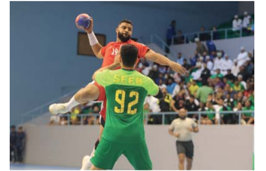
مباراة نادي عمان والسيب في ختام درع الوزارة