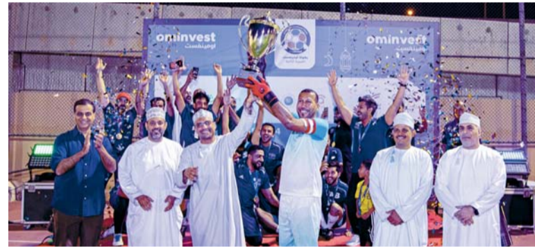
■ تتويج بطل المسابقة

وبهدف تعزيز الشراكة المجتمعية التي تنتهجها الشركة العمانية العالمية للتأمين والاستثمار «أومينفست»، وسعيًا لتشجيع الشباب العماني، وصل مهاراتهم ومواجهتهم من خلال الأنشطة الرياضية المختلفة، اختتمت منافسات النسخة الثانية من بطولة أومينفست الكروية لشركات المجموعة. ويأتي تنظيم هذا الحدث الرياضي استكمالاً لجهود المجموعة المبذولة في نشر ثقافة العمل المشترك والتعاون بين موظفي أومينفست والشركات التابعة لها. وشهدت البطولة مشاركة عشرة فرق موزعة على مجموعتين، حيث ضمت المجموعة الأولى فرقا رياضية من: شركة فواي، وبنك العن الإسلامي، والوطنية للتأمين (أ)، وليفيا للتأمين، أما المجموعة الثانية ضمت: مجموعة أومينفست، تكافل عُمان، وبنك عُمان العربي، وليفيا للتأمين (أ)، والوطنية للتأمين (ب). وانطلقت منافسات البطولة يوم 17 مارس؛ حيث تأهل الفريقان الأول والثاني من كل مجموعة للمربع الذهبي. وشهدت مباريات المربع الذهبي للبطولة الكثير من الإثارة والتشويق بين الفرق الأربعة للوصول إلى المباراة النهائية. وسط حضور جماهيري غفير وصل أكثر من 350 مشجعا، أسدل الستار مؤخرا على منافسات بطولة أومينفست الكروية على ملعب نادي الأمل بمسقط، تحت رعاية عبدالعزيز بن محمد البلوشي الرئيس التنفيذي لمجموعة أومينفست، وبحضور عدد من الإداريين والموظفين من شركات المجموعة.