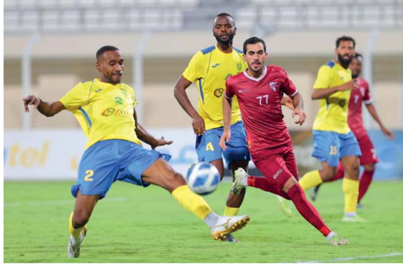
■ من مباريات دوري عماتل

بعد المساء إذا ما أراد الأزرق استعادة الثقة بنفسه والصراع على المركز الثالث على أقل تقدير، أما التعادل فهو أشبه بالخسارة ولن يقدم خدمة كبيرة للفريق، في المقابل فإن عمري فقد الكثير من جوانبه الإيجابية وبات فريقا يخسر كثيرا دون مقاومة، وخسارته الأخيرة أمام النهضة جاءت امتدادا لعطاءات سابقة تراجعت للوراء خاصة