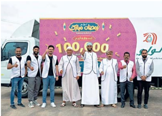
«قافلة الخير» خلال زيارتها إحدى الولايات

أطلقت مؤخرا مجموعة لؤلؤ حملة «قافلة الخير» لتوزيع مجموعات البقالة الرمضانية الخاصة على الأسر المستحقة، مما يعكس روح المشاركة والرعاية بمعناها الحقيقي خلال شهر رمضان المبارك. حيث تعد الحملة جزءاً من التزام لؤلؤ المستمر بالمشاركة في العديد من الأنشطة الخيرية والإنسانية والاجتماعية وإحداث تأثير إيجابي على المجتمع.