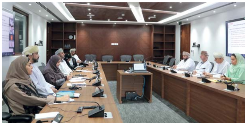
الندوة أكدت تكثيف الجهود للكشف المبكر عن التوحد

نظمت اللجنة العُمانية لحقوق الإنسان ندوة «احترام ودعم حقوق الأشخاص المصابين بالتوحد» من منظور المؤسسات الوطنية لحقوق الإنسان» عبر تقنية الاتصال المرئي بالتعاون مع منتدى آسيا والمحيط الهادئ، وذلك بالتزامن مع احتفال العالم باليوم العالمي للتوحد، وبمشاركة العديد من المؤسسات الوطنية لحقوق الإنسان والشبكات الإقليمية ضمن التحالف العالمي وعدد من المختصين والباحثين وممثلي المجتمع المدني من داخل وخارج عُمان. وقد أقيمت الندوة في بنيت عبدالله العطية رئيسة التحالف العالمي للمؤسسات الوطنية لحقوق الإنسان كلفة في افتتاح الندوة قالت فيها: إن المؤشرات المتصاعدة للإصابات بطيف التوحد دفعت الحكومات إلى السعي لتكثيف الجهود في الكشف المبكر للتوحد خصوصاً وأن دولاً عديدة منضمة إلى الاتفاقية الدولية لحقوق الأشخاص ذوي الإعاقة. وأضافت: إن اضطراب طيف التوحد يعد من الأولويات في برامج التحالف العالمي للمؤسسات الوطنية لحقوق الإنسان والمفوضية السامية لحقوق الإنسان ويمكن دور المؤسسات الوطنية لحقوق الإنسان من خلال دعم السياسات نحو تطوير