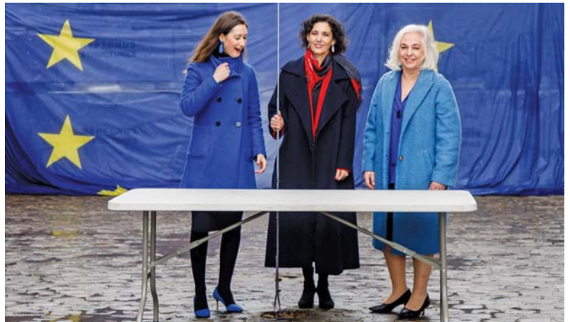
وزيرة الخارجية البلجيكية (في الوسط) تحضر حفل رفع العلم تحت قوس سينكو إنترنت للاحتفال بالذكرى السنوية الخامسة والسبعين لتأسيس التحالف العسكري لحلف شمال الأطلسي (الناتو).

برلين. د.ب.أ: دعا وزراء خارجية ألمانيا وفرنسا وبولندا بشدة إلى تعزيز القدرات العسكرية في أوروبا. وكتبت وزيرة الخارجية الألمانية أنالينا بيربوك ونظيرها الفرنسي ستيفان سيجورني وبولندي رادوسلاف سيكورسكي في مقال على موقع «بوليتيكو» الإخباري «علينا أن نستخدم كامل الإمكانيات الصناعية لقرتنا لتحسين قدراتنا العسكرية»، موضحين أن عملية التسليح الأداة هذه تحتاج إلى إبرام عقود ملزمة طويلة الأجل وجدول زمني واضحة، ومستوى معين من الطموحات، والتزامات مالية ثابتة، وضمانات شراء من الحكومات الأوروبية، مشيرين إلى أن إنفاق ٢٪ من الناتج المحلي الإجمالي على الدفاع يمكن أن يكون «مجرد نقطة بداية». وبمناسبة الذكرى السنوية الخامسة والسبعين لتأسيس حلف شمال الأطلسي العسكري (الناتو) اليوم الخميس، كتب وزراء الخارجية الثلاثة: «لقد تحملت الولايات المتحدة لفترة طويلة العبء أكثر من بقية تحالفنا. لكن الدفاع الجماعي هو جهدنا المشترك»، مشيرين إلى أنه لا بد من هذا المنطلق من تعزيز الدفاع الأوروبي وبالتالي المساهمة في الأمن عبر الأطلسي».