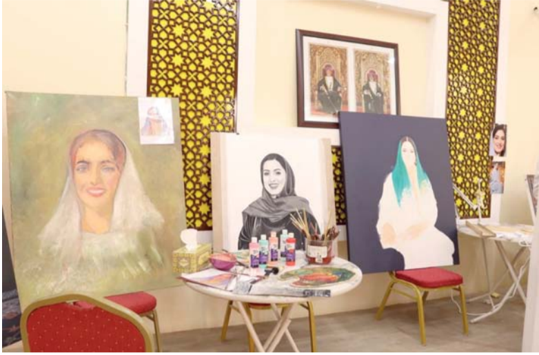
■ عدد من الأعمال التشكيلية المشاركة في المسابقة بعبري