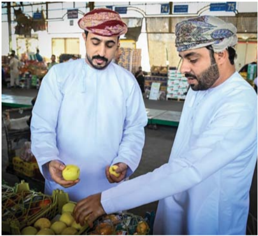
تحديد فترة العمل بالسوق المركزي للخضراوات والفواكه بالمواقع