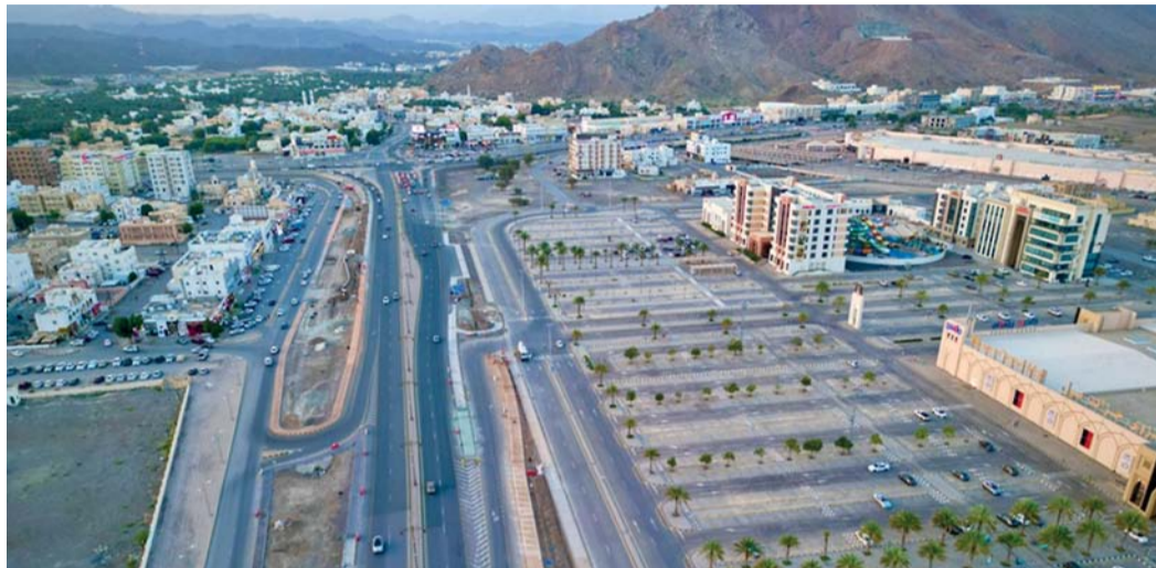
المشاريع تُواكب الحركة التجارية والسياحية والترفيهية

استدامة تلك الطرق، حيث تم الانتهاء مؤخراً من صيانة بعض المواقع بولاية آدم وسماثل، وأسندت بعض المشاريع المتعلقة بالصيانة بولاية بهلاء، والتي من المؤمل إنجازها خلال النصف الأول من هذا العام ٢٠٢٤م. وأكد مدير بلدية الداخلية أنه - لغرض إيجاد بيئة صحية ملائمة للمنتجات وتوفير الأريحية للبايع ومرتادي الأسواق -؛ شرعت المحافظة في تنفيذ أسواق لبيع الخضار والفواكه بولايي نزوى وإزكي، وإنشاء سوق للأعلاف بولاية آدم، وإنشاء مسلخ للبلدية بولاية الحمراء، وعمل أكشاك بولاية الجبل الأخضر. وأضاف أن المحافظة تسعى لإيجاد متنفس لأهالي المحافظة لقضاء الأوقات أثناء الإجازات؛ من خلال تنفيذ حزمة من مشاريع إنشاء وتطوير وتأهيل الحدائق والمتنزهات، حيث طُرحت مناقصات لإنشاء حدائق عامة بولايي نزوى والجبل الأخضر وإعداد مستندات المناقصة لإنشاء ميدان الداخلية، كما أسندت مؤخراً مجموعة من المناقصات لتأهيل وتطوير بعض المتنزهات القائمة بولايات: بدبد، وسماثل، وإزكي، ومنج، وأدم وبهلاء، لافتاً إلى أنها وحالياً في طور إكمال إجراءات التعاقد مع الشركات المسند لها تلك المشاريع.