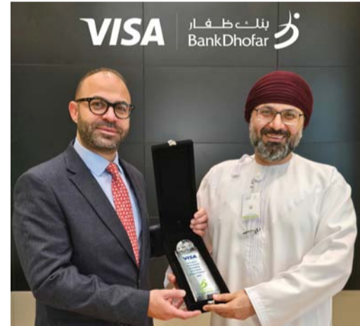
الجائزة تقديرًا لتفاني بنك ظفار في تعزيز الاعتماد الرقمي

تم مؤخرا تكريم بنك ظفار من قبل شركة Visa لإنجازته المتميز في تمكين تقنية الدفع عبر الهاتف النقال من Visa، والمعروفة باسم نظام نقاط البيع عبر الأجهزة الذكية، حيث إن تفاني بنك ظفار في تنفيذ وتعزيز هذا الحل المبتكر لم يسهم في تعزيز الدفع الرقمي في سلطنة عمان فحسب، بل ساهم أيضا في تمكين الشركات المحلية من الإزدهار في اقتصاد رقمي متنام، يمثل نظام نقاط البيع عبر الأجهزة الذكية نقلة نوعية في الطريقة التي يتعامل بها التجار مع المعاملات، على عكس أنظمة نقاط البيع التقليدية التي تعتمد على أجهزة مخصصة، يعمل نظام نقاط البيع عبر الأجهزة الذكية على الاستفادة من التطبيقات البرمجية للهواتف النقالة الذكية التي تعمل بنظام أندرويد من خلال تقليل التكاليف التشغيلية التي يتحملها التجار، حيث يمكن