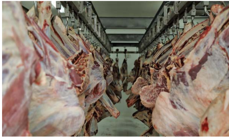
اتخاذ كافة الإجراءات الصحية في المسالخ البلدية

الأضرار التي تترتب بالماشية بجميع أنواعها وخلوها من الأمراض المعدية في عملية الذبح واتباع الاشتراطات الصحية السليمة التي يتسبب عنها أضرار صحية وببئية من حيث عدم التخلص من مخلفات الذبح، وإرقاة دم الضحية في الأماكن العامة، وبالتالي تشويه المنظر العام وانبعث الروائح الكريهة. في السياق، تبدأ فترة العمل في السوق المركزي للخضراوات والفواكه بالمواقع الجنوبية بولاية السيب خلال الفترة (٧ - ٩ من أبريل الجاري) من الساعة ٤ صباحاً حتى ١٥ مساءً على أن يتم إغلاق السوق يومي الأول والثاني من أيام عيد الفطر المبارك. ونذكر بلدية مسقط التابعة لمحافظة مسقط أن القرار حدد فترة العمل بالسوق المركزي للخضراوات والفواكه بالمواقع وبخول الشاحنات (البرادات)، القادمة من عدد من الدول العربية الشقيقة والدول الصديقة إلى السوق عبر المنافذ البرية، المحملة بمختلف أصناف الخضراوات والفواكه. وأوضح المهندس السيد المدير العام لبلدية مسقط في سبب أن فترة العمل بالسوق ستبدأ الأحد المقبل، حيث المظلة الرئيسية (مظلة بيع الفواكه بالجملة) من الساعة ٤ صباحاً حتى ١٥ مساءً، ومظلة (بيع الإنتاج المحلي من الخضراوات والفواكه) من الساعة ٤ صباحاً حتى ١٥ مساءً، أما محل (البيع بالجملة) فسيكون موعداً استقبالها للمسوقين من ٤ صباحاً حتى ١٥ مساءً. وبين أن فترة دخول الشاحنات (البرادات) الكبيرة المحملة بالمواد الغذائية تكون عبر البوابة الأولى خلال الفترة من الساعة ٤ صباحاً حتى ١١ مساءً، أما دخول سيارات المستهلكين للسوق عبر البوابتين رقمي ٢ و٥ بهدف التسوق فسيكون خلال الفترة من ٤ والنصف صباحاً حتى ١٠ والنصف مساءً.