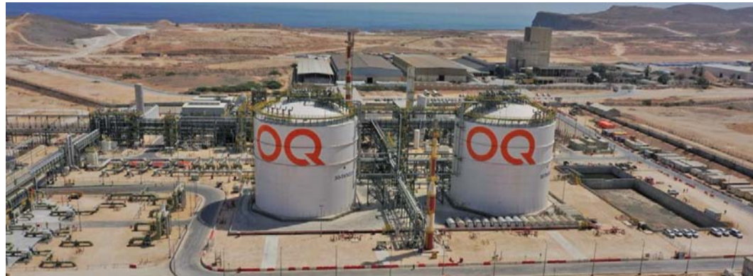
إجمالي إنتاج «أوكيو» من النفط حوالي ٢٤٦ ألف برميل يوميا من النفط المكافئ

إلى تدريب أكثر من ٩٠٠ مدرب ومتدربة، لتمكين الشباب العماني من الانخراط في سوق العمل بكفاءة عالية. وبين التقرير أن إجمالي إنفاق أوكيو على القيمة المحلية المضافة خلال العام الماضي بلغ نحو أكثر من ٤٠٨ ملايين ريال عماني شكّل ما نسبته ٧٧ بالمائة من إنفاق أوكيو على المشتريات البالغة ٥٢٨ مليون ريال عماني في عام ٢٠٢٣ م، وشكّل مؤشر القيمة المحلية المضافة ٣١,٩ بالمائة؛ حيث تولي أوكيو أهمية كبيرة للقيمة المحلية المضافة؛ كونها إحدى الاستراتيجيات التي تحرص عليها في استثماراتها وأعمالها وأنشطتها؛ وذلك في إطار دورها لإثراء الأسواق المحلية، وتعزيز المنتجات الوطنية، وتماشياً مع توجيهات الحكومة الرشيدة، كما بلغ الإنفاق على المؤسسات الصغيرة والمتوسطة ٩٥ مليون ريال عماني بنسبة تبلغ ١٨ بالمائة من إجمالي الإنفاق. وبلغ حجم الاستثمار الاجتماعي لمجموعة أوكيو ٤,٤ ملايين ريال عماني خلال العام الماضي، تمثل خدمة للمجتمع في الجوانب الاجتماعية والبيئية والاقتصادية والصحية، حيث يعد الاستثمار الاجتماعي أحد الركائز الرئيسة للمجموعة، وفي مجال الصحة والسلامة والأمن والبيئة، سجّلت المجموعة ٤٦ مليون ساعة عمل خلال عام ٢٠٢٣ دون تسجيل أي حالة وفاة؛ حيث تطبق أوكيو المعايير الوطنية والدولية في مجالات السلامة لتجنب كل ما من شأنه أن يسفر عن وقوع ضحايا ناجمة عن الحوادث في الشركات والمرافق والبيئة.