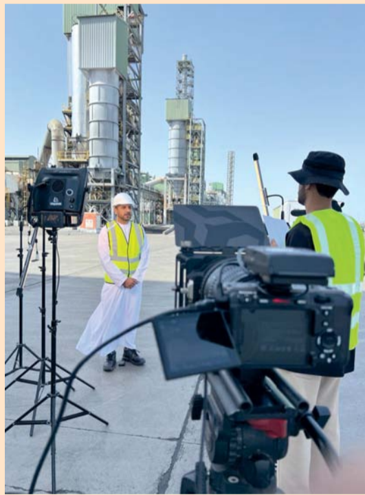
■ فريق البرنامج أثناء زيارته أحد المصانع في سلطنة عمان