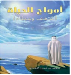
■ غلاف الكتاب