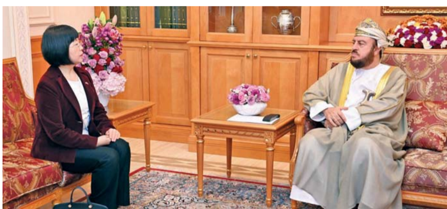
■ أسعد بن طارق أثناء استقباله لي لينج بينج

مسقط - العُمانية: نيابة عن حضرة صاحب الجلالة السلطان هيثم بن طارق المعظم . حفظه الله ورعاه . استقبل صاحب السمو السيد أسعد بن طارق آل سعيد نائب رئيس الوزراء لشؤون العلاقات والتعاون الدولي، والممثل الخاص لجلالة السلطان بمكتبه صباح أمس سعادة السفارة لي لينج بينج سفيرة جمهورية الصين الشعبية المعتمدة لدى سلطنة عُمان، وذلك للتوديع بمناسبة انتهاء مهام عملها. وقد أعربت سعادة السفارة عن شكرها لجلالة السلطان المعظم على الدعم الذي لقيته خلال فترة عملها