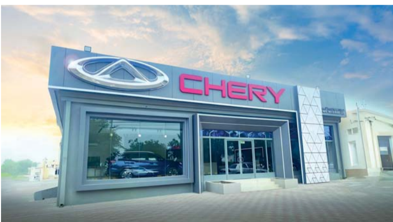
صالة عرض شركة شيري في ولاية صحار

بانورامية عالية الدقة بزواوية ٣٦٠ درجة، و٦ سماعات، وتحكم كهربائي لتعديل المقعد السائق و٦ وضعيات، وتحكم كهربائي لفتح السقف، و٤ وسائل لاسلكي سريع، و٤ وسائل هوائية ومحرك توربيني سعة ١,٥ لتر.