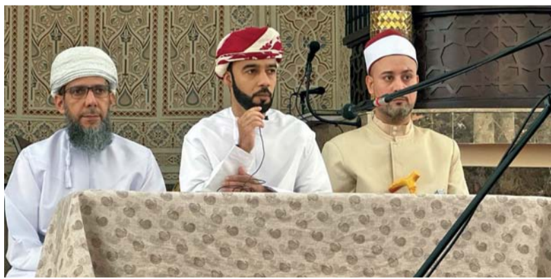
■ الندوة ناقشت أهمية القصص القرآنية في التربية

ينقصون المكيا والميزان فكان عذاب الله مع أنه والده طرده يرثها إلا القوم الصالحون. ثم تطرق المحاضر لذكر بعض الأمثلة من القصص القرآنية والتي تعلم الناس الأخلاق ومنها قصة يوسف عليه السلام مع امرأة العزيز فمع توفره لحو العصية ومع ملكة وحسن وجمال إلا أنه قال (معاذ الله) ثم طلب من ربه السجن على أن ينجيه من قيد النساء. ومنها أيضاً قصة بن نبي الله إبراهيم بآبيه ومخاطبته باسم الابن فهي من عند عليم خبير.