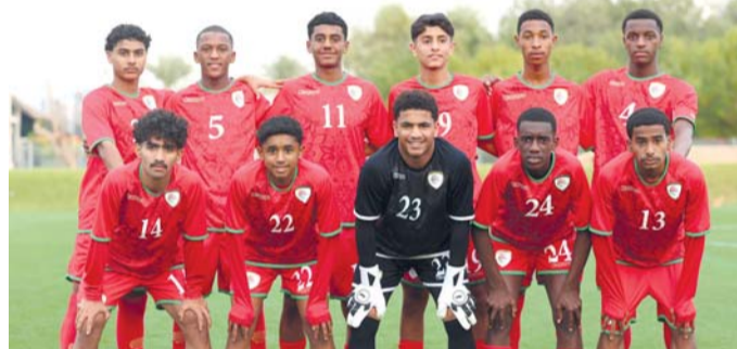
منتخبنا الوطني للناشئين لكرة القدم

اختارت اللجنة المنظمة للدورة شعارا وتعبيرا للدورة الذي يجسد، كلمة «الإمارات» فنيا، ويرمز إلى الطموح والتقدم بخطوطه العربية المتصاعدة، إذ تتجلى في الشعار روح الحيوية والوحدة، مع التركيز على التآلف الثقافي بين دول المجلس، وتأكيدا على دور الإمارات كدولة مضيئة بأسلوبه البسيط والأنيق.