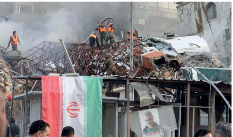
■ فرق الطوارئ والأمن يخدمون حريقاً في موقع الضربات التي أصابت مبنى ملحقاً بالقنصلية الإيرانية في العاصمة السورية دمشق.

وشددت على «وجوب حماية عمال الإغاثية الإنسانية