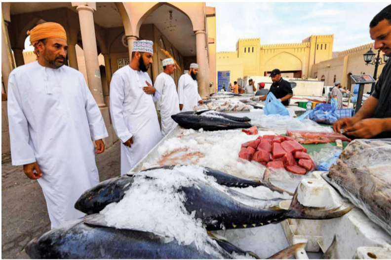
توافر أنواع عديدة من الأسماك يسهم في ثبات الأسعار