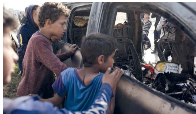
■ أطفال يتجمعون حول السيارة التي استخدمتها مجموعة الإغاثة، عقب تعرضها لضربة إسرائيلية في دير البلح بوسط قطاع غزة.