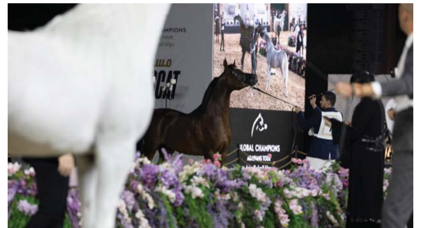
تألق كبير للخيول المشاركة في البطولة

اختتمت منافسات الجولة الثالثة لبطولة جولة الجياد العربية - مسقط ٢٠٢٤، التي أقيمت ضمن فعاليات مهرجان كتارا الدولي لتتويج ملاك الخيول الفائزة بالمراكز الأولى في البطولة وأُسفرت نتائج البطولة عن فوز أي أس حرير بالميدالية الذهبية في نهائي الأفضل لمربط الجاسمية وحقق رهن الشحانية لسعادة الشبيخة ريم بنت محمد آل ثاني الميدالية الفضية، أما الميدالية البرونزية فحققها أي جي كفو لمربط عجمان.