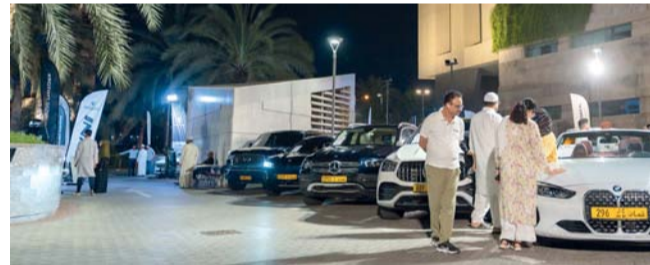
الكرنفال يلبي متطلبات العملاء ويقدم باقات تمويل للسيارات بأسعار تنافسية

البنك الوطني العماني: نلتزم في البنك بنجاحاتنا في إيجاد قيمة مضافة لعملائنا وتقديم تجارب ميسرة لهم. وخلال شهر رمضان المبارك، يسعى الكثير من العملاء إلى اقتناء مركبة جديدة أو مستعملة للاستفادة من العروض