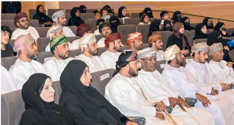
.. وأثناء الاحتفال في صلالة

والخدمات المقدمة لهم، لتمكينهم ودعمهم في المجتمع، واستمد شعار الأمم المتحدة من التباين والاختلاف بين البشر. كما نظمت المديرية العامة للتنمية الاجتماعية بمحافظة