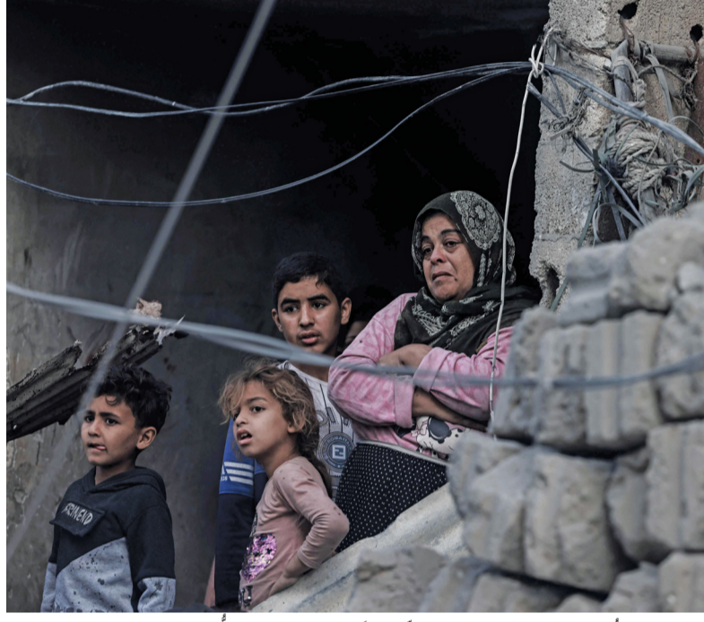
فلسطينيون يشاهدون من منزلهم المنهطم عملية انتشار جثامين الشهداء بعد قصف استهدف منطقة سكنية في رفح جنوب قطاع غزة.

القدس المحتلة. «الوطن». وكالات: الله اغتالت «إسرائيل» سبعة عاملين في منظمة غير حكومية أميركية تُوزع مساعدات غذائية في قطاع غزة المهبط بالمجاعة، بضربة جوية على ما أفادت المنظمة الإغاثية؛ معلنة وقف عملياتها في المنطقة، فيما كشف انسحاب الاحتلال من غرب مدينة غزة، ومشفى الشفاء عن جرائم حرب ودمار واسع في المشفى ومحيطه. وعثر الأهالي على عشرات الجثث؛ بما فيها بقية الأيدي، ما يشير إلى إعدامات ميدانية، ومن بين الضحايا أطباء وعاملون في القطاع الصحي وأسرى فلسطينية كاملة. وأشار المكتب الإعلامي الحكومي بغزة لاستشهاد نحو (٤٠٠) خلال أسبوعين من الاحتجاج، إضافة إلى اعتقال نحو (٩٠٠) آخرين. وطال الدمار أجزاء واسعة من البنايات السكنية. يأتي ذلك فيما أعلنت مصادر طبية عن ارتفاع حصيلة الشهداء في قطاع غزة إلى (٣٢٩١٦)، أغلبيتهم من الأطفال والنساء، منذ بدء العدوان «الإسرائيلي» في السابع من أكتوبر الماضي. ■ تفاصيل .. ص ه