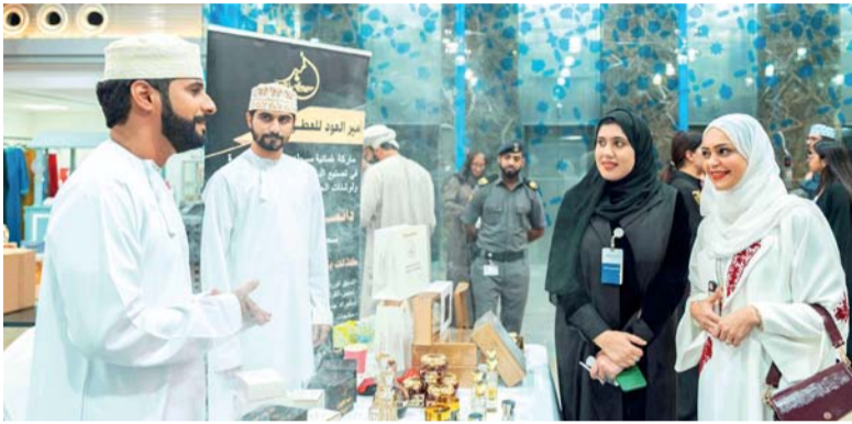
سوق الوثبة الرمضاني فرصة لتسويق المشاريع الشبابية

مثل هذه المبادرات لتمكين رواد الأعمال وأصحاب المشاريع وتوفير منصة ملائمة تتناسب مع احتياجاتهم وخاصة في ظل تنامي دور القطاع في خطط التقدم والتنمية في سلطنة عمان. وأوضح مساعد مدير عام أول المؤسسات الصغيرة والمتوسطة ببنك مسقط، أن هذا العام شهد سوق الوثبة الرمضاني تنافس أكبر مقارنة بالسنوات الماضية من حيث عدد الراغبين في المشاركة من رواد ورائدات الأعمال، وكذلك تميز بمشاركة عدد من رواد الأعمال لأول مرة في السوق وبمنتجات جديدة ومختلفة عن السنوات الماضية مما ساهم في إعطاء خيارات للزوار في شراء مايناسبهم من هذه المنتجات. مشيراً إلى أن سوق الوثبة أصبح من الأسواق المعروفة التي ينتظرها الجميع سواء من قبل رواد الأعمال أو من الزوار.