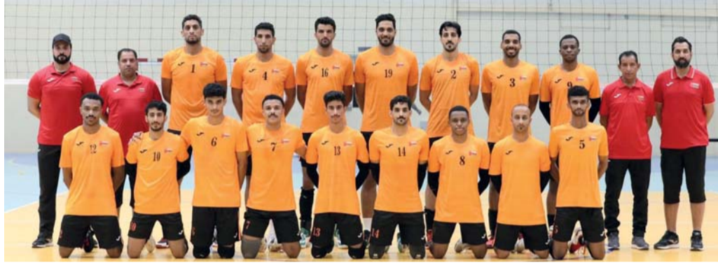
منتخبنا الوطني الأول لكرة الطائرة

اختار الجهاز الفني لمنتخبنا الوطني لكرة الطائرة بقيادة المدرب الوطني جمال العمري صحار لتكون مقر معسكر منتخبنا الوطني للاستحقاقات القادمة التي تنتظر المنتخب، منها المشاركة في التحدي الآسيوي المقرر في مملكة البحرين، وكذلك المشاركة في البطولة العربية القادمة للرجال.