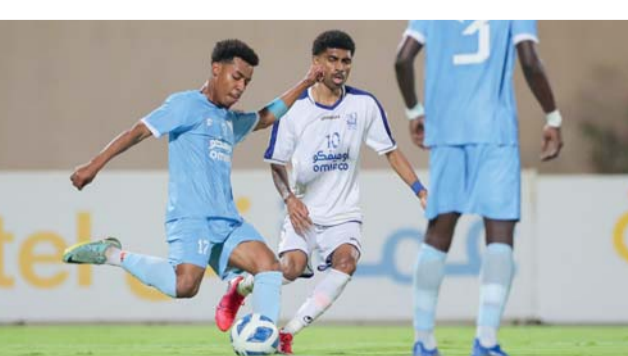
من منافسات دوري عمانتل واللظة من لقاء صور والوحدة بالجولة الماضية

تختتم اليوم (الأربعاء) منافسات بطولة موظفي وزارة الثقافة والرياضة والشباب، وذلك عندما يلتقي في المباراة النهائية فريق المديرية العامة للأنشطة الرياضية مع فريق المديرية العامة للرعاية والتطوير الرياضي والتي ستقام في مجمع بوشهر، وجاء تأهل فريق المديرية العامة للرعاية والتطوير الرياضي للمباراة النهائية بعد فوزه بضربات الترجيح على فريق المديرية العامة للشؤون الإدارية والمالية بنتيجة ١/٢ بعدما انتهى الوقت الأصلي من المباراة بالتعادل الإيجابي ١/١، أما تأهل فريق المديرية العامة للأنشطة الرياضية، فقد جاء بعد أن تجاوز فريق مكتب الوزير بنتيجة ٣/١، ويكلم تأكيد بأنه من المتوقع بأن تشهد المباراة النهائية الأثارة والتشويق وأن تهتز الشباك على خلاف المباراة الأولى التي جمعت الطرفين في منافسات دور المجموعات والتي انتهت بالتعادل السلبي بينهما.