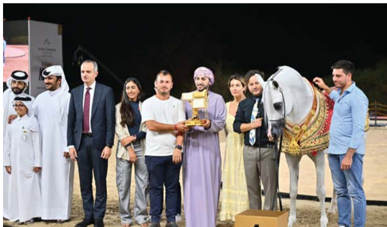
تتويج ملاك الخيول الفائزة بالمراكز الأولى في البطولة