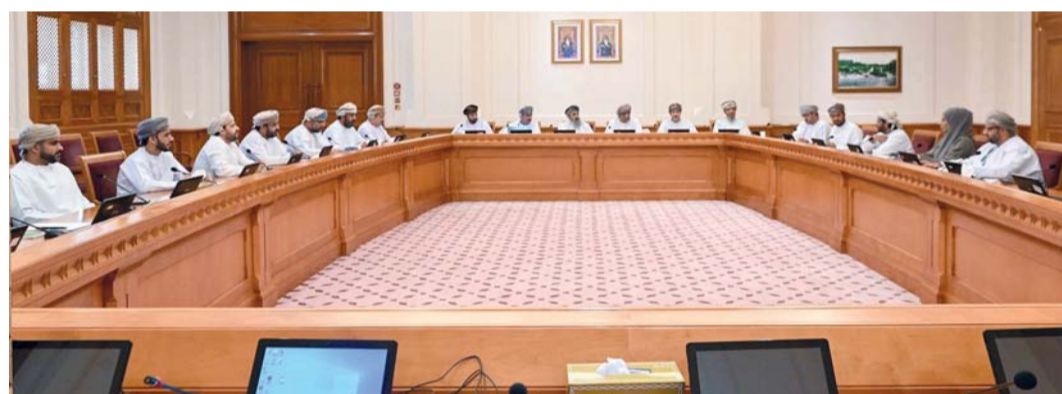
■ اللقاء تضمّن شرحاً وتفصيلاً لبعض المواد المُختلف عليها

عمان، إضافة إلى تدارس مواد مشابهة من بعض قوانين الدول ومقارنتها بمشروع القانون.