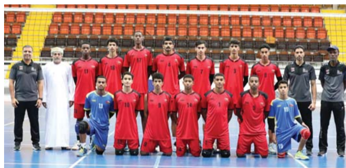
منتخبنا الوطني للشباب لكرة الطائرة

حيث من المتوقع أن تشهد الدورة مشاركة ٣٥٠٠ رياضي ورياضية يتنافسون في ٤١ مسابقة رياضية، وقد تم توزيع مسابقات الألعاب بدولة الإمارات العربية المتحدة حيث تستضيف العاصمة الاماراتية أبوظبي مسابقات كرة القدم «شباب - شباب»، والجولف، والجوجو، والجوجيتسو، والملاكمة، والجولف، والسباحة، وهوكي الجليد، والشراع، ومسابقة المسار للدراجات الهوائية، فيما تستضيف دبي مسابقات ألعاب القوى لأصحاب الهمم، والبيلياردو والسنوكر، والبولينج، وكرة الطائرة، والرياضة البحرية، والرياضة الجوية، وألعاب القوى، والبال تنس، والريشة الطائرة، والتنس، والدراجات الهوائية الجبلية، وكرة الطاولة، والموتوكروس، والألعاب الإلكترونية للسيارات، والرياضة الإلكترونية. وتستضيف الشارقة مسابقات رياضات كرة السلة ٣×٣ وكرة اليد، والتجديف، والشطرنج، والقوس والسهم، والفروسية «قفر الحواجز» والترويض، والدراجات الهوائية «مسابقة مضمار»، والرماية، كما تقام منافسات التايكواندو، والمبارزة، والكاراته في الفجيرة، وتستضيف عجمان منافسات الخماسي الحديث، والتراپلون، فيما تستضيف أم القيوين ورأس الخيمة مسابقات اللياقة البدنية، والكاريتنج على الترتيب.