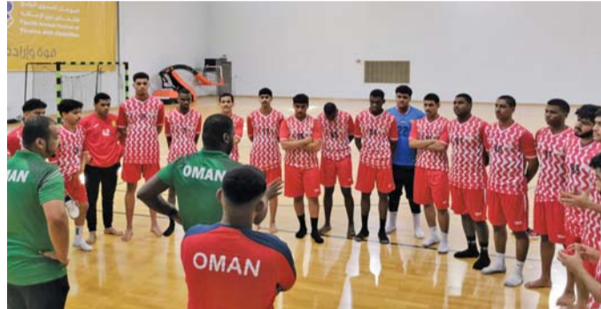
من تدريبات منتخبنا الوطني للناشئين لكرة اليد