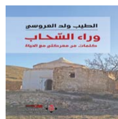
■ غلاف الكتاب

للكتاب الجزائري. العُمانية: يروي الكاتب الجزائري الطيب ولد العروسي في سيرته الذاتية (وراء السحاب.. كلمات من معركتي في الحياة) رحلة حياته في بلاده الجزائر. فبينما يصف مساراته في قراه ومدنه، يعرض لنا مشاهد تاريخية واجتماعية وسياسية واقتصادية، ويميط اللثام عن أثار الاستعمار وأعوانه، ثم عن فجر الاستقلال الذي نالته الجزائر بفضل تضحيات المجاهدين. محطات كثيرة تنقل فيها الطيب العروسي في سيرته الصادرة عن (الآن ناشرون وموزعون) بالأردن (٢٠٢٤)، ونقلها بشغافية، دافعا القارئ للتفاعل مع تلك الأحداث بكل جوارحه، يبكي ويضحك، يسخط ويرضى، يشجب الظلم تارة، وتارة أخرى يمني نفسه بالأمل القادم بالتححرر. يمشي القارئ يداً بيد مع الكاتب وهو يجوب الطرقات الوعرة في (سبدي) محمد الخضير) (القرية التي ولد فيها) ويقطع معه الدروب الموحلة، ويستأنس بأصوات الطيور المغردة والبساتين الخضراء وعيون الماء، يصعد أعلى التلال والجبال التي تمتد على مرمى البصر، ويهبط للوديان التي تحتضن بيوت الطين المتواضعة وأسر الفلاحين الذين يعانون الشقاء بسبب عزلة قراهم عن العالم وبسبب الاستعمار الذي يلاحقهم بسيطاه في حلهم وترحالهم.