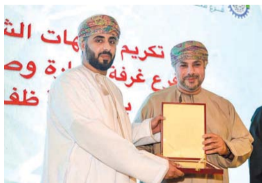
■ أثناء تكريم الجهات الفاعلة بالمحافظة

الاستفادة من الإمكانيات الموجودة في مجال التدريب والتأهيل والتشجيع على الابتكار وريادة الأعمال والدراسات والبحوث. وفي ختام حفل التكريم تم عقد جلسات حوارية ونقاشية مع رئيس مجلس إدارة فرع الغرفة بمحافظة ظفار.